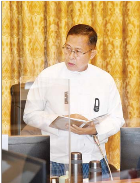
နိုင်ငံတော်စီမံအုပ်ချုပ်ရေးကောင်စီ ဒုတိယ ဥက္ကဋ္ဌ ဒုတိယဝန်ကြီးချုပ် ဒုတိယဗိုလ်ချုပ်မှူးကြီး စိုးဝင်း ဖြည့်စွက်ဆွေးနွေးစဉ်။

စိုက်ပျိုးရေးလုပ်ငန်းများတွင် သီးနှံမျိုးကွဲများ များပြားသည့်အတွက် ရောင်းချမှုနှင့် စီမံခန့်ခွဲမှုများ တွင် အခက်အခဲရှိသဖြင့် မျိုးကွဲများ နည်းပါးစေရေး တတ်နိုင်သမျှ ထိန်းသိမ်းဆောင်ရွက်ကြရန်လို ကြောင်း၊ အမျိုးတူ မျိုးကောင်းမျိုးသန့်များ စိုက်ပျိုး နိုင်ရေး ဆောင်ရွက်ကြရန်လိုကြောင်း၊ စိုက်ပျိုးရေး လုပ်ငန်းများကို နည်းစနစ်တကျ စိုက်ပျိုးခြင်းဖြင့် အထွက်နှုန်းများ ကောင်းမွန်တိုးတက်လာမည် ဖြစ်ကြောင်း၊ တိုင်းဒေသကြီးနှင့် ပြည်နယ်များ အလိုက် နေရောင်ခြည်စွမ်းအင်သုံး မြစ်ရေတင် စီမံကိန်းများကို ဆောင်ရွက်ခြင်းဖြင့် လိုအပ်သည့် စိုက်ပျိုးရေးများ လုံလောက်စွာရရှိနိုင်မည်ဖြစ်ကြောင်း၊ စိုက်ပျိုးရေးလုပ်ငန်းများ ဆောင်ရွက်ရာတွင် စက်ယန္တရားများဖြင့် စနစ်တကျဆောင်ရွက်နိုင်ရေး ဧကကွက်များ ဖော်ထုတ်ဆောင်ရွက်ရန် လိုကြောင်း၊ မွေးမြူရေးလုပ်ငန်းများတွင်လည်း လှောင်မွေးသည့် စနစ်ဖြင့် မွေးမြူမည်ဆိုပါက ပိုမိုအကျိုးဖြစ်ထွန်းစေ မည်ဖြစ်ကြောင်း၊ ငါးသယ်ဇာတများ ပြုန်းတီးမှု