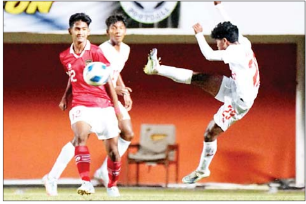
မြန်မာနှင့် အင်ဒိုနီးရှားအသင်းတို့ ယှဉ်ပြိုင်ကစားကြစဉ်။

ဆီမီးဖိုင်နယ်ပွဲစဉ်များတွင် ဗီယက်နမ်အသင်းက ထိုင်းအသင်းကို