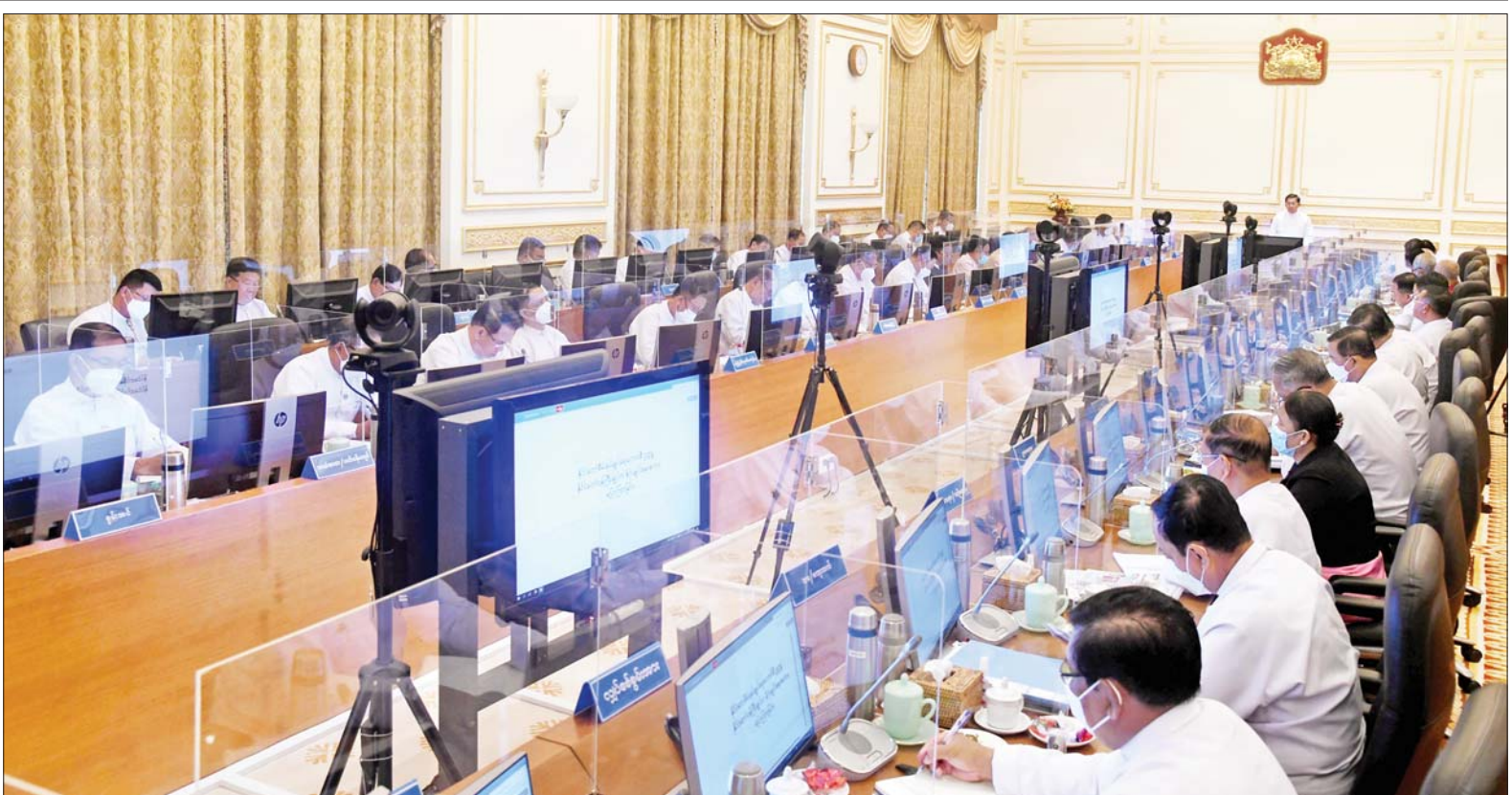
နိုင်ငံတော်စီမံအုပ်ချုပ်ရေးကောင်စီဥက္ကဋ္ဌ နိုင်ငံတော်ဝန်ကြီးချုပ် ဗိုလ်ချုပ်မှူးကြီး မင်းအောင်လှိုင် ပြည်ထောင်စုအစိုးရအဖွဲ့ လုပ်ငန်းဆောင်ရွက်ချက်များနှင့်စပ်လျဉ်းသည့် ညှိနှိုင်းအစည်းအဝေး တတိယနေ့သို့ တက်ရောက်၍ လိုအပ်သည်များကို လမ်းညွှန်မှာကြားစဉ်။