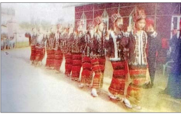
“ဝ” တိုင်းရင်းသား သမီးပျိုတို့၏အက။

သီဆိုသောသီချင်း၏ အဓိပ္ပာယ်မှာလည်း “ဝ” တိုင်းရင်းသားများ နေထိုင်ရာဒေသ၏ ရှုခင်းများ သာယာလှပမှုကို တင်စားဖွဲ့ဆိုထားခြင်း ဖြစ်ပြီး “ဝ” တိုင်းရင်းသားတို့၏ ရုပ်ရည်အလှအပ၊ စိတ်သဘောထား ဖြူစင်မှုများကိုပါ ထည့်သွင်းဖွဲ့ဆိုထားခြင်းဖြစ်ကြောင်းနှင့် လသာသော