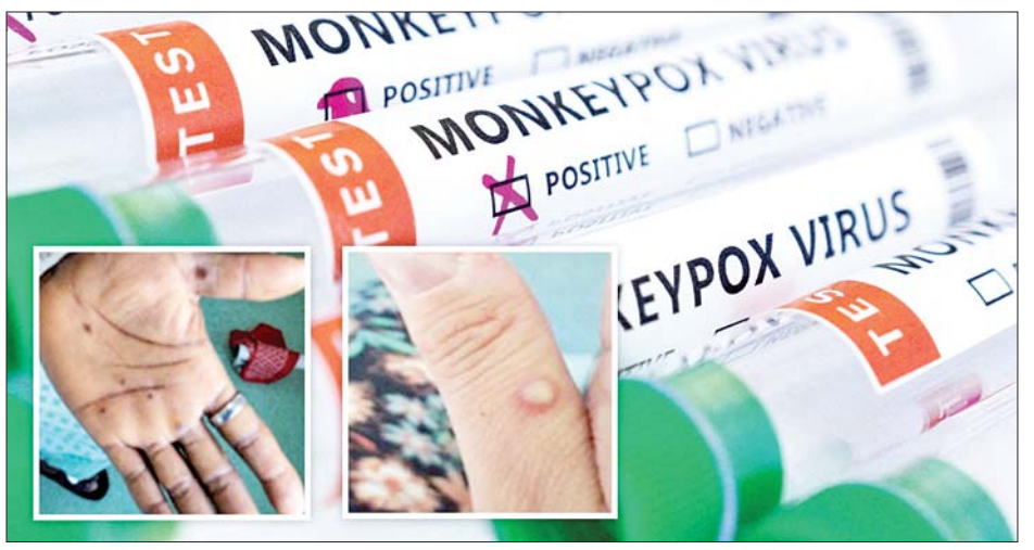
ကျောက်ရောဂါကာကွယ်ဆေးပေါ်တွင် အခြေခံထုတ်လုပ်ထားသည့် ဒိန်းမတ်ဆေးဝါးထုတ်လုပ်ရေးကုမ္ပဏီ၏ Bavarian Nordic မျောက်ကျောက်ရောဂါကာကွယ်ဆေးများကို မှာယူထားကြောင်း သိရသည်။ ကိုးကား- ဆင်ဟွာ၊ ဘာသာပြန်-အောင်ကျော်ကျော်

ဖြစ်ကြောင်း ကျန်းမာရေးအာဏာပိုင်များက ပြောသည်။ ကာကွယ်ဆေးထိုးနှံမှု စတင်သည့်ပထမရက်သတ္တပတ်တွင် မျောက်ကျောက်ရောဂါကူးစက်နိုင်မှုမြင့်မားသည့် အုပ်စုများကို ကာကွယ်ဆေးဦးစားပေးထိုးနှံပေးသွားမည်ဖြစ်ကြောင်း နယူးဆောက်ဝေးလ်ပြည်နယ် ကျန်းမာရေးတာဝန်ရှိသူများက ပြောသည်။ မျောက်ကျောက်ရောဂါကာကွယ်ဆေး အလုံးရေ ၂၀၀၀၀ ခန့်သည် လာမည့်ရက်အနည်းငယ်အတွင်း ရောက်ရှိမည်ဖြစ်ပြီး ကာကွယ်ဆေးအလုံးရေ ၃၀၀၀၀ သည် လာမည့်လအတွင်း ရောက်ရှိမည်ဖြစ်သည်။ နောက်ထပ်မှာယူထားသည့် ကာကွယ်ဆေးအလုံးရေ ထောင်ပေါင်းများစွာသည် လာမည့်နှစ်အတွင်း ရောက်ရှိမည်ဖြစ်သည်။