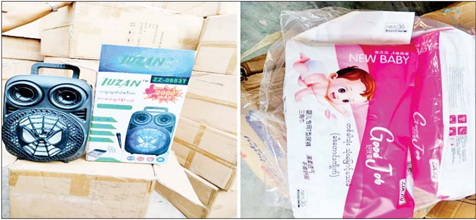
မန္တလေးတိုင်းဒေသကြီး (၁၆) မိုင် ကျောက်ချောစစ်ဆေးရေးစခန်း၌ သိမ်းဆည်းရမိမှု မှတ်တမ်းဓာတ်ပုံ။

တရားမဝင် ကုန်သွယ်မှု တိုက်ဖျက်ရေး ဦးဆောင်ကော်မတီ၏ ကြီးကြပ်ကွပ်ကဲမှုဖြင့် တရားမဝင် ကုန်သွယ်မှုများကို ဥပဒေနှင့်အညီ ထိရောက်စွာ တားဆီး အရေးယူနိုင် ရေးဆောင်ရွက်လျက်ရှိရာ ဩဂုတ် ၂ ရက်တွင် အကောက်ခွန် ဦးစီးဌာန၏ စီမံခန့်ခွဲမှုဖြင့် ရန်ကုန်တိုင်းဒေသကြီး အေးရှားဝေါလ်ကုန်သေတ္တာစစ်ဆေးရေးစခန်း၌ တာဝန်ကျ အကောက်ခွန် အဖွဲ့က စစ်ဆေးမှုများ ဆောင်ရွက်ခဲ့ရာ သွင်းကုန်ကြေညာလွှာ (ID) တွင် ကြေညာထားသည်နှင့် ကိုက်ညီမှု မရှိသည့် လုပ်ငန်းသုံး စက်ပစ္စည်းများ (ခန့်မှန်းတန်ဖိုး ငွေကျပ် ၈၀၀၀၀၀)ကို သိမ်းဆည်းရမိခဲ့ပြီး အကောက်ခွန် လုပ်ထုံးလုပ်နည်းနှင့်အညီ အရေးယူဆောင်ရွက်လျက်ရှိသည်။ ထို့ပြင် ဩဂုတ် ၃ ရက်တွင် ရခိုင်ပြည်နယ် တရားမဝင် ကုန်သွယ်မှု တိုက်ဖျက်ရေး အထူးအဖွဲ့၏ စီမံခန့်ခွဲမှုဖြင့် ဝှံမြို့နယ် သစ်တောဦးစီးဌာန ဦးဆောင်သော ပူးပေါင်းစစ်ဆေးရေးအဖွဲ့က စစ်ဆေးမှုများဆောင်ရွက်ခဲ့ရာ သံတွဲခရိုင် ဝှံမြို့နယ် တောင်ညို ကြိုးပြင်ကာကွယ်တောအတွင်း တရားမဝင် သစ်ပုတ်ခွဲသား ၁၁ ဒသမ ၈၅၃၆ တန် (ခန့်မှန်းတန်ဖိုးငွေကျပ် ၈၂၉၇၅)ကို သိမ်းဆည်းရမိခဲ့ပြီး သစ်တောဥပဒေနှင့်အညီ အရေးယူဆောင်ရွက်လျက်ရှိသည်။ အလားတူ ဩဂုတ် ၄ ရက်တွင် ကရင်ပြည်နယ် တရားမဝင် ကုန်သွယ်မှု တိုက်ဖျက်ရေး အထူး