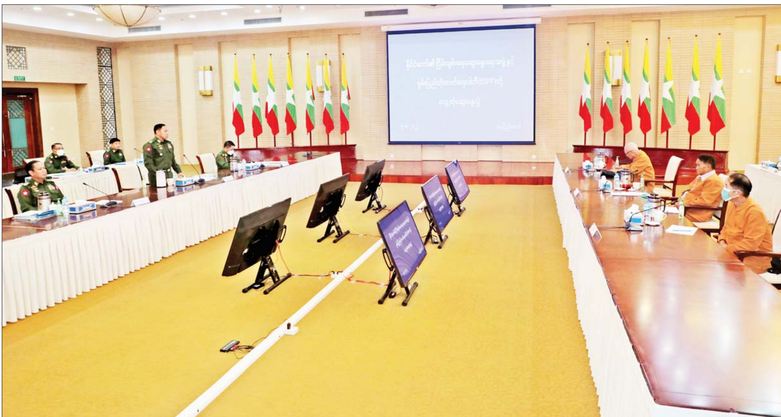
နိုင်ငံတော်၏ ငြိမ်းချမ်းရေးဆွေးနွေးရေးအဖွဲ့နှင့် ရှမ်းပြည်တိုးတက်ရေးပါတီ(SSPP) ဒုတိယဥက္ကဋ္ဌ(၁) ဦးဆောင်သော ကိုယ်စားလှယ်အဖွဲ့တို့ တွေ့ဆုံဆွေးနွေးစဉ်။

လက်ခံစဉ်ကလည်း မြန်မာနိုင်ငံ၏ ပြည်တွင်းတည်ငြိမ်မှုအပေါ် မူတည်ပြီး နိုင်ငံကောင်းကျိုးအတွက် အာဆီယံပဋိညာဉ်စာတမ်း၊ အာဆီယံနည်းလမ်းနှင့် အာဆီယံစိတ်ဓာတ်တို့နှင့်အညီ ဆောင်ရွက်သွားမည်ဖြစ်ကြောင်း ရှင်းလင်းစွာ ပြောကြားခဲ့ ပါသည်။ အဖွဲ့ဝင်နိုင်ငံများ၏ ပြည်တွင်းရေးကိစ္စကို ပြင်ပမှ မစွက်ဖက်ရေး၊ မနှောင့်ယှက်ရေး၊ အဖွဲ့ဝင်နိုင်ငံများအကြား နိုင်ငံထက်စီးနင်းမှုမရှိရေး စသည့် “မူ” များကို အာဆီယံအနေ ဖြင့် လေးစားသင့်ပြီး မြန်မာနိုင်ငံသည် မိမိ၏ ပြည်တွင်းရေး ကိစ္စကို မြန်မာနိုင်ငံ၏ ၂၀၀၈ ခုနှစ် ဖွဲ့စည်းပုံအခြေခံဥပဒေ၊ တည်ဆဲဥပဒေ၊ လုပ်ထုံးလုပ်နည်းများနှင့်အညီ ဆောင်ရွက်နေမှု ကို လေးစားရန်လိုပါသည်။ စာမျက်နှာ ၃ ကော်လံ ၁ သို့ ❖