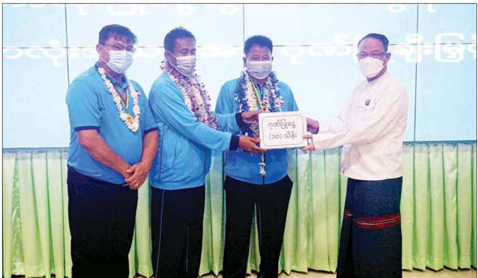
သိန်း ဂုဏ်ပြုချီးမြှင့်ခဲ့ကြသည်။ ထို့နောက် ကရင်ပြည်နယ် အသက် ၁၉ နှစ်အောက် အမျိုးသား ဘောလုံးအသင်း အုပ်ချုပ်သူက တင်စကား ပြန်လည်ပြောကြား ရှင်းလင်းပြောကြား၍ ကျေးဇူးပြုသည့်အားဖြင့် အတွေ့အကြုံများကို ခွဲကြောင်း သိရသည်။

ပြည်နယ်၊ ခရိုင်၊ မြို့နယ်အဆင့် ဌာနဆိုင်ရာများ၊ တက္ကသိုလ်၊ ကောလိပ်၊ သိပ္ပံကျောင်းများမှ ကျောင်းသား ကျောင်းသူများ၊ ဆရာ ဆရာမများ၊ ဒေသခံ တိုင်းရင်းသားများ၊ ကရင်ရိုးရာ ယဉ်ကျေးမှု ခုံးအဖွဲ့များက အတီး၊ အမှုတ်၊ အကအခုန်များဖြင့် ဂုဏ်ပြုကြိုဆိုခဲ့ကြသည်။ ထို့နောက် အောင်ပွဲရ ကရင်ပြည်နယ် ဘောလုံးအသင်းအား ဂုဏ်ပြုချီးမြှင့်သည့်အခမ်းအနားကို ကရင်ပြည်နယ်အစိုးရအဖွဲ့ရုံး အစည်းအဝေးခန်းမ(၂)၌ ဆက်လက်ကျင်းပရာ ကရင်ပြည်နယ်ဝန်ကြီးချုပ်က ဂုဏ်ယူ