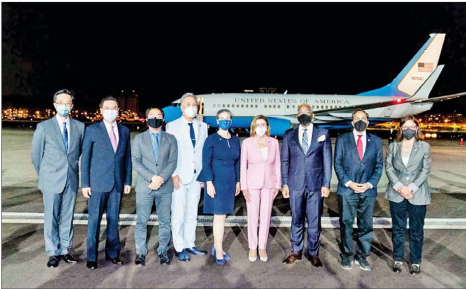
အမေရိကန်အောက်လွှတ်တော်ဥက္ကဋ္ဌ နန်စီပလိုစီနှင့်အဖွဲ့ ထိုင်ဝမ်သို့ ဩဂုတ် ၂ ရက်က ရောက်ရှိ ကြစဉ်။

အမေရိကန် အောက်လွှတ်တော်ဥက္ကဋ္ဌ နန်စီပလိုစီနဲ့ လွှတ်တော်အမတ်မြောက်ဦးပါတဲ့ ကိုယ်စားလှယ်အဖွဲ့ဟာ အာရှခရီးစဉ်အဖြစ် စင်ကာပူ၊ မလေးရှား၊ တောင်ကိုရီးယားနဲ့ ဂျပန်နိုင်ငံ တို့ကို သွားရောက်ခဲ့ပါတယ်။ အဲဒီခရီးစဉ်အစမှာ ထိုင်ဝမ်ကို နန်စီပလိုစီ သွားမယ်/ မသွားဘူး မဖော် ပြခဲ့ပါဘူး။ ဒါပေမယ့် နန်စီပလိုစီအနေနဲ့ ထိုင်ဝမ်ကို သွားရောက်နိုင်တယ်လို့ သတင်းတွေ ကျယ်ကျယ် ပြန့်ပြန့်ထွက်ပေါ်ခဲ့ပြီး တရုတ်နိုင်ငံကလည်း ခရီးစဉ် ကိုစောင့်ကြည့်နေခဲ့ပါတယ်။ နန်စီပလိုစီနဲ့ ကိုယ်စား လှယ်အဖွဲ့ဟာ မလေးရှားနိုင်ငံ ခရီးစဉ်ပြီးမှ ထိုင်ဝမ် ကို ဩဂုတ်လ ၂ ရက်နေ့က သွားရောက်ခဲ့ပါတယ်။