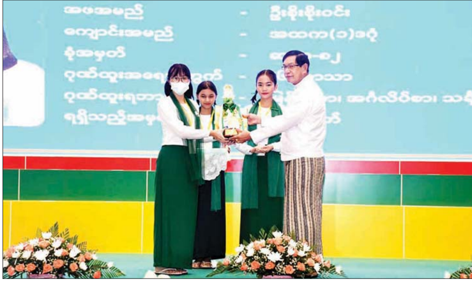
အထက(ခွဲ)(ကျွဲကန်)၊ မှော်ဘီမြို့နယ် အထက(ခွဲ)ရှမ်းကုန်း၊ ဗိုလ်တထောင်မြို့နယ် အထက(ခွဲ)လ (၂)၊ အောင်ချက်အကောင်းဆုံးရရှိသည့် မြို့နယ်များဖြစ်သည့် ကမာရွတ်၊ လသာ၊ ဗဟန်းတို့အား ဂုဏ်ပြုဆုတံဆိပ်များနှင့် ဂုဏ်ပြုချီးမြှင့်ငွေများ ပေးအပ်ရာ ကျောင်းသား ကျောင်းသူများ

ရန်ကုန် ဩဂုတ် ၅ ၂၀၂၂ ခုနှစ် တက္ကသိုလ်ဝင်စာမေးပွဲတွင် ရန်ကုန်တိုင်းဒေသကြီးအတွင်း ထူးချွန်စွာအောင်မြင်ခဲ့ကြသည့် ကျောင်းသား ကျောင်းသူများ၊ အောင်ချက်အကောင်းဆုံးကျောင်းများနှင့် မြို့နယ်များအား ရန်ကုန်တိုင်းဒေသကြီးအစိုးရအဖွဲ့က ဂုဏ်ပြုချီးမြှင့်ခြင်းကို ယနေ့နံနက်ပိုင်းက တိုင်းဒေသကြီးအစိုးရအဖွဲ့ရုံး မင်္ဂလာခန်းမတွင် ကျင်းပသည်။ တိုင်းဒေသကြီးဝန်ကြီးချုပ် ဦးစိုးသိန်းက အမှာစကားပြောကြားပြီး သိပ္ပံဘာသာတွဲ၊ ဝိဇ္ဇာဘာသာတွဲ၊ ဝိပဿနာဘာသာတွဲများ၌ အမှတ်အများဆုံးရရှိခဲ့ကြသည့် ကျောင်းသား ကျောင်းသူ ကိုးဦး၊ အောင်ချက်အကောင်းဆုံးရရှိသည့် အမှတ်(၂) အခြေခံပညာအထက်တန်းကျောင်း မင်္ဂလာဒုံ၊ အမှတ်(၂) အခြေခံပညာအထက်တန်းကျောင်း စမ်းချောင်း၊ အမှတ်(၂) အခြေခံပညာအထက်တန်းကျောင်း လသာ၊ အောင်ချက်အကောင်းဆုံးရရှိသည့် အခြေခံပညာအထက်တန်းကျောင်း(ခွဲ)များဖြစ်သည့် ကျောက်တန်းမြို့နယ်