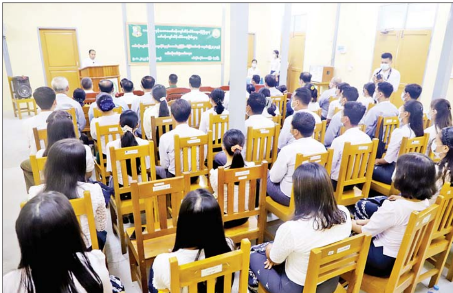
နားလည်ပြီး ပတ်ဝန်းကျင်ဆိုင်ရာပြဿနာရပ်များ ကို ဖြေရှင်းရန်နှင့် လက်တွေ့နယ်ပယ်တွင် ပြန်လည် အသုံးချကာ နိုင်ငံ့တာဝန်များကို ကျေပွန်စွာ ထမ်းဆောင်သွားကြရန် လိုအပ်ကြောင်း ပြောကြား သည်။ ထို့နောက် တိုင်းဒေသကြီး ပတ်ဝန်းကျင်

ပတ်ဝန်းကျင်ညစ်ညမ်းမှုကို လျော့ချရန် တိုင်းဒေသကြီးဝန်ကြီးချုပ် ဦးမြတ်ကျော်က လူဦးရေတိုးပွားလာခြင်းနှင့်အတူ စွန့်ပစ်ပစ္စည်း များလည်း တိုးပွားလာသည့်အပေါ် ပတ်ဝန်းကျင် ညစ်ညမ်းမှုကို လျော့ချရန် ဘက်ပေါင်းစုံမှ ကြိုးစား အဖြေရှာကြရန်လိုအပ်ကြောင်း၊ စစ်ကိုင်းတိုင်းဒေသကြီး အစိုးရအဖွဲ့အနေဖြင့် တိုင်းဒေသကြီးအတွင်း ဖွံ့ဖြိုး တိုးတက်ရေးလုပ်ငန်းများ ဆောင်ရွက်ရာတွင် ပတ်ဝန်းကျင်ထိခိုက်ပျက်စီးမှုမရှိစေရန် အထူး အလေးထားဆောင်ရွက်လျက်ရှိကြောင်း၊ သင်တန်း သားများအနေဖြင့် ပတ်ဝန်းကျင်နှင့်သက်ဆိုင်သော ဥပဒေ၊ နည်းဥပဒေ၊ လုပ်ထုံးလုပ်နည်းများကို