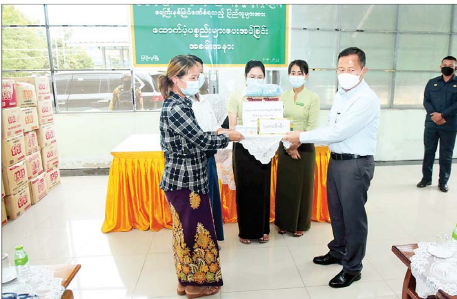
နိုင်ငံတော်စီမံအုပ်ချုပ်ရေးကောင်စီဒုတိယဥက္ကဋ္ဌ အမျိုးသားသဘာဝဘေးအန္တရာယ်ဆိုင်ရာ စီမံခန့်ခွဲမှုကော်မတီဥက္ကဋ္ဌ ဒုတိယတပ်မတော်ကာကွယ်ရေးဦးစီးချုပ် ကာကွယ်ရေးဦးစီးချုပ်(ကြည်း) ဒုတိယ ဗိုလ်ချုပ်မှူးကြီးစိုးဝင်း ရေဘေးသင့်ပြည်သူများအတွက် ထောက်ပံ့ငွေများပေးအပ်ရာ တာဝန်ရှိသူများက လက်ခံရယူစဉ်။

ဖြစ်ပေါ်လာသည့်ဘေးအန္တရာယ်၊ လူပယောဂကြောင့် ဖြစ်ပေါ်လာသော ဘေးအန္တရာယ်မျိုးကိုမဆို ရင်ဆိုင် ကျော်လွှားနိုင်မည်ဖြစ်၍ ညီညွတ်စွာဖြင့် ပူးပေါင်း ဆောင်ရွက်သွားကြရန်လိုကြောင်း ပြောကြား သည်။ ထို့နောက် နိုင်ငံတော်စီမံအုပ်ချုပ်ရေးကောင်စီ ဒုတိယဥက္ကဋ္ဌ အမျိုးသားသဘာဝဘေးအန္တရာယ် ဆိုင်ရာစီမံခန့်ခွဲမှုကော်မတီဥက္ကဋ္ဌ ဒုတိယတပ်မတော် ကာကွယ်ရေးဦးစီးချုပ် ကာကွယ်ရေးဦးစီးချုပ် (ကြည်း) က ရေဘေးသင့်ပြည်သူများအတွက် ထောက်ပံ့ငွေများကိုလည်းကောင်း၊ တိုင်းဒေသကြီး ဝန်ကြီးချုပ်က သဘာဝဘေးအန္တရာယ်ဆိုင်ရာ ကယ်ဆယ်ရေးပစ္စည်းများကိုလည်းကောင်း ပေးအပ် ရာ တာဝန်ရှိသူများက လက်ခံရယူကြပြီး ရေဘေး