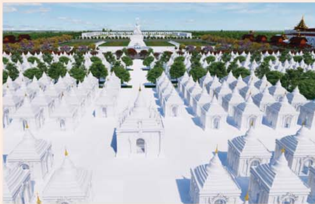
ကျောက်စာရုံစေတီ(၁၂ x ၁၂x ၁၈)ပေ ၁ ဆူ တန်ဖိုး- ၂၇၉ သိန်း