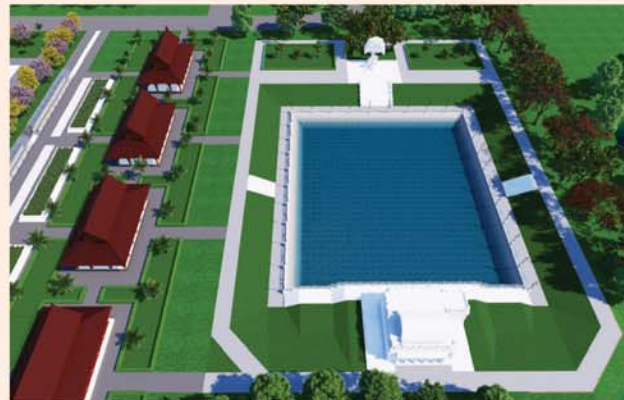
မုစလိန္နုတိုင်

၁။ နိုင်ငံတော်စီမံအုပ်ချုပ်ရေးကောင်စီဥက္ကဋ္ဌ၊ တပ်မတော်ကာကွယ်ရေးဦးစီးချုပ် ဗိုလ်ချုပ်မှူးကြီးမင်းအောင်လှိုင် ဦးဆောင်သည့် (၇)ရက်သား၊ သမီး၊ ဘုရားဒါယကာ၊ ဒါယိကာမတို့က မာရဝိဇယပုဒ္ဒရုပ်ပွားတော်မြတ်ကြီးအား မြန်မာနိုင်ငံတွင် ထေရဝါဒပုဒ္ဒသာသနာတော်ထွန်းလင်းတောက်ပလျက်ရှိသည်ကို ကမ္ဘာကိုပြသရန်၊ တိုင်းပြည်အေးချမ်းသာယာမှုရှိစေရန်၊ ရုပ်ပွားတော် မြတ်ကြီးအား ပြည်တွင်း၊ ပြည်ပဘုရားဖူးများလာရောက်ခြင်းဖြင့် ဒေသတိုးတက်စည်ကားမှုကို အထောက်အကူဖြစ်စေရန်၊ နိုင်ငံတော်ဖွံ့ဖြိုးတိုးတက်မှုအား အထောက်အကူဖြစ်စေရန် ရည်သန်လျက် ပြည်ထောင်စုနယ်မြေ နေပြည်တော်၊ ဒက္ခိန္ဒာသီရိမြို့နယ်အတွင်း၌ သာသနာတော်ထုံး၊ ရုပ်ပွားဆင်းတုတော်ထုံး၊ မြန်မာ့ရိုးရာတည်ထုံးများနှင့်အညီ တည်ဆောက်ပူဇော်လျက် ရှိပါသည်။