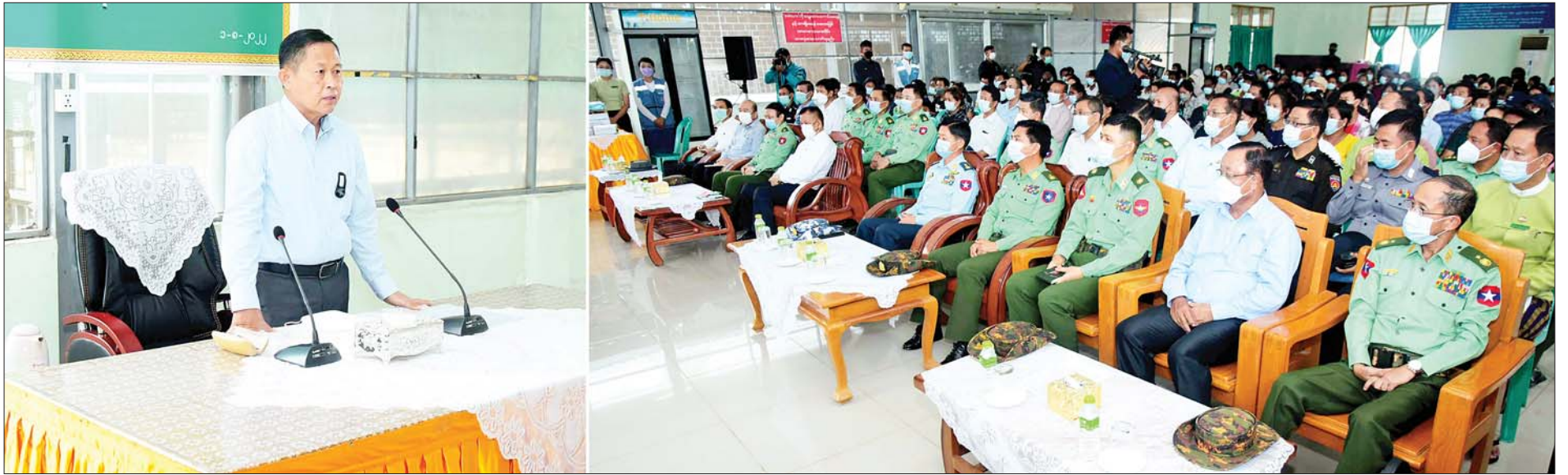
နိုင်ငံတော်စီမံအုပ်ချုပ်ရေးကောင်စီဒုတိယဥက္ကဋ္ဌ အမျိုးသားသဘာဝဘေးအန္တရာယ်ဆိုင်ရာ စီမံခန့်ခွဲမှုကော်မတီဥက္ကဋ္ဌ ဒုတိယတပ်မတော်ကာကွယ်ရေးဦးစီးချုပ် ကာကွယ်ရေးဦးစီးချုပ်(ကြည်း) ဒုတိယဗိုလ်ချုပ်မှူးကြီးစိုးဝင်း ပြင်ဦးလွင်မြို့ အားကစားခန်းမ၌ ရေကြီးနစ်မြုပ်ဒဏ်ခံရသည့် ရေဘေးသင့်ပြည်သူများအား တွေ့ဆုံအားပေးစကားပြောကြားစဉ်။