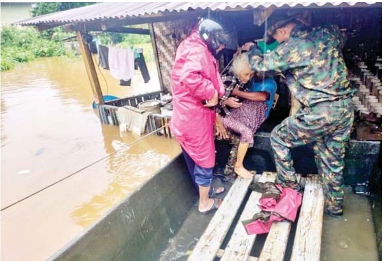
ပြီး မိုးကင်းရေလှောင်တံခံ အကူရေပိုလွှဲ ကြောင်း သိရသည်။ အောက်ပိုင်း ပျက်စီးမှုများ ဖြစ်ပေါ်ခဲ့

များ ထောက်ပံ့ပေးအပ်ပြီး လိုအပ်သည့် ကျန်းမာရေးစောင့်ရှောက်မှုလုပ်ငန်းများ ဆောင်ရွက်ပေးခဲ့သည်။ အဆိုပါ ရေကြီးရေလျှံမှုကြောင့် ပြင်ဦးလွင်မြို့နယ်အတွင်းရှိ ရပ်ကွက် ကြီး(၁)၊ ရပ်ကွက်ကြီး(၂)၊ ရပ်ကွက်ကြီး(၃)၊ ရပ်ကွက်ကြီး(၄)၊ ရပ်ကွက်ကြီး(၅)၊ ရပ်ကွက်ကြီး(၆)၊ ရပ်ကွက်ကြီး(၇)၊ ရပ်ကွက်ကြီး(၈)၊ ရပ်ကွက်ကြီး(၉)၊ ရပ်ကွက်ကြီး(၁၀)၊ ရပ်ကွက်ကြီး(၁၁)တို့အတွင်းနှင့် ကျွဲနွား ထောက်ကျေးရွာအုပ်စု သရက်ပင်ကျေးရွာ အတွင်း ရေဝင်ရောက်မှုများ ဖြစ်ပေါ်ခဲ့