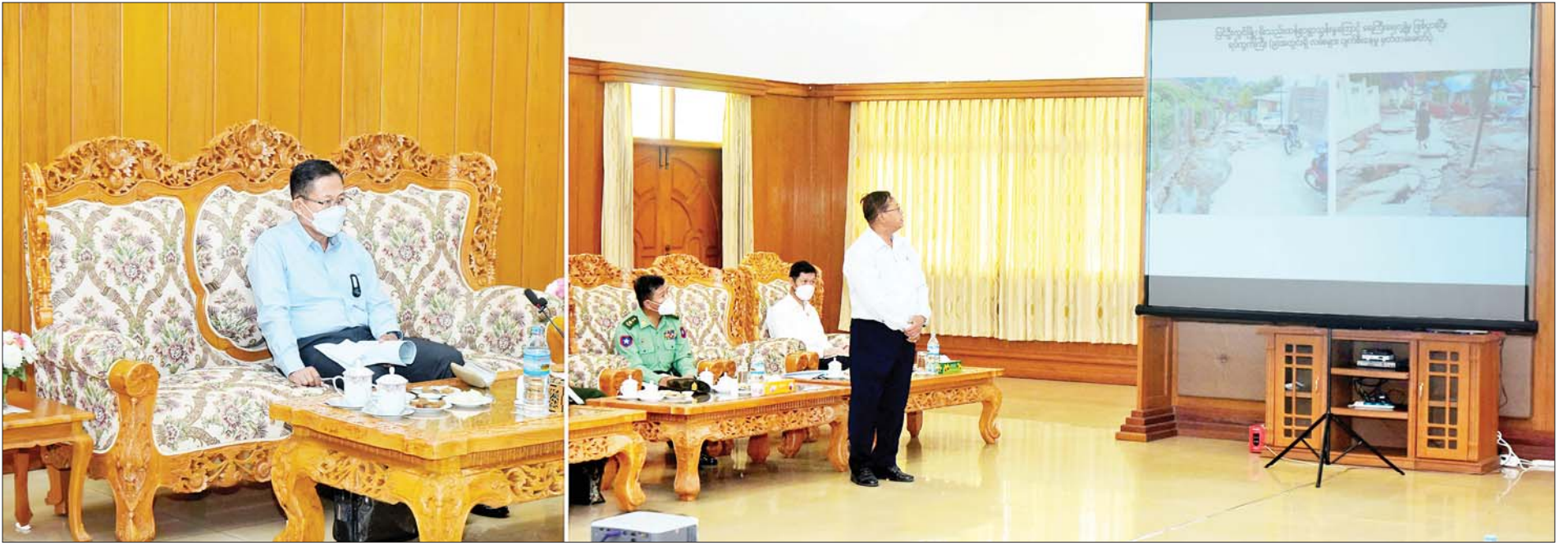
နိုင်ငံတော်စီမံအုပ်ချုပ်ရေးကောင်စီဒုတိယဥက္ကဋ္ဌ အမျိုးသားသဘာဝဘေးအန္တရာယ်ဆိုင်ရာစီမံခန့်ခွဲမှုကော်မတီဥက္ကဋ္ဌ ဒုတိယတပ်မတော်ကာကွယ်ရေးဦးစီးချုပ် ကာကွယ်ရေးဦးစီးချုပ်(ကြည်း) ဒုတိယဗိုလ်ချုပ်မှူးကြီးစိုးဝင်းအား တပ်နယ်ခန်းမ၌ တာဝန်ရှိသူတစ်ဦးက ရှင်းလင်းတင်ပြစဉ်။

နိုင်ငံတော်စီမံအုပ်ချုပ်ရေးကောင်စီ ဒုတိယဥက္ကဋ္ဌ အမျိုးသား သဘာဝဘေးအန္တရာယ်ဆိုင်ရာ စီမံခန့်ခွဲမှုကော်မတီဥက္ကဋ္ဌ ဒုတိယတပ်မတော်ကာကွယ်ရေးဦးစီးချုပ် ကာကွယ်ရေးဦးစီးချုပ်(ကြည်း) ဒုတိယဗိုလ်ချုပ်မှူးကြီးစိုးဝင်း မြို့ပေါ်ရပ်ကွက်များတွင် ရှင်းလင်းရေးဆောင်ရွက်နေမှုများကို ကြည့်ရှုစဉ်။