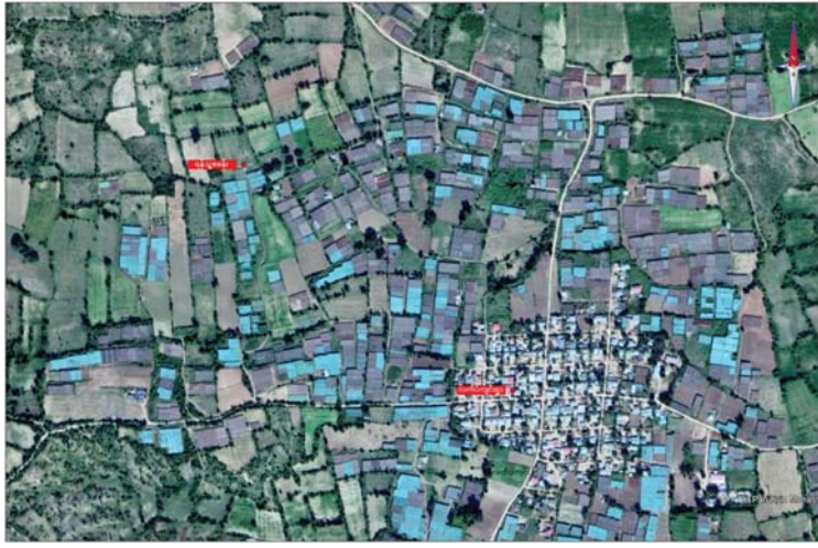
မြင်းမူမြို့နယ် လက်ပံကျင်းကျေးရွာအနီး သိမ်းဆည်းရမိသည့် ရန်သူစခန်း နေရာပြမြေပုံ။

နေပြည်တော် ဩဂုတ် ၁ စစ်ကိုင်းတိုင်းဒေသကြီး မြင်းမူ မြို့နယ် လက်ပံကျင်းကျေးရွာ၌ အကြမ်းဖက်လုပ်ရပ်များ ဆောင်ရွက်ရန် စုဝေး ရောက်ရှိနေသော PDF အမည်ခံ အကြမ်းဖက်သမားများကို ယနေ့နံနက်ပိုင်းတွင် လုံခြုံရေးတပ်ဖွဲ့ဝင်များက ဝင်ရောက် ဖမ်းဆီးခဲ့ကြောင်း သိရသည်။