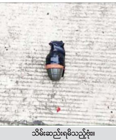
သိမ်းဆည်းရမိသည့်ပစ္စည်း။

လုပ်ရပ်များ လုပ်ဆောင်ရန်အတွက် လက်လုပ်မိုင်း တစ်လုံးအား တပ်ဆင်နေစဉ် ပေါက်ကွဲမှုဖြစ်ပွားခဲ့ ခြင်းဖြစ်ပြီး ပေါက်ကွဲမှုကြောင့် နေလင်းတွင် ဝဲလက် ကောက်ဝတ်နှင့် ယာလက်ချောင်းများပြတ်ကာ မျက်နှာ၊ ရင်ဘတ်နှင့် ဝဲ/ယာခြေထောက်တို့၌ လည်းကောင်း၊ ပြည့်ဖြိုးဦး(ခ)အကြီးကောင်တွင်