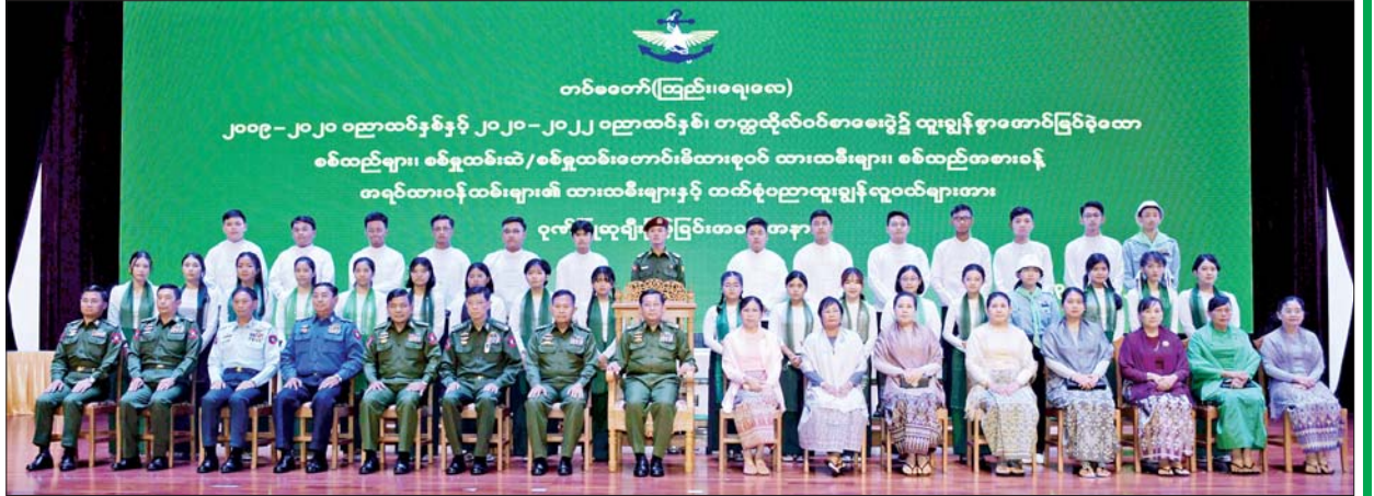
နိုင်ငံတော်စီမံအုပ်ချုပ်ရေးကောင်စီဥက္ကဋ္ဌ တပ်မတော်ကာကွယ်ရေးဦးစီးချုပ် ဗိုလ်ချုပ်မှူးကြီးမင်းအောင်လှိုင်နှင့်အဖွဲ့ဝင်များ ထူးချွန်ဂုဏ်ထူးရ ကျောင်းသား ကျောင်းသူများ၊ စစ်သည်များနှင့်အတူ စုပေါင်းမှတ်တမ်းတင်ဓာတ်ပုံရိုက်စဉ်။

“မကောင်းမြစ်တာ၊ ကောင်းရာညွန့်လတ်၊ အတတ်သင်စေ၊ ပေးဝေနှီးရင်း၊ ထိမ်းမြားခြင်းလျှင် ဝတ်ငါးအင်” တည်းဟူသော မိဘ ကျင့်ဝတ်ပါအတိုင်း သားသမီးများကို အတတ်ပညာသင်ပေးသော