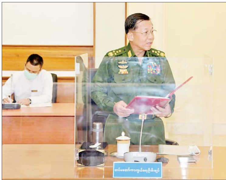
နိုင်ငံတော်စီမံအုပ်ချုပ်ရေးကောင်စီဥက္ကဋ္ဌ တပ်မတော်ကာကွယ်ရေးဦးစီးချုပ် ဗိုလ်ချုပ်မှူးကြီး မင်းအောင်လှိုင်က နိုင်ငံရေးအရ အရေးပေါ်အခြေအနေကြေညာ၍ နိုင်ငံတော်တာဝန်ထမ်းဆောင်နေရစဉ်အတွင်း ချမှတ်ထားသည့် ရှေ့လုပ်ငန်းစဉ်များ နှင့်အညီ အကောင်အထည်ဖော်ဆောင်ရွက်နေသည့် အခြေအနေနှင့် ဆက်လက် ဆောင်ရွက်မည့် အခြေအနေများနှင့် စပ်လျဉ်း၍ ပြောကြားစဉ်။

ထိုသို့ပြောကြားရာတွင် မိမိတို့ နိုင်ငံတော်စီမံအုပ်ချုပ်ရေးကောင်စီအစိုးရ အနေဖြင့် နိုင်ငံရေးအရ အရေးပေါ်အခြေ အနေကြေညာပြီး နိုင်ငံတာဝန်များကို ထမ်းဆောင်လာခဲ့သည်မှာ ၂၀၂၂ ခုနှစ် ဩဂုတ် ၁ ရက်တွင် တစ်နှစ်နှင့် ခြောက်လ (၁၈ လ) ပြည့်မြောက်မည် ဖြစ်ပါကြောင်း၊ အမျိုးသားကာကွယ်ရေးနှင့် လုံခြုံရေး ကောင်စီ အကြီးအကဲများနှင့် အဖွဲ့ဝင်များ ပါဝင်သည့် အမျိုးသားကာကွယ်ရေးနှင့် လုံခြုံရေးကောင်စီအစည်းအဝေးအမှတ်စဉ် (၁/၂၀၂၂)ကို ကျင်းပခဲ့ပြီး မိမိတို့အစိုးရ၏ တစ်နှစ်တာ တာဝန်ထမ်းဆောင်ခဲ့မှု အခြေ အနေကို တင်ပြခဲ့ပါကြောင်း၊ အဆိုပါကာလ ဖြစ်ပေါ်ခဲ့သည့် အခြေအနေများအရ ဖွဲ့စည်းပုံအခြေခံဥပဒေနှင့်အညီ ၂၀၂၂ ခုနှစ် ဖေဖော်ဝါရီ ၁ ရက်မှစပြီး ပထမခြောက်လ သက်တမ်းတိုးမြှင့်ရန် အမျိုးသားကာကွယ် ရေးနှင့် လုံခြုံရေးကောင်စီက သဘောတူ အတည်ပြုခဲ့ပါကြောင်း၊ သက်တမ်းတိုးမြှင့် ခဲ့သည့် ခြောက်လအတွင်း မိမိတို့အစိုးရ၏ အကောင်အထည်ဖော် ဆောင်ရွက်မှု များ၊ တိုးတက်ပြောင်းလဲလုပ်ဆောင်မှုများ ဆက်လက်လုပ်ဆောင်သွားမည့် အခြေ အနေများကို တင်ပြသွားမည်ဖြစ်ပါ ကြောင်း။