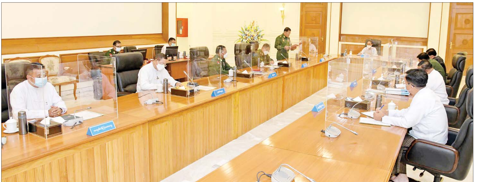
ပြည်ထောင်စုသမ္မတမြန်မာနိုင်ငံတော် အမျိုးသားကာကွယ်ရေးနှင့်လုံခြုံရေးကောင်စီအစည်းအဝေး(၂/၂၀၂၂) ကျင်းပစဉ်။