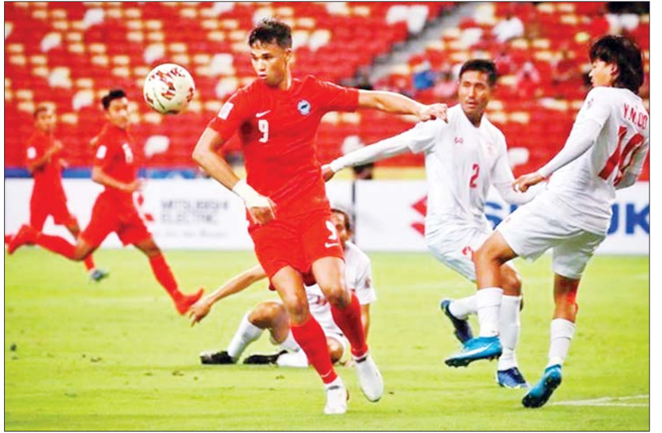
၂၀၂၀ ဆူဇူကီးဖလားပြိုင်ပွဲတွင် မြန်မာနှင့် စင်ကာပူအသင်းတို့ တွေ့ဆုံခဲ့စဉ်။

အာဆီယံ ဘောလုံးအဖွဲ့ချုပ်သည် ယင်းပြိုင်ပွဲအတွက် စပွန်ဆာအသစ် ရရှိထားပြီး မစ်ဆူဘီရီကုမ္ပဏီနှင့် စာချုပ်ချုပ်ထားကာ ယခုနှစ်ကုန် ပြုလုပ်မည့် ပြိုင်ပွဲမှစတင်ကာ Title Sponsor အဖြစ် ပံ့ပိုးကူညီသွားမည်ဖြစ်သည်။ အာဆီယံဘောလုံးအဖွဲ့ချုပ်သည် ၂၀၂၂ AFF Cup ပြိုင်ပွဲကို ဒီဇင်ဘာလတွင် စတင်ကျင်းပရန် စီစဉ်ထားပြီး ၂၀၁၈ ပြိုင်ပွဲပုံစံအတိုင်းပြုလုပ်နိုင်ရန် ဆောင်ရွက်လျက်ရှိသည်။ ၂၀၁၈ ပြိုင်ပွဲတွင် အိမ်ရှင်နိုင်ငံ သီးခြားရွေးချယ်ခြင်း မရှိတော့ဘဲ ပြိုင်ပွဲဝင်အသင်း တစ်သင်းလျှင် အုပ်စုလေးပွဲကို အိမ်ကွင်း နှစ်ပွဲ၊ အဝေးကွင်း နှစ်ပွဲ ကစားရခြင်းဖြစ်ပြီး ဆီမီးဖိုင်နယ်နှင့် ဗိုလ်လုပွဲကိုလည်း အိမ်ကွင်း၊ အဝေးကွင်း နှစ်ကျော