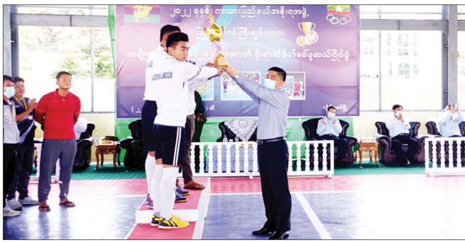
၂၀၂၂ ခုနှစ် ကယားပြည်နယ် ဖလား အမျိုးသား အသက် ၂၅ နှစ်အောက် မိုးရာသီဖိတ်ခေါ် ဖူဆယ်ပြိုင်ပွဲကို ပြိုင်ပွဲဝင်အသင်း ၁၂ သင်း ပါဝင်ယှဉ်ပြိုင်ခဲ့ကြောင်း သိရသည်။

တို့၏ ယှဉ်ပြိုင်ကစားနေမှုကို ကြည့်ရှုအားပေးကြသည်။ ဖူဆယ်ပြိုင်ပွဲ ဆုချီးမြှင့်ပွဲကို ဆက်လက်ကျင်းပရာ ပြည်နယ် ဝန်ကြီးချုပ်က ပထမဆုရရှိသည့် လွိုင်ကော်မြို့နယ်အသင်းအား တစ်ဦးချင်းဆုတံဆိပ်၊ ငွေသားဆု နှင့် တံခွန်စိုက်ဆုဖလားကို လည်းကောင်း၊ ပြည်နယ်ဝန်ကြီး များနှင့် ဒေသကွပ်ကဲမှုစစ်ဌာနချုပ် (လွိုင်ကော်) ဒေသကွပ်ကဲရေးမှူး ဗိုလ်မှူးကြီး မြတ်မင်းမိုးတို့က ဆုတံဆိပ်များနှင့် တစ်ဦးချင်း ဆုတံဆိပ်များကို ပေးအပ်ချီးမြှင့် သည်။