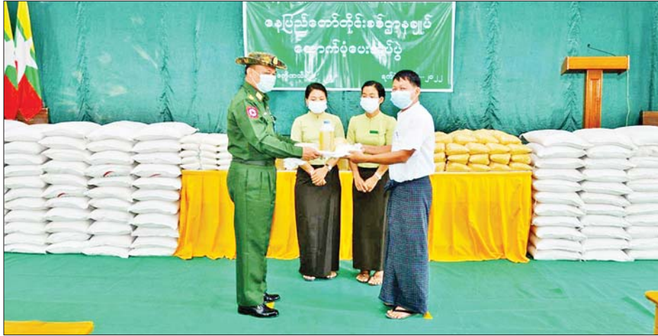
အန္တရာယ်မှ တိမ်းရှောင်လာကြသူများ တက်ရောက် ဦးစွာ တိုင်းမှူးနှင့် တာဝန်ရှိသူများက နေပြည်တော်ကောင်စီနယ်မြေ ဒက္ခိဏသီရိခရိုင် ကြသည်။

ကချင်ပြည်နယ်၊ ကယားပြည်နယ်၊ ချင်းပြည်နယ်၊ ရှမ်းပြည်နယ်၊ မကွေးတိုင်းဒေသကြီးနှင့် စစ်ကိုင်းတိုင်းဒေသကြီးအတွင်း၌ PDF အမည်ခံ အကြမ်းဖက်သမားများ၏ ခြိမ်းခြောက်အကြမ်းဖက် သတ်ဖြတ်မှုအန္တရာယ်မှ တိမ်းရှောင်လာကြသူများ အား ဆန်၊ ဆီ၊ စားသောက်ဖွယ်ရာနှင့် ထောက်ပံ့ ငွေများပေးအပ်ခြင်းကို ဇူလိုင် ၂၉ ရက် ညနေပိုင်း တွင် နေပြည်တော်ကောင်စီနယ်မြေ ဒက္ခိဏသီရိ မြို့နယ်ရှိ အထွေထွေအုပ်ချုပ်ရေးဦးစီးဌာန မြို့နယ် အုပ်ချုပ်ရေးမှူးရုံး၌ ပြုလုပ်ရာ နေပြည်တော်တိုင်းစစ် ဌာနချုပ် တိုင်းမှူး ဗိုလ်ချုပ်ဇော်ဟိန်းနှင့် ဌာနဆိုင်ရာ တာဝန်ရှိသူများ၊ ခရိုင်/မြို့နယ်စီမံအုပ်ချုပ်ရေးအဖွဲ့မှ တာဝန်ရှိသူများ၊ PDF အမည်ခံအကြမ်းဖက်သမား များ၏ ခြိမ်းခြောက်အကြမ်းဖက်သတ်ဖြတ်မှု