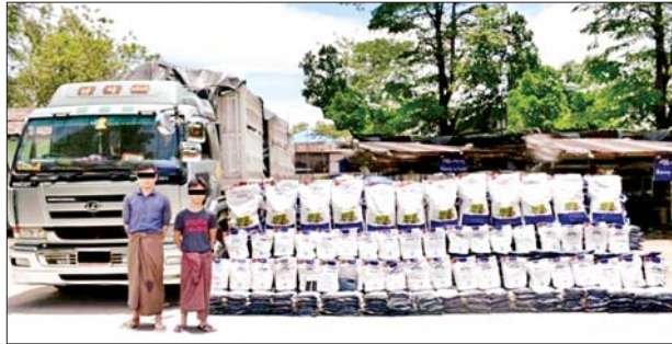
သိမ်းဆည်းရမိသည့် အမိန့်ယမ်းနိုက်ထရိတ်များနှင့်အတူ တွေ့ရစဉ်။