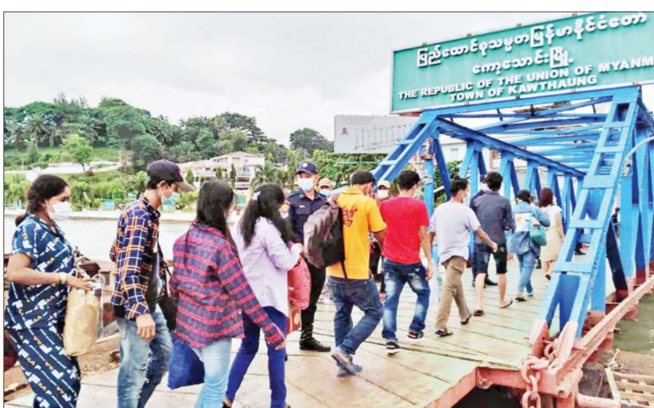
စစ်ဆေးပြီး ရောဂါပိုးတွေ့ရှိခြင်း မရှိမှသာ မိမိတို့ မည်ဖြစ်ကြောင်း သိရသည်။ နေရပ်အသီးသီးသို့ ပြန်လည်ပို့ဆောင်ပေးသွား ကျော်စိုး(ကော့သောင်း)

ပြန်လည်ဝင်ရောက်လာသူများက ကိုဗစ်-၁၉ ရောဂါကာကွယ်ဆေး နှစ်ကြိမ်ထိုးနှံပြီးသူများကို တတိယအကြိမ် ဘိုစတာထပ်ဆောင်းထိုးနှံပေးပြီး မိမိတို့နေရပ်အသီးသီးသို့ချက်ချင်း ပို့ဆောင်ပေးသွားမည်ဖြစ်ကာ ကာကွယ်ဆေးလုံးဝမထိုးနှံရသေးသူနှင့် တစ်ကြိမ်သာထိုးနှံထားသူများကို ရောဂါပိုးစစ်ဆေးမှုများဆောင်ရွက်ပြီး ကော့သောင်းမြို့ရှိ Quarantine Center သုံးခုတွင် အမျိုးသားအမျိုးသမီး သီးခြားစီခွဲခြားထားရှိအထူးကြပ်မတ်ကာ သုံးရက်အသွားအလာကန့်သတ်ထားရှိ စောင့်ကြည့်