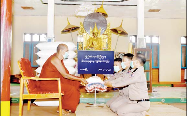
မြို့နယ်ရှိ ဇေယျာသီရိကမ္မဋ္ဌာန်းကျောင်းတိုက်သို့လည်းကောင်း၊ ရှမ်းပြည်နယ် မိုးမိတ်မြို့နယ်ရှိ ရွှေကျောင်းကျောင်းတိုက်သို့လည်းကောင်း၊ ဧရာဝတီတိုင်းဒေသကြီး ကျိုက်လတ်မြို့နယ်ရှိ ဟံသာရုံကျောင်းတိုက်သို့လည်းကောင်း ဆရာတော်၊ သံဃာတော်များအတွက် ဆွမ်းဆန်တော်များကို တာဝန်ရှိသူများက သွားရောက်ဆက်ကပ်လှူဒါန်းခဲ့ကြကြောင်း သိရသည်။ သတင်းစဉ်

ထိုသို့ဆောင်ရွက်လျက်ရှိရာ ယနေ့တွင် နေပြည်တော်ကောင်စီနယ်မြေလယ်ဝေးမြို့နယ်ရှိ မဟာဝိဟာရရန်ကင်းတောရကျောင်းတိုက်သို့လည်းကောင်း၊ ကချင်ပြည်နယ် မြစ်ကြီးနားမြို့နယ်ရှိ မဟာဂန္ဓာရုံတိုက်သစ်ပရိယတ္တိစာသင်တိုက်သို့လည်းကောင်း၊ စစ်ကိုင်းတိုင်းဒေသကြီး ကသာမြို့နယ်ရှိ မဟာလေးထပ်ကျောင်းတိုက်သို့ လည်းကောင်း၊ တနင်္သာရီတိုင်းဒေသကြီး ကော့သောင်း