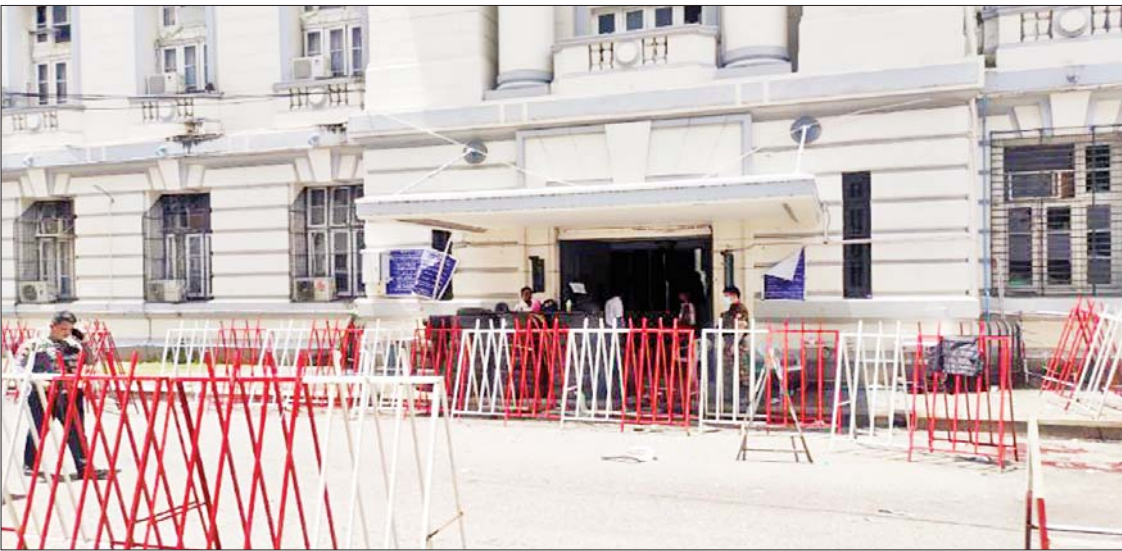
ကျောက်တံတားမြို့နယ် (၁)ရပ်ကွက် စည်ပင်လမ်း မြို့တော်ခန်းမဝင်/ထွက်ပေါက်ဂိတ်အား လက်ပစ်ဗုံးဖြင့် ပစ်ခတ်သွား သည့် မှတ်တမ်းဓာတ်ပုံ။

- ဒီမိုကရေစီတွင် တူညီသည့်အခွင့်အရေးများ ပေးရမည်ဖြစ်သကဲ့သို့ ဖက်ဒရယ် စနစ်တွင်လည်း တူညီသည့်အခွင့်အရေးများ ပေးရမည်ဖြစ်။ ငြိမ်းချမ်းရေးရရှိရန် အတွက် တိုင်းရင်းသားလက်နက်ကိုင်အဖွဲ့များနှင့် ဆက်လက်ဆွေးနွေးသွားမည်။ - တိုင်းရင်းသားလက်နက်ကိုင်အဖွဲ့များနှင့် တွေ့ဆုံဆွေးနွေးရာတွင် အဆင်ပြေ မှုများရှိခဲ့ပြီး ကောင်းမွန်သည့် တွေ့ဆုံဆွေးနွေးမှုများကို ပြုလုပ်၍ နိုင်ငံငြိမ်းချမ်းရေး ရရှိအောင် ဆက်လက်ကြိုးပမ်းဆောင်ရွက်သွားရမည်။ - အချို့သော တိုင်းရင်းသားလက်နက်ကိုင်အဖွဲ့များမှာ အကြောင်းအမျိုးမျိုးဖြင့် တွေ့ဆုံဆွေးနွေးမှု မပြုနိုင်ကြ။ မိမိတို့သည် နိုင်ငံရေးရည်မှန်းချက် နှစ်ရပ်အတိုင်း ခိုင်မြဲစွာ ဆောင်ရွက်သွားမည်ဖြစ်သဖြင့် ဆွေးနွေးရန်ကျန်ရှိသည့် အဖွဲ့များအနေ ဖြင့် မိမိကမ်းလှမ်းထားသည့်အတိုင်း ထပ်မံဖိတ်ခေါ်။ (နိုင်ငံတော်စီမံအုပ်ချုပ်ရေးကောင်စီဥက္ကဋ္ဌ နိုင်ငံတော်ဝန်ကြီးချုပ် ဗိုလ်ချုပ်မှူးကြီး မင်းအောင်လှိုင် ၂၀၂၂ ခုနှစ် ဇွန်လ ၉ ရက်နေ့တွင် ရန်ကုန်တိုင်းဒေသကြီးအစိုးရအဖွဲ့ ဝန်ကြီးများနှင့် တာဝန်ရှိသူများအား တွေ့ဆုံအမှာစကား ပြောကြားမှုမှ ကောက်နုတ်ချက်)