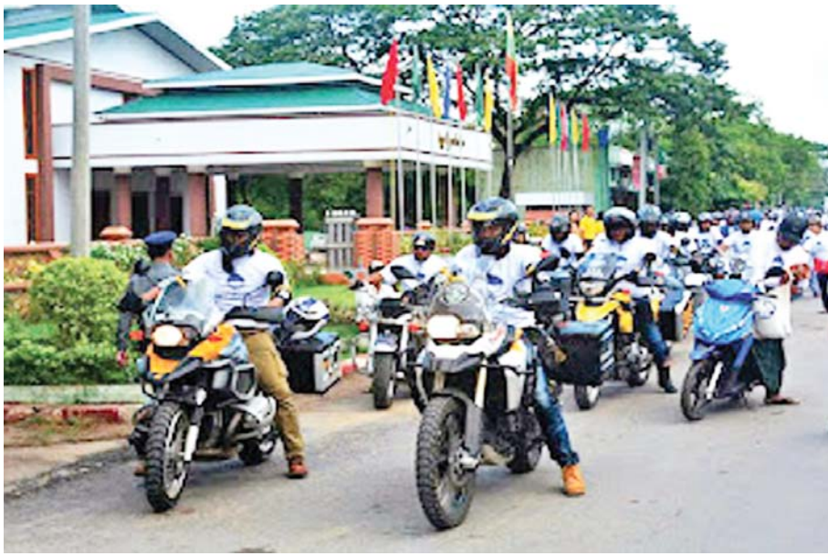
မုံရွာမြို့၌ ယာဉ်မတော်တဆမှုများ လျော့နည်းပပျောက်စေရန် ဆိုင်ကယ်စုပေါင်းစီးနင်းလှုပ်ရှားမှု ပြုလုပ်စဉ်။

ယနေ့ကာလတွင် မြန်မာနိုင်ငံတစ်ဝန်း မြို့ရွာအနှံ့ မော်တော်ဆိုင်ကယ်များ၊ ဘေးတွဲ ဆိုင်ကယ်များ၊ သုံးဘီးယာဉ်များကို ပို့ဆောင်ရေး ယာဉ်အဖြစ် အဓိကထားအသုံးပြုနေကြသည်။ မြို့ပြဘက်စွာပို့ဆောင်ရေးမရှိသော မြို့ရွာများ တွင် ဆိုင်ကယ်ကိုပင် အဓိကထားသုံးစွဲကြရသည်။ နိုင်ငံအတွင်း စီးနင်းသုံးစွဲနေသော မော်တော် ဆိုင်ကယ်များတွင် တရားဝင်တင်သွင်းလာပြီး ယာဉ်မှတ်ပုံတင်ထားသော မော်တော်ဆိုင်ကယ် များရှိသလို တရားမဝင်နည်းလမ်းပေါင်းစုံဖြင့် တင်သွင်းလာပြီး ယာဉ်မှတ်ပုံတင်ထားခြင်းမရှိ သော “without” ခေါ် လိုင်စင်မဲ့ဆိုင်ကယ်များ ကိုလည်း အများအပြားသုံးစွဲနေကြသည်။ ဆိုင်ကယ်ကို ကိုယ်ပိုင်အသုံးပြုမှုအပြင် “ကယ်ရီ” ခေါ် အခကြေးငွေဖြင့် ပို့ဆောင်သည့်စနစ်လည်း တွင်ကျယ်လျက်ရှိသည်။ ဆိုင်ကယ်စီးနင်းအသုံးပြု ရာတွင်လည်း ဆိုင်ကယ်စီးလိုင်စင်ရှိသူရှိသလို ဆိုင်ကယ်စီးလိုင်စင်မရှိဘဲ စီးနင်းနေသူများ လည်းရှိသည်။