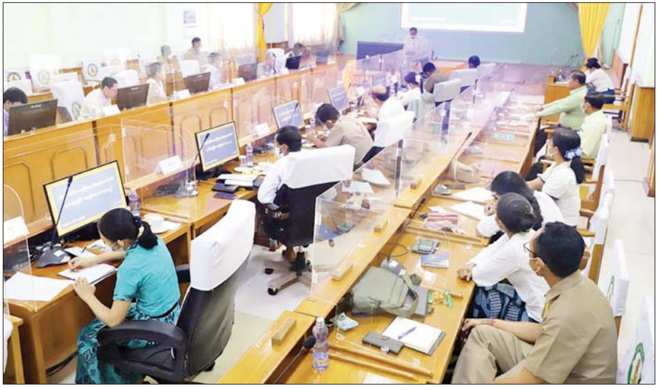
နေမှုအခြေအနေများနှင့်ပတ်သက်၍ အကြံပြု ဖြည့်ဆည်းပေါင်းစပ် ဆောင်ရွက်ပေးခဲ့ကြောင်း သိရသည်။

နေမှုအခြေအနေများနှင့်ပတ်သက်၍ အကြံပြု ဖြည့်ဆည်းပေါင်းစပ် ဆောင်ရွက်ပေးခဲ့ကြောင်း သိရသည်။ တိုင်းဒေသကြီး (ပြန်/ဆက်)