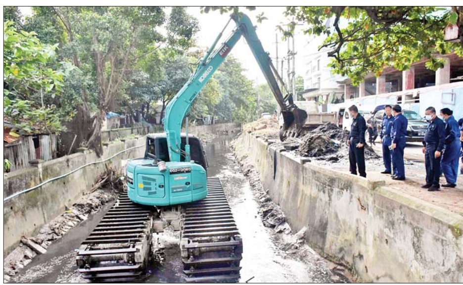
နေမှုကို လည်းကောင်း၊ တာမေမြို့နယ် မေတ္တာညွန့် ရပ်ကွက် စက်မှုရတနာလမ်းရှိ ခုနစ်ပင်လိမ်ချောင်း ရေထိန်းတံခါးပိတ်၍ ရေစုတ်စက်တစ်လုံးလျှင် တစ်နာရီ ရေဂါလန် ၃၃၀၀၀၀ စုတ်ယူနိုင်သည့် Flood

ရန်ကုန် ဇူလိုင် ၃၀ ရန်ကုန်တိုင်းဒေသကြီး စည်ပင်သာယာရေး ဝန်ကြီး ရန်ကုန်မြို့တော်စည်ပင်သာယာရေး ကော်မတီဥက္ကဋ္ဌ(မြို့တော်ဝန်) ဦးဗိုလ်ဌေးသည် ဒုတိယမြို့တော်ဝန်၊ အတွင်းရေးမှူး၊ ကော်မတီဝင် များ၊ ဌာနမှူးများနှင့်အတူ ယနေ့ နံနက် ၇ နာရီခွဲတွင် တောင်ဥက္ကလာပမြို့နယ် ၁၅ ရပ်ကွက် သံသုမာ လမ်းမပေါ်ရှိ ရေပေါက်ကြည့်ချောင်း ရေထိန်းတံခါးသို့ သွားရောက်ပြီး ဒီဇေလက်ချိန် ရေထိန်းတံခါးပိတ်၍ ငမိုးရိပ်ချောင်းအတွင်းသို့ ရေစုတ်ထုတ်နေမှုနှင့် ရေထိန်းတံခါးဝန်းကျင် မြက်ပင်ချွန်နွယ်များ ရှင်းလင်း နေမှုတို့ကို ကြည့်ရှုစစ်ဆေးပြီး လိုအပ်သည်များ ဖြည့်ဆည်းဆောင်ရွက်ပေးသည်။ ကြည့်ရှုစစ်ဆေး ထို့နောက် မြို့တော်ဝန်နှင့်အဖွဲ့သည် တောင် ဥက္ကလာပမြို့နယ် ၆ ရပ်ကွက် သစ္စာလမ်းရှိ ကျိုက္ကဆံ ချောင်းအတွင်း အမှိုက်နှင့်နန်းများ ဆယ်ယူရှင်းလင်း