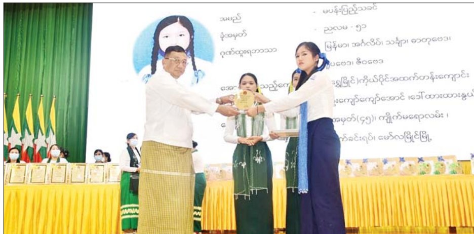
မွန်ပြည်နယ်ဝန်ကြီးချုပ် ဦးဇော်လင်းထွန်း တက္ကသိုလ်ဝင်စာမေးပွဲတွင် ခြောက်ဘာသာဂုဏ်ထူးဖြင့် အောင်မြင်ခဲ့သော မပန်းပြည့်သခင်အား ဆုချီးမြှင့်စဉ်။