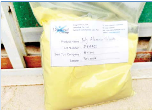
ကရင်ပြည်နယ်ကော့ကရိတ်(တံတားကျိုး) စုပေါင်းစစ်ဆေးရေးစခန်း၌ သိမ်းဆည်းရမိမှု မှတ်တမ်းဓာတ်ပုံ။

နေပြည်တော် ဇူလိုင် ၂၅ တရားမဝင် ကုန်သွယ်မှု တိုက်ဖျက်ရေး ဦးဆောင်ကော်မတီ၏ ကြီးကြပ်ကွပ်ကဲမှုဖြင့် တရားမဝင် ကုန်သွယ်မှုများကို ဥပဒေနှင့်အညီ ထိရောက်စွာ တားဆီး အရေးယူနိုင်ရေး ဆောင်ရွက်လျက်ရှိရာ ဇူလိုင် ၂၄ ရက်တွင် ကရင်ပြည်နယ် တရားမဝင် ကုန်သွယ်မှု တိုက်ဖျက်ရေး အထူးအဖွဲ့၏ စီမံခန့်ခွဲမှုဖြင့် ကော့ကရိတ် (တံတားကျိုး) စုပေါင်းစစ်ဆေးရေးစခန်း၌ တာဝန်ကျစစ်ဆေးရေးအဖွဲ့က စစ်ဆေးမှုများ ဆောင်ရွက်ခဲ့ရာ မြဝတီမှ ရန်ကုန်သို့ သွားရောက်မည့် ကုန်တင်ယာဉ် တစ်စီးပေါ်၌ သွင်းကုန်ကြေညာလွှာ (ID) တွင် ကြေညာထားခြင်း မရှိသည့် ကားတာယာများ (ခန့်မှန်း တန်ဖိုးငွေကျပ် ၂၀၀၀၀၀) ကို လည်းကောင်း၊ ကုန်တင်ယာဉ် တစ်စီးပေါ်၌ သွင်းကုန် ကြေညာလွှာ (ID) တွင် ကြေညာထားသည့် အမျိုးအစားနှင့် ကွဲလွဲတင်ဆောင်လာသော Poly Aluminium Chloride အိတ် ၁၂၀၀ (ခန့်မှန်း တန်ဖိုးငွေကျပ် ၁၀၀၀၀၀) နှင့် အဆိုပါပစ္စည်းများ တင်ဆောင်လာသည့် နောက်တွဲယာဉ်ပါ Dongfeng အမျိုးအစား ၂၂ ဘီး ကုန်တင်ယာဉ်