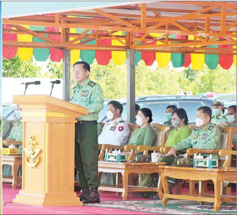
နိုင်ငံတော်စီမံအုပ်ချုပ်ရေးကောင်စီဥက္ကဋ္ဌ တပ်မတော်ကာကွယ်ရေးဦးစီးချုပ် ဗိုလ်ချုပ်မှူးကြီးမင်းအောင်လှိုင် ၂၀၂၂ ခုနှစ် ကာကွယ်ရေးဦးစီးချုပ်ရုံး (ကြည်း၊ ရေ၊ လေ) မိသားစုများ၏ ဒုတိယအကြိမ် မိုးရာသီ သစ်ပင်စိုက်ပျိုးပွဲအခမ်းအနားတွင် အမှာစကားပြောကြားစဉ်။