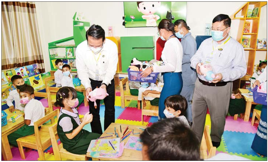
ပြည်ထောင်စုဝန်ကြီး ဦးမောင်မောင်အုန်း လူထုအခြေပြုဗဟိုဌာန(တောင်ကြီး) အဆောက်အအုံသစ်ရှိ ကလေးစာဖတ်ခန်း၌ ကလေးငယ်များအား အမှတ်တရလက်ဆောင်ပစ္စည်းများ ပေးအပ်စဉ်။

ဝိုင်းဝန်းထိန်းသိမ်း ဆောင်ရွက်ကြစေလိုကြောင်းနှင့် လူထုအခြေပြုဗဟိုဌာန (တောင်ကြီး) အောင်မြင်စွာ ဖွင့်လှစ်နိုင်ရေးအတွက် ဝိုင်းဝန်းပံ့ပိုးကူညီပေးကြသည့် ရှမ်းပြည်နယ်အစိုးရအဖွဲ့နှင့် ဌာနဆိုင်ရာများ၊ စေတနာရှင်အလှူရှင်များအား ကျေးဇူးတင်ရှိကြောင်း ပြောကြားသည်။