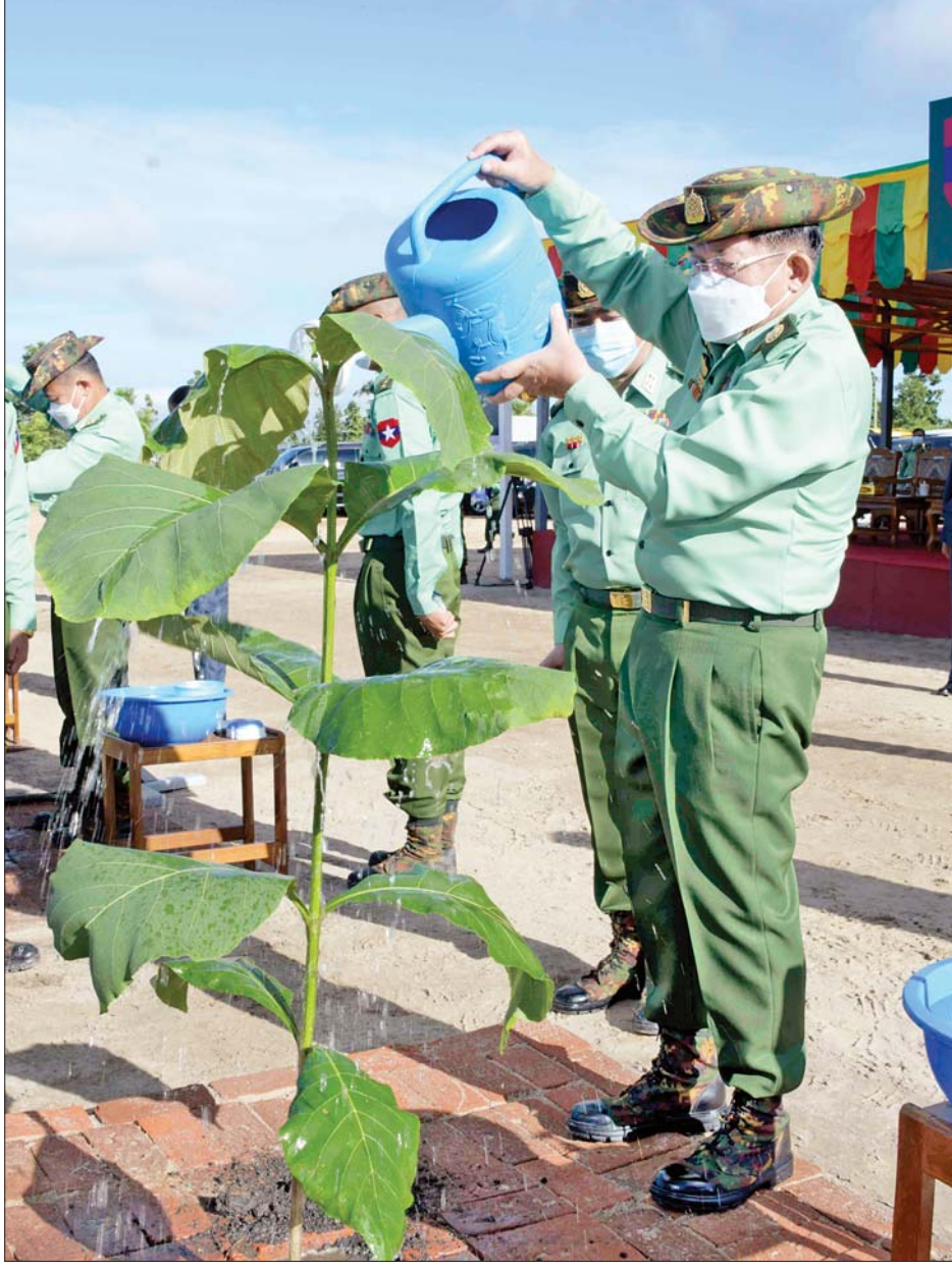
နိုင်ငံတော်စီမံအုပ်ချုပ်ရေးကောင်စီဥက္ကဋ္ဌ တပ်မတော်ကာကွယ်ရေးဦးစီးချုပ် ဗိုလ်ချုပ်မှူးကြီး မင်းအောင်လှိုင် ရတနာတန်းဝင်ကျွန်းပင်ကို ဦးဆောင်စိုက်ပျိုးပေးစဉ်။

တပ်မတော်အရာရှိကြီးများနှင့် ဇနီးများ၊ နေပြည်တော် တိုင်းစစ်ဌာနချုပ်တိုင်းမှူးနှင့် ဇနီး၊ နိုင်ငံတော် ကာကွယ်ရေးတက္ကသိုလ်မှ သင်တန်းသားအရာရှိကြီး များ၊ ကာကွယ်ရေးဦးစီးချုပ်ရုံး(ကြည်း)ရှိ ရုံးဌာန အသီးသီးမှ အရာရှိ၊ စစ်သည်များနှင့် မိသားစုဝင်များ တက်ရောက်ကြသည်။ သစ်တော၊ သစ်ပင်များ၏ဖြစ်တည်မှုသည် လူ့အပါအဝင် သက်ရှိသတ္တဝါအားလုံးတို့ အသက်ရှင်တည်မြဲနိုင်ရေးအတွက် ဂေဟကွင်းဆက်တစ်ခုပင်ဖြစ် ဦးစွာ နိုင်ငံတော်စီမံအုပ်ချုပ်ရေးကောင်စီဥက္ကဋ္ဌ တပ်မတော်ကာကွယ်ရေးဦးစီးချုပ် ဗိုလ်ချုပ်မှူးကြီး မင်းအောင်လှိုင်က အမှာစကားပြောကြားရာတွင် တပ်မတော်အနေဖြင့် နှစ်စဉ်နှစ်တိုင်း သစ်ပင်စိုက် ပွဲတော်များပြုလုပ်လာသည်မှာ ဆယ်စုနှစ်တစ်ခုခန့်က တိုင်ခဲ့ပြီဖြစ်ပြီး သစ်ပင်စိုက်ပျိုးခြင်းနှင့်ပတ်သက်၍ နှစ်စဉ် မိုးရာသီရောက်တိုင်း သစ်ပင်စိုက်ပျိုးပွဲတော် များကို ပြုလုပ်ကျင်းပကြကာ သက်ဆိုင်ရာဝန်ကြီး ဌာနများ၊ တိုင်းဒေသကြီးများ၊ အဖွဲ့အစည်းများ အလိုက် စာမျက်နှာ ၃ ကော်လံ ၁ သို့ ။