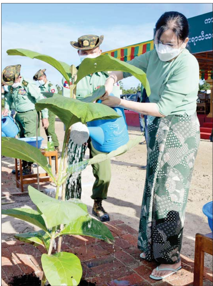
နိုင်ငံတော် စီမံအုပ်ချုပ်ရေး ကောင်စီဥက္ကဋ္ဌ တပ်မတော် ကာကွယ်ရေး ဦးစီးချုပ် ဗိုလ်ချုပ်မှူးကြီး မင်းအောင်လှိုင်၏ ဇနီး ဒေါ်ကြူကြူလှ ရတနာတန်းဝင် ကျွန်းပင်ကို ဦးဆောင် စိုက်ပျိုးပေးစဉ်။

ထို့ကြောင့် မိမိတို့တပ်မတော်သားများမှအစ ပြု၍ မိမိတို့နိုင်ငံသားများအနေဖြင့် တစ်ဦးချင်း တစ်ယောက်ချင်းမှ အုပ်စုလိုက်၊ အဖွဲ့အစည်းလိုက်၊ ကျေးရွာလိုက်၊ မြို့နယ်လိုက် သစ်ပင်စိုက်ပျိုး ထိန်းသိမ်းသည့် အလေ့အထရှိသူများဖြစ်လာမည်