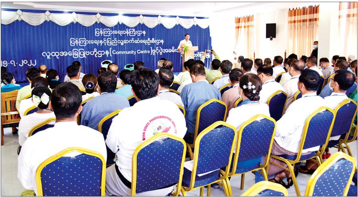
ပြည်ထောင်စုဝန်ကြီး ဦးမောင်မောင်အုန်း လူထုအခြေပြုဗဟိုဌာန(တောင်ကြီး) အဆောက်အအုံသစ် ဖွင့်ပွဲအခမ်းအနားတွင် အမှာစကား ပြောကြားစဉ်။

တောင်ကြီး ဇူလိုင် ၂၅ ပြန်ကြားရေးဝန်ကြီးဌာနသည် ပြန်ကြားရေးနှင့် ပြည်သူ့ဆက်ဆံရေးဦးစီးဌာနရုံးများအား ပြည်သူများ အသိပညာနှင့် သတင်းအချက်အလက်များ ရှာဖွေရာနေရာ၊ ရပ်ကျိုးရွာကျိုး တိုင်းကျိုး ပြည်ကျိုးကိစ္စများ ဆွေးနွေးတိုင်ပင်ရာနေရာ၊ ပြည်သူများ အကျွမ်းတဝင် ဝင်/ထွက်သွားလာရာ နေရာများအဖြစ် ပေါ်ပေါက်လာစေရေးအတွက် လူထုအခြေပြုဗဟိုဌာနများကို စီစဉ်ဆောင်ရွက်ပေးလျက်ရှိရာ တောင်ကြီးမြို့၌ တည်ဆောက်ပြီးစီးသည့်လူထုအခြေပြုဗဟိုဌာန အဆောက်အအုံသစ်ဖွင့်ပွဲ အခမ်းအနားကို ယနေ့နံနက် ၉ နာရီတွင် အဆိုပါအဆောက်အအုံသစ်ရှေ့၌ ကျင်းပသည်။