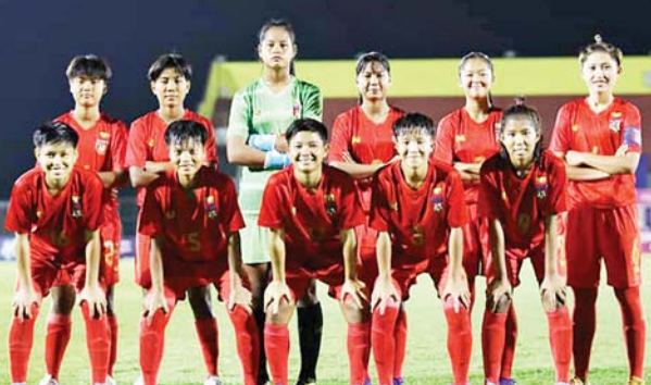
မြန်မာ ယူ-၁၈ အမျိုးသမီး အသင်း အားကစား သမားများကို တွေ့ရစဉ်။

ရန်ကုန် ဇူလိုင် ၂၅ ၂၀၂၂ အာဆီယံ ယူ-၁၈ အမျိုးသမီးချန်ပီယံရှစ်ပြိုင်ပွဲ အုပ်စု(ခ) ပထမနေ့ကို ဇူလိုင် ၂၅ ရက်က အင်ဒိုနီးရှားနိုင်ငံ၌ကျင်းပရာ မြန်မာအသင်းက မလေးရှားအသင်းကို နှစ်ဂိုး-ဂိုးမရှိဖြင့် အနိုင်ရခဲ့သည်။ စာမျက်နှာ ၁၆ ကော်လံ ၁ သို့ ၀