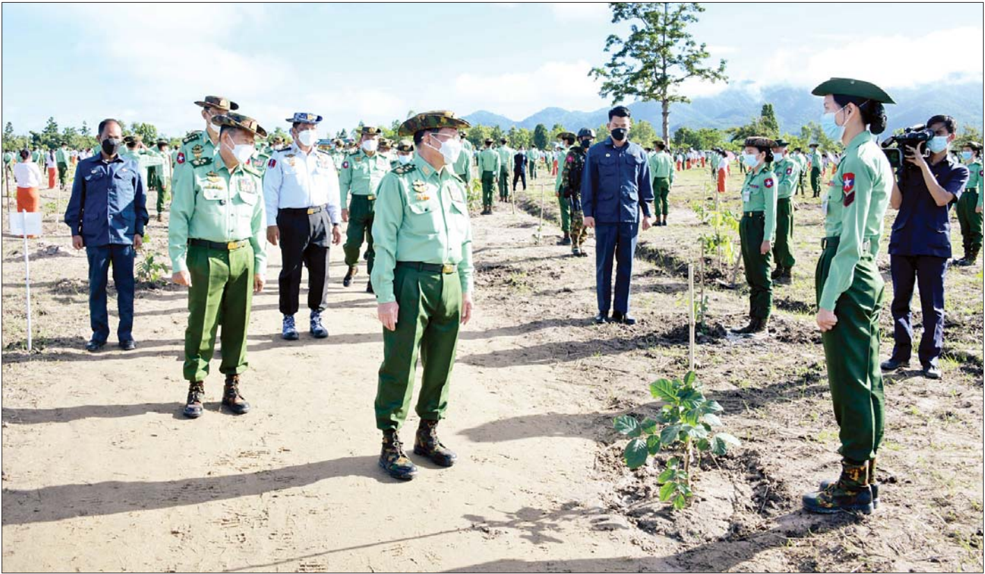
နိုင်ငံတော်စီမံအုပ်ချုပ်ရေးကောင်စီဥက္ကဋ္ဌ တပ်မတော်ကာကွယ်ရေးဦးစီးချုပ် ဗိုလ်ချုပ်မှူးကြီးမင်းအောင်လှိုင်နှင့် အဖွဲ့ဝင်များ အရာရှိ၊ စစ်သည် မိသားစုများ၏ စုပေါင်းသစ်ပင်စိုက်ပျိုးနေမှုအား လှည့်လည်ကြည့်ရှုအားပေးစဉ်။

စိုက်ပျိုးပြီးစီးခဲ့သည့် အပင်တိုင်းကို စတင်စိုက်ပျိုးပြီးချိန်မှစ၍ စဉ်ဆက်မပြတ် စောင့်ကြည့်သည့်စနစ် ထူထောင်သွားရမည်ဖြစ်ပြီး ထိန်းသိမ်းပြုစုခြင်း လုပ်ငန်းစဉ်များကို ရာသီအလိုက်၊ အပင်သက်တမ်းအလိုက် မပျက်မကွက် ဆောင်ရွက်ကြရမည်ဖြစ်ကြောင်း၊ သစ်ပင်စိုက်ပျိုးရာတွင် အဖြစ်သဘောမျိုး၊