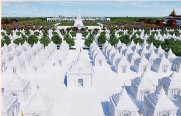
ကျောက်စာရုံစေတီ(၁၂ x ၁၂x ၁၈)ပေ ၁ ဆူ တန်ဖိုး- ၂၇၉ သိန်း