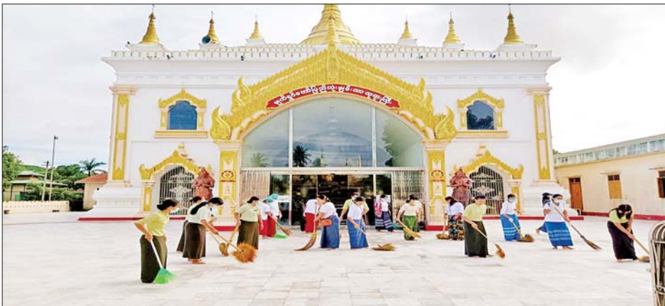
ဧရာဝတီတိုင်းဒေသကြီး ကျောင်းကုန်းမြို့နယ် မျက်ရှင်တော်ပြည်လုံးချမ်းသာဘုရားကြီး၌ စုပေါင်း သန့်ရှင်းရေး ဆောင်ရွက်ကြစဉ်။

နေပြည်တော် ဇူလိုင် ၂၃ ယခုအချိန်အခါတွင် နိုင်ငံတော် စီမံအုပ်ချုပ်ရေး ကောင်စီ၏ ဦးဆောင်မှုနှင့်အတူ နိုင်ငံတစ်ဝန်း လုံး၌ အုပ်ချုပ်ရေးအဖွဲ့အစည်း များ၊ ဒေသခံပြည်သူများအားလုံး က နိုင်ငံတော်ဖွံ့ဖြိုးတိုးတက်ရေး လုပ်ငန်းများကို ညီညီညွတ်ညွတ် ဖြင့် ဆောင်ရွက်လျက်ရှိကြပြီး အပတ်စဉ် စနေနေ့တိုင်းတွင် လည်း မိမိတို့၏ မြို့၊ ရွာဒေသများ သန့်ရှင်းသာယာ လှပရေးကို ဆောင်ရွက်လျက်ရှိကြသည်။ ထိုသို့ ဆောင်ရွက်လျက်ရှိရာ ယနေ့တွင် နေပြည်တော်ကောင်စီ နယ်မြေ ဇေယျာသီရိမြို့နယ် အပါအဝင် မြို့နယ် ၃ ခုနှင့် မြို့နယ် တို့၌လည်းကောင်း၊ ကချင် ပြည်နယ် မြစ်ကြီးနားမြို့နယ် အပါအဝင် မြို့နယ် သုံးမြို့နယ် တို့၌လည်းကောင်း၊ ရှမ်းပြည်နယ် (မြောက်ပိုင်း) ကွတ်ခိုင်မြို့၌ လည်းကောင်း၊ ရှမ်းပြည်နယ် (တောင်ပိုင်း) နမ့်စန်မြို့နှင့် မိုးနဲမြို့တို့၌ လည်းကောင်း၊ ရှမ်းပြည်နယ်(အရှေ့ပိုင်း) မိုင်းဖြတ် မြို့အပါအဝင် မြို့နယ် ငါးမြို့နယ် တို့၌လည်းကောင်း၊ မွန်ပြည်နယ် သထုံမြို့နယ် အပါအဝင် မြို့နယ် လေးမြို့နယ်တို့၌ လည်းကောင်း၊ တနင်္သာရီတိုင်းဒေသကြီး မြိတ်မြို့ အပါအဝင် မြို့နယ် ၁၀ မြို့နယ်