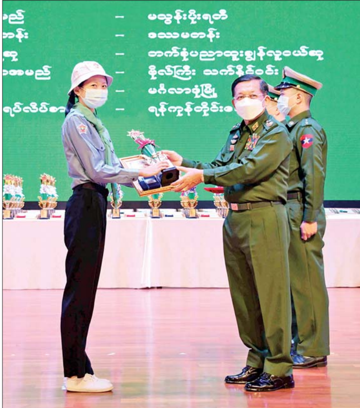
နိုင်ငံတော်စီမံအုပ်ချုပ်ရေးကောင်စီဥက္ကဋ္ဌ တပ်မတော်ကာကွယ်ရေးဦးစီးချုပ် ဗိုလ်ချုပ်မှူးကြီး မင်းအောင်လှိုင် ဘက်စုံပညာထူးချွန်လူငယ်ဆုရရှိသည့် မသွန်းဝင်း ရတီအား ဂုဏ်ပြုတံဆိပ်၊ ဂုဏ်ပြုဆုနှင့် ဂုဏ်ပြုမှတ်တမ်းလွှာများ ပေးအပ်စဉ်။