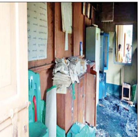
အုပ်ချုပ်ရေးအဖွဲ့များထံ သတင်းပို့ခြင်းဖြင့် ပြည်သူ့ လုံခြုံရေး၊ အနာဂတ်ရင်သွေးငယ်များ၏ လုံခြုံရေးကို ဝိုင်းဝန်းကူညီပေးကြပါရန် မေတ္တာရပ်ခံတိုက်တွန်း ထားကြောင်း သိရသည်။ သတင်းစဉ်