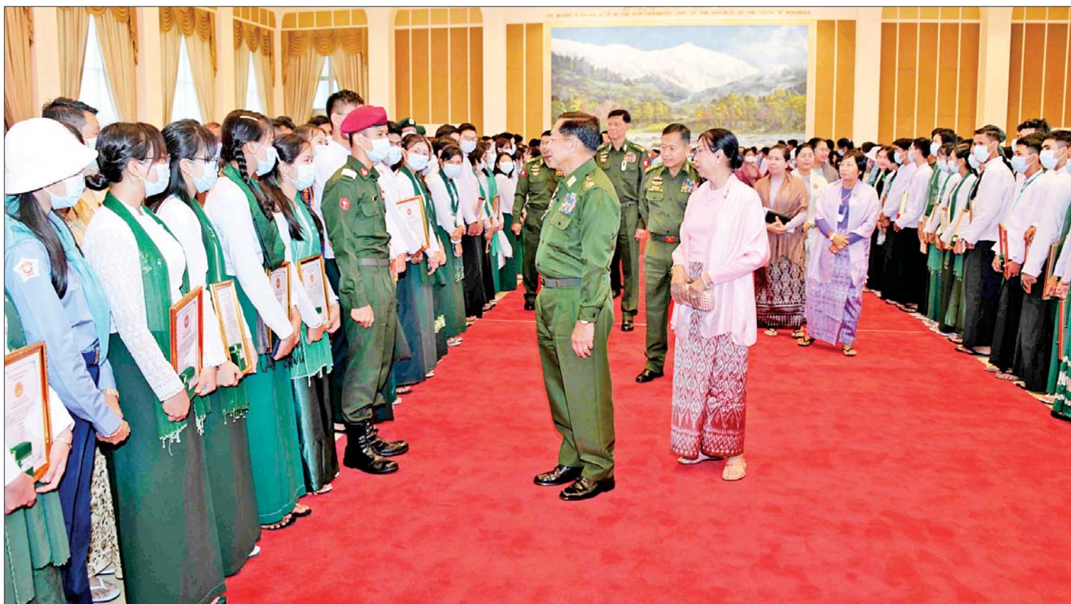
နိုင်ငံတော်စီမံအုပ်ချုပ်ရေးကောင်စီဥက္ကဋ္ဌ တပ်မတော်ကာကွယ်ရေးဦးစီးချုပ် ဗိုလ်ချုပ်မှူးကြီး မင်းအောင်လှိုင်၊ ဇနီး ဒေါ်ကြူကြူလှနှင့် အဖွဲ့ဝင်များက ဆုရစစ်သည်များ၊ ကျောင်းသား ကျောင်းသူများနှင့် မိဘများအား ရင်းရင်းနှီးနှီးလိုက်လံနှုတ်ဆက်စဉ်။

နေပြည်တော် ဇူလိုင် ၂၃ မိမိတို့၏မိသားစုဂုဏ်၊ ပညာ သင်ကြားခဲ့သည့် ကျောင်းတော်ကြီး၏ ဂုဏ်ဆောင်နိုင်ခြင်းမှသည် အမိနိုင်ငံတော် ၏ဂုဏ်ကို ထွန်းလင်းပြောင်စေသည့် မြန်မာ့လူငယ်များဖြစ်အောင် ကြိုးစား သွားကြရမည်ဖြစ်ကြောင်း၊ ကျောင်းသား ကျောင်းသူဘဝတွင် တပည့်ကောင်း ဖြစ်အောင် ကြိုးစားခဲ့သကဲ့သို့ တစ်နေ့နေ့ တစ်ချိန်ချိန်တွင် တိုင်းပြည်ကို ပြန်လည် ဦးဆောင်ရမည့်သူများ ဖြစ်လာကြပြီးမည် ဖြစ်သည့်အတွက် နောင်အနာဂတ်အချိန် တွင်လည်း စည်းကမ်းကောင်းမွန်သည့် ဆရာကောင်းများ၊ ခေါင်းဆောင်ကောင်း များ ဖြစ်လာကြရေး ဆက်လက်ကြိုးစား အားထုတ်သွားကြရန် တိုက်တွန်း မှာကြားလိုကြောင်းဖြင့် နိုင်ငံတော်စီမံ အုပ်ချုပ်ရေးကောင်စီဥက္ကဋ္ဌ တပ်မတော် ကာကွယ်ရေးဦးစီးချုပ် ဗိုလ်ချုပ်မှူးကြီး မင်းအောင်လှိုင်က ယနေ့မွန်းလွဲပိုင်းတွင် နေပြည်တော်ရှိ ဇေယျာသီရိဗိမာန်၌ ကျင်းပပြုလုပ်သည့် ၂၀၁၉-၂၀၂၀ ပညာ သင်နှစ်နှင့် ၂၀၂၁-၂၀၂၂ ပညာသင်နှစ် တက္ကသိုလ်ဝင်စာမေးပွဲ၌ ထူးချွန်စွာ စာမျက်နှာ ၃ ကော်လံ ၁ သို့ ၂