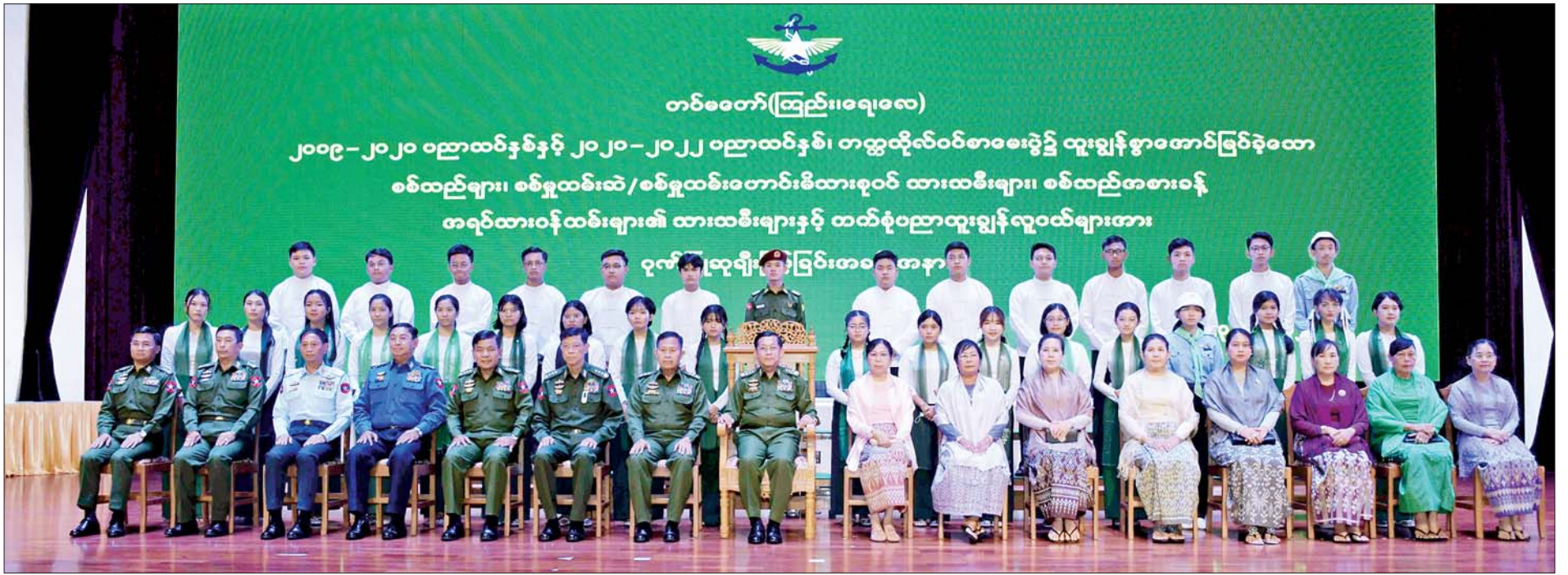
နိုင်ငံတော်စီမံအုပ်ချုပ်ရေးကောင်စီဥက္ကဋ္ဌ တပ်မတော်ကာကွယ်ရေးဦးစီးချုပ် ဗိုလ်ချုပ်မှူးကြီးမင်းအောင်လှိုင်နှင့်အဖွဲ့ဝင်များ ထူးချွန်စွာအောင်မြင်ခဲ့သော စစ်ထောင်များ၊ စစ်မှုထမ်းထံ/စစ်မှုထမ်းတောင်းခံထားစုဝင် ထားထမ်းများ၊ စစ်ထည်တမားခန့် တရင်ထားဝန်ထမ်းများ၏ ထားထမ်းများနှင့် ထက်စုံပညာထူးချွန်လူငယ်များအား ဂုဏ်ထူးဆောင်ချီးမြှင့်ပေးခြင်းအခမ်းအနား

ဒ် စာမျက်နှာ ၄ မှ ခံယူချက်ကောင်းများနှင့် ပညာကို ဆက်လက် ကြိုးစားသင်ယူသွား ကြရမည်ဖြစ်ကြောင်း၊ စစ်မှန် သည့် မျိုးချစ်စိတ်ဓာတ်ကို နှလုံး သွင်းပြီး အတတ်ပညာများကို ဆည်းပူးသကဲ့သို့ အသိပညာ ပိုင်းဆိုင်ရာတွင်လည်း အားနည်း မှုမရှိစေအောင် ကြိုးစားအားထုတ် ကြစေလိုကြောင်း၊ မိမိတို့၏ မိသားစုဂုဏ်၊ ပညာသင်ကြားခဲ့ သည့် ကျောင်းတော်ကြီး၏ ဂုဏ်ဆောင်နိုင်ခြင်းမှသည် အမိ နိုင်ငံတော်၏ဂုဏ်ကို ထွန်းလင်း ပြောင်စေသည့် မြန်မာ့လူငယ်များ ဖြစ်အောင် ကြိုးစားသွားကြရမည် ဖြစ်ကြောင်း တိုက်တွန်းမှာကြား သည်။