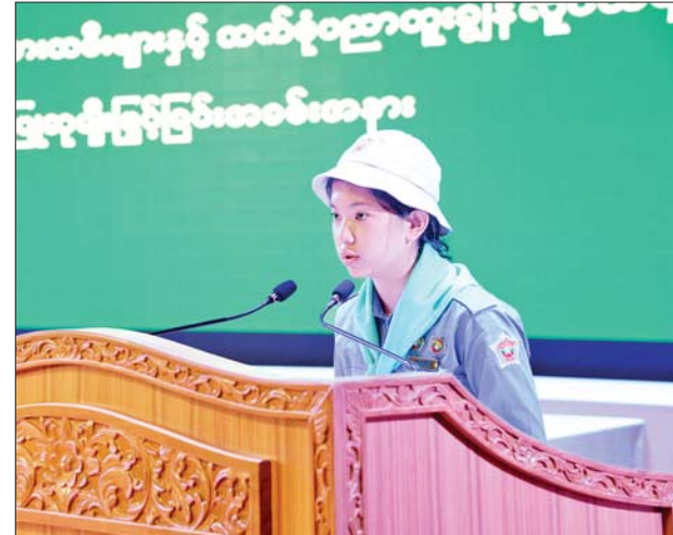
ထူးချွန်ဂုဏ်ထူးရ ကျောင်းသား ကျောင်းသူများနှင့် စစ်သည်များကိုယ်စား ဘက်စုံပညာထူးချွန်ဆုရ မရွှေပြည့်လှဦးက ကျေးဇူးတင်စကား ပြန်လည်ပြောကြားစဉ်။

ငါးဘာသာဂုဏ်ထူးရှင် ၁၀ ဦးကိုလည်းကောင်း၊ ပညာရေးဝန်ကြီးဌာန ပြည်ထောင်စုဝန်ကြီး ဒေါက်တာညွန့်ဖေက ငါးဘာသာဂုဏ်ထူးရှင် ၁၀ ဦးကိုလည်းကောင်း၊ သိပ္ပံနှင့် နည်းပညာဝန်ကြီးဌာန ပြည်ထောင်စုဝန်ကြီး ဒေါက်တာမျိုးသိန်းကျော်က ငါးဘာသာဂုဏ်ထူးရှင် ၁၀ ဦးကိုလည်းကောင်း၊ ကျန်းမာရေးဝန်ကြီးဌာန ပြည်ထောင်စုဝန်ကြီး ဒေါက်တာ သက်ခိုင်ဝင်းက ငါးဘာသာဂုဏ်ထူးရှင် ၁၀ ဦးကိုလည်းကောင်း၊ ညှိနှိုင်းကွပ်ကဲရေးမှူး(ကြည်း၊ ရေ၊ လေ) ဗိုလ်ချုပ်ကြီးမောင်မောင်အေးက ငါးဘာသာဂုဏ်ထူးရှင် ကိုးဦးကိုလည်းကောင်း၊ ညှိနှိုင်းကွပ်ကဲရေးမှူး(ကြည်း၊ ရေ၊ လေ) ဗိုလ်ချုပ်ကြီး မောင်မောင်အေး၏ ဇနီးက ငါးဘာသာဂုဏ်ထူးရှင် ၁၀ ဦးကိုလည်းကောင်း၊ ကာကွယ်ရေးဦးစီးချုပ်(ရေ) ဗိုလ်ချုပ်ကြီးမိုးအောင်က ငါးဘာသာဂုဏ်ထူးရှင် ကိုးဦးကိုလည်းကောင်း၊ ကာကွယ်ရေးဦးစီးချုပ် (ရေ)ဗိုလ်ချုပ်ကြီး မိုးအောင်၏ဇနီးက ငါးဘာသာဂုဏ်ထူးရှင် ၁၀ ဦးကိုလည်းကောင်း၊ ကာကွယ်ရေးဦးစီးချုပ် (လေ) ဗိုလ်ချုပ်ကြီးထွန်းအောင်က ငါးဘာသာဂုဏ်ထူးရှင် ၁၀ ဦး