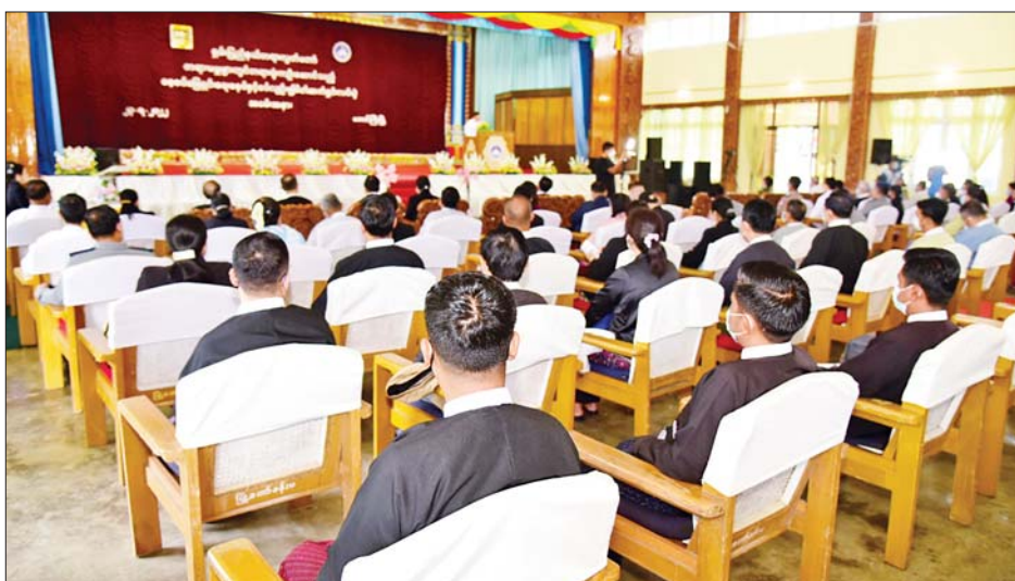
တရားလွှတ်တော်အနေဖြင့် ယခုအခါ စေ့စပ်ဖြေရှင်းရေးဌာနကို ဖွင့်လှစ်ထားရှိပြီး သြဂုတ် ၁ ရက်မှ စတင်ကာ ပြည်နယ်အတွင်းရှိ တရားရုံးများ၌ စွဲဆိုသော တရားမကြီးမှုများနှင့်စပ်လျဉ်း၍ စေ့စပ်

တောင်ကြီး ဇူလိုင် ၂၃ ရှမ်းပြည်နယ် တရားလွှတ်တော်က ကြီးမှူးကျင်းပသည့် တရားမမှုများတွင် တရားရုံးက ဦးဆောင်သည့် စေ့စပ်ဖြေရှင်းရေးစနစ်နှင့်စပ်လျဉ်းသည့် မိတ်ဆက်ရှင်းလင်းပွဲကို ယနေ့နံနက် ၉ နာရီက တောင်ကြီးမြို့ မြို့တော်ခန်းမ၌ ကျင်းပသည်။ ရှမ်းပြည်နယ်ဝန်ကြီးချုပ် ဒေါက်တာကျော်ထွန်းက တရားရုံးကဦးဆောင်သည့် စေ့စပ်ဖြေရှင်းရေးဆိုသည်မှာ တရားရုံး၌စွဲဆိုပြီးဖြစ်သော တရားမမှုများအား အမှုသည်တို့၏ဆန္ဒအရဖြစ်စေ၊ သတ်မှတ်ချက်အရဖြစ်စေ တရားရုံးရှိ စေ့စပ်ဖြေရှင်းရေးဌာန၌ အမှုသည်များကိုယ်တိုင်ပါဝင်ပြီး စေ့စပ်ဖြေရှင်းရာတွင် တရားရုံးက တာဝန်ပေးအပ်သည့် စေ့စပ်ဖြေရှင်းရေး အရာရှိတစ်ဦးက အမှုသည်များအကြား ကြားဝင်ကူညီဆောင်ရွက်ပေးခြင်းဖြင့် အငြင်းပွားမှုများကို ဖြေရှင်းပေးခြင်းဖြစ်ကြောင်း၊ ရှမ်းပြည်နယ်