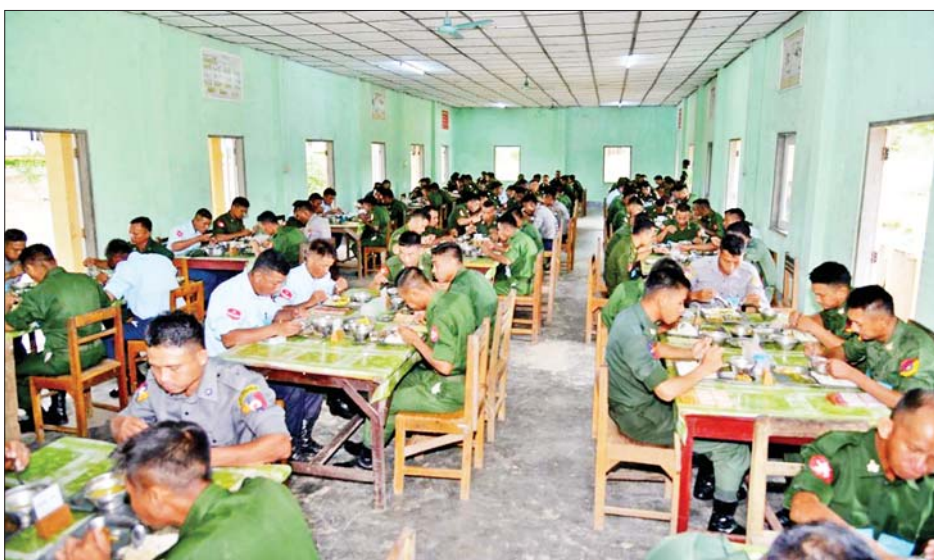
တပ်ဖွဲ့များနှင့် နယ်မြေခံသင်တန်းကျောင်းများမှ တက်ရောက်အားပေးကာ အရာရှိ၊ စစ်သည်၊ မိသားစုများကို ရင်းရင်းနှီးနှီး မိသားစုများနှင့် အတူတကွသုံးဆောင်ခဲ့ကြောင်း သိရသည်။

ထိုသို့ ဆောင်ရွက်လျက်ရှိရာ နေပြည်တော် တိုင်းစစ်ဌာနချုပ်နှင့် မြောက်ပိုင်းတိုင်းစစ်ဌာနချုပ်မှ တိုင်းမှူးများနှင့် တာဝန်ရှိသူများက သက်ဆိုင်ရာ ကွပ်ကဲမှုအောက်ရှိ တပ်ရင်း/တပ်ဖွဲ့များနှင့် နယ်မြေခံ သင်တန်းကျောင်းများသို့ သွားရောက်၍ အရာရှိ၊ စစ်သည်၊ မိသားစုများကို ရင်းရင်းနှီးနှီး တွေ့ဆုံ နှုတ်ဆက်ပြီး ဂုဏ်ပြုစားပွဲများ ပြုလုပ်ပေး၍ တက်ရောက်အားပေးကာ အရာရှိ၊ စစ်သည်၊ မိသားစု များနှင့် အတူတကွ လက်ရည်တစ်ပြင်တည်း သုံးဆောင်ခဲ့ကြသည်။ အတူတကွသုံးဆောင် အလားတူ တိုင်းစစ်ဌာနချုပ်များအလိုက် တပ်နယ်အသီးသီးမှ တပ်မတော်အရာရှိကြီးများက လည်း ၎င်းတို့၏ ကွပ်ကဲမှုများအလိုက် တပ်ရင်း/