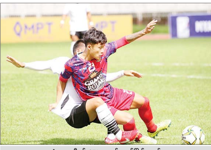
ဟံသာဝတီနှင့် GFA အသင်း ယှဉ်ပြိုင်နေစဉ်။

မြန်မာနိုင်ငံအပေါ် ဂမ်ဘီယာနိုင်ငံက အပြည်ပြည်ဆိုင်ရာ တရားရုံး၌ ၁၉၄၈ ခုနှစ် လူမျိုးသုဉ်းစေမှုကို တားဆီးရန်နှင့် ပြစ်ဒဏ် ပေးရန်နိုင်ငံတကာသဘောတူစာချုပ်ကို ကျူးလွန်ဖောက်ဖျက်သည်ဟု စွပ်စွဲချက်ဖြင့် ၂၀၁၉ ခုနှစ်၊ နိုဝင်ဘာလတွင် တရားစွဲဆိုခဲ့ခြင်းနှင့် ပတ်သက်၍ အပြည်ပြည်ဆိုင်ရာတရားရုံးက မြန်မာနိုင်ငံက တင်သွင်းခဲ့သည့် ကနဦးကန့်ကွက်လွှာကို ပယ်ချကြောင်း ဆုံးဖြတ်ချက် ကို ပြည်ထောင်စုသမ္မတ မြန်မာနိုင်ငံတော်အနေဖြင့် မှတ်သား ထားရှိသည်။ ဂမ်ဘီယာနိုင်ငံက အပြည်ပြည်ဆိုင်ရာတရားရုံးသို့ တင်ပြထားသည့် အမှုကိစ္စနှင့်ပတ်သက်၍ အပြည်ပြည်ဆိုင်ရာတရားရုံးက စီရင်ခွင့်မရှိ ကြောင်း၊ ဂမ်ဘီယာနိုင်ငံသည် တရားစွဲဆိုပိုင်ခွင့်မရှိကြောင်း ကနဦး ကန့်ကွက်လွှာ(Preliminary objections) အချက် ၄ ချက်အား မြန်မာနိုင်ငံက အပြည်ပြည်ဆိုင်ရာတရားရုံးသို့ တင်သွင်းခဲ့သည်။ အဆိုပါ ကနဦးကန့်ကွက်လွှာ ၄ ချက်တွင် - စာမျက်နှာ ၉ ကော်လံ ၁ သို့ ☆