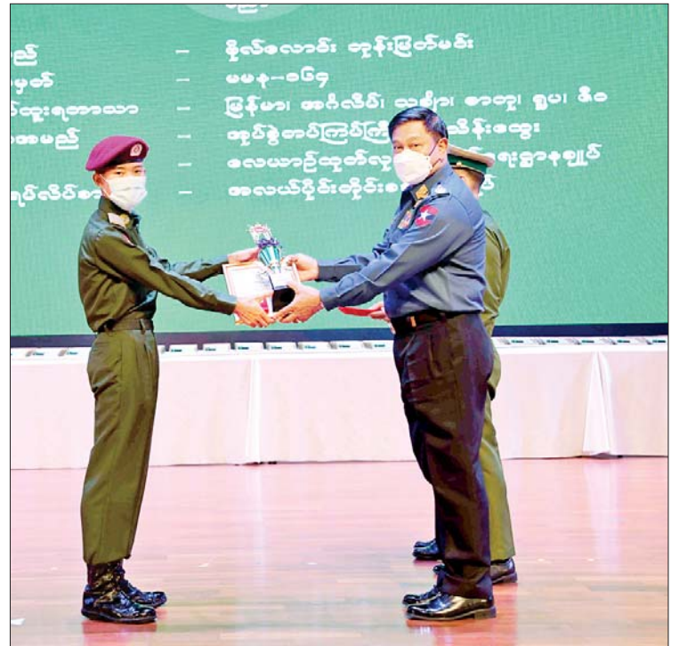
နိုင်ငံတော်စီမံအုပ်ချုပ်ရေးကောင်စီ အဖွဲ့ဝင် ဗိုလ်ချုပ်ကြီး တင်အောင်စန်းက ခြောက်ဘာသာဂုဏ်ထူးရှင် ဗိုလ်လောင်း ဘုန်းမြတ်မင်းအား ဂုဏ်ပြုတံဆိပ်၊ ဂုဏ်ပြုဆုနှင့် ဂုဏ်ပြုမှတ်တမ်းလွှာများ ပေးအပ်စဉ်။

☆ စာမျက်နှာ ၅ မှ နိုင်ငံတော်စီမံအုပ်ချုပ်ရေးကောင်စီ အတွင်းရေးမှူး ဒုတိယဗိုလ်ချုပ်ကြီး အောင်လင်းဒွေးက ငါးဘာသာဂုဏ်ထူးရှင် ၁၀ ဦးကိုလည်းကောင်း၊ နိုင်ငံတော်စီမံအုပ်ချုပ်ရေးကောင်စီအတွင်းရေးမှူး ဒုတိယဗိုလ်ချုပ်ကြီး အောင်လင်းဒွေး၏ ဇနီးက ငါးဘာသာဂုဏ်ထူးရှင် ၁၀ ဦးကိုလည်းကောင်း၊ နိုင်ငံတော်စီမံအုပ်ချုပ်ရေးကောင်စီတွဲဖက် အတွင်းရေးမှူး ဒုတိယဗိုလ်ချုပ်ကြီး ရဲဝင်းဦးက ငါးဘာသာဂုဏ်ထူးရှင် ၁၀ ဦးကိုလည်းကောင်း၊ နယ်စပ်ရေးရာဝန်ကြီးဌာန ပြည်ထောင်စုဝန်ကြီး ဒုတိယဗိုလ်ချုပ်ကြီး ထွန်းထွန်းနောင်က ငါးဘာသာဂုဏ်ထူးရှင် ၁၀ ဦးကိုလည်းကောင်း၊ စိုက်ပျိုးရေး၊ မွေးမြူရေးနှင့် ဆည်မြောင်းဝန်ကြီးဌာန ပြည်ထောင်စုဝန်ကြီး ဦးတင်ထွန်းဦးက ငါးဘာသာဂုဏ်ထူးရှင် ၁၀ ဦးကိုလည်းကောင်း၊ သမဝါယမနှင့် ကျေးလက်ဖွံ့ဖြိုးရေးဝန်ကြီးဌာန ပြည်ထောင်စုဝန်ကြီး ဦးလှမိုးက