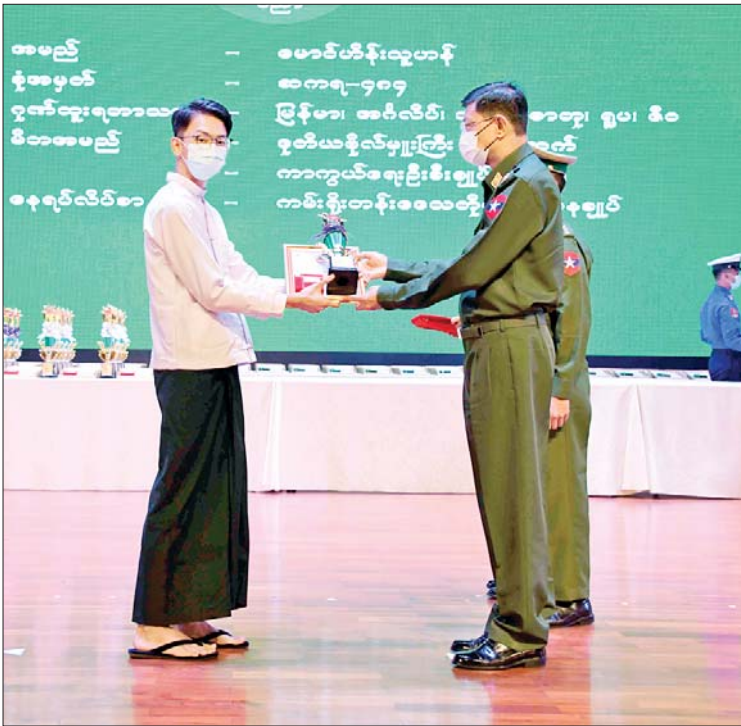
နိုင်ငံတော်စီမံအုပ်ချုပ်ရေးကောင်စီ အဖွဲ့ဝင် ကာကွယ်ရေးဝန်ကြီးဌာန ပြည်ထောင်စုဝန်ကြီး ဗိုလ်ချုပ်ကြီး မြထွန်းဦးက ခြောက်ဘာသာဂုဏ်ထူးရှင် မောင်ဟိန်းသူဟန်အား ဂုဏ်ပြုတံဆိပ်၊ ဂုဏ်ပြုဆုနှင့် ဂုဏ်ပြုမှတ်တမ်းလွှာများ ပေးအပ်စဉ်။