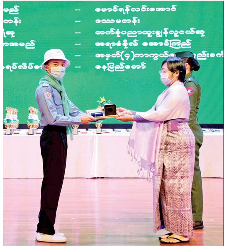
မည် တန်း ျဇု ကအမည် ရင်လိတ်စ