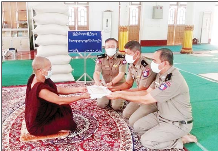
ရှမ်းပြည်နယ် တာချီလိတ်မြို့နယ်ရှိ တောင်တန်းသာသနာပြု(ဗဟို)ကျောင်းတိုက်သို့လည်းကောင်း၊ ဧရာဝတီတိုင်းဒေသကြီး ပုသိမ်မြို့နယ်ရှိ ဓာတုဝိဇ္ဇာပရိယတ္တိစာသင်တိုက်သို့ လည်းကောင်း တာဝန်ရှိသူများက သွားရောက်ဆက်ကပ်လှူဒါန်းခဲ့ကြကြောင်း သိရသည်။ သတင်းစဉ်

ထိုသို့ ဆောင်ရွက်လျက်ရှိရာ ယနေ့တွင် နေပြည်တော်ကောင်စီနယ်မြေပျဉ်းမနားမြို့နယ်ရှိ အောင်ချမ်းသာကျောင်းတိုက်သို့ လည်းကောင်း၊ တနင်္သာရီတိုင်းဒေသကြီး ကျွန်းစုမြို့နယ်ရှိ ကမ္ဘာရာမကျောင်းတိုက်သို့ လည်းကောင်း၊ မကွေးတိုင်းဒေသကြီး မကွေးမြို့နယ်ရှိ ကျောင်းထိုင်ဘုန်းကြီး သင်တန်းကျောင်းသို့လည်းကောင်း၊ ရန်ကုန်တိုင်းဒေသကြီး ဗဟန်းမြို့နယ်ရှိ မူလကမ္ဘာအေးကျောင်းတိုက်(မိုးကုတ်ရိပ်သာ)သို့လည်းကောင်း၊