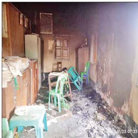
ရန် အားပေးလှုံ့ဆော်နေသည့် NUG၊ PDF အမည်ခံ အကြမ်းဖက်အဖွဲ့များအပေါ် ဝိုင်းဝန်းဆန့်ကျင်ကြရန်နှင့် အကြမ်းဖက်အဖွဲ့များ၏ လှုပ်ရှားမှုသတင်းများ ရရှိပါက လုံခြုံရေးတပ်ဖွဲ့ဝင်များနှင့် သက်ဆိုင်ရာ

တန်းကျောင်းခွဲကို အကြမ်းဖက်သမားများက ကျောင်းဝင်းအတွင်းဝင်ရောက်ကာ မီးရှို့ဖျက်ဆီးခဲ့ကြောင်း သတင်းအရ လုံခြုံရေးတပ်ဖွဲ့ဝင်များက သွားရောက်စစ်ဆေးခဲ့ရာ အကြမ်းဖက်သမားများ၏ မီးရှို့ဖျက်ဆီးမှုကြောင့် ကျောင်းအုပ်ဆရာမကြီး ရုံးခန်းအတွင်းရှိ သစ်သားစားပွဲတစ်လုံး၊ ပလတ်စတစ်ထိုင်ခုံလေးလုံး၊ သစ်သားကုလားထိုင်တစ်လုံး၊ စာရေးခုံရည်နှစ်လုံး၊ အလူမီနီယမ်ဗီရို တစ်လုံး၊ နံရံကပ်နာရီတစ်လုံး၊ သိပ္ပံလက်တွေ့ပစ္စည်းများ၊ စာရွက်စာတမ်းများ၊ မျက်နှာကြက်များ မီးလောင်ဆုံးရှုံးခဲ့ကြောင်း သိရသည်။ ဖြစ်စဉ်တွင် ပါဝင်ပတ်သက်သူများကို ဖော်ထုတ်ဖမ်းဆီး၍ ဥပဒေနှင့်အညီ ထိရောက်စွာ အရေးယူနိုင်ရေး လုံခြုံရေးတပ်ဖွဲ့ဝင်များက စုံစမ်းဖော်ထုတ်လျက်ရှိပြီး တိုင်းရင်းသားပြည်သူလူထု တစ်ရပ်လုံးအနေဖြင့်လည်း ယခုကဲ့သို့ ယုတ်မာရိုင်းစိုင်းသည့်လုပ်ရပ်ကို ကျူးလွန်ခဲ့သည့် ကျူးလွန်