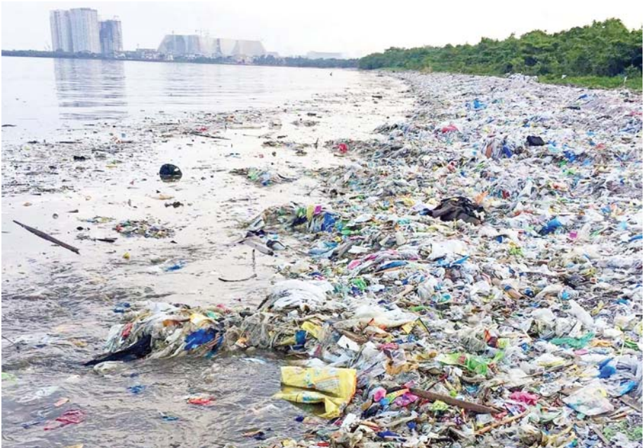
ခြင်း အကျိုးတရားများ ရရှိနိုင်သည့်အပြင် လေထု ကိုလည်း သန့်ရှင်းစင်ကြယ်စေနိုင်သည်။

မြေမျက်နှာပြင်နှင့် လေထုအတွင်း အပူရှိန် မြင့်မားလာခြင်းက ကမ္ဘာကြီးပူနွေးလာမှုကို ပြဆို နေသည်။ မြေမျက်နှာပြင်တွင် စုပ်ယူထားသည့် အပူလှိုင်းများနှင့်လေထုအတွင်းမှ များပြားသော ဓာတ်ငွေ့များက ကမ္ဘာကြီးကို ပိုမိုပူနွေးစေသည်။ စက်ရုံ၊ အလုပ်ရုံနှင့် စက်တပ်ယာဉ်များ တိုးပွား လာခြင်းက လေထုအတွင်း မှန်လုံအိမ်ဓာတ်ငွေ့များ ဖြစ်ပေါ်စေသည်။ လေထု၏အရည်အသွေးပိုင်း ကျဆင်းခြင်း၊ အပူစုပ်ယူထုတ်လွှတ်မှု အားကောင်း လာခြင်းကို တွေ့ရသည်။ ရာသီဥတုပြောင်းလဲမှု ဖြစ်စဉ်များသည် ကမ္ဘာကြီးပူနွေးမှု၏ အရိပ် လက္ခဏာဖြစ်ပါသည်။ အဆိုပါအရိပ်လက္ခဏာ မှတစ်ဆင့် ရရှိနိုင်သည့် နောက်ဆက်တွဲဆိုးကျိုး များသည် ပင်လယ်ရေမျက်နှာပြင် မြင့်တက်ခြင်း၊ မုန်တိုင်းဖြစ်ပေါ်ခြင်း၊ ရေကြီးခြင်း၊ မိုးခေါင်ခြင်း၊ ငလျင်လှုပ်ခတ်ခြင်းတို့ ဖြစ်ပါသည်။ ရာသီဥတု ပြောင်းလဲမှုဖြစ်စဉ်သည် လူနှင့် သက်ရှိသတ္တဝါများ အတွက် အကြီးမားဆုံးစိန်ခေါ်မှုဖြစ်ပြီး သဘာဝ ဘေးအန္တရာယ်အသွယ်သွယ်ကို ဖိတ်ခေါ်ခြင်းနှင့် လည်း တူသည်။