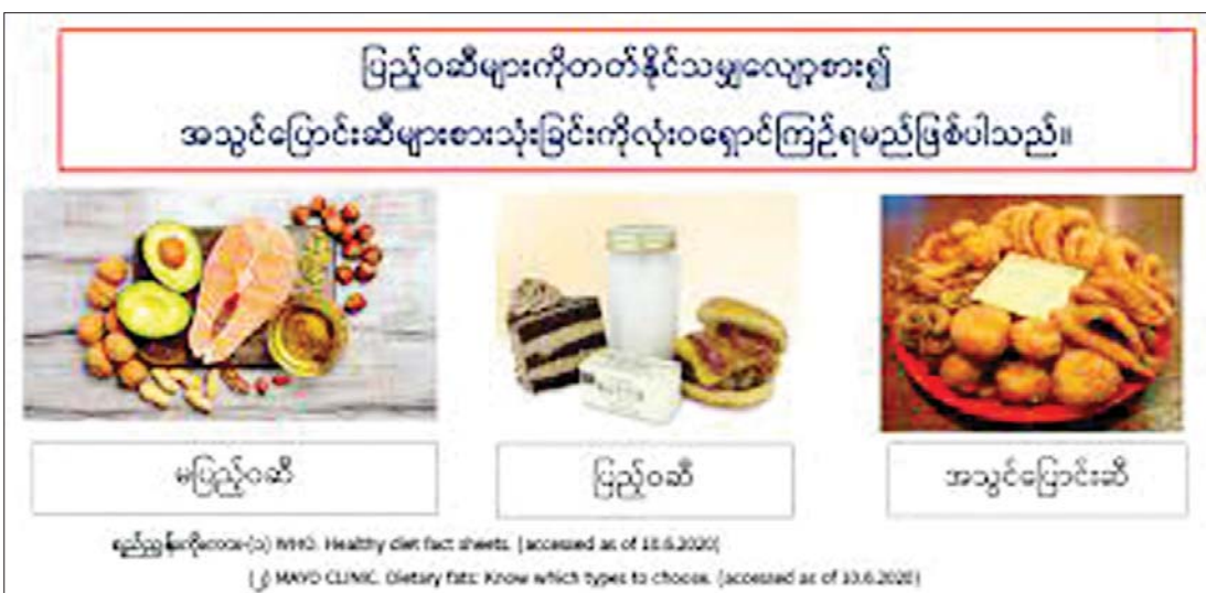
ရည်ညွှန်းချက်- (၁) WHO. Healthy diet fact sheets. (accessed as of 11.6.2022) (၂) MAYO CLINIC. Dietary fats: Know which types to choose. (accessed as of 11.6.2022)

ဈေးကွက်အတွင်း တံဆိပ်ကပ်ကြော်ငြာရောင်းချ ဆီစားသုံးမှု များပြားနေမှုကို အကြောင်းပြု၍ စားသုံးဆီတင်သွင်း