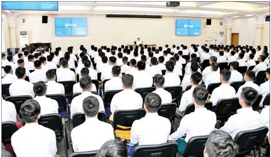
နိုင်ငံတော်စီမံအုပ်ချုပ်ရေးကောင်စီဥက္ကဋ္ဌ နိုင်ငံတော်ဝန်ကြီးချုပ် ဗိုလ်ချုပ်မှူးကြီးမင်းအောင်လှိုင် ရုရှားဖက်ဒရေးရှင်းနိုင်ငံရှိ မြန်မာ့တပ်မတော်မှ ပညာတော်သင် သင်တန်းသားအရာရှိများအား တွေ့ဆုံအမှာစကားပြောကြားစဉ်။

အလိုက် အပတ်တကုတ် ကြိုးစားလေ့ကျင့်သွားရန် လိုအပ်ကြောင်း၊ ပညာတော်သင်များအား တစ်ဦးတစ်ယောက်ချင်းစီအတွက် တပ်မတော်မှ အကုန်အကျများစွာကျခံ၍ ဆောင်ရွက်ပေးထားခြင်းဖြစ်