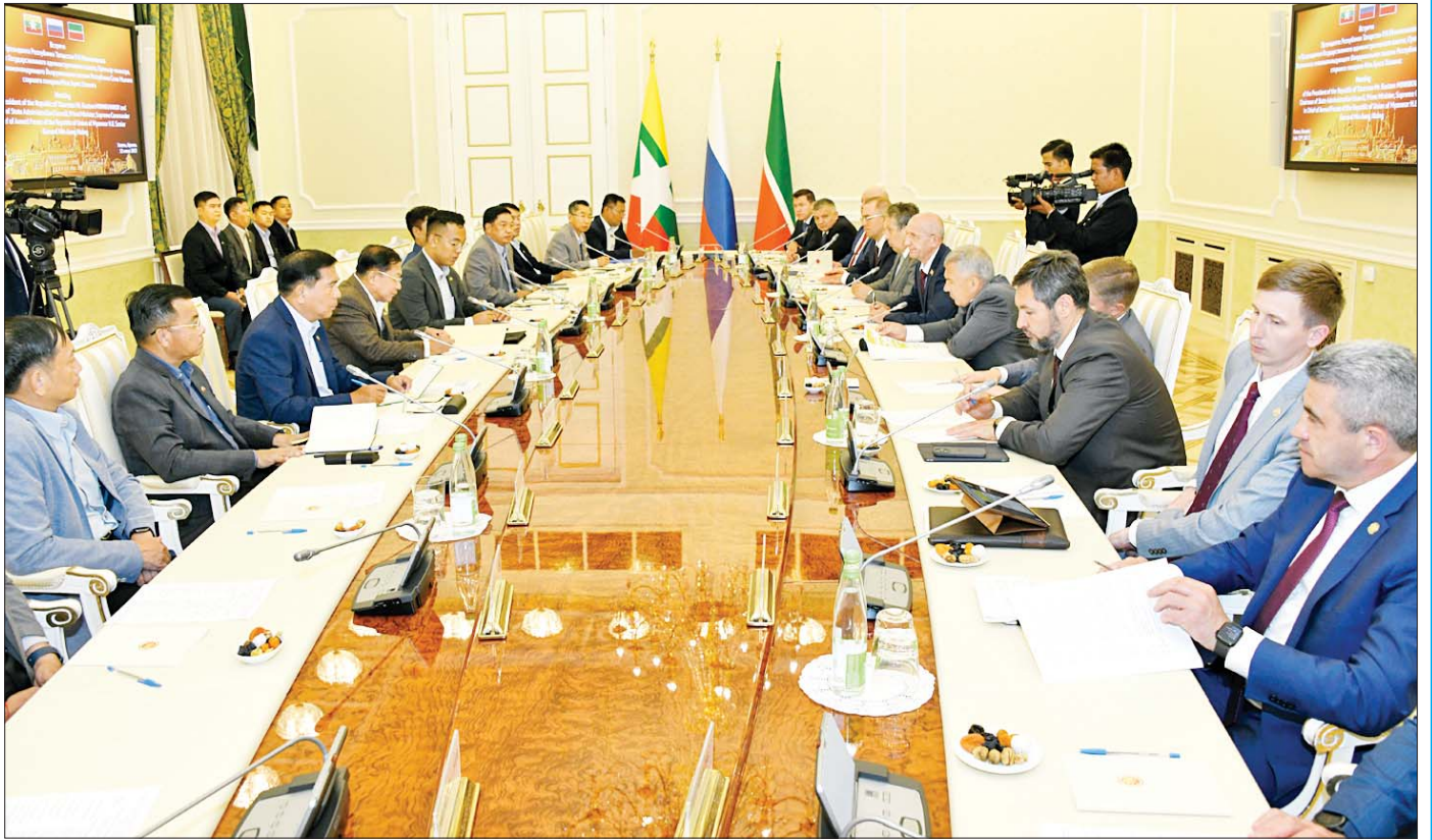
နိုင်ငံတော်စီမံအုပ်ချုပ်ရေးကောင်စီဥက္ကဋ္ဌ နိုင်ငံတော်ဝန်ကြီးချုပ် ဗိုလ်ချုပ်မှူးကြီးမင်းအောင်လှိုင် ဦးဆောင်သည့် ကိုယ်စားလှယ်အဖွဲ့နှင့် Republic of the Tatarstan အကြီးအကဲ Mr. Rustam Nurgaliyevich Minnikhanov ဦးဆောင်သည့် ကိုယ်စားလှယ်အဖွဲ့တို့ တွေ့ဆုံဆွေးနွေးကြစဉ်။

တာတာစတန်ပြည်နယ်သည် ရုရှားနိုင်ငံ၏ ကိုယ်ပိုင်အုပ်ချုပ်ခွင့်ရဒေသဖြစ်ပြီး ရုရှားဖက်ဒရေရှင်းနိုင်ငံ၏ယဉ်ကျေးမှုပဟိုဒေသအဖြစ် တည်ရှိသည်။ ယဉ်ကျေးမှုပဟိုဒေသဟု သတ်မှတ်ခံထားရသည်မှာလည်း ထူးတော့မထူးဆန်းလှ။ များပြားလှစွာသော ရှေးဟောင်းအဆောက်အအုံများ၊ လမ်းများ၊ ပန်းခြံများ စသည်ဖြင့် ယခုကာလအထိ အသက်ဝင်နေဆဲ။ တာတာစတန်ပြည်နယ်သို့ ကိုယ်စားလှယ်အဖွဲ့ ရောက်ရှိချိန်တွင်လည်း ရောက်ရှိသည့် ညပိုင်း၌ပင် တွေ့ဆုံဆွေးနွေးရေးကို စတင်လုပ်ဆောင်သည်။ တာတာစတန်ပြည်နယ်၏ အကြီးအကဲဖြစ်သူ Mr. Rustam Nurgaliyevich Minnikhanov နှင့် ၎င်း၏ ရုံးခန်းတွင် တွေ့ဆုံဆွေးနွေးသည်။ နိုင်ငံအတွက် အလုပ်သဘော ခရီးထွက်ခဲ့သည်မို့ ဆွေးနွေးချက်များမှာ နိုင်ငံတော်အတွက် အကျိုးပြုမည့် အကြောင်းအရာများသာ၊ မြန်မာနှင့် တာတာစတန်တို့ကြား စီးပွားရေးဆိုင်ရာ ကိစ္စရပ်များတွင် ပူးပေါင်းဆောင်ရွက်သွားမည့် အခြေအနေများ၊ ရိုရှင်းစွဲဆက်ဆံရေး အခြေအနေနှင့် ပူးပေါင်းဆောင်ရွက်မည့် စီးပွားရေးကဏ္ဍများ ပိုမိုတွင်ကျယ်လာစေရေးအတွက် ကူးသန်းရောင်းဝယ်မှုနှင့် ရင်းနှီးမြှုပ်နှံမှုဆိုင်ရာတို့တွင် တိုးမြှင့်ဆောင်ရွက်သွားမည့် အခြေအနေများကို အကျေအလည် ဆွေးနွေးကြသည်။ ရေနံနှင့် သဘာဝဓာတ်ငွေ့ထုတ်လုပ်မှု၊ တင်ပို့မှု စသည့် အကြောင်း