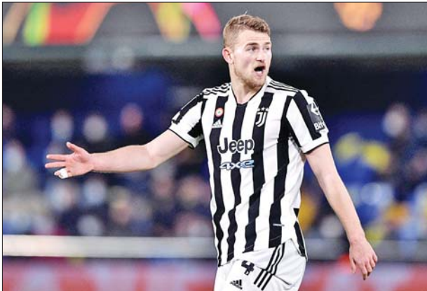
စာမျက်နှာ ၁၇ ကော်လံ ၁ သို့ *

ဂျပန်ဘွန်ဒင်လီဂါကလပ် ဘိုင်ယန်မြူးနစ်အသင်းဟာ အီတလီ စီးရီးအေကလပ် ဂျပန်တပ်အသင်းမှ နယ်သာလန်နောက်တန်းကစား သမားဒီလစ်ကို ပြောင်းရွှေ့ကြေးပေါင် ၆၅ ဒသမ ၆ သန်းနဲ့ ခေါ်ယူ လိုက်ပြီး ငါးနှစ်သက်တမ်းရှိ စာချုပ်တစ်ရပ်ချုပ်ဆိုခဲ့တယ်လို့ သိရပါ တယ်။