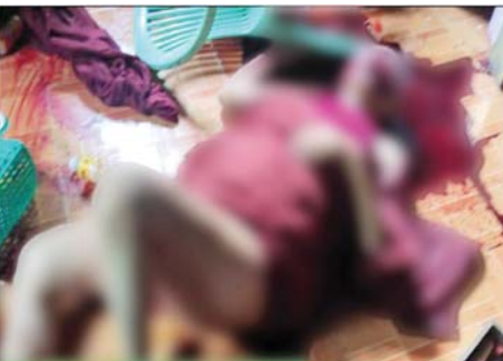
ဘဒ္ဒန္တ အိန္ဒိယ (ပျံလွန်တော်မူ)

နေပြည်တော် ဇူလိုင် ၂၀ နိုင်ငံရေးအစွန်းရောက် အကြမ်းဖက်သမားများ အနေဖြင့် နိုင်ငံတော်အတွင်း တည်ငြိမ်အေးချမ်းမှု ပျက်ပြားစေရန်နှင့် ပြည်သူလူထုအကြား စိုးရိမ်ထိတ်လန့်မှုဖြစ်ပေါ်လာစေရန်ရည်ရွယ်၍ ဗုဒ္ဓဘာသာဝင် မြန်မာလူမျိုးများ၏ အထွတ်အမြတ်ထားရာ သာသနာပိုင်အဆောက်အအုံများ၊ ဘုန်းတော်ကြီးကျောင်းများကိုပါ အကြမ်းဖက်ပစ်ခတ်တိုက်ခိုက်ခြင်း၊ မိုင်းထောင်ဖောက်ခွဲခြင်းနှင့် ရဟန်းသံဃာတော်များအား ဖမ်းဆီးခေါ်ဆောင်သတ်ဖြတ်ခြင်းများကို စိတ်နှလုံးညှိုးနွမ်းဖွယ် ရက်စက်စွာပြုလုပ်နေကြသည်ကို တွေ့ရပါသည်။ ထိုသို့ပြုလုပ်လျက်ရှိရာတွင် ရောဂါတိုင်းဒေသကြီး ဒေးဒရိုမြို့နယ် အင်ဒူးကျေးရွာ ဘုန်းကြီးကျောင်း