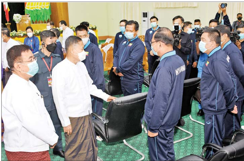
နိုင်ငံတော်စီမံအုပ်ချုပ်ရေးကောင်စီဒုတိယဥက္ကဋ္ဌ ဒုတိယဝန်ကြီးချုပ် ဒုတိယဗိုလ်ချုပ်မှူးကြီးစိုးဝင်း အကြိမ်(၂၀) မြောက် အာဆီယံတက္ကသိုလ်များအားကစားပြိုင်ပွဲသို့ ဝင်ရောက်ယှဉ်ပြိုင်ကြမည့် မြန်မာတက္ကသိုလ်အားကစားအဖွဲ့အား ရင်းရင်းနှီးနှီး လိုက်လံနှုတ်ဆက်စဉ်။

အားကစားပြိုင်ပွဲများသည် တရားမျှတမှုရှိသော စွမ်းရည်ပြယှဉ်ပြိုင်ပွဲများဖြစ်ကြောင်း၊ အလားတူ