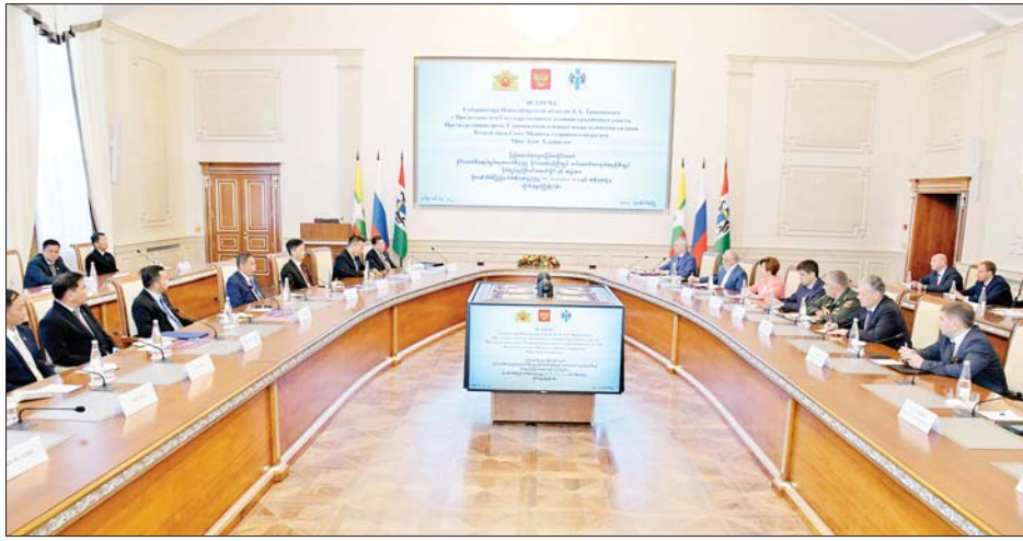
နိုင်ငံတော်စီမံအုပ်ချုပ်ရေးကောင်စီဥက္ကဋ္ဌ နိုင်ငံတော်ဝန်ကြီးချုပ် ဗိုလ်ချုပ်မှူးကြီးမင်းအောင်လှိုင် ဦးဆောင်သော ကိုယ်စားလှယ်အဖွဲ့နှင့် Novosibirsk အစိုးရအဖွဲ့အကြီးအကဲ Mr. Andrey Alexandrovich Travnikov ဦးဆောင်သော ကိုယ်စားလှယ်အဖွဲ့တို့ တွေ့ဆုံဆွေးနွေးကြစဉ်။

ဝမ်းသာအလဲလဲကြိုဆိုနှုတ်ဆက်ကြ နိုင်ငံတော်စီမံအုပ်ချုပ်ရေးကောင်စီ ဥက္ကဋ္ဌ နိုင်ငံတော်ဝန်ကြီးချုပ် ဦးဆောင်သည့် ကိုယ်စား လှယ်အဖွဲ့သည် ၁၈၉၉ ခုနှစ်တွင် စတင်ဖွင့်လှစ်ခဲ့ သည့် Polytechnic State University သို့ ရောက်ရှိ စဉ်တွင်လည်း တက္ကသိုလ်ပါမောက္ခချုပ် Mr.Andrey Ivanovich Rudskoy နှင့် တာဝန်ရှိသူများက ဝမ်းသာအလဲလဲ ကြိုဆိုနှုတ်ဆက်ကြသည်။ ထို့နောက် ပါမောက္ခချုပ်က တက္ကသိုလ်၏ လုပ်ဆောင်မှုအခြေ အနေများကို ဦးစွာရှင်းလင်းတင်ပြပြီး မြန်မာနိုင်ငံမှ ပညာတော်သင်များ ထပ်မံစေလွှတ်သင်ကြားမည့် အခြေအနေများ၊ ပညာရေးဆိုင်ရာ ပူးပေါင်း ဆောင်ရွက်သွားမည့် အခြေအနေများကို ဆွေးနွေးခဲ့ သည်။ အနာဂတ်မျိုးဆက်သစ်လူငယ်လူရွယ်များ၏ ရုရှားမြေတွင် လာရောက်၍ ပညာသင်ကြားနေမှု၊ နိုင်ငံတော်တည်ဆောက်ရေးတွင် တစ်တပ်တစ်အား ပါဝင်ဆောင်ရွက်နေမှုများသည် လက်ရှိကာလတွင် တွေ့မြင်နေရသကဲ့သို့ အနာဂတ်ကာလတွင်လည်း စဉ်ဆက်မပြတ်သည့် ဆင့်ကဲမြှင့်တင်မှုနှင့်အတူ ရှိနေ