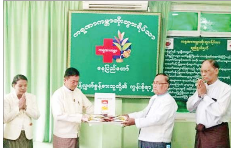
ဖော်စပ်ထုတ်လုပ်ထားသော အာဟာရ ဖြည့်စွက်စာအထုပ် ၅၀၀ (တန်ဖိုးငွေ ကျပ် ကိုးသန်းခန့်)နှင့် ခြံထွက်ဟင်းသီးဟင်းရွက်များကို ပေးအပ်လှူဒါန်းရာ သတင်းစဉ်

နေပြည်တော် ဇူလိုင် ၂၀ မြန်မာနိုင်ငံ စစ်မှုထမ်းဟောင်းအဖွဲ့ ဗဟိုဌာနချုပ်က ကရုဏာကမ္ဘာ့ဘိုးဘွားရိပ်သာသို့ အာဟာရဖြည့်စွက်စာနှင့် ဟင်းသီးဟင်းရွက်များ လှူဒါန်းခဲ့ကြောင်း သိရသည်။