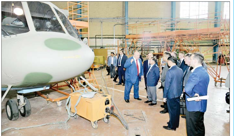
နိုင်ငံတော်စီမံအုပ်ချုပ်ရေးကောင်စီဥက္ကဋ္ဌ နိုင်ငံတော်ဝန်ကြီးချုပ် ဗိုလ်ချုပ်မှူးကြီးမင်းအောင်လှိုင် နှင့် အဖွဲ့ဝင်များ PJSC "Kazan Helicopters" ထုတ်လုပ်ရေးအလုပ်ရုံတွင် ကြည့်ရှုလေ့လာစဉ်။

တာတာစတန်ပြည်နယ်အတွင်း ရောက်ရှိနေသည့် ကိုယ်စားလှယ်အဖွဲ့သည် ရောက်နေသည့် ကာလအတွင်း မြန်မာအတွက် အကျိုးရှိမည့် အချက်အလက်၊ အကြောင်းအရာများကို အပြည့်အဝ ယူဆောင်သွားလိုသည့် သဘောရှိသည်။ ရသရွေ့