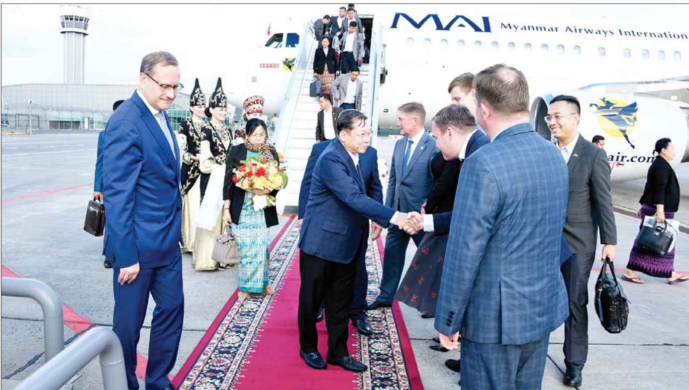
နိုင်ငံတော်စီမံအုပ်ချုပ်ရေးကောင်စီဥက္ကဋ္ဌ နိုင်ငံတော်ဝန်ကြီးချုပ် ဗိုလ်ချုပ်မှူးကြီး မင်းအောင်လှိုင် ဦးဆောင်သည့်ကိုယ်စားလှယ်အဖွဲ့အား Republic of the Tatarstan ကာဇန်မြို့ ကာဇန်လေဆိပ်၌ တာဝန်ရှိသူတို့က ရိုးရာဓလေ့ ထုံးတမ်းစဉ်လာများနှင့်အညီ ခင်မင်ရင်းနှီးစွာ ကြိုဆိုနှုတ်ဆက်ကြစဉ်။

နိုင်ငံတော်စီမံအုပ်ချုပ်ရေးကောင်စီဥက္ကဋ္ဌ နိုင်ငံတော်ဝန်ကြီးချုပ် ဗိုလ်ချုပ်မှူးကြီး မင်းအောင်လှိုင် နှင့် ဇနီး ဒေါ်ကြူကြူလှတို့ ဦးဆောင်သည့် ကိုယ်စားလှယ်အဖွဲ့၏ ရုရှားနိုင်ငံသို့ သွားရောက်သည့်ခရီးစဉ်မှာ ဇူလိုင် ၁၀ ရက်မှ ဇူလိုင် ၁၆ ရက်နေ့ထိ ဖြစ်ပြီး ရက်ကာလအားဖြင့် များပြားသည်တော့မဟုတ်။ အလုပ်သဘောခရီးစဉ်ဖြစ်သည့်အတွက် ရသည့် အချိန်ကာလတိုအတွင်း တွေ့ဆုံရမည့်သူများနှင့် တွေ့ဆုံ၊ ဆွေးနွေးသင့်သူများနှင့် ဆွေးနွေး၊ လေ့လာရမည့်နေရာများအား လေ့လာရသည်။ ၎င်းအပြင် အနာဂတ်မြန်မာနိုင်ငံတော်ကြီးအား တည်ဆောက်ရာတွင် နယ်ပယ်ပေါင်းစုံမှ တိုးတက်ဖွံ့ဖြိုးစေရေးအတွက် အထောက်အပံ့ဖြစ်စေရန် ရည်ရွယ်စေလွှတ်ထားသည့် ပညာတော်သင်ကျောင်းသားများကိုလည်း လိုအပ်သည့်လမ်းညွှန်ဩဝါဒကိုပေးရသည်။ ရုရှားနိုင်ငံရှိ နိုင်ငံတကာအဆင့်မီ တက္ကသိုလ်အသီးသီး၌ ပညာတော်သင်များအဖြစ် တက်ရောက်လျက်ရှိသည့် နိုင်ငံတကာမှ ကျောင်းသား ကျောင်းသားများကြား၌ အမိမြန်မာပြည်မှလည်း အများအပြားပါဝင်သည်။ အလှမ်းဝေးကွာလွန်းသည့် နိုင်ငံရပ်ခြားသို့ ပညာတော်သင်အဖြစ် လာရောက်ကြသူများဖြစ်၍ သူတို့လည်း အမိမြေကို လွမ်းကြသည်။ တမ်းတတတ်ကြသည်။ မိဘတွေ့မျိုးနှင့် အသိုင်းအဝိုင်းများကို ခေတ္တခွဲခွာ၍ ပညာသင်အဖြစ် လာခြင်းဖြစ်သည့်အတွက် မြန်မာနိုင်ငံမှ သတင်းစကားကို ကြားလိုသည်။ မြန်မာပြည်၏ ဒေသထွက်အစား