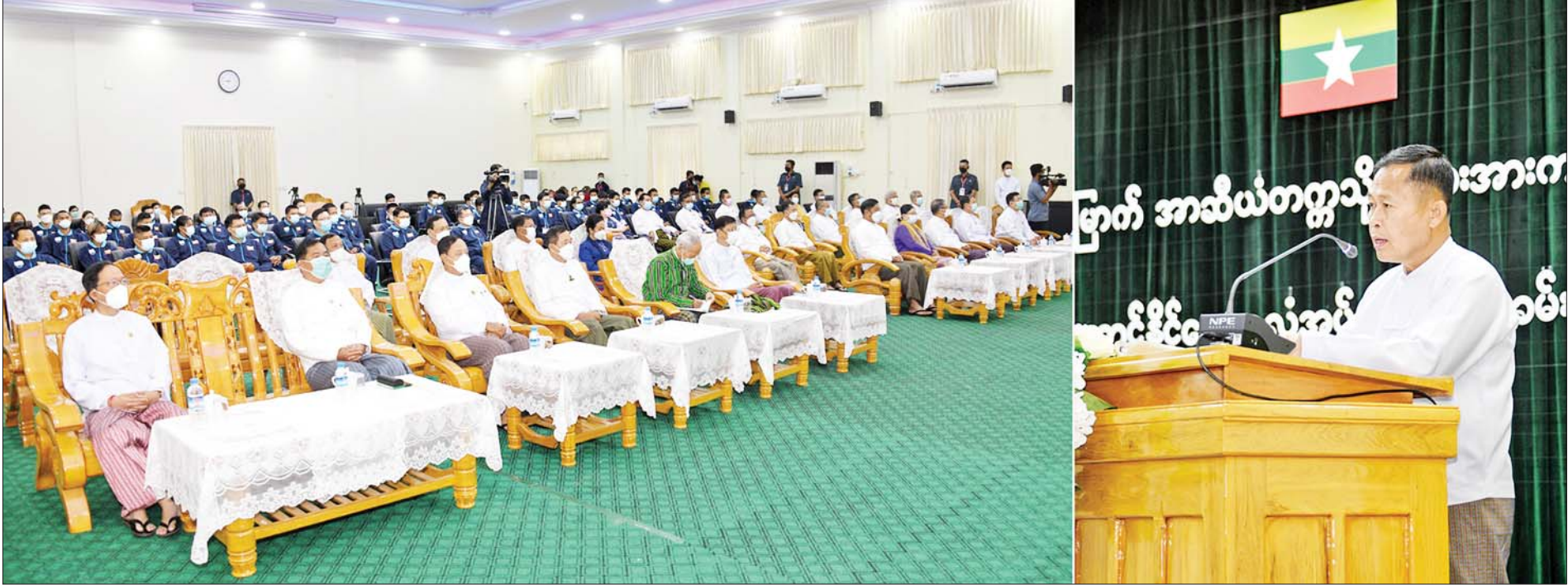
နိုင်ငံတော်စီမံအုပ်ချုပ်ရေးကောင်စီဒုတိယဥက္ကဋ္ဌ ဒုတိယဝန်ကြီးချုပ် ဒုတိယဗိုလ်ချုပ်မှူးကြီးစိုးဝင်း အကြိမ်(၂၀)မြောက် အာဆီယံတက္ကသိုလ်များ အားကစားပြိုင်ပွဲသို့ သွားရောက်ယှဉ်ပြိုင်ကြမည့် မြန်မာနိုင်ငံ ကိုယ်စားပြု တက္ကသိုလ်အားကစားအဖွဲ့အား အောင်နိုင်ရေးအလံအပ်နှင်းခြင်း အခမ်းအနားတွင် အမှာစကားပြောကြားစဉ်။