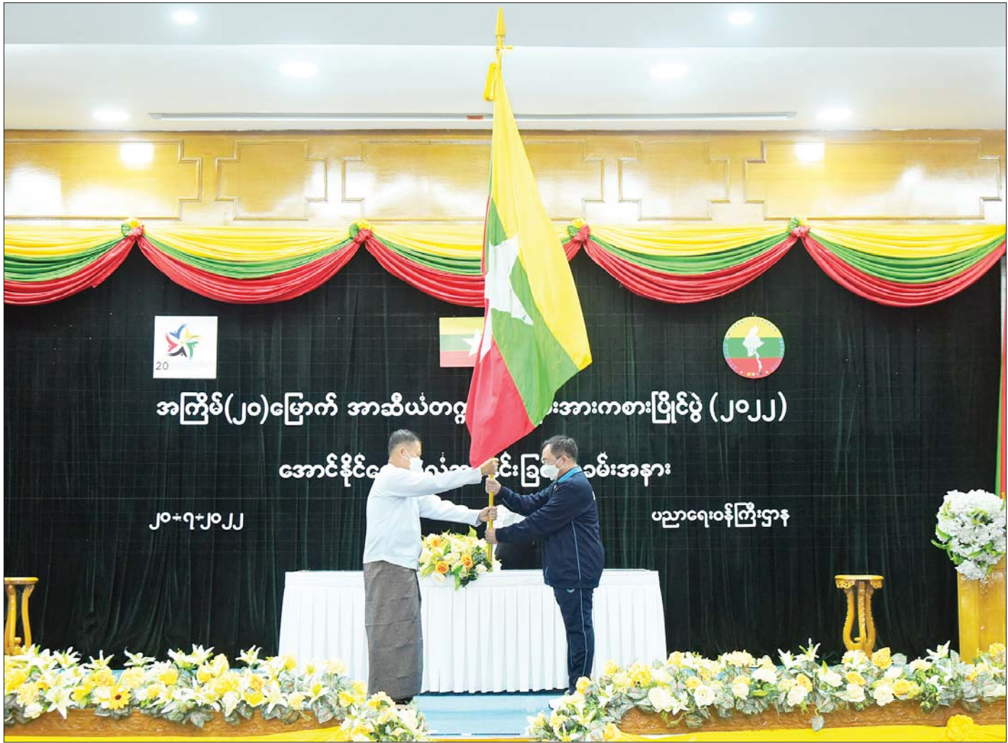
နိုင်ငံတော်စီမံအုပ်ချုပ်ရေးကောင်စီဒုတိယဥက္ကဋ္ဌ ဒုတိယဝန်ကြီးချုပ် ဒုတိယဗိုလ်ချုပ်မှူးကြီးစိုးဝင်း မြန်မာတက္ကသိုလ်အားကစားအဖွဲ့ခေါင်းဆောင် ရန်ကုန်တက္ကသိုလ်ပါမောက္ခချုပ် ဒေါက်တာတင်မောင်ထွန်းထံ ပြည်ထောင်စုသမ္မတမြန်မာနိုင်ငံတော်အလံကို အပ်နှင်းစဉ်။

မြန်မာနိုင်ငံအနေဖြင့် နှစ်နှစ်လျှင် တစ်ကြိမ် ကျင်းပသည့် အာဆီယံတက္ကသိုလ်များ အားကစားပြိုင်ပွဲများကို ၂၀၁၀ ပြည့်နှစ်က ထိုင်းနိုင်ငံ၌ ကျင်းပခဲ့သော (၁၅)ကြိမ်မြောက် အာဆီယံတက္ကသိုလ်များ