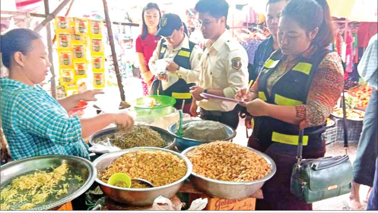
ရန်ကုန်မြို့အတွင်းရှိ ဈေးများတွင် အစားအသောက်နှင့် ဆေးဝါးကွပ်ကဲရေးဦးစီးဌာနက ရှောင်တခင်စစ်ဆေးမှုပြုလုပ်စဉ်။

မြန်မာနိုင်ငံ ကျန်းမာရေးဝန်ကြီးဌာနလက်အောက်ရှိ အစား အသောက်နှင့် ဆေးဝါးကွပ်ကဲရေးဦးစီးဌာန (FDA) သည် အတတ် နိုင်ဆုံးကြိုးစား၍ စားသုံးသူများဘေးအန္တရာယ်ကင်းရှင်းစေရန် စိစစ် ပေးနေသည်ကိုလည်း တွေ့ရပါ၏။ ၂၀၂၂ ခုနှစ်ထဲတွင် ထုတ်ပြန်ချက် အရ ဘေးအန္တရာယ်ဖြစ်စေသော အသားချောင်းများကို ပိတ်ပင် တားဆီးမှုများပြုလုပ်မည့်သတင်းကိုလည်း ဖတ်ခဲ့ရ၏။ FDA စတင် ထုထောင်စဉ်မှအစပြုကာ ယနေ့အထိ ထုတ်ဖော်ခဲ့သော “အစာမှ လာသောအန္တရာယ်”များမှာ အတော်ပင်များပြားလှ၏။ ကျန်းမာရေး ထိခိုက်စေမည့်ပစ္စည်းများ အစာထဲတွင်ပါဝင်မှု၊ ချည်ဆေး၊ ဆိုးဆေး များထည့်၍အရောင်တင်မှု၊ ရောဂါပိုးများ၊ အဆိပ်အတောက်ဖြစ်စေ သော မှိုများကလည်း ဓာတ်သတ္တုများပါဝင်နေမှုတို့ကို ဖော်ထုတ်