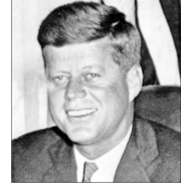
ဂျွန်အက်ဖ်ကနေဒီ

သံသယတရားခံ လီးဟာပေး အော့စံဝဲလ်ကို အချုပ်ကနေ ဒါးလက်စံ ကောင်တီခရိုင်ထောင်လွှဲပြောင်းစဉ်မှာပဲ ဂျက်ရှာဘီက ခြောက်လုံးပြူးသေနတ်နဲ့ အနီးကပ် ပစ်ခတ်သတ်ဖြတ်လိုက်တဲ့ အတွက် လုပ်ကြံမှုဖြစ်စဉ်ဟာ ပိုပြီး