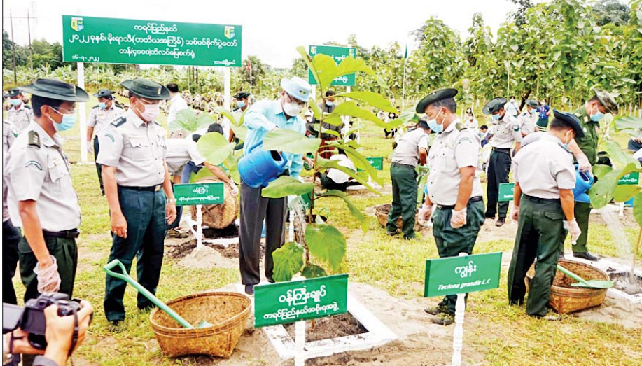
ဌာနဆိုင်ရာ တာဝန်ရှိသူများ၊ စက်ရုံမှူးကြီးနှင့် ပါးပါး စိုက်ပျိုးပေးခဲ့ကြကာ ပြည်နယ်ဝန်ကြီးချုပ်နှင့် ဝန်ထမ်းများ၊ လှာကာကျေးရွာအုပ်စုမှ ကျေးရွာသူ တာဝန်ရှိသူများက လှည့်လည်ကြည့်ရှုအားပေးခဲ့ကြ ကြောင်း သိရသည်။ (မြို့နယ်(ပြန်/ဆက်)