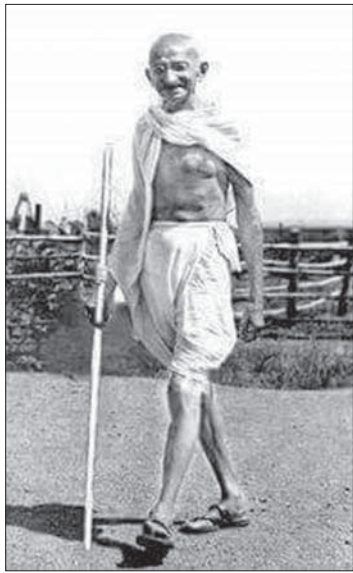
မဟတ္တမဂန္ဒီ

လျှို့ဝှက်ကြံစည်မှု ဖြစ်ကြောင်း ဖော်ထုတ်လာနိုင်ခဲ့ပါတယ်။ အစွန်းရောက် စစ်သွေးကြွ ဟိန္ဒူအုပ်စုဝင်တွေက ဂန္ဒီကြီး ဟာ သူတို့ရဲ့ဘာသာအယူဝါဒနဲ့ ယုံကြည်မှု တွေကို ဆန့်ကျင်နေပြီလို့ စွပ်စွဲခဲ့ကြရုံ မက သူတို့ရဲ့အကြမ်းဖက်ဝါဒဟာလည်း ဂန္ဒီကြီးရဲ့နေသမျှကာလပတ်လုံး ကျင့်သုံး လို့ရနိုင်မှာမဟုတ်ဘူးလို့ ယုံကြည်လာတဲ့ အတွက် သူတို့ရင်ဆိုင်နေရတဲ့ ပြဿနာ ရဲ့အဖြေဟာ ဂန္ဒီကြီးကိုသတ်သင်ရှင်းလင်း ပစ်မှတ်မယ်လို့ တွေးခေါ်လာကြပြီး လုပ်ကြံခဲ့ခြင်းဖြစ်ပါတယ်။