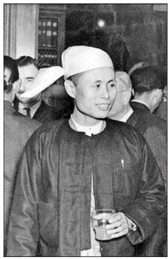
ဗိုလ်ချုပ်အောင်ဆန်း

ထိုပုဂ္ဂိုလ်ကတော့ ဗြိတိသျှကောင်စီ ကိုယ်စားလှယ်ဖြစ်သူ မစ္စတာဘင်ဂလေ ဆိုသူဖြစ်ပြီး သူဟာ ဂဠုန်ဦးစောတို့ အဖမ်းခံရပြီးနောက် ၄၈ နာရီအချိန် အတွင်း မြန်မာနိုင်ငံမှ ဗြိတိန်နိုင်ငံသို့