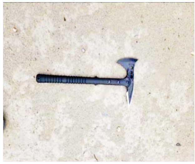
လူယက်မှုကျူးလွန်ခဲ့သူများ အသုံးပြုခဲ့သည့် ဖိုက်ဘာအရိုးနှစ်ပေခန့် တပ်ဆင်ထားသော ပုဆိန်ကို တွေ့ရစဉ်။

☆ ပြည်ကြီးတံခွန်မှ KBZ ဘဏ်ခွဲအမှတ်(၄၂) စက်မှုပန်းခြံဘဏ်ခွဲသို့ အမျိုးသား နှစ်ဦး ဆိုင်ကယ် နှစ်စီးဖြင့် ရောက်ရှိလာပြီး ဘဏ်အတွင်းဝင်ရောက်ကာ သေနတ်ပြခြိမ်းခြောက်၍ ဘဏ်ကောင်တာအတွင်း ထားရှိသည့် ငွေကျပ်သိန်း ၁၃၅၀ ခန့်အား လူယက်ယူဆောင်ကာ ဘဏ်၌ အသုံးပြုသည့် ကွန်ပျူတာမော်နီတာတစ်လုံးအား ဖိုက်ဘာအရိုး နှစ်ပေခန့် တပ်ဆင်ထားသည့် ပုဆိန်ဖြင့် ရိုက်ခွဲဖျက်ဆီးကာ လုံးပတ် လေးလက်မ၊ အရှည် တစ်ပေခန့်ရှိ PVC ပိုက်ဖြင့်ပြုလုပ်ထားသည့် လက်လုပ်မိုင်း တစ်လုံးအား မှန်ကောင်တာပေါ်တင်၍ ၎င်းတို့ စီးနင်းလာသည့် ဆိုင်ကယ် နှစ်စီးဖြင့် ပြန်လည်ထွက်ခွာသွားခဲ့ကြောင်း သိရှိရပါသည်။ ဖြစ်စဉ်မှ လူယက်မှုကျူးလွန်ခဲ့သည့် အမျိုးသား နှစ်ဦးအား ဖော်ထုတ်ဖမ်းဆီးရမိနိုင်ရေးအတွက် လုံခြုံရေးတပ်ဖွဲ့ဝင်များက လိုအပ်သော ပိတ်ဆို့ရှာဖွေစစ်ဆေးခြင်းများ ဆက်လက်ဆောင်ရွက်လျက်ရှိကြောင်း သိရပါသည်။