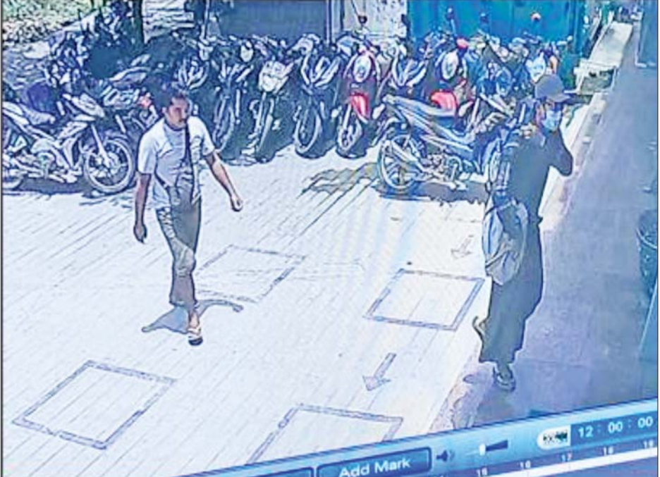
CCTV မှတ်တမ်းပါ အမျိုးသားနှစ်ဦး (စိစစ်ဆဲ)။

နေပြည်တော် ဇူလိုင် ၁၆ မန္တလေး တိုင်းဒေသကြီး ပြည်ကြီးတံခွန်မြို့နယ်ရှိ KBZ ဘဏ်ခွဲအမှတ်(၄၂) စက်မှုပန်းခြံ ဘဏ်ခွဲမှ ငွေကျပ်သိန်း ၁၃၅၀ ခန့် အား အမျိုးသားနှစ်ဦးက ဇူလိုင် ၁၅ ရက် မွန်းလွဲပိုင်းက သေနတ် ပြခြိမ်းခြောက်ကာ လုယက် ယူဆောင်သွားကြောင်း သိရ သည်။