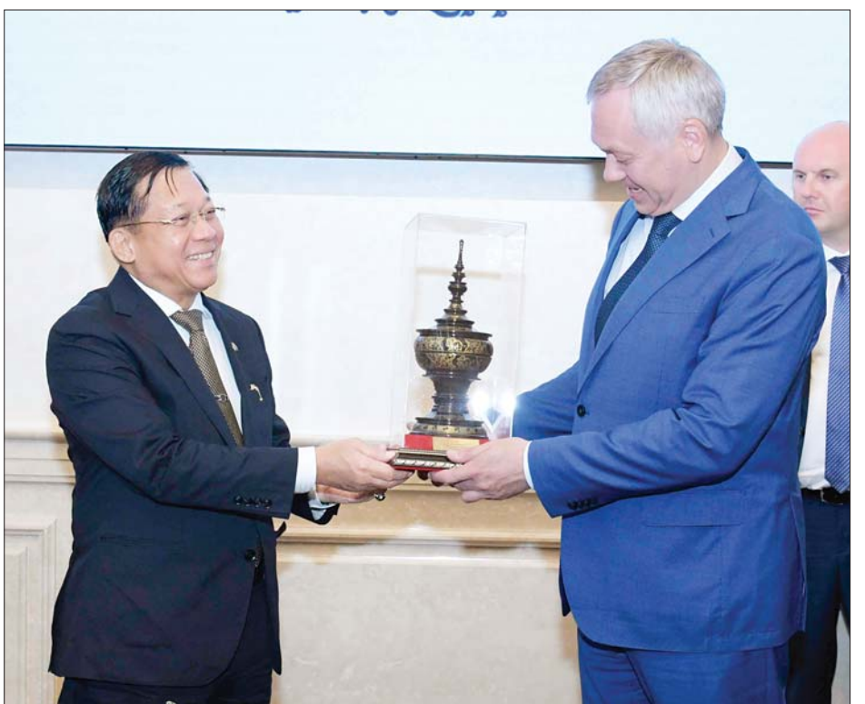
နိုင်ငံတော်စီမံအုပ်ချုပ်ရေးကောင်စီဥက္ကဋ္ဌ နိုင်ငံတော်ဝန်ကြီးချုပ် ဗိုလ်ချုပ်မှူးကြီးမင်းအောင်လှိုင်နှင့် Novosibirsk အစိုးရအဖွဲ့အကြီးအကဲ Mr. Andrey Alexandrovich Travnikov တို့ အမှတ်တရ လက်ဆောင်ပစ္စည်းများ အပြန်အလှန်ပေးအပ်ကြစဉ်။

အတွက် ပညာရေးနယ်ပယ်တွင် မြန်မာနိုင်ငံနှင့် ပူးပေါင်းဆောင်ရွက်နိုင်မည့် အခြေအနေ၊ ရုရှားဖက်ဒရေးရှင်းနိုင်ငံတွင် ကျင်းပမည့် သိပ္ပံနှင့် နည်းပညာဆိုင်ရာ ဖိုရမ်သို့ မြန်မာကိုယ်စားလှယ်အဖွဲ့ စေလွှတ်ပေးနိုင်ရေးနှင့် သိပ္ပံနှင့် နည်းပညာကဏ္ဍအတွက် လေ့လာနိုင်ရေး စီစဉ်ဆောင်ရွက်ပေးမည့် အခြေအနေ၊ ယဉ်ကျေးမှုနယ်ပယ်တွင်လည်း အပြန်အလှန် ဖလှယ်ဆောင်ရွက်နိုင်မည့် အခြေအနေ၊ နှစ်နိုင်ငံ ချစ်ကြည်ရင်းနှီးမှုနှင့် ပူးပေါင်းဆောင်ရွက်မှုများကို စစ်ဘက်၊ နယ်ဘက်ကဏ္ဍပေါင်းစုံ၌ တိုးမြှင့်ဆောင်ရွက်သွားမည့် အခြေအနေများနှင့် ပတ်သက်၍ ခင်မင်ရင်းနှီးစွာ အမြင်ချင်းဖလှယ်ဆွေးနွေးကြသည်။ အပြန်အလှန်ပေးအပ် တွေ့ဆုံပွဲအပြီးတွင် နိုင်ငံတော်စီမံအုပ်ချုပ်ရေးကောင်စီ ဥက္ကဋ္ဌ နိုင်ငံတော် ဝန်ကြီးချုပ်နှင့် Novosibirsk အစိုးရအဖွဲ့အကြီးအကဲတို့သည် အမှတ်တရ လက်ဆောင်ပစ္စည်းများ အပြန်အလှန်ပေးအပ်ကြသည်။