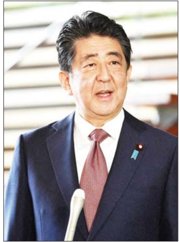
ရှင်ဇိုအာဘေး

နောက်ပိုင်းမှာ သက်ဆိုင်ရာက ဂန္ဒီကြီးကိုလုပ်ကြံမှုဟာ သူတစ်ဦးတည်း မဟုတ်ဘဲ ဟိန္ဒူအစွန်းရောက်အဖွဲ့ရဲ့ စာမျက်နှာ ၉ သို့ ❁