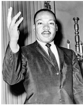
ဒေါက်တာမာတင်လူသာကင်း

ဂျပန်နိုင်ငံဝန်ကြီးချုပ်ဟောင်း ရှင်ဇိုအာဘေး တိုက်တိုက်ဆိုင်ဆိုင် ပြီးခဲ့တဲ့ ဝါဆို လဆန်း ၁၁ ရက်(ဇူလိုင် ၈ ရက်)နံနက်မှာ ဂျပန်နိုင်ငံဝန်ကြီးချုပ်ဟောင်း ရှင်ဇို အာဘေးဟာ နာရာမြို့မှာ ကျင်းပတဲ့ နိုင်ငံ ရေးအခမ်းအနားတစ်ခုမှာ တက်ရောက် မိန့်ခွန်းပြောကြားနေစဉ် မသမာသူ တစ်ဦးရဲ့ လက်လုပ်သေနတ်နဲ့ အနီးကပ် လုပ်ကြံပစ်ခတ်မှုကြောင့် ညနေပိုင်းမှာ