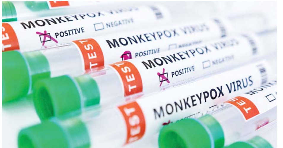
နိုင်ငံ၌ ၁၈၅၉ ဦးနှင့် ဗြိတိန်နိုင်ငံ၌ ၁၈၅၆ ဦးရှိကြောင်း သိရသည်။ အလားတူ တောင်ကိုရီးယား၊ တရုတ် (တိုင်ပေ)နှင့် စင်ကာပူနိုင်ငံတို့တွင်လည်း အဆိုပါ ရောဂါ ကူးစက်ခံရသူများတွေ့ရှိကြောင်း သိရသည်။ ကိုးကား- အင်န်အိတ်ချ်ကေ ဘာသာပြန်- အောင်ကျော်ကျော်

အနောက်နိုင်ငံများအနက် စပိန်နိုင်ငံ၌ မျောက်ကျောက်ရောဂါကူးစက်ခံရသူပေါင်း ၂၈၃၅ ဦး၊ ဂျာမနီ