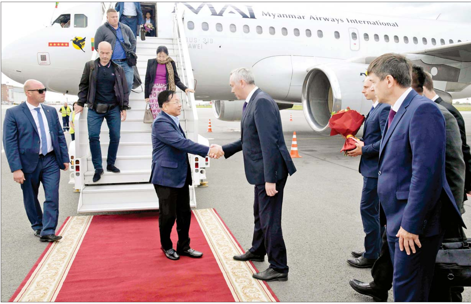
နိုင်ငံတော်စီမံအုပ်ချုပ်ရေးကောင်စီဥက္ကဋ္ဌ နိုင်ငံတော်ဝန်ကြီးချုပ် ဗိုလ်ချုပ်မှူးကြီးမင်းအောင်လှိုင် ဦးဆောင်သည့် ကိုယ်စားလှယ်အဖွဲ့အား Novosibirsk မြို့ Tolmachevo လေဆိပ်၌ တာဝန်ရှိသူများက ရိုးရာဓလေ့ထုံးတမ်းစဉ်လာများနှင့်အညီ ခင်မင်ရင်းနှီးလှိုက်လှဲစွာ ကြိုဆိုနှုတ်ဆက်ကြစဉ်။

နေပြည်တော် ဇူလိုင် ၁၆ ရုရှားဖက်ဒရေးရှင်း နိုင်ငံ၌ ရောက်ရှိနေသည့် နိုင်ငံတော် စီမံအုပ်ချုပ်ရေးကောင်စီ ဥက္ကဋ္ဌ နိုင်ငံတော်ဝန်ကြီးချုပ် ဗိုလ်ချုပ်မှူးကြီးမင်းအောင်လှိုင် ဦးဆောင်သည့် ကိုယ်စားလှယ်အဖွဲ့သည် ရုရှားဖက်ဒရေးရှင်းနိုင်ငံဆိုင်ရာ မြန်မာနိုင်ငံ သံအမတ်ကြီး ဦးလွင်ဦး၊ စစ်သံမှူး ဗိုလ်မှူးချုပ် မိုးကျော်နှင့် တာဝန်ရှိသူများ လိုက်ပါ၍ ယနေ့ဒေသစံတော်ချိန် နံနက်ပိုင်းတွင် စိန့်ပီတာစဘတ်မြို့ ပူကောဗာ အပြည်ပြည်ဆိုင်ရာ လေဆိပ်မှတစ်ဆင့် Novosibirsk မြို့သို့ လေကြောင်းခရီးဖြင့် ထွက်ခွာရာ စိန့်ပီတာစဘတ်မြို့ အစိုးရအဖွဲ့မှ တာဝန်ရှိသူများက လေဆိပ်တွင် ပို့ဆောင်နှုတ်ဆက်ကြသည်။ ထို့နောက်နိုင်ငံတော်စီမံအုပ်ချုပ်ရေးကောင်စီဥက္ကဋ္ဌ နိုင်ငံတော်ဝန်ကြီးချုပ်နှင့် အဖွဲ့ဝင်များသည် Novosibirsk မြို့ Tolmachevo လေဆိပ်သို့ ရောက်ရှိကြရာ တာဝန်ရှိသူများက ရိုးရာဓလေ့ထုံးတမ်းစဉ်လာများနှင့်အညီ ခင်မင်ရင်းနှီးလှိုက်လှဲစွာ ကြိုဆိုနှုတ်ဆက်ကြသည်။ စာမျက်နှာ ၃ ကော်လံ ၁ သို့ ။