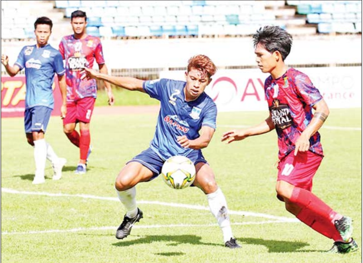
ဟံသာဝတီအသင်းနှင့် ရတနာပုံအသင်းတို့ ယှဉ်ပြိုင်ကစားကြစဉ်။

ရန်ကုန် ဇူလိုင် ၁၆ ၂၀၂၂ ရာသီ MNL အမှတ်ပေးပြိုင်ပွဲ ပွဲစဉ်(၄) ပထမနေ့ကို ဇူလိုင် ၁၆ ရက်က သုဝဏ္ဏကွင်း၌ ဆက်လက်ကျင်းပရာ ဟံသာဝတီနှင့် ရတနာပုံအသင်း တစ်ရိုးစီ သရေကျခဲ့သည်။ ရှုံးပွဲဆက်နေသည့် ဟံသာဝတီနှင့် ရတနာပုံအသင်းတို့ ထိပ်တိုက်တွေ့ဆုံ ခြင်းဖြစ်ပြီး ရှုံးပွဲဆက်နေမှုကို ရပ်တန့် နိုင်ခဲ့သော်လည်း နိုင်ပွဲရယူနိုင်ခြင်းမရှိဘဲ သရေရလဒ်ဖြင့်သာ ပြီးဆုံးခဲ့သည်။ ထူးခြားမှုအဖြစ် ယခုသရေပွဲမှာ ၂၀၂၂ ရာသီ MNL ပြိုင်ပွဲ၏ ပထမဆုံးသရေပွဲ ဖြစ်ခဲ့ပြီး ၁၆ ပွဲမြောက်မှ သရေပွဲထွက်ပေါ် ခဲ့ခြင်းဖြစ်သည်။ စာမျက်နှာ ၂၅ ကော်လံ ၃ သို့ *