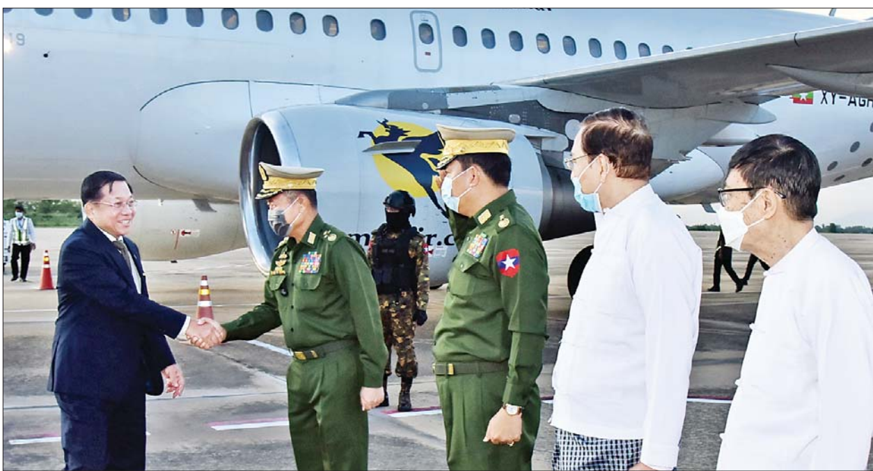
နိုင်ငံတော်စီမံအုပ်ချုပ်ရေးကောင်စီဥက္ကဋ္ဌ နိုင်ငံတော်ဝန်ကြီးချုပ် ဗိုလ်ချုပ်မှူးကြီးမင်းအောင်လှိုင်နှင့် ကိုယ်စားလှယ်အဖွဲ့ဝင်များအား နေပြည်တော်လေဆိပ်တွင် နိုင်ငံတော်စီမံအုပ်ချုပ်ရေးကောင်စီ ဒုတိယဥက္ကဋ္ဌ ဒုတိယတပ်မတော်ကာကွယ်ရေးဦးစီးချုပ် ကာကွယ်ရေးဦးစီးချုပ်(ကြည်း) ဒုတိယဗိုလ်ချုပ်မှူးကြီး စိုးဝင်းနှင့် တာဝန်ရှိသူများက ကြိုဆိုနှုတ်ဆက်ကြစဉ်။

စီမံအုပ်ချုပ်ရေးကောင်စီ ဥက္ကဋ္ဌ နိုင်ငံတော်ဝန်ကြီးချုပ် ဦးဆောင်သည့် ကိုယ်စားလှယ်အဖွဲ့သည် မြန်မာစံတော်ချိန် ညပိုင်းတွင် နေပြည်တော် တပ်မတော် လေဆိပ်သို့ ပြန်လည်ရောက်ရှိ ကြရာ ကောင်စီဒုတိယဥက္ကဋ္ဌ ဒုတိယတပ်မတော်ကာကွယ်ရေး ဦးစီးချုပ် ကာကွယ်ရေးဦးစီးချုပ် (ကြည်း) ဒုတိယဗိုလ်ချုပ်မှူးကြီး စိုးဝင်းနှင့် ဇနီး ဒေါ်သန်းသန်းနွယ်၊ ကောင်စီဝင်များနှင့် ဇနီးများ၊ ပြည်ထောင်စု ဝန်ကြီးများ၊ ကာကွယ်ရေးဦးစီးချုပ်ရုံး(ကြည်း) မှ တပ်မတော်အရာရှိကြီးများနှင့် ဇနီးများ၊ မြန်မာနိုင်ငံဆိုင်ရာ ရုရှားဖက်ဒရေးရှင်းနိုင်ငံ သံရုံးမှ သံရုံး ဒုတိယအကြီးအကဲ Mr. Pavel A.KLABUKOV နှင့် တာဝန်ရှိသူများက လေဆိပ်၌ ကြိုဆို နှုတ်ဆက်ခဲ့ကြကြောင်း သိရသည်။ သတင်းစဉ်