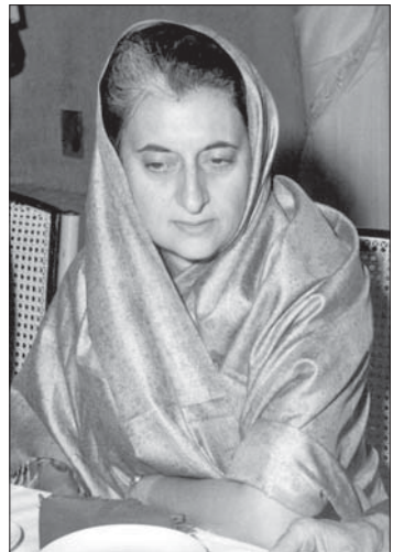
အင်ဒီရာဂန္ဒီ

လုပ်ကြံမှုကြီးတွေကို လေ့လာကြည့်ရင်း နိုင်ငံရေးအရ လုပ်ကြံသတ်ဖြတ်မှုတွေက အများစုဖြစ်ကြောင်း တွေ့မြင်ရပါလိမ့် မယ်။ မြန်မာပြည်မှာ လွန်ခဲ့တဲ့ ၇၅ နှစ်က လုပ်ကြံခံခဲ့ရတဲ့ အမျိုးသားခေါင်းဆောင် ကြီး ဗိုလ်ချုပ်အောင်ဆန်းနဲ့ အာဇာနည် ခေါင်းဆောင်ကြီးတွေရဲ့ ကျဆုံးမှု ဖြစ်စဉ်ဟာလည်း နိုင်ငံရေးအရ လုပ်ကြံသတ်ဖြတ်ခံရခြင်းပဲ ဖြစ်ပါ တယ်။