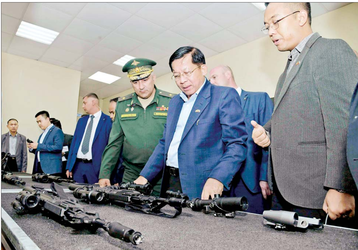
နိုင်ငံတော်စီမံအုပ်ချုပ်ရေးကောင်စီဥက္ကဋ္ဌ နိုင်ငံတော်ဝန်ကြီးချုပ် ဗိုလ်ချုပ်မှူးကြီးမင်းအောင်လှိုင် Higher Military Command School အတွင်းရှိ ရုရှားတပ်မတော်မှ ထုတ်လုပ်ထားသည့် လက်နက်များနှင့် လက်နက်ချိန်ဆိုင်များကို ကြည့်ရှုလေ့လာစဉ်။

လေ့လာကြည့်ရှု ယင်းနောက် နိုင်ငံတော်စီမံ အုပ်ချုပ်ရေးကောင်စီ ဥက္ကဋ္ဌ နိုင်ငံတော်ဝန်ကြီးချုပ်နှင့် အဖွဲ့ဝင် များသည် Higher Military Command School သို့ သွားရောက်လေ့လာကြည့်ရှုကြ ရာ ကျောင်းအုပ်ကြီး Major General Markochin Segeri Gregorovich နှင့် တာဝန်ရှိသူ