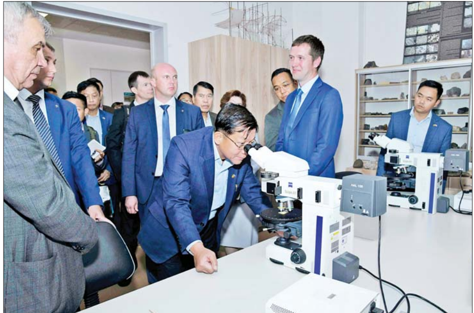
နိုင်ငံတော်စီမံအုပ်ချုပ်ရေးကောင်စီဥက္ကဋ္ဌ နိုင်ငံတော်ဝန်ကြီးချုပ် ဗိုလ်ချုပ်မှူးကြီးမင်းအောင်လှိုင် Novosibirsk State University အတွင်း ကြည့်ရှုလေ့လာစဉ်။