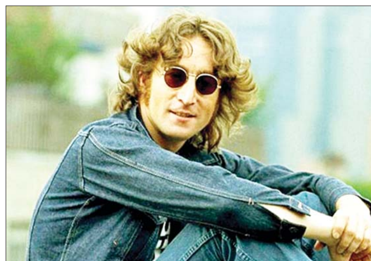
ရော့ခါအဆိုတော် ဂျွန်လင်နွန်

ပြည်ထောင်စု တက္ကဆက်ပြည်နယ် ဒါးလက်စ်မြို့မှာ သေနတ်နဲ့ ချောင်း မြောင်းလုပ်ကြံသတ်ဖြတ်ခြင်းခံခဲ့ရရှာတဲ့ အမေရိကန်ပြည်ထောင်စုရဲ့ ၃၅ ဦး မြောက်သမ္မတ ဂျွန်အက်ဖ်ကနေဒီ လုပ်ကြံမှုကြီးဟာလည်း “ဂျွန်အက်ဖ် ကနေဒီကို ဘယ်သူသတ်သလဲ၊