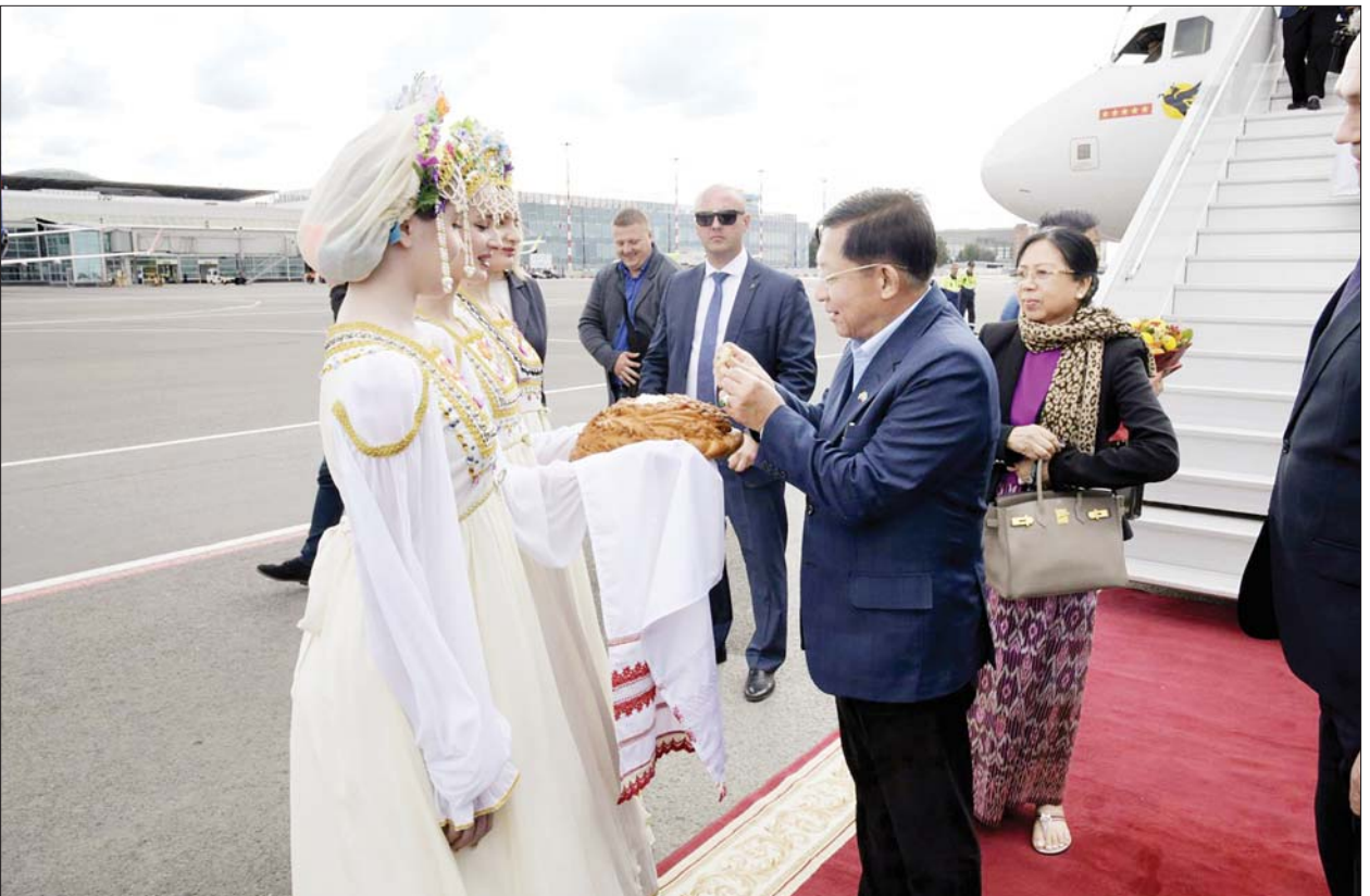
နိုင်ငံတော်စီမံအုပ်ချုပ်ရေးကောင်စီဥက္ကဋ္ဌ နိုင်ငံတော်ဝန်ကြီးချုပ် ဗိုလ်ချုပ်မှူးကြီးမင်းအောင်လှိုင် ဦးဆောင်သည့် ကိုယ်စားလှယ်အဖွဲ့အား Novosibirsk မြို့ Tolmachevo လေဆိပ်၌ တာဝန်ရှိသူများက ရိုးရာဓလေ့ထုံးတမ်းစဉ်လာများနှင့်အညီ ခင်မင်ရင်းနှီးလှိုက်လှဲစွာ ကြိုဆို နှုတ်ဆက်ကြစဉ်။

များအပေါ် နိုင်ငံတော်စီမံ အုပ်ချုပ်ရေးကောင်စီ ဥက္ကဋ္ဌ နိုင်ငံတော်ဝန်ကြီးချုပ်က သိရှိလို သည်များကို ပြန်လည်မေးမြန်း ဆွေးနွေးသည်။ ရှင်းလင်းပြောကြား ဆက်လက်၍ တက္ကသိုလ် အစည်းအဝေး ခန်းမတွင် Novosibirsk State University ၏ စာပေသင်ကြားပို့ချပေးနေမှု ဆိုင်ရာ Video File ကို ဖွင့်လှစ် ပြသပြီး ပါမောက္ခချုပ်က တက္ကသိုလ်ဆိုင်ရာ အချက် အလက်များ၊ နိုင်ငံခြားသင်တန်း သားများကို လက်ခံသင်ကြားပေး နေမှု၊ အဆင့်မြင့်တွဲလွန်ပညာ သင်တန်းများ၏ သင်ရိုးညွှန်းတမ်း အလိုက် သင်ကြားဆောင်ရွက်မှု အစီအစဉ်၊ ကျောင်းသား ကျောင်းသူ များ နေထိုင်ရေးအတွက် အဆောင် နှင့် အားကစားရုံများ ထည့်သွင်း တည်ဆောက်ထားရှိမှု မြန်မာနိုင်ငံ မှ ကျောင်းသူ ကျောင်းသားများ လာရောက် တက်ရောက်မည် စာမျက်နှာ ၄ သို့ »»