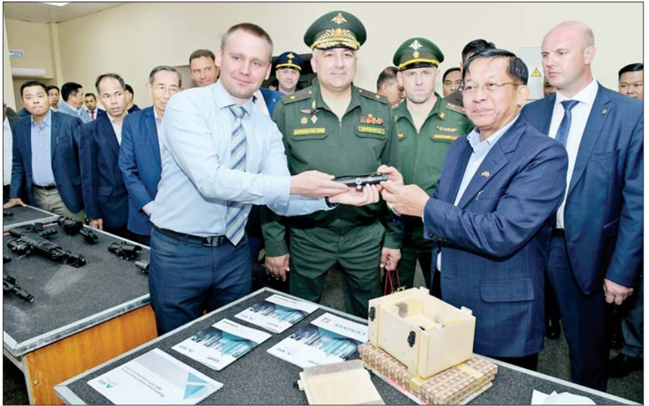
နိုင်ငံတော်စီမံအုပ်ချုပ်ရေးကောင်စီဥက္ကဋ္ဌ နိုင်ငံတော်ဝန်ကြီးချုပ် ဗိုလ်ချုပ်မှူးကြီးမင်းအောင်လှိုင် အား ရုရှားတပ်မတော်တွင် နှစ်ပေါင်း ၈၀ ကြာ တာဝန်ထမ်းဆောင်ခဲ့သည့် ရုရှားတပ်မတော်ထုတ် သမိုင်းဝင် လက်နက်ချိန်ဆိုဒ်ကို အမှတ်တရလက်ဆောင်အဖြစ် တာဝန်ရှိသူတစ်ဦးက ပေးအပ်စဉ်။