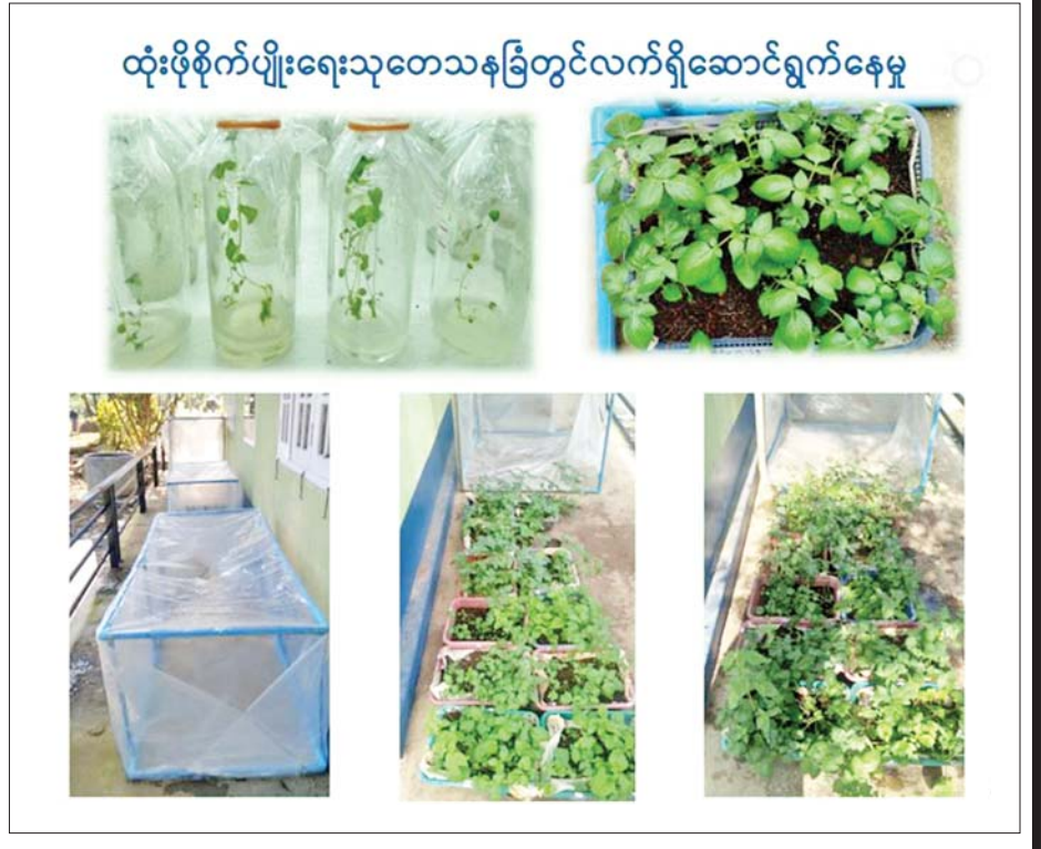
ထုံးဖိုစိုက်ပျိုးရေးသုတေသနမြူတွင်လက်ရှိဆောင်ရွက်နေမှု

စိုက်ပျိုးတောင်သူများ အကျိုးဖြစ်ထွန်းမည့် အာလူးစိုက်ပျိုးထုတ်လုပ်မှုအတွက် ပိုးမွှားကင်းစင်သောမျိုးအာလူးများ အသုံးပြုရန်လိုအပ်သည်။ သို့အတွက် မျိုးကောင်းမျိုးသန့်များစွာ ရရှိရန်အတွက် အပင်တစ်သျှူးကာချာနည်းပညာဖြင့် မွေးမြူထုတ်လုပ်ရသည်။ ယင်းနည်းပညာဖြင့် ရရှိလာသည့်မျိုးပင်ငယ်များကို အဆင့်ဆင့်စိုက်ပျိုးပြီးမှ မျိုးအာလူးထုတ်လုပ်ခြင်းဖြစ်သည်။