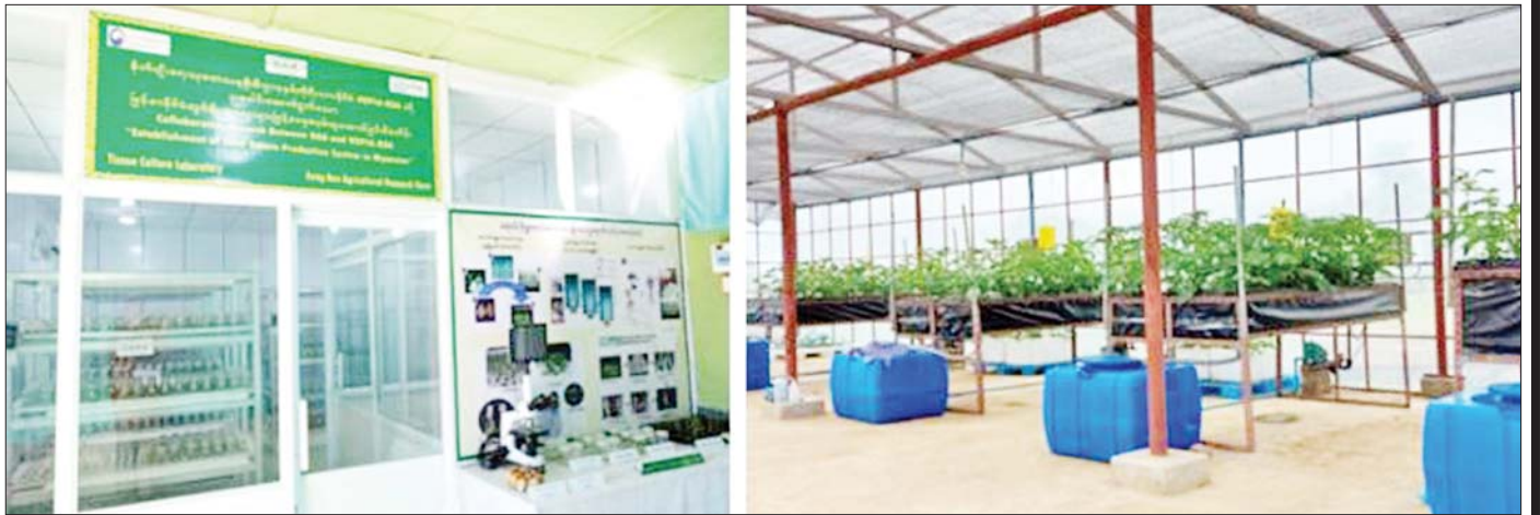
အောင်ပန်းမြို့ (ဒေသသုတေသနဗဟိုဌာန)၌ အာလူးသီးနှံဧက ၁၀၀၀၀ အတွက် မျိုးကောင်းမျိုးသန့် စိုက်ပျိုးထုတ်လုပ်ရေးစီမံချက်အရ မျိုးအာလူးများ ထုတ်လုပ်မှုကို တွေ့ရစဉ်။

“ကျွန်မတို့ရှမ်းပြည်နယ်ဟာ တစ်နိုင်ငံလုံး အာလူးစိုက်ဧကရဲ့ ၇၅ ရာခိုင်နှုန်း စိုက်ပျိုးထုတ်လုပ်ပါတယ်။ တောင်သူတွေဟာ အာလူးကို အကျိုးအမြတ်များတဲ့အတွက် အထွက်တိုးနိုင်မယ့် နိုင်ငံခြားကတင်သွင်းတဲ့ မျိုးအာလူးတွေကို ဝယ်ယူ