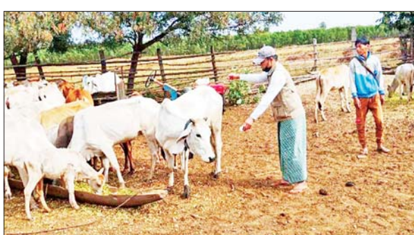
၆၅ ကောင်ကို ခွာနာလျှာနာရောဂါကာကွယ်ဆေး ထိုးနှံပေးခြင်းနှင့် တိရစ္ဆာန်ရောဂါကာကွယ်ရေးဆိုင်ရာ အသိပညာပေးလက်ကမ်းစာစောင် များ အခမဲ့ဖြန့်ဝေပေးခဲ့ကြောင်း သိရသည်။ ပိုးတောင်း