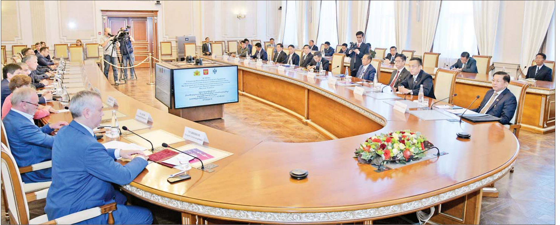
နိုင်ငံတော်စီမံအုပ်ချုပ်ရေးကောင်စီဥက္ကဋ္ဌ နိုင်ငံတော်ဝန်ကြီးချုပ် ဗိုလ်ချုပ်မှူးကြီးမင်းအောင်လှိုင် ဦးဆောင်သော ကိုယ်စားလှယ်အဖွဲ့နှင့် Novosibirsk အစိုးရအဖွဲ့အကြီးအကဲ Mr. Andrey Alexandrovich Travnikov ဦးဆောင်သော ကိုယ်စားလှယ်အဖွဲ့တို့ တွေ့ဆုံဆွေးနွေးကြစဉ်။

နေပြည်တော် ဇူလိုင် ၁၆ ရုရှား ဖက်ဒရေးရှင်းနိုင်ငံ Novosibirsk မြို့၌ ရောက်ရှိနေသည့် နိုင်ငံတော်စီမံအုပ်ချုပ်ရေးကောင်စီဥက္ကဋ္ဌ နိုင်ငံတော်ဝန်ကြီးချုပ် ဗိုလ်ချုပ်မှူးကြီးမင်းအောင်လှိုင်သည် ယနေ့နံနက်ပိုင်းတွင် Novosibirsk အစိုးရအဖွဲ့အကြီးအကဲ Mr. Andrey Alexandrovich Travnikov နှင့် အစိုးရအဖွဲ့ရုံး၌ တွေ့ဆုံဆွေးနွေးသည်။