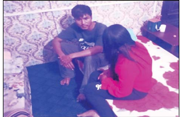
တရားခံဝင်းဗိုလ်အား ပြည့်တန်ဆာအခန်းတွင် ဖမ်းဆီးရမိမှု မှတ်တမ်းဓာတ်ပုံ။