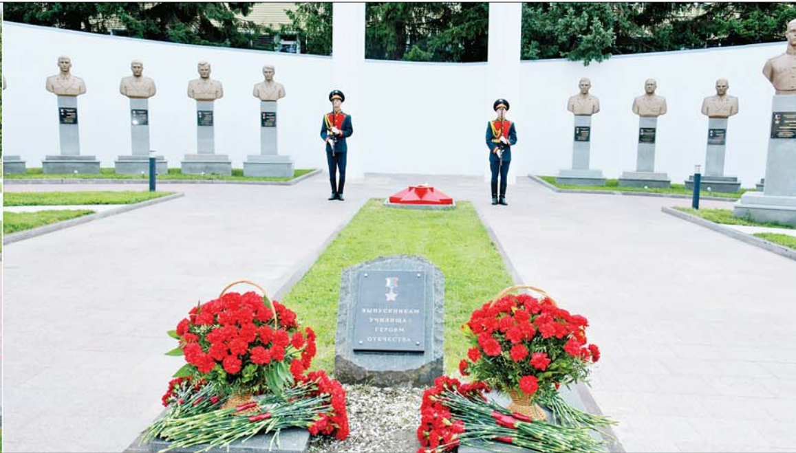
နိုင်ငံတော်စီမံအုပ်ချုပ်ရေးကောင်စီဥက္ကဋ္ဌ နိုင်ငံတော်ဝန်ကြီးချုပ် ဗိုလ်ချုပ်မှူးကြီးမင်းအောင်လှိုင်နှင့် Higher Military Command School ကျောင်းအုပ်ကြီး Major General Markochin Segeri Gregorovich တို့ နိုင်ငံတော်အတွက် အသက်စွန့်လွှတ်တာဝန်ထမ်းဆောင်ခဲ့ကြသည့် သူရဲကောင်းဆုတံဆိပ်ရရှိသူများကို ဂုဏ်ပြုထားသည့် သူရဲကောင်းရုပ်တုများအား ဂုဏ်ပြုပန်းခြင်းဖြင့် အလေးပြုကြစဉ်။

»» စာမျက်နှာ ၃ မှ ဆိုပါကလည်း အသင့်ကြိုဆိုမည် ဖြစ်သည့် အခြေအနေများနှင့် ပတ်သက်၍ ရှင်းလင်းဆွေးနွေး ပြောကြားသည်။