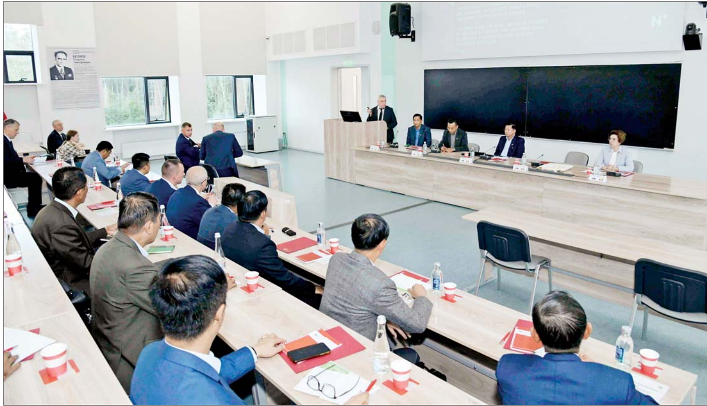
နိုင်ငံတော်စီမံအုပ်ချုပ်ရေးကောင်စီဥက္ကဋ္ဌ နိုင်ငံတော်ဝန်ကြီးချုပ် ဗိုလ်ချုပ်မှူးကြီးမင်းအောင်လှိုင် ဦးဆောင်သော ကိုယ်စားလှယ်အဖွဲ့အား Novosibirsk State University မှ ပါမောက္ခချုပ် Dr. Mikhail Petrovich Fedoruk က ရှင်းလင်းဆွေးနွေးပြောကြားစဉ်။