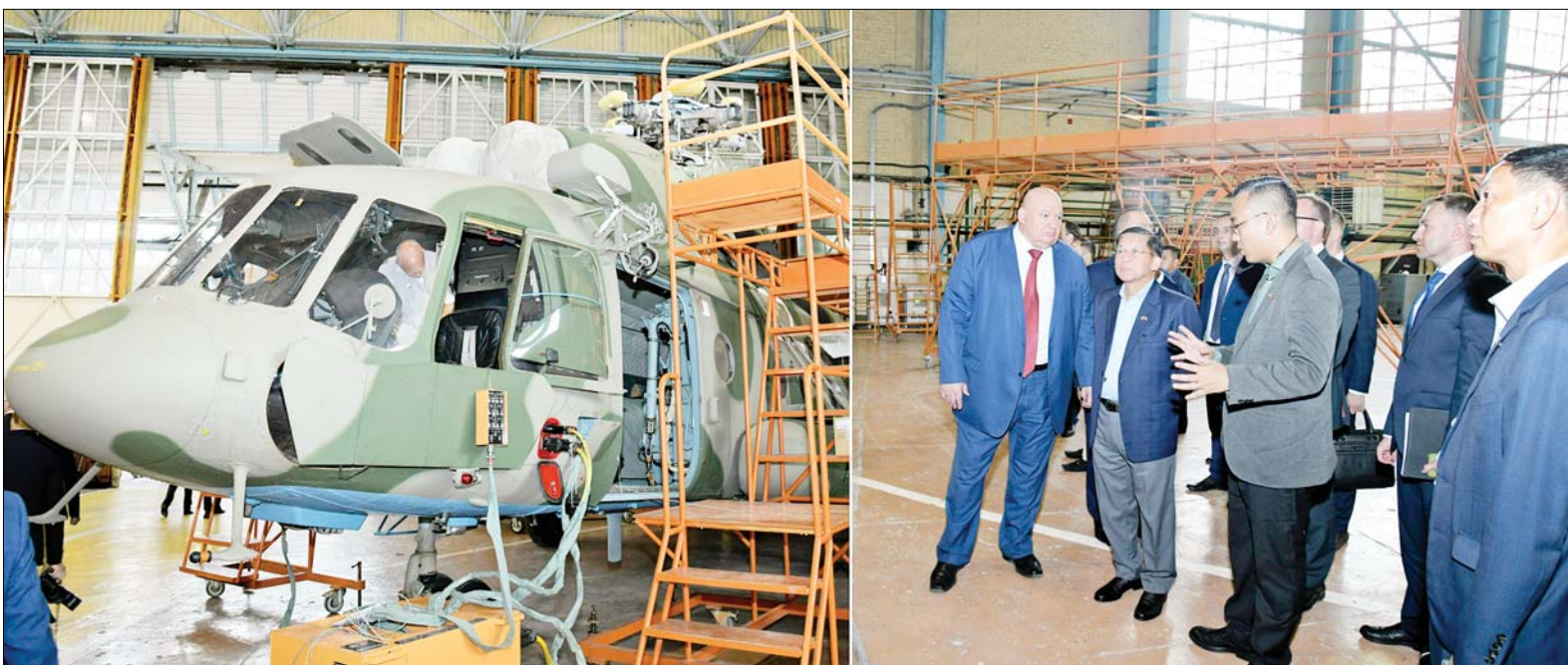
နိုင်ငံတော်စီမံအုပ်ချုပ်ရေးကောင်စီဥက္ကဋ္ဌ နိုင်ငံတော်ဝန်ကြီးချုပ် ဗိုလ်ချုပ်မှူးကြီးမင်းအောင်လှိုင်နှင့် အဖွဲ့ဝင်များ PJSC “Kazan Helicopters” ထုတ်လုပ်ရေးအလုပ်ရုံတွင် ကြည့်ရှုလေ့လာစဉ်။

နေပြည်တော် ဇူလိုင် ၁၅ ရက်နေ့တွင် နိုင်ငံတော်စီမံအုပ်ချုပ်ရေးကောင်စီ ဥက္ကဋ္ဌ နိုင်ငံတော်ဝန်ကြီးချုပ် ဗိုလ်ချုပ်မှူးကြီး မင်းအောင်လှိုင် ဦးဆောင်သည့် ကိုယ်စားလှယ်အဖွဲ့သည် ရုရှားဖက်ဒရေးရှင်းနိုင်ငံဆိုင်ရာ မြန်မာနိုင်ငံ သံအမတ်ကြီး ဦးလွင်ဦး၊ စစ်သံမှူး ဗိုလ်မှူးချုပ် မိုးကျော်နှင့် တာဝန်ရှိသူများ လိုက်ပါ၍ ဇူလိုင် ၁၃ ရက်တွင် Republic of the Tatarstan၊ ကာဇန်မြို့ရှိ Kazan Aircraft Production Association နှင့် HIMGRAD Industrial Complex တို့သို့ သွားရောက်လေ့လာကြည့်ရှုသည်။