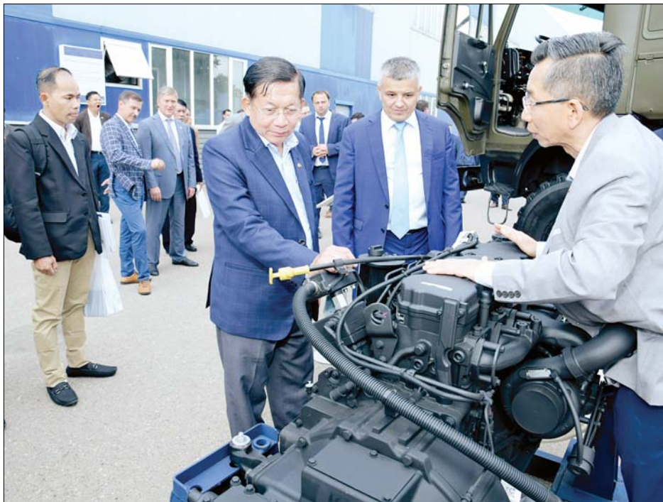
နိုင်ငံတော်စီမံအုပ်ချုပ်ရေးကောင်စီဥက္ကဋ္ဌ နိုင်ငံတော်ဝန်ကြီးချုပ် ဗိုလ်ချုပ်မှူးကြီးမင်းအောင်လှိုင်နှင့် အဖွဲ့ဝင်များ HIMGRAD Industrial Complex တွင် ကြည့်ရှုလေ့လာကြစဉ်။