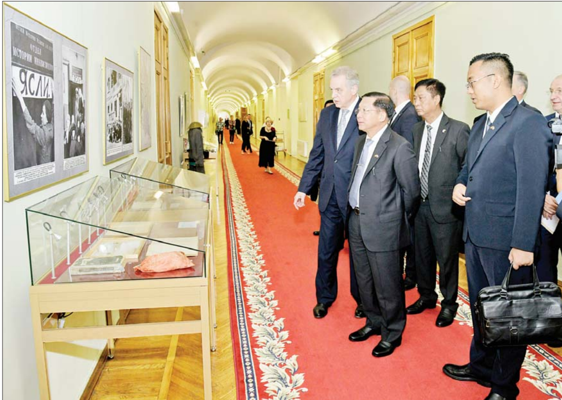
နိုင်ငံတော်စီမံအုပ်ချုပ်ရေးကောင်စီဥက္ကဋ္ဌ နိုင်ငံတော်ဝန်ကြီးချုပ် ဗိုလ်ချုပ်မှူးကြီးမင်းအောင်လှိုင် စိန့်ပီတာစဘတ်မြို့ အစိုးရအဖွဲ့ရုံးအတွင်း ကြည့်ရှုလေ့လာစဉ်။

သိရှိလိုသည့် အတူတကွ မေးခွန်းများကို ဖြေကြားခဲ့ကြသည်။ ထို့နောက် စိန့်ပီတာစဘတ်မြို့ အစိုးရအဖွဲ့ အကြီးအကဲက နိုင်ငံတော် စီမံအုပ်ချုပ်ရေးကောင်စီဥက္ကဋ္ဌ နိုင်ငံတော်ဝန်ကြီးချုပ်နှင့် အဖွဲ့ဝင်များအား အစိုးရအဖွဲ့ရုံးအတွင်း လှည့်လည်ပြသ၍ နိုင်ငံ့ခေါင်းဆောင်များ ယခင်တာဝန်ထမ်းဆောင်ခဲ့သည့် ရုံးခန်းများနှင့် ရုံးဖွဲ့စည်းဆောင်ရွက်မှုများအား လိုက်လံရှင်းလင်းပြသခဲ့ကြောင်း သိရသည်။