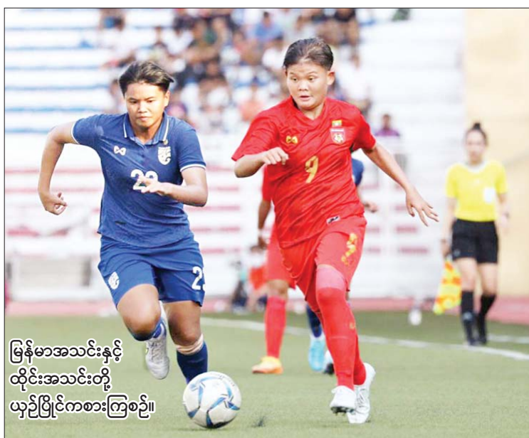
မြန်မာအသင်းနှင့် ထိုင်းအသင်းတို့ ယှဉ်ပြိုင်ကစားကြစဉ်။

ရန်ကုန် ဇူလိုင် ၁၅ ၂၀၂၂အာဆီယံ အမျိုးသမီးချန်ပီယံရှစ် ပြိုင်ပွဲ ဆီမီးဖိုင်နယ်ပွဲစဉ်များကို ယနေ့ တွင် ဖိလစ်ပိုင်နိုင်ငံ မနီလာမြို့၌ ကျင်းပရာ မြန်မာအသင်း ရှုံးပွဲကြုံတွေ့ပြီး ဗိုလ်လုပွဲ နှင့် လွဲချော်ခဲ့သည်။ နှစ်ဂိုး - ဂိုးမရှိ ဆီမီးဖိုင်နယ်ပွဲစဉ်များအဖြစ် ထိုင်း အသင်းက မြန်မာအသင်းကို နှစ်ဂိုး- ဂိုးမရှိ ဖိလစ်ပိုင်အသင်းက ဗီယက်နမ် အသင်းကို လေးဂိုး - ဂိုးမရှိတို့ဖြင့် အနိုင် ရရှိခဲ့သည်။ မြန်မာအသင်းသည် ယခု ဆီမီးဖိုင်နယ်ပွဲအတွက် သေချာပြင်ဆင်ပြီး ယှဉ်ပြိုင်ခဲ့သော်လည်း ထိုင်းအသင်းကို အရှုံးပေးခဲ့ရသည်။ စာမျက်နှာ ၂၃ ကော်လံ ၁ သို့ ၀