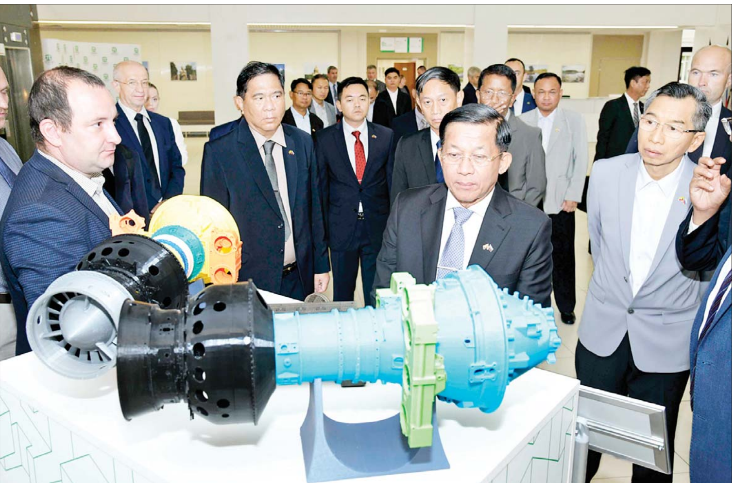
နိုင်ငံတော်စီမံအုပ်ချုပ်ရေးကောင်စီဥက္ကဋ္ဌ နိုင်ငံတော်ဝန်ကြီးချုပ် ဗိုလ်ချုပ်မှူးကြီးမင်းအောင်လှိုင် ဦးဆောင်သည့် ကိုယ်စားလှယ်အဖွဲ့ စိန့်ပီတာစဘတ်မြို့ရှိ Polytechnic State University အတွင်း ကြည့်ရှုလေ့လာစဉ်။

နေပြည်တော် ဇူလိုင် ၁၅ ရက်၊ ဖက်ဒရေးရှင်းနိုင်ငံ၌ ရောက်ရှိ နေသည့် နိုင်ငံတော်စီမံအုပ်ချုပ်ရေး ကောင်စီဥက္ကဋ္ဌ နိုင်ငံတော်ဝန်ကြီးချုပ် ဗိုလ်ချုပ်မှူးကြီးမင်းအောင်လှိုင် ဦးဆောင် သည့် ကိုယ်စားလှယ်အဖွဲ့သည် ရုရှား ဖက်ဒရေးရှင်းနိုင်ငံဆိုင်ရာ မြန်မာနိုင်ငံ သံအမတ်ကြီး ဦးလွင်ဦး၊ စစ်သံမှူး ဗိုလ်မှူးချုပ်မိုးကျော်နှင့် တာဝန်ရှိသူများ လိုက်ပါ၍ ဇူလိုင် ၁၄ ရက် ဒေသစံတော်ချိန် နံနက်ပိုင်းတွင် စိန့်ပီတာစဘတ်မြို့ရှိ Polytechnic State University နှင့် အထင်ကရနေရာတစ်ခုဖြစ်သည့် Peterhof (ဇွေရာသီနန်းတော်)တို့ သွားရောက် လေ့လာသည်။