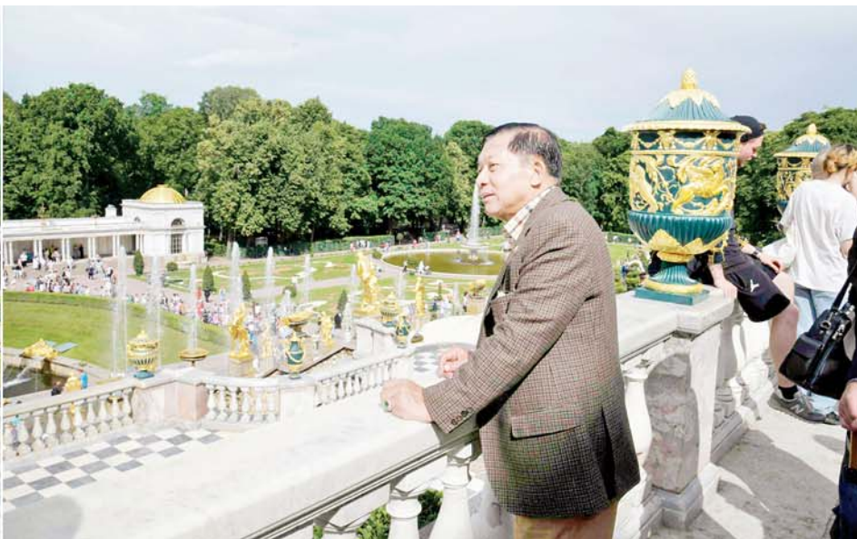
နိုင်ငံတော်စီမံအုပ်ချုပ်ရေးကောင်စီဥက္ကဋ္ဌ နိုင်ငံတော်ဝန်ကြီးချုပ် ဗိုလ်ချုပ်မှူးကြီးမင်းအောင်လှိုင် Peterhof (နေရာသီနန်းတော်)၌ ကြည့်ရှုလေ့လာစဉ်။

☆ စာမျက်နှာ ၃ မှ လေယာဉ်တိုက်မှုရရှိသည့် အချက်အလက်များအပေါ် မူတည်၍ 3D တွက်ချက်ခြင်း၊ Drawing ရေးဆွဲခြင်းများ၊ အာကာသဆိုင်ရာ တွက်ချက်ခြင်း၊ ရောဂါရှာဖွေစမ်းသပ်စစ်ဆေးခြင်းများ အပါအဝင် အခြားတွက်ချက်မှုမှန်သမျှကို လုပ်ဆောင်နိုင်သည့် အခြေအနေများနှင့် သတ္တုထုတ်လုပ်မှု အလုပ်ရုံတို့ လုပ်ဆောင်နိုင်မှု အခြေအနေများကို လိုက်လံရှင်းလင်းပြသကြသည်။ နိုဗယ်ဆုရှင်များစွာ မွေးထုတ်ပေး အဆိုပါ St. Petersburg Polytechnic State University သည် ရုရှားနည်းပညာဆိုင်ရာ တက္ကသိုလ်တစ်ခုဖြစ်ပြီး Peter the Great Polytechnic Institute သို့မဟုတ် Kalinin Polytechnic Institute ဟုလည်း ခေါ်ဝေါ်ကြကြောင်း၊ ၁၈၉၉ ခုနှစ်တွင် စတင် တည်ထောင်ခဲ့ပြီး နိုဗယ်ဆုရှင်များစွာ မွေးထုတ်ပေးနိုင်ခဲ့သည့် တက္ကသိုလ်လည်း ဖြစ်ကြောင်း၊ တက္ကသိုလ်ကို အင်ဂျင်နီယာဌာနခွဲ၊ ရူပဗေဒဌာနခွဲနှင့် စီးပွားရေးနှင့် လူမှုရေးဆိုင်ရာ ဌာနခွဲဟူ၍ ဌာနခွဲ