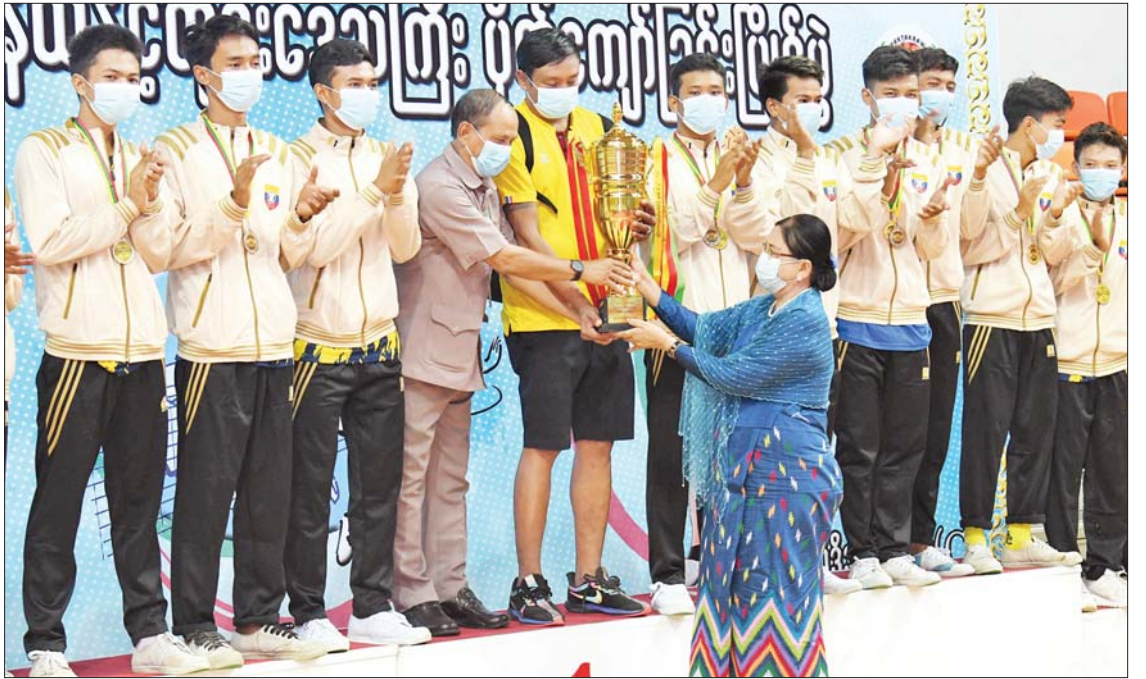
နိုင်ငံတော်စီမံအုပ်ချုပ်ရေးကောင်စီအဖွဲ့ဝင် ဒေါ်အေးနုစိန် စုပေါင်းတံခွန်စိုက်ခိုင်းဆုရရှိသည့် စစ်ကိုင်းတိုင်းဒေသကြီး အသင်းအား ဆုပေးအပ်ချီးမြှင့်စဉ်။

နေပြည်တော် ဇူလိုင် ၁၅ အားကစားနှင့်လူငယ်ရေးရာဝန်ကြီးဌာနနှင့် မြန်မာနိုင်ငံပိုက်ကျော်ခြင်းအဖွဲ့ချုပ်တို့ ပူးပေါင်းကျင်းပသည့် ၂၀၂၂ ခုနှစ် တိုင်းဒေသကြီးနှင့် ပြည်နယ်ပိုက်ကျော်ခြင်းပြိုင်ပွဲ ဗိုလ်လုပွဲနှင့် ဆုချီးမြှင့်ပွဲအခမ်းအနားကို ယနေ့မနန်းလွဲ ၃ နာရီတွင် နေပြည်တော်ရှိ ဝဏ္ဏသိဒ္ဓိအားကစားကွင်း (C) ရုံ၌ ကျင်းပသည်။