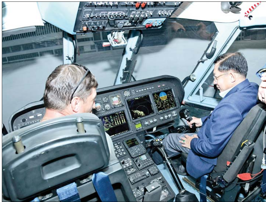
နိုင်ငံတော်စီမံအုပ်ချုပ်ရေးကောင်စီဥက္ကဋ္ဌ နိုင်ငံတော်ဝန်ကြီးချုပ် ဗိုလ်ချုပ်မှူးကြီးမင်းအောင်လှိုင် Simulator ဖြင့် ရဟတ်ယာဉ် စမ်းသပ်မောင်းနှင်ခန်းသို့ ရောက်ရှိလေ့လာပြီး ကိုယ်တိုင်စမ်းသပ်မောင်းနှင်စဉ်။

လျှပ်စစ်ပစ္စည်းများ၊ စိုက်ပျိုးရေးလုပ်ငန်းသုံး ဓာတ်မြေဩဇာနှင့် ဆေးဝါးထုတ်လုပ်မှုဆိုင်ရာ ပစ္စည်းများနှင့် အခြားလူသုံးကုန်ပစ္စည်း အမျိုးမျိုးကို ထုတ်လုပ်နေမှု၊ ဖြန့်ဖြူးမှုတို့နှင့် ပတ်သက်၍ လုပ်ငန်းအလိုက် တာဝန်ရှိသူများက ရှင်းလင်းတင်ပြကြရာ နိုင်ငံတော်စီမံအုပ်ချုပ်ရေးကောင်စီ ဥက္ကဋ္ဌ နိုင်ငံတော်ဝန်ကြီးချုပ်က သိရှိလိုသည်များ ပြန်လည်မေးမြန်းဆွေးနွေးခဲ့ပြီး မြန်မာနိုင်ငံနှင့် ကုန်သွယ်ရေး လုပ်ငန်းများ ဆောင်ရွက်နိုင်မည့် အခြေအနေများကို ဆွေးနွေးပြောကြားသည်။ စာမျက်နှာ ၇ သို့ >>>