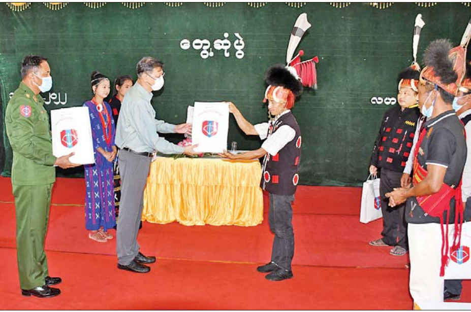
နိုင်ငံတော်စီမံအုပ်ချုပ်ရေးကောင်စီအဖွဲ့ဝင် ကာကွယ်ရေးဝန်ကြီးဌာန ပြည်ထောင်စုဝန်ကြီး ဗိုလ်ချုပ်ကြီးမြထွန်းဦး ဒေသခံတိုင်းရင်းသားများအား စားသောက်ဖွယ်ရာများ ပေးအပ်စဉ်။

နေပြည်တော် ဇူလိုင် ၁၅ စစ်ကိုင်းတိုင်းဒေသကြီး နာဂကိုယ်ပိုင် အုပ်ချုပ်ခွင့်ရဒေသ လဟယ်မြို့သို့ ရောက်ရှိနေသော နိုင်ငံတော်စီမံအုပ်ချုပ်ရေးကောင်စီ အဖွဲ့ဝင် ကာကွယ်ရေးဝန်ကြီးဌာန ပြည်ထောင်စုဝန်ကြီး ဗိုလ်ချုပ်ကြီးမြထွန်းဦး၊ စစ်ကိုင်းတိုင်းဒေသကြီး ဝန်ကြီးချုပ် ဦးမြတ်ကျော်၊ အနောက်မြောက်တိုင်း စစ်ဌာနချုပ်တိုင်းမှူး ဗိုလ်မှူးချုပ်သန်းထိုက်နှင့် တာဝန်ရှိသူများသည် ဇူလိုင် ၁၄ ရက် နံနက်ပိုင်းတွင် လဟယ်မြို့ရှိ နယ်မြေခံတပ်ရင်းခန်းမ၌ အရာရှိ၊ စစ်သည်၊ မိသားစုဝင်များအား တွေ့ဆုံအမှာစကား ပြောကြားပြီး တပ် နယ်မိသားစုများအတွက် စားသောက်ဖွယ်ရာများနှင့် ကိုဗစ်-၁၉ ရောဂါ ကာကွယ်ရေး အထောက်အကူပြုပစ္စည်းများ ပေးအပ် သည်။