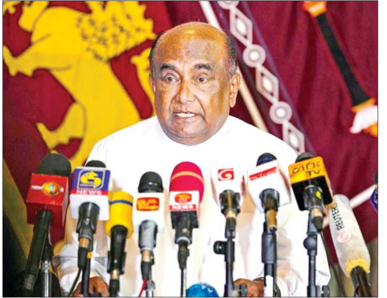
သီရိလင်္ကာပါလီမန်ဥက္ကဋ္ဌ မဟင်ဒါရာပါ။

နေအိမ်များကို ဝင်ရောက်စီးနင်းခဲ့သည်။ လက်ရှိတွင် သီရိလင်္ကာဝန်ကြီးချုပ်သည် ယာယီသမ္မတအဖြစ် တာဝန်ထမ်းဆောင်လျက်ရှိပြီး ဇူလိုင် ၂၀ ရက်တွင် သမ္မတအသစ်ကို ရွေးချယ်တင်မြှောက်မည်ဖြစ်ကြောင်း သိရသည်။ လာမည့် အစိုးရအဖွဲ့အသစ်သည် နိုင်ငံတွင်းဖြစ်ပေါ်လျက်ရှိသည့် တင်းမာမှုများကို ကောင်းမွန်စွာကိုင်တွယ်ဖြေရှင်းပြီး ပြည်သူများ၏ ယုံကြည်မှုကို ပြန်လည်ရရှိရန် ကြိုးပမ်းသွားရမည်ဖြစ်သည်။ သို့သော် စားနပ်ရိက္ခာနှင့် လောင်စာဆီပြတ်လပ်မှုများသည် အစိုးရအဖွဲ့အသစ်အတွက် ရင်ဆိုင်ဖြေရှင်းရန် အဓိကကျသော ပြဿနာများပင်ဖြစ်သည်။ ကိုးကား - အင်န်အိတ်ချီကော ဘာသာပြန် - အောင်ကျော်ကျော်