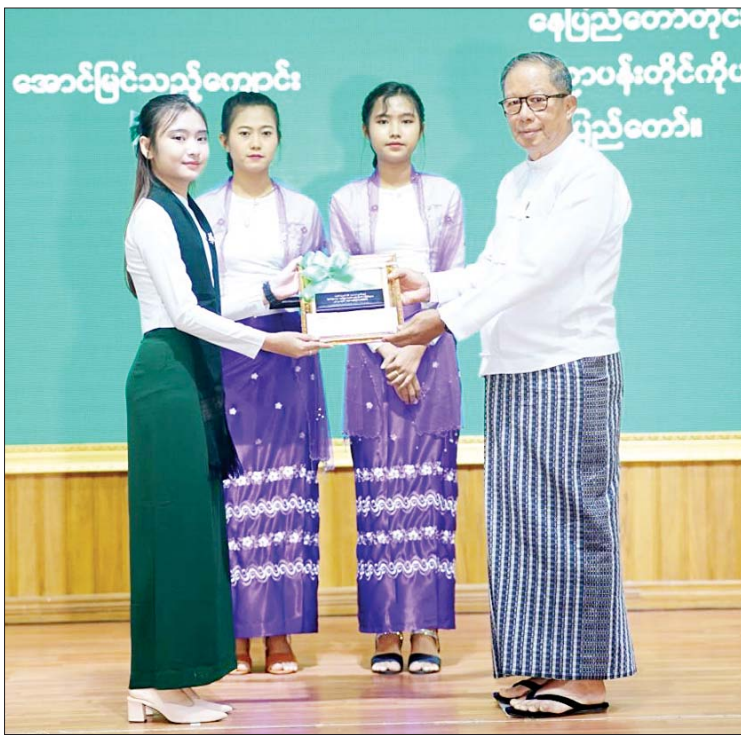
ဝိပွဲဘာသာတွဲဖြင့် တစ်နိုင်ငံလုံး၌ ဒုတိယ ဆုရရှိခဲ့သူ တစ်ဦး၊ သိပ္ပံဘာသာတွဲ ဆဋ္ဌမ ဆုရရှိသူတစ်ဦးအပါအဝင် ဘာသာစုံ အောင်မြင်သူ ၃၂ ဦး၊ သုံးဘာသာရပ်ထူး ဝန်ထမ်းဖြင့် အောင်မြင်သူ ၁၉ ဦး၊

ပိုမိုမြှင့်တင်ပေးရန်အတွက် အခမ်းအနားတွင် ပြည်ထောင်စု ဝန်ကြီး ဦးတင်ထွဋ်ဦးက နိုင်ငံတော် အနေဖြင့် လူသားအရင်းအမြစ်ဖွံ့ဖြိုးမှု အားကောင်းလာစေရေးအတွက် ပညာ ရေးတွင် ရင်းနှီးမြှုပ်နှံမှုကို အလေးထား ဆောင်ရွက်ပေးလျက်ရှိကြောင်း၊ မိမိတို့ ဝန်ကြီးဌာနအောက်ရှိ ဝန်ထမ်းမိသားစု များအနေဖြင့်လည်း မိမိတို့မျိုးဆက်များ ပညာရည်ထူးချွန်ပြီး ဘက်စုံဖွံ့ဖြိုးရေး၊ ကျန်းမာကြံ့ခိုင်ရေးတို့အတွက် ပိုမို မြှင့်တင်ပေးရန်လိုအပ်ကြောင်း၊ ၂၀၂၂ ခုနှစ် တက္ကသိုလ်ဝင်စာမေးပွဲတွင် မိမိတို့ဝန်ကြီးဌာန ဝန်ထမ်းသားသမီး စုစုပေါင်း ၁၀၀၉ ဦး အောင်မြင်ခဲ့ကြပြီး