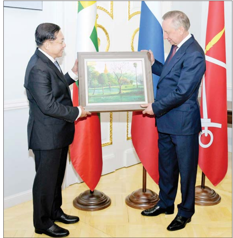
နိုင်ငံတော်စီမံအုပ်ချုပ်ရေးကောင်စီဥက္ကဋ္ဌ နိုင်ငံတော်ဝန်ကြီးချုပ် ဗိုလ်ချုပ်မှူးကြီး မင်းအောင်လှိုင် စိန့်ပီတာစဘတ်မြို့ အစိုးရအဖွဲ့အကြီးအကဲ Mr.Alexander Beglov အား အမှတ်တရလက်ဆောင်ပစ္စည်းပေးအပ်စဉ်။