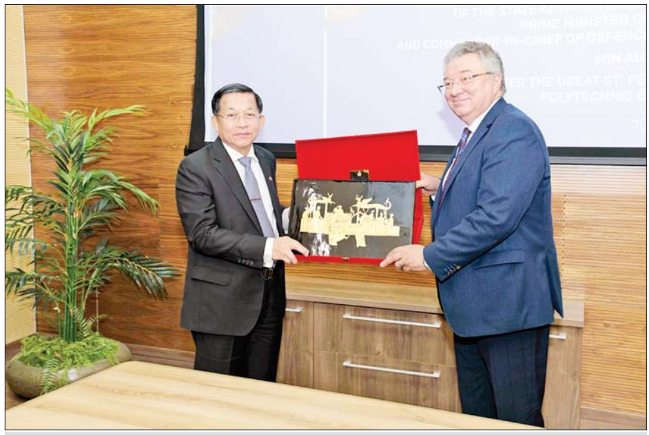
နိုင်ငံတော်စီမံအုပ်ချုပ်ရေးကောင်စီဥက္ကဋ္ဌ နိုင်ငံတော်ဝန်ကြီးချုပ် ဗိုလ်ချုပ်မှူးကြီးမင်းအောင်လှိုင် Polytechnic State University ပါမောက္ခချုပ် Mr. Andrey Ivanovich Rudskoy အား အမှတ်တရ လက်ဆောင်ပစ္စည်း ပေးအပ်စဉ်။