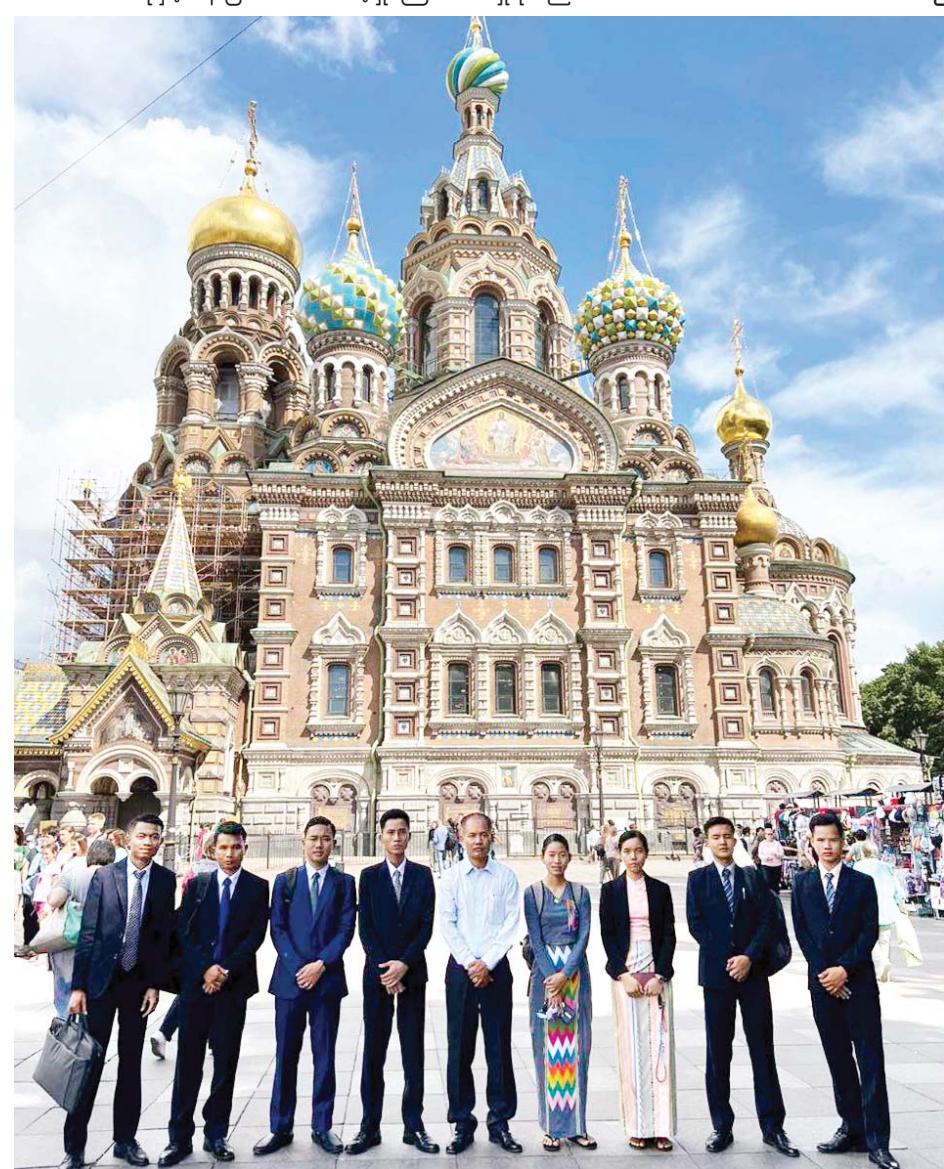
ထူးချွန်ဆုရ အမျိုးသား၊ အမျိုးသမီး အရာရှိများ စိန့်ပီတာစဘတ်မြို့ရှိ အထင်ကရနေရာအား ကြည့်ရှုလေ့လာပြီး စုပေါင်းမှတ်တမ်းတင်ဓာတ်ပုံရိုက်စဉ်။