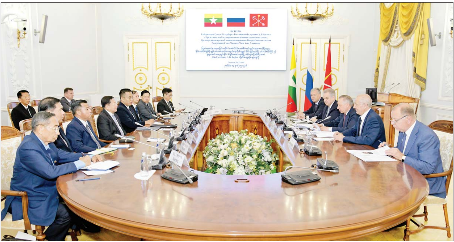
နိုင်ငံတော်စီမံအုပ်ချုပ်ရေးကောင်စီဥက္ကဋ္ဌ နိုင်ငံတော်ဝန်ကြီးချုပ် ဗိုလ်ချုပ်မှူးကြီး မင်းအောင်လှိုင် စိန့်ပီတာစဘတ်မြို့ အစိုးရအဖွဲ့အကြီးအကဲ Mr.Alexander Beglov နှင့် တွေ့ဆုံဆွေးနွေးစဉ်။

ထိုသို့ တွေ့ဆုံဆွေးနွေးရာတွင် စိန့်ပီတာစဘတ်မြို့ အစိုးရအဖွဲ့အနေဖြင့် နိုင်ငံတော်စီမံအုပ်ချုပ်ရေးကောင်စီဥက္ကဋ္ဌ နိုင်ငံတော်ဝန်ကြီးချုပ်နှင့် ကိုယ်စားလှယ်အဖွဲ့ဝင်များအား ခင်မင်ရင်းနှီးစွာ ကြိုဆိုကြောင်းနှင့် ရုရှား-မြန်မာနှစ်နိုင်ငံ ကောင်းမွန်သည့်ဆက်ဆံရေးသမိုင်းကြောင်းသည် နှစ်ပေါင်း ၇၅ နှစ်ကျော်ရှိပြီဖြစ်သည့် အခြေအနေ၊