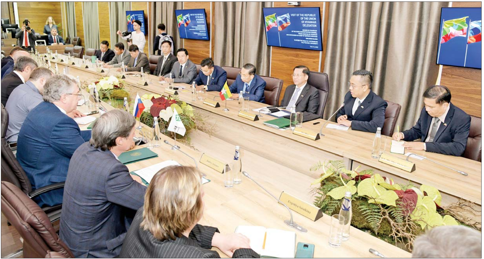
နိုင်ငံတော်စီမံအုပ်ချုပ်ရေးကောင်စီဥက္ကဋ္ဌ နိုင်ငံတော်ဝန်ကြီးချုပ် ဗိုလ်ချုပ်မှူးကြီးမင်းအောင်လှိုင် ဦးဆောင်သည့် ကိုယ်စားလှယ်အဖွဲ့နှင့် စိန့်ပီတာစဘတ်မြို့ရှိ Polytechnic State University မှ ပါမောက္ခချုပ် Mr. Andrey Ivanovich Rudskoy တို့ တွေ့ဆုံဆွေးနွေးစဉ်။

ယင်းနောက် နိုင်ငံတော်စီမံအုပ်ချုပ်ရေးကောင်စီ ဥက္ကဋ္ဌ နိုင်ငံတော် ဝန်ကြီးချုပ်နှင့်