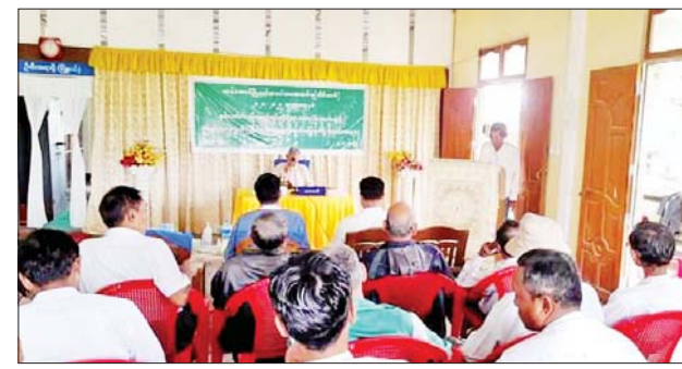
အဖွဲ့သစ်များသည် ပြည်နယ်အဆင့်ဖွဲ့စည်းရေးကော်မတီဥက္ကဋ္ဌ ရှေ့မှောက်တွင် ကတိသစ္စာခံယူပြီးနောက် ဥက္ကဋ္ဌသစ်က နှုတ်ခွန်းဆက် အမှာစကားပြောကြားကြောင်း သိရသည်။