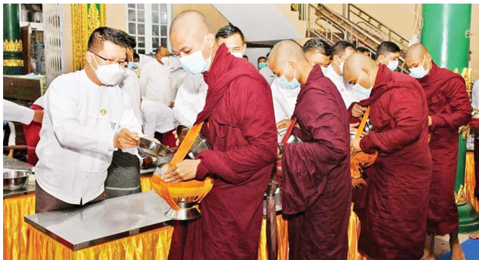
အေးချမ်းသာသာ ဆောင်ရွက်နိုင်ရေး ဌာနဆိုင်ရာများ၊ အရုဏ်ဆွမ်းများ လောင်းလှူပူဇော်သွားမည်ဖြစ် စေတနာရှင် အလှူရှင်များက ဝါတွင်းကာလပတ်လုံး ကြောင်း သိရသည်။ တနင်္လာနေ့မှအပ တစ်ပတ်လျှင် ခြောက်ရက်ဖြင့် တိုင်းဒေသကြီး(ပြန်/ဆက်)

ဝါတွင်းကာလအတွင်း သံဃာတော်အရှင်သူ မြတ်များ သာသနာရေးဆိုင်ရာကိစ္စရပ်များကို စိတ်