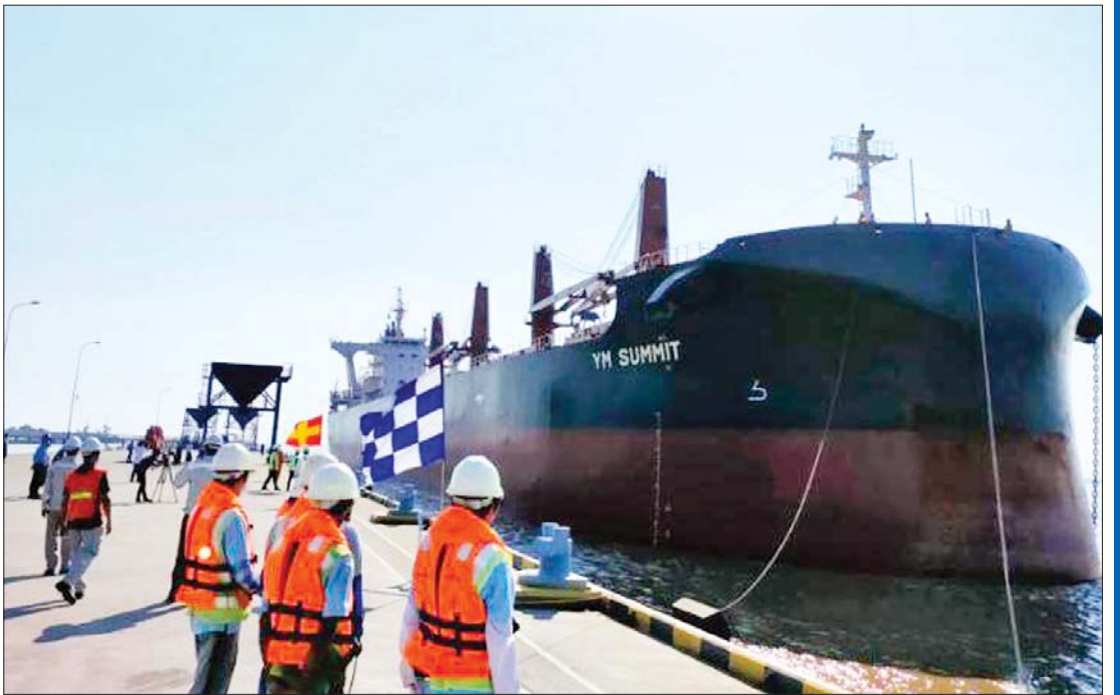
ပဲခူးစင်တာတင်ဆောင်လာသည့် YN SUMMIT အမည်ရှိ ပင်လယ်ကူးသင်္ဘောကြီး အပြည်ပြည်ဆိုင်ရာ သီလဝါဆိပ်ကမ်း International Bulk Terminal Tilawa (IBTT) သို့ ဆိုက်ကပ်လာစဉ်။

ကင်းလွတ်ဇုန်များတွင် ရင်းနှီးမြှုပ်နှံ ပါက အနည်းဆုံးပမာဏ USD 750000 နှင့်အထက် ရင်းနှီးမြှုပ်နှံနိုင်ပြီး ပထမ ခုနှစ်နှစ်အတွက် ဝင်ငွေခွန်ကင်းလွတ်ခွင့် နှင့် ကျော်လွန်ပြီးနောက် နောက်ထပ် ငါးနှစ်အတွက် တည်ဆဲဥပဒေအရ သတ်မှတ်သည့် ဝင်ငွေခွန်နှုန်းထား၏ ၅၀ ရာခိုင်နှုန်း သက်သာခွင့်ရမည်