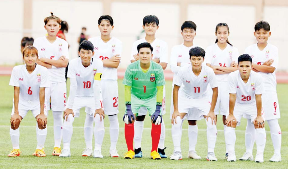
မြန်မာအမျိုးသမီး ဘောလုံးအသင်း ကစားသမားများကို တွေ့ရစဉ်။