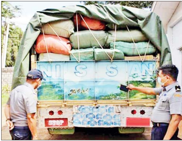
ရှမ်းပြည်နယ် လားရှိုးမြို့နယ်၌ သိမ်းဆည်းရမိမှု။

တရားမဝင် ကုန်သွယ်မှုတိုက်ဖျက်ရေး ဦးဆောင်ကော်မတီ၏ ကြီးကြပ်ကွပ်ကဲမှုဖြင့် တရားမဝင် ကုန်သွယ်မှုများကို ဥပဒေနှင့်အညီ ထိရောက်စွာ တားဆီးအရေးယူနိုင်ရေး ဆောင်ရွက်လျက်ရှိရာ ဇူလိုင် ၈ ရက်တွင် ရှမ်းပြည်နယ် တရားမဝင်ကုန်သွယ်မှုတိုက်ဖျက်ရေး အထူးအဖွဲ့၏ စီမံခန့်ခွဲမှုဖြင့် လားရှိုးမြို့နယ် အကောက်ခွန်ဦးစီးဌာနမှူးရုံးအဖွဲ့ ဦးဆောင်သော စစ်ဆေးရေးအဖွဲ့က စစ်ဆေးမှုများ ဆောင်ရွက်ခဲ့ရာ ကုန်တင်ယာဉ် သုံးစီးပေါ်၌ တရားဝင်စာရွက်စာတမ်း အထောက်အထား တစ်စုံတစ်ရာ တင်ပြနိုင်ခြင်းမရှိသည့် အဝတ်အထည်နှင့် လူသုံးကုန် ပစ္စည်းများ (ခန့်မှန်းတန်ဖိုးငွေကျပ် ၆၀၀၀၀၀)နှင့် အဆိုပါပစ္စည်းများ တင်ဆောင်လာသည့် ISUZU အမျိုးအစား ကုန်တင်ယာဉ်တစ်စီး (ခန့်မှန်းတန်ဖိုး ငွေကျပ် ၁၆၀၀၀၀၀)၊ Nissan Condor အမျိုးအစား ကုန်တင်ယာဉ်တစ်စီး (ခန့်မှန်းတန်ဖိုးငွေကျပ် ၁၉၀၀၀၀၀)နှင့် Hino Ranger အမျိုးအစား ကုန်တင်ယာဉ်တစ်စီး (ခန့်မှန်းတန်ဖိုးငွေကျပ် ၂၃၀၀၀၀၀) စုစုပေါင်း ခန့်မှန်းတန်ဖိုးငွေကျပ် ၁၁၉၄၅၅၀၀ ကို သိမ်းဆည်းရမိခဲ့ပြီး အကောက်ခွန် လုပ်ထုံးလုပ်နည်းနှင့်အညီ အရေးယူ ဆောင်ရွက်လျက်ရှိသည်။