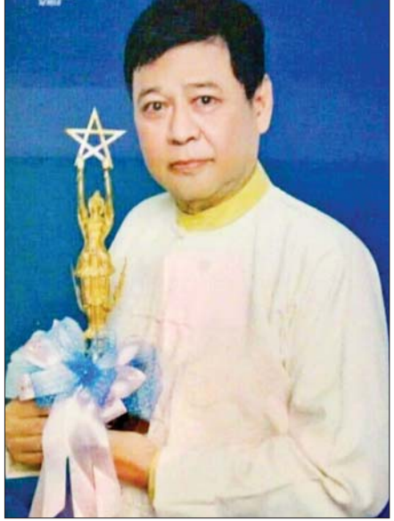
ခွဲကြောင်း သိရသည်။ ဆရာကြီးသည် မြန်မာသံကိုယ်ပိုင်သံစဉ် သီချင်းများကိုလည်း ရေးသားခဲ့သူဖြစ်ပြီး “ချမ်းမြေ့ပါစေ” သီချင်းမှာ အောင်မြင်မှုအများဆုံးရရှိခဲ့သည့်တေးသီချင်းဖြစ်သည်။ ကွယ်လွန်ခဲ့ပြီဖြစ်သည့် စန္ဒရားဦးတင်ဝင်းလှိုင်အားလာမည့်စနေနေ့ ဧပြီလ ၁၆ ရက် မွန်းလွဲ ၂ နာရီတွင် ရေဝေးသုသာန်၌ မီးသဂြိုဟ်မည်ဖြစ်ကြောင်း သိရသည်။ ဆရာကြီးသည် ရန်ကုန်မြို့ စမ်းချောင်းမြို့နယ် မြေနီကုန်းတောင်ရပ်ကွက် ပြည်လမ်းအမှတ်-၂၁၈ / ဘီ (၅)အတွင် နေထိုင်ခဲ့ပြီး ကွယ်လွန်ချိန်တွင် သမီးနှစ်ဦးကျန်ရစ်ခဲ့သည်။ စိုးစံကို

အရွယ်တွင် ပဒေသာမိသားစုနေအိမ်ရှိရာ ၄၂ လမ်းရှိ တိုက်ခန်းတွင် စန္ဒရားအတတ်ပညာကို စတင်သင်ကြားခဲ့သည်။ စတင်သင်ကြားပေးခဲ့သူမှာ နောင်တစ်ချိန်တွင် စန္ဒရားချစ်ဆွေဟု စန္ဒရားအကျော်အမော်ပညာရှင်ဖြစ်လာမည့် မောင်ချစ်ဆွေ ဖြစ်ကြောင်း သိရသည်။ ဆရာကြီးသည် အသက်ငါးနှစ်အရွယ်တွင် စန္ဒရားပညာသင်ကြားပြီး ၁၃ နှစ်အရွယ်တွင် ပြိုင်ပွဲများ ဝင်ပြိုင်ရာ စန္ဒရားအတီးထူးချွန်သည့်အတွက် ဆုများစွာရရှိခဲ့သည်။ အသက် ၁၈ နှစ်အရွယ်တွင် အလင်္ကာကျော်စွာဆရာရွှေပြည်အေး တာဝန်ယူတီးခတ်ပေးသည့် ရုပ်ရှင်ဇာတ်ထုပ်များတွင် ပညာရရှိရန်အတွက် လက်ထောက်အဖြစ်ဖြင့် လိုက်လံတီးခတ်ပေးရာမှ စန္ဒရားတင်ဝင်းလှိုင်ဟု အမည်တွင်လာခဲ့ခြင်းဖြစ်သည်။ စန္ဒရားတင်ဝင်းလှိုင်သည် ငယ်ရွယ်စဉ်ကာလများတွင် ပလေးဘွိုင်းတေးဂီတအဖွဲ့၊ LPJ တေးဂီတအဖွဲ့၊ Electronic Machine တေးဂီတအဖွဲ့တို့တွင် စန္ဒရားပညာရှင်အဖြစ်တီးခတ်ကာ စတီရီယိုလောကတွင် နှစ်၂၀ ခန့် ကျင်လည်ခဲ့ပြီး နိုင်ငံတကာအထိ မြန်မာ့ဂီတကိုမိတ်ဆက်ခဲ့သူဖြစ်သည်။ ဂျပန်နိုင်ငံ တိုကျိုအနုပညာတက္ကသိုလ်တွင် မြန်မာ့ဂီတနှင့် ပတ်သက်၍ သင်ကြားပေးခဲ့သည်။ ဂျပန်နိုင်ငံနှင့် အင်္ဂလန်နိုင်ငံ ဂီတတက္ကသိုလ်တို့တွင် သုံးဆောင်းဘာသာစကားဖြင့် တစ်ကြိမ်စီ တီးဆိုပြီးဟောပြော