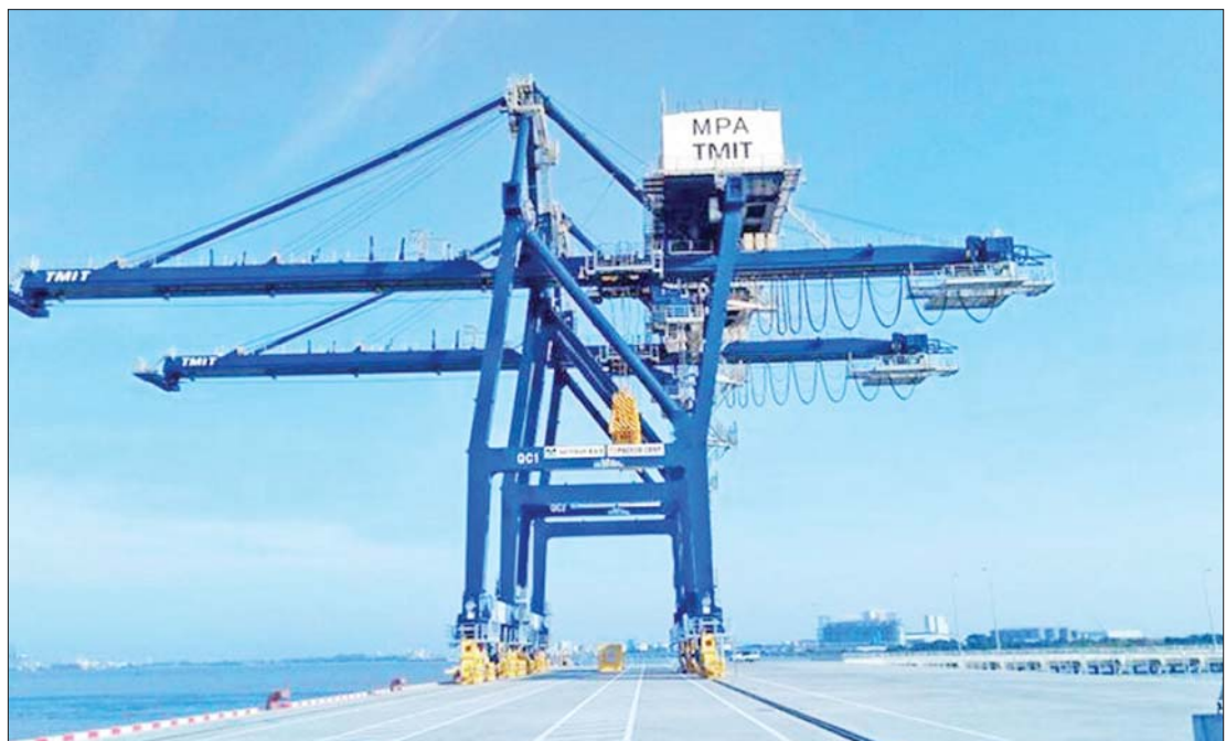
သီလဝါဆိပ်ကမ်း၌ တည်ဆောက်ပြီးစီးခဲ့သည့် အထွေထွေကုန်စည်နှင့် ကုန်သွယ်ရေး တင်ချဆိပ်ခံတံတားသစ်ကို တွေ့ရစဉ်။

အခြား စီးပွားရေးဇုန်များထက် အားသာချက်များတွင် Excellent One Stop Service Center၊ ကုန်သွယ် ရေကြောင်းပို့ဆောင်ရေး လွယ်ကူမှု၊ ပြည့်စုံသည့်လူနေမှုဝန်ဆောင်မှု၊ အောင်မြင် သော စက်ရုံ၊ အလုပ်ရုံများ တည်ဆောက် နိုင်မှုနှင့် စီးပွားရေးလုပ်ငန်းဆိုင်ရာ လိုက်နာရမည့် ကျင့်ဝတ်များနှင့် လျော်ညီမှု ထုတ်လုပ်မှုစွမ်းရည် မြင့်မား မှုစသည်တို့ကိုလည်း ခံစားရရှိစေမည် ဖြစ်ပါသည်။ စာမျက်နှာ ၁၁ သို့