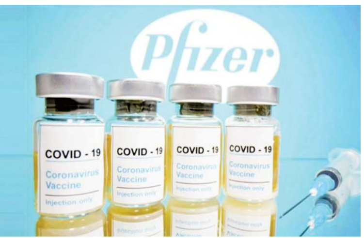
အထိ ကလေးငယ်များကို Moderna အတည်ပြုပေးခဲ့သည်။ ကိုဗစ်-၁၉ ရောဂါကာကွယ်ဆေးကို ကိုးကား- အင်န်အိတ်ချ်ကော လွန်ခဲ့သောလက အရေးပေါ်သုံးစွဲခွင့် ဘာသာပြန်- အောင်ကျော်ကျော်

ရှိမှုနှင့် ဘေးကင်းလုံခြုံမှုတို့ကို စစ်ဆေး လျက်ရှိသည်။ ဂျပန်နိုင်ငံအတွင်း သုံးစွဲခွင့်အတည် ပြုထားသည့်ကာကွယ်ဆေးများအနက် Moderna ကာကွယ်ဆေးသည် အသက် ၁၂ နှစ်နှင့်အထက်ပြည်သူများအား ထိုးနှံ ရာတွင် အသုံးပြုလျက်ရှိကြောင်း သိရ သည်။ ထို့ပြင် အသက် ၄၀ နှင့်အထက် ပြည်သူများအတွက် AstraZeneca ကာကွယ်ဆေးကို အသုံးပြုလျက်ရှိ ကြောင်း သိရသည်။ အမေရိကန်စားနပ်ရိက္ခာနှင့်ဆေးဝါး ကွပ်ကဲရေးအဖွဲ့က ခြောက်လမှ လေးနှစ်အရွယ်အထိ ကလေးငယ်များ အား Pfizer ကိုဗစ်-၁၉ ရောဂါကာကွယ် ဆေးနှင့် ခြောက်လမှ ငါးနှစ်အရွယ်