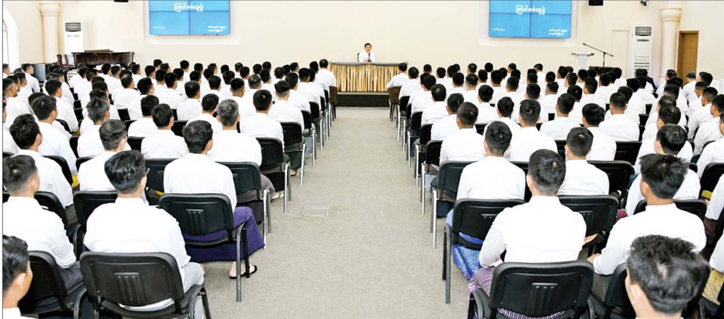
နိုင်ငံတော်စီမံအုပ်ချုပ်ရေးကောင်စီဥက္ကဋ္ဌ နိုင်ငံတော်ဝန်ကြီးချုပ် ဗိုလ်ချုပ်မှူးကြီးမင်းအောင်လှိုင် ရှုရှားဖက်ဒရေးရှင်းနိုင်ငံရှိ မြန်မာ့တပ်မတော်မှ ပညာတော်သင် သင်တန်းသားအရာရှိများအား တွေ့ဆုံအမှာစကားပြောကြားစဉ်။

ခဲ့သဖြင့် တပ်မတော်အနေဖြင့် နိုင်ငံတော်၏တာဝန်များကို ဝင်ရောက်ထိန်းသိမ်းခဲ့ရကြောင်း၊ ပြည်သူ့လူထုတစ်ရပ်လုံးလိုလားသည့် ပါတီစုံဒီမိုကရေစီစနစ်သို့ လျှောက်လှမ်းနိုင်ရေး တပ်မတော်အနေဖြင့် အစဉ်အဆက်ကြိုးပမ်းဆောင်ရွက်ခဲ့ပြီး ဒီမိုကရေစီပထမအကြိမ်ရွေးကောက်ပွဲတွင် ဦးသိန်းစိန်