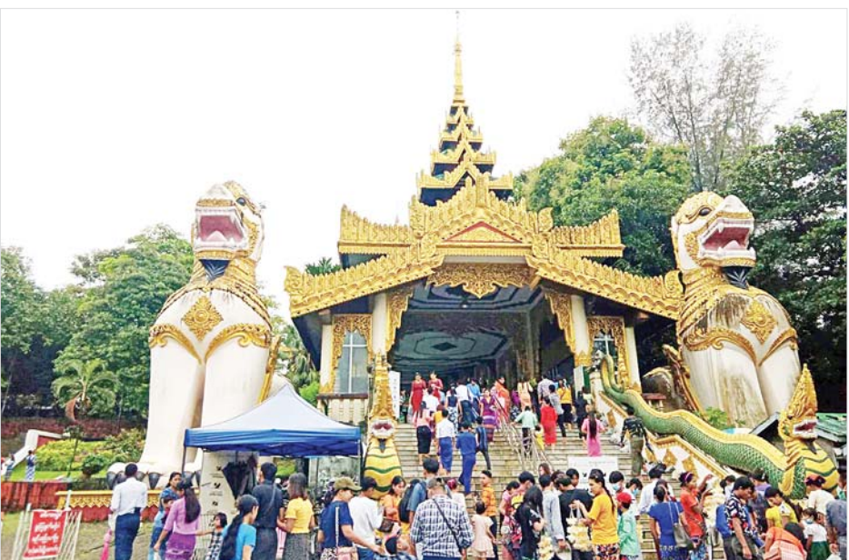
ဝါဆိုလပြည့်(ဓမ္မစကြာအခါတော်နေ့)တွင် လောကချမ်းသာအဘယလာဘမုနိရုပ်ပွားတော်မြတ်ကြီး (ကျောက်တော်ကြီးဘုရား)၌ ကုသိုလ်ကောင်းမှုပြုကြသူများဖြင့် စည်ကားများပြားလျက်ရှိသည်ကို တွေ့ရစဉ်။

အလားတူ ဗိုလ်တထောင်ကျိုက်ဒေးအပ်ဆံတော်ဦးစေတီတော်၊ ဆူးလေစေတီတော်၊ လောကချမ်းသာ အဘယလာဘမုနိရုပ်ပွားတော်မြတ်ကြီး (ကျောက်တော်ကြီးဘုရား)၊ စွယ်တော်မြတ်စေတီတော် (ရန်ကုန်) တို့၌လည်း သက်ဆိုင်ရာစေတီတော် ဂေါပကအဖွဲ့များက ကြီးမှူး၍ ဝါဆိုလပြည့်(ဓမ္မစကြာအခါတော်နေ့) အခမ်းအနားများကို ကျင်းပကြကြောင်း သိရသည်။ သတင်းစဉ်