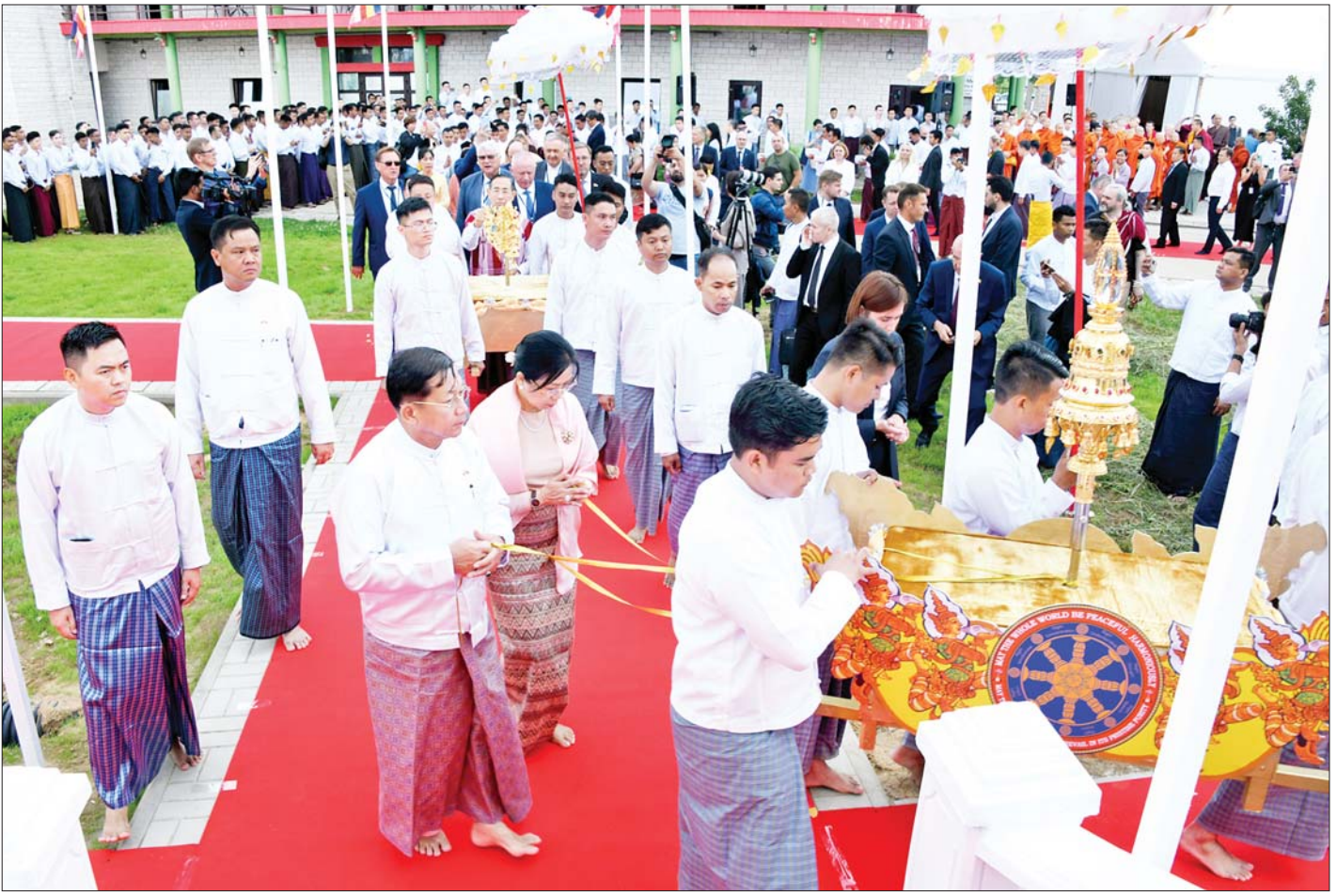
နိုင်ငံတော်စီမံအုပ်ချုပ်ရေးကောင်စီဥက္ကဋ္ဌ နိုင်ငံတော်ဝန်ကြီးချုပ် ဗိုလ်ချုပ်မှူးကြီးမင်းအောင်လှိုင်၊ ဇနီးဒေါ်ကြူကြူလှနှင့် အဖွဲ့ဝင်များ ရတနာစိန်ဖူးတော်၊ ငှက်မြတ်နားတော်တို့ကို ပင့်ဆောင်၍ စေတီတော်ကြီးအား လက်ယာရစ်လှည့်လည်ပူဇော်ကြစဉ်။

နေပြည်တော် ဇူလိုင် ၁၂ ရုရှားဖက်ဒရေးရှင်းနိုင်ငံ မော်စကိုမြို့ ကာလုဂါပြည်နယ် ETHNOMIR ကမ္ဘာ့ယဉ်ကျေးမှုမြို့တော်ရှိ ရွှေစည်းခုံပုံတူစေတီတော်ကြီး ရတနာစိန်ဖူးတော်၊ ငှက်မြတ်နားတော် တင်လှူပူဇော်ပွဲနှင့် ပုဒ္ဓါဘိသေက အနေကဇာတင် မဟာမင်္ဂလာ အခမ်းအနားကို သာသနာတော်နှစ် ၂၅၆၆ ခုနှစ်၊ ကောဇာသက္ကရာဇ် ၁၃၈၄ ခုနှစ်၊ ဝါဆိုလပြည့်နေ့ဖြစ်သည့် ယနေ့ နံနက်ပိုင်းတွင် ကျင်းပပြုလုပ်ရာ သီတဂူကမ္ဘာ့ပုဒ္ဓိတက္ကသိုလ်များ၏ အဓိပတိအဘိဓမ္မမဟာရဋ္ဌဂုရု၊ အဘိဓမ္မ အဂ္ဂမဟာသဒ္ဓမ္မ ဇောတိက၊ မဟာဓမ္မ ကထိက ဗဟုဇနဟိတရေ၊ ရွှေကျင်နိကာယဥက္ကဋ္ဌ ရွှေကျင်သာသနာပိုင် သီတဂူဆရာတော်ဘုရားကြီး ဒေါက်တာဘဒ္ဒန္တဉာဏိသရ၊ နိုင်ငံတော်သံဃမဟာ နာယကအဖွဲ့ ဒုတိယဥက္ကဋ္ဌ ကျောက်မဲဆရာတော် ဒေါက်တာဘဒ္ဒန္တ စန္ဒနသရ၊ တိပိဋကဆရာတော် ဘဒ္ဒန္တ သီလကန္တာဘိဝံသနှင့် အပြည်ပြည်ဆိုင်ရာ ထေရဝါဒပုဒ္ဓိ သာသနာပြုတက္ကသိုလ် ပါမောက္ခချုပ် အဂ္ဂမဟာပဏ္ဍိတ အဂ္ဂမဟာသဒ္ဓမ္မဇောတိကဓမ္မ၊ မဟာဓမ္မကထိက ဗဟုဇနဟိတရေ၊ မဟာဂန္ထဝါစက ပဏ္ဍိတ ဒေါက်တာဘဒ္ဒန္တဆေကိန္ဒ(ဓမ္မဒူတဆရာတော်) တို့ အမှူးပြုသည့် ဆရာတော်၊ သံဃာတော် အရှင်သူမြတ်များ၊ ရုရှားဖက်ဒရေးရှင်းနိုင်ငံမှ Orthodox ဘုန်းတော်ကြီး၊ လားမားဘုန်းတော်ကြီး များ ကြွရောက်ချီးမြှင့်တော်မူကြသည်။