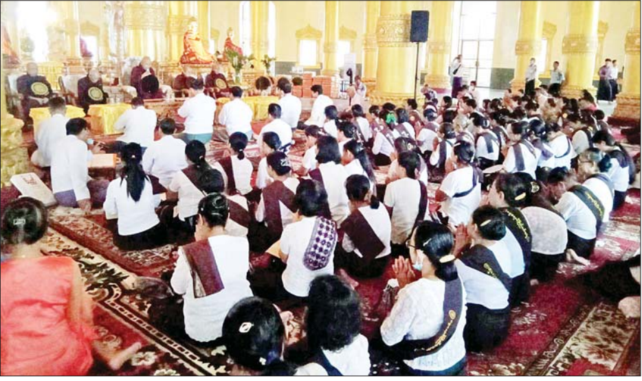
ဝါဆိုလပြည့်(ဓမ္မစကြာအခါတော်နေ့)တွင် စွယ်တော်မြတ်စေတီတော်(ရန်ကုန်)၌ ကုသိုလ်ကောင်းမှုပြုကြသူများဖြင့် စည်ကားများပြားလျက်ရှိသည်ကို တွေ့ရစဉ်။