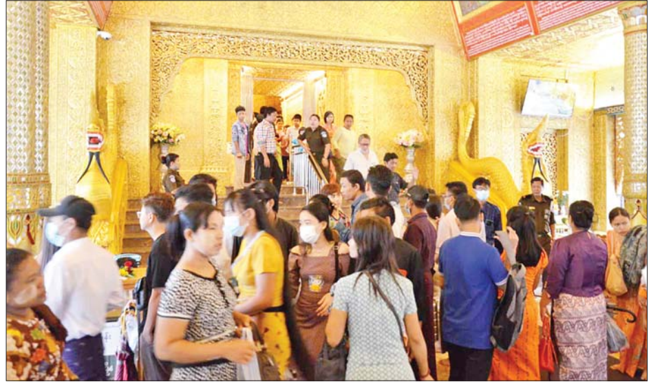
ဝါဆိုလပြည့်(ဓမ္မစကြာအခါတော်နေ့)တွင် ဗိုလ်တထောင် ကျိုက်ဒေးအပ်ဆံတော်ဦးစေတီတော်၌ ကုသိုလ်ကောင်းမှုပြုကြသူများဖြင့် စည်ကားများပြားလျက်ရှိသည်ကို တွေ့ရစဉ်။