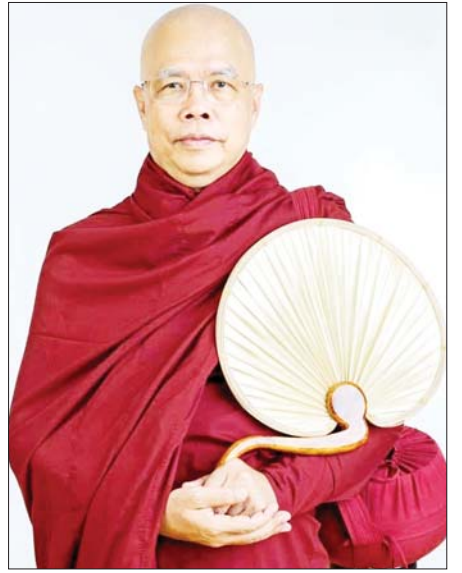
ဓမ္မဒူတ ဒေါက်တာအရှင်ဆေကိန္ဒ၏ အသံတိတ်နဲ့ ကျိတ်ငိုသည်စာအုပ်မှ ဆရာတော်၏ခွင့်ပြုချက်ဖြင့် ကူးယူဖော်ပြပါသည်။