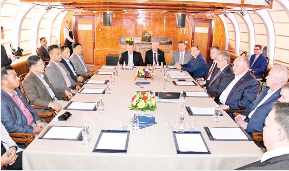
နိုင်ငံတော်စီမံအုပ်ချုပ်ရေးကောင်စီဥက္ကဋ္ဌ နိုင်ငံတော်ဝန်ကြီးချုပ် ဗိုလ်ချုပ်မှူးကြီးမင်းအောင်လှိုင် ဦးဆောင်သည့် ကိုယ်စားလှယ်အဖွဲ့ မော်စကိုမြစ်အတွင်းရှိ သင်္ဘောပေါ်၌ Rosoboronexport ကုမ္ပဏီ အမှုဆောင်အရာရှိချုပ် Mr. Alexander Mikheev ဦးဆောင်သည့် အဖွဲ့ဝင်များနှင့် တွေ့ဆုံဆွေးနွေးစဉ်။

ထို့ပြင် နိုင်ငံတော်စီမံအုပ်ချုပ်ရေးကောင်စီဥက္ကဋ္ဌ နိုင်ငံတော်ဝန်ကြီးချုပ်သည် ညပိုင်းတွင် မော်စကိုမြစ်အတွင်းရှိ သင်္ဘောပေါ်၌ Rosoboronexport ကုမ္ပဏီ အမှုဆောင်အရာရှိချုပ် Mr. Alexander Mikheev (အလက်ဇန်းဒါး မိဇေးယက်ဖ်) ဦးဆောင်သည့် အဖွဲ့ဝင်များနှင့် တွေ့ဆုံဆွေးနွေးခဲ့ပြီး ခရီးစဉ်တွင် လိုက်ပါလာခဲ့သည့် အဖွဲ့ဝင်များနှင့်အတူ မော်စကိုမြစ်အတွင်း သင်္ဘောဖြင့် လှည့်လည်ကြည့်ရှု၍ မော်စကိုမြို့၏ မြို့ပြဖွံ့ဖြိုးတိုးတက်မှုအခြေအနေများကို လေ့လာကြည့်ရှုခဲ့ကြကြောင်း သတင်းရရှိသည်။ သတင်းစဉ်