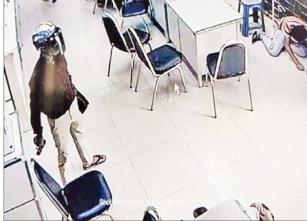
၂၀၂၂ ခုနှစ် ဇွန် ၁၇ ရက်တွင် မန္တလေးတိုင်းဒေသကြီး ချမ်းအေးသာစံမြို့နယ် ပြည်ကြီးမျက်မှန်ရပ်ကွက် (၂၆)လမ်း၊ (၆၂)လမ်းနှင့် (၆၃)လမ်းကြားရှိ ကမ္ဘောဇ ဘဏ်ခွဲ(၉)အား ဓားပြတိုက်ခံရမှု မှတ်တမ်းဓာတ်ပုံ။