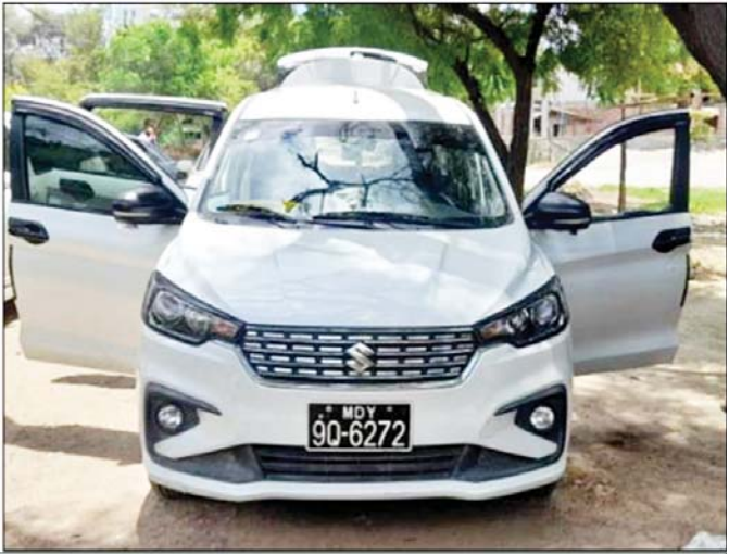
မခင်ရတနာအောင်(သေဆုံး)နှင့် ၎င်းစီးနင်းခဲ့သည့် မော်တော်ယာဉ်ကို တွေ့ရစဉ်။