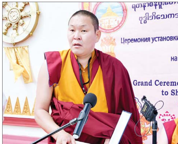
လားမားဘုန်းတော်ကြီး ဝမ်းမြောက်ဩဝါဒစကားမြက်ကြားစဉ်။