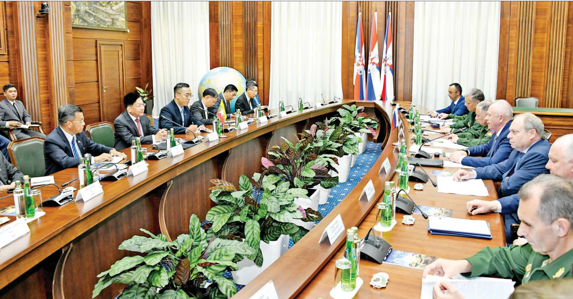
နိုင်ငံတော်စီမံအုပ်ချုပ်ရေးကောင်စီဥက္ကဋ္ဌ တပ်မတော်ကာကွယ်ရေးဦးစီးချုပ် ဗိုလ်ချုပ်မှူးကြီးမင်းအောင်လှိုင် ရုရှားဖက်ဒရေးရှင်းနိုင်ငံ ကာကွယ်ရေးဝန်ကြီးဌာနမှ တာဝန်ရှိသူအကြီးအကဲများနှင့် အလုပ်သဘောတူစာချုပ် ဆွေးနွေးစဉ်။

နေပြည်တော် ဇူလိုင် ၁၂ ရုရှားဖက်ဒရေးရှင်းနိုင်ငံသို့ ရောက်ရှိနေသည့် နိုင်ငံတော်စီမံအုပ်ချုပ်ရေးကောင်စီဥက္ကဋ္ဌ တပ်မတော်ကာကွယ်ရေးဦးစီးချုပ် ဗိုလ်ချုပ်မှူးကြီးမင်းအောင်လှိုင်သည် ရုရှားဖက်ဒရေးရှင်းနိုင်ငံ ကာကွယ်ရေးဝန်ကြီး Army General Sergey Kuzhugotovitch Shoigu ကိုယ်စား ကာကွယ်ရေးဝန်ကြီးဌာနမှ တာဝန်ရှိသူအကြီးအကဲများနှင့် ဇူလိုင် ၁၁ ရက်မွန်းလွဲပိုင်းတွင် ရုရှားဖက်ဒရေးရှင်းနိုင်ငံ ကာကွယ်ရေးဝန်ကြီးဌာန ဧည့်ခန်းမ ဆောင်၌ အလုပ်သဘောတူစာချုပ် ဆွေးနွေးသည်။ စာမျက်နှာ ၂ ကော်လံ ၃ သို့ ၆