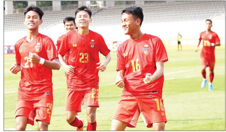
မြန်မာအသင်း ဗီယက်နမ် ယူ-၁၉ ဖိတ်ခေါ်ပြိုင်ပွဲတွင် ဝင်ရောက်ယှဉ်ပြိုင်မည်