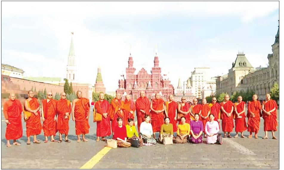
နိုင်ငံတော်စီမံအုပ်ချုပ်ရေးကောင်စီဥက္ကဋ္ဌ နိုင်ငံတော်ဝန်ကြီးချုပ် ဗိုလ်ချုပ်မှူးကြီးမင်းအောင်လှိုင်၏ ဇနီး ဒေါ်ကြူကြူလှနှင့် အဖွဲ့ဝင်များ၊ သံဃာတော်များ ရုရှားနိုင်ငံ မော်စကိုမြို့တွင် ကြည့်ရှုလေ့လာ အမှတ်တရဓာတ်ပုံရိုက်စဉ်။