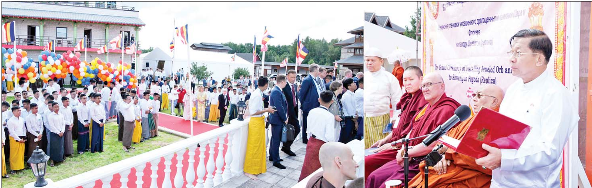
နိုင်ငံတော်စီမံအုပ်ချုပ်ရေးကောင်စီဥက္ကဋ္ဌ နိုင်ငံတော်ဝန်ကြီးချုပ် ဗိုလ်ချုပ်မှူးကြီးမင်းအောင်လှိုင် ဝမ်းမြောက်စကားပြောကြားစဉ်။