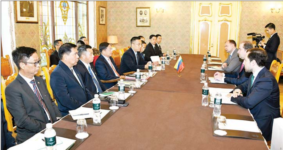
နိုင်ငံတော်စီမံအုပ်ချုပ်ရေးကောင်စီဥက္ကဋ္ဌ နိုင်ငံတော်ဝန်ကြီးချုပ်ဗိုလ်ချုပ်မှူးကြီးမင်းအောင်လှိုင် ဦးဆောင်သည့် ကိုယ်စားလှယ်အဖွဲ့နှင့် ရုရှား-အာဆီယံ စီးပွားရေးကောင်စီဥက္ကဋ္ဌ Mr. Ivan Polyakov ဦးဆောင်သည့် ကိုယ်စားလှယ် အဖွဲ့အား ခေတ္တတည်းခိုနေထိုင်

ကြီး ရတနာစိန်ဖူးတော်၊ ငှက်မြတ် နားတော်၊ ရွှေထီးတော် တင်လှူ ပူဇော်ခြင်းနှင့် ဗုဒ္ဓါဘိသေက အနောက်ဘက် မင်္ဂလာအခမ်း အနားသို့ တက်ရောက်ရန်အတွက် နိုင်ငံတော်စီမံအုပ်ချုပ်ရေးကောင်စီ ဥက္ကဋ္ဌ နိုင်ငံတော်ဝန်ကြီးချုပ် ဦးဆောင်သည့် ကိုယ်စားလှယ် အဖွဲ့သည် ရုရှားဖက်ဒရေးရှင်း နိုင်ငံသို့ ဇူလိုင် ၁၀ ရက် နံနက်ပိုင်း တွင် အပြည်ပြည်ဆိုင်ရာ မြန်မာ လေကြောင်း(MAI)မှ အထူး လေယာဉ်ဖြင့် နေပြည်တော် တပ်မတော်လေဆိပ်မှ ထွက်ခွာ ခဲ့ပြီး ယင်းနေ့ ဒေသစံတော်ချိန် ညနေပိုင်းတွင် မော်စကိုမြို့၊ Sheremetyevo (ရှလ်ယယ် မြက်ဂျာ) အပြည်ပြည်ဆိုင်ရာ လေဆိပ်သို့ ရောက်ရှိခဲ့ရာ