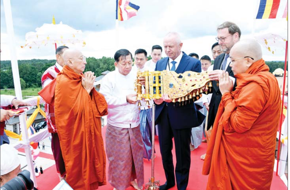
နိုင်ငံတော်စီမံအုပ်ချုပ်ရေးကောင်စီဥက္ကဋ္ဌ နိုင်ငံတော်ဝန်ကြီးချုပ် ဗိုလ်ချုပ်မှူးကြီးမင်းအောင်လှိုင်နှင့် အဖွဲ့ဝင်များ ရတနာစိန်ဖူးတော်၊ ငှက်မြတ်နားတော်တို့ကို အမွှေးနံ့သာရည်များဖြင့် ပက်ဖျန်းပြီး စေတီတော်အထွတ်သို့ ပင့်ဆောင်တပ်ဆင်ပူဇော်စဉ်။