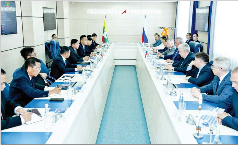
နိုင်ငံတော်စီမံအုပ်ချုပ်ရေးကောင်စီဥက္ကဋ္ဌ နိုင်ငံတော်ဝန်ကြီးချုပ် ဗိုလ်ချုပ်မှူးကြီးမင်းအောင်လှိုင် ဦးဆောင်သည့် ကိုယ်စားလှယ်အဖွဲ့ ရုရှားနိုင်ငံသမ္မတ၏ နိုင်ငံတကာအကာသဆိုင်ရာ အထူးသံတမန်နှင့် “Roscosmos” ၏ အထွေထွေညွှန်ကြားရေးမှူးချုပ်ဖြစ်သူ Dr. Dmitry Rogozin ဦးဆောင်သည့်အဖွဲ့ဝင်များနှင့် တွေ့ဆုံဆွေးနွေးစဉ်။