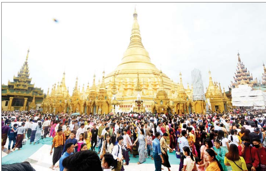
ဝါဆိုလပြည့်(ဓမ္မစကြာအခါတော်နေ့)တွင် ရွှေတိဂုံစေတီတော်မြတ်ကြီး၌ ကုသိုလ်ကောင်းမှုပြုကြသူများဖြင့် စည်ကားများပြားလျက်ရှိသည်ကို တွေ့ရစဉ်။

ဆက်လက်၍ ဝါဆိုသင်္ကန်းကပ်လှူပူဇော်ပွဲနှင့် (ဓမ္မစကြာအခါတော်နေ့) ရေစက်ချ မင်္ဂလာခမ်းအနားကို ကျင်းပရာ အခမ်းအနားသို့ ရွှေတိဂုံစေတီတော် ဘဏ္ဍာတော်ထိန်း ဂေါပကအဖွဲ့၏ ဩဝါဒါစရိယ ဆရာတော်ကြီးများနှင့် ပင့်သံဃာတော်များ