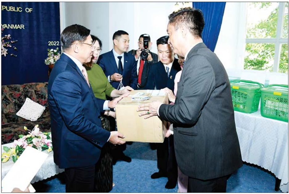
နိုင်ငံတော်စီမံအုပ်ချုပ်ရေးကောင်စီဥက္ကဋ္ဌ နိုင်ငံတော်ဝန်ကြီးချုပ် ဗိုလ်ချုပ်မှူးကြီးမင်းအောင်လှိုင်နှင့် ဇနီး ဒေါ်ကြူကြူလှတို့ သံရုံး၊ စစ်သံရုံးမိသားစုများအတွက် အမှတ်တရလက်ဆောင်ပစ္စည်းများ ပေးအပ်ရာ သံအမတ်ကြီး ဦးလွင်ဦးနှင့် သံရုံး၊ စစ်သံရုံးတို့မှ တာဝန်ရှိသူများက လက်ခံရယူစဉ်။

များကိုလည်း အဆင်ပြေချောမွေ့စေရေး ချိတ်ဆက်ဆောင်ရွက်ပေးကြရမည်ဖြစ်ကြောင်း၊ မိမိတို့၏တာဝန်များကို ကျေပွန်စွာ ထမ်းဆောင်ပြီး တစ်ဦးနှင့်တစ်ဦး ဖေးမကူညီကာ ထိန်းထိန်းသိမ်းသိမ်းဖြင့် ဝိုင်းဝန်းကြိုးပမ်းဆောင်ရွက်ကြရမည်ဖြစ်ကာ နိုင်ငံနှင့်လူမျိုး၏ ဂုဏ်သိက္ခာကို