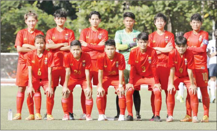
မြန်မာအမျိုးသမီးအသင်း ကစားသမားများကို တွေ့ရစဉ်။