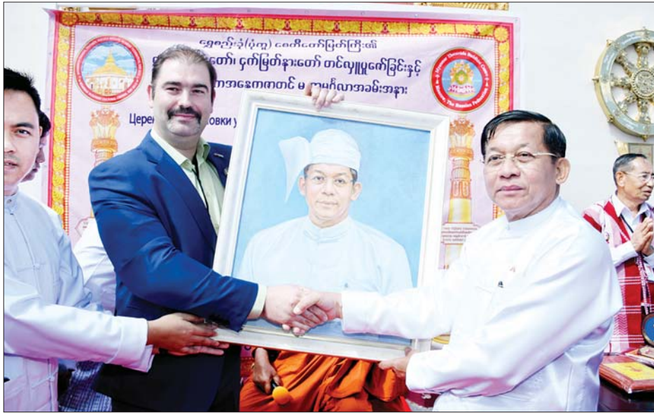
နိုင်ငံတော်စီမံအုပ်ချုပ်ရေးကောင်စီဥက္ကဋ္ဌ နိုင်ငံတော်ဝန်ကြီးချုပ် ဗိုလ်ချုပ်မှူးကြီးမင်းအောင်လှိုင် အား ရှုရှားရှုခင်းပန်းချီပညာရှင် Mr. Alexander Alexandrovich Shilov က ကိုယ်တိုင်ရေးဆွဲထားသည့် ပုံတူပန်းချီအား အမှတ်တရလက်ဆောင်အဖြစ် ပေးအပ်စဉ်။

ယင်းနောက် နိုင်ငံတော်စီမံအုပ်ချုပ်ရေးကောင်စီဥက္ကဋ္ဌ နိုင်ငံတော်ဝန်ကြီးချုပ်နှင့် ဇနီးနှင့် အဖွဲ့ဝင်များသည် ဆရာတော်၊ သံဃာတော်များအား နေ့ဆွမ်းဆက်ကပ်လှူဒါန်းကြပြီး အခမ်းအနားတက်ရောက်လာကြသူများအား နေ့လယ်စာဖြင့် တည်ခင်းဧည့်ခံခဲ့သည်။ နေ့လယ်စာသုံးဆောင်အပြီးတွင် နိုင်ငံတော်