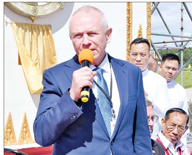
ရှုရှားကာကွယ်ရေးဝန်ကြီးဌာန ဒုတိယဝန်ကြီး အလက်ဇန်ဒါးဗားစီးလီယယ်ဗစ် ဖိုမင် ဝမ်းမြောက်စကားပြောကြားစဉ်။

တော်ကြီး ရတနာစိန်ဖူးတော်၊ ငှက်မြတ်နားတော် တင်လှူပူဇော်ပွဲနှင့် ဗုဒ္ဓါဘိသေက အနေကဇာတင် မဟာမင်္ဂလာအခမ်းအနား အောင်မြင်စွာ ပြီးမြောက်ခြင်းအဖြစ် ဝမ်းမြောက်ဩဝါဒစကားမြက်ကြားသည်။