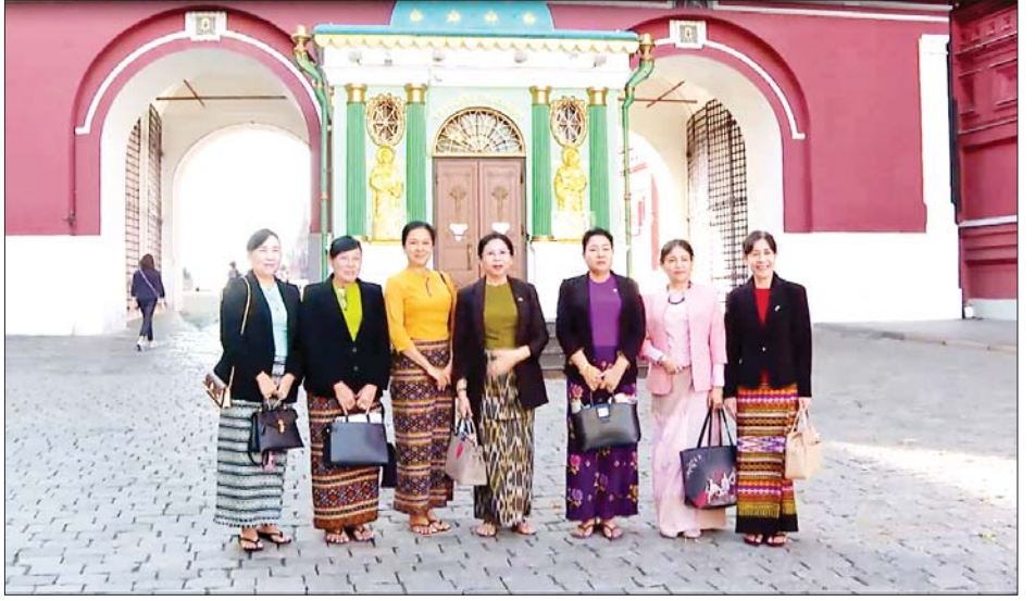
နိုင်ငံတော်စီမံအုပ်ချုပ်ရေးကောင်စီဥက္ကဋ္ဌ နိုင်ငံတော်ဝန်ကြီးချုပ် ဗိုလ်ချုပ်မှူးကြီးမင်းအောင်လှိုင်၏ ဇနီး ဒေါ်ကြူကြူလှနှင့် အဖွဲ့ဝင်များ ရုရှားနိုင်ငံ မော်စကိုမြို့တွင် ကြည့်ရှုလေ့လာ အမှတ်တရဓာတ်ပုံရိုက်စဉ်။