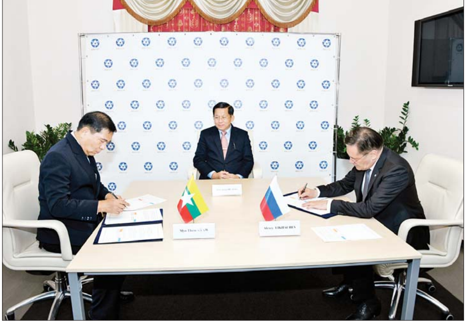
ပြည်ထောင်စုသမ္မတ မြန်မာနိုင်ငံတော် သိပ္ပံနှင့်နည်းပညာဝန်ကြီးဌာနနှင့် ရုရှားဖက်ဒရေးရှင်းနိုင်ငံ Rosatom State Corporations တို့ နားလည်မှုစာချုပ်လွှာတစ်ရပ်ကို အတည်ပြုလက်မှတ်ရေးထိုးစဉ်။

ရုရှားနိုင်ငံဆိုင်ရာ မြန်မာနိုင်ငံ သံအမတ်ကြီး ဦးလွင်ဦး၊ စစ်သံမှူး ဗိုလ်မှူးချုပ်မှူးကျော်နှင့် တာဝန် ရှိသူများက လေဆိပ်၌ ကြိုဆို နှုတ်ဆက်ကြသည်။ ရုရှား-မြန်မာ ချစ်ကြည် ရေးအသင်းဥက္ကဋ္ဌနှင့်တွေ့ဆုံ နိုင်ငံတော် စီမံအုပ်ချုပ်ရေး ကောင်စီဥက္ကဋ္ဌ နိုင်ငံတော်ဝန်ကြီး ချုပ်နှင့် ကိုယ်စားလှယ်အဖွဲ့သည် ယင်းနေ့ ညနေပိုင်းတွင် ခေတ္တ တည်းခိုသည့် မော်စကိုမြို့၊ Metropol ဟိုတယ် ဧည့်ခန်းမ ဆောင်၌ ရုရှား-မြန်မာ ချစ်ကြည် ရေးအသင်းဥက္ကဋ္ဌ Mr. Dmitriev Mikhail Arkadievich ဦးဆောင် သည့် ကိုယ်စားလှယ်အဖွဲ့နှင့် နှစ်နိုင်ငံစီးပွားရေးဆိုင်ရာ ပူးပေါင်း ဆောင်ရွက်မှု မြှင့်တင်ရေး၊