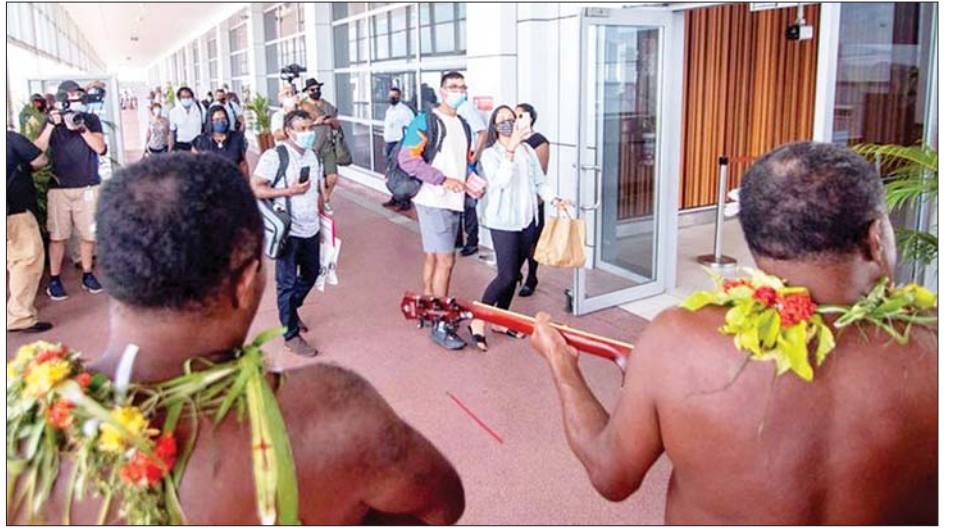
ဖီဂျီနိုင်ငံ သည် ၂၀၂၀ ပြည့်နှစ်မတ်လတွင် ကိုဗစ်-၁၉ ကို ပိတ်ပင်ခဲ့ခြင်းဖြစ်သည်။ ရောဂါစတင်ဖြစ်ပွားပြီးနောက် ခရီးသွားဝင်ရောက်မှု ကိုးကား-ဆင်ဟွာ၊ ဘာသာပြန်-အလင်းသစ်

ဖီဂျီနိုင်ငံသည် နယူးဇီလန်၊ ဩစတြေးလျ၊ ဗြိတိန်နှင့် အမေရိကန်နိုင်ငံတို့အပါအဝင် ခရီးသွား မိတ်ဖက်နိုင်ငံများမှ ကာကွယ်ဆေးထိုးနှံပြီးသူများ အား ၂၀၂၁ ခုနှစ် ဒီဇင်ဘာလမှစတင်ကာ နိုင်ငံအတွင်း ပြန်လည်ဝင်ရောက်ခွင့်ပြုထားကြောင်း သိရသည်။