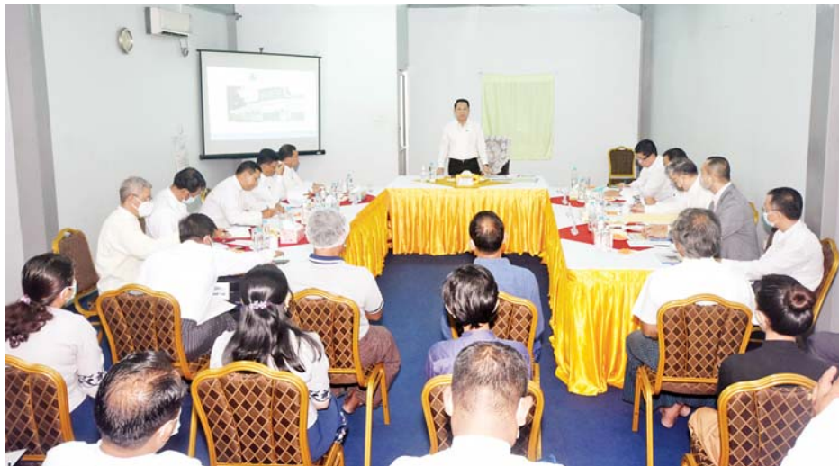
ပြည်ထောင်စုဝန်ကြီး ဦးမောင်မောင်အုန်း ရန်ကုန်မြို့ ဗဟန်းမြို့နယ် ငါးထပ်ကြီးဘုရားလမ်းရှိ The Global New Light of Myanmar သတင်းစာတိုက်ဝန်ထမ်းများအား တွေ့ဆုံအမှာစကားပြောကြားစဉ်။

ထို့နောက် ပြည်ထောင်စုဝန်ကြီးက The Global New Light of Myanmar သတင်းစာ၏ အနာဂတ် တွင် ပုံဖော်လိုသည့်အနေအထားကို ဆွေးနွေးပြီး ယခုထက်ပိုမိုကောင်းမွန်သည့် အနေအထားကို ရောက်အောင် ဆောင်ရွက်သွားရမည်ဖြစ်ကြောင်း၊ ပြန်ကြားရေးဝန်ကြီးဌာနအနေဖြင့် သတင်းမှန်များကို ပြည်သူများထံ နည်းလမ်းပေါင်းစုံဖြင့် ရောက်ရှိအောင် ဆောင်ရွက်နေသည့်အတွက် သတင်းများကို ဖတ်ချင်