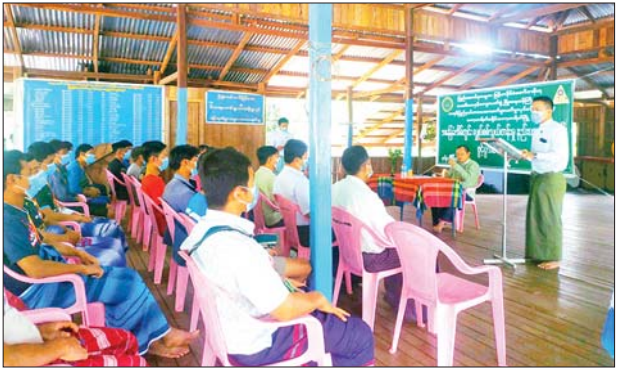
ရက်အထိ ၁၅ ရက်ကြာ ဖွင့်လှစ် သင်ကြားပေးမည်ဖြစ်ပြီး အခြေခံ လျှပ်စစ်ကို နည်းလမ်း မှန်ကန်စွာ တတ်မြောက်စေရန်၊ လက်သုံးကိရိယာများ အသုံးပြုပုံ နှင့် ဂရုတစိုက်ထိန်းသိမ်းတတ် စေရန်၊ စမ်းသပ်စစ်ဆေးနည်းနှင့် ပြစ်ချက်ရှိသောနေရာ ရှာဖွေ တတ်မြောက်စေရန်၊ အန္တရာယ် ကင်းရှင်းရေးကို ကြိုတင်တွေးဆ သိရှိရန်နှင့် ကာကွယ်နိုင်စေရန်၊ အိမ်တွင်းသုံးလျှပ်စစ်ပစ္စည်းများ စောမျိုးမင်းသိန်း(ပြန်/ဆက်)

ဘားအံ ဇူလိုင် ၆ သမဝါယမနှင့် ကျေးလက်ဖွံ့ဖြိုး ရေးဝန်ကြီးဌာန ကော့ကရိတ်ခရိုင် အသေးစားစက်မှုလက်မှုလုပ်ငန်း ဦးစီးဌာန အခြေခံအိမ်တွင်း လျှပ်စစ် သွယ်တန်းမှုနည်း ပညာသင်တန်းကို ယနေ့နံနက် ၁၀ နာရီက ကော့ကရိတ်မြို့နယ် ရန်ကုတ်ကျေးရွာ ရန်ကုတ် ဘုန်းတော်ကြီးကျောင်းဓမ္မာရုံ၌ ကျင်းပသည်။ သင်တန်းဖွင့်ပွဲတွင် ကော့ကရိတ် ခရိုင်အုပ်ချုပ်ရေးမှူးက အမှာ စကားပြောကြားပြီး အသေးစား စက်မှုလက်မှုလုပ်ငန်း ဦးစီးဌာန ခရိုင်ဦးစီးမှူးက သင်တန်းဖွင့် လှစ်ခြင်း၏ ရည်ရွယ်ချက်များ ကို ရှင်းလင်းပြောကြားသည်။ အဆိုပါသင်တန်းကို ရန်ကုတ် ကျေးရွာ ရန်ကုတ်ဘုန်းတော် ကြီးကျောင်း ဓမ္မာရုံ၌ သင်တန်း သား၂၀ ဖြင့် ဇူလိုင် ၆ ရက်မှ၂၀