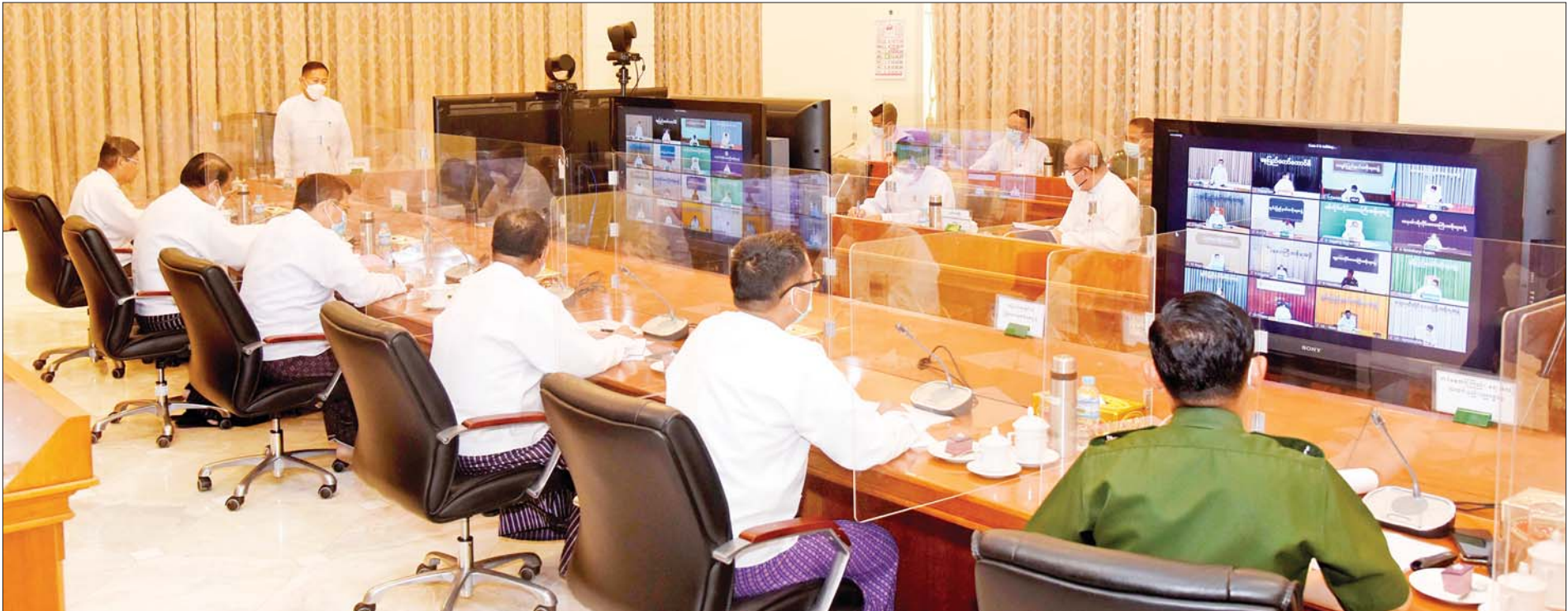
နိုင်ငံတော်စီမံအုပ်ချုပ်ရေးကောင်စီဒုတိယဥက္ကဋ္ဌ ဒုတိယဝန်ကြီးချုပ် ဒုတိယဗိုလ်ချုပ်မှူးကြီးစိုးဝင်း ရွေးကောက်ပွဲအတွက် မဲစာရင်းပြုစုရေးဆိုင်ရာ လုပ်ငန်းညှိနှိုင်းအစည်းအဝေးတွင် အမှာစကားပြောကြားစဉ်။