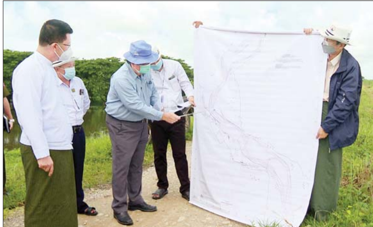
တိုင်းဒေသကြီးဦးစီးမှူးက ဧရာဝတီမြစ်၊ ဟင်္သာတမြစ်ကြောင်းအခြေအနေများ၊ အလျားပေ ၂၀၀၀ တာဝန်-ဖောင်ဆိပ် ဧရာဝတီမြစ်ကမ်းပါး အခြေအနေများ၊ တိုက်စားမှုကြောင့် လုပ်ငန်းများအဖြစ် အလျားပေ ၂၀၀၀ အခြေအနေများ၊ တိုက်စားမှုကြောင့် Floating unit ဆောင်ရွက်မည့် ဧရာဝတီမြစ်ရေ ဖောင်ဆိပ်ဖြတ်

ပုသိမ် ဇူလိုင် ၆ ဧရာဝတီတိုင်းဒေသကြီး ဝန်ကြီးချုပ် ဦးတင်မောင်ဝင်းသည် တိုင်းဒေသကြီး ဝန်ကြီးများ၊ တိုင်းဒေသကြီး၊ ခရိုင်၊ မြို့နယ်အဆင့် ဌာနဆိုင်ရာများနှင့်အတူ ယနေ့နံနက်ပိုင်းက ဟင်္သာတမြို့နယ် အိပ်ပျက်ကျေးရွာအုပ်စု ဖောင်ဆိပ် ကျေးရွာအနီးရှိ ဧရာဝတီ-ဟင်္သာတတာ တာတိုင် ၄/၆ တွင် ဧရာဝတီမြစ်၏ မြစ်ကမ်းပါးသို့ ဦးတည်တိုက်စားမှု အခြေအနေကို သွားရောက်ကြည့်ရှု စစ်ဆေးသည်။ ရှေးဦးစွာ တိုင်းဒေသကြီး ရေအရင်း အမြစ်နှင့် မြစ်ချောင်းများဖွံ့ဖြိုးတိုးတက် ရေးဦးစီးဌာန တိုင်းဒေသကြီးဆည်မြောင်း နှင့် ရေအသုံးချမှု စီမံခန့်ခွဲရေးဦးစီးဌာန