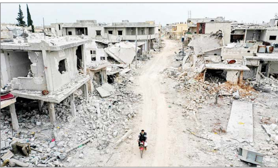
ဆီးရီးယားနိုင်ငံ အိမ်လစ်ပြည်နယ် အာဖစ်မြို့၌ ပြင်းထန်သော တိုက်ခိုက်မှုများနှင့် လေကြောင်းတိုက်ခိုက်မှုများကြောင့် ကြီးမားစွာ ပျက်စီးဆုံးရှုံးခဲ့မှုများ။