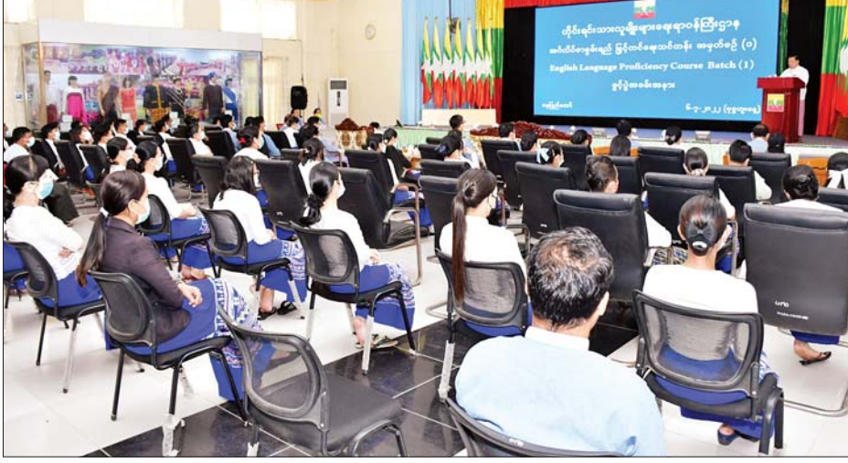
ကာလ တစ်လကြာ ဖွင့်လှစ် ယနေ့ခေတ်တွင် ပညာရပ် ရေးသားထားသည့် ဖြစ်ရာ သင်ကြားသွားမည်ဖြစ်ပါကြောင်း၊ အများစုကို အင်္ဂလိပ်ဘာသာဖြင့် အင်္ဂလိပ်စာကို ကျွမ်းကျင်မှသာ

နေပြည်တော် ဇူလိုင် ၆ တိုင်းရင်းသားလူမျိုးများရေးရာ ဝန်ကြီးဌာန အင်္ဂလိပ်စာစွမ်းရည် မြှင့်တင်ရေးသင်တန်း အမှတ်စဉ် (၁) ဖွင့်ပွဲအခမ်းအနားကို ယနေ့ နံနက်ပိုင်းတွင် တိုင်းရင်းသားလူမျိုး များရေးရာ ဝန်ကြီးဌာန အစည်း အဝေးခန်းမ၌ ကျင်းပသည်။ ဦးစွာ ပြည်ထောင်စု ဝန်ကြီး ဦးစောထွန်းအောင်မြင့်က အင်္ဂလိပ်စာ စွမ်းရည်မြှင့်တင်ရေး သင်တန်းအမှတ်စဉ်(၁) (English Language Proficiency Course- Batch 1) ကို ဇူလိုင် ၆ ရက်မှ ကာလ တစ်လကြာ ဖွင့်လှစ် ယနေ့ခေတ်တွင် ပညာရပ် ရေးသားထားသည့် ဖြစ်ရာ သင်ကြားသွားမည်ဖြစ်ပါကြောင်း၊ အများစုကို အင်္ဂလိပ်ဘာသာဖြင့် အင်္ဂလိပ်စာကို ကျွမ်းကျင်မှသာ