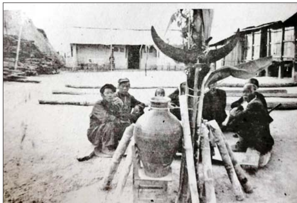
“ဝ” တိုင်းရင်းသားတို့၏အိမ်သစ်တက်ပွဲအတွက် ပြင်ဆင်ထားမှု။

“ဝ” တိုင်းရင်းသားသွေးချင်းသည် နေအိမ်ဆောက်လုပ်ပြီး လှေကားတပ်ဆင်ပြီးသည်နှင့် အိမ်သစ်တက်ပွဲကို ကျင်းပလေ့ရှိသည်။ အိမ်သစ်တက်ပွဲတွင် အိမ်ရှင်က အိမ်ဆောက်လုပ်ရာတွင်ကူညီသူများ နှင့် အိမ်သစ်တက်ပွဲလာသူများအား “ဝ” ဆန်ပြုတ် သို့မဟုတ် ထမင်း ကျွေး၍ ခေါ်ရသည်။