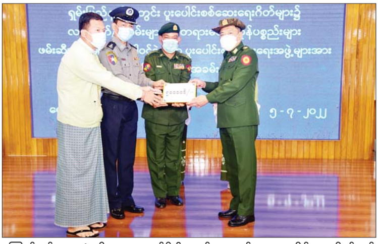
ရှမ်းပြည်နယ်အစိုးရရုံးတွင် ပူးပေါင်းစစ်ဆေးရေးဂိတ်များ၌ လက်နက်/ခဲယမ်းများနှင့် တရားမဝင်ကုန်ပစ္စည်းများ ဖမ်းဆီးရမိမှုများတွင် ပါဝင်ခဲ့သော ပူးပေါင်းစစ်ဆေးရေးအဖွဲ့များအား ဂုဏ်ပြုချီးမြှင့်ပေးနေသည့် အခမ်းအနားပွဲ။

ဆောင်ရွက်လျက်ရှိရာ ယခုပူးပေါင်း စစ်ဆေးရေးဂိတ်များတွင် တာဝန် ထမ်းဆောင်နေသည့် တပ်မတော်သား များ၊ မြန်မာနိုင်ငံရဲတပ်ဖွဲ့ဝင်များ၊ ပူးပေါင်း စစ်ဆေးရေးအဖွဲ့များသည် တည်ငြိမ် အေးချမ်းရေးကို ထိခိုက်စေမည့် လက်နက်များကို ဖမ်းမိခဲ့ကြောင်း၊ ပူးပေါင်းစစ်ဆေးရေးအဖွဲ့ ကိုလည်း ကျေးဇူးတင်ရှိကြောင်း၊ ပူးပေါင်း ဆောင်ရွက်ပေးသည့်အဖွဲ့များကို ယနေ့ အခမ်းအနားတွင် ဂုဏ်ပြုပေးခြင်းဖြစ် ကြောင်း၊ နောင်တွင်လည်း အားလုံး ပူးပေါင်းဆောင်ရွက်၍ ဖော်ထုတ်ပေးကြ ရန်နှင့် ပြည်နယ်အတွက်သာမက နိုင်ငံတော်အတွက်ပါ ဂုဏ်ယူမိပါ