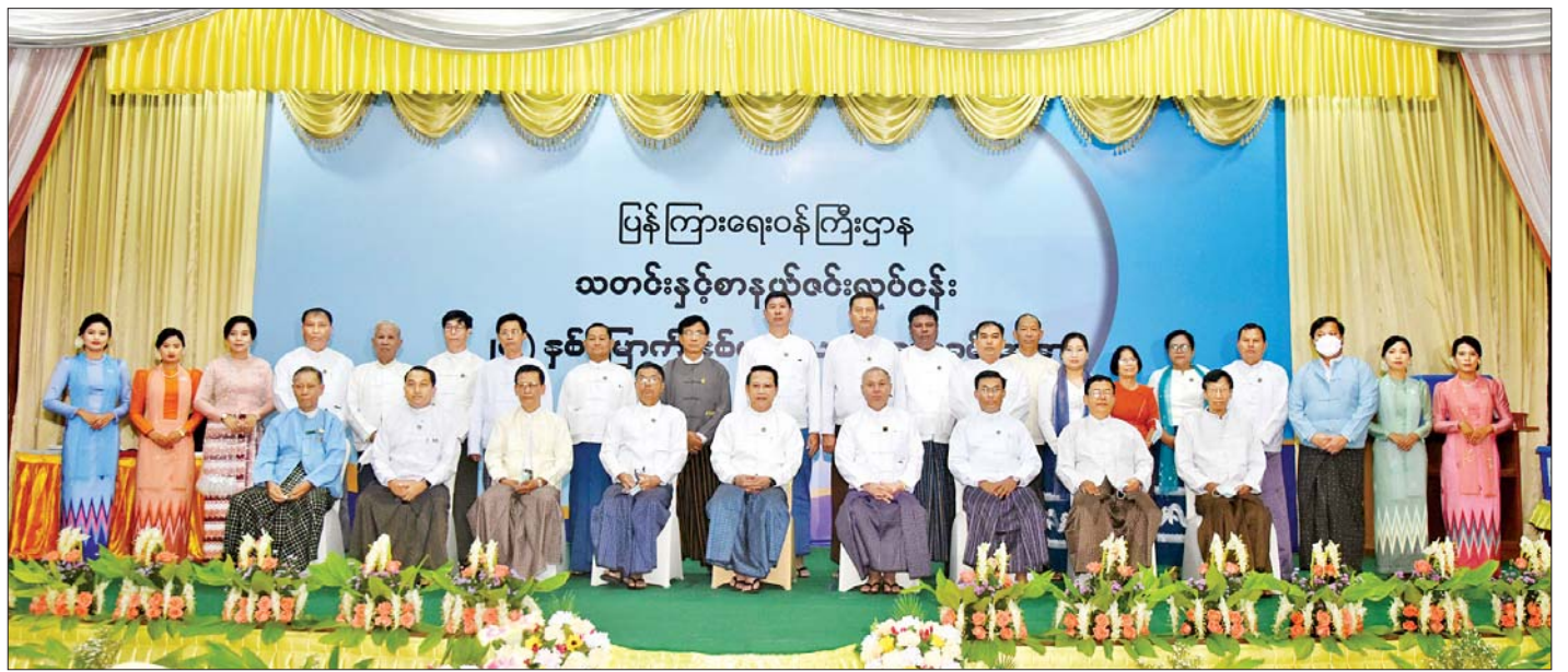
ပြည်ထောင်စုဝန်ကြီး ဦးမောင်မောင်အုန်း သတင်းနှင့်စာနယ်ဇင်းလုပ်ငန်း၏ (၂၄)နှစ်မြောက် နှစ်ပတ်လည်နေ့အခမ်းအနားသို့ တက်ရောက်လာကြသူများ နှင့်အတူ စုပေါင်းမှတ်တမ်းတင်ဓာတ်ပုံရိုက်စဉ်။

အခမ်းအနားတွင် ပြန်ကြားရေးဝန်ကြီးဌာန ပြည်ထောင်စုဝန်ကြီး ဦးမောင်မောင်အုန်းက ပြန်ကြားရေးဝန်ကြီးဌာန၏ ဌာနကြီးတစ်ခုဖြစ်သည့် သတင်းနှင့်စာနယ်ဇင်းလုပ်ငန်းသည် ၁၉၇၂ ခုနှစ်တွင် သတင်းနှင့်စာနယ်ဇင်း ကော်ပိုရေးရှင်းအဖြစ် ဖွဲ့စည်း ထားရာမှ ၁၉၉၈ ခုနှစ် ဧပြီ ၁ ရက်တွင် သတင်းနှင့် စာနယ်ဇင်းလုပ်ငန်းအဖြစ် ပြောင်းလဲဖွဲ့စည်းခဲ့သည့် အတွက် ယခုအခါ ၂၄ နှစ်တာကာလကို ကျော်ဖြတ် နိုင်ခဲ့ပြီးဖြစ်ကြောင်း၊ ၂၄ နှစ်ပြည့်မြောက်သည့် ကာလတွင် ဘယ်လိုတိုးတက်မှုတွေ့ အောင်မြင်မှုတွေ့ ရှိခဲ့သလဲ၊ ဘယ်လိုအခက်အခဲတွေ့ စိန်ခေါ်မှုတွေ့ရှိခဲ့ သလဲဆိုတာတွေကို ပြန်လည်သုံးသပ်ကြည့်ရှုမှာဖြစ် သလို အနာဂတ်ကို ဘယ်လိုဆက်သွားရမယ်ဆိုတာ တွေကို မြှော်တွေးလုပ်ကိုင်ကြမှာဖြစ်ကြောင်း။