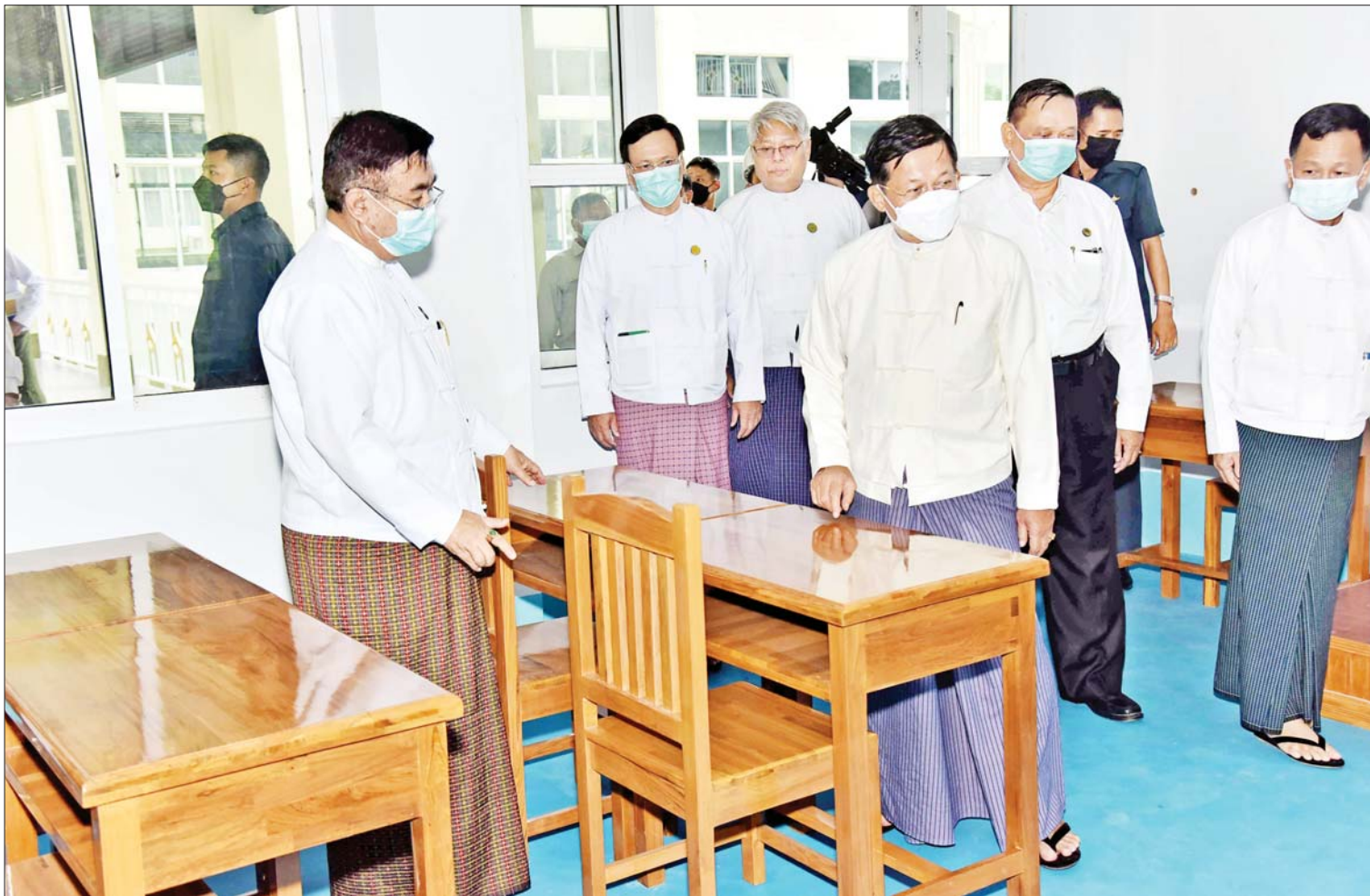
နိုင်ငံတော်စီမံအုပ်ချုပ်ရေးကောင်စီဥက္ကဋ္ဌ နိုင်ငံတော်ဝန်ကြီးချုပ် ဗိုလ်ချုပ်မှူးကြီး မင်းအောင်လှိုင် Naypyitaw State Academy Main အဆောက်အအုံကြီးအတွင်း လှည့်လည်ကြည့်ရှုစစ်ဆေးစဉ်။

NSA တွင် ရွေးချယ်ထားသော ဝိဇ္ဇာ / သိပ္ပံဘာသာရပ်များ၊ စီးပွားရေး၊ ဥပဒေ၊ လူမှုရေး၊ အားကစားနှင့် ဆေးပညာရပ်များ သင်ကြားသွားမည်