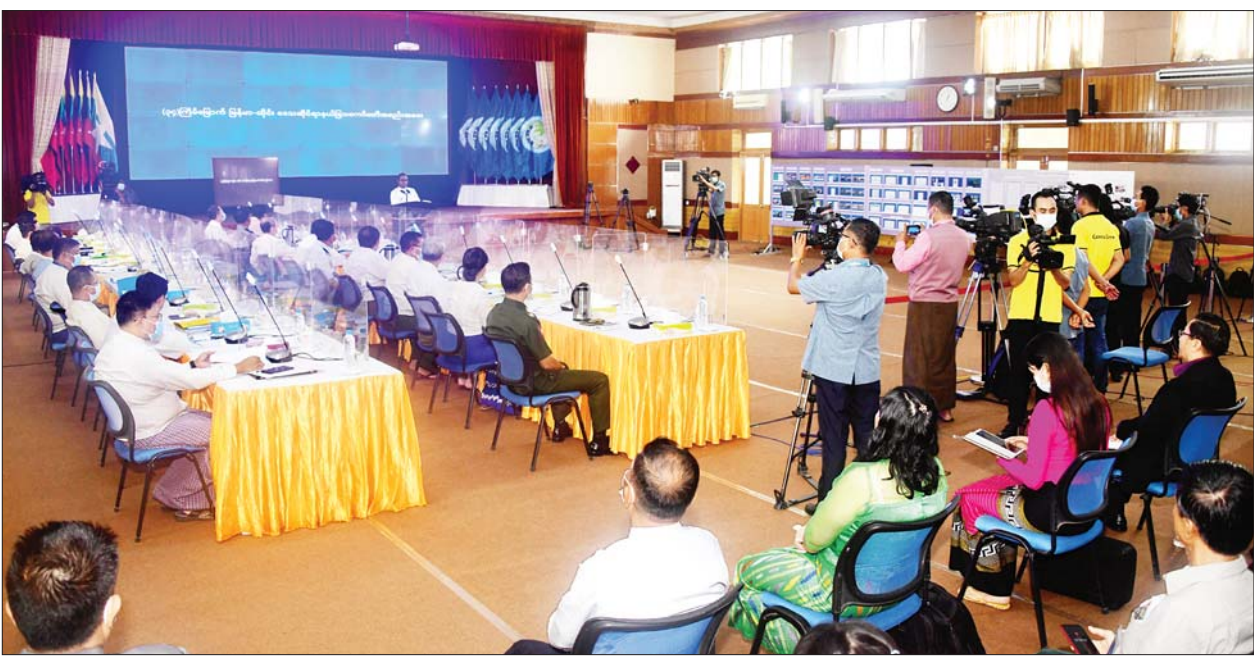
နိုင်ငံတော်စီမံအုပ်ချုပ်ရေးကောင်စီ သတင်းထုတ်ပြန်ရေးအဖွဲ့၏ (၁၇)ကြိမ်မြောက် သတင်းစာရှင်းလင်းပွဲပြုလုပ်စဉ်။

MNL အမှတ်ပေးပြိုင်ပွဲ ပွဲစဉ် (၂) ယနေ့ စတင်ကျင်းပမည် ရန်ကုန် ဇူလိုင် ၁ ၂၀၂၂ ရာသီ MNL အမှတ်ပေးပြိုင်ပွဲ ပွဲစဉ်(၂)ကို ဇူလိုင် ၂ ရက် စတင်ကျင်းပသွားမည်ဖြစ်သည်။ ယင်းပြိုင်ပွဲကို တစ်ပတ်လျှင် ငါးရက်နှုန်းဖြင့် ကျင်းပလျက်ရှိပြီး ပွဲစဉ်(၂)အဖြစ် ဇူလိုင် ၂ ရက်တွင် ဟံသာဝတီအသင်းနှင့် မဟာယူနိုက်တက် အသင်း၊ ဇူလိုင် ၃ ရက်တွင် ဧရာဝတီအသင်းနှင့် ရခိုင်အသင်း၊ ဇူလိုင် ၄ ရက်တွင် မြဝတီအသင်းနှင့် အား/ကာသိပွဲအသင်း၊ ဇူလိုင် ၆ ရက်တွင် ရှမ်းယူနိုက်တက်အသင်းနှင့် GFA အသင်း၊ ဇူလိုင် ၇ ရက်တွင် ရန်ကုန် အသင်းနှင့် ရတနာပုံအသင်းတို့ ယှဉ်ပြိုင်ကစားမည်ဖြစ်သည်။ စာမျက်နှာ ၂၁ ကော်လံ ၁ သို့ ○