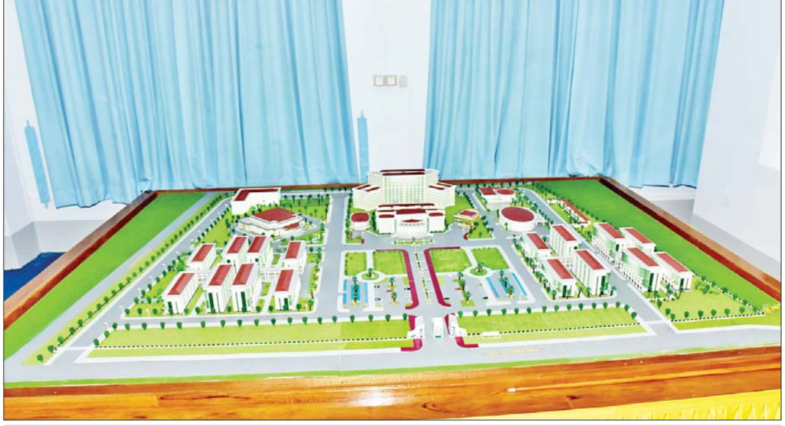
Naypyitaw State Academy(NSA)စီမံကိန်းပုံစံငယ်ကို တွေ့ရစဉ်။