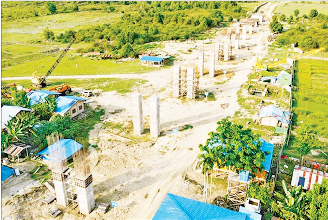
ထမံသီတံတား တည်ဆောက်ရေးစီမံကိန်းကို တွေ့ရစဉ်။

စိမ်းစိုနေသည့်တောတောင်၊ သန့်စင်လတ်ဆတ်သည့် လေထုနှင့် ရိုးသားစွာနေထိုင်တတ်ကြသည့် နာဂရိုးရာယဉ်ကျေးမှုများသည် ခရီးသွားပြည်သူနှင့် အကျွမ်းတဝင် မထိတွေ့ရသေးပေ။ ရင်သပ်ရှုမောဖွယ် လှပသည့်တောင်တန်းများကပင် သွားရေးလာရေးခက်ခဲစေရန်အတားအဆီးဖြစ်နေပြီး နာဂဒေသဖွံ့ဖြိုးမှုကို အဟန့်အတားဖြစ်နေစေသည်။ ထိုကဲ့သို့အခြေအနေကို ကျော်လွန်နိုင်ရန် ဆောက်လုပ်ရေးဝန်ကြီးဌာနမှ လမ်းဦးစီးဌာနနှင့် တံတားဦးစီးဌာနတို့သည် နှစ်စဉ်ဘဏ္ဍာနှစ်အလိုက် လမ်းကွန်ရက်၊ တံတားကွန်ရက်ချိတ်ဆက်မှုတိုးတက်လာစေရန် ကြိုးပမ်းဆောင်ရွက်လျက်ရှိသည်။