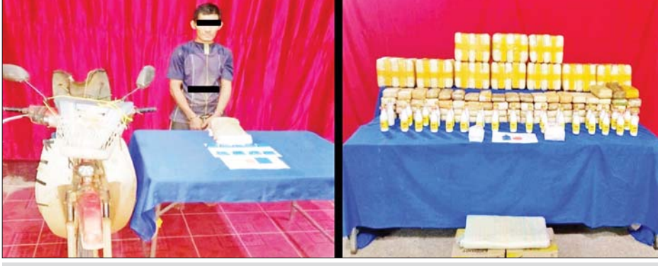
အားကျိုးအား သိမ်းဆည်းရမိသည့် စိတ်ကြွေးသွပ်ဆေးပြားများနှင့်အတူ တွေ့ရစဉ်။

နေပြည်တော် ဇူလိုင် ၁ ရှမ်းပြည်နယ် (အရှေ့ပိုင်း) တာချီလိတ်မြို့နယ်တွင် ငွေကျပ်သိန်း ၆၂၀၀ ကျော်တန်ဖိုးရှိ မူးယစ်ဆေးဝါးများ သိမ်းဆည်းရမိခဲ့ကြောင်း မြန်မာနိုင်ငံရဲတပ်ဖွဲ့မှ သိရသည်။