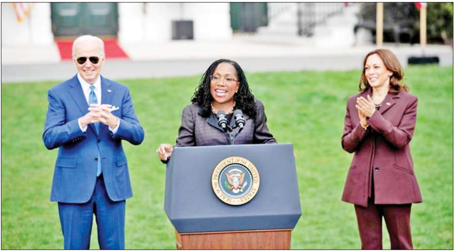
အတွင်းက ပယ်ဖျက်ခဲ့သည်။ ထို့ပြင် ပြည်သူများအား အတွက် ပယ်ဖျက်ခဲ့ကြောင်း သိရသည်။ သေနတ်ကိုင်ဆောင်ခွင့်ပြုထားသည့် နယူးယောက် ပြည်နယ်ဥပဒေကိုလည်း အခြေခံဥပဒေနှင့်မညီသည့် ကိုးကား - အင်န်အိတ်ချ်ကော့ဘာသာပြန် - အောင်ကျော်ကျော်

ရခြင်းမှာ အမေရိကန်နိုင်ငံအတွက် လေးနက်သည့် ခြေလှမ်းသစ်တစ်ခုကို ကိုယ်စားပြုပြီး နိုင်ငံအတွင်းရှိ လူမည်းလူငယ်များနှင့် မိန်းကလေးငယ်များအားလုံး အတွက် ကိုယ်စားပြုမည်ဖြစ်ကြောင်း သမ္မတ ဂျိုးဘိုင်ဒင်က ဆိုသည်။ ဂျက်ဆင်သည် ဇူလိုင် ၁ ရက်တွင် ရာထူးတာဝန် များမှ အနားယူသွားသည့် လစ်ဘရယ်တရားသူကြီး စတီဗင်နီ ဘီရီယာ၏နေရာတွင် တာဝန်များကို ထမ်းဆောင်သွားမည်ဖြစ်သည်။ ဂျက်ဆင်အပါအဝင် တရားရုံးချုပ်တရားသူကြီး ကိုးဦးအနက် လေးဦးသည် အမျိုးသမီးများဖြစ် ကြောင်း သိရသည်။ တရားရုံးချုပ်၏ စီရင်ထုံးများသည် မကြာသေးမီ ကာလများအတွင်း ရှေးရိုးဆန်မှုများရှိလာခဲ့သည်။ ကိုယ်ဝန် ဖျက်ချခြင်းကို အမျိုးသမီးတစ်ဦး၏ ဖွဲ့စည်းပုံအခြေခံဥပဒေဆိုင်ရာ အခွင့်အရေးတစ်ရပ် အဖြစ် သတ်မှတ်ပေးသည့်ဥပဒေကို လွန်ခဲ့သောလ