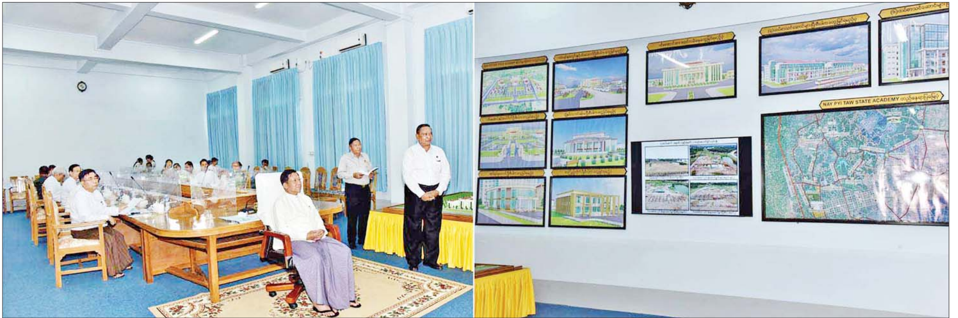
နိုင်ငံတော်စီမံအုပ်ချုပ်ရေးကောင်စီဥက္ကဋ္ဌ နိုင်ငံတော်ဝန်ကြီးချုပ် ဗိုလ်ချုပ်မှူးကြီး မင်းအောင်လှိုင်အား ပြည်ထောင်စုဝန်ကြီး ဦးရွှေလေးက တည်ဆောက်ရေးလုပ်ငန်းများ ဆောင်ရွက်နေမှုကို ရှင်းလင်းတင်ပြစဉ်။

● ရှေ့ဖိုးမှ သင်ကြားရေးဌာနများ ဖွင့်လှစ်ဆောင်ရွက်ရန် လျာထားမှုအခြေအနေများကို လည်းကောင်း ရှင်းလင်းတင်ပြကြသည်။ ရှင်းလင်းတင်ပြမှုများအပေါ် နိုင်ငံတော်စီမံအုပ်ချုပ်ရေးကောင်စီဥက္ကဋ္ဌ နိုင်ငံတော်ဝန်ကြီးချုပ်က သင်ကြားရေးနှင့်ပတ်သက်၍ နေပြည်တော်သည် အစိုးရရုံးစိုက်ရာ ပြည်ထောင်စုနယ်မြေဖြစ်သဖြင့် နိုင်ငံ့ဝန်ထမ်းများ၏ မိသားစုဝင်သားသမီးများ များစွာရှိသော်လည်း အဆင့်မြင့်ပညာ သင်ကြားရေးအတွက် စိုက်ပျိုးရေး၊ မွေးမြူရေးနှင့် သစ်တောတက္ကသိုလ်များ သာရှိပြီး အခြားတက္ကသိုလ်မရှိကြောင်း၊ ဝန်ထမ်းမိသားစုများရှိ မျိုးဆက်သစ် သားသမီးများ၏ပညာရေး အဆင့်မြင့်တင် ရာတွင် အဆင့်မြင့်ပညာရေး အဆောက်အအုံနှင့် သင်ကြားရေးဌာနများ မဖြစ်မနေ လိုအပ်မည်ဖြစ်သည့်အတွက် တာဝန်ရှိသူ အသီးသီးနှင့် တိုင်ပင်ဆွေးနွေး၍ Naypyitaw State Academy စီမံကိန်းကို အကောင်အထည်ဖော် ဆောင်ရွက်စေ ခဲ့ခြင်းဖြစ်ကြောင်း၊ ယခု တက္ကသိုလ်နေရာ သည် ယခင်အားကစားတက္ကသိုလ်အဖြစ် စတင်တည်ထောင်ခဲ့ခြင်းဖြစ်ပြီး အကြောင်း အမျိုးမျိုးဖြင့် အားကစားတက္ကသိုလ် မဖွင့်နိုင်ခဲ့ကြောင်း၊ ယင်းကိုအခြေခံ၍ တက္ကသိုလ်အင်္ဂါရပ်နှင့် ပြည့်စုံအောင် အဆောက်အအုံများ ဖြည့်တင်း တည်ဆောက်ခြင်းဖြစ်ကြောင်း၊ စီမံကိန်း အတွင်း လိုအပ်သည့် သင်ကြားရေး အဆောက်အအုံများ၊ အုပ်ချုပ်မှုအဆောက်