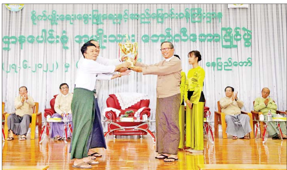
ထူးချွန်အားကစားသမားများကို ရွေးချယ်ပြီး တွင် ပါဝင်ယှဉ်ပြိုင်နိုင်ရန် စီစဉ်ဆောင်ရွက်သွားမည် လာမည့်ဝန်ကြီးဌာနပေါင်းစုံ အားကစားပြိုင်ပွဲများ ဖြစ်ကြောင်း သိရသည်။ သတင်းစဉ်

ထို့နောက် ဆုချီးမြှင့်ပွဲကို ဆက်လက်ကျင်းပရာ ပြည်ထောင်စုဝန်ကြီးက တံခွန်စိုက်ဆုရရှိသည့် စက်မှုလယ်ယာဦးစီးဌာနကိုယ်စားပြု ဘော်လီဘောအသင်းကိုလည်းကောင်း၊ အမြဲတမ်းအတွင်းဝန်ဦးကျော်မင်းဦးက ဒုတိယဆုရစိုက်ပျိုးရေးသုတေသနဦးစီးဌာန ကိုယ်စားပြုဘော်လီဘောအသင်းကိုလည်းကောင်း၊ ကျန်ဆုများကို ဌာနဆိုင်ရာတာဝန်ရှိသူများကလည်းကောင်း ပေးအပ်ချီးမြှင့်ကြသည်။ စိုက်ပျိုးရေး၊ မွေးမြူရေးနှင့် ဆည်မြောင်းဝန်ကြီးဌာန ဝန်ထမ်းများ၏ ကိုယ်စိတ်အပန်းပြေ ပျော်ရွှင်စေရေး၊ ဝန်ထမ်းတိုင်း မိမိတို့ဝါသနာပါရာ အားကစားနည်းများဖြင့် ကျန်းမာရေးနှင့် ညီညွတ်သော ကိုယ်လက်လှုပ်ရှားမှုများတွင် ပါဝင်ဆောင်ရွက်နိုင်ရေး၊ ဌာနအချင်းချင်းအကြား စည်းလုံးညီညွတ်စွာ ပူးပေါင်းဆောင်ရွက်မှု အားကောင်းလာစေရေးအတွက် အားကစားနည်းများအလိုက် ပြိုင်ပွဲများ ကျင်းပပေးလျက်ရှိရာ အဆိုပါ အားကစားပွဲများမှ