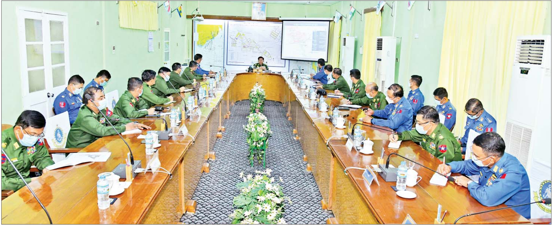
နိုင်ငံတော်စီမံအုပ်ချုပ်ရေးကောင်စီဥက္ကဋ္ဌ တပ်မတော်ကာကွယ်ရေးဦးစီးချုပ် ဗိုလ်ချုပ်မှူးကြီး မင်းအောင်လှိုင် သန်လျင်တပ်နယ်နှင့် ဒလတပ်နယ်တို့ရှိ နယ်မြေခံရတပ်စခန်းဌာနချုပ်များမှ ဌာနချုပ်မှူးများနှင့် အရာရှိကြီးများအား တွေ့ဆုံအမှာစကားပြောကြားစဉ်။

☆ ရှေ့ဖုံးမှ အဆိုပါတွေ့ဆုံပွဲသို့ နိုင်ငံတော်စီမံအုပ်ချုပ်ရေးကောင်စီဥက္ကဋ္ဌ တပ်မတော်ကာကွယ်ရေးဦးစီးချုပ်နှင့်အတူ ကာကွယ်ရေးဦးစီးချုပ်(ရေ) ဗိုလ်ချုပ်ကြီး မိုးအောင်၊ ကာကွယ်ရေးဦးစီးချုပ်(လေ)ဗိုလ်ချုပ်ကြီး ထွန်းအောင်နှင့် ကာကွယ်ရေးဦးစီးချုပ်ရုံးမှ တပ်မတော်အရာရှိကြီးများ၊ ရန်ကုန်တိုင်းစစ်ဌာနချုပ်တိုင်းမှူး ဗိုလ်ချုပ်ညွှန်ဝင်းဆွေ၊ သန်လျင်တပ်နယ်နှင့် ဒလတပ်နယ်တို့ရှိ နယ်မြေခံရတပ်စခန်းဌာနချုပ်များမှ ဌာနချုပ်မှူးများနှင့် အရာရှိကြီးများ တက်ရောက်ကြသည်။