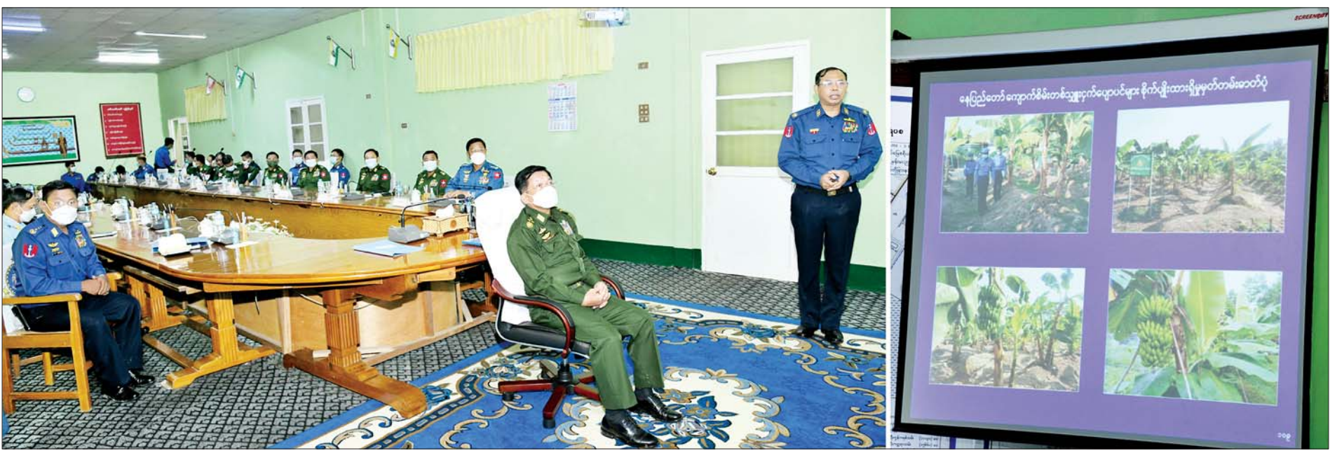
နိုင်ငံတော်စီမံအုပ်ချုပ်ရေးကောင်စီဥက္ကဋ္ဌ တပ်မတော်ကာကွယ်ရေးဦးစီးချုပ် ဗိုလ်ချုပ်မှူးကြီး မင်းအောင်လှိုင်အား တာဝန်ရှိသူတစ်ဦးက ရှင်းလင်းတင်ပြစဉ်။