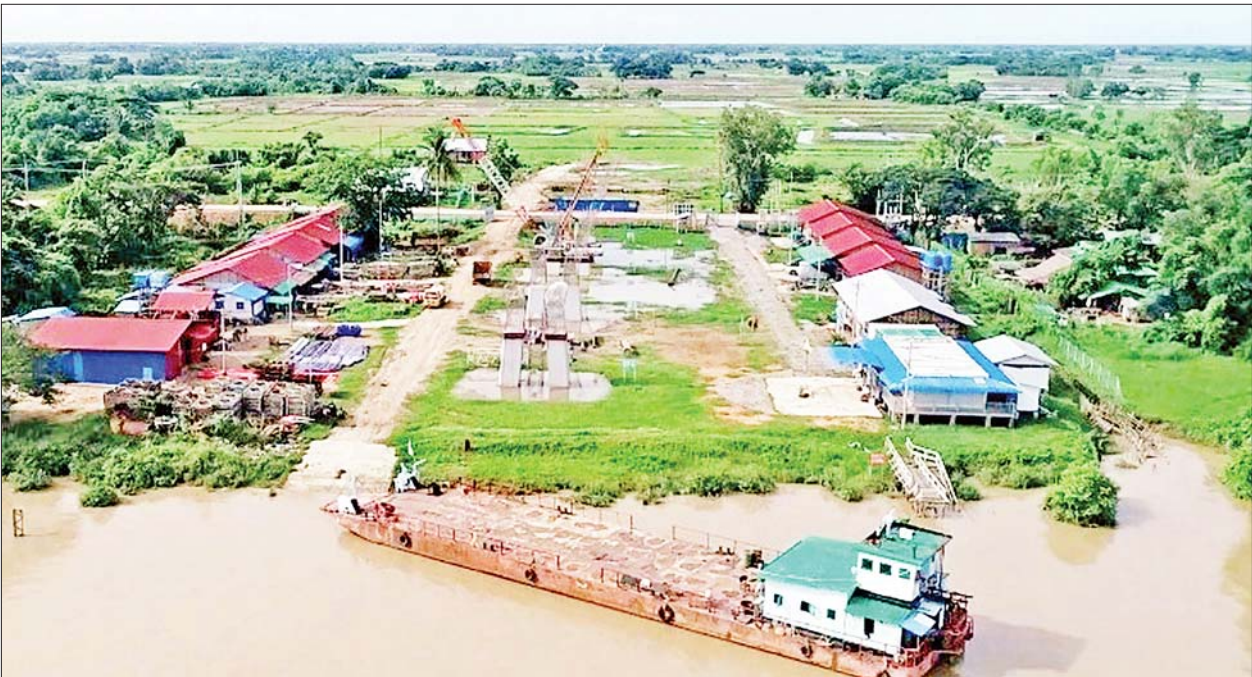
ဆိပ်ကြီးခနောင်တို တံတားတည်ဆောက်ရေးစီမံကိန်းရှိ ဒလမြို့နယ်ဘက်ခြမ်း ဘိုးပိုင်တူးဖော်ခြင်းလုပ်ငန်းများ ဆောင်ရွက်ပြီးစီးနေမှုကို တွေ့ရစဉ်။

- ဒီမိုကရေစီတွင် တူညီသည့်အခွင့်အရေးများ ပေးရမည်ဖြစ်သကဲ့သို့ ဖက်ဒရယ် စနစ်တွင်လည်း တူညီသည့်အခွင့်အရေးများ ပေးရမည်ဖြစ် ငြိမ်းချမ်းရေးရရှိရန် အတွက် တိုင်းရင်းသားလက်နက်ကိုင်အဖွဲ့များနှင့် ဆက်လက်ဆွေးနွေးသွားမည်။ - တိုင်းရင်းသား လက်နက်ကိုင်အဖွဲ့များနှင့်တွေ့ဆုံဆွေးနွေးရာတွင် အဆင်ပြေ မှုများရှိခဲ့ပြီး ကောင်းမွန်သည့် တွေ့ဆုံဆွေးနွေးမှုများကို ပြုလုပ်၍ နိုင်ငံငြိမ်းချမ်း ရေးရရှိအောင် ဆက်လက်ကြိုးပမ်းဆောင်ရွက်သွားရမည်။ - အချို့သော တိုင်းရင်းသား လက်နက်ကိုင်အဖွဲ့များမှာ အကြောင်းအမျိုးမျိုးဖြင့် တွေ့ဆုံဆွေးနွေးမှု မပြုနိုင်ကြ၊ မိမိတို့သည် နိုင်ငံရေးရည်မှန်းချက် နှစ်ရပ်အတိုင်း ခိုင်မြဲစွာ ဆောင်ရွက်သွားမည်ဖြစ်သဖြင့် ဆွေးနွေးရန်ကျန်ရှိသည့် အဖွဲ့များအနေ ဖြင့် မိမိကမ်းလှမ်းထားသည့်အတိုင်း ထပ်မံဖိတ်ခေါ်။ (နိုင်ငံတော်စီမံအုပ်ချုပ်ရေးကောင်စီဥက္ကဋ္ဌ နိုင်ငံတော်ဝန်ကြီးချုပ် ဗိုလ်ချုပ်မှူးကြီး မင်းအောင်လှိုင် ၂၀၂၂ ခုနှစ် ဇွန်လ ၉ ရက်နေ့တွင် ရန်ကုန်တိုင်းဒေသကြီးအစိုးရအဖွဲ့ ဝန်ကြီးများနှင့် တာဝန်ရှိသူများအား တွေ့ဆုံအမှာစကား ပြောကြားမှုမှ ကောက်နုတ်ချက်)