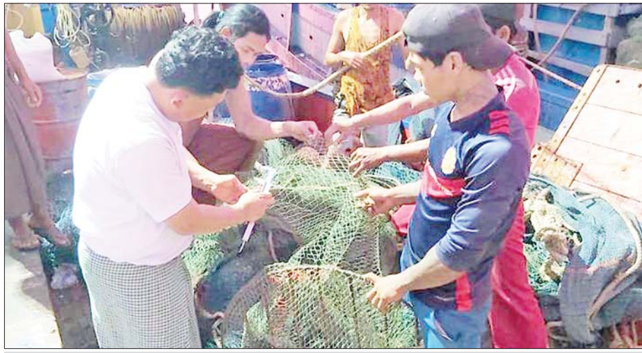
ပင်လယ်ပြင်သို့ထွက်ခွာမည့် ငါးဖမ်းစက်လှေများတွင် VMS စက်နှင့် TED ကိရိယာတပ်ဆင်ထားမှု ရှိ၊ မရှိကို စစ်ဆေးနေစဉ်။