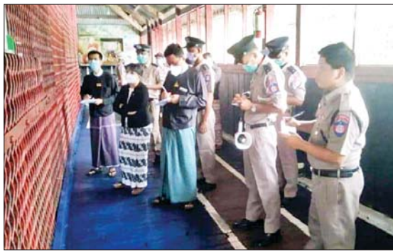
ပညာသင်ကြားမှု အခြေအနေကို ကြည့်ရှုစစ်ဆေးမေးမြန်းခဲ့ပြီး လိုအပ်ချက်များ ဖြည့်ဆည်းဆောင်ရွက်ပေးရန် အကျဉ်းထောင်မှ တာဝန်ရှိသူများအား လမ်းညွှန်မှာကြားခဲ့ကြောင်း သိရသည်။

ဧရာဝတီတိုင်းဒေသကြီး တရားလွှတ်တော်တရားသူကြီး ဒေါ်ယဉ်ယဉ်ဟန်သည် ရုံးအဖွဲ့မှူး ဦးကျော်စိုးညွန့်၊ ဖျာပုံခရိုင် တရားသူကြီး ဒေါ်သူဇာအေး တို့နှင့်အတူ ယနေ့နံနက်ပိုင်းက ဖျာပုံအကျဉ်းထောင်အား ကြည့်ရှုစစ်ဆေးရာ ဖျာပုံမြို့အကျဉ်းထောင်တာဝန်ခံအရာရှိက အကျဉ်းထောင်အတွင်း အခြေအနေများကို ရှင်းလင်းတင်ပြသည်။