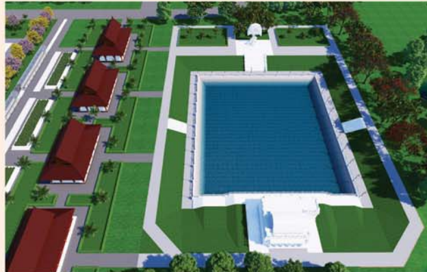
ကျောက်စာရုံစေတီ(၁၂ x ၁၂x ၁၈)ပေ ၁ ဆူ တန်ဖိုး-၂၇၉ သိန်း