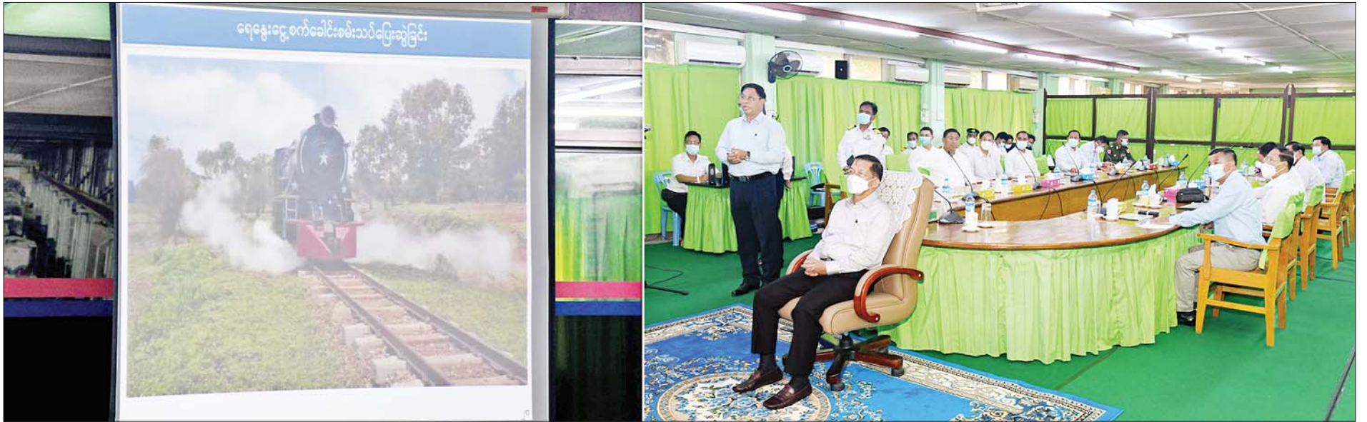
နိုင်ငံတော်စီမံအုပ်ချုပ်ရေးကောင်စီဥက္ကဋ္ဌ နိုင်ငံတော်ဝန်ကြီးချုပ် ဗိုလ်ချုပ်မှူးကြီးမင်းအောင်လှိုင်အား မြန်မာ့မီးရထားစက်ခေါင်းစက်ရုံ(အင်းစိန်)အစည်းအဝေးခန်းမတွင် ပြည်ထောင်စုဝန်ကြီး ဗိုလ်ချုပ်ကြီး တင်အောင်စန်းက ရှင်းလင်းတင်ပြစဉ်။