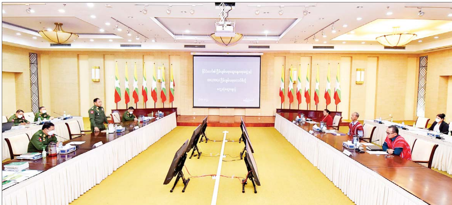
နိုင်ငံတော်၏ငြိမ်းချမ်းရေးဆွေးနွေးရေးအဖွဲ့နှင့် ကရင်အမျိုးသားအစည်းအရုံး၊ ကရင်အမျိုးသားလွတ်မြောက်ရေးတပ်မတော် (ငြိမ်းချမ်းရေးကောင်စီ) KNU/KNLA (PC) ဥက္ကဋ္ဌ ဦးဆောင်သော ကိုယ်စားလှယ်အဖွဲ့တို့ တွေ့ဆုံဆွေးနွေးစဉ်။

နေပြည်တော် မေ ၂၇ နိုင်ငံတော်၏ငြိမ်းချမ်းရေးဆွေးနွေးရေးအဖွဲ့နှင့် ကရင်အမျိုးသားအစည်းအရုံး၊ ကရင်အမျိုးသားလွတ်မြောက်ရေးတပ်မတော် (ငြိမ်းချမ်းရေးကောင်စီ) KNU/KNLA (PC) ဥက္ကဋ္ဌ ဦးဆောင်သော ကိုယ်စားလှယ်အဖွဲ့တို့ တွေ့ဆုံဆွေးနွေးပွဲကို ယနေ့နံနက်ပိုင်းတွင် နေပြည်တော်ရှိ အမျိုးသားစည်းလုံးညီညွတ်ရေးနှင့် ငြိမ်းချမ်းရေးဖော်ဆောင်မှု ဗဟိုဌာန အစည်းအဝေးခန်းမ၌ ကျင်းပသည်။ တွေ့ဆုံဆွေးနွေးပွဲသို့ နိုင်ငံတော်စီမံအုပ်ချုပ်ရေးကောင်စီအဖွဲ့ဝင် အမျိုးသားစည်းလုံးညီညွတ်ရေးနှင့် ငြိမ်းချမ်းရေးဖော်ဆောင်မှုညွှန်ကြားရေးကော်မတီဥက္ကဋ္ဌ ပြည်ထောင်စုအစိုးရအဖွဲ့ရုံးဝန်ကြီးဌာန (၁) ပြည်ထောင်စုဝန်ကြီး ငြိမ်းချမ်းရေးဆွေးနွေးရေးအဖွဲ့ခေါင်းဆောင် ဒုတိယဗိုလ်ချုပ်ကြီးရာပြည့်၊ အဖွဲ့ဝင်များဖြစ်ကြသည့် စာမျက်နှာ ၇ ကော်လံ ၁ သို့ ။