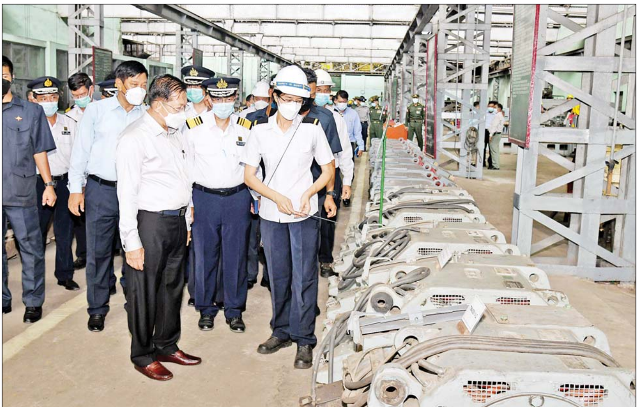
နိုင်ငံတော်စီမံအုပ်ချုပ်ရေးကောင်စီဥက္ကဋ္ဌ နိုင်ငံတော်ဝန်ကြီးချုပ် ဗိုလ်ချုပ်မှူးကြီးမင်းအောင်လှိုင် မြန်မာ့မီးရထားစက်ခေါင်းစက်ရုံ (အင်းစိန်)တွင် ကြည့်ရှုစစ်ဆေးစဉ်။

အဓိကကျသည့် ပို့ဆောင်ရေးစနစ်တစ်ခု ရှင်းလင်းတင်ပြမှုများအပေါ် နိုင်ငံတော်စီမံအုပ်ချုပ်ရေးကောင်စီ ဥက္ကဋ္ဌ နိုင်ငံတော်ဝန်ကြီးချုပ်က ရထားပို့ဆောင်ရေးစနစ်သည် တိုင်းပြည် တစ်ခု၏ အဓိကကျသည့် ပို့ဆောင်ရေးစနစ်တစ်ခုပင်ဖြစ်ကြောင်း၊ စက်ခေါင်းများပြင်ဆင်ခြင်းလုပ်ငန်းများ ဆောင်ရွက်ရာတွင် ပြုပြင်ခြင်း လုပ်ငန်းများ အဆင့်ဆင့်ဆောင်ရွက်မှုကို မှတ်တမ်းဓာတ်ပုံများဖြင့် စနစ်တကျ မှတ်တမ်းတင်ခြင်းများ ဆောင်ရွက်ထားရှိရန်လိုကြောင်း၊ စက်ခေါင်းများဝယ်ယူချိန်မှစ၍ အသုံးပြုမှုနှင့် ပြုပြင်ထိန်းသိမ်းမှုများကို စက်ခေါင်းတစ်ခုချင်းအလိုက် သမိုင်းမှတ်တမ်းများ ပြည့်စုံစွာဖြင့် ပြုစု ထားရှိရန်လိုကြောင်း၊ စက်ခေါင်းများသည် တန်ဖိုးအားဖြင့် များစွာကြီးမား သည့် ပစ္စည်းများဖြစ်သဖြင့် ပြုပြင်ထိန်းသိမ်းခြင်းနှင့် စွမ်းရည်မြှင့်တင်ခြင်း