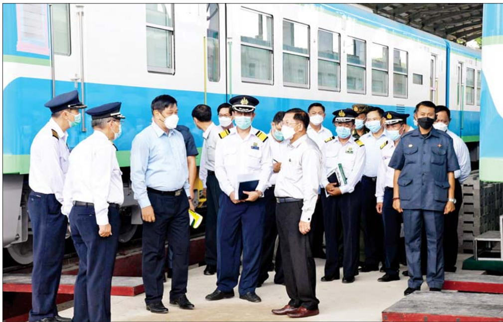
နိုင်ငံတော်စီမံအုပ်ချုပ်ရေးကောင်စီဥက္ကဋ္ဌ တပ်မတော်ကာကွယ်ရေးဦးစီးချုပ် ဗိုလ်ချုပ်မှူးကြီးမင်းအောင်လှိုင် မြို့ပတ်ဒီဇယ်စက်ခေါင်းရုံတွင် ဂျပန်နိုင်ငံမှ ရောက်ရှိလာသည့် DEMU ရထားတွဲဆိုင်အသစ်များကို ကြည့်ရှုစစ်ဆေး စဉ်။