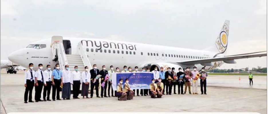
မြန်မာအမျိုးသားလေကြောင်းမှ ပြည်ပခရီးစဉ်များ တိုးချဲ့ပျံသန်းမည့် Boeing 737-800 NG လေယာဉ်တစ်စင်း ရန်ကုန်အပြည်ပြည်ဆိုင်ရာလေဆိပ်သို့ ရောက်ရှိစဉ်။

ရန်ကုန် မေ ၂၇ မြန်မာအမျိုးသားလေကြောင်းမှ ပြည်ပခရီးစဉ်များ တိုးချဲ့ပျံသန်းမည့် Boeing 737-800 NG လေယာဉ်တစ်စင်းသည် ယနေ့ညနေပိုင်းတွင် ရန်ကုန်အပြည်ပြည်ဆိုင်ရာလေဆိပ်သို့ ရောက်ရှိလာကြောင်း သိရသည်။ အဆိုပါလေယာဉ်ရောက်ရှိချိန်၌ Parking Area သို့ အဝင်လမ်းတွင် မီးသတ်ရေးယာဉ်နှစ်စီးမှ ဝဲယာခွဲ၍ အန္တရာယ်ကင်းပရိတ်ရေ စာမျက်နှာ ၇ ကော်လံ ၁ သို့ *