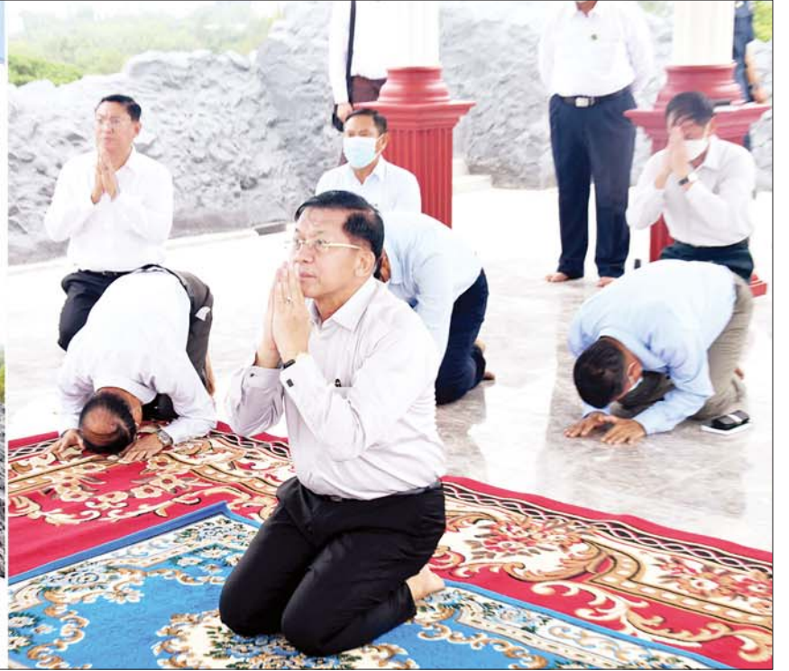
နိုင်ငံတော်စီမံအုပ်ချုပ်ရေးကောင်စီဥက္ကဋ္ဌ နိုင်ငံတော်ဝန်ကြီးချုပ် ဗိုလ်ချုပ်မှူးကြီးမင်းအောင်လှိုင် မဟာပါသာဏလိုဏ်ဂူတော်ကြီး၏ အပေါ်ဆုံးထပ်ရှိ ဗုဒ္ဓရုပ်ပွားတော်မြတ်အား ဖူးမြော်ကြည့်ညှိစဉ်။

ရှေ့ဖုံးမှ အကြီးစားပြင်ဆင်မှုမိမိခြင်း လုပ်ငန်းအဆင့်ဆင့် ဆောင်ရွက်နေမှုအခြေအနေနှင့် ဆောင်ရွက်ပြီးစီးမှု အခြေအနေ၊ ကမ္ဘာအေး ဟံသာသီရိကုန်းမြေရှိ သာသနိကအဆောက်အဦ ကျောင်းဆောင် ခြောက်ဆောင် အဆင့်မြှင့်တင်မှုမိမိခြင်း၊ မြေပြုပြင်ခြင်း၊ နေရာရှုခင်းဆောင်ရွက်ခြင်းနှင့် လမ်းပြုပြင်ခြင်း လုပ်ငန်းများ ဆောင်ရွက်သွားမည့် အခြေအနေများ နှင့် ပတ်သက်၍ ရှင်းလင်းတင်ပြကြသည်။