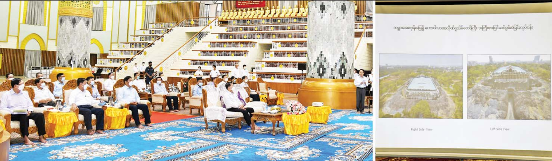
နိုင်ငံတော်စီမံအုပ်ချုပ်ရေးကောင်စီဥက္ကဋ္ဌ နိုင်ငံတော်ဝန်ကြီးချုပ် ဗိုလ်ချုပ်မှူးကြီးမင်းအောင်လှိုင်အား ပြည်ထောင်စုဝန်ကြီး ဦးကိုကိုက လိုဏ်ဂူတော်ကြီး အကြီးစားပြင်ဆင်မှုမိမိခြင်း လုပ်ငန်းအဆင့်ဆင့် ဆောင်ရွက်နေမှုအခြေအနေကို ရှင်းလင်းတင်ပြစဉ်။