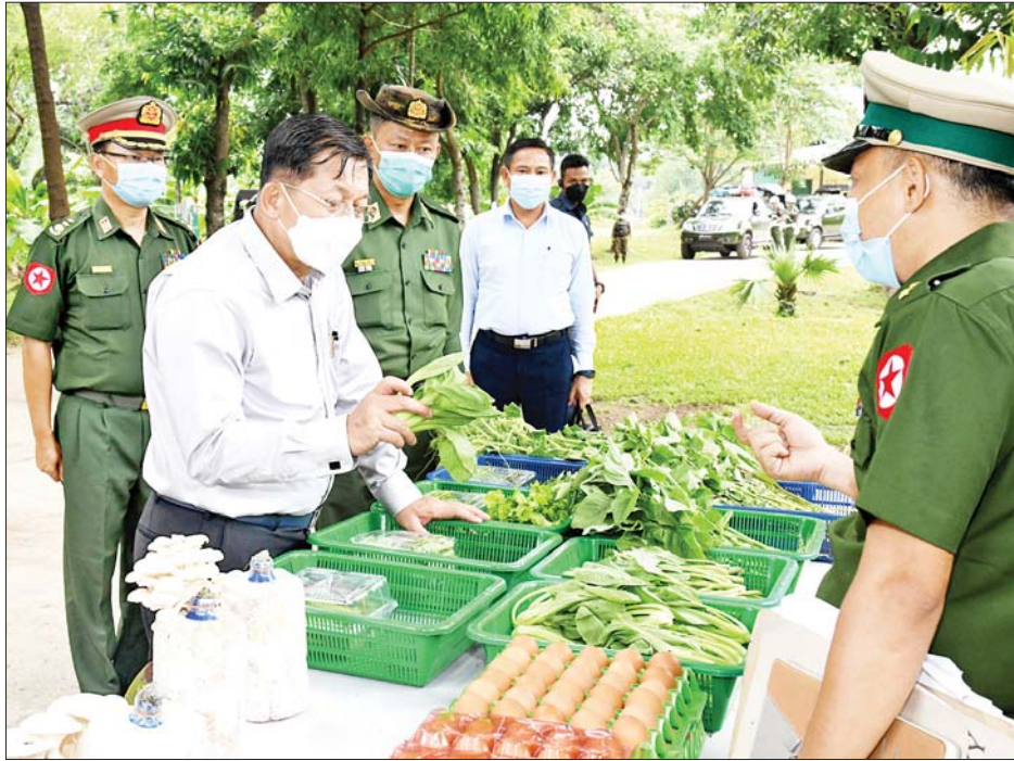
နိုင်ငံတော်စီမံအုပ်ချုပ်ရေးကောင်စီဥက္ကဋ္ဌ တပ်မတော်ကာကွယ်ရေးဦးစီးချုပ် ဗိုလ်ချုပ်မှူးကြီး မင်းအောင်လှိုင် ရန်ကုန်တိုင်းစစ်ဌာနချုပ် စိုက်ပျိုးမွေးမြူရေးစခန်းမှ ထွက်ရှိသည့် ဟင်းသီးဟင်းရွက်များ၊ မှိုနှင့် ကြက်ဥများကို ကြည့်ရှုစစ်ဆေးစဉ်။

ရှင်းလင်းတင်ပြမှုများအပေါ် နိုင်ငံတော်စီမံ အုပ်ချုပ်ရေးကောင်စီဥက္ကဋ္ဌ တပ်မတော်ကာကွယ် ရေးဦးစီးချုပ်က ရန်ကုန်တိုင်းစစ်ဌာနချုပ်နယ်မြေ အတွင်း ဘက်စုံစိုက်ပျိုး မွေးမြူရေးလုပ်ငန်းများ ဆောင်ရွက်စေခြင်းသည် ရန်ကုန်တိုင်းဒေသကြီး အတွင်းရှိ လူဦးရေ ခုနစ်သန်းကျော် ရှစ်သန်းခန့်အား အသားငါးနှင့်ဟင်းသီးဟင်းရွက်များ ဈေးနှုန်း