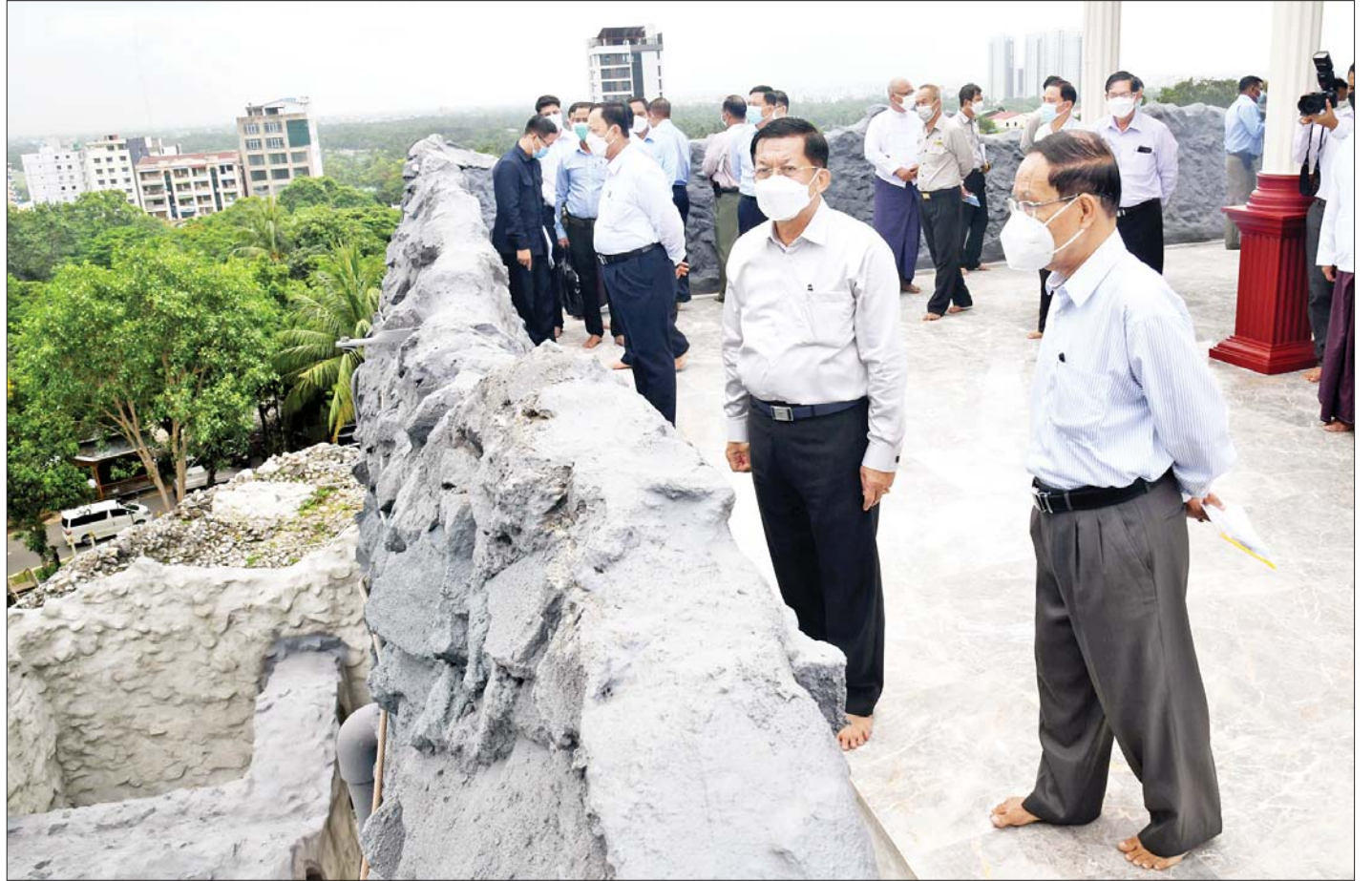
နိုင်ငံတော်စီမံအုပ်ချုပ်ရေးကောင်စီဥက္ကဋ္ဌ နိုင်ငံတော်ဝန်ကြီးချုပ် ဗိုလ်ချုပ်မှူးကြီးမင်းအောင်လှိုင် ဆဋ္ဌသင်္ဂါယနာတင် မဟာပါသာဏလိုဏ်ဂူသိမ်တော်ကြီး အကြီးစားပြင်ဆင်မှုမိမိခြင်းလုပ်ငန်းများ ဆောင်ရွက်နေမှုအခြေအနေများကို ကြည့်ရှုစစ်ဆေးစဉ်။