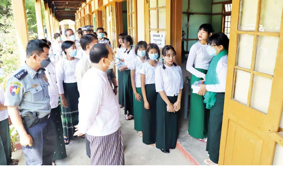
အတွက် ကျောင်းသုံးဗလာစာအုပ်၊ ခဲတံ၊ ဘောပင်များ ကျောင်းအပ်ဆရာမကြီးတို့က ကျောင်းသား ကို လည်းကောင်း၊ မုံရွာမြို့နယ် ပညာရေးမှူးနှင့် ကျောင်းသူများအတွက် ကျောင်းဝတ်စုံများအား အမှတ်(၂)အခြေခံပညာ အထက်တန်းကျောင်း ကျောင်းသား ကျောင်းသူများထံ ပေးအပ်ကြသည်။

စစ်ကိုင်း မေ ၂၇ ၂၀၂၂-၂၀၂၃ ပညာသင်နှစ် စစ်ကိုင်းတိုင်း ဒေသကြီး ကျောင်းအပ်နှံရေးနေ့ အခမ်းအနားကို ယနေ့နံနက်ပိုင်းတွင် မုံရွာမြို့ အမှတ်(၂) အခြေခံပညာအထက်ကျောင်းရှိ သလ္လာဝတီခန်းမ ၌ ကျင်းပသည်။ ဖွင့်လှစ် ရှေးဦးစွာ အမှတ်(၂)အခြေခံပညာ အထက်တန်း ကျောင်း အလုံမှ ကျောင်းသား ကျောင်းသူများက “မြန်မာ့ကျောင်း” သီချင်းသီဆို၍ ၂၀၂၂-၂၀၂၃ ပညာ သင်နှစ် စစ်ကိုင်းတိုင်းဒေသကြီး ကျောင်းအပ်နှံရေး နေ့အခမ်းအနားအား ဖွင့်လှစ်ကြသည်။ ယင်းနောက် တိုင်းဒေသကြီး ဝန်ကြီးချုပ် ဦးမြတ်ကျော်နှင့် လူမှုရေးရာဝန်ကြီး ဦးအေးလှိုင် တို့က ကျောင်းသား ကျောင်းသူများအတွက် ကျောင်းသုံး ပုံနှိပ်စာအုပ်များကိုလည်းကောင်း၊ တိုင်းဒေသကြီး ပညာရေးမှူး ဦးတိုးဝင်းနှင့် မုံရွာခရိုင် ပညာရေးမှူးတို့က ကျောင်းသား ကျောင်းသူများ