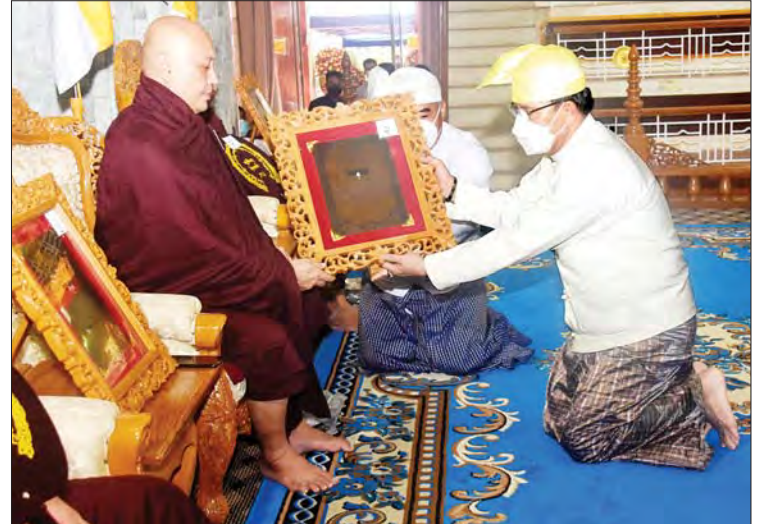
ပြည်ထောင်စုဝန်ကြီး ဦးမောင်မောင်အုန်း ပိဋကတ်တစ်ပုံ ရေးဖြေအောင် ရန်ကုန်တိုင်းဒေသကြီး မင်္ဂလာဒုံမြို့နယ် တိပိဋကစုဆန်လီကျောင်းတိုက်မှ အရှင်ဝဏ္ဏိတာလင်္ကာရအား ဘွဲ့တံဆိပ်တော်နှင့် အောင်လက်မှတ် ဆက်ကပ်လှူဒါန်းစဉ်။

ရှေ့ဖုံးမှ ကျန်းမာရေးဝန်ကြီးဌာန ပြည်ထောင်စုဝန်ကြီး ဒေါက်တာသက်ခိုင်ဝင်း၊ ရန်ကုန်တိုင်းဒေသကြီးအစိုးရအဖွဲ့ ဝန်ကြီးချုပ် ဦးစိုးသိန်း၊ ကာကွယ်ရေးဦးစီးချုပ်ရုံး (ကြည်း)မှ ဒုတိယဗိုလ်ချုပ်ကြီးသက်ပုံ၊ ရန်ကုန်တိုင်းစစ်ဌာနချုပ် တိုင်းမှူး ဗိုလ်ချုပ်ညွှန်ဝင်းဆွေနှင့် ၎င်းတို့၏ ဇနီးများ၊ ဌာနဆိုင်ရာတာဝန်ရှိသူများ၊ ဖိတ်ကြားထားသူများ တက်ရောက်ကြည့်ညိကြသည်။