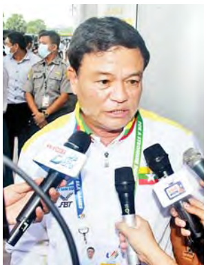
ပြည်ထောင်စုဝန်ကြီး ဦးမင်းသိန်းဇံ

ထို့နောက် ကာယဗလနှင့် ကာယကြံ့ခိုင်မှု အားကစားနည်းမှ ရွှေတံဆိပ်ဆုရင် ရဲထွန်းနောင်(၇၀) ကိုလို့ က “ ရွှေတံဆိပ်ဆုရတဲ့ အတွက် အတိုင်းထက်အလွန် ဝမ်းသာရပါတယ်။ ဒီပွဲအတွက် ပြင်ဆင်ခဲ့တာ တစ်နှစ်ခွဲနီးပါးလောက်ရှိပြီ။ လေ့ကျင့်မှုကို အကောင်းဆုံးပြင်ဆင်တယ်။ ပြိုင်ဘက်ကစားသမားတွေကို လေ့လာတယ်။ ကျွန်တော်တို့ အဖွဲ့ချုပ်တွေမှာလုပ်တဲ့ ပွဲတွေမှာလည်း ပထမနှစ်ခါလောက်ရတယ်။ ဒီပွဲကို ထိုက်ထိုက်တန်တန်နဲ့ တက်လှမ်းပြီးတော့မှ ရွှေတံဆိပ်ဆုကို ဆွတ်ခူးခဲ့တာပါ။ အရင်ပွဲတွေထက်ကို အများကြီးကြိုးစားပြီး အပင်ပန်းခံထားရတာပါ။ ကိုယ်ပင်ပန်းခံပြီး ထိုက်ထိုက်တန်တန်ရလို့ ဝမ်းသာဂုဏ်ယူမိပါတယ်။