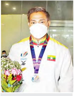
ငွေတံဆိပ်ဆုရ ခင်မောင်ကျော်