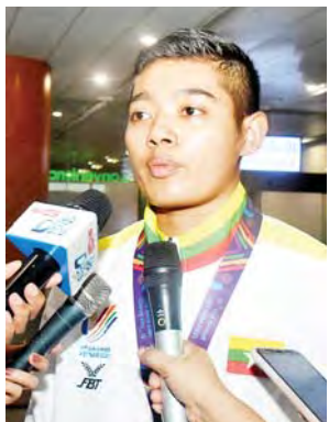
ရွှေတံဆိပ်ဆုရ မခင်ချယ်ရီသက်