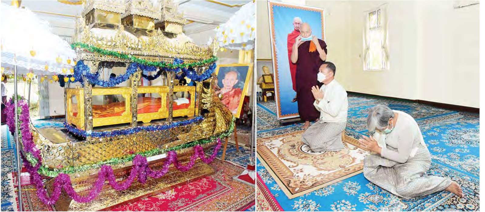
နိုင်ငံတော်စီမံအုပ်ချုပ်ရေးကောင်စီ ဒုတိယဥက္ကဋ္ဌ ဒုတိယတပ်မတော်ကာကွယ်ရေးဦးစီးချုပ် ကာကွယ်ရေးဦးစီးချုပ်(ကြည်း) ဒုတိယဗိုလ်ချုပ်မှူးကြီး စိုးဝင်း နိုင်ငံတော်ဩဝါဒါစရိယ ရွှေသုဝဏ် ဆရာတော်ဘုရားကြီး၏ ရုပ်ကလာပ်တော်အား ဖူးမြော်ကြည်ညိုစဉ်။

နေပြည်တော် မေ ၂၂ ရန်ကုန်တိုင်းဒေသကြီး သယံဇာတနှင့်သိုလှော်ရေး ဝန်ကြီးဌာနမှ ရှေးဦးစီးဌာန ရုပ်ကလာပ်တော်အား သွားရောက်ဖူးမြော်ကြည်ညိုရာ မေ ၂၁ ရက် (စနေနေ့) နံနက် ၁ နာရီ မိနစ် ၄၀ တွင် ဘဝနတ်ထံပျံလွန်တော်မူခဲ့သည့်