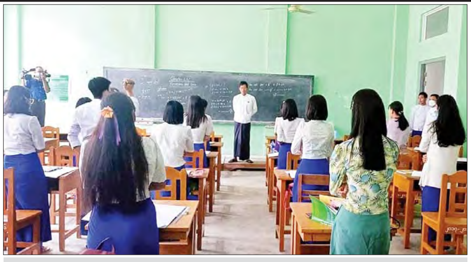
သမဝါယမနှင့် စီမံခန့်ခွဲမှုပညာတက္ကသိုလ်(စစ်ကိုင်း)မှ ဆရာ ဆရာမများ၊ ကျောင်းသား ကျောင်းသူ များနှင့် တွေ့ဆုံစဉ်။

ကျွန်တော် မရောက်ဖူးသေးပါ။ စစ်ကိုင်း တက္ကသိုလ်ကမူ စစ်ကိုင်းမြို့ ရွာထောင် ဘူတာရုံအနီး ရွှေသမားရပ်တွင် တည်ရှိနေပါသည်။ မူလဘူတာ အစောပိုင်းကာလများတွင်တော့ အဆိုပါ တက္ကသိုလ်သည် ကချင်ပြည်နယ်၊ ချင်းပြည်နယ်နှင့် စစ်ကိုင်းတိုင်းတို့အတွက် ရည်ရွယ်ဖွင့်လှစ်သော သမဝါယမသင်တန်းကျောင်းဖြစ်ခဲ့သည်။ ၁၉၈၂ ခုနှစ်တွင် စတင်ဖွင့်လှစ်ခဲ့ခြင်းဖြစ်၏။ ၂၀၁၂ ခုနှစ် ဖေဖော်ဝါရီလ ၁၁ ရက်နေ့တွင် တက္ကသိုလ်အဆင့်ကို တိုးမြှင့်ဖွင့်လှစ်ပေးခဲ့သည်။ တက္ကသိုလ်များ ဖွင့်လှစ် ရသည့် ရည်ရွယ်ချက်မှာ လူမှုစီးပွားဖွံ့ဖြိုးတိုးတက် ရေးအတွက် အရည်အသွေးပြည့်ဝသော လူ့စွမ်းအား အရင်းအမြစ်များ မွေးထုတ်ပေးနိုင်ရန် ဖြစ်ပါသည်။ သမဝါယမတက္ကသိုလ်ဟု ခေါ်ဝေါ်လာရာမှ ၂၀၂၁ ခုနှစ် အောက်တိုဘာလ ၂၅ ရက်နေ့တွင် သမဝါယမ နှင့် စီမံခန့်ခွဲမှုပညာတက္ကသိုလ်ဟု ပြောင်းလဲ သတ်မှတ်ခေါ်ဝေါ်ခဲ့ပါသည်။ ယင်းတက္ကသိုလ်များ၌ သင်ကြားပေးသော အထူးပြုဘာသာရပ်များမှာ သမဝါယမပညာဘာသာ ရပ်၊ ဘောဂဗေဒဘာသာရပ်၊ စာရင်းအင်းပညာ ဘာသာရပ်၊ ဘဏ္ဍာရေးနှင့် စာရင်းကိုင်ပညာဘာသာ ရပ်၊ စီမံခန့်ခွဲမှုပညာ ဘာသာရပ်များဖြစ်ပြီး အထောက်အကူပြု ဘာသာရပ်များအနေဖြင့် မြန်မာ ဘာသာ၊ အင်္ဂလိပ်၊ သင်္ချာ၊ သတင်းအချက်အလက် နှင့် ဆက်သွယ်ရေးနည်းပညာဘာသာရပ်၊ စီးပွား ရေးပထဝီဝင်ဘာသာရပ်၊ ဥပဒေပညာ ဘာသာရပ် တို့ ဖြစ်သည်။ သင်တန်းပြီးဆုံးချိန်တွင် စီးပွားရေး သိပ္ပံဘွဲ့များ ချီးမြှင့်လျက်ရှိရာ အောက်ဖော်ပြပါ ဘွဲ့များ ပါဝင်ပါသည် -