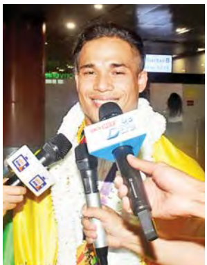
ရွှေတံဆိပ်ဆုရ ရဲထွန်းနောင်