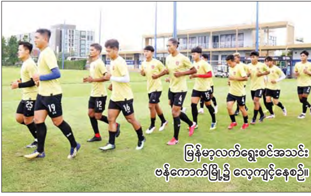
မြန်မာ့လက်ရွေးစင်အသင်း ဗီဖာ(A)အဆင့် နိုင်ငံတကာခြေစမ်းပွဲတို့ ယှဉ်ပြိုင်ကစားမည်ဖြစ်သည်။ မြန်မာ့လက်ရွေးစင်အသင်းကို နည်းပြချုပ် အန်တွမ်နီဟေးက ပဏာမကစားသမား ၂၇ ဦးဖြင့် ဖွဲ့စည်းထားပြီး ယင်းခြေစမ်းပွဲများအပြီးတွင် အပြီးသတ်လူစာရင်း ထုတ်ပြန်မည်ဖြစ်သည်။ မြန်မာ့လက်ရွေးစင်အသင်းသည် အာရှဖလားတတိယအဆင့်ခြေစစ်ပွဲတွင် အိမ်ရှင် ကာဂျစ္စတန်၊ တာဂျစ်ကစ္စတန်၊ စင်ကာပူအသင်းများနှင့် အုပ်စု(F)၌ ကျရောက်နေသည်။ မြန်မာအသင်းသည် ထိုင်းနိုင်ငံ ဗန်ကောက်မြို့ရှိ Alpine Training Camp တွင် လေ့ကျင့်မှုများပြုလုပ်ကာ ခြေစမ်းပွဲများကစားပြီးနောက် ဇွန် ၃ ရက်တွင် အာရှခြေစစ်ပွဲ ပွဲစဉ်များ ယှဉ်ပြိုင်ကစားရန် ကာဂျစ္စတန်နိုင်ငံသို့ ဆက်လက်ထွက်ခွာမည် ဖြစ်သည်။ သတင်း - ကိုညီလေး

ရန်ကုန် မေ ၂၂ မြန်မာ့လက်ရွေးစင် အသင်းသည် ၂၀၂၃ အာရှဖလား တတိယအဆင့်ခြေစစ်ပွဲအတွက် ကြိုတင်ပြင်ဆင်သည့်အနေဖြင့် ထိုင်းနိုင်ငံ ဗန်ကောက်မြို့၌ လေ့ကျင့်မှုပြုလုပ်မည်ဖြစ်ပြီး နိုင်ငံတကာခြေစမ်းပွဲ နှစ်ပွဲယှဉ်ပြိုင်ကစားမည်ဖြစ်သည်။ မြန်မာ့လက်ရွေးစင်အသင်းသည် အကြိုပြင်ဆင်မှုများ ပြုလုပ်ရန် ယနေ့နံနက်ပိုင်းက ထိုင်းနိုင်ငံသို့ ထွက်ခွာသွားပြီး မေ ၂၂ ရက် ညနေပိုင်းမှစတင်ကာ ထိုင်းနိုင်ငံ၌ လေ့ကျင့်မှုပြုလုပ်လျက်ရှိသည်။ မြန်မာ့လက်ရွေးစင်အသင်းသည် နိုင်ငံတကာခြေစမ်းပွဲများအဖြစ် မေ ၂၄ ရက်တွင် ဟောင်ကောင်လက်ရွေးစင်အသင်းနှင့် Training Match လေ့ကျင့်ခြေစမ်းပွဲ၊ မေ ၂၇ ရက်တွင် ဘာရိန်း လက်ရွေးစင်အသင်းနှင့်