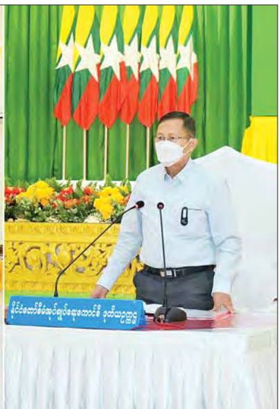
နိုင်ငံတော်စီမံအုပ်ချုပ်ရေးကောင်စီဒုတိယဥက္ကဋ္ဌ အမျိုးသားသဘာဝဘေးအန္တရာယ်ဆိုင်ရာ စီမံခန့်ခွဲမှုကော်မတီဥက္ကဋ္ဌ ဒုတိယတပ်မတော်ကာကွယ်ရေးဦးစီးချုပ် ကာကွယ်ရေးဦးစီးချုပ်(ကြည်း) ဒုတိယဗိုလ်ချုပ်မှူးကြီး စိုးဝင်း မော်လမြိုင်မြို့နယ်၊ ချောင်းဆုံမြို့နယ်၊ သံဖြူဇရပ်မြို့နယ်၊ သထုံမြို့နယ်၊ ပေါင်မြို့နယ်တို့ရှိ ရေဘေးသင့်ပြည်သူများ၊ မွန်ပြည်နယ် သဘာဝဘေးအန္တရာယ်ဆိုင်ရာစီမံခန့်ခွဲမှုအဖွဲ့များနှင့် ဌာနဆိုင်ရာတာဝန်ရှိသူများအား တွေ့ဆုံအမှာစကားပြောကြားစဉ်။

သောကျန်းမာရေးစောင့်ရှောက်မှုလုပ်ငန်းများ ဆောင်ရွက်ပေးမှုအခြေအနေများကို ရှင်းလင်းတင်ပြသည်။