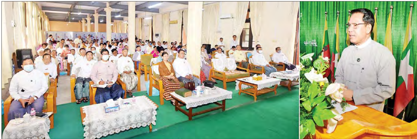
ပြည်ထောင်စုဝန်ကြီး ဦးမောင်မောင်အုန်း မြန်မာနိုင်ငံစာရေးဆရာအသင်း တတိယအကြိမ် ညီလာခံတွင် အမှာစကားပြောကြားစဉ်။