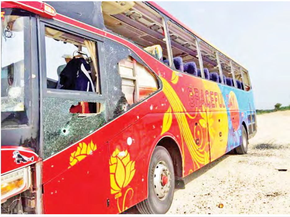
ဝက်လက်မြို့နယ် ရွှေဘို-မန္တလေးကားလမ်းမကြီး၌ ခရီးသည်ယာဉ်အား မိုင်းခွဲ။

နေပြည်တော် မေ ၂၂ စစ်ကိုင်းတိုင်းဒေသကြီး ဝက်လက်မြို့နယ်ရွှေဘို-မန္တလေးကားလမ်းမကြီးပေါ်၌ သွားလာနေသည့် မော်တော်ယာဉ်များအား မေ ၂၁ ရက် နံနက်ပိုင်းတွင် PDF အမည်ခံအကြမ်းဖက်သမားများက လက်လုပ်မိုင်းများဖြင့် ဖောက်ခွဲတိုက်ခိုက်သဖြင့် ခရီးသည်တင်မှန်လုံယာဉ်တစ်စီး ထိခိုက်ပျက်စီးကာ ခရီးသည် အမျိုးသမီးနှစ်ဦးထိခိုက်ဒဏ်ရာရရှိခဲ့ကြောင်း သိရသည်။