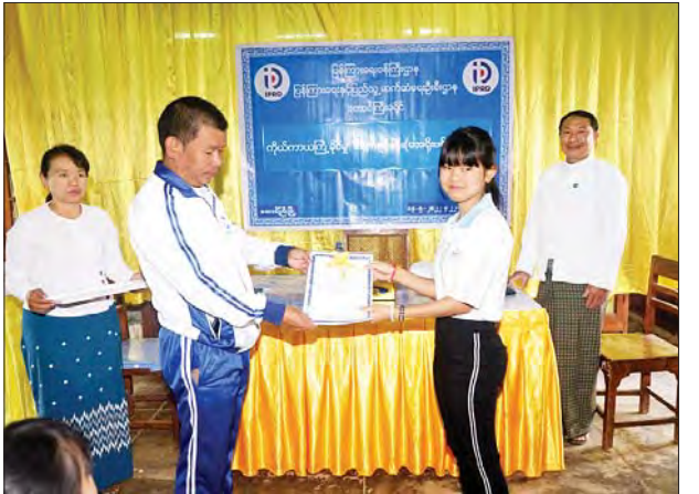
ကိုယ်ကာယကြံ့ခိုင်မှုလေ့ကျင့်ခန်း (အေရီးဗစ်)ကို ကြိုးစားသင်ယူခဲ့ကြသည့်အတွက် များစွာကျေးဇူးတင်ပါကြောင်း၊ လူငယ်များဗလငါးတန် ဖွံ့ဖြိုးရေးနှင့်စပ်လျဉ်း