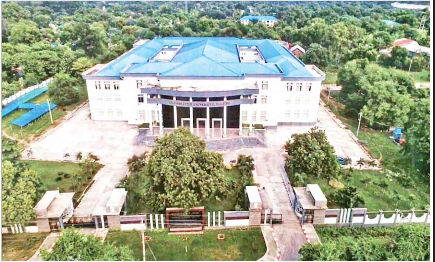
သမဝါယမနှင့် စီမံခန့်ခွဲမှုပညာတက္ကသိုလ်(စစ်ကိုင်း)

အညာမြေသို့ ခရီးတစ်ခေါက် “လောကကြီးမှာ မမျှော်လင့်သောအရာတို့သည် ဖြစ်တတ်ကြလေရာ အံ့ဩစရာမဟုတ်ဘဲ..... ဖြစ်လာမှသာလျှင်၊ ဪ... ငါဖြစ်လာပါ ပကောဟု အံ့ဩရပေတော့သတည်း ...”