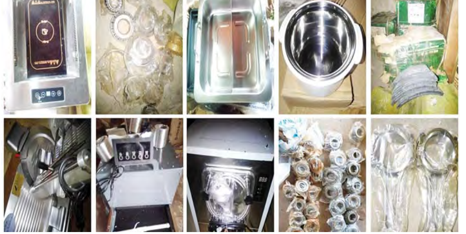
မူဆယ် ၁၀၅ မိုင် ကုန်သွယ်ရေးဇုန်၌ သိမ်းဆည်းရမိမှု။

နေပြည်တော် မေ ၂၂ တရားမဝင် ကုန်သွယ်မှုတိုက်ဖျက်ရေး ဦးဆောင်ကော်မတီ၏ ကြီးကြပ်ကွပ်ကဲမှုဖြင့် တရားမဝင်ကုန်သွယ်မှုများကို ဥပဒေနှင့်အညီ ထိရောက်စွာတားဆီးအရေးယူနိုင်ရေး ဆောင်ရွက်လျက်ရှိရာ မေ ၂၁ ရက်တွင် မူဆယ် ၁၀၅ မိုင် ကုန်သွယ်ရေးဇုန်၌ ဌာနဆိုင်ရာအဖွဲ့စုံဖြင့် စစ်ဆေးမှုများ ဆောင်ရွက်ခဲ့ရာ သံတိုသစ်(အဟောင်း) များနှင့် အတူ ရောနှောသယ်ဆောင်လာသော တရားဝင်စာရွက်စာတမ်းအထောက်အထား တစ်စုံတစ်ရာ တင်ပြနိုင်ခြင်းမရှိသည့် မော်တော်ကားအပိုပစ္စည်းများနှင့် ဟော့ပေါ့ဆိုင်သုံးပစ္စည်းအမျိုးမျိုး (ခန့်မှန်းတန်ဖိုးငွေကျပ် ၆၅၀၀၀၀)၊ Wheel Loader လုပ်ငန်းသုံး ယာဉ်အဟောင်း တစ်စီး (ခန့်မှန်းတန်ဖိုးငွေကျပ် ၁၅၀၀၀၀)နှင့် အဆိုပါပစ္စည်းများ တင်ဆောင်လာသော Mitsubishi Fuso အမျိုးအစား ၁၂ ဘီးကုန် တင်ယာဉ်တစ်စီး (ခန့်မှန်းတန်ဖိုးငွေကျပ် ၃၅၀၀၀၀) စုစုပေါင်း ခန့်မှန်းတန်ဖိုးငွေကျပ် ၄၀၀၀၀၀ ကို သိမ်းဆည်းရမိခဲ့ပြီး အကောက်ခွန် လုပ်ထုံးလုပ်နည်းနှင့်အညီ အရေးယူဆောင်ရွက်လျက်ရှိသည်။ အလားတူ စစ်ကိုင်းတိုင်းဒေသကြီး တရားမဝင်ကုန်သွယ်မှု တိုက်ဖျက်ရေးအထူးအဖွဲ့၏ စီမံ