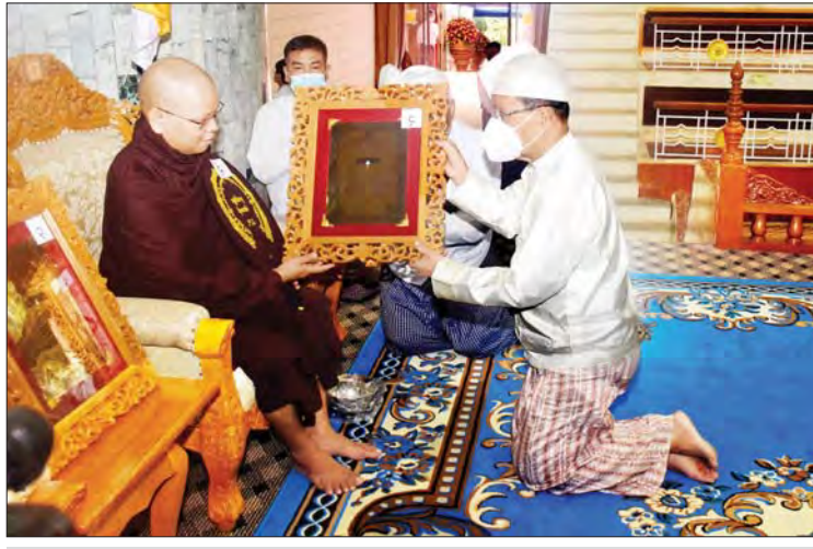
ပြည်ထောင်စုဝန်ကြီး ဦးကိုကို ပိဋကတ်တစ်ပုံ ရေးဖြေအောင် ရန်ကုန်တိုင်းဒေသကြီး ဒဂုံမြို့သစ်(အရှေ့ပိုင်း)မြို့နယ် တိပိဋကမဟာဂန္ထဝင်နိကာယ်ကျောင်းတိုက်မှ အရှင်ပါမောက္ခအား ဘွဲ့တံဆိပ်တော်နှင့် အောင်လက်မှတ် ဆက်ကပ်လှူဒါန်းစဉ်။

ထို့နောက် နိုင်ငံတော်သံဃမဟာနာယကအဖွဲ့ဥက္ကဋ္ဌ ဗန်းမော်ဆရာတော် ဒေါက်တာ ဘဒ္ဒန္တကုမာရာဘိဝံသက သာရဏီယဩဝါဒကထာကို ဖတ်ကြားချီးမြှင့်တော်မူသည်။ (နိုင်ငံတော် သံဃမဟာနာယကအဖွဲ့၏ သာရဏီယဩဝါဒကထာကို စာမျက်နှာ ၃ တွင် ဖော်ပြထားပါသည်။) ယင်းနောက် သာသနာရေးနှင့် ယဉ်ကျေးမှုဝန်ကြီးဌာန ပြည်ထောင်စု