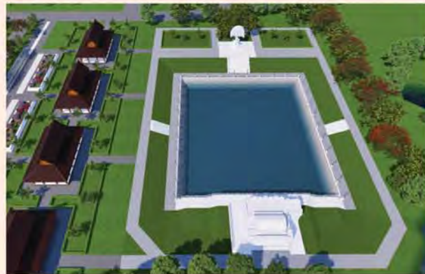
ကျောက်စာရုံစေတီ(၁၂ x ၁၂x ၁၈)ပေ ၁ ဆူ တန်ဖိုး-၂၇၉ သိန်း