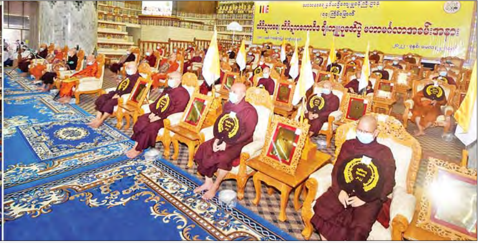
တိပိဋကဓရ တိပိဋကကောဝိဒ ရွေးချယ်ရေးစာမေးပွဲ ဩဝါဒါစရိယအဖွဲ့ ဒုတိယဥက္ကဋ္ဌ ဧရာဝတီတိုင်းဒေသကြီး ဟင်္သာတမြို့ မိုးကောင်းကျောင်းတိုက် ပဓာနနာယက အဘိဓမ္မမဟာရဋ္ဌဂုရု အဘိဓမ္မအဂ္ဂမဟာသဒ္ဓမ္မ ဇောတိက ဘဒ္ဒန္တသုဓမ္မာစာရာဘိဝံသ မဟာထေရ်မြတ်ကြီးထံမှ နိုင်ငံတော်စီမံအုပ်ချုပ်ရေးကောင်စီဒုတိယဥက္ကဋ္ဌ ဒုတိယတပ်မတော်ကာကွယ်ရေးဦးစီးချုပ် ကာကွယ်ရေးဦးစီးချုပ်(ကြည်း) ဒုတိယဗိုလ်ချုပ်မှူးကြီး စိုးဝင်း အမှူးပြုသော ဧည့်ပရိသတ်များက ငါးပါးသီလ ခံယူဆောက်တည်ကြစဉ်။