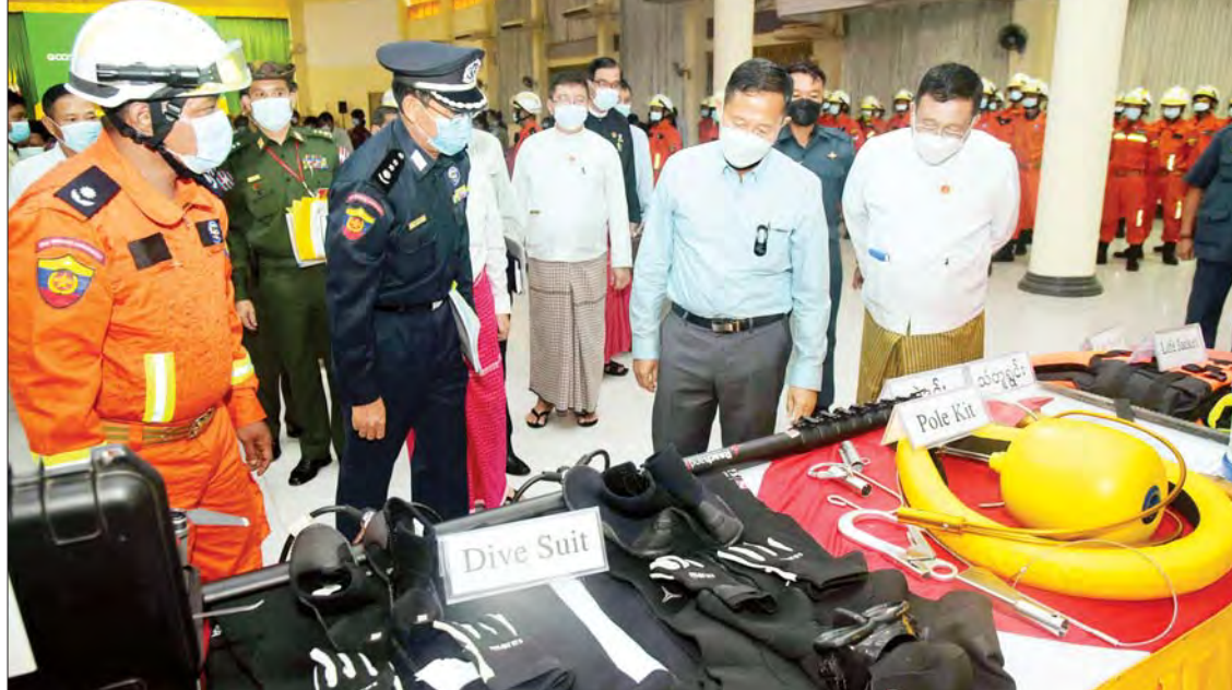
နိုင်ငံတော်စီမံအုပ်ချုပ်ရေးကောင်စီဒုတိယဥက္ကဋ္ဌ အမျိုးသားသဘာဝဘေးအန္တရာယ်ဆိုင်ရာ စီမံခန့်ခွဲမှုကော်မတီဥက္ကဋ္ဌ ဒုတိယတပ်မတော်ကာကွယ်ရေးဦးစီးချုပ် ကာကွယ်ရေးဦးစီးချုပ်(ကြည်း) ဒုတိယဗိုလ်ချုပ်မှူးကြီး စိုးဝင်း အသင့်ပြင်ဆင်စုဖွဲ့ထားရှိသော ကူညီကယ်ဆယ်ရေးပစ္စည်းများကို လိုက်လံကြည့်ရှုစဉ်။

ဦးစွာ ပြည်နယ်ဝန်ကြီးချုပ်က ရေကြီးရေလျှံမှုများ ဖြစ်ပေါ်ခဲ့သည့်အခြေအနေ၊ ရေဘေးသင့်ပြည်သူများအား ရေဘေးရှောင်စခန်းများသို့ ပြောင်းရွှေ့နေရာချထားမှု၊ ပြည်နယ်အစိုးရနှင့် နယ်မြေခံတပ်မတော်သားများ၊ လူမှုကူညီရေးအသင်းအဖွဲ့များမှ ရေဘေးရှောင်ပြည်သူများအား ကူညီဆောင်ရွက်ပေးနေမှုအခြေအနေ၊ ရေကြီးရေလျှံမှုများကြောင့် လမ်း၊ တံတား၊ အဆောက်အအုံများ ပျက်စီးဆုံးရှုံးမှုနှင့် ပြုပြင်ပြီးစီးမှုအခြေအနေ၊ သဘာဝဘေးအန္တရာယ်ဆိုင်ရာ စီမံခန့်ခွဲမှုအဖွဲ့များ ဖွဲ့စည်းထားရှိမှု၊ ရေဘေးရှောင်ပြည်သူများအား လိုအပ်