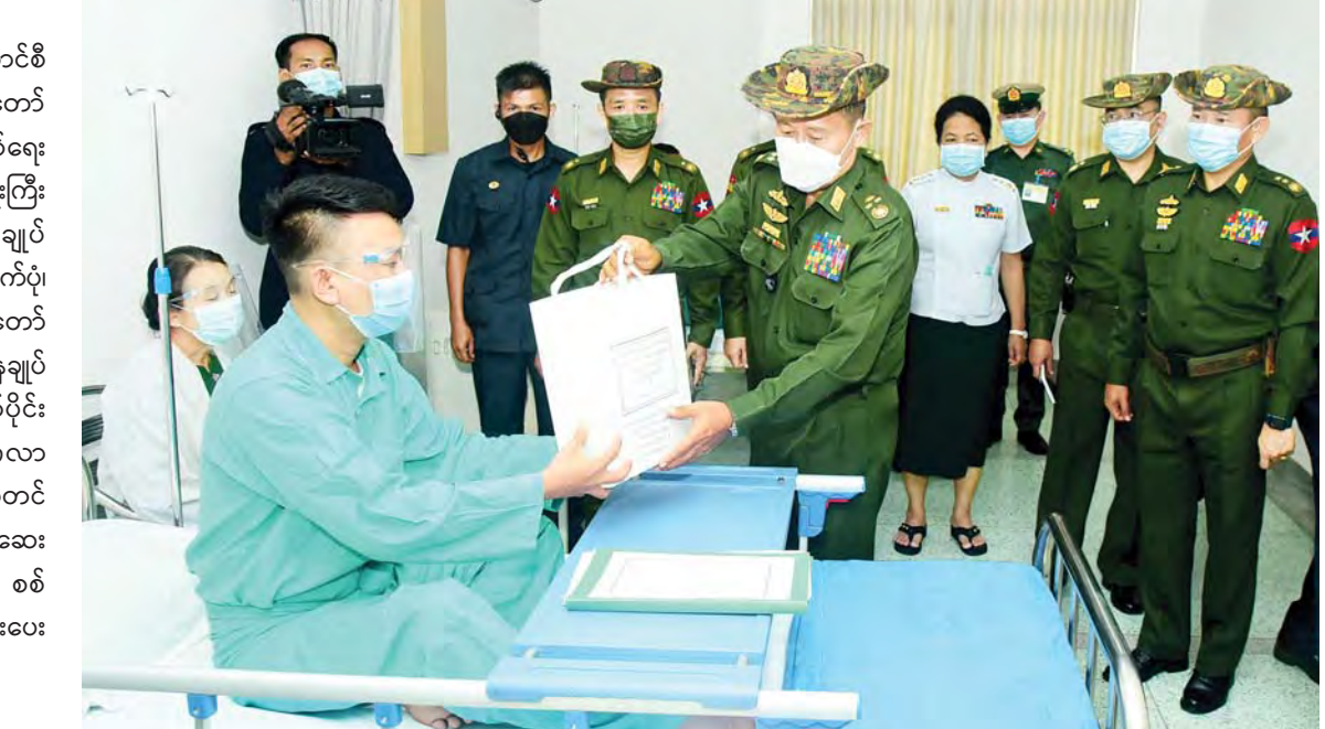
နိုင်ငံတော်စီမံအုပ်ချုပ်ရေးကောင်စီ ဒုတိယဥက္ကဋ္ဌ ဒုတိယတပ်မတော်ကာကွယ်ရေးဦးစီးချုပ် ကာကွယ်ရေးဦးစီးချုပ်(ကြည်း) ဒုတိယဗိုလ်ချုပ်မှူးကြီး စိုးဝင်း တပ်မတော်ဆေးရုံကြီး ခုတင်(၁၀၀၀)တွင် ဆေးကုသမှုခံယူလျက်ရှိသူတစ်ဦးအား စားသောက်ဖွယ်ရာများနှင့် ထောက်ပံ့ပစ္စည်းများ ပေးအပ်စဉ်။

နေပြည်တော် မေ ၂၂ နိုင်ငံတော်စီမံအုပ်ချုပ်ရေးကောင်စီ ဒုတိယဥက္ကဋ္ဌ ဒုတိယတပ်မတော်ကာကွယ်ရေးဦးစီးချုပ် ကာကွယ်ရေးဦးစီးချုပ်(ကြည်း) ဒုတိယဗိုလ်ချုပ်မှူးကြီး စိုးဝင်းသည် ကာကွယ်ရေးဦးစီးချုပ်ရုံး(ကြည်း)မှ ဒုတိယဗိုလ်ချုပ်ကြီး သက်ပုံ၊ ကာကွယ်ရေးဦးစီးချုပ်ရုံးမှ တပ်မတော်အရာရှိကြီးများ၊ ရန်ကုန်တိုင်းစစ်ဌာနချုပ်တိုင်းမှူးတို့လိုက်ပါ၍ ယနေ့နံနက်ပိုင်းတွင် ရန်ကုန်တိုင်းဒေသကြီး မင်္ဂလာဒုံမြို့နယ် တပ်မတော်ဆေးရုံကြီး ခုတင်(၁၀၀၀)တွင် ဆေးရုံတက်ရောက် ဆေးကုသမှုခံယူလျက်ရှိသည့် အရာရှိ၊ စစ်သည်၊ မိသားစုများအား ကြည့်ရှုအားပေးစကားပြောကြားသည်။