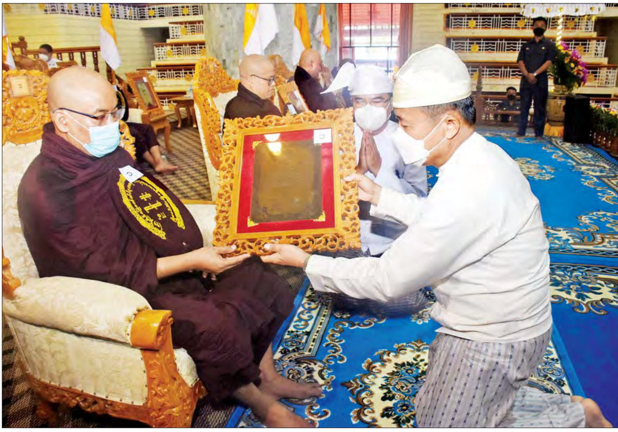
နိုင်ငံတော်စီမံအုပ်ချုပ်ရေးကောင်စီ ဒုတိယဥက္ကဋ္ဌ ဒုတိယတပ်မတော်ကာကွယ်ရေးဦးစီးချုပ် ကာကွယ်ရေးဦးစီးချုပ်(ကြည်း) ဒုတိယ ဗိုလ်ချုပ်မှူးကြီးစိုးဝင်း တံပိဋကနစ်ပုံခွဲ ရေးဖြေအောင် မူလအဘိဓမ္မကောဝိဒဘွဲ့တံဆိပ်တော်ရ ရန်ကုန်တိုင်းဒေသကြီး ဒဂုံမြို့သစ်(အရှေ့ပိုင်း) မြို့နယ် တံပိဋကမဟာဂန္ထဝင်နိကာယ်ကျောင်းတိုက်မှ အရှင်မာနိတအား ဘွဲ့တံဆိပ်တော်နှင့် အောင်လက်မှတ် ဆက်ကပ်လှူဒါန်းစဉ်။

ရန်ကုန် မေ ၂၂ ပြည်ထောင်စုသမ္မတမြန်မာနိုင်ငံတော် သာသနာရေးနှင့် ယဉ်ကျေးမှုဝန်ကြီးဌာနက ကြီးမှူးကျင်းပသော (၇၄)ကြိမ်မြောက် တံပိဋကဓရ တံပိဋကကောဝိဒရွေးချယ်ရေးစာမေးပွဲတွင် အောင်မြင်တော် မူကြသည့် သာသနာ့အာဇာနည်အရှင်သူမြတ် အပါး ၂၀ တို့အား ချီးကျူးပူဇော်ပွဲနှင့် အောင်လက်မှတ် ဆက်ကပ်လှူဒါန်းပွဲ မဟာမင်္ဂလာ အခမ်းအနားကို ယနေ့နံနက် ၈ နာရီတွင် ရန်ကုန်မြို့ သီရိမင်္ဂလာကမ္ဘာအေး ကုန်းမြေရှိ မဟာပါသာဏာလိုဏ်ဂူသိမ်တော်ကြီး၌ ကျင်းပသည်။ ကြွရောက်တော်မူ အခမ်းအနားသို့ နိုင်ငံတော်သံဃမဟာနာယကအဖွဲ့ဥက္ကဋ္ဌ အဘိဓဇမဟာရဋ္ဌဂုရု အဘိဓဇအဂ္ဂမဟာသဒ္ဓမ္မဇောတိက မန္တလေးမြို့ ဗန်းမော်ကျောင်းတိုက်ဆရာတော် ဒေါက်တာဘဒ္ဒန္တ ကုမာရာဘိဝံသ အမှူးပြုသော ဆရာတော်ကြီးများ၊ တံပိဋကဓရ တံပိဋကကောဝိဒ ရွေးချယ်ရေးအဖွဲ့၏ ဩဝါဒါစရိယဆရာတော်ကြီးများ၊ တံပိဋကဓမ္မ ဘဏ္ဍာဂါရိကဆရာတော်ကြီးများ၊ တံပိဋကဓရ တံပိဋကကောဝိဒ ဆရာတော်များ၊ စာထောက်စာမဆရာတော်များ၊ တံပိဋကပုစ္ဆက ဆရာတော်များ၊ ကြီးကြပ်ရေးဆရာတော်များ၊ (၇၄)ကြိမ်မြောက် တံပိဋကဓရ တံပိဋကကောဝိဒရွေးချယ်ရေးစာမေးပွဲတွင် သဘောရေး ဖြေအောင်မြင်တော်မူကြသည့် သာသနာ့အာဇာနည်အရှင်သူမြတ်များ ကြွရောက်တော်မူကြပြီး နိုင်ငံတော်စီမံအုပ်ချုပ်ရေးကောင်စီဒုတိယ ဥက္ကဋ္ဌ ဒုတိယတပ်မတော်ကာကွယ်ရေးဦးစီးချုပ် ကာကွယ်ရေးဦးစီးချုပ် (ကြည်း) ဒုတိယဗိုလ်ချုပ်မှူးကြီး စိုးဝင်းနှင့်အဖွဲ့ ဒေါ်သန်းသန်းနွယ်၊ နိုင်ငံတော်စီမံအုပ်ချုပ်ရေးကောင်စီအဖွဲ့ဝင် ဒေါက်တာဗညားအောင်မိုး၊ ပြန်ကြားရေးဝန်ကြီးဌာန ပြည်ထောင်စုဝန်ကြီး ဦးမောင်မောင်အုန်း၊ သာသနာရေးနှင့် ယဉ်ကျေးမှုဝန်ကြီးဌာန ပြည်ထောင်စုဝန်ကြီး ဦးကိုကို၊ စာမျက်နှာ ၄ ကော်လံ ၁ သို့