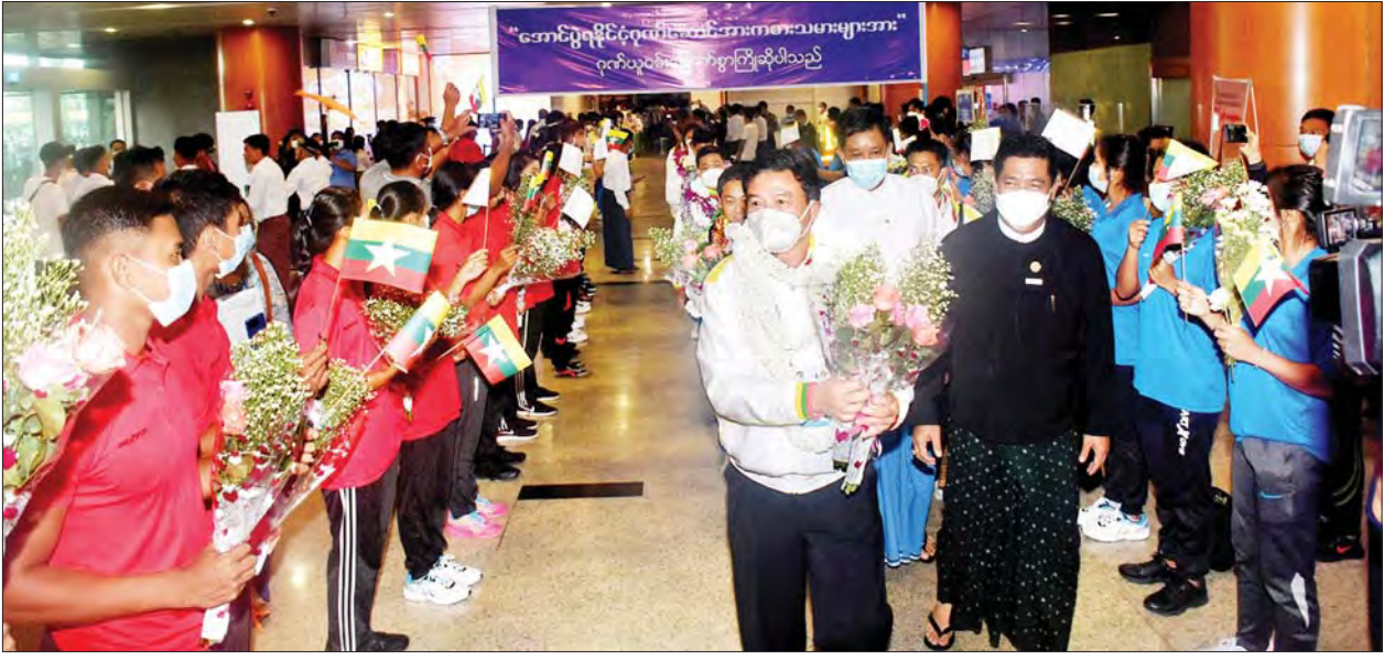
(၃၁) ကြိမ်မြောက် အရှေ့တောင်အာရှအားကစားပြိုင်ပွဲတွင် ဝင်ရောက်ယှဉ်ပြိုင်ခဲ့သော မြန်မာအားကစားသမားများအား ရန်ကုန်အပြည်ပြည်ဆိုင်ရာလေဆိပ်သို့ သောင်းသောင်းဖြူဖြူဆိုကြစဉ်။

ဗီယက်နမ်နိုင်ငံတွင် ကျင်းပလျက်ရှိသည့် (၃၁) ကြိမ်မြောက် အရှေ့တောင်အာရှ အားကစားပြိုင်ပွဲတွင် မြန်မာနိုင်ငံမှ အားကစားနည်း ၂၀ တွင် ဝင်ရောက်ယှဉ်ပြိုင်ခဲ့ပြီး မေ ၂၂ ရက်အထိ စုစုပေါင်းရွှေတံဆိပ်ကိုးခု၊ ငွေတံဆိပ် ၁၈ ခု၊ ကြေးတံဆိပ် ၃၅ ခု ရရှိထားကြောင်း သိရသည်။ သတင်း - နဒီမင်း