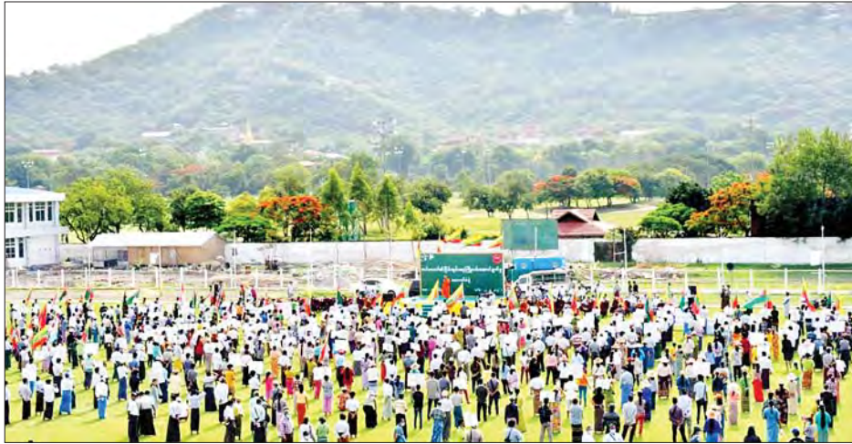
ဦးစွာ တက်ရောက်လာကြသူများက ပြည်ထောင်စုသမ္မတ မြန်မာနိုင်ငံတော်အလံအား အလေးပြု၍ နိုင်ငံတော်သီချင်းကို သီဆိုကာ အခမ်းအနားကို ဖွင့်လှစ်ကြသည်။ ထို့နောက် ငြိမ်းချမ်းရေးကို လိုလားသူ အမျိုးသားရေးဦးဆောင် ဆရာတော်များနှင့် စာရေးဆရာ၊ ဆရာမများက ငြိမ်းချမ်းရေးကြိုးပမ်းမှုလုပ်ငန်းများကို ကြိုဆိုထောက်ခံခြင်းနှင့် ပြည်ပစွက်ဖက်နှောင့်ယှက်မှုများကို ဆန့်ကျင်ရှုတ်ချ

နေပြည်တော် မေ ၂၂ ပြည်ထောင်စုသမ္မတမြန်မာနိုင်ငံတော်အစိုးရ နိုင်ငံတော်စီမံအုပ်ချုပ်ရေးကောင်စီဥက္ကဋ္ဌ နိုင်ငံတော်ဝန်ကြီးချုပ် ဗိုလ်ချုပ်မှူးကြီး မင်းအောင်လှိုင်၏ တိုင်းရင်းသားလက်နက်ကိုင်အဖွဲ့အစည်းများကို ငြိမ်းချမ်းရေးဆွေးနွေးပွဲအတွက် ဖိတ်ခေါ်မှုကို ပြည်သူများက ကြိုဆိုထောက်ခံသည့်အနေဖြင့် ငြိမ်းချမ်းရေးကြိုးပမ်းဆောင်ရွက်မှုလုပ်ငန်းများကို ကြိုဆိုထောက်ခံခြင်းနှင့် ပြည်ပစွက်ဖက်နှောင့်ယှက်မှုများအား ဆန့်ကျင်ရှုတ်ချပွဲကို ယနေ့နံနက်ပိုင်းတွင် မန္တလေးတိုင်းဒေသကြီး အောင်မြေသာစံမြို့နယ်ရှိ ရွှေမန်းတောင်အားကစားကွင်း၌ ပြုလုပ်သည်။ အဆိုပါ ကြိုဆိုထောက်ခံပွဲသို့ ပြည်ထောင်စုကြံ့ခိုင်ရေးနှင့်ဖွံ့ဖြိုးရေးပါတီမှ တာဝန်ရှိသူများ၊ အမျိုးသားရေးဆရာတော်များ၊ ငြိမ်းချမ်းရေးကို လိုလားသူ ပြည်သူများ စုစုပေါင်းအင်အား ၃၀၀၀ ခန့် တက်ရောက်ကြသည်။