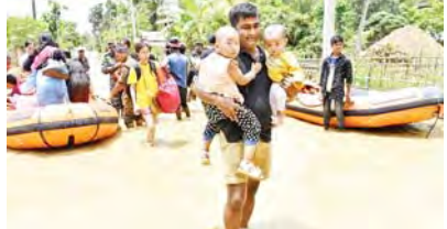
စာမျက်နှာ » ၁၃

ရွှေဘို-မန္တလေးကားလမ်းမကြီးပေါ်၌ သွားလာနေသည့် မော်တော်ယာဉ်များအား PDF အမည်ခံ အကြမ်းဖက်သမား များက လက်လုပ်မိုင်းများဖြင့် ဖောက်ခွဲတိုက်ခိုက်သဖြင့် ခရီးသည်တင်မှန်လုံယာဉ်တစ်စီး ထိခိုက်ပျက်စီးကာ ခရီးသည် အမျိုးသမီးနှစ်ဦး ထိခိုက်ဒဏ်ရာရ စာမျက်နှာ » ၁၄