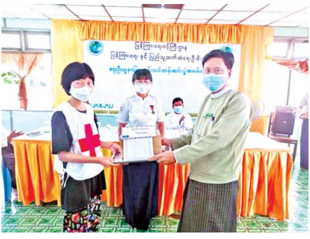
ကြားသည်။ ဆက်လက်ပြီး သင်တန်းတွင် စာတွေ့လက်တွေ့ သင်ကြားပို့ချပေးသော ဘာသာ ရပ်များကို ဆန်းစစ်ဖြေဆိုခဲ့ရာတွင် အကောင်းဆုံး ဖြေဆိုနိုင်ခဲ့သော ပထမ၊ ဒုတိယနှင့် တတိယ ရရှိ

မန္တလေးတိုင်း ဒေသကြီး သာစည်မြို့နယ် ပြန်ကြားရေးနှင့် ပြည်သူ့ဆက်ဆံရေးဦးစီးဌာနနှင့် မြို့နယ်ကြက်ခြေနီအသင်းခွဲတို့ ပူးပေါင်းဖွင့်လှစ်သော အခြေခံ ရေးဦးပြုစုခြင်း သင်တန်းဆင်းပွဲ နှင့် ဆုချီးမြှင့်ပွဲကို ယနေ့နံနက် ၁၀ နာရီက သာစည်မြို့ လူထု အခြေပြု ဗဟိုဌာနခန်းမ၌ ကျင်းပ ကြောင်း သိရသည်။