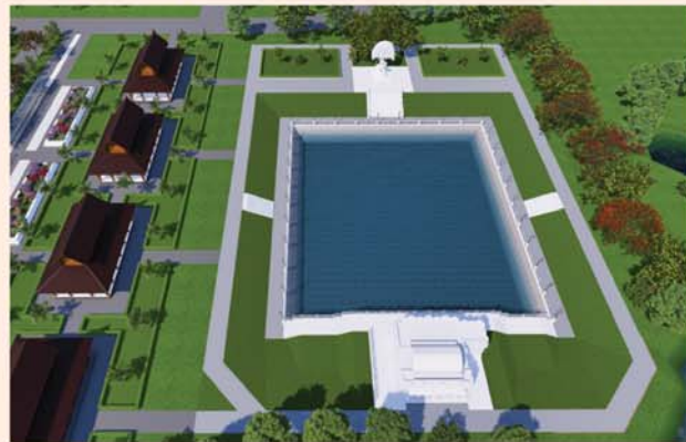
ကျောက်စာရုံစေတီ(၁၂ x ၁၂x ၁၈)ပေ ၁ ဆူ တန်ဖိုး-၂၇၉ သိန်း