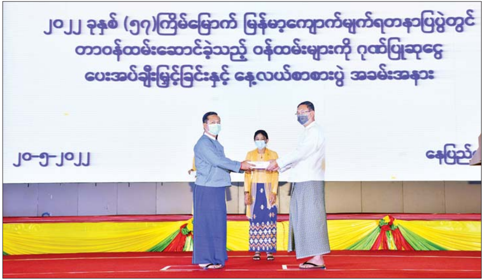
လုပ်ငန်းများကို ဆောင်ရွက်ခဲ့သဖြင့် ပြပွဲကို အောင်မြင်စွာ ကျင်းပနိုင်ခြင်းဖြစ်ကြောင်း၊ ယင်းကဲ့သို့ အောင်မြင်အောင် ကျင်းပနိုင်ရေးအတွက် အကောင်အထည်ဖော် ဆောင်ရွက်ကြရာတွင် ဝန်ထမ်းများ၏ ဆောင်ရွက်ချက်များသည် အဓိက အရေးကြီးသည့် အခန်းကဏ္ဍတွင် ပါဝင်နေကြောင်း၊

ပြည်ထောင်စုဝန်ကြီးက ၂၀၂၂ ခုနှစ် (၅၇)ကြိမ်မြောက် မြန်မာ့ကျောက်မျက်ရတနာပြပွဲကို ဧပြီ ၂၂ ရက်မှ ၂၈ ရက်ထိ နေပြည်တော် မဏိရတနာကျောက်စိမ်းခန်းမတွင် အောင်မြင်စွာ ကျင်းပနိုင်ခဲ့ပြီး ဖြစ်ပါကြောင်း၊ ပြပွဲကျင်းပနိုင်ရေး စီစဉ်ဆောင်ရွက်ရာတွင် ဆက်စပ်ဌာန၊ အဖွဲ့အစည်းများ၊ အသင်းအဖွဲ့များနှင့် အသေးစိတ်ညှိနှိုင်းဆွေးနွေးခဲ့ပြီး ပြပွဲဆိုင်ရာ