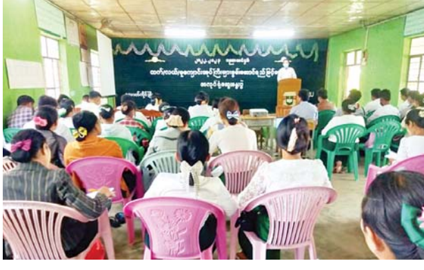
မေ ၁၉ ရက်မှ ၂၀ ရက်အထိ နှစ်ရက်ကြာဆွေးနွေးခဲ့ကြောင်း သိရ သည်။ ရွှေစင်ဖြိုး(ပြန်/ဆက်)

အဆိုပါ အလုပ်ရုံဆွေးနွေးပွဲသို့ လောက်ကိုင်မြို့နယ်အတွင်းရှိ အခြေခံပညာကျောင်းများမှ အထက်တန်းကျောင်းအုပ် လေးဦး၊ တာဝန်ခံ ကျောင်းအုပ် ၁၃ ဦး၊ မူလတန်းကျောင်းအုပ် ၅၈ ဦးတို့ တက်ရောက်ခဲ့ပြီး