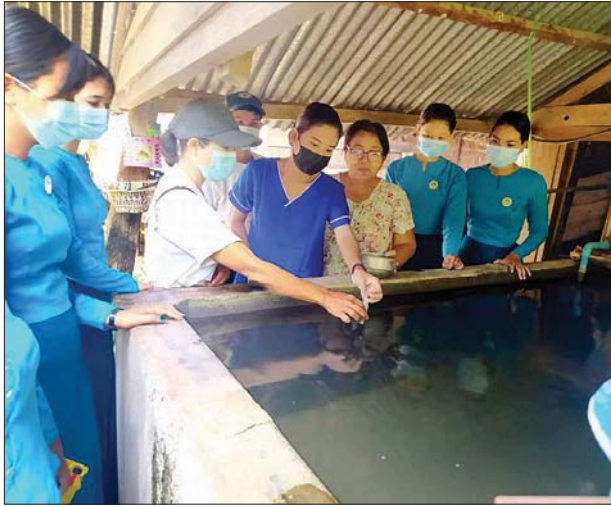
ပညာပေးလုပ်ငန်းများ ဆက်လက်ဆောင်ရွက်သွားမည်ဖြစ်ကြောင်း သိရသည်။

ထိုသို့ ဆောင်ရွက်ရာတွင် မိုးတွင်းကာလသွေးလွန်တုပ်ကွေးရောဂါ ကြိုတင်ကာကွယ်နိုင်ရေးအတွက် ခြင်္သေ့အလွယ်တကူ ပေါက်ပွားနိုင်သည့် ရေတွင်း၊ ရေကန်များ၊ ရေစည်၊ ရေပုံးများအတွင်း အဘိတ်ဆေးခတ်ခြင်း၊ ဖုံး၊ သွန်၊ လဲ၊ စစ်လုပ်ငန်းများဆောင်ရွက်ပြီး အသိပညာပေးလုပ်ငန်းများ ဆောင်ရွက်ကာ ကျန်ရှိသည့်ရပ်ကွက်၊ ကျေးရွာများသို့ အဘိတ်ဆေးခတ်ခြင်း၊ ဖုံး၊ သွန်၊ လဲ၊ စစ်နှင့် အသိ