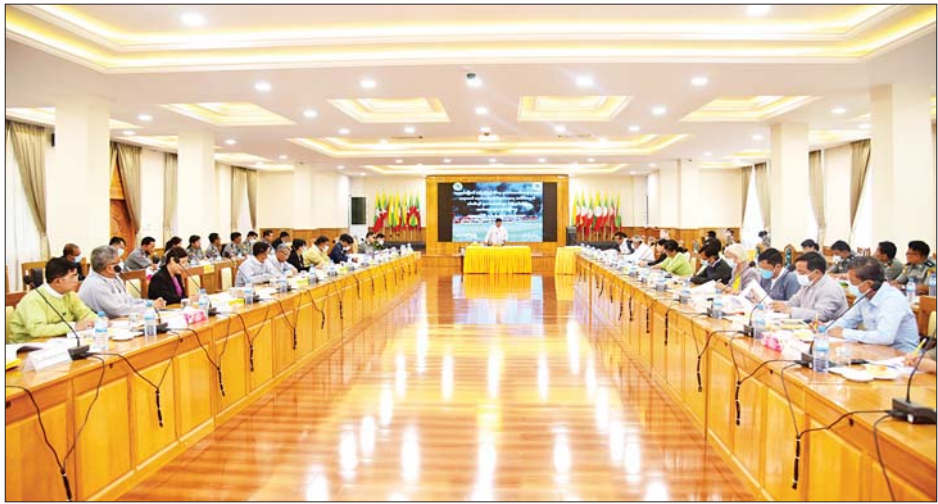
ဖြစ်ကြောင်း၊ ရှမ်းပြည်နယ်အတွင်း ဖျက်ဆီးခဲ့သည့် မူးယစ်ဆေးဝါးများကို နှစ်အလိုက် နှိုင်းယှဉ်ကြည့်ပါက ၂၀၁၅ ခုနှစ်တွင် အမေရိကန်ဒေါ်လာ ၈၂ သန်းကျော်၊ ၂၀၁၆ ခုနှစ်တွင် အမေရိကန်ဒေါ်လာ ၃၁ သန်းကျော်၊ ၂၀၁၇ ခုနှစ်တွင် အမေရိကန်ဒေါ်လာ

ညှိနှိုင်းအစည်းအဝေးတွင် ရှမ်းပြည်နယ် ဝန်ကြီးချုပ် ဒေါက်တာကျော်ထွန်းက ၂၀၂၂ ခုနှစ် ဇွန် ၂၆ ရက်တွင် ကျရောက်မည့် (၃၅)ကြိမ်မြောက် အပြည်ပြည်ဆိုင်ရာ မူးယစ်ဆေးဝါးအလွဲသုံးမှုနှင့် တရားမဝင်ရောင်းဝယ်မှု တိုက်ဖျက်ရေးနေ့ အထိမ်းအမှတ်အခမ်းအနားနှင့် ဖမ်းဆီးရမိသည့် မူးယစ်ဆေးဝါးများ မီးရှို့ဖျက်ဆီးပွဲ အခမ်းအနားများကို အောင်မြင်စွာကျင်းပနိုင်ရေးအတွက် ယခုလို အကြံပြုလုပ်ငန်းညှိနှိုင်းအစည်းအဝေးကို ကျင်းပရခြင်း