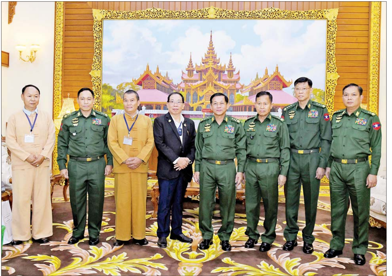
နိုင်ငံတော်စီမံအုပ်ချုပ်ရေးကောင်စီဥက္ကဋ္ဌ တပ်မတော်ကာကွယ်ရေးဦးစီးချုပ် ဗိုလ်ချုပ်မှူးကြီးမင်းအောင်လှိုင်နှင့် ရှမ်းပြည်ပြန်လည် ထူထောင်ရေးကောင်စီ RCSS(SSA)အဖွဲ့ဥက္ကဋ္ဌ စပ်ယွက်စစ်တို့ အဖွဲ့ဝင်များနှင့်အတူ စုပေါင်းမှတ်တမ်းတင်ဓာတ်ပုံရိုက်စဉ်။

အဆိုပါ ရှမ်းပြည်ပြန်လည်ထူထောင်ရေးကောင်စီ RCSS(SSA) အဖွဲ့ဥက္ကဋ္ဌ ဦးဆောင်သည့်အဖွဲ့သည် နိုင်ငံတော်စီမံအုပ်ချုပ်ရေး ကောင်စီမှ ဖွဲ့စည်းပေးထားသည့် ကောင်စီဝင်များပါဝင်သည့် ငြိမ်းချမ်းရေး ဆွေးနွေးရေးအဖွဲ့၊ အမျိုးသားစည်းလုံးညီညွတ်ရေးနှင့် ငြိမ်းချမ်းရေး ဖော်ဆောင်မှုညှိနှိုင်းရေးကော်မတီတို့နှင့် ငြိမ်းချမ်းရေးဆွေးနွေးမှုများကို ဆက်လက်ပြုလုပ်သွားမည်ဖြစ်ကြောင်း သတင်းရရှိသည်။ သတင်းစဉ်