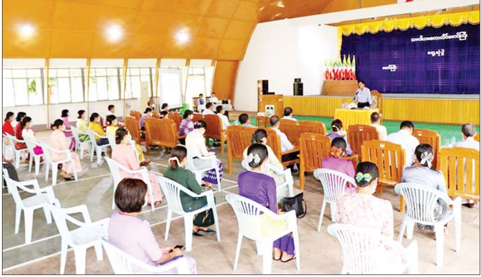
လုပ်ငန်းများ ရှင်သန်ဖွံ့ဖြိုးစေရန်၊ တိမ်ကောပျောက်မှု မရှိစေရန်၊ မြန်မာ့လက်မှုအနုပညာ ယဉ်ကျေးမှုများ ရေရှည်တည်တံ့စေရန်၊ ရိုးရာလက်မှုလုပ်ငန်းများကို အားပေးမြှင့်တင်ရန်၊ နိုင်ငံတစ်ဝန်းမှာရှိသည့် လက်မှုအနုပညာများကို တစ်နေရာတည်းမှာ လေ့လာနိုင်ရန်၊ မြန်မာ့လက်မှုထည်များ ပြည်ပသို့တင်ပို့နိုင်ရေး

ဆက်လက်၍ ပြည်ထောင်စုဝန်ကြီးနှင့် အဖွဲ့သည် မြန်မာ့ရိုးရာပန်းဆယ်မျိုး လက်မှုအနုပညာ