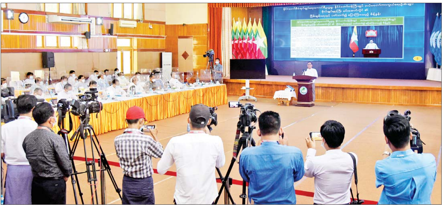
နိုင်ငံတော်စီမံအုပ်ချုပ်ရေးကောင်စီ သတင်းထုတ်ပြန်ရေးအဖွဲ့၏ (၁၄) ကြိမ်မြောက် သတင်းစာရှင်းလင်းပွဲ ပြုလုပ်စဉ်။

ပြည်သူလူထုအကျိုးကိုရှေးရှုပြီး ငြိမ်းချမ်းရေးကို နှစ်နှစ်ကာကာလိုလားသည့်စိတ်၊ ညီညွတ်စွာ ပူးပေါင်းဆောင်ရွက်လိုသည့်စိတ်များနှင့် ကြိုးစားဆောင်ရွက်သွားကြရမည်ဖြစ်ကြောင်း၊ ငြိမ်းချမ်းရေးနှင့်ပတ်သက်သည့် ကိစ္စရပ်တွင် သဘောထားကြီးကြီးထားပြီး မိမိတို့၏စိတ်ခံစားချက်၊ အတ္တကို အခြေခံသည့် ထင်မြင်ယူဆချက်များကို ဘေးချိတ်