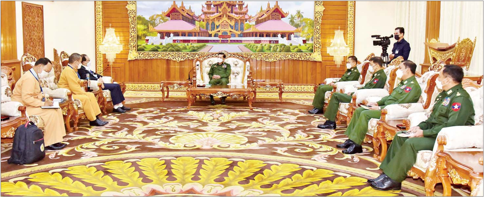
နိုင်ငံတော်စီမံအုပ်ချုပ်ရေးကောင်စီဥက္ကဋ္ဌ တပ်မတော်ကာကွယ်ရေးဦးစီးချုပ် ဗိုလ်ချုပ်မှူးကြီးမင်းအောင်လှိုင် ရှမ်းပြည်ပြန်လည်ထူထောင်ရေးကောင်စီ RCSS(SSA)အဖွဲ့ဥက္ကဋ္ဌ စပ်ယွက်စစ် ဦးဆောင်သည့် ကိုယ်စားလှယ်အဖွဲ့နှင့် တွေ့ဆုံ၍ ငြိမ်းချမ်းရေးဆိုင်ရာကိစ္စရပ်များ ဆွေးနွေးစဉ်။