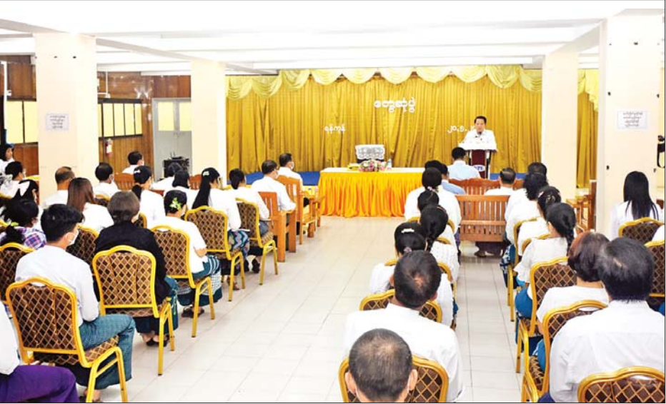
ပြည်ထောင်စုဝန်ကြီး ဦးမောင်မောင်အုန်း သတင်းနှင့်စာနယ်ဇင်းလုပ်ငန်း(ရုံးချုပ်) ရွှေဥဒေါင်းခန်းမ၌ ဝန်ထမ်းများနှင့် တွေ့ဆုံအမှာစကားပြောကြားစဉ်။

ယင်းနောက် သိမ်ဖြူလမ်းရှိ သတင်းနှင့် စာနယ်ဇင်းလုပ်ငန်း(ရုံးချုပ်) ရွှေဥဒေါင်းခန်းမ၌ ဝန်ထမ်းများနှင့်တွေ့ဆုံ၍ ဒီမိုကရေစီစနစ်တွင် မီဒီယာကဏ္ဍသည် အလွန်အရေးပါပြီး နိုင်ငံတော်ကို ခေတ်မီဖွံ့ဖြိုးအောင် တည်ဆောက်ရာတွင် အရေးကြီး ကြောင်း၊ MRTV ကို ခေတ်နှင့်လျော်ညီသော၊ နုပျို သစ်လွင်သော၊ ပြည်သူများစိတ်ဝင်စားမည့် အစီအစဉ်ကောင်းများ စီစဉ်ထုတ်လွှင့်နိုင်ရေး ပြောင်းလဲ ဆောင်ရွက်လျက်ရှိကြောင်း၊ အလားတူ သတင်းနှင့် စာနယ်ဇင်းလုပ်ငန်းက ထုတ်ဝေသည့် နိုင်ငံပိုင် သတင်းစာများကလည်း ပြည်သူများအား သတင်း