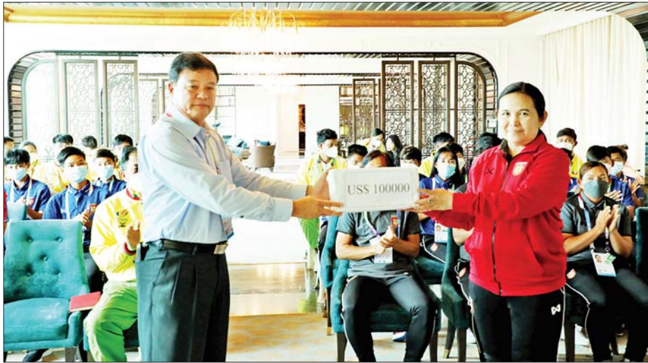
မြန်မာအမျိုးသမီး ဘောလုံးအသင်းသည် အကြံဉာဏ်လှပွဲ အဖြစ် မေ ၁၆ ရက်တွင် ဗီယက်နမ် အမျိုးသမီးဘောလုံးအသင်းနှင့် ယှဉ်ပြိုင်ကစားမည် ဖြစ်သည်။

တွေ့ဆုံစဉ် ပြည်ထောင်စုဝန်ကြီးက မြန်မာ တို့၏ မဆုတ်မနစ်သော ဇွဲ၊ လုံ့လ ကြိုးစားအားထုတ်မှုကို ပြသယုဉ်ပြိုင်သွားကြရန်၊ အားကစားဖြင့် နိုင်ငံတော်၏ဂုဏ်ကို မြှင့်တင်ကြရန်နှင့် အောင်မြင်မှု ရရှိသည်နှင့်အမျှ နိုင်ငံတော်နှင့် ပြည်သူတစ်ရပ်လုံးက စောင့်မျှော် အားပေးဂုဏ်ပြုကြမည်ဖြစ်ကြောင်း ပြောကြားပြီး အကြံဉာဏ်လှပွဲသို့ တက်ရောက်သွားသည့် မြန်မာအမျိုးသမီး ဘောလုံးအသင်းကို နိုင်ငံတော်က ချီးမြှင့်ငွေအမေရိကန်ဒေါ်လာ တစ်သိန်း ပေးအပ်သည်။