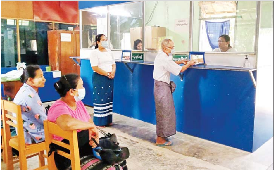
၁၀ ဧကအတွက် ချေးငွေကျပ် ၂၉ ဒသမ ၆၅ သန်း စတင်ထုတ်ချေးပေးလျက်ရှိပါသည်။ ပြည်ထောင်စုနယ်မြေ နေပြည်တော် မြန်မာ့လယ်ယာဖွံ့ဖြိုးရေးဘဏ် ကွပ်ကဲမှုအောက်ရှိ ဘဏ်ခွဲလေးခုမှ နေပြည်တော် နယ်မြေအတွင်းရှိ တောင်သူများသို့ ချေးငွေများ စိုက်ပျိုးရာသီချိန်အမီရရှိရေး ဆက်လက်ထုတ်ချေးပေးသွားမည်ဖြစ်ကြောင်း သိရသည်။ သတင်းစဉ်

ဖြင့် မိုးစပါး တစ်ဧကလျှင် ငွေကျပ် ၁၅၀၀၀၀ နှုန်း၊ အခြားသီးနှံ တစ်ဧကလျှင် ငွေကျပ် ၁၀၀၀၀၀ နှုန်း ထုတ်ချေးပေးလျက်ရှိပါသည်။ ၂၀၂၂ ခုနှစ် မိုးရာသီစိုက်ပျိုးစရိတ်ချေးငွေများကို လယ်ဝေးခရိုင်ဘဏ်ခွဲအနေဖြင့် ကျေးရွာအုပ်စု တစ်အုပ်စု၊ တောင်သူ ၅၀၊ စပါး ၁၇၆ ဧကအတွက် ချေးငွေကျပ် ၂၆ ဒသမ ၄ သန်း၊ ပုဗ္ဗသီရိခရိုင်ဘဏ်ခွဲအနေဖြင့် ကျေးရွာအုပ်စု တစ်အုပ်စု၊ တောင်သူ ၅၅ ဦး၊ စပါး ၁၆၅ ဧက၊ အခြားသီးနှံ ခုနှစ်ဧကအတွက် ချေးငွေကျပ် ၂၅ ဒသမ ၄၅ သန်း၊ ပျဉ်းမနားမြို့နယ် ဘဏ်ခွဲအနေဖြင့် ကျေးရွာအုပ်စု တစ်အုပ်စု၊ တောင်သူ ၅၅ ဦး၊ စပါး ၁၆၃ ဧက၊ အခြားသီးနှံ ၃၂ ဧကအတွက် ချေးငွေကျပ် ၂၆ ဒသမ ၁၅ သန်းနှင့် တပ်ကုန်းမြို့နယ် ဘဏ်ခွဲအနေဖြင့် ကျေးရွာအုပ်စု တစ်အုပ်စု၊ တောင်သူ ၅၅ ဦး၊ စပါး ၁၉၁ ဧက၊ အခြားသီးနှံ