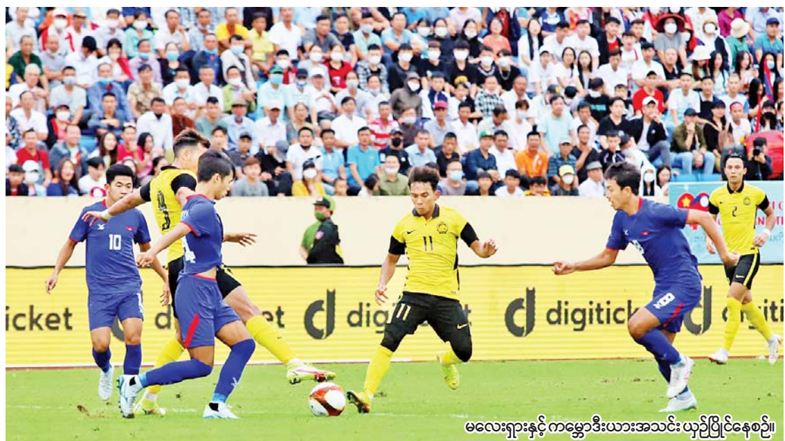
မလေးရှားနှင့် ကမ္ဘောဒီးယားအသင်း ယှဉ်ပြိုင်နေစဉ်။