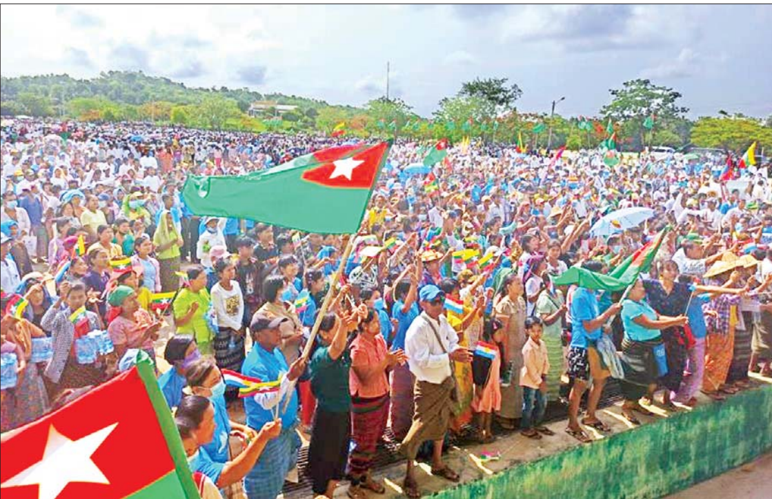
ပါတီဥက္ကဋ္ဌ ဦးမြင့်လှိုင်၊ မြို့နယ်ပါတီဥက္ကဋ္ဌများနှင့် နေပြည်တော် ရှစ်မြို့နယ်မှ ဦးစွာ တက်ရောက်လာကြသူများက ပြည်သူစုစုပေါင်း အင်အား ၇၀၀၀ ခန့် ပြည်ထောင်စုသမ္မတ မြန်မာနိုင်ငံတော် အလံအားအလေးပြု၍ နိုင်ငံတော်သီချင်းကို သီဆိုကာ အခမ်းအနားကို ဖွင့်လှစ်သည်။

နိုင်ငံတော်စီမံအုပ်ချုပ်ရေးကောင်စီ ဥက္ကဋ္ဌ နိုင်ငံတော်ဝန်ကြီးချုပ် ဗိုလ်ချုပ်မှူးကြီး မင်းအောင်လှိုင်၏ တိုင်းရင်းသားလက်နက်ကိုင် အဖွဲ့အစည်းများအား ငြိမ်းချမ်းရေးဆွေးနွေးပွဲအတွက် ဖိတ်ခေါ်မှုကို ပြည်သူများက ကြိုဆိုထောက်ခံသည့်အနေဖြင့် ငြိမ်းချမ်းရေးကြိုးပမ်းဆောင်ရွက်မှု လုပ်ငန်းများကို ကြိုဆိုထောက်ခံခြင်းနှင့် ပြည်ပစွက်ဖက်နှောင့်ယှက်မှုများအား ဆန့်ကျင်ရှုတ်ချပွဲကို ယနေ့နံနက်ပိုင်းတွင် နေပြည်တော်ကောင်စီနယ်မြေ ပုဗ္ဗသီရိမြို့နယ် ဥပုတသန္တီစေတီတော် တပေါင်းကွင်း၌ ကျင်းပသည်။ (ယာပုံ)