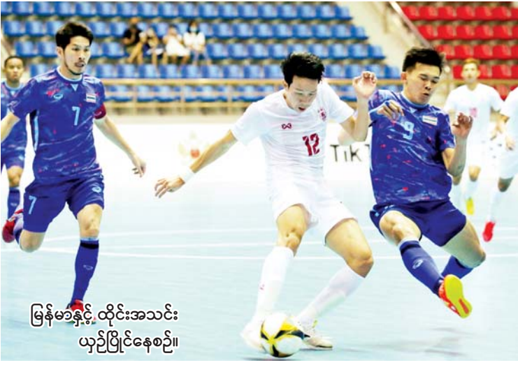
မြန်မာနှင့် ထိုင်းအသင်း ယှဉ်ပြိုင်နေစဉ်။

ရန်ကုန် မေ ၁၆ ဆီးဂိမ်းအမျိုးသားဖူဆယ်ပြိုင်ပွဲ အုပ်စုတတိယနေ့ကို မေ ၁၆ ရက်က ဆက်လက် ကျင်းပရာ မြန်မာအသင်း ရှုံးပွဲဆက်ခဲ့သည်။ အုပ်စုတတိယနေ့တွင် အင်ဒိုနီးရှားအသင်းက မလေးရှားအသင်းကို သုံးဂိုး-ဂိုးမရှိ၊ ထိုင်းအသင်းက မြန်မာအသင်းကို နှစ်ဂိုး-တစ်ဂိုးဖြင့် အနိုင်ရခဲ့သည်။ မြန်မာအသင်းသည် ပထမပွဲတွင် အင်ဒိုနီးရှားကို ဂိုးပြတ်ရှုံးနိမ့်ထားသောကြောင့် ယခုပွဲတွင် ရလဒ်ကောင်း ရရန် ကြိုးပမ်းခဲ့ပြီး နာမည်ကြီးထိုင်းအသင်းကို ကျဉ်းမြောင်းသည့် ဂိုးရလဒ်ဖြင့်သာ အရေးနိမ့်ခဲ့ခြင်းဖြစ်သည်။ ထိုင်းအသင်းသည် ပထမပိုင်းကတည်းက နှစ်ဂိုး-တစ်ဂိုးဖြင့် အနိုင်ရနေပြီး ဒုတိယပိုင်းတွင် ဂိုးထပ်မံသွင်းယူနိုင်ခြင်းမရှိခဲ့ပေ။ မြန်မာအသင်းအတွက် ချေပဂိုးတစ်ဂိုးကို သိုင်းဘွဲ့အောင်က သွင်းယူခဲ့သည်။ စာမျက်နှာ ၁၇ ကော်လံ ၁ သို့ *