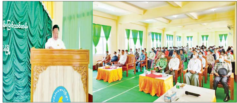
ရှမ်းပြည်နယ်ဝန်ကြီးချုပ် ဒေါက်တာကျော်ထွန်း နယ်စပ်ဒေသတိုင်းရင်းသားလူငယ်များ စက်မှုလက်မှုပညာသင်တန်းကျောင်း (အောင်ပန်း)သင်တန်းဖွင့်ပွဲအခမ်းအနားတွင် အမှာစကားပြောကြားစဉ်။