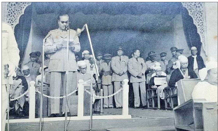
တောင်ကြီးမြို့၌ ကျင်းပသည့် ရှမ်းစော်ဘွားများ အာဏာစွန့်ပွဲတွင် နိုင်ငံတော်ဝန်ကြီးချုပ် ဗိုလ်ချုပ်ကြီး နေဝင်း မိန့်ခွန်းပြောကြားစဉ်။ (၂၄-၄-၁၉၅၉)

ရှမ်းစော်ဘွားများအနေဖြင့် သူတို့၏အုပ်ချုပ်မှုအာဏာကို စွန့်လွှတ်ခဲ့ခြင်းမှာ နိုင်ငံတော်၏ လိုလားချက်နှင့် ရှမ်းပြည်သူအများစု၏ လိုလားချက်အတိုင်း ဆောင်ရွက်ခဲ့ ခြင်းဖြစ်သည့်အပြင် နောက်တစ်ချက်အနေဖြင့် တိုးတက်လာသော ခေတ်စနစ်အမြင်များ နှင့်အညီ မိမိတို့ရှေ့တွင် လွတ်လပ်ရေးရရှိခဲ့သည့် အိန္ဒိယနိုင်ငံမှ မဟာရာဇာစော်ဘွားကြီး များ၏ လမ်းစဉ်ကို အတုယူခဲ့ခြင်းဖြစ်