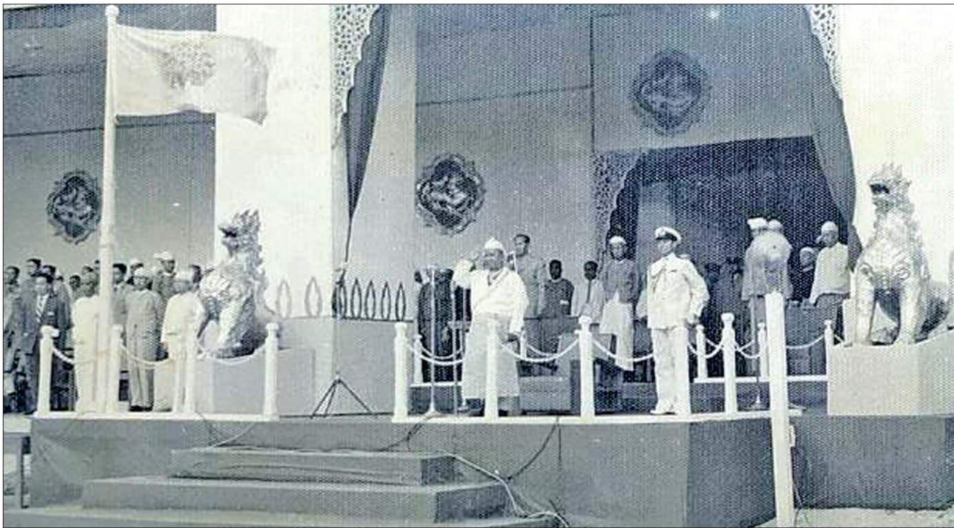
ရှမ်းစော်ဘွားများ အာဏာစွန့်ပွဲအခမ်းအနားတွင် နိုင်ငံတော်သမ္မတ အလေးပြုခံစဉ်။

နယ်ချဲ့အင်္ဂလိပ်တို့အနေဖြင့် ရှမ်းစော်ဘွားပိုင် နယ်ပေါင်း ၃၂ နယ်ကို ပဒေသရာဇ် ရှမ်းပြည်နယ်ဟု