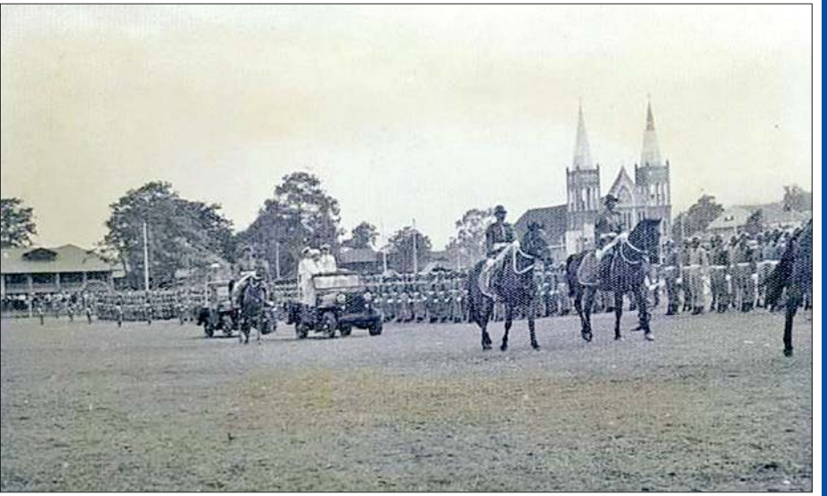
ဒုတိယဗိုလ်မှူးကြီးအောင်ဇင် ဦးဆောင်မှုဖြင့် နိုင်ငံတော်သမ္မတက တပ်ပေါင်းစုအား ဂျစ်ကားဖြင့် လှည့်လည်စစ်ဆေးစဉ်။

ပြည်ပအဖျက်သမားများ၏ အန္တရာယ် အမိန့်နိုင်ငံတော်ကြီး ပျက်စီးပြိုကွဲရေးကို ထာဝစဉ်ကြိုးပမ်းနေသော ပြည်ပအဖျက်သမားများ ၏ အန္တရာယ်ကို မေ့လျော့ပေါ့ဆနေမည်ဆိုပါလျှင် ပြည်တွင်းစည်းလုံးညီညွတ်ရေးကို ထိပါးလာမည် ဖြစ်ပါသည်။ စည်းလုံးညီညွတ်မှုပြိုကွဲခြင်းမှ တစ်ဆင့် တိုင်းပြည်ကို စိတ်တိုင်းကျ ခြယ်လှယ်သွား သည့် အတိတ်ကဖြစ်စဉ်ကို မေ့လျော့၍မရပါချေ။ တစ်ချိန်တစ်ခါက ရှမ်းစော်ဘွားများကို နယ်ချဲ့ဗြိတိသျှ တို့က မြောက်စားမှုများပေးပြီး တောင်တန်းပြည်မ