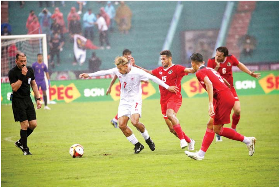
မြန်မာနှင့် အင်ဒိုနီးရှားအသင်း ယှဉ်ပြိုင်နေစဉ်။

ဘဲ ယခင်ပွဲများတွင် အသုံးပြုခဲ့သည့် ကစားသမားအများစုဖြင့်သာ ဆက်လက်ယှဉ်ပြိုင်ခဲ့သည်။ အိမ်ရှင်ဗီယက်နမ်နှင့်ပွဲတွင် အမှားနည်းခဲ့သည့် မြန်မာအသင်း ခံစစ်မှာ ပွဲစကတည်းက အင်ဒိုနီးရှားတိုက်စစ်ကို မထိန်းချုပ်နိုင်ဘဲ အခွင့်အရေးများ ဆက်တိုက်ပေးခဲ့ရသည်။