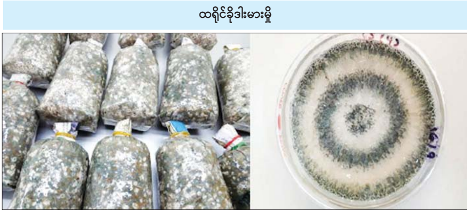
ထရိုင်ဆိုဒါးမားမို

မြေဆွေးပြုလုပ်ရာတွင် စိုက်ပျိုးရေးဆိုင်ရာ စွန့်ပစ်ပစ္စည်းများဖြစ်သည့် ကောက်ရိုး၊ ပြောင်းရိုး၊ နှမ်းရိုး၊ ကြံကြိတ်ဖတ် ကဲ့သို့သော ပစ္စည်းများကို အသုံးပြုနိုင်ပါသည်။ သမားရိုးကျမြေဆွေးများသည် ဆွေးမြည့်ရန်အတွက် ပုံမှန်အားဖြင့် လေးလမှ ငါးလခန့်အထိ ကြာမြင့်တတ်ကြပါသည်။ အကျိုးပြုအကျိုး ဝင်သက်ရှိကိုအသုံးပြု၍ ဆွေးမြည့်စေမည်ဆိုပါက သုံးပတ်မှ လေးပတ်အထိ ကြာမြင့်ချိန်ကို လျော့ချနိုင်မည်ဖြစ်ပါသည်။ ဆဲလူးလို့စ်များကို ချေဖျက်နိုင်သည့် အက်စပါးဂျီးလစ်နှင့် ထိုစိုက်ပျိုးရေးဆွေးမြည့်မှုကို အသုံးပြုမည်ဆိုပါက တစ်လအတွင်းဆွေးမြည့်စေနိုင်ကြောင်း သုတေသနများအရ သိရှိရပါသည်။