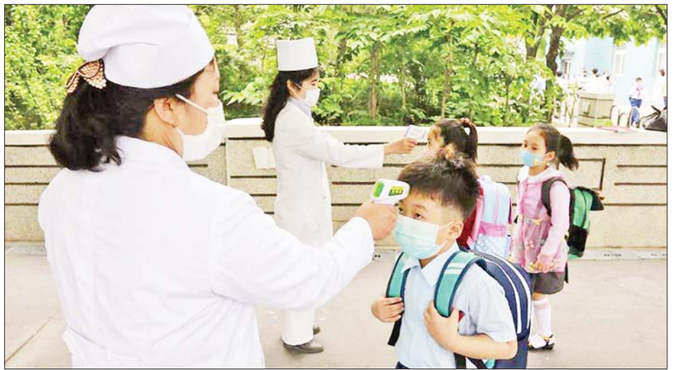
သို့သော် မြောက်ကိုရီးယားနိုင်ငံ၏ ကျန်းမာရေး ဖွယ်ရှိကြောင်း နိုင်ငံရေးစောင့်ကြည့်လေ့လာသူ စနစ်သည် အနည်းငယ်ယိုယွင်းလျက်ရှိပြီး အဖျား ရောဂါလက္ခဏာတွေ့ရှိသူများ ပိုမိုများပြားလာနိုင် များက ဆိုသည်။ ကိုးကား - အင်န်အိတ်ချီကော ဘာသာပြန် - အောင်ကျော်ကျော်

သွားလာခွင့်ပိတ်ပင်ထားကြောင်း သိရသည်။ မေ ၁၄ ရက်တွင် အဖျားရောဂါလက္ခဏာတွေ့ရှိသူအရေအတွက်သည် မေ ၁၃ ရက်တွင်တွေ့ရှိသည့် ၁၂၀၀၀၀ ကျော်ထက် ပိုမိုများပြားလာကြောင်း သိရသည်။ နိုင်ငံအတွင်း၌ ဧပြီလနှောင်းပိုင်းမှစပြီး လက်ရှိ အချိန်အထိ အဖျားရောဂါလက္ခဏာတွေ့ရှိသူပေါင်း ၈၂၀၀၀ နှင့် သေဆုံးသူပေါင်း ၄၂ ဦးရှိကြောင်း သိရသည်။ နိုင်ငံ၏ လက်ရှိအခြေအနေသည် နိုင်ငံ ဖွဲ့စည်းတည်ထောင်သည့် အချိန်မှစပြီး ရင်ဆိုင် ကြုံတွေ့ခြင်းမရှိသေးသည့် ခက်ခဲမှုတစ်ခုဖြစ်သည်ဟု ခေါင်းဆောင် ကင်ဂျီအန်က ယမန်နေ့တွင်ပြုလုပ် သည့် ပါတီအစည်းအဝေးတွင် ပြောကြားခဲ့သည်။ ထို့ပြင် ပြည်သူ့အားလုံးကို ရောဂါ ရှိ၊ မရှိ စစ်ဆေးရန်နှင့် တရုတ်နိုင်ငံ၏ ကိုင်းတွယ်ထိန်းချုပ်ပုံ များကို သင်ခန်းစာယူကြရန် ခေါင်းဆောင်ကင်က တာဝန်ရှိသူများအား ပြောကြားသည်။