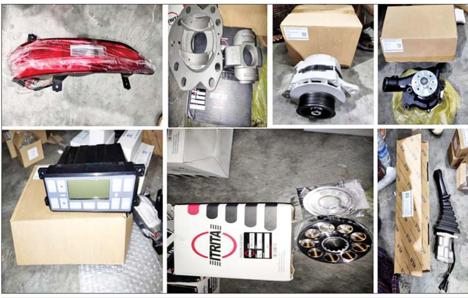
ရန်ကုန်အပြည်ပြည်ဆိုင်ရာလေဆိပ်၌ ဖမ်းဆီးရမိမှု။

နေပြည်တော် မေ ၁၅ တရားမဝင်ကုန်သွယ်မှု တိုက်ဖျက်ရေး ဦးဆောင်ကော်မတီ၏ ကြီးကြပ်ကွပ်ကဲမှုဖြင့် တရားမဝင်ကုန်သွယ်မှုများကို ဥပဒေနှင့်အညီ ထိရောက်စွာ တားဆီးရေးအဖွဲ့ နှင့် ရောင်းချဆောင်ရွက်လျက်ရှိရာ မေ ၁၄ ရက်တွင် အကောက်ခွန်ဦးစီးဌာန၏ စီမံခန့်ခွဲမှုဖြင့် ရန်ကုန် အပြည်ပြည်ဆိုင်ရာလေဆိပ် လေဆိပ်ကုန်လှောင်ရုံ (လေဆိပ်သွင်းကုန်)၌ စုံစမ်းစစ်ဆေးရေးနှင့် တရားမဝင်ကုန်သွယ်မှု တိုက်ဖျက်ရေးဌာနခွဲအကောက်ခွန်စစ်ဆေးရေးအဖွဲ့က စစ်ဆေးမှုများ ဆောင်ရွက်ခဲ့ရာ သွင်းကုန်ကြေညာလွှာ ID တွင် ကြေညာထားခြင်း မရှိသော ဖန်စီပစ္စည်းများ၊ (ခန့်မှန်းတန်ဖိုး ၂၀၉၆၇၃၀၀) ကို ဖမ်းဆီးရမိခဲ့ပြီး