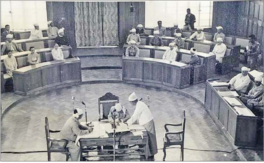
ရှမ်းပြည်နယ် ပြည်သူ့အုပ်ချုပ်ရေးပဏ္ဍိတ်ချလက်မှတ်ရေးထိုးပွဲကြီး ကျင်းပစဉ်။

“တိုင်းပြည်ကို အမှန်တကယ် ချစ်မြတ်နိုးစိတ်ရှိပါလျှင် မြန်မာ့နိုင်ငံရေးသမိုင်းတွင် ရှမ်းစော်ဘွားများ အာဏာစွန့်သည့်ပမာကို နမူနာယူသင့်ပါသည်။ အများအကျိုး၊ နိုင်ငံ့အကျိုးနှင့် ယှဉ်လာလျှင် မိမိတို့အကျိုးစီးပွားကို ဥပေက္ခာပြုနိုင်ရမည်ဖြစ်၏။ စွန့်ရသည့်သတ္တိရှိဖို့သာ လိုပါသည်။ ထိုအရာမှသာ စစ်မှန်သည့်သတ္တိဟု ဆိုရပါမည်။ တစ်ကိုယ်ရေကောင်းစားရေးနှင့် တစ်ပြည်ထောင်ကောင်းစားရေးအတွက် စွန့်စားခြင်း သည် စစ်မှန်သော သတ္တိ၏ပြယုဂ်မဟုတ်ပါချေ။ တိုင်းတစ်ပါး၏ အမြောက်အပင်များကြား တွင် ကိုယ့်တိုင်းပြည်မြေပုံ ပျက်ယွင်းမှုမရှိစေရေး သတိပြုရန်လို