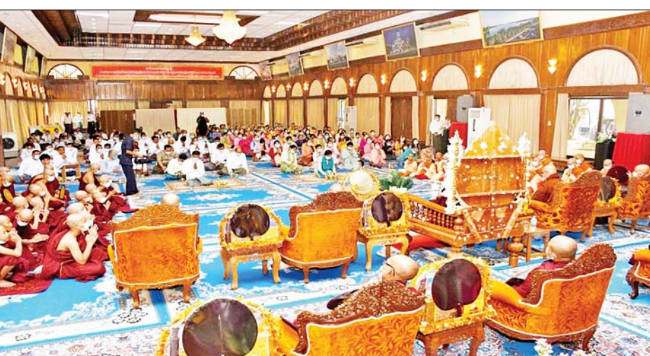
ထို့နောက် သံဃာတော်များနှင့် သာသနာ့ဌာနဝန်ထမ်းများက ရဟန်းလောင်း ခြောက်ပါး၊ ရှင်သာမဏေ ၄၁ ပါးနှင့် သီလရှင် ၁၄ ပါးတို့ကို ရဟန်းဘောင်၊ ရှင်သာမဏေ၊ သီလရှင်အဖြစ်သို့ သွတ်သွင်းပေးပြီး တိုင်းမှူးနှင့် အလှူရှင်များက သံဃာတော်များနှင့် ရှင်သာမဏေများအား သိမ်ဆင်း