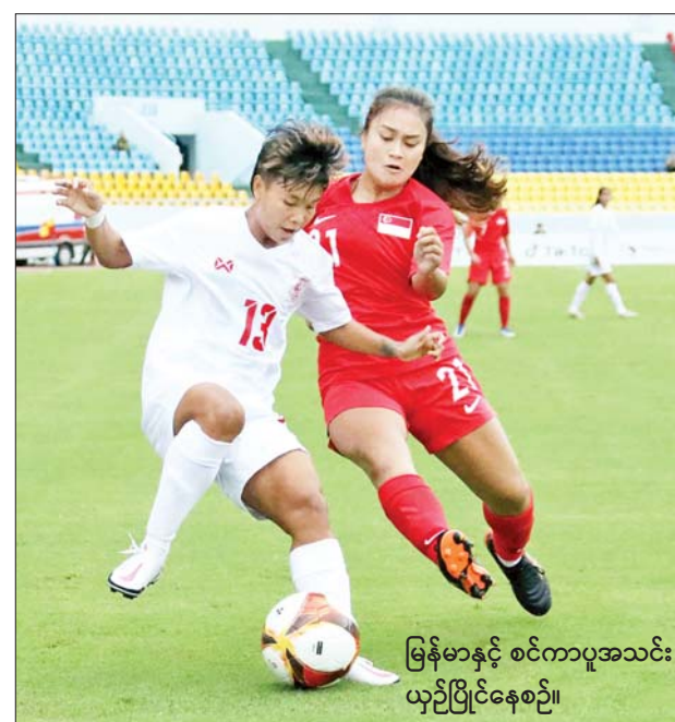
မြန်မာနှင့် စင်ကာပူအသင်း ယှဉ်ပြိုင်နေစဉ်။