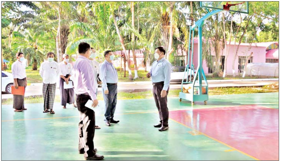
စီမံကိန်းမှ တာဝန်ရှိသူများက စီမံကိန်းဆိုင်ရာ အချက်အလက်များနှင့် စီမံကိန်းဆောင်ရွက်နေမှု များကို ရှင်းလင်းတင်ပြသည်။ ယင်းနောက် ပြည်ထောင်စုဝန်ကြီးသည်

ထို့နောက် ပြည်ထောင်စုဝန်ကြီးသည် ပန်းပဲတန်းမြို့နယ်အမှတ်(၃၇၂) ဗိုလ်ချုပ်အောင်ဆန်း လမ်းမပေါ်ရှိ မြန်မာ့မီးရထားပိုင်မြေတွင် BOT စနစ်ဖြင့် ဆောင်ရွက်လျက်ရှိသည့် International Hotel Project နှင့် Land Mark Project တို့ကို ကြည့်ရှုစစ်ဆေးရာ စီမံကိန်းရှင်းလင်းဆောင်၌ မြန်မာ့မီးရထား ဦးဆောင်ညွှန်ကြားရေးမှူးနှင့်