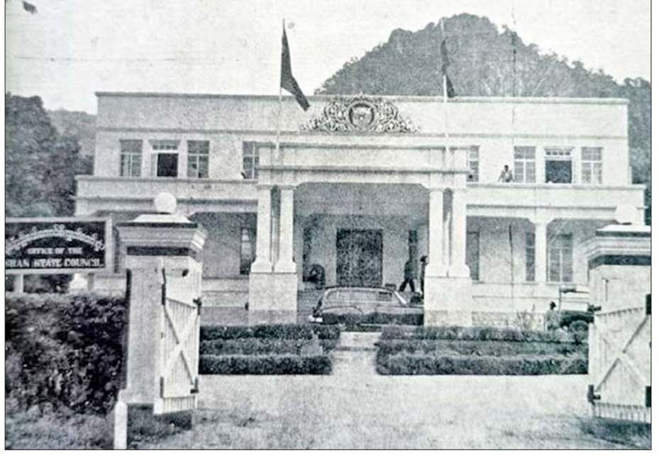
ရှမ်းပြည်နယ်ရာဇဝင်တွင် မော်ကွန်းတင်ရမည့် ရှမ်းပြည်နယ် ပြည်သူ့အုပ်ချုပ်ရေး ပဏ္ဍိတ်ချ လက်မှတ်ရေးထိုးပွဲအခမ်းအနားကျင်းပသော တောင်ကြီးမြို့ရှိ ရှမ်းပြည်နယ်ကောင်စီ လွှတ်တော် အဆောက်အအုံကြီး။

သွေးကွဲမှုများဖြစ်အောင် ဖန်တီးသကဲ့သို့ ယနေ့ထိ တိုင်လည်း အလားတူ ဖန်တီးမှုမျိုးကို ခေတ်သစ် ကျားငါးလဲတို့က ကျင့်ကြံနေကြဆဲဖြစ်ပါသည်။ တပ်မတော်သည် အတိတ်သမိုင်းမှဖြစ်စဉ်များအပေါ် ဆင်ခြင်သုံးသပ်မှုအပြည့်ဖြင့် လွတ်လပ်ရေးရပြီးချိန် မှသည် ယနေ့ကာလတိုင် နိုင်ငံတော်ကို ကာကွယ် စောင့်ရှောက်ပေးလျက်ရှိပါသည်။ ကျွန်ုပ်တို့အားလုံး သည် မြန်မာဖြစ်သည်ဟူသော ခံယူချက်စိတ်ထား များရှိပါက မည်သည့်သွေးခွဲမိုင်းတိုက်မှုမျိုးကိုမဆို တွန်းလှန်နိုင်မည်ဖြစ်ပေသည်။ ကျွန်တော်တို့ ငယ်စဉ်က သင်ခဲ့ရသည့် “ဇွန်ပန်းရုံအနီး လှည်းဘီး နွံထဲကျွံနေသည်၊ ကူ၍တွန်းပေးကြပါ။ လေးလွန်း၍ မတွန်းနိုင်ဘူးလား၊ ပြိုင်တူတွန်းလျှင် ရွှေနိုင်ပါသည်” ဟူသော ကဗျာလေးက အကောင်းဆုံးသာကေပင် ဖြစ်ပါသည်။