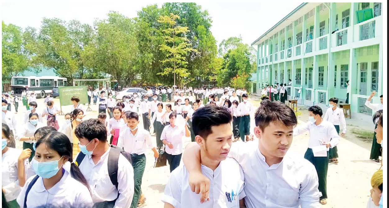
နေပြည်တော် ဇေယျာသီရိမြို့နယ် ပြည်စံအောင်အထက်တန်းကျောင်း၌ ၂၀၂၁-၂၀၂၂ ပညာသင်နှစ် တက္ကသိုလ်ဝင်စာမေးပွဲဖြေဆိုသည့် ကျောင်းသား ကျောင်းသူများအား တွေ့ရစဉ်။