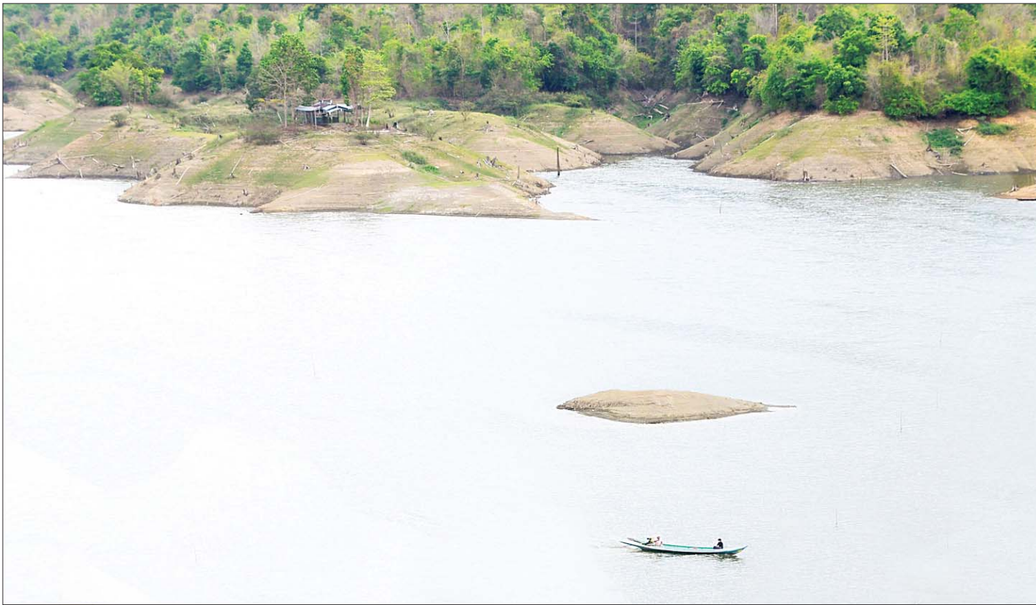
တဘူးလှဆည်ကို တွေ့ရစဉ်။

တိုက်ကြီးမြို့နယ်နှင့် မှော်ဘီမြို့နယ်တို့ရှိ နွေစပါးစိုက်ဧက ၂၆၅၅၃ ဧကကို တဘူးလှဆည်မှ အောင်ရေပြည့်မီစွာ ပို့လွှတ်နိုင်ခဲ့သောကြောင့် ယခုနှစ် နွေစပါးအထွက်နှုန်းကောင်းပြီး တောင်သူများ အဆင်ပြေခဲ့ကြောင်း သိရသည်။