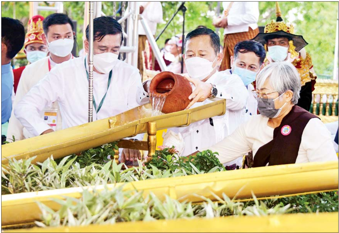
နိုင်ငံတော်စီမံအုပ်ချုပ်ရေးကောင်စီဒုတိယဥက္ကဋ္ဌ ဒုတိယဝန်ကြီးချုပ် ကာကွယ်ရေးဦးစီးချုပ်(ကြည်း) ဒုတိယဗိုလ်ချုပ် မျိုးကြီးစိုးဝင်းနှင့် ဇနီး မဟာဗောဓိညောင်ပင်အား ကဆုန်ညောင်ရေ သွန်းလောင်းပူဇော်စဉ်။

ကဆုန်လပြည့်နေ့သည် ဒီပင်တင်မြို့ မြတ်စွာဘုရားက ဂေါတမဘုရား အလောင်းတော် သုမေဓာရှင်ရသေ့အား “ဘဒ္ဒကမ္ဘာတွင် ဘုရားအဖြစ်ကို ရလိမ့်မည်” ဟု ဗျာဒိတ်တော်စကား မိန့်ကြား တော်မူသောနေ့၊ ဘုရားအလောင်းတော် သိဒ္ဓတ္ထမင်းသား ဖွားမြင်သောနေ့၊ သဗ္ဗညု ဘုရားရှင်အဖြစ်သို့ ရောက်တော်မူသော နေ့၊ ပရိနိဗ္ဗာန်စံတော်မူသောနေ့များ ဖြစ်သဖြင့် “ဗျာဒိတ်ဖွားမြင်၊ ဗောဓိပင်၊ စံဝင်နိဗ္ဗာန်နန်း” ဟု မှတ်တမ်းပြုကြပြီး ကဆုန်လပြည့် (ဗုဒ္ဓနေ့)ဟူ၍ ဗုဒ္ဓ ဘာသာဝင်များက နေ့ထူးနေ့မြတ်အဖြစ် အထွတ်အမြတ်ထား၍ ကျင်းပပူဇော်လေ့ ရှိကြသည်။ ကဆုန်လပြည့်နေ့၏ ထူးခြား ချက်မှာ ဂေါတမမြတ်စွာဘုရားသာလျှင် မကဘဲ သဗ္ဗညုမြတ်စွာဘုရားရှင်တို့၏ ဖွားမြင်တော်မူသောနေ့၊ ဘုရားဖြစ်တော် မူသောနေ့၊ ပရိနိဗ္ဗာန်ပြုသောနေ့များမှာ လည်း ကဆုန်လပြည့်နေ့ပင်ဖြစ်၍ ကဆုန် လပြည့်နေ့ကို “ဗုဒ္ဓနေ့” ဟု သတ်မှတ် ခြင်းဖြစ်ကြောင်း၊ ကဆုန်ညောင်ရေသွန်း ပွဲတော်သည် ကုသိုလ်ယူဖွယ်ရာ၊ ဝမ်းသာ ကြည်နူးဖွယ်ရာ ဘာသာရေးဆိုင်ရာ ပွဲတော်တစ်ခုဖြစ်သည့်အပြင် မြန်မာ့ ယဉ်ကျေးမှု အမွေအနှစ်တစ်ရပ်အဖြစ် ကျင်းပပြုလုပ်သည့် ပွဲတော်ဖြစ်ကြောင်း နှင့် ကဆုန်လပြည့်နေ့မတိုင်မီ တစ်ရက် အလိုတွင် ညောင်ရေသွန်းလောင်းကြမည့် ညောင်ပင်များကို အမွှေးနံ့သာရည်များ ပက်ဖျန်းပေးခြင်း၊ မဟာဗောဓိပင် ပလ္လင်တော်အား ကြည့်ညိုစဖွယ် ဖြစ်အောင်ပြင်ဆင်ခြင်း စသည့် ကုသိုလ် ယူဖွယ်များကို ပြုလုပ်လေ့ရှိကြကြောင်း သတင်းရရှိသည်။ သတင်းစဉ်