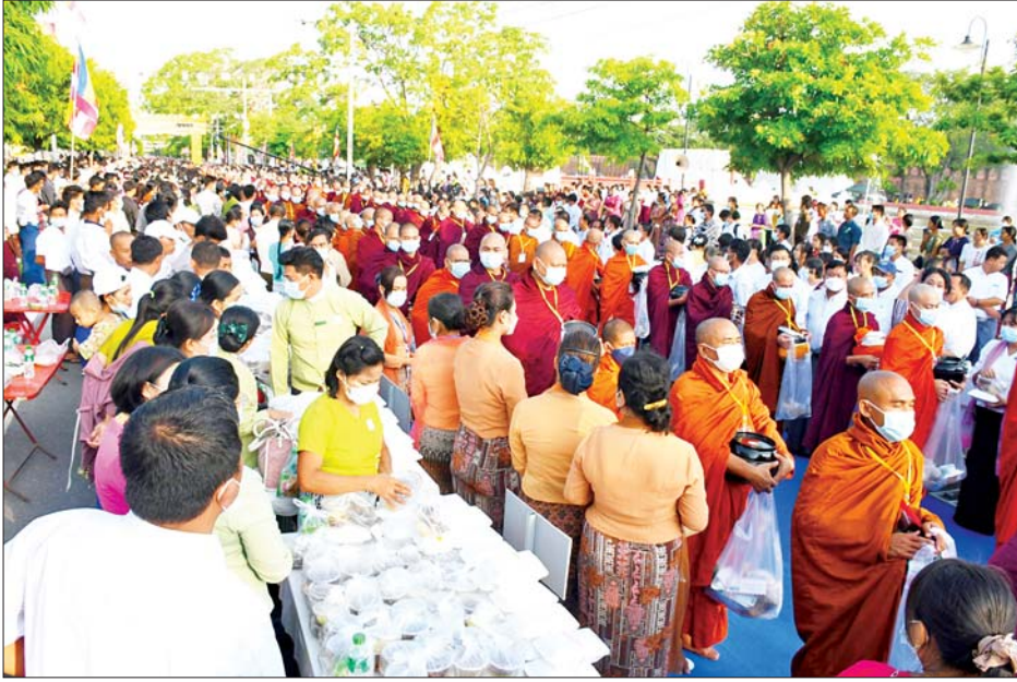
မန္တလေးမြို့၊ လေးပြင်လေးရပ်ရှိ သံဃာတော်များအား ဆွမ်း၊ ဆွမ်းဟင်း၊ လှူဖွယ်ပစ္စည်းများနှင့် နဝကမ္မဝတ္ထုငွေများ လောင်းလှူပူဇော်ခြင်း မဟာမင်္ဂလာပြုလုပ်စဉ်။