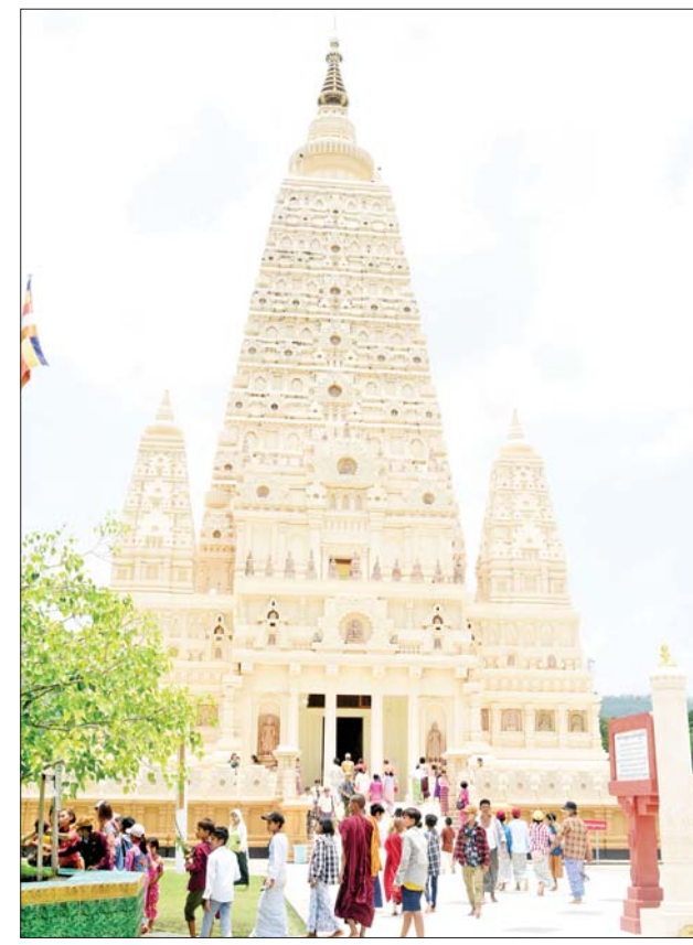
ဗုဒ္ဓဂယာ(နေပြည်တော်)တွင် ဘုရားဖူးလာရောက်ကြသူများဖြင့် စည်ကားလျက်ရှိသည်ကို တွေ့ရစဉ်။

အလားတူ နေပြည်တော်ရှိ Ocean Super Center၊ Junction Center၊ Naypyitaw Wholesale တို့တွင် ဈေးဝယ်ကြသူများနှင့် နေပြည်တော် ရေပန်းဥယျာဉ်၊ တိရစ္ဆာန်ဥယျာဉ်၊ ဆာဖာရီဥယျာဉ်၊ အမျိုးသားအထိမ်းအမှတ်ဥယျာဉ်၊ လှေခွင်းတောင်ကမ်းခြေအပန်းဖြေစခန်း၊ မင်္ဂလာကန်တော်တို့တွင်