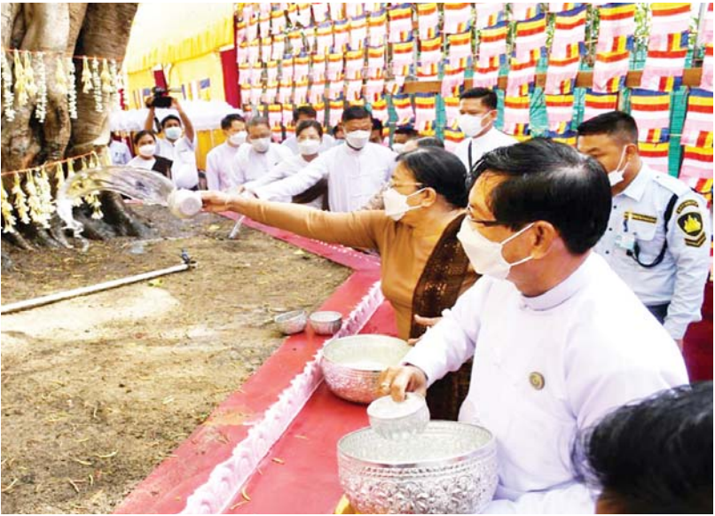
ရွှေတိဂုံစေတီတော်မြတ်ကြီးရင်ပြင်တော်ရှိ မဟာဗောဓိညောင်ပင်အား ရန်ကုန်တိုင်းဒေသကြီးဝန်ကြီးချုပ်ဦးစိုးသိန်းနှင့် တာဝန်ရှိသူများက ညောင်ရေသွန်းလောင်းပူဇော်ကြစဉ်။