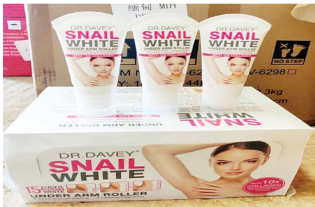
မရမ်းချောင်းမြို့နယ်၊ စစ်ဆေးရေးစခန်း၌ သိမ်းဆည်းရမိသည့် အလှူကုန်ပစ္စည်းများကို တွေ့ရစဉ်။

ထို့အတူ မေ ၁၄ ရက်တွင် စစ်ကိုင်းတိုင်းဒေသကြီး တရားမဝင် ကုန်သွယ်မှု တိုက်ဖျက်ရေးအဖွဲ့၏ စီမံခန့်ခွဲမှုဖြင့် စစ်ဆေးမှုများ ဆောင်ရွက်ခဲ့ရာ မြန်မာနိုင်ငံ ရဲတပ်ဖွဲ့ဦးဆောင်သော စစ်ဆေးရေးအဖွဲ့က ကန်တလေးမြို့နယ်အတွင်း တရားမဝင် ဒီဇယ်နှင့် ချက်ဆီသန့် ၁၅၇၅ ဂါလန် (ခန့်မှန်းတန်ဖိုးငွေကျပ် ၁၂၆၀၀၀၀)ကို ရေနံနှင့် ရေနံထွက် ပစ္စည်းဆိုင်ရာဥပဒေအရ လည်းကောင်း၊ တိုင်းဒေသကြီး သစ်တောဦးစီး ဌာန ဦးဆောင်သော စစ်ဆေးရေးအဖွဲ့များက စစ်ကိုင်းမြို့နယ်အတွင်း တရားမဝင် အင်ဓွေး ၅ ဒဿမ ၈၀၆၂ တန် (ခန့်မှန်းတန်ဖိုးငွေကျပ်