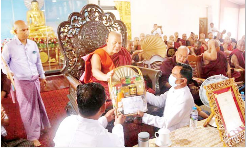
ငါးပါးသီလခံယူဆောက်တည်ကြပြီး အနုမောဒနာများနှင့် နေ့ဆွမ်းဆက်ကပ်လှူဒါန်းခဲ့ကြကြောင်း သိရသည်။ နဝကမ္မဝတ္ထုငွေများ၊ နဝကမ္မအလှူငွေ သိရသည်။ သတင်းစဉ်

ယင်းနောက် နိုင်ငံတော်မှဆက်ကပ်သည့် အဂ္ဂမဟာသဒ္ဓမ္မဇောတိကဓဇ ဘွဲ့တံဆိပ်တော်ရ မြောက်ဦးဆရာတော်ကြီးအား ဂုဏ်သိက္ခာပူဇော်ပွဲကို ဆက်လက်ကျင်းပရာ ပြည်နယ်ဝန်ကြီးချုပ်၊ တိုင်းမှူးနှင့် တက်ရောက်လာကြသူများက ဓမ္မစရိယတက္ကသိုလ်နာယကချုပ်(စစ်တွေ)ပါမောက္ခချုပ် ဆရာတော်ထံမှ