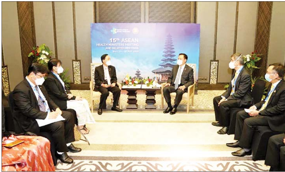
ကိုဗစ်-၁၉ ကာကွယ်ဆေး AstraZeneca တစ်သန်း Doses မြန်မာနိုင်ငံသို့ လှူဒါန်းခဲ့မှုနှင့် RT PCR ဓာတ်ခွဲပစ္စည်းများ အမျိုးသားကျန်းမာရေးဓာတ်ခွဲ

ကျန်းမာရေးဝန်ကြီးဌာန ပြည်ထောင်စုဝန်ကြီး ဒေါက်တာသက်ခိုင်ဝင်းသည် အင်ဒိုနီးရှားနိုင်ငံ ဘာလီမြို့တွင် မေ ၁၁ ရက်မှ ၁၅ ရက်အထိ ကျင်းပသည့် (၁၅)ကြိမ်မြောက် အာဆီယံကျန်းမာရေးဝန်ကြီးများအစည်းအဝေးနှင့် ဆက်စပ်အစည်းအဝေးများ တက်ရောက်နေစဉ်အတွင်း ယနေ့နံနက် ဒေသစံတော်ချိန် ၁၁ နာရီခန့်တွင် ထိုင်းနိုင်ငံ ဒုတိယဝန်ကြီးချုပ်နှင့် ပြည်သူ့ကျန်းမာရေးဝန်ကြီးဌာန ဝန်ကြီး H.E. Anutin Charnvirakul ဦးဆောင်သည့် ကိုယ်စားလှယ်အဖွဲ့နှင့် CORAD HOTEL Bali Lagoon Room(1)၌ တွေ့ဆုံသည်။