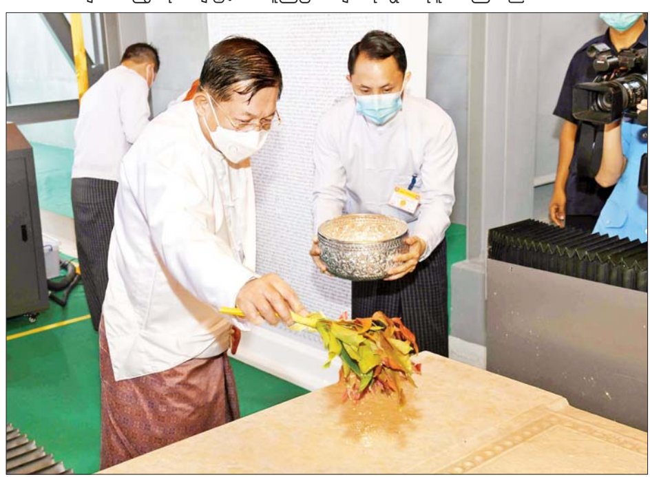
နိုင်ငံတော်စီမံအုပ်ချုပ်ရေးကောင်စီဥက္ကဋ္ဌ နိုင်ငံတော်ဝန်ကြီးချုပ် ဗိုလ်ချုပ်မှူးကြီး မင်းအောင်လှိုင် ပိဋကတ်ကျောက်စာတော်ကို ပရိတ်နံ့သာရည်ပက်ဖျန်းပေးစဉ်။

ယင်းနောက် ဗုဒ္ဓသာသနံ စိရံတိဋ္ဌတု သုံးကြိမ် ရွတ်ဆိုဆုတောင်း၍ အခမ်းအနားကို ရုပ်သိမ်း လိုက်သည်။