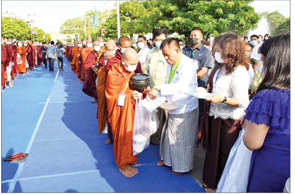
မန္တလေးတိုင်းဒေသကြီး ဝန်ကြီးချုပ် ဦးမောင်ကို မန္တလေးမြို့၊ လေးပြင်လေးရပ်ရှိ သံဃာတော် များအား ဆွမ်း၊ ဆွမ်းဟင်း၊ လှူဖွယ်ပစ္စည်းများနှင့် နဝကမ္မဝတ္ထုငွေများ လောင်းလှူပူဇော်စဉ်။