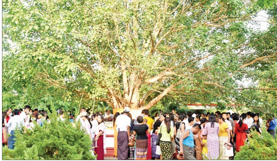
ဓာတုစယဓာတ်ပေါင်းစုစေတီတော်တွင် ညောင်ရေသွန်းလောင်းပူဇော်ကြသူများဖြင့် စည်ကားလျက်ရှိသည်ကို တွေ့ရစဉ်။

နေ့၊ ဂေါတမဘုရားရှင် ပရိနိဗ္ဗာန်စံဝင်သည့်နေ့ဖြစ်ပြီး ဗုဒ္ဓဘာသာဝင်များက နေ့ထူးနေ့မြတ်အဖြစ် သတ်မှတ်၍ နှစ်စဉ်ကဆုန်လပြည့်နေ့တွင် ဗောဓိညောင်ရေသွန်းလောင်းပူဇော်ခြင်း၊ ဥပုသ်သီလဆောက်တည်ခြင်း၊ တရားဘာဝနာပွားများခြင်း၊ စတုဒိသာကျွေးမွေးခြင်း စသည့်ကုသိုလ်ကောင်းမှုများကို ပြုလုပ်ကြသည်။ နေပြည်တော်ကောင်စီနယ်မြေအတွင်းရှိ ဥပုသ်သီလဆောက်တော်