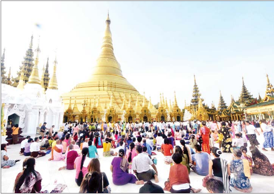
ရွှေတိဂုံစေတီတော်မြတ်ကြီး၌ ကုသိုလ်ကောင်းမှုပြုကြသူများဖြင့် စည်ကားလျက်ရှိသည်ကို တွေ့ရစဉ်။