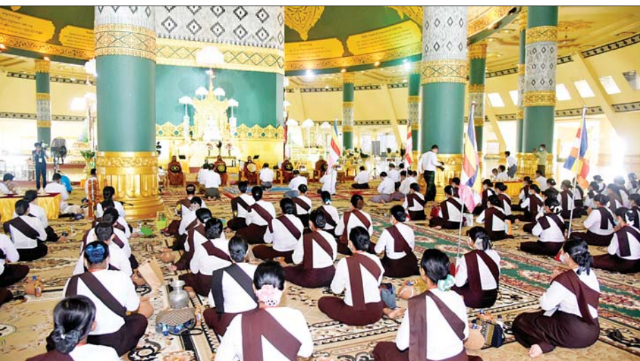
ဖြစ်ကြသည့် ဦးအေးထွန်း၊ ဒေါက်တာမိုးဇော်ထွန်း၊ နေပြည်တော်ကောင်စီဝင် ဦးမြင့်စိုး၊ အမြတ်စမ်းအတွင်းဝန်၊ ညွှန်ကြားရေးမှူးချုပ်များ၊ ဂေါတမအဖွဲ့ဝင်များနှင့် တာဝန်ရှိသူများ တက်ရောက်ကြည့်ညှိ

နေပြည်တော် မေ ၁၄ (၁၄)ကြိမ်မြောက်ကဆုန်ညောင်ရေသွန်းလောင်းပူဇော်ခြင်း မင်္ဂလာအခမ်းအနား (ပထမပိုင်း) မေတ္တသုတ်ပရိတ်တရားတော်များ နာယူကြည့်ညှိ၍ သံဃာတော်အရှင်သူမြတ်တို့အား လှူဖွယ်ပစ္စည်းများဆက်ကပ်လှူဒါန်းခြင်း မင်္ဂလာအခမ်းအနားကို ယနေ့ညနေ ၄ နာရီတွင် နေပြည်တော်ရှိ ဥပ္ပါတသန္တိစေတီတော်မြတ်ကြီးလိုဏ်ဂူတော်အတွင်း ဂေါတမဗုဒ္ဓရုပ်ပွားဆင်းတုတော်ရှေ့၌ ကျင်းပသည်။ တက်ရောက်ကြည့်ညှိ အခမ်းအနားသို့ ဥပ္ပါတသန္တိစေတီတော် ဂေါတမအဖွဲ့ ဩဝါဒါစရိယဆရာတော် နေပြည်တော် ပျဉ်းမနားမြို့ မင်္ဂလာဇေယျပါဠိတက္ကသိုလ်ကျောင်းတိုက် ပဓာနနာယက အဂ္ဂမဟာပဏ္ဍိတ အဂ္ဂမဟာသဒ္ဓမ္မဇောတိကဇေ ဘဒ္ဒန္တဝိမလဗုဒ္ဓိ (ပါဠိဆရာတော်) အမှုပြုသည့်ဆရာတော်၊ သံဃာတော်များကြွရောက်ကြပြီး သာသနာရေးနှင့် ယဉ်ကျေးမှုဝန်ကြီးဌာန ပြည်ထောင်စုဝန်ကြီး ဦးကိုကို၊ ဒုတိယဝန်ကြီးများ