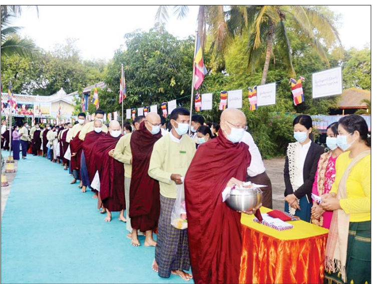
မြို့နယ်အဆင့်ဌာနဆိုင်ရာအကြီးအကဲများနှင့်ဝန်ထမ်းများ၊ မြို့နယ်အမျိုးသမီးရေးရာအဖွဲ့ဝင်များ၊ မြို့နယ်မိခင်နှင့်ကလေးစောင့်ရှောက်အသင်းဝင်များနှင့် အလှူရှင်များက ဆွမ်း၊ ဆွမ်းဟင်း၊ လှူဖွယ်ပစ္စည်းများနှင့် နဝကမ္မဝတ္ထုငွေများလောင်းလှူခဲ့ကြောင်း သိရသည်။ မြို့နယ်(ပြန်/ဆက်)