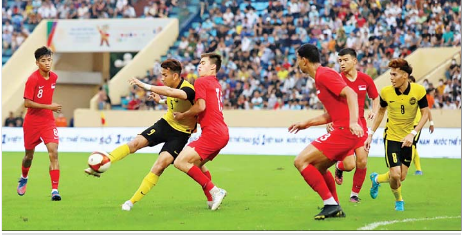
အမျိုးသားဘောလုံးပြိုင်ပွဲတွင် မလေးရှားနှင့် စင်ကာပူအသင်း ယှဉ်ပြိုင်နေစဉ်။

အမျိုးသား ဘောလုံးပြိုင်ပွဲ အုပ်စု(ခ) စတုတ္ထနေ့တွင် ထိုင်း အသင်းက ကမ္ဘောဒီးယားအသင်း ကို ငါးဂိုးပြတ် အနိုင်ရပြီး မလေးရှားနှင့် စင်ကာပူအသင်းတို့ နှစ်ဂိုးစီ သရေကျခဲ့သည်။ မလေးရှားအသင်းမှာ သုံးပွဲဆက် ရှုံးပွဲမရှိသေးဘဲ ဆီမီးဖိုင်နယ် တက်ရောက်ရန် သေချာသွားခဲ့ သည်။ ထိုင်းအသင်းမှာလည်း နှစ်ပွဲဆက်တိုက် ဂိုးပြတ်နိုင်ပွဲရယူ ကာ ဆီမီးဖိုင်နယ် တက်ရောက်ရန် အခြေအနေ ကောင်းသွားခဲ့သည်။ ယခုပွဲအပြီးတွင် မလေးရှား အသင်းက သုံးပွဲကစား ခုနစ်မှတ် ရရှိကာ ဆီမီးဖိုင်နယ်တက်ရောက် ရန် သေချာသွားပြီး ထိုင်းအသင်း