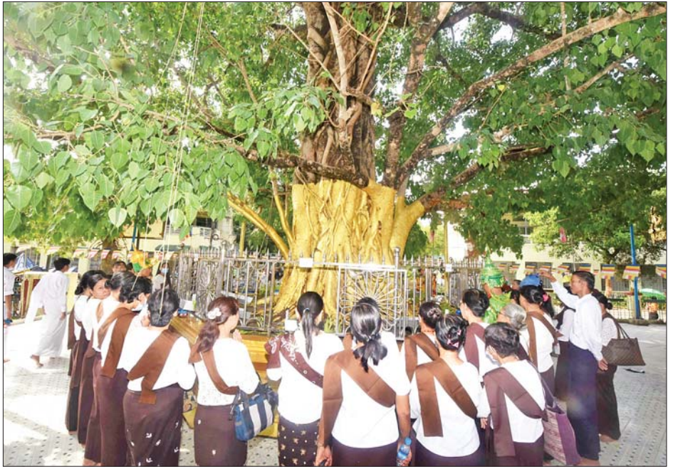
သီရိမင်္ဂလာ ကမ္ဘာအေးစေတီတော်၌ ဘုရားဖူးလာပြည်သူများက မဟာဗောဓိညောင်ပင်အား ညောင်ရေသွန်းလောင်းပူဇော်ကြစဉ်။