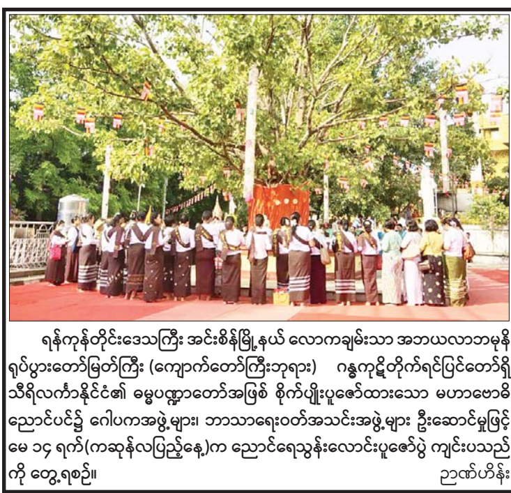
ရန်ကုန်တိုင်းဒေသကြီး အင်းစိန်မြို့နယ် လောကချမ်းသာ အဘယလာဘမုနိ ရုပ်ပွားတော်မြတ်ကြီး (ကျောက်တော်ကြီးဘုရား) ဂန္ဓကုဋ်တိုက်ရင်ပြင်တော်ရှိ သီရိလင်္ကာနိုင်ငံ၏ ဓမ္မပဏ္ဍာတော်အဖြစ် စိုက်ပျိုးပူဇော်ထားသော မဟာဗောဓိ ညောင်ပင်၌ ဂေါပကအဖွဲ့များ၊ ဘာသာရေးဝတ်အသင်းအဖွဲ့များ ဦးဆောင်မှုဖြင့် မေ ၁၄ ရက်(ကဆုန်လပြည့်နေ့)က ညောင်ရေသွန်းလောင်းပူဇော်ပွဲ ကျင်းပသည် ကို တွေ့ရစဉ်။

ထို့နောက် ဩဝါဒါစရိယဆရာတော်ကြီးများ၊ တိုင်းဒေသကြီးဝန်ကြီးချုပ်၊ တိုင်းမှူးနှင့် တာဝန်ရှိသူ များ၊ ဂေါပကအဖွဲ့များ၊ ဘာသာရေးဝတ်အသင်းအဖွဲ့ များနှင့် ဘုရားဖူးလာပြည်သူများက ဗောဓိညောင်ပင် အား ညောင်ရေသွန်းလောင်းပူဇော်ကြသည်။ ယနေ့တွင် စေတီတော်မြတ်ကြီးသို့ဘုရားဖူးလာ ပြည်သူများအား အလှူရှင်များက စတုဒိသာများ ကျွေးမွေးလှူဒါန်းကြသည်။ အလားတူ ဗိုလ်တထောင် ကျိုက်ဒေးအပ် ဆံတော်ဦးစေတီတော်နှင့် ဆံတော်ရှင် ဆူးလေစေတီ တော် ဂေါပကအဖွဲ့များက ကြီးမှူးကျင်းပသည့် ကဆုန်ညောင်ရေသွန်းလောင်း ပူဇော်ပွဲအခမ်းအနား များကို သက်ဆိုင်ရာစေတီတော်များ၌ ကျင်းပရာ တိုင်းဒေသကြီးဝန်ကြီးချုပ်၊ တိုင်းဒေသကြီးဝန်ကြီး များ၊ ဂေါပကအဖွဲ့ဝင်များ၊ ဘာသာရေးဝတ်အသင်း အဖွဲ့များနှင့် ဘုရားဖူးလာပြည်သူများက မဟာ ဗောဓိညောင်ပင်များ၌ ညောင်ရေသွန်းလောင်း ပူဇော်ကြသည်။ ထို့ပြင် ဆဋ္ဌသင်္ဂါယနာ သာသနာ့သမိုင်းဝင် သီရိမင်္ဂလာ ကမ္ဘာအေးစေတီတော်နှင့် ရှေးဟောင်း သမိုင်းဝင် အပရာဇိတဆံတော်ရှင် ကျိုက်ပိုင်းစေတီ တော်တို့၌လည်း သက်ဆိုင်ရာစေတီတော်ဂေါပက အဖွဲ့များကကြီးမှူး၍ ညောင်ရေသွန်းလောင်းပူဇော်ပွဲ များ ကျင်းပကြကြောင်း သိရသည်။ သတင်းစဉ်