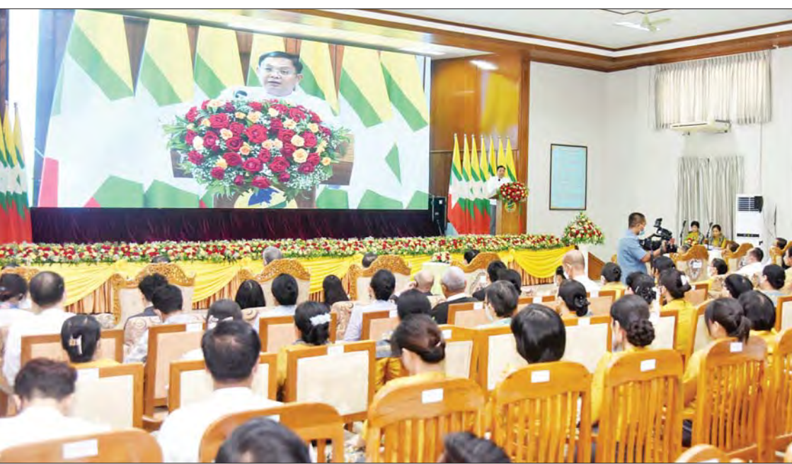
နိုင်ငံတော်စီမံအုပ်ချုပ်ရေးကောင်စီအဖွဲ့ဝင် မြန်မာနိုင်ငံ ရင်းနှီးမြှုပ်နှံမှုကော်မရှင်ဥက္ကဋ္ဌ ဒုတိယဗိုလ်ချုပ်ကြီး မိုးမြင့်ထွန်း နိုင်ငံခြားစီးပွားဆက်သွယ်ရေးဦးစီးဌာန၏ နှစ် (၅၀) ပြည့် ရွှေရတုအခမ်းအနားတွင် ဂုဏ်ပြုအမှာစကား ပြောကြားစဉ်။

နိုင်ငံတော်၏ စီးပွားရေးပူးပေါင်းဆောင်ရွက်မှုနှင့်စပ်လျဉ်း၍ အရေးပါသည့်ဌာနဖြစ်သည့်အပြင် နိုင်ငံတော်ဖွံ့ဖြိုးတိုးတက်ရန်အတွက် လိုအပ်သည့် အကူအညီထောက်ပံ့မှုများ ရရှိအောင် ဆောင်ရွက်ပေးနိုင်သည့်ဌာနလည်း ဖြစ်ပါကြောင်း၊ နိုင်ငံခြားစီးပွားဆက်သွယ်ရေး