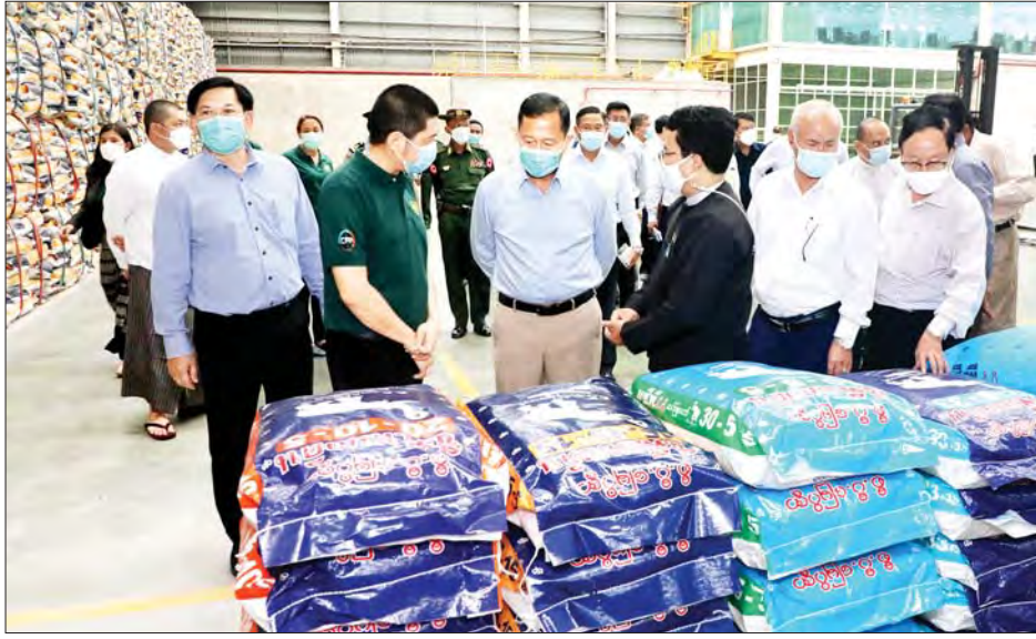
နိုင်ငံတော်စီမံအုပ်ချုပ်ရေးကောင်စီ ဒုတိယဥက္ကဋ္ဌ ဒုတိယတပ်မတော်ကာကွယ်ရေးဦးစီးချုပ် ကာကွယ်ရေးဦးစီးချုပ်(ကြည်း) ဒုတိယဗိုလ်ချုပ်မှူးကြီးစိုးဝင်း သီလဝါအထူးစီးပွားရေးဇုန်အတွင်းရှိ ဓာတ်မြေဩဇာထုတ်လုပ်သည့် စီ.ပီ ဆင်ဖြူတော်စက်ရုံတွင် လှည့်လည်ကြည့်ရှုစဉ်။

တပ်မတော်(ရေ)တွင် အသုံးပြုလျက်ရှိသည့် စစ်ရေယာဉ်များ၏ မှတ်တမ်းဓာတ်ပုံများအား ကြည့်ရှုကြရာ တာဝန်ရှိသူများက လိုက်လံရှင်းလင်းပြသကြသည်။ ထို့နောက် နိုင်ငံတော်စီမံအုပ်ချုပ်ရေးကောင်စီဒုတိယဥက္ကဋ္ဌ ဒုတိယတပ်မတော်ကာကွယ်ရေးဦးစီးချုပ် ကာကွယ်ရေးဦးစီးချုပ်(ကြည်း)နှင့် အဖွဲ့ဝင်များသည် နယ်မြေခံသင်တန်းကျောင်းရှိ သင်တန်းသားများအား စာတွေ့၊ လက်တွေ့ သင်ခန်းစာပို့ချနေမှုများကို ကြည့်ရှုစစ်ဆေး၍ လိုအပ်သည်များ မှာကြားသည်။ ဆက်လက်၍ နိုင်ငံတော်စီမံအုပ်ချုပ်ရေးကောင်စီ ဒုတိယဥက္ကဋ္ဌ ဒုတိယတပ်မတော်ကာကွယ်ရေးဦးစီးချုပ် ကာကွယ်ရေးဦးစီးချုပ်(ကြည်း)နှင့် အဖွဲ့ဝင်များသည် အဆိုပါတပ်ရှိ Damage Control Simulator လက်တွေ့လေ့ကျင့်နေမှုများအား ကြည့်ရှုစစ်ဆေး၍ လိုအပ်သည်များ ပေါင်းစပ်ညှိနှိုင်းပေးခဲ့ကြောင်း သိရသည်။ သတင်းစဉ်