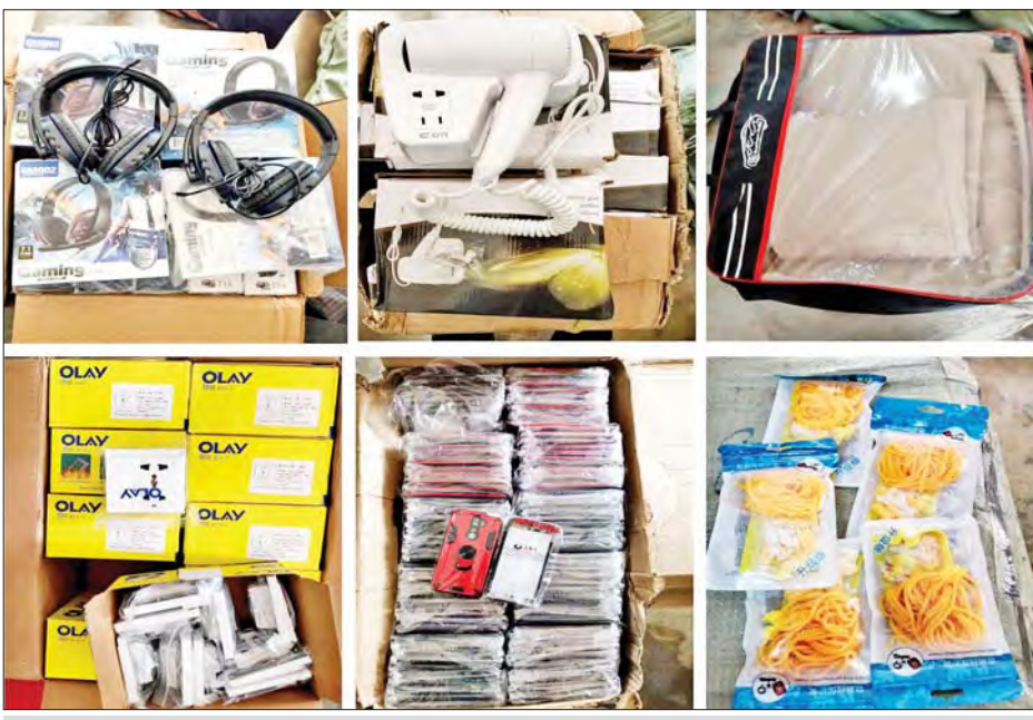
ရှမ်းပြည်နယ် လားရှိုးမြို့နယ်၌ သိမ်းဆည်းရမိသည့် တရားမဝင်ဖုန်းဆက်စပ်ပစ္စည်းများနှင့် လျှပ်စစ် ပစ္စည်းများကိုတွေ့ရစဉ်။

တရားမဝင် ကုန်သွယ်မှု တိုက်ဖျက်ရေး ဦးဆောင် ကော်မတီ၏ ကြီးကြပ်ကွပ်ကဲ မှုဖြင့် တရားမဝင်ကုန်သွယ်မှု များကို ဥပဒေနှင့်အညီ ထိရောက် စွာ တားဆီးအရေးယူနိုင်ရေး ဆောင်ရွက်လျက်ရှိရာ မေ ၅ ရက်တွင် အကောက်ခွန်ဦးစီးဌာန ၏ စီမံခန့်ခွဲမှုဖြင့် မွန်ပြည်နယ် မရမ်းချောင့် အမြဲတမ်းစစ်ဆေး ရေးစခန်း၌ တာဝန်ကျ ပူးပေါင်း အဖွဲ့က စစ်ဆေးမှုများ ဆောင်ရွက်ခဲ့ရာ မြဝတီမှ ရန်ကုန်သို့ မောင်းနှင်လာ သော ခရီးသည်တင်မှန်လုံယာဉ် တစ်စီးပေါ်၌ တရားဝင် စာရွက် စာတမ်း အထောက်အထား တစ်စုံတစ်ရာ တင်ပြနိုင်ခြင်း မရှိသည့် လူသုံးကုန်ပစ္စည်းများ (ခန့်မှန်း တန်ဖိုးငွေကျပ် ၆၄၀၀၀၀)ကို သိမ်းဆည်းရမိ ခဲ့ပြီး အကောက်ခွန် လုပ်ထုံး ဆောင်ရွက်လျက်ရှိသည်။