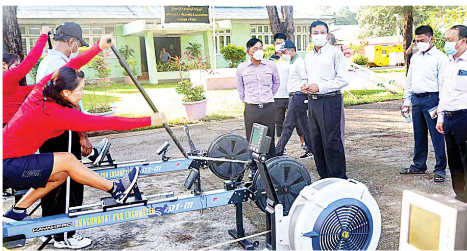
(၃၁)ကြိမ်မြောက် အရှေ့တောင်အာရှအားကစားပြိုင်ပွဲတွင် ဝင်ရောက်ယှဉ်ပြိုင်ရန် ရန်ကုန်မြို့၌ စခန်းသွင်းလေ့ကျင့်နေသည့် အားကစားသမားများအား ပြည်ထောင်စုဝန်ကြီး ဦးမင်းသိန်းဇံ ကြည့်ရှု အားပေးစဉ်။

တစ်နှစ်ကျော်ခန့် ကြိုတင်ပြင်ဆင် ပြိုင်ပွဲသို့ ဝင်ရောက်ယှဉ်ပြိုင်နိုင်ရေးအတွက် လည်း လွန်ခဲ့သည့် ၂၀၂၁ ခုနှစ် ဖေဖော်ဝါရီ ၁ ရက် မှစ၍ အားကစားသမားများအားလုံးကို နေပြည်တော် အားကစားလေ့ကျင့်ရေးစခန်းနှင့် ရန်ကုန်မြို့ရှိ သက်ဆိုင်ရာ အားကစားအဖွဲ့ချုပ် အသီးသီးတွင် တစ်နှစ်ကျော်ခန့် ကြိုတင်ပြင်ဆင် လေ့ကျင့်ခဲ့ကြပြီး ပြိုင်ပွဲတွင် အောင်မြင်မှုရရှိစေရေး အတွက်လည်း အားကစားခြောက်မျိုးဖြစ်သည့် ပြေးခုန်ပစ်၊ လက်ဝှေ့၊ ဘော်လီဘော၊ အလေးမ၊ ဂူရှူး၊ လှေလှော် (ကနူး/ကယက်) အားကစားသမား စုစုပေါင်း ၇၉ ဦးကို တရုတ်နိုင်ငံသို့ စေလွှတ် လေ့ကျင့်စေခဲ့သည့်အပြင် နိုင်ငံတကာမှ အဆင့်မီ နည်းပြများ ငှားရမ်းလေ့ကျင့်မှုအနေဖြင့်လည်း မြားပစ်နှင့် တိုက်ကွမ်ဒိုအားကစားနည်းများ အတွက် ကိုရီးယားနည်းပြ နှစ်ဦးဖြင့်လည်းကောင်း၊ ပီတန်းအားကစားနည်းအတွက် ထိုင်းနည်းပြ တစ်ဦးဖြင့်လည်းကောင်း အတွေ့အကြုံရှိ မြန်မာ လက်ရွေးစင်နည်းပြများဖြင့် ပူးတွဲလေ့ကျင့်ပေးခဲ့ကြ ပြီး အားကစားနည်းအားလုံးမှ အားကစားသမား များ စနစ်တကျလေ့ကျင့်နိုင်စေရေးအတွက် ဂျပန်