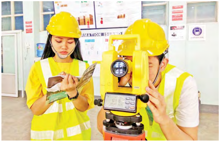
မြို့ပြအင်ဂျင်နီယာကျောင်းသားများ လက်တွေ့ပြုလုပ်နေစဉ်။

“အဂတိလိုက်စားမှုတားဆီးဖို့ “1111” ကို ဖြေကြားစို့” “ဝန်ဆောင်မှုများ ကောင်းစေရေး “1111” ကိုဖြေကြားပေး” “အဂတိပယ်ခွာ ပြည်သာယာဖို့ ပူးပေါင်းဆောင်ရွက်ကြပါစို့”