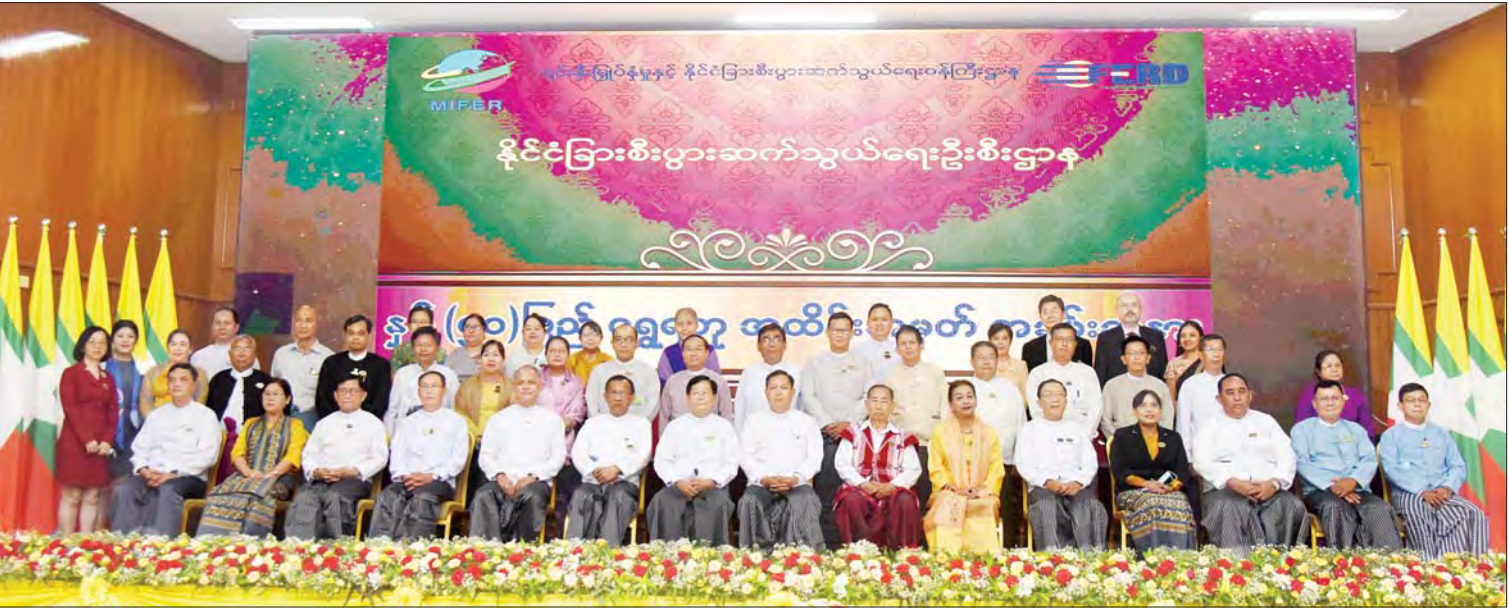
နိုင်ငံခြားစီးပွားဆက်သွယ်ရေးဦးစီးဌာန၏ နှစ်(၅၀)ပြည့် ရွှေရတုအခမ်းအနားသို့ တက်ရောက်လာကြသူများ စုပေါင်းမှတ်တမ်းတင်ဓာတ်ပုံရိုက်စဉ်။

နိုင်ငံခြား စီးပွားဆက်သွယ်ရေးဝန်ကြီးဌာန ပြည်ထောင်စုဝန်ကြီး ဦးအောင်နိုင်ဦးက နိုင်ငံခြားစီးပွားဆက်သွယ်ရေးဦးစီးဌာနအနေဖြင့် ရွှေရတုတိုင် သမိုင်းအစဉ်အလာကောင်းများဖြင့် ဆောင်ရွက်နိုင်ခဲ့မှု