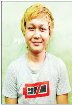
မင်းစစ်သွေး (ခ) ICE

သေခတ်ဖြင့် ပစ်ခတ်သတ်ဖြတ်ရာတွင် ပါဝင်ခြင်း တို့ကြောင့် စစ်အုပ်ချုပ်ရေး(Martial Law) စစ်ခုံရုံး ဖွဲ့၍ စစ်ဆေးမှုများဆောင်ရွက်ခဲ့ရာ အကြမ်းဖက်မှု တိုက်ဖျက်ရေး ဥပဒေပုဒ်မ- ၅၄ အရ ၂၀၂၂ ခုနှစ် မေ ၅ ရက်တွင် “သေဒဏ်” အမိန့်ချမှတ်လိုက်ကြောင်း သိရသည်။