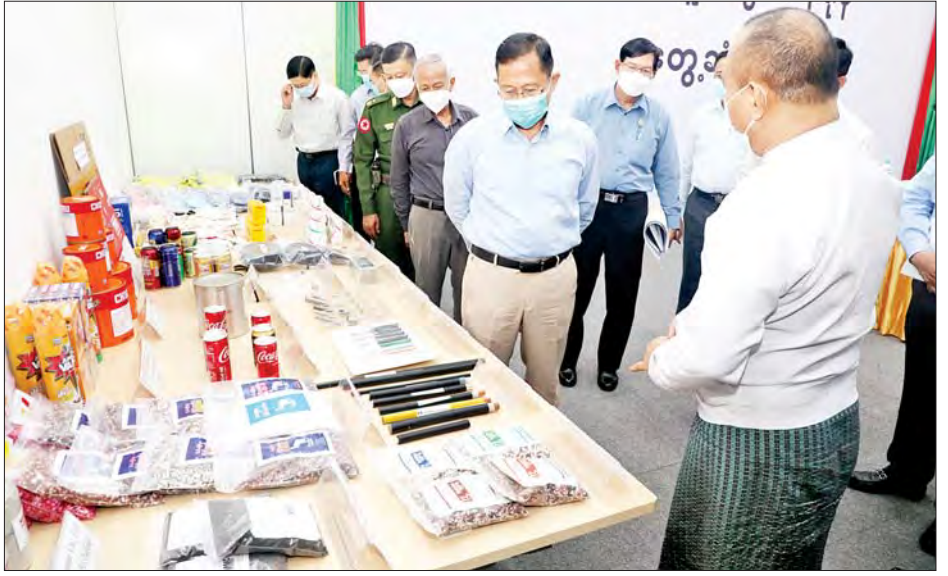
နိုင်ငံတော်စီမံအုပ်ချုပ်ရေးကောင်စီ ဒုတိယဥက္ကဋ္ဌ ဒုတိယတပ်မတော်ကာကွယ်ရေးဦးစီးချုပ် ကာကွယ်ရေးဦးစီးချုပ်(ကြည်း) ဒုတိယဗိုလ်ချုပ်မှူးကြီးစိုးဝင်း ခင်းကျင်းပြသထားသည့် သီလဝါအထူးစီးပွားရေးဇုန်မှထုတ်လုပ်သော ကုန်ပစ္စည်းများအား လှည့်လည်ကြည့်ရှုစဉ်။

၎င်းအပြင် အများစုက ပြောကြားရာတွင် ၂၀၁၅-၂၀၁၆ ဘဏ္ဍာနှစ်မှစတင်၍ မြန်မာနိုင်ငံ အစိုးရနှင့် ဂျပန်နိုင်ငံအစိုးရ ပူးပေါင်းဆောင်ရွက်မှုဖြင့် ထူထောင်ခဲ့သည့် သီလဝါ အထူးစီးပွားရေးဇုန်သည် ရှစ်နှစ်တာကာလအတွင်း ရင်းနှီးမြှုပ်နှံမှု စုစုပေါင်း အမေရိကန်ဒေါ်လာ ၂ ဒသမ ၁၂ ဘီလီယံရှိပြီး မြန်မာ့ကုမ္ပဏီ ကိုးခု၊ မြန်မာအစုရှယ်ယာရှင် ၁၇၀၀၀ ကျော်နှင့် ဂျပန်ကုမ္ပဏီ သုံးခုတို့မှ ပါဝင်ပူးပေါင်း၍ မြန်မာနိုင်ငံအစိုးရမှ ၁၀ ရာခိုင်နှုန်း၊ မြန်မာနိုင်ငံသားကုမ္ပဏီမှ ၄၁ ရာခိုင်နှုန်း၊ ဂျပန်နိုင်ငံအစိုးရမှ ၁၀ ရာခိုင်နှုန်း၊ ဂျပန်ကုမ္ပဏီမှ ၃၉ ရာခိုင်နှုန်း အသီးသီး အချိုးကျ ထည့်ဝင်ဆောင်ရွက်ရသည့် အထူးစီးပွားရေးဇုန် ကြီးတစ်ခုဖြစ်ကြောင်း၊ လုပ်နည်းပိုင်းဆိုင်ရာအရနှင့် သီလဝါအထူးစီးပွားရေးဇုန်၏ လုပ်ပိုင်ခွင့်ရခြေဧက ၅၀၀၀ ကျော်တွင် ခွင့်ပြုရောင်းချပြီး မြေနေရာများအားလုံးအခက်ကျန်ရှိခြေနေရာများနှင့် လုပ်ငန်းအမြန်အကောင်အထည်ဖော်နိုင်ရန် စီမံခန့်ခွဲမှု