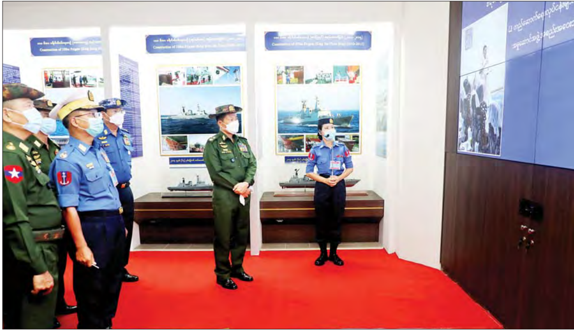
နိုင်ငံတော်စီမံအုပ်ချုပ်ရေးကောင်စီ ဒုတိယဥက္ကဋ္ဌ ဒုတိယတပ်မတော်ကာကွယ်ရေးဦးစီးချုပ် ကာကွယ်ရေးဦးစီးချုပ်(ကြည်း) ဒုတိယဗိုလ်ချုပ်မှူးကြီးစိုးဝင်း သန်လျင်ရေတပ်သင်တန်းကျောင်းဌာနချုပ်ရှိ တပ်မတော်(ရေ)တွင် အသုံးပြုလျက်ရှိသည့် စစ်ရေယာဉ်များ၏ မှတ်တမ်းဓာတ်ပုံများကို ကြည့်ရှုစဉ်။

နေပြည်တော် မေ ၆ နိုင်ငံတော်စီမံအုပ်ချုပ်ရေးကောင်စီ ဒုတိယဥက္ကဋ္ဌ ဒုတိယတပ်မတော်ကာကွယ်ရေးဦးစီးချုပ် ကာကွယ်ရေးဦးစီးချုပ်(ကြည်း) ဒုတိယဗိုလ်ချုပ်မှူးကြီးစိုးဝင်း သန်လျင် ကာကွယ်ရေးဦးစီးချုပ်(ရေ) ဗိုလ်ချုပ်ကြီး စိုးအောင်၊ ကာကွယ်ရေးဦးစီးချုပ်(ကြည်း)၊ ရေ၊ လေ)မှ တပ်မတော်အရာရှိကြီးများ၊ ရန်ကုန်တိုင်း စစ်ဌာနချုပ်တိုင်းမှူးနှင့် တာဝန်ရှိသူများ လိုက်ပါ၍ ယနေ့မုန်းလွဲပိုင်းတွင် သန်လျင်တပ်နယ်ရှိ ရေတပ်သင်တန်းကျောင်း ဌာနချုပ်သို့ သွားရောက်ကြည့်ရှုစစ်ဆေးသည်။ ကြည့်ရှု ဦးစွာ နိုင်ငံတော်စီမံအုပ်ချုပ်ရေးကောင်စီဒုတိယဥက္ကဋ္ဌ ဒုတိယတပ်မတော်ကာကွယ်ရေးဦးစီးချုပ် ကာကွယ်ရေးဦးစီးချုပ်(ကြည်း)နှင့် အဖွဲ့ဝင်များသည် သန်လျင်ရေတပ် သင်တန်းကျောင်းဌာနချုပ်ရှိ Motivation Hall သို့ ရောက်ရှိကြပြီး