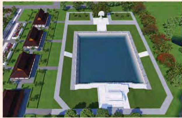
ကျောက်စာရုံစေတီ(၁၂ x ၁၂x ၁၈)ပေ ၁ ဆူ တန်ဖိုး-၂၇၉ သိန်း