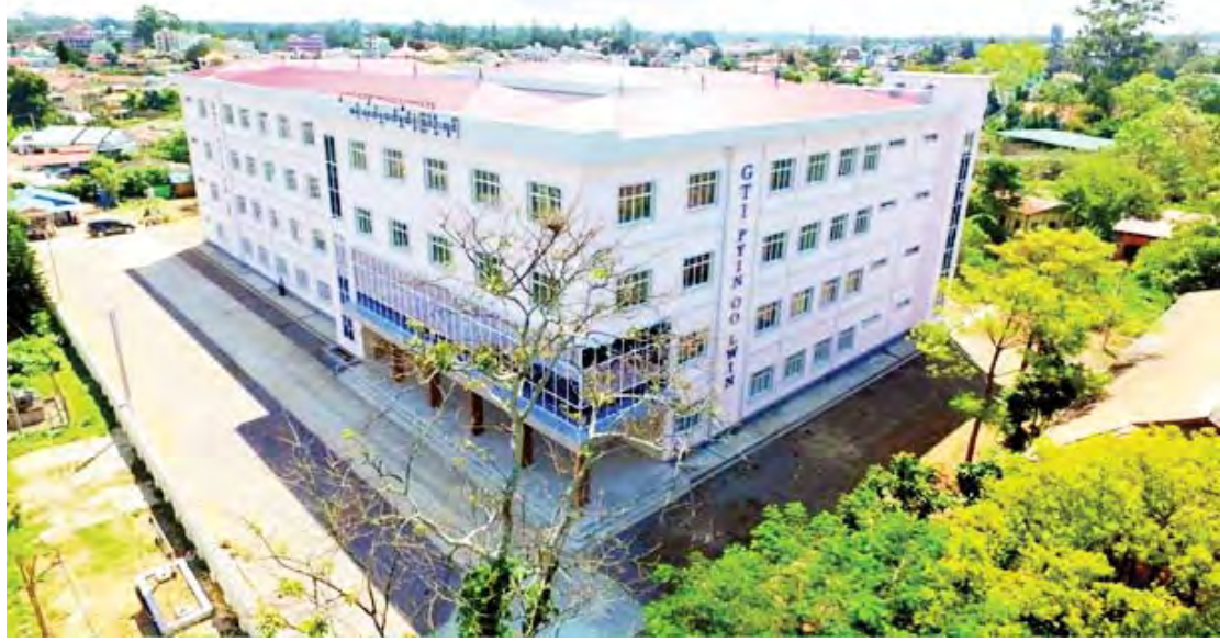
အစိုးရစက်မှုလက်မှုသိပ္ပံကျောင်း(ပြင်ဦးလွင်)။

“သင်တန်းကာလ သုံးနှစ်အတွင်း World Youth Skills Day ကဲ့သို့ နိုင်ငံတကာအထိမ်းအမှတ်နေ့တွေမှာ သတ်မှတ်ထားတဲ့ GTI တွေမှာ Skills Competition and Innovation Award ပြိုင်ပွဲတွေ ကျင်းပစေ ပြီး ကျောင်းသား ကျောင်းသူတွေရဲ့ ဘာသာရပ်ကျွမ်းကျင် မှု၊ တီထွင်ဖန်တီးနိုင်မှု၊ အဖွဲ့လိုက်ဆောင်ရွက်တတ်မှု၊ စီမံ ခန့်ခွဲမှု၊ သတင်းအချက်အလက်နည်းပညာနဲ့ ဒစ်ဂျစ်တယ် စွမ်းရည်တွေ အသုံးပြုနိုင်မှု စတဲ့အရည်အချင်းတွေကို ဖော်ထုတ်ပြသယှဉ်ပြိုင်ခွင့်ရရှိနိုင်”