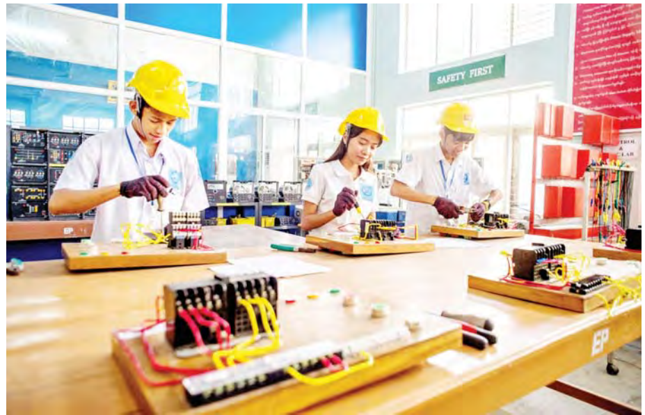
လျှပ်စစ်စွမ်းအားအင်ဂျင်နီယာကျောင်းသားများ လက်တွေ့ပြုလုပ်နေစဉ်။