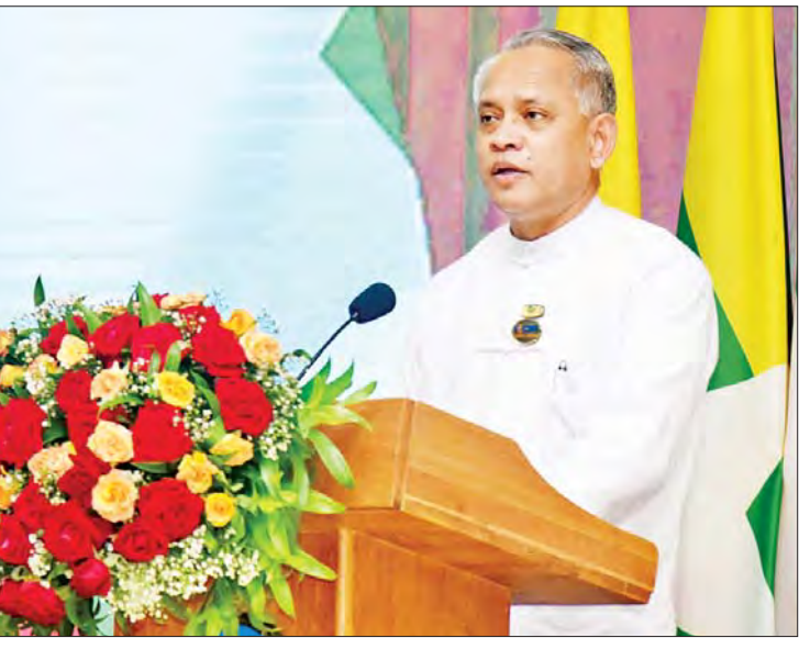
ပြည်ထောင်စုဝန်ကြီး ဦးအောင်နိုင်ဦး ဂုဏ်ပြုအမှာစကား ပြောကြားစဉ်။

နိုင်ငံခြားစီးပွားဆက်သွယ်ရေး ဦးစီးဌာနအနေဖြင့် နိုင်ငံတော်စီမံအုပ်ချုပ်ရေးကောင်စီ၏ ရှေ့လုပ်ငန်းစဉ်(၅)ရပ်နှင့် နိုင်ငံရေး၊ စီးပွားရေး၊ လူမှုရေးဦးတည်ချက်(၉)ရပ်တို့ကို ဆက်လက်ကြိုးပမ်းဆောင်ရွက်ကြခြင်းဖြင့် နိုင်ငံတော်၏ မေမရီစီးပွားရေး အခြေခံအဆောက်အအုံများ ဖွံ့ဖြိုးတိုးတက်ရေးလုပ်ငန်းစဉ်များအတွက် လိုအပ်သည့် ပံ့ပိုးမှုများ ရရှိစေရန် ကြိုးပမ်းဆောင်ရွက်သွားစေလို