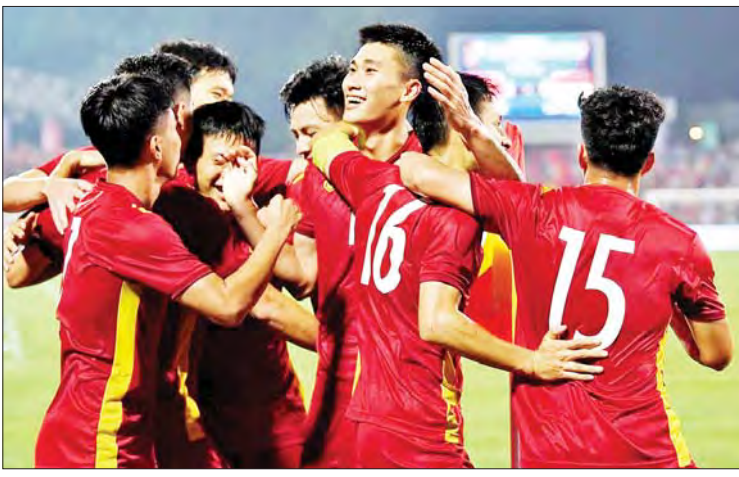
အိမ်ရှင်ဗီယက်နမ်အသင်း ဂိုးသွင်းအပြီး အောင်ပွဲခံနေစဉ်။

ရန်ကုန် မေ ၆ (၃၁)ကြိမ်မြောက် ဆီးဂိမ်းအမျိုးသားဘောလုံးပြိုင်ပွဲ အုပ်စု(က)ပထမနေ့ကို မေ ၆ ရက်က ဗီယက်နမ်နိုင်ငံ၌ စတင်ကျင်းပရာ ဖိလစ်ပိုင်နှင့် အိမ်ရှင် ဗီယက်နမ်အသင်း ဂိုးပြတ်အနိုင်ရခဲ့သည်။ အုပ်စု (က) ပထမနေ့တွင် မြန်မာအသင်းပွဲစဉ်မပါဝင်ဘဲ အခြားလေးသင်းသာ ယှဉ်ပြိုင်ခဲ့ရပြီး ဖိလစ်ပိုင်အသင်းက တီမောအသင်းကို လေးဂိုးပြတ်၊ အိမ်ရှင်ဗီယက်နမ်အသင်းက အင်ဒိုနီးရှားအသင်းကို သုံးဂိုးပြတ် အနိုင်ရခဲ့သည်။ ဖိလစ်ပိုင်အသင်းသည် တီမောအသင်းကို ပထမပိုင်းတွင် စာမျက်နှာ ၂၀ ကော်လံ ၁ သို့ *