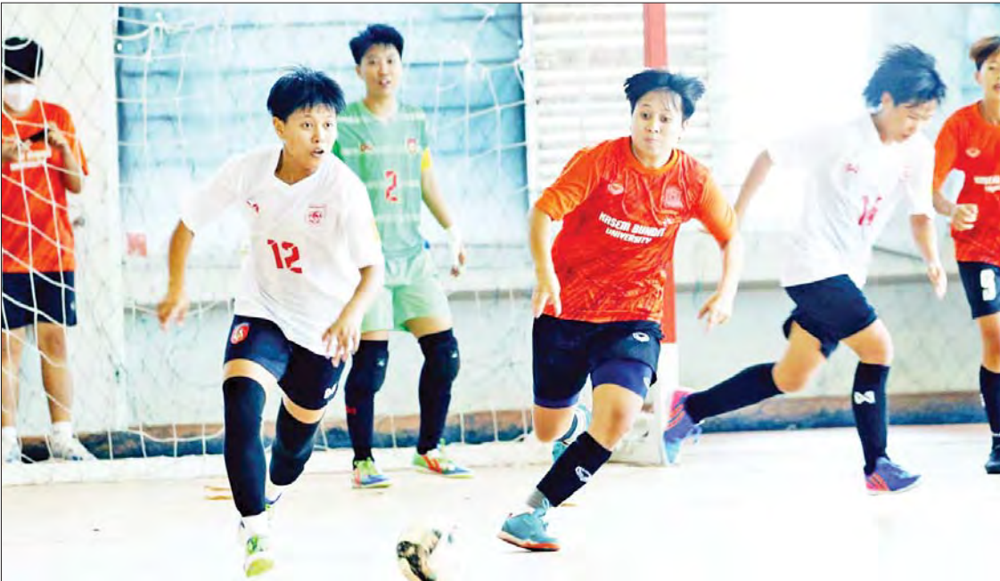
မြန်မာ့လက်ရွေးစင် အမျိုးသမီးဖူဆယ်အသင်းနှင့် Kasem Bundit တက္ကသိုလ်အမျိုးသမီးဖူဆယ်အသင်းတို့ ခြေစမ်းပွဲကစားစဉ်။