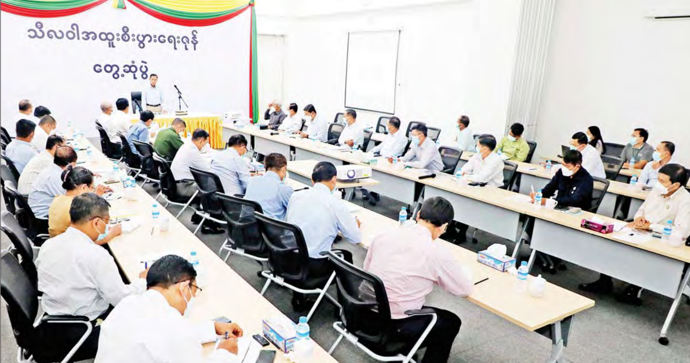
နိုင်ငံတော်စီမံအုပ်ချုပ်ရေးကောင်စီ ဒုတိယဥက္ကဋ္ဌ ဒုတိယတပ်မတော်ကာကွယ်ရေးဦးစီးချုပ် ကာကွယ်ရေးဦးစီးချုပ်(ကြည်း) ဒုတိယဗိုလ်ချုပ်မှူးကြီးစိုးဝင်း သီလဝါအထူးစီးပွားရေးဇုန်စီမံခန့်ခွဲမှုကော်မတီမှ တာဝန်ရှိသူများအား တွေ့ဆုံအမှာစကားပြောကြားစဉ်။

နေပြည်တော် မေ ၆ နိုင်ငံတော်စီမံအုပ်ချုပ်ရေးကောင်စီ ဒုတိယဥက္ကဋ္ဌ ဒုတိယတပ်မတော်ကာကွယ်ရေးဦးစီးချုပ် ကာကွယ်ရေးဦးစီးချုပ်(ကြည်း) ဒုတိယဗိုလ်ချုပ်မှူးကြီးစိုးဝင်းနှင့်အဖွဲ့သည် ယနေ့မွန်းလွဲပိုင်းတွင် သီလဝါအထူး စီးပွားရေးဇုန်စီမံခန့်ခွဲမှုကော်မတီမှ တာဝန်ရှိသူများအား သီလဝါအထူးစီးပွားရေးဇုန် စီမံခန့်ခွဲမှုကော်မတီ ဥက္ကဋ္ဌရုံး အစည်းအဝေးခန်းမ၌ တွေ့ဆုံ၍ အမှာစကားပြောကြားသည်။