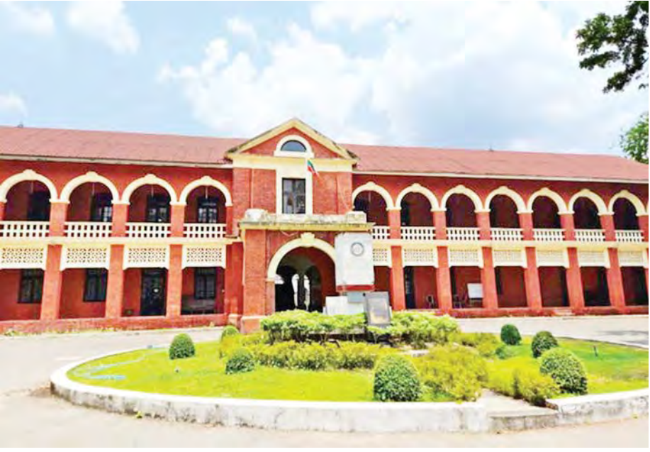
အစိုးရစက်မှုလက်မှုသိပ္ပံကျောင်း(အင်းစိန်)။

အစောဆုံး ပေါ်ပေါက်လာခဲ့တဲ့ စက်မှုလက်မှုသိပ္ပံ နိုင်ငံတော်ရဲ့ GTI ပညာရေးဟာ GTI (အင်းစိန်) မှ စတင်ခဲ့ပါတယ်။ GTI (အင်းစိန်) ဟာ ၁၈၉၅ ခုနှစ် ဧပြီ ၁ ရက်မှာ ရန်ကုန်တိုင်းဒေသကြီး လသာ မြို့နယ် မြို့မကျောင်းလမ်း အမှတ်(၂၉၇)မှာ Government Engineering School အဖြစ် စတင်မွေးဖွားခဲ့ပြီး နောင်အခါမှာ မြန်မာနိုင်ငံရဲ့ စက်မှုလက်မှုသိပ္ပံကျောင်း ၁၂ ကျောင်းအနက် အစောဆုံး ပေါ်ပေါက်လာခဲ့တဲ့ စက်မှုလက်မှုသိပ္ပံ ဖြစ်လာခဲ့ပါတယ်။