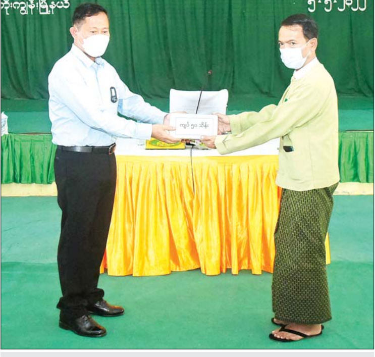
နိုင်ငံတော်စီမံအုပ်ချုပ်ရေးကောင်စီ ဒုတိယဥက္ကဋ္ဌ ဒုတိယတပ်မတော်ကာကွယ်ရေး ဦးစီးချုပ် ကာကွယ်ရေးဦးစီးချုပ် (ကြည်း) ဒုတိယဗိုလ်ချုပ်မှူးကြီးစိုးဝင်း ကိုကိုးကျွန်း မြို့ရှိ ဒေသဖွံ့ဖြိုးရေးအတွက် ထောက်ပံ့ငွေပေးအပ်ရာ တာဝန်ရှိသူတစ်ဦးက လက်ခံ ရယူစဉ်။