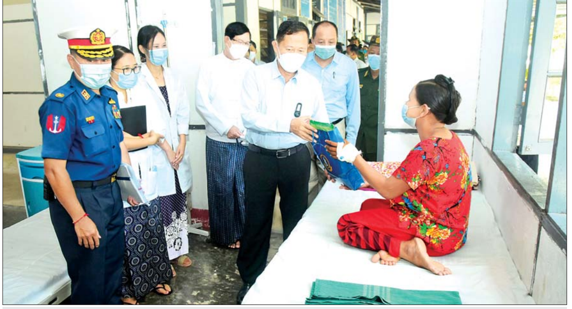
နိုင်ငံတော်စီမံအုပ်ချုပ်ရေးကောင်စီ ဒုတိယဥက္ကဋ္ဌ ဒုတိယတပ်မတော်ကာကွယ်ရေးဦးစီးချုပ် ကာကွယ်ရေးဦးစီးချုပ် (ကြည်း) ဒုတိယဗိုလ်ချုပ်မှူးကြီးစိုးဝင်း ကိုကိုးကျွန်းမြို့ရှိ မြို့နယ်ပြည်သူ့ဆေးရုံ၌ တက်ရောက်ဆေးကုသမှုခံယူလျက်ရှိသည့် ဒေသခံ ပြည်သူတစ်ဦးအား စားသောက်ဖွယ်ရာများနှင့် ထောက်ပံ့ပစ္စည်းများ ပေးအပ်စဉ်။