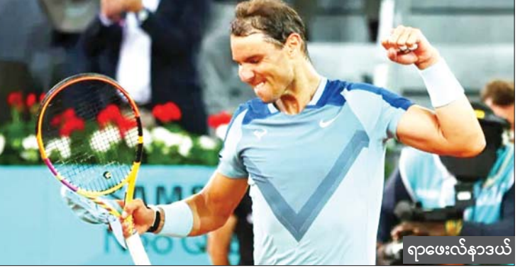
ရာဖေးလ်နာဒယ်

၂၁ ကြိမ်အထိ ဆွတ်ခူးထားနိုင်ခဲ့တဲ့ ရာဖေးလ်နာဒယ် နောက်တစ်ဆင့်တက်ခဲ့ သလို ဗြိတိန်တင်းနစ်အကျော်အမော် အန်ဒီမာရေးဟာလည်း ရှာပိုလာလော့ကို အနိုင်ရရှိကာ နောက်တစ်ဆင့်တက်ခဲ့ပြီး အန်ဒီမာရေးဟာ နောက်တစ်ဆင့်မှာ ဆားဘီးယားပရော်ဖက်ရှင်နယ် တင်းနစ် ကစားသမား ဂျီကိုဗစ်နဲ့ ယှဉ်ပြိုင်ကစား ရမှာလည်း ဖြစ်ပါတယ်။