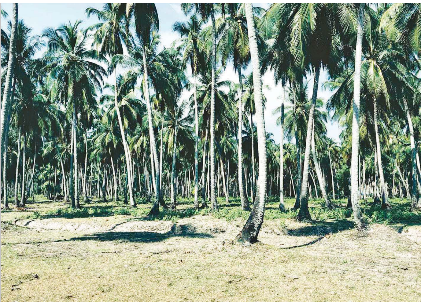
ကိုကိုးကျွန်းမြို့နယ်ရှိ ပင်လယ်ကမ်းခြေ ရှုခင်းများကို တွေ့ရစဉ်။

ထိုသို့ထူးထူးခြားခြား နယ်စပ်ဒေသမြို့ရွာလေး