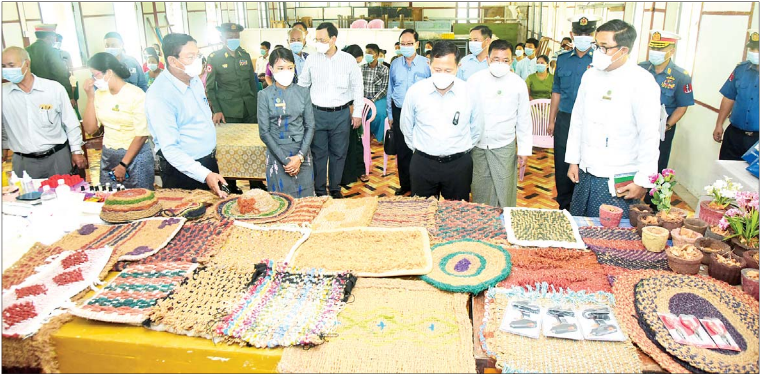
နိုင်ငံတော်စီမံအုပ်ချုပ်ရေးကောင်စီ ဒုတိယဥက္ကဋ္ဌ ဒုတိယတပ်မတော်ကာကွယ်ရေးဦးစီးချုပ် ကာကွယ်ရေးဦးစီးချုပ် (ကြည်း) ဒုတိယဗိုလ်ချုပ်မှူးကြီးစိုးဝင်း စားသောက်ကုန် နှင့် လူသုံးကုန်ထုတ်လုပ်မှုနည်းပညာသင်တန်း ဖွင့်လှစ်သင်ကြားပေးနေသည့် ကိုကိုးကျွန်းမြို့ရှိ အခြေခံပညာအထက်တန်းကျောင်းအတွင်း ကြည့်ရှုစစ်ဆေးစဉ်။

သော တိုင်းပြည်သာယာပြောရေး၊ စားရေရိက္ခာဖူလုံရေး မူဝါဒကို အကောင် အထည်ဖော်နိုင်ရန် တစ်ဦးချင်းဝင်ငွေ ရရှိနိုင်သော အလုပ်အကိုင် အခွင့်အလမ်း များ ရရှိရန်လည်း နိုင်ငံတော်ဝန်ကြီးချုပ် အနေဖြင့် သမဝါယမနှင့် ကျေးလက်ဖွံ့ဖြိုး ရေးဝန်ကြီးဌာနကို တာဝန်ပေး၍ SME လုပ်ငန်းအဖြစ် အုန်းဆံကြိုးစက်ရုံနှင့် အုန်းဆံဆက်စပ်သည့် လူသုံးကုန်ထုတ် ပစ္စည်း လက်မှုလုပ်ငန်းများ လုပ်ဆောင် ရန် သင်တန်းပေးမှုများ ဆောင်ရွက်ပေး