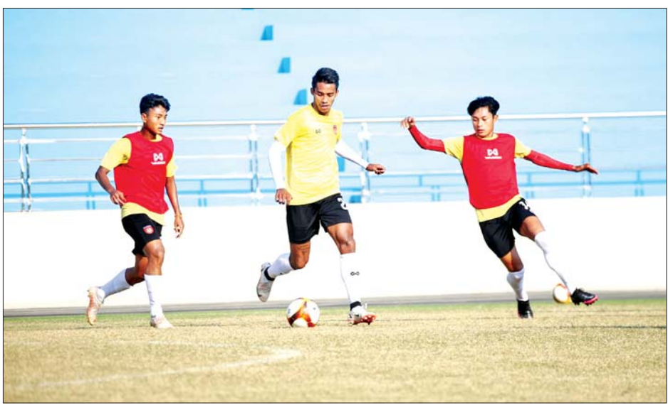
မြန်မာအမျိုးသားဘောလုံးအသင်း ကစားသမားများ လေ့ကျင့်နေစဉ်။