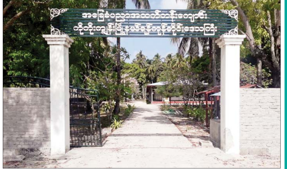
ကိုကိုးကျွန်းမြို့နယ်ရှိ အခြေခံပညာအထက်တန်းကျောင်းကို တွေ့ရစဉ်။