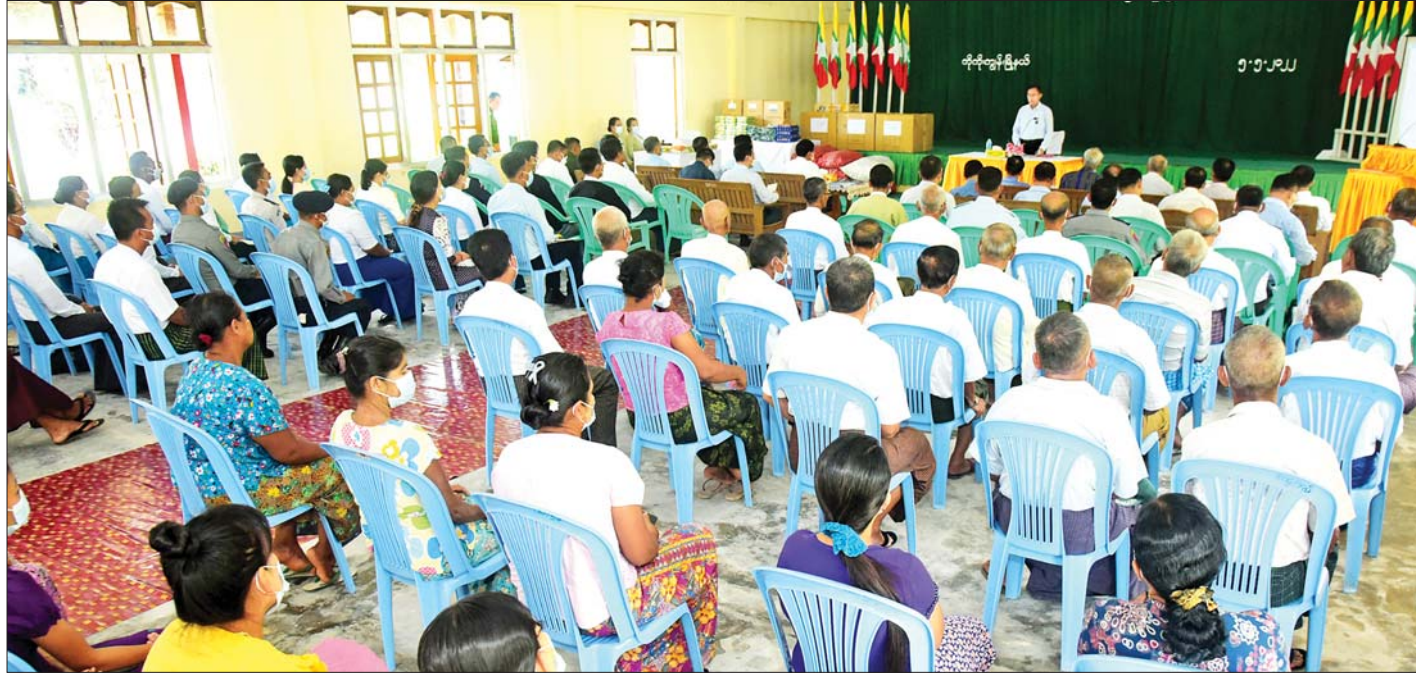
နိုင်ငံတော်စီမံအုပ်ချုပ်ရေးကောင်စီ ဒုတိယဥက္ကဋ္ဌ ဒုတိယတပ်မတော်ကာကွယ်ရေးဦးစီးချုပ် ကာကွယ်ရေးဦးစီးချုပ်(ကြည်း) ဒုတိယဗိုလ်ချုပ်မှူးကြီးစိုးဝင်း ရန်ကုန်တိုင်းဒေသကြီး ကိုကိုးကျွန်းမြို့ရှိ ဌာနဆိုင်ရာများ၊ ဒေသခံပြည်သူများအား တွေ့ဆုံအမှာစကားပြောကြားစဉ်။

နေပြည်တော် မေ ၅ နိုင်ငံတော်စီမံအုပ်ချုပ်ရေးကောင်စီ ဒုတိယ ဥက္ကဋ္ဌ ဒုတိယတပ်မတော်ကာကွယ်ရေးဦးစီးချုပ် ကာကွယ်ရေးဦးစီးချုပ်(ကြည်း) ဒုတိယဗိုလ်ချုပ်မှူး ကြီး စိုးဝင်းသည် ယနေ့နံနက်ပိုင်းတွင် ရန်ကုန်တိုင်း ဒေသကြီး ကိုကိုးကျွန်းမြို့ရှိ ဌာနဆိုင်ရာများ၊ ဒေသခံ ပြည်သူများအား မြို့နယ်ခန်းမ၌ တွေ့ဆုံအမှာ စကားပြောကြားသည်။