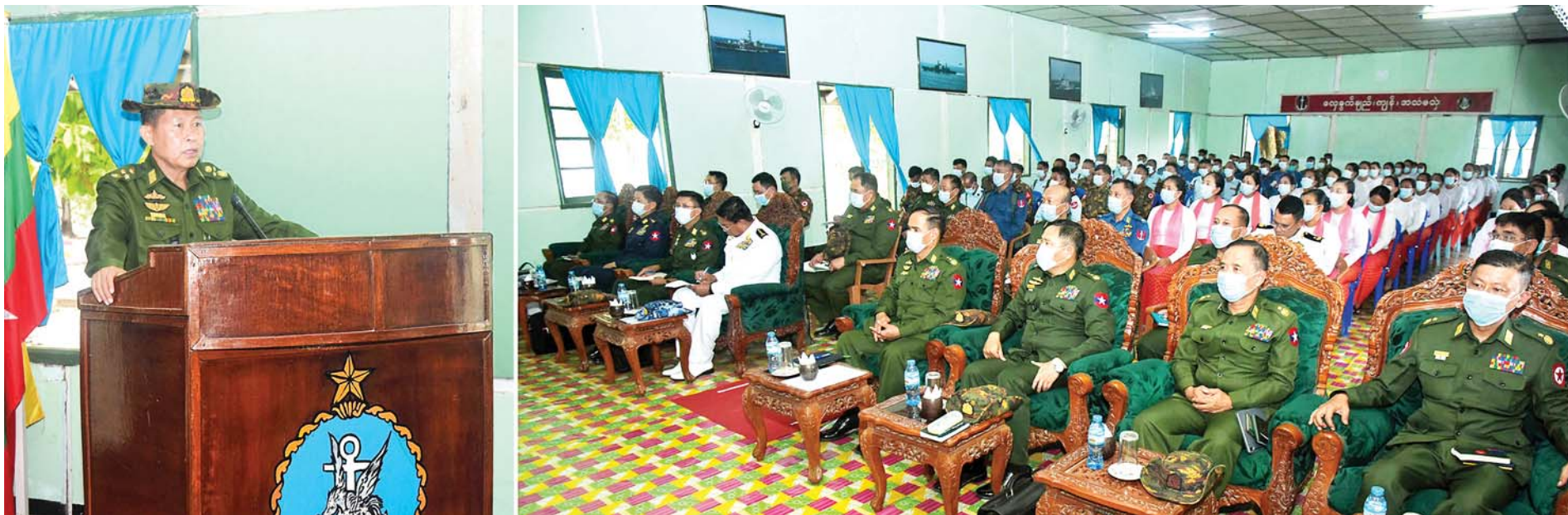
နိုင်ငံတော်စီမံအုပ်ချုပ်ရေးကောင်စီ ဒုတိယဥက္ကဋ္ဌ ဒုတိယတပ်မတော်ကာကွယ်ရေးဦးစီးချုပ် ကာကွယ်ရေးဦးစီးချုပ်(ကြည်း) ဒုတိယဗိုလ်ချုပ်မှူးကြီးစိုးဝင်း ကိုကိုးကျွန်းမြို့ရှိ အရာရှိ၊ စစ်သည်မိသားစုဝင်များအား တွေ့ဆုံအမှာစကားပြောကြားစဉ်။