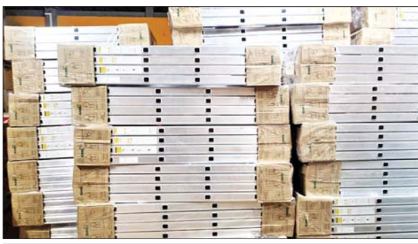
ကရင်ပြည်နယ် ကော့ကရိတ်(တံတားကျိုး) စုပေါင်းစစ်ဆေးရေး စခန်း၌ သိမ်းဆည်းရမိမှု။

အဖွဲ့က စစ်ဆေးမှုများဆောင်ရွက်ခဲ့ရာ သွင်းကုန်ကြေညာလွှာ(ID)တွင် ကြေညာထားသည်ထက် ပိုမိုပါရှိလာသော အဝတ်အထည်များ (ခန့်မှန်း တန်ဖိုးငွေကျပ် ၁၅,၀၈၀,၀၀၀)ကို သိမ်းဆည်းရမိခဲ့ပြီး အကောက်ခွန် လုပ်ထုံးလုပ်နည်းနှင့်အညီ အရေးယူဆောင်ရွက်လျက်ရှိသည်။ ထို့အတူ ဧရာဝတီတိုင်းဒေသကြီး တရားမဝင် ကုန်သွယ်မှု တိုက်ဖျက်ရေးအထူးအဖွဲ့၏ စီမံခန့်ခွဲမှုဖြင့် သစ်တောဦးစီးဌာန ဦးဆောင် သော စစ်ဆေးရေးအဖွဲ့က စစ်ဆေးမှုများဆောင်ရွက်ခဲ့ရာ ရေကြည် မြို့နယ်အတွင်း တရားမဝင် သစ်မျိုးစုံ ၂ ဒသမ ၂၃၆၄ တန် (ခန့်မှန်း တန်ဖိုးငွေကျပ် ၁၅၆,၅၄၈)ကို သိမ်းဆည်းရမိခဲ့ပြီး သစ်တောဥပဒေနှင့် အညီ အရေးယူဆောင်ရွက်လျက်ရှိသည်။ ထို့ပြင် မေ ၅ ရက်တွင် ပဲခူးတိုင်းဒေသကြီး တရားမဝင် ကုန်သွယ်မှု တိုက်ဖျက်ရေးအထူးအဖွဲ့၏ စီမံခန့်ခွဲမှုဖြင့် တိုင်းဒေသကြီး သစ်တော ဦးစီးဌာန ဦးဆောင်သော ပူးပေါင်းစစ်ဆေးရေးအဖွဲ့က စစ်ဆေးမှုများ ဆောင်ရွက်ခဲ့ရာ တောင်ငူခရိုင် ရေတာရှည်မြို့နယ်အတွင်း တရားမဝင် သစ်မျိုးစုံ ၄ ဒသမ ၅၂၈၈ တန် (ခန့်မှန်းတန်ဖိုးငွေကျပ် ၃၀၇,၀၁၆) ကို သိမ်းဆည်းရမိခဲ့ပြီး သစ်တောဥပဒေနှင့်အညီ အရေးယူဆောင်ရွက် လျက်ရှိသည်။ သို့ဖြစ်ပါ၍ မေ ၂ ရက်၊ ၃ ရက်၊ ၄ ရက် နှင့် ၅ ရက်တို့တွင် သိမ်းဆည်း ရမိမှု စုစုပေါင်းမှာ အမှုတွဲ ၁၈ မှု (ခန့်မှန်းတန်ဖိုးငွေကျပ် ၁၃၅,၅၅၁,၇၈၆) ဖြစ်ကြောင်း တရားမဝင်ကုန်သွယ်မှုတိုက်ဖျက်ရေးဦးဆောင်ကော်မတီ မှ သိရသည်။ သတင်းစဉ်