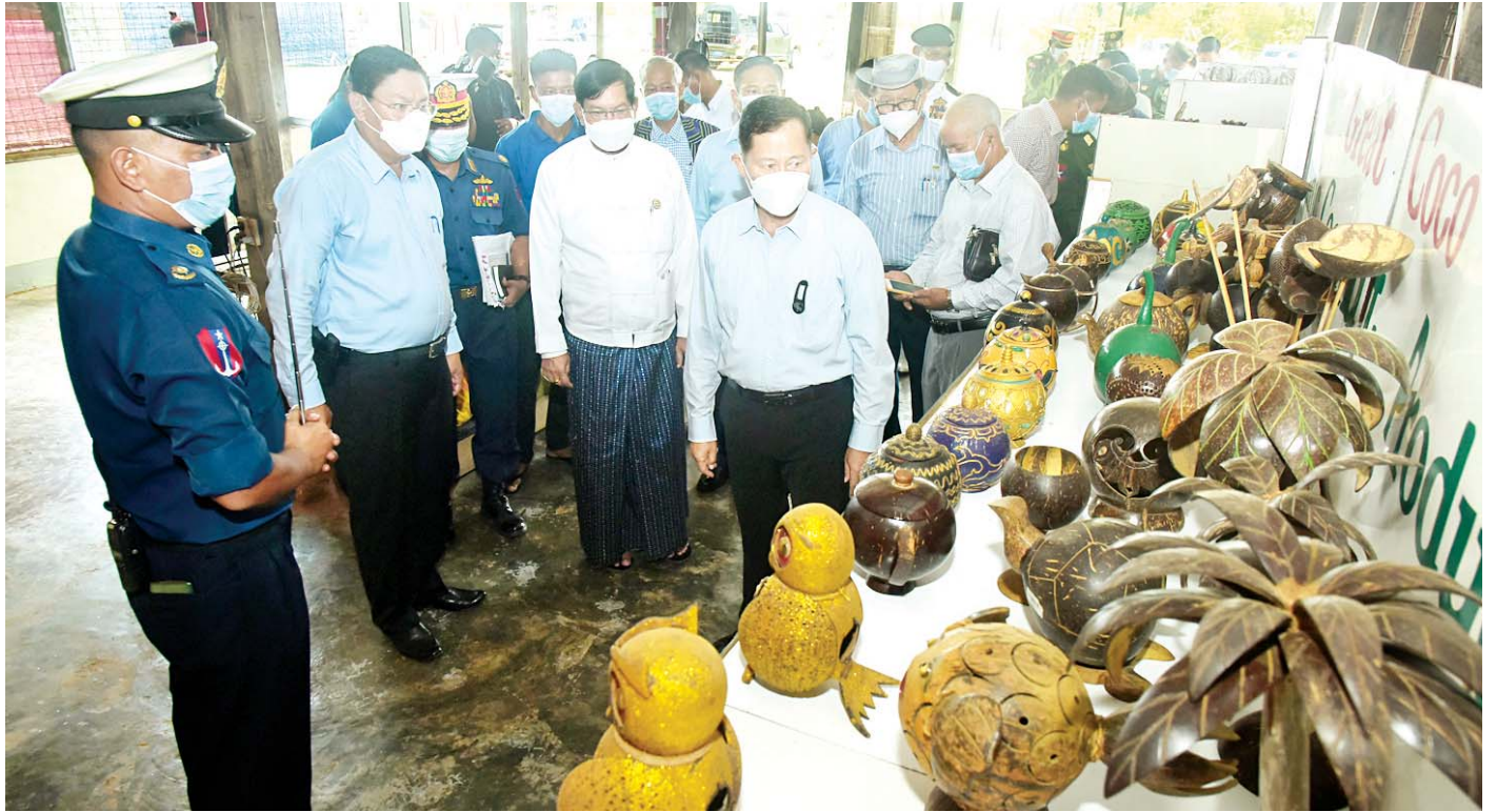
နိုင်ငံတော်စီမံအုပ်ချုပ်ရေးကောင်စီ ဒုတိယဥက္ကဋ္ဌ ဒုတိယတပ်မတော် ကာကွယ်ရေးဦးစီးချုပ် ကာကွယ်ရေးဦးစီးချုပ်(ကြည်း) ဒုတိယဗိုလ်ချုပ်မှူးကြီးစိုးဝင်း ကိုကိုးကျွန်းမြို့ နယ်မြေခံတပ်ရှိ အုန်းနှင့်အုန်းထွက်ပစ္စည်းထုတ်လုပ်မှုလုပ်ငန်းတွင် လှည့်လည်ကြည့်ရှုစဉ်။

အဆိုပါပင်လယ်သွားဆေးရုံရေယာဉ်(သံလွင်)သည် မေ ၄ ရက်မှစ၍ ကိုကိုးကျွန်းမြို့ပေါ်ရှိ