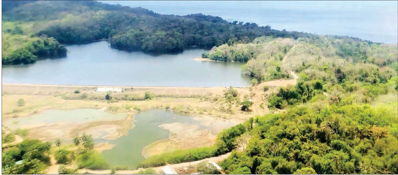
ကိုကိုးကျွန်း ရေလှောင်တံ။

တော်ကြီးကျောင်းရှေ့သို့အရောက် လက်အုပ်ချိမ့် ရှိခိုးခဲ့ပါသေးသည်။ (၄)မိုင် ကမ်းခြေနေရာလေး သည်ကား မြို့သူမြို့သားများ အပန်းဖြေချေးဆိပ် နေရာဖြစ်ကြောင်း သိရသည်။ ကြည့်ရသည်မှာ သာသာယာယာ နေရာလေးတစ်ခုပေ။