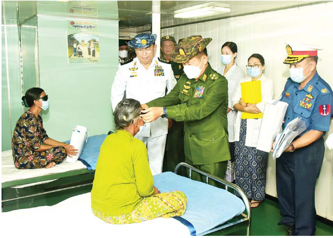
နိုင်ငံတော်စီမံအုပ်ချုပ်ရေးကောင်စီ ဒုတိယဥက္ကဋ္ဌ ဒုတိယတပ်မတော်ကာကွယ်ရေးဦးစီးချုပ် ကာကွယ်ရေးဦးစီးချုပ်(ကြည်း) ဒုတိယဗိုလ်ချုပ်မှူးကြီးစိုးဝင်း ပင်လယ်သွားဆေးရုံရေယာဉ် (သံလွင်)ပေါ်တွင် ဆေးကုသမှု ခံယူလျက်ရှိသည့် မျက်စိခွဲစိတ်လူနာတစ်ဦးအား ဆေးမျက်မှန် တပ်ဆင်ပေးစဉ်။

နိုင်ငံတော်စီမံအုပ်ချုပ်ရေး ကောင်စီ ဒုတိယဥက္ကဋ္ဌ ဒုတိယတပ်မတော် ကာကွယ်ရေးဦးစီးချုပ် ကာကွယ်ရေးဦးစီးချုပ်(ကြည်း) ဒုတိယဗိုလ်ချုပ်မှူးကြီး စိုးဝင်း ကိုကိုးကျွန်းမြို့ နယ်မြေခံတပ်ရှိ ဥစားကြက် မွေးမြူရေးခြံကြည့်ရှုစစ်ဆေးစဉ်။