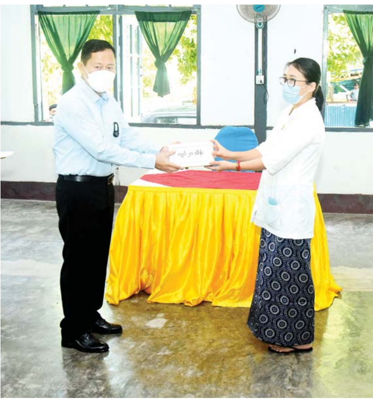
နိုင်ငံတော်စီမံအုပ်ချုပ်ရေးကောင်စီ ဒုတိယဥက္ကဋ္ဌ ဒုတိယတပ်မတော် ကာကွယ်ရေးဦးစီးချုပ် ကာကွယ်ရေးဦးစီးချုပ်(ကြည်း) ဒုတိယဗိုလ်ချုပ်မှူးကြီး စိုးဝင်း ကိုကိုးကျွန်းမြို့ရှိ မြို့နယ်ပြည်သူ့ဆေးရုံတွင် တာဝန်ထမ်းဆောင်လျက် ရှိသည့် ကျန်းမာရေးဝန်ထမ်းများအတွက် ချီးမြှင့်ငွေများပေးအပ်ရာ တာဝန်ရှိသူ တစ်ဦးက လက်ခံရယူစဉ်။

★ စာမျက်နှာ ၅ မှ ယင်းနောက် နိုင်ငံတော်စီမံအုပ်ချုပ် ရေးကောင်စီ ဒုတိယဥက္ကဋ္ဌ ဒုတိယ တပ် မတော် ကာကွယ် ရေးဦးစီးချုပ် ကာကွယ်ရေးဦးစီးချုပ်(ကြည်း) ဒုတိယ ဗိုလ်ချုပ်မှူးကြီး စိုးဝင်းသည် အဖွဲ့ဝင်များ လိုက်ပါ၍ ကိုကိုးကျွန်းမြို့ရှိ မြို့နယ် ပြည်သူ့ဆေးရုံသို့သွားရောက်၍ ဆေးရုံ တွင် တက်ရောက် ဆေးကုသမှုခံယူလျက် ရှိသည့် ဒေသခံပြည်သူများကို လိုက်လံ ကြည့်ရှု၍ တစ်ဦးချင်း၏ ရောဂါအခြေ အနေများကို မေးမြန်းအားပေးစကား ပြောကြားကာ စားသောက်ဖွယ်ရာ များနှင့် ထောက်ပံ့ပစ္စည်းများ ပေးအပ် သည်။ ထို့နောက် နိုင်ငံတော်စီမံအုပ်ချုပ်ရေး ကောင်စီဒုတိယဥက္ကဋ္ဌ ဒုတိယတပ်မတော် ကာကွယ်ရေးဦးစီးချုပ် ကာကွယ်ရေး ဦးစီးချုပ်(ကြည်း)နှင့် အဖွဲ့ဝင်များသည် ဆေးရုံရှိ ဆေးသိုလှောင်ခန်း၊ ခွဲစိတ်ခန်း၊ ဓာတ်မှန်ခန်းအပါအဝင် ဆေးရုံအတွင်း လှည့်လည် ကြည့်ရှုစစ်ဆေးပြီး လိုအပ် သည်များ ပေါင်းစပ်ညှိနှိုင်းဆောင်ရွက် ပေးသည်။ ယင်းနောက် ဆေးရုံတွင် တာဝန်ထမ်း