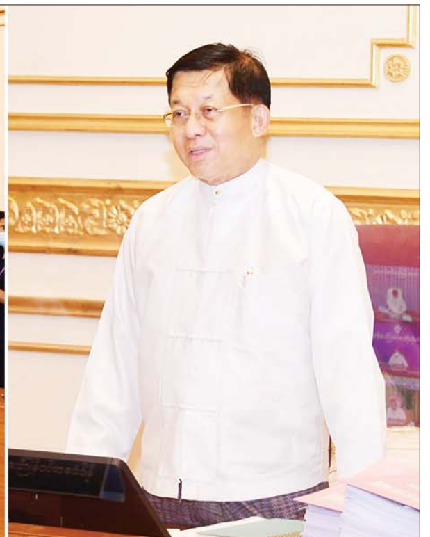
နိုင်ငံတော်စီမံအုပ်ချုပ်ရေးကောင်စီဥက္ကဋ္ဌ နိုင်ငံတော်ဝန်ကြီးချုပ် ဗိုလ်ချုပ်မှူးကြီးမင်းအောင်လှိုင် ပြည်ထောင်စုအစိုးရအဖွဲ့ အစည်းအဝေးအမှတ်စဉ် (၃/၂၀၂၂)တွင် အမှာစကားပြောကြားစဉ်။