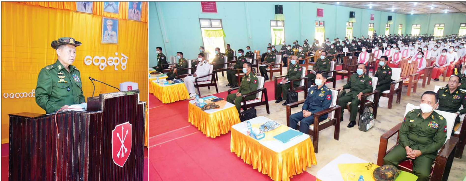
နိုင်ငံတော်စီမံအုပ်ချုပ်ရေးကောင်စီဒုတိယဥက္ကဋ္ဌ ဒုတိယတပ်မတော်ကာကွယ်ရေးဦးစီးချုပ် ကာကွယ်ရေးဦးစီးချုပ်(ကြည်း) ဒုတိယဗိုလ်ချုပ်မှူးကြီးစိုးဝင်း ပလောက်တပ်နယ်မှ အရာရှိ၊ စစ်သည် မိသားစုဝင်များအား တွေ့ဆုံအမှာစကားပြောကြားစဉ်။