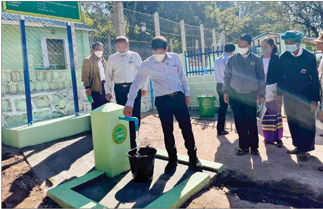
ကလောမြို့နယ် မြောက်မြေခြားကျေးရွာနှင့် တောင်ပတ်ကျေးရွာ စုပေါင်းရေရရှိရေးလုပ်ငန်း ဆောင်ရွက်စဉ်။

ယခုအခါ ခန့်ကိုယ်ပိုင်အုပ်ချုပ်ခွင့်ရဒေသ ပင်းတယမြို့နယ်အတွင်းရှိ နွေရာသီ ရေရှားပါးကျေးရွာများတွင် သောက်သုံးရေရရှိရေးအတွက် မြို့နယ်ကျေးလက်ဒေသ ဖွံ့ဖြိုးတိုးတက်ရေးဦးစီးဌာနက အင်းပက်လက်အပါအဝင် ကျေးရွာ ငါးရွာတွင် စုပေါင်းရေရရှိရေးလုပ်ငန်းများ အမြင့်တင်စနစ်ဖြင့် ဆောင်ရွက်ပေးခဲ့သည်။ နွေရာသီ ရေရှားပါးကျေးရွာဖြစ်သည့် အင်းပက်လက်၊ နန်ပလန်၊ သရက်ပြား၊ သစ်အယ်ပင်၊ ဘော်ဆုံ (ကလော) ကျေးရွာများတွင် လျှပ်စစ်ဓာတ်အားလှိုင်းသွယ်တန်းခြင်း၊ အမှတ်(၁)နှင့် အမှတ်(၂) စက်ရေတွင်းတူးဖော်ခြင်း၊ ရေစက်ရုံတည်ဆောက်ခြင်း၊ ရေစုကန် ဂါလန် ၂၀၀၀၀ ဆုံ တည်ဆောက်ခြင်း၊ ရေဖြန့်ဝေကန် ဂါလန် ၃၀၀၀၀ ဆုံ တည်ဆောက်ခြင်း၊ ကျေးရွာရေစုကန် ဂါလန် ၁၀၀၀၀ ဆုံနှင့် ဂါလန် ၅၀၀၀ ဆုံ ရေလှောင်ကန် တည်ဆောက်ခြင်း၊ ရေတင်ပိုက်လိုင်း တူးဖော်ခြင်း၊ ကျေးရွာချင်းဆက် ပိုက်လိုင်းများ တူးဖော်ခြင်းနှင့် ဆက်စပ်လုပ်ငန်းများ ဆောင်ရွက်ခြင်းလုပ်ငန်းများ၊ အိမ်တိုင်ရာရောက် ရေမီတာ တပ်ဆင်စနစ်ဖြင့်