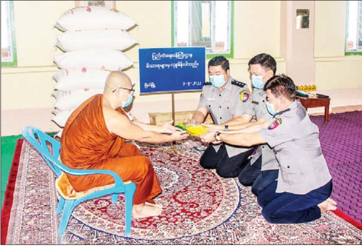
စာသင်တိုက်သို့လည်းကောင်း၊ ဧရာဝတီ တော်များအား ဆွမ်းဆန်တော်များ တိုင်းဒေသကြီး မြောင်းမြမြို့နယ်ရှိ သွားရောက်ဆက်ကပ် လှူဒါန်းခဲ့ကြ တိုက်သစ်ပဇ္ဇောတာရုံ ကျောင်းတိုက် ကြောင်း သိရသည်။ သတင်းစဉ်

ထိုသို့လှူဒါန်းလျက်ရှိရာ ယနေ့တွင် တနင်္သာရီတိုင်းဒေသကြီး မြိတ်မြို့နယ်ရှိ ရှေးဟောင်းမင်းကျောင်းပရိယတ္တိစာသင် တိုက်သို့လည်းကောင်း၊ ပဲခူးတိုင်းဒေသ ကြီး သနပ်ပင်မြို့နယ်ရှိ အနောမာရ်ကွင်း ကျောင်းတိုက်သို့လည်းကောင်း၊ ရခိုင် ပြည်နယ် ဘူးသီးတောင်မြို့နယ်ရှိ အေးစေတီကျောင်းတိုက်နှင့် မြေပုံမြို့နယ် ရှိ ပညာဗိမာန်ကျောင်းတိုက်တို့သို့ လည်းကောင်း၊ ရှမ်းပြည်နယ် လင်းခေး မြို့နယ်ရှိ နားကုန်းကျေးရွာပရိယတ္တိ