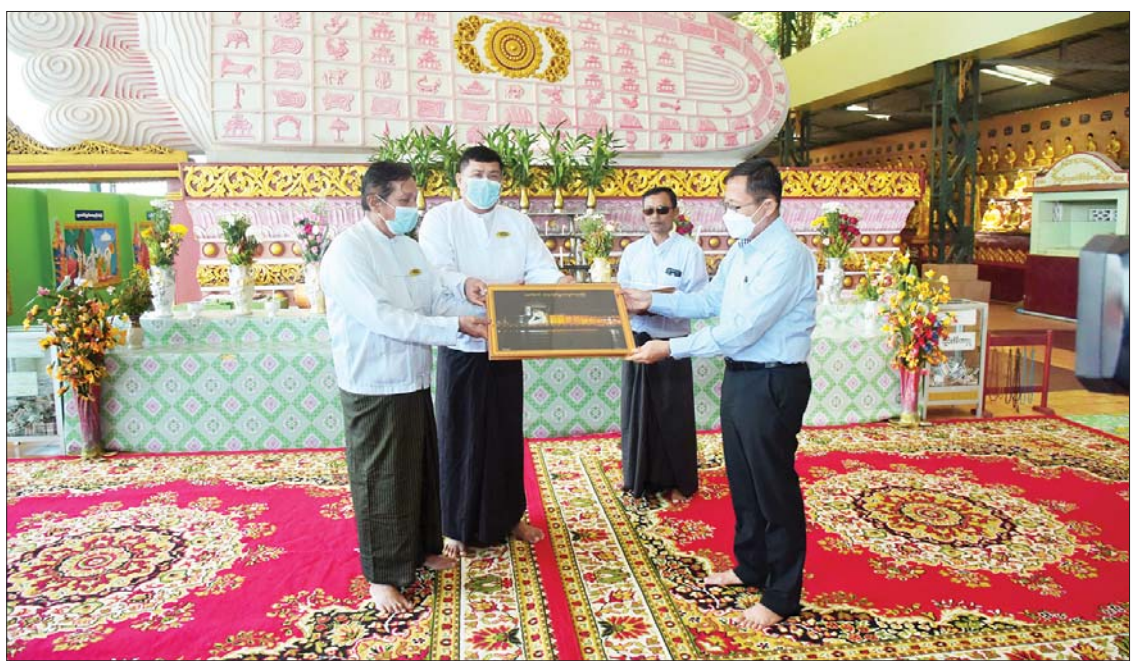
နိုင်ငံတော်စီမံအုပ်ချုပ်ရေးကောင်စီဒုတိယဥက္ကဋ္ဌ ဒုတိယတပ်မတော်ကာကွယ်ရေးဦးစီးချုပ် ကာကွယ်ရေးဦးစီးချုပ်(ကြည်း) ဒုတိယဗိုလ်ချုပ်မှူးကြီးစိုးဝင်း ပထက်တောင် အတုလရံသီ ရွှေသာလျောင်းဘုရားကြီး ဂေါပကအဖွဲ့ထံ အလှူငွေများ ပေးအပ် လှူဒါန်းရာ ဘုရားကြီး၏ပုံတော်အား ဓမ္မလက်ဆောင်အဖြစ် ပြန်လည်ပေးအပ်စဉ်။

သည့် ကန်များကို မော်တော်ယာဉ်များ ဖြင့် လိုက်လံကြည့်ရှုကြသည်။ အဆိုပါ (တန် ၁၀၀၀) အအေးခန်း စက်ရုံသည် မြိတ်မြို့အနီး ပထော်-ပထက် ကျွန်း၌ ရေထွက်ပစ္စည်းများအား တန်ဖိုး မြှင့်ထုတ်ကုန်အဖြစ် ပြည်ပနိုင်ငံများသို့ တင်ပို့ရောင်းချရန် ရရှိလာသည့် ရေထွက် ကုန်ကြမ်းပစ္စည်းများ လေလွင့်ဆုံးရှုံးမှု နည်းပါးစေရန်၊ နိုင်ငံတော်၏ နိုင်ငံခြား ဝင်ငွေရရှိမှု ပိုမိုတိုးတက်လာစေရန်၊ ဒေသတွင်း အလုပ်အကိုင် အခွင့်အလမ်း များ ပိုမိုတိုးတက်ရရှိလာစေရန်၊ လူသား အရင်းအမြစ်များ ပိုမိုဖွံ့ဖြိုးတိုးတက်လာစေ ရန်၊ နိုင်ငံတော်သို့ အခွန်ငွေများကို တစ်နှစ် ထက်တစ်နှစ် ပိုမိုပေးသွင်းထမ်းဆောင်