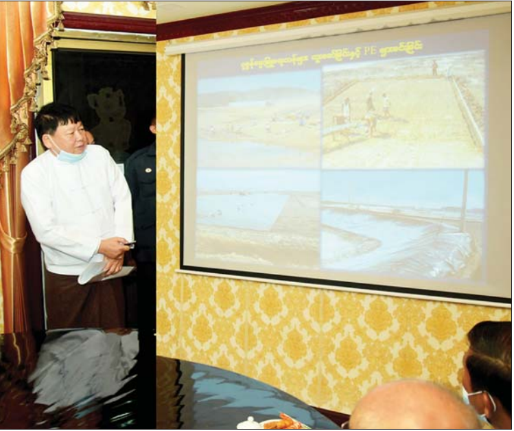
နိုင်ငံတော်စီမံအုပ်ချုပ်ရေးကောင်စီဒုတိယဥက္ကဋ္ဌ ဒုတိယတပ်မတော်ကာကွယ်ရေးဦးစီးချုပ် ကာကွယ်ရေးဦးစီးချုပ်(ကြည်း) ဒုတိယဗိုလ်ချုပ်မှူးကြီးစိုးဝင်းနှင့် အဖွဲ့ ဝင်များအား ပြည့်ဖြိုးထွန်း အင်တာနေရှင်နယ်ကုမ္ပဏီလီမိတက် ငါး၊ ပုစွန်(တန် ၁၀၀၀) အအေးခန်းစက်ရုံ ဧည့်ခန်းမဆောင်၌ တာဝန်ရှိသူများက ရှင်းလင်းတင်ပြစဉ်။

ဖူးမြော်ကြည့်ပါ ယင်းနောက် နိုင်ငံတော်စီမံအုပ်ချုပ် ရေးကောင်စီဒုတိယဥက္ကဋ္ဌ ဒုတိယ တပ်မတော်ကာကွယ်ရေး ဦးစီးချုပ် ကာကွယ်ရေးဦးစီးချုပ်(ကြည်း)နှင့် အဖွဲ့ ဝင်များသည် ပထက်တောင် အတုလရံသီ ရွှေသာလျောင်းဘုရားကြီးအား ပန်း၊ ရေချမ်းနှင့် ဆီမီးများ ကပ်လှူပူဇော် ဖူးမြော်ကြည့်ပါအလှူငွေများ ပေးအပ်လှူဒါန်းရာ ဘုရားဂေါပကအဖွဲ့ဝင် များက လက်ခံရယူကြပြီး ဘုရားကြီး၏ ပုံတော်အား ဓမ္မလက်ဆောင်အဖြစ် ပြန်လည်ပေးအပ်သည်။ ထို့နောက် နိုင်ငံတော်စီမံအုပ်ချုပ်ရေး ကောင်စီ ဒုတိယဥက္ကဋ္ဌ ဒုတိယတပ်မတော်ကာကွယ် ရေးဦးစီးချုပ် ကာကွယ်ရေးဦးစီးချုပ် (ကြည်း)သည် ဘုရားကြီး ဧည့်သည်တော် မှတ်တမ်းစာအုပ်တွင် လက်မှတ်ရေးထိုး ခဲ့ကြောင်း သိရသည်။ သတင်းစဉ်