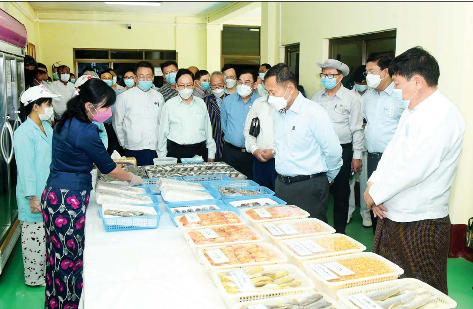
နိုင်ငံတော်စီမံအုပ်ချုပ်ရေးကောင်စီဒုတိယဥက္ကဋ္ဌ ဒုတိယတပ်မတော်ကာကွယ်ရေးဦးစီးချုပ် ကာကွယ်ရေးဦးစီးချုပ်(ကြည်း) ဒုတိယဗိုလ်ချုပ်မှူးကြီးစိုးဝင်းနှင့် အဖွဲ့ဝင်များ ကျွန်းစုမြို့နယ်ရှိ ပြည်ဖြိုးထွန်း အင်တာနေရှင်နယ် ကုမ္ပဏီလီမိတက် ငါး၊ ပုစွန်(တန် ၁၀၀၀) အအေးခန်းစက်ရုံတွင် ခင်းကျင်းပြထားသည့် ငါး၊ ပုစွန်များ ထုပ်ပိုးထားမှုအဆင့်ဆင့်ကို ကြည့်ရှုကြစဉ်။

နေပြည်တော် မေ ၃ နိုင်ငံတော်စီမံအုပ်ချုပ်ရေးကောင်စီ ဒုတိယဥက္ကဋ္ဌ ဒုတိယတပ်မတော် ကာကွယ်ရေးဦးစီးချုပ် ကာကွယ်ရေး ဦးစီးချုပ်(ကြည်း) ဒုတိယဗိုလ်ချုပ်မှူးကြီး စိုးဝင်းသည် နိုင်ငံတော်စီမံအုပ်ချုပ်ရေး ကောင်စီအဖွဲ့ဝင်များ ဖြစ်ကြသည့် ဦးမောင်းဟာ၊ စောဒန်နီယယ်၊ ဒေါက်တာ ဗညားအောင်မိုး၊ တနင်္သာရီတိုင်းဒေသကြီး ဝန်ကြီးချုပ် ဦးမြတ်ကို၊ ကာကွယ်ရေး ဦးစီးချုပ်(ရေ) ဗိုလ်ချုပ်ကြီးမိုးအောင်၊ ကာကွယ်ရေးဦးစီးချုပ်ရုံး (ကြည်း)မှ ဒုတိယဗိုလ်ချုပ်ကြီး အောင်စိုး၊ ကာကွယ် ရေးဦးစီးချုပ်ရုံးမှ တပ်မတော်အရာရှိကြီး များ၊ ကမ်းရိုးတန်းဒေသ တိုင်းစစ်ဌာနချုပ် တိုင်းမှူး၊ ဒုတိယဝန်ကြီးများ၊ တာဝန်ရှိ သူများလိုက်ပါ၍ ယနေ့နံနက်ပိုင်းတွင် ကျွန်းစုမြို့နယ်ရှိ ပြည်ဖြိုးထွန်း အင်တာ နေရှင်နယ် ကုမ္ပဏီလီမိတက် ငါး၊ ပုစွန် တန်(၁၀၀၀) အအေးခန်းစက်ရုံကို သွားရောက်ကြည့်ရှုသည်။