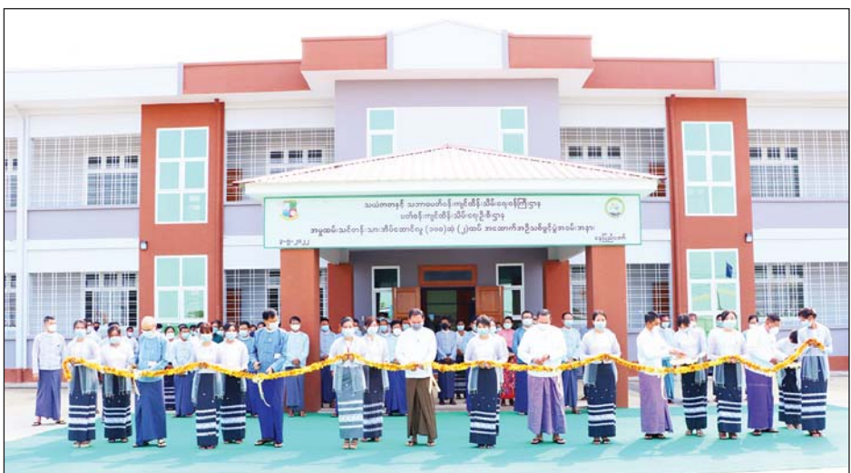
မည့်အစီအစဉ်၊ ကျောက်စီ လိုအပ်သည်များ မှာကြားသည်။ ၃၆၇၂ ပင်ကို လူထုလှုပ်ရှားမှုဖြင့် နန်းထိန်းတံဆိပ် ဆောင်ရွက်မည့် အဆိုပါ မြေနေရာတွင် အမြင့် စိုက်ပျိုးသွားမည့် ဖြစ်ကြောင်း နှစ်ပေနှင့်အထက် သစ်တောပင်၊ သိရသည်။ ရာ ပြည်ထောင်စုဝန်ကြီးက အရိပ်ရပင်၊ ဝါးပင် စုစုပေါင်း သတင်းစဉ်

လူ့စွမ်းအားအရင်းအမြစ် ဖွံ့ဖြိုး တိုးတက်စေရေးနှင့် ပတ်ဝန်းကျင် ထိန်းသိမ်းရေး ဘာသာရပ် ကျွမ်းကျင်သူများ မွေးထုတ်ပေး နိုင်ရေးအတွက် ရည်ရွယ် တည်ဆောက်ခြင်းဖြစ်သည်။ ဆက်လက်၍ ပြည်ထောင်စု ဝန်ကြီး ဦးခင်မောင်ရီသည် လယ်ဝေးမြို့နယ် ရန်အောင်မြေ ကြိုးဝိုင်း အကွက်အမှတ်(၁၃)ရှိ ၂၀၂၂ ခုနှစ် လူထုလှုပ်ရှားမှုဖြင့် သစ်ပင်စိုက်ပျိုးမည့် မြေနေရာ ၆ ဒသမ ၈ ဧကကို ကြည့်ရှုစစ်ဆေး ရာ သစ်တောဦးစီးဌာန ညွှန်ကြား ရေးမှူးချုပ်နှင့် တာဝန်ရှိသူများ က အကွက်အလိုက်၊ လိုင်းအလိုက် ပန္နက်စိုက်ထူပြီးစီးမှု၊ ကွန်တို ကန်သင်းအလိုက် သရုပ်ပြစိုက်ပျိုး