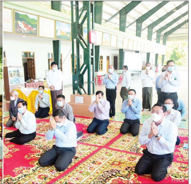
နိုင်ငံတော်စီမံအုပ်ချုပ်ရေးကောင်စီဒုတိယဥက္ကဋ္ဌ ဒုတိယတပ်မတော်ကာကွယ်ရေးဦးစီးချုပ် ကာကွယ်ရေးဦးစီးချုပ်(ကြည်း) ဒုတိယဗိုလ်ချုပ်မှူးကြီးစိုးဝင်းနှင့် အဖွဲ့ဝင်များ ပထက်တောင် အတုလရံသီ ရွှေသာလျောင်းဘုရားကြီးအား ပန်း၊ ရေချမ်းနှင့် ဆီမီးများ ကပ်လှူပူဇော် ဖူးမြော်ကြည့်ပါစဉ်။

သည့် ကန်များကို မော်တော်ယာဉ်များ ဖြင့် လိုက်လံကြည့်ရှုကြသည်။ အဆိုပါ (တန် ၁၀၀၀) အအေးခန်း စက်ရုံသည် မြိတ်မြို့အနီး ပထော်-ပထက် ကျွန်း၌ ရေထွက်ပစ္စည်းများအား တန်ဖိုး မြှင့်ထုတ်ကုန်အဖြစ် ပြည်ပနိုင်ငံများသို့ တင်ပို့ရောင်းချရန် ရရှိလာသည့် ရေထွက် ကုန်ကြမ်းပစ္စည်းများ လေလွင့်ဆုံးရှုံးမှု နည်းပါးစေရန်၊ နိုင်ငံတော်၏ နိုင်ငံခြား ဝင်ငွေရရှိမှု ပိုမိုတိုးတက်လာစေရန်၊ ဒေသတွင်း အလုပ်အကိုင် အခွင့်အလမ်း များ ပိုမိုတိုးတက်ရရှိလာစေရန်၊ လူသား အရင်းအမြစ်များ ပိုမိုဖွံ့ဖြိုးတိုးတက်လာစေ ရန်၊ နိုင်ငံတော်သို့ အခွန်ငွေများကို တစ်နှစ် ထက်တစ်နှစ် ပိုမိုပေးသွင်းထမ်းဆောင်