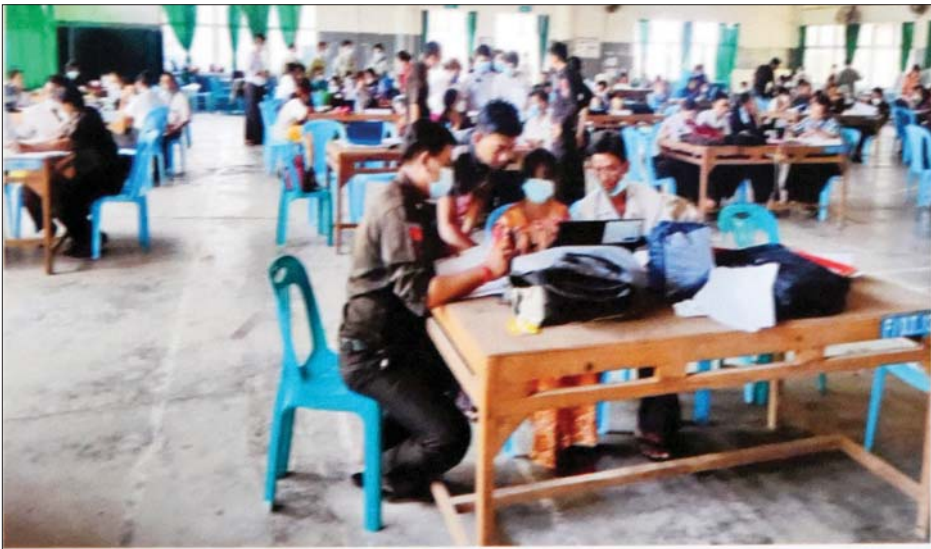
အခြေခံမဲဆန္ဒရှင်စာရင်းများ ပြည့်စုံမှန်ကန်ရေး ပြည်ထောင်စုရွေးကောက်ပွဲကော်မရှင်အဖွဲ့ဝင်များ ကွင်းဆင်းကြပ်မတ်ဆောင်ရွက်ခြင်း (ရန်ကုန်တိုင်းဒေသကြီး)

ဗိုလ်ချုပ်ဇော်မင်းထွန်းက ဥပဒေနှင့်အညီမည်သို့ လျှောက်ရမည်ကို လုပ်ထုံးလုပ်နည်းရှိပြီးဖြစ်ကြောင်း၊ ဥပမာပြောရမည်ဆိုပါက တချို့အရာများသည် မလွတ်မကင်းဖြစ်မည်ဖြစ်ကြောင်း၊ ဘိန်းထုပ်နှင့်