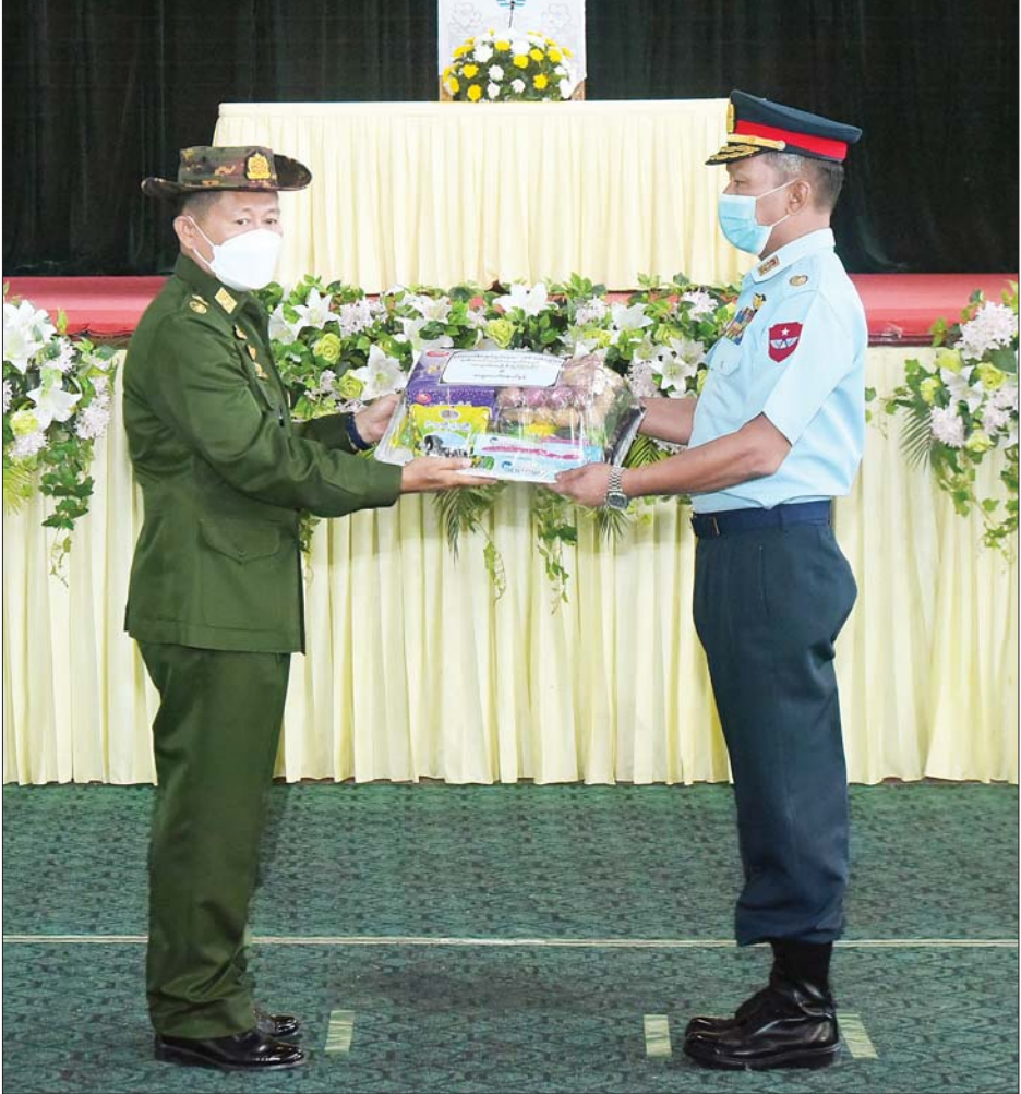
နိုင်ငံတော်စီမံအုပ်ချုပ်ရေးကောင်စီဒုတိယဥက္ကဋ္ဌ ဒုတိယတပ်မတော်ကာကွယ်ရေးဦးစီးချုပ် ကာကွယ်ရေးဦးစီးချုပ်(ကြည်း) ဒုတိယဗိုလ်ချုပ်မှူးကြီးစိုးဝင်း မြတ်တပ်နယ်မှ အရာရှိ စစ်သည် မိသားစုများအတွက် စားသောက်ဖွယ်ရာများပေးအပ်ရာ တာဝန်ရှိသူတစ်ဦးက လက်ခံရယူစဉ်။

ထို့ပြင် နိုင်ငံတော်စီမံအုပ်ချုပ်ရေးကောင်စီ ဒုတိယဥက္ကဋ္ဌ ဒုတိယတပ်မတော် ကာကွယ်ရေးဦးစီးချုပ် ကာကွယ်ရေးဦးစီးချုပ်(ကြည်း)နှင့် အဖွဲ့ဝင်များသည် ပလောက်တပ်နယ် နယ်မြေခံသင်တန်းကျောင်းရှိ ဘက်စုံစိုက်ပျိုးမွေးမြူရေးစခန်းအတွင်း ဥစားကြက်၊ အသားတိုးကြက်၊ DYLဝက်နှင့် နို့စားနွားမွေးမြူထားရှိမှု၊ ရာသီသီးနှံများ စိုက်ပျိုးမွေးမြူထားရှိမှုများအား ကြည့်ရှုစစ်ဆေးခဲ့ကြောင်း သိရသည်။ သတင်းစဉ်