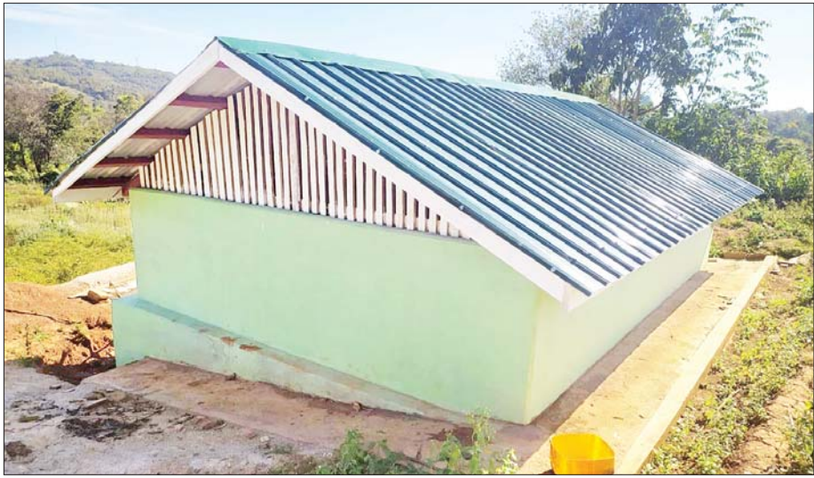
ပင်လောင်းမြို့နယ် နန်းပန်းညောင်ပင်ကျေးရွာ၌ ဂါလန် ၅၀၀၀ ဆုံ ရေလှောင်ကန် ဆောင်ရွက်ထားမှုကို တွေ့ရစဉ်။