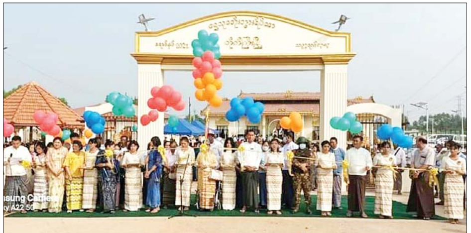
ဘိုးဘွားရိပ်သာလည်ပတ်နိုင်ရေးအတွက် ငွေကျပ် ဦးနှင့် အဘွား ၂၀ စတင်လက်ခံထားရှိသွားမည် ၁၀ သိန်းဖြင့် ငွေပဒေသာပင်စိုက်ထူကာ အဘိုး ၁၀ ဖြစ်ကြောင်း သိရသည်။ ဉာဏ်ဟိန်း

ထို့နောက် ရွှေသုခဘိုးဘွားရိပ်သာသစ်နှင့် သက်ဆိုင်သော စာရွက်စာတမ်းများကို အလှူရှင် များက တာဝန်ရှိသူများထံသို့ လွှဲပြောင်းပေးအပ်ခဲ့ပြီး