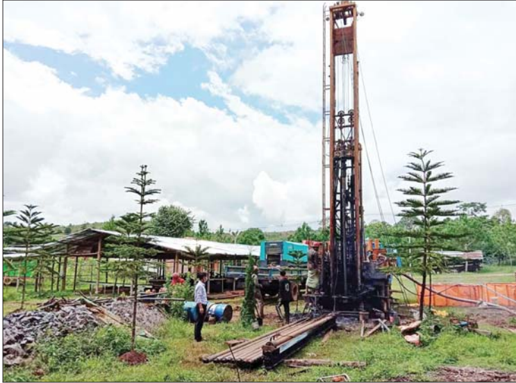
ပင်းတယမြို့နယ် ကျေးရွာ ငါးရွာအတွက် ရေရရှိရေးလုပ်ငန်း ဆောင်ရွက်နေမှုကို တွေ့ရစဉ်။

ပင်လောင်းမြို့နယ်၌ ရေရရှိရေး လုပ်ငန်းများ ဆောင်ရွက်မှု နွေရာသီ ရေရှားပါးကျေးရွာများ ဖြစ်သည့် ပင်လောင်းမြို့နယ်ရှိ ဝါးလီကျေးရွာအပါအဝင် ကျေးရွာ ၁၀ ရွာ၊ ပင်းတယမြို့နယ်ရှိ ကျေးရွာ လေးရွာနှင့် ကလောမြို့နယ်ရှိ ကျေးရွာ သုံးရွာတို့တွင် ရေပေးရေးလုပ်ငန်းများ ဆောင်ရွက်ပေးနိုင်ခဲ့သည်မှာ အောင်မြင်မှု မှတ်တိုင်တစ်ခု ဖြစ်ခဲ့သည်။