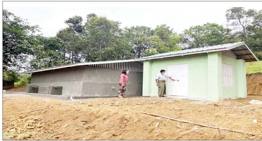
ကလောမြို့နယ် မြောက်မြေခြားကျေးရွာနှင့် တောင်ပတ်ကျေးရွာ ရေရရှိရေးလုပ်ငန်း ဆောင်ရွက် ထားမှုကို တွေ့ရစဉ်။

နန်းပလန် ကျေးရွာသည်လည်း ကိုယ်ပိုင်မိုးရေလှောင်ကန်ဖြင့်သာ သုံးစွဲခဲ့ရပြီး နွေရာသီကာလတွင် ရေလုံလောက်မှုမရှိသောကြောင့် တစ်မိုင် သုံးဖာလုံခန့် ကွာဝေးသော ကလောမြို့နယ်အတွင်းရှိ ချယ်ရီမြိုင်တောရကျောင်းအတွင်းရှိ စက်ရေတွင်းမှ အလှည့်ကျသွားရောက် ခပ်ယူသုံးစွဲခဲ့ရသည်။ စာမျက်နှာ ၁၇ သို့ *