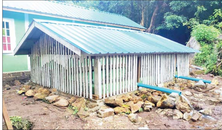
ပင်လောင်းမြို့နယ် ကျေးရွာ ၁၀ ရွာအတွက် ရေစစ်ကန်ဆောင်ရွက်ထားမှုကို တွေ့ရစဉ်။

ဝယ်ယူသုံးစွဲခဲ့ကြရသည်။ ထို့အတူ ဘန်ဘာကျေးရွာအုပ်စုအတွင်းရှိ ဘူးဝါးကျေးရွာသည် ခေတ်အဆက်ဆက် ကိုယ်ပိုင် မိုးရေလှောင်ကန်များဖြင့်သာ သုံးစွဲခဲ့ကြပြီး နွေရာသီကာလများတွင် သောက်သုံးရေ ဝယ်ယူသုံးစွဲခဲ့ကြရသည်။