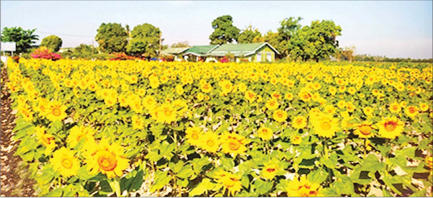
အောင်မြင်ဖြစ်ထွန်းနေသော နေကြာစိုက်ခင်း။

မြန်မာနိုင်ငံ၏ ရေ၊ မြေ၊ ရာသီဥတုအခြေအနေ အရ နေရာဒေသအများစုတွင် နေကြာသီးနှံ စိုက်ပျိုး ဖြစ်ထွန်းနိုင်ကြောင်း တွေ့ရှိရပါသည်။ နေကြာ သီးနှံသည် အခြားဆီထွက်သီးနှံများနှင့် နှိုင်းယှဉ် ကြည့်ပါက စိုက်ပျိုးရလွယ်ကူပြီး စိုက်ပျိုးသည့် ကုန်ကျစရိတ် သက်သာသည့်အပြင် တစ်ယူနစ် ဧရိယာမှထွက်ရှိသည့် ဆီထွက်နှုန်းပိုမိုရရှိမှု သေချာ သည့် သီးနှံဖြစ်ပါသည်။ စိုက်ပျိုးသူတောင်သူများ အကျိုးအမြတ် ရရှိနိုင်သည့် သီးနှံဖြစ်သလို ပြည်တွင်း စားသုံးဆီဖူလုံရေး၊ စိုက်ပျိုးသူတောင်သူ များ ဝင်ငွေတိုးတက်ရရှိရေး၊ အစားအစာဘေးကင်း လုံခြုံရေးတို့ကို ရှေးရှု၍ နေကြာသီးနှံကို လက်ရှိ စိုက်ပျိုးနေသည့် ဧရိယာထက် ပိုမိုတိုးချဲ့စိုက်ပျိုး သင့်ပါသည်။