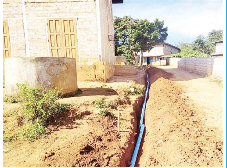
ပင်လောင်းမြို့နယ် ဝါးလီကျေးရွာ၌ နှစ်လက်မ PVC ရေဖြန့်ဝေပိုက်လိုင်း သွယ်တန်းခြင်းလုပ်ငန်း ဆောင်ရွက်နေမှုကို တွေ့ရစဉ်။

ယခုအခါ ပင်လောင်းမြို့နယ် အတွင်းရှိ နွေရာသီရေရှားပါးကျေးရွာများတွင် သောက်သုံးရေရရှိရေးအတွက် ရှမ်းပြည်နယ်(တောင်ပိုင်း) ကျေးလက်ဒေသ ဖွံ့ဖြိုးတိုးတက်ရေးဦးစီးဌာန ကြီးကြပ်မှုဖြင့် အလျား ရှစ်ပေ၊ အနံ ၂၄ ပေ၊ အမြင့် ရှစ်ပေ ရှိသည့် ငါးခန်းတွဲ ရေစက်ရုံ