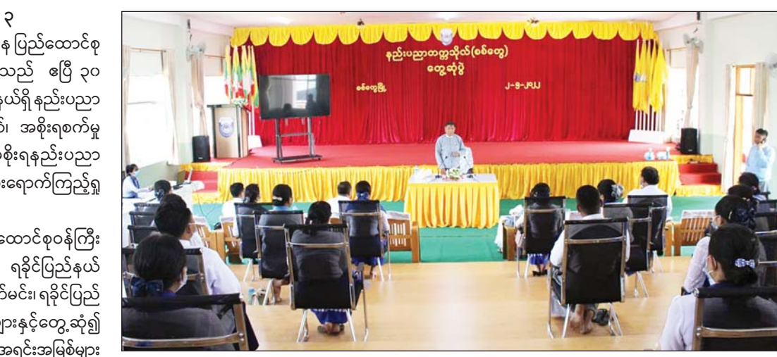
ဧပြီ ၃၀ ရက်တွင် ပြည်ထောင်စုဝန်ကြီးသည် အစိုးရစက်မှုလက်မှုသိပ္ပံ(သံတွဲ)သို့ ရောက်ရှိပြီး ကျောင်းအုပ်ကြီး၊ ဌာနမှူးများ၊ ဆရာ ဆရာမများနှင့် တွေ့ဆုံကာ စီမံခန့်ခွဲရေးဆိုင်ရာကိစ္စ၊ အရည်အသွေး ပြည့်ဝသော သင်ကြားသင်ယူမှုဆိုင်ရာကိစ္စ၊ ကျောင်း များ ပြန်လည်ဖွင့်လှစ်ရာတွင် အဆင်သင့်ဖြစ်စေနိုင် ရေးအတွက် ကြိုတင်ပြင်ဆင်ဆောင်ရွက်ထားရှိ သည့် အခြေအနေများ၊ ကျောင်းဥပမိရုပ်ကောင်းမွန် စေရေးနှင့် သန့်ရှင်းသာယာလှပစေရေးတို့ကို မှာကြားသည်။ ထို့နောက် ကျောင်းအုပ်ကြီးက ကျောင်းဆိုင်ရာကိစ္စရပ်များကို ရှင်းလင်းတင်ပြရာ ပြည်ထောင်စုဝန်ကြီးက လိုအပ်သည်များကို လမ်းညွှန်မှာကြားခဲ့သည်။ ရှင်းလင်းဆွေးနွေး ဆက်လက်၍ ပြည်ထောင်စုဝန်ကြီးသည် မေ ၁ ရက်နှင့် ၂ ရက်တို့တွင် စစ်တွေမြို့ နည်းပညာ တက္ကသိုလ်(စစ်တွေ)၊ ကွန်ပျူတာတက္ကသိုလ် (စစ်တွေ)နှင့် အစိုးရနည်းပညာ အထက်တန်းကျောင်း (စစ်တွေ)သို့လည်းကောင်း၊ မေ ၃ ရက်တွင် ကျောက်ဖြူမြို့ အစိုးရစက်မှုလက်မှုသိပ္ပံ

နေပြည်တော် မေ ၃ သိပ္ပံနှင့် နည်းပညာဝန်ကြီးဌာန ပြည်ထောင်စု ဝန်ကြီး ဒေါက်တာမျိုးသိန်းကျော်သည် ဧပြီ ၃၀ ရက်မှ မေ ၃ ရက်အတွင်း ရခိုင်ပြည်နယ်ရှိ နည်းပညာ တက္ကသိုလ်၊ ကွန်ပျူတာတက္ကသိုလ်၊ အစိုးရစက်မှု လက်မှုသိပ္ပံကျောင်းများနှင့် အစိုးရနည်းပညာ အထက်တန်းကျောင်းများသို့ သွားရောက်ကြည့်ရှု စစ်ဆေးသည်။ ခရီးစဉ်အတွင်း ပြည်ထောင်စုဝန်ကြီး ဒေါက်တာမျိုးသိန်းကျော်သည် ရခိုင်ပြည်နယ် ဝန်ကြီးချုပ် ဒေါက်တာအောင်ကျော်မင်း၊ ရခိုင်ပြည် နယ် ဝန်ကြီးများ၊ တာဝန်ရှိသူများနှင့်တွေ့ဆုံ၍ ရခိုင်ပြည်နယ်အတွင်း လူ့စွမ်းအားအရင်းအမြစ်များ ဖွံ့ဖြိုးတိုးတက်ရေးအတွက် နည်းပညာတက္ကသိုလ် (စစ်တွေ)၊ ကွန်ပျူတာတက္ကသိုလ်(စစ်တွေ)၊ အစိုးရ စက်မှုလက်မှုသိပ္ပံ (သံတွဲ)၊ ကျောက်ဖြူနှင့် အစိုးရ နည်းပညာ အထက်တန်းကျောင်း (စစ်တွေ) တို့တွင် သင်တန်းများ သင်ကြားပို့ချပေးနေမှုများကို ရှင်းလင်း ဆွေးနွေးပြီး ရခိုင်ပြည်နယ် ဝန်ကြီးချုပ် ဒေါက်တာ အောင်ကျော်မင်းနှင့် တာဝန်ရှိသူများက ဒေသ အကျိုးပြုလုပ်ငန်းများ၊ စီမံကိန်းဆိုင်ရာကိစ္စရပ်များ ကို ကူညီပူးပေါင်းဆောင်ရွက်မည့် အခြေအနေများ ကို ဆွေးနွေးခဲ့ကြသည်။