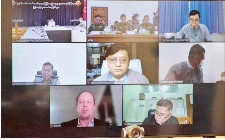
တားဆီးထိန်းသိမ်းရေးလုပ်ငန်းများနှင့် ပတ်သက် ကိစ္စရပ်များကို ဆွေးနွေးညှိနှိုင်းခဲ့ကြောင်း သိရ ၍ နှစ်ဦးနှစ်ဖက် ပူးပေါင်းဆောင်ရွက်ရေးဆိုင်ရာ သတင်းစဉ်