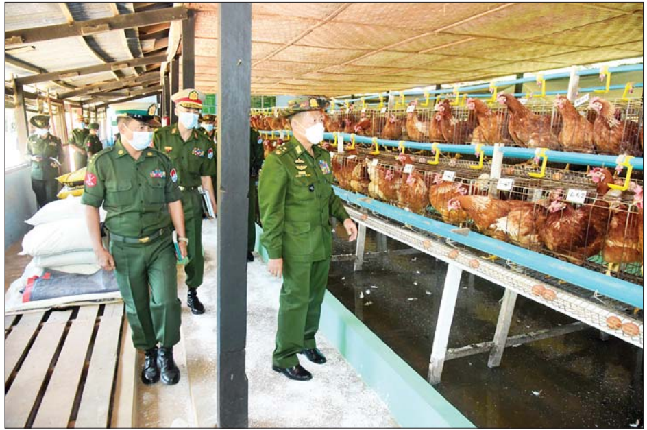
နိုင်ငံတော်စီမံအုပ်ချုပ်ရေးကောင်စီဒုတိယဥက္ကဋ္ဌ ဒုတိယတပ်မတော်ကာကွယ်ရေးဦးစီးချုပ် ကာကွယ်ရေးဦးစီးချုပ်(ကြည်း) ဒုတိယဗိုလ်ချုပ်မှူးကြီးစိုးဝင်း ပလောက်တပ်နယ် နယ်မြေခံသင်တန်းကျောင်းရှိ ဘက်စုံမွေးမြူရေးစခန်း၌ မွေးမြူထားရှိမှုများအား ကြည့်ရှုစစ်ဆေးစဉ်။