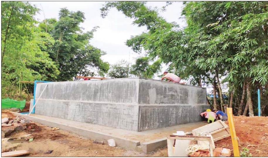
ပင်းတယမြို့နယ် ကျေးရွာငါးရွာအတွက် ဂါလန် ၁၀၀၀၀ ဆုံ ရေစုကန် ဆောင်ရွက်ထားမှုကို တွေ့ရစဉ်။

ကျေးလက်ဒေသ ဖွံ့ဖြိုးတိုးတက်ရေးဦးစီးဌာနအနေဖြင့် ဘဏ္ဍာရေးနှစ်အတွင်းမှာပင် စုပေါင်းကျေးရွာရေရရှိရေးလုပ်ငန်းများ ဆောင်ရွက်ပေးမှုကြောင့် နွေရာသီရေရှားပါးကျေးရွာများဖြစ်သည့် ပင်လောင်းမြို့နယ်အတွင်းရှိ ကျေးရွာ ၁၀ ရွာ၊ ပင်းတယမြို့နယ်အတွင်းရှိ ကျေးရွာ လေးရွာ၊ ကလောမြို့နယ်အတွင်းရှိ ကျေးရွာ သုံးရွာနှင့် ဖယ်ခုံမြို့နယ်အတွင်းရှိ ကျေးရွာ ၂၀ တို့မှ ဒေသခံပြည်သူများ အတွက် ရာသီမရွေးသောက်သုံးရေ လိုအပ်ချက်ကို ဖြည့်တင်းပေးနိုင်ခဲ့ကြောင်း တင်ပြလိုက်ရပါသည်။ ။