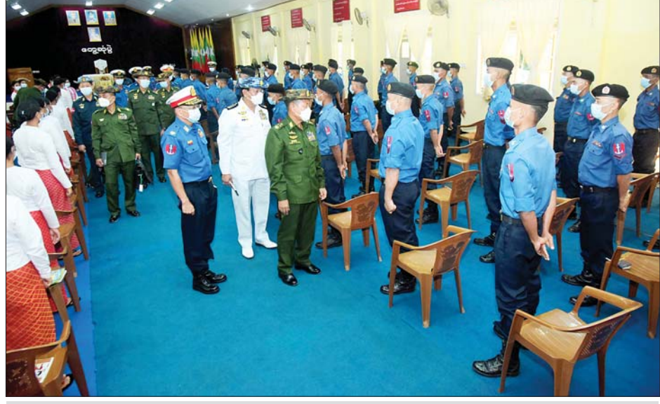
နိုင်ငံတော်စီမံအုပ်ချုပ်ရေးကောင်စီဒုတိယဥက္ကဋ္ဌ ဒုတိယတပ်မတော်ကာကွယ်ရေးဦးစီးချုပ် ကာကွယ်ရေးဦးစီးချုပ်(ကြည်း) ဒုတိယဗိုလ်ချုပ်မှူးကြီးစိုးဝင်း ဟိန်းဇဲတပ်နယ်မှ အရာရှိ၊ စစ်သည် မိသားစုဝင်များအား ရင်းရင်းနှီးနှီး လိုက်လံနှုတ်ဆက်စဉ်။