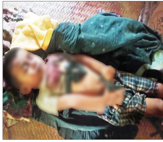
စစ်ကြောင်းများနှင့်ပူးပေါင်း၍ လုံခြုံရေးလုပ်ငန်းစဉ်များနှင့်အညီ ဆက်လက်ဆောင်ရွက်လျက်ရှိကြောင်း သိရသည်။ သတင်းစဉ်