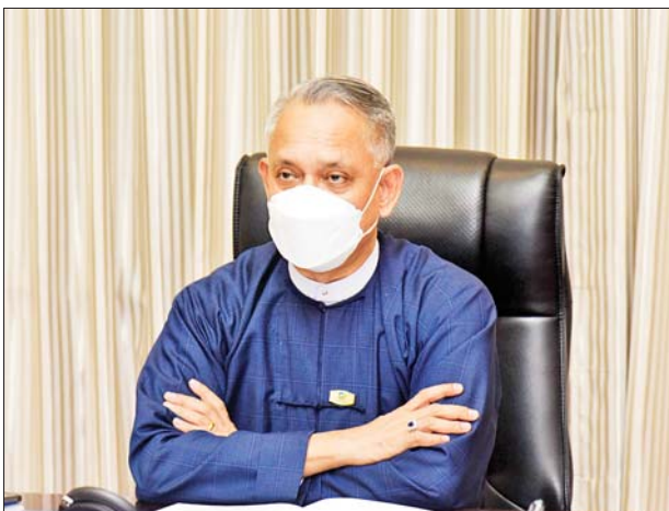
ပြည်ထောင်စုဝန်ကြီး ဦးအောင်နိုင်ဦး နိုင်ငံခြားသတင်းဌာနများမှ သတင်းထောက်များ၏ မေးမြန်းမှုများကို ဖြေကြားစဉ်။

သို့သော်လည်း ကိုဗစ်-၁၉ ရောဂါကို ယခုအချိန်တွင် ထိန်းချုပ်နိုင်သည့် အနေအထားရောက်ရှိသည့်အတွက် ပြန်လည်ဖွင့်လှစ်နိုင်သည့်