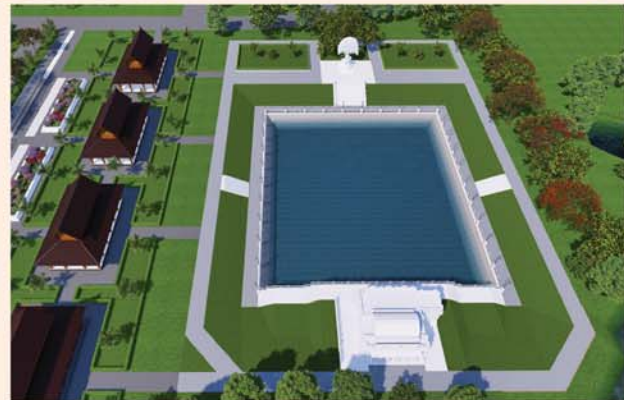
မုစလိန္နုတိုင်

၁။ နိုင်ငံတော်စီမံအုပ်ချုပ်ရေးကောင်စီဥက္ကဋ္ဌ၊ တပ်မတော်ကာကွယ်ရေးဦးစီးချုပ် ဗိုလ်ချုပ်မှူးကြီးမင်းအောင်လှိုင် ဦးဆောင်သည့် (၇)ရက်သား၊ သမီး၊ ဘုရားဒါယကာ၊ ဒါယိကာမတို့က မာရဝိဇယပုဒ္ဒရုပ်ပွားတော်မြတ်ကြီးအား မြန်မာနိုင်ငံတွင် ထေရဝါဒပုဒ္ဓသာသနာတော်ထွန်းလင်းတောက်ပလျက်ရှိသည်ကို ကမ္ဘာကိုပြသရန်၊ တိုင်းပြည်အေးချမ်းသာယာမှုရှိစေရန်၊ ရုပ်ပွားတော် မြတ်ကြီးအား ပြည်တွင်း၊ ပြည်ပဘုရားဖူးများလာရောက်ခြင်းဖြင့် ဒေသတိုးတက်စည်ကားမှုကို အထောက်အကူဖြစ်စေရန်၊ နိုင်ငံတော်ဖွံ့ဖြိုးတိုးတက်မှုအား အထောက်အကူဖြစ်စေရန် ရည်သန်လျက် ပြည်ထောင်စုနယ်မြေ နေပြည်တော်၊ ဒက္ခိဏသီရိမြို့နယ်အတွင်း၌ သာသနာတော်ထုံး၊ ရုပ်ပွားဆင်းတုတော်ထုံး၊ မြန်မာ့ရိုးရာတည်ထုံးများနှင့်အညီ တည်ဆောက်ပူဇော်လျက် ရှိပါသည်။