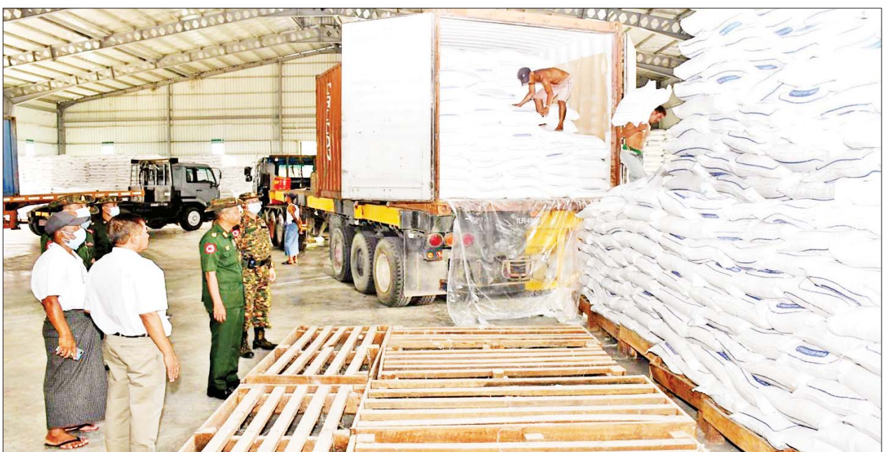
မင်္ဂလာတောင်ညွန့်မြို့နယ်ရှိ သိုလှောင်ရုံအတွင်း အိန္ဒိယအစိုးရကလှူဒါန်းသော ဆန်နှင့်ဂျုံတို့ကို စနစ်တကျထားရှိ၍ ပြည်သူများ လက်ဝယ်အရောက် ဖြန့်ဖြူးပေးနိုင်ရေးအတွက် ဆောင်ရွက်နေမှုကို တွေ့ရစဉ်။