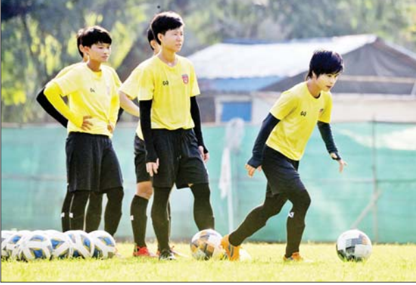
မြန်မာ့လက်ရွေးစင် အမျိုးသမီးအသင်း လေ့ကျင့်နေစဉ်။