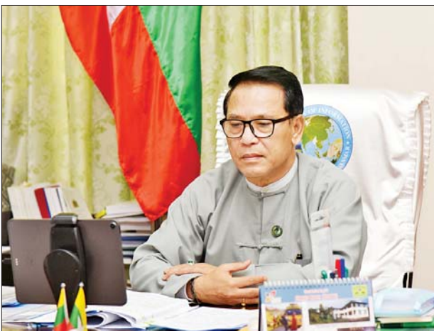
ပြည်ထောင်စုဝန်ကြီး ဦးမောင်မောင်အုန်း နိုင်ငံခြားသတင်းဌာနများမှ သတင်းထောက်များ၏ မေးမြန်းမှုများကို ဖြေကြားစဉ်။

မိမိတို့နိုင်ငံ တည်ငြိမ်အေးချမ်းမှုရရှိအောင် ယနေ့အချိန်တွင် စွမ်းအင်လိုအပ်မှုပြဿနာကို ဖြေရှင်းပေးရန်လိုအပ်လာပါကြောင်း၊ တစ်ချိန်တည်းမှာပင် မြန်မာနိုင်ငံအပေါ် စီးပွားရေးပိတ်ဆို့မှုအသစ်များ မကြာမီက ထုတ်ပြန်ခဲ့ကြပါကြောင်း၊ နိုင်ငံခြား ရေနံနှင့် သဘာဝဓာတ်ငွေ့ ကုမ္ပဏီအချို့ မြန်မာပြည်မှ ထွက်ခွာမှုများကို မီဒီယာတော်တော်များများ