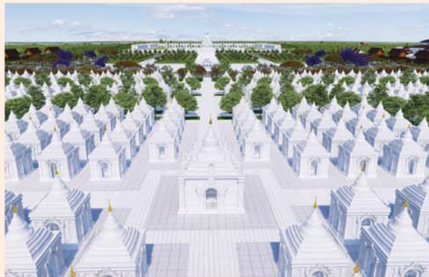
ကျောက်စာရုံစေတီ(၁၂ x ၁၂x ၁၈)ပေ ၁ ဆူ တန်ဖိုး- ၂၇၉ သိန်း