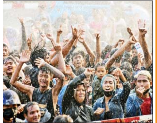
နေပြည်တော် မြို့တော်ဝန်မဟာသင်္ကြန်မဏ္ဍပ်၌ ပျော်ရွှင်စွာ ရေကစားကြသူများကို တွေ့ရစဉ်။