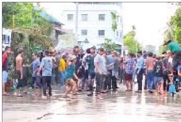
အိမ်မဲမြို့၌ ပျော်ရွှင်စွာ ရေကစားကြသူများကို တွေ့ရစဉ်။