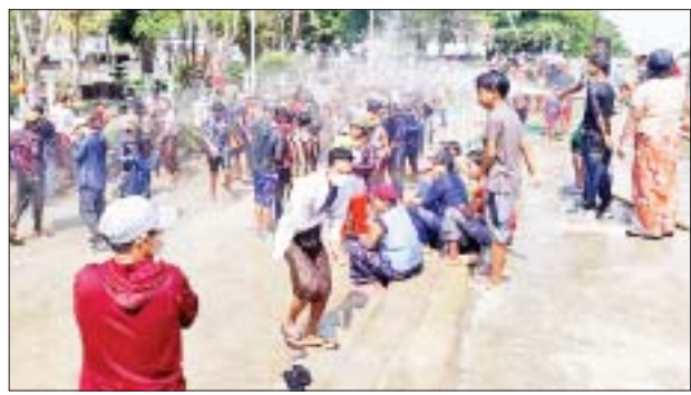
ရေးအဖွဲ့၏ကြီးကြပ်မှုဖြင့် မြို့နယ်ရေတပ်ဖွဲ့၊ ဌာနဆိုင်ရာတာဝန်ရှိသူများက ပူးပေါင်းဆောင်ရွက်လျက်ရှိကြောင်း သိရသည်။

ပန်းတနော် ဧပြီ ၁၅ ဧရာဝတီတိုင်းဒေသကြီး ပန်းတနော်မြို့နယ်၌ မြန်မာ့ရိုးရာ ယဉ်ကျေးမှု မဟာသင်္ကြန်ပွဲတော် အကြတ်နေ့တွင် ဗဟိုရေကစားမဏ္ဍပ်နှင့် မြို့ပေါ်ရပ်ကွက်၊ ကျေးရွာများတွင် ပြည်သူများ အေးချမ်းပျော်ရွှင်စွာ ရေကစားကြသူများဖြင့် စည်ကားလျက်ရှိသည်။ နှစ်သစ်ကူး မြန်မာ့ရိုးရာမဟာသင်္ကြန်အချိန်ကာလတွင် မြို့နယ်အတွင်း ဥပုသ်သီတင်းသီလ ဆောက်တည်ကြသူများ၊ တရားစခန်းများ၌ တရားဘာဝနာပွားများကြသူများနှင့် ဗဟိုရေကစားမဏ္ဍပ်၊ မြို့ပေါ် ရပ်ကွက်၊ ကျေးရွာများရှိ ရေကစားမဏ္ဍပ်များတွင် ပြည်သူများအေးချမ်းပျော်ရွှင်စွာဖြင့် ရေကစားကြသူများနှင့် စည်ကားလျက်ရှိကြောင်း သိရသည်။ မဟာသင်္ကြန်ကာလအတွင်း ပြည်သူများစိတ်အေးချမ်းသာပျော်ရွှင်စွာ အနားယူအပန်းဖြေနိုင်စေရေးအတွက် မြို့နယ်စီမံအုပ်ချုပ်