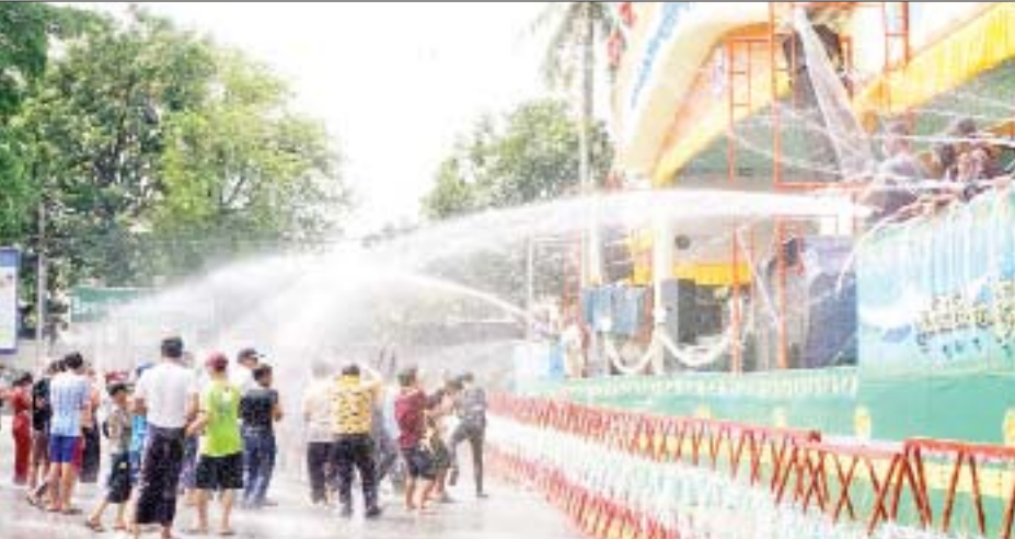
ဖျန်းပက်ပေးကာ ယိမ်းအကအဖွဲ့များအားဂုဏ်ပြု မဏ္ဍပ်နှင့် ဌာနဆိုင်ရာရေကစားမဏ္ဍပ်များတွင် သင်္ကြန်ယိမ်းအဖွဲ့များ၊ စတိတ်ရှိုးကဏ္ဍများ၏ ဧည့်ခံ ဆုငွေများချီးမြှင့်ပေးအပ်ခဲ့သည်။ ထိုသို့ ထားဝယ်မြို့ မြို့တော်ခန်းမရှေ့ ဗဟို ဖျော်ဖြေနေမှုများနှင့် ရေကစားမဏ္ဍပ်များဖြင့်

ထားဝယ် ဧပြီ ၁၅ မြန်မာသက္ကရာဇ် ၁၃၈၃ ခုနှစ် မြန်မာ့ရိုးရာ မဟာသင်္ကြန်အကြတ်နေ့ဖြစ်သည့် ယနေ့နံနက်ပိုင်းတွင် တိုင်းဒေသကြီး အစိုးရအဖွဲ့မှကြီးမှူးကျင်းပသည့်ဗဟိုမဏ္ဍပ်နှင့် ဌာနဆိုင်ရာ ရေကစားသင်္ကြန်မဏ္ဍပ်များတွင် တနင်္သာရီတိုင်းဒေသကြီးဝန်ကြီးချုပ် ဦးမြတ်ကိုနှင့် တာဝန်ရှိသူများက ပျော်ရွှင်စွာ ရေသဘင်ပွဲတော်ဆင်နွှဲနေမှုများအား ကြည့်ရှုအားပေးခဲ့ကြောင်း သိရသည်။