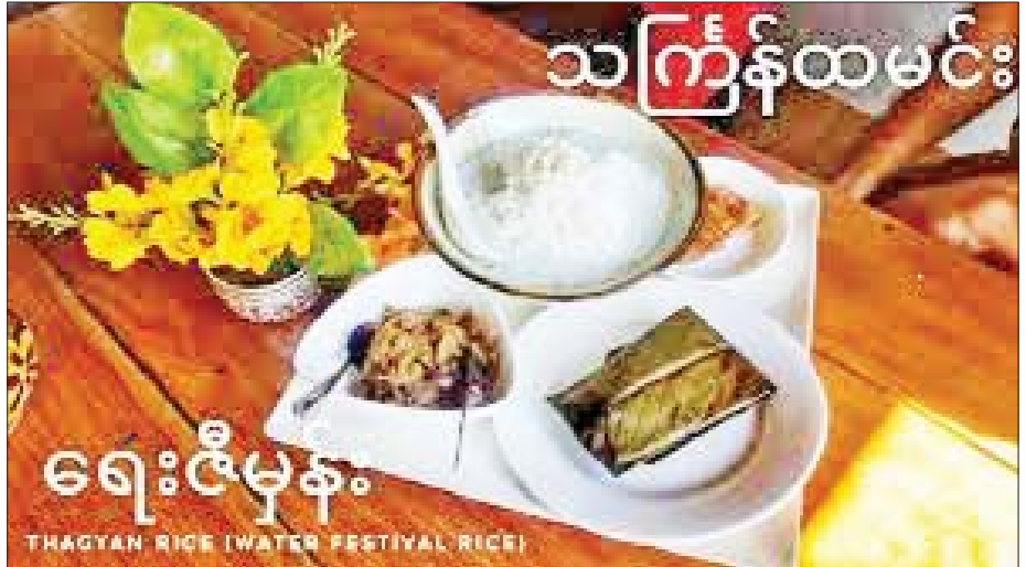
ရေးဇီမှန်း THAGYAN RICE (WATER FESTIVAL RICE)

တနင်္သာရီတိုင်းဒေသကြီး ထားဝယ်ဒေသရှိ ထားဝယ်သူ ထားဝယ်သားများက သင်္ကြန်ကာလ အတွင်း ရေစိမ့်ထမင်း (ရေးဇီမှန်း) လှူဒါန်းပြုလုပ် ခြင်းများ ဆောင်ရွက်ခဲ့ကြောင်းသိရပြီး သင်္ကြန် အတက်နေ့တွင် မိမိမွေးနေ့နှင့်တိုက်ဆိုင်နေပါက ထားဝယ်သူ ထားဝယ်သားများအနေဖြင့် (ထားဝယ် အခေါ် အတာသတ်)သည်ဟု မှတ်ယူခဲ့ကြကာ သင်္ကြန်ရေစိမ့်ထမင်း အလှူပြုလေ့ရှိကြသည်။