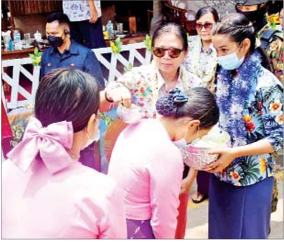
နိုင်ငံတော်စီမံအုပ်ချုပ်ရေးကောင်စီဥက္ကဋ္ဌ တပ်မတော်ကာကွယ်ရေးဦးစီးချုပ် ဗိုလ်ချုပ်မှူးကြီးမင်းအောင်လှိုင်နှင့် ဇနီး ဒေါ်ကြူကြူလှ ပြင်ဦးလွင်တပ်နယ်ရှိ တပ်မတော်ဆက်သွယ်ရေးနှင့် အီလက်ထရွန်းနစ် ကျောင်းမိသားစု အတာရေသဘင်မဏ္ဍပ်၌ အတာရေပက်ဖျန်းပေးကြစဉ်။