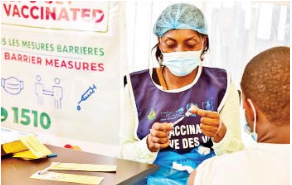
အဆိုပါရောဂါကြောင့်သေဆုံးသူ ၂၅၁၆၆၆ ဦးနှင့် ၁၀၇၄၁၆၂၄ ဦးရှိကြောင်း သိရသည်။ ကိုဗစ်-၁၉ ရောဂါမှ ပြန်လည်ကျန်းမာလာသူ ကိုးကား-ဆင်ဟွာ၊ ဘာသာပြန်-စိုးသူရ

ပြောကြားသည်။ ထို့ပြင် ဗီဇပြောင်းပိုင်းရပ်စ်တိုက်ဖျက်ရေးတွင် ရောဂါကာကွယ်ရေးနည်းလမ်းများကို ဒေသခံများမှ တိကျစွာ လိုက်နာဆောင်ရွက်သွားရန်လိုအပ်ကြောင်း ၎င်းက ပြောကြားသည်။ ထို့ပြင် လက်ရှိအချိန်၌ အိုမီခရွန်ဗီဇပြောင်းပိုင်းရပ်စ်မျိုးကွဲများဖြစ်သည့် ဘီအေ-၄ နှင့် ဘီအေ-၅ အမျိုးအစား ဗီဇပြောင်းပိုင်းရပ်စ်ကူးစက်မှုများကို တောင်အာဖရိကနိုင်ငံနှင့် ဘော့စ်ဝါနာနိုင်ငံတို့တွင် တွေ့ရှိနေကြောင်း သိရသည်။ လက်ရှိအချိန်တွင် အာဖရိကဒေသရှိနိုင်ငံအများအပြားသည် ကိုဗစ်-၁၉ ရောဂါဆိုင်ရာ ကျန်းမာရေးစည်းမျဉ်းများကို ဖြေလျှော့နေသောကြောင့် ယင်းကဲ့သို့သောဆောင်ရွက်မှုများကို ကိုဗစ်-၁၉ ရောဂါ ထိန်းချုပ်ရေးအတွက် ချင့်ချိန်ဆောင်ရွက်ကြရန် တိုက်တွန်းကြောင်း ၎င်းက ပြောကြားသည်။ လက်ရှိအချိန်အထိ အာဖရိကဒေသတွင် ကိုဗစ်-၁၉ ရောဂါကူးစက်ခံရသူ ၁၁၃၆၉၁၆၄ ဦး၊