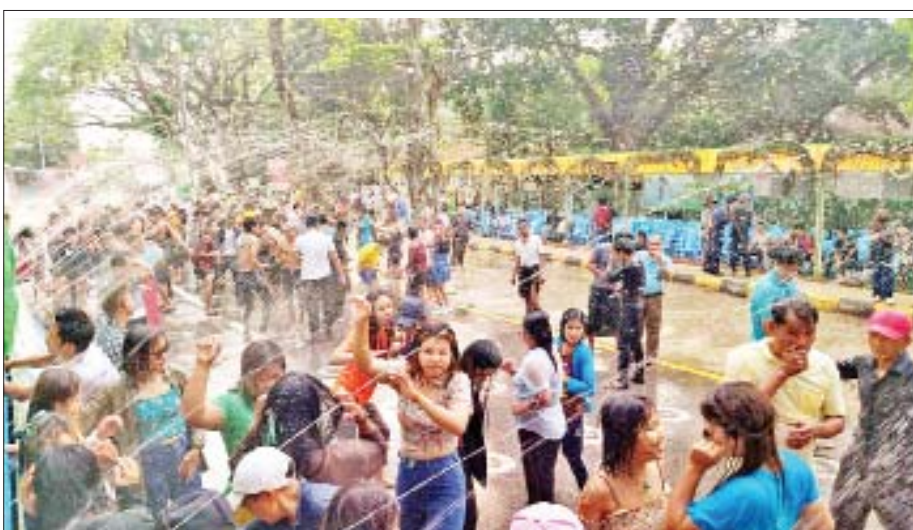
ဗန်းမော်မြို့၌ ပျော်ရွှင်စွာရေကစားကြသူများကို တွေ့ရစဉ်။