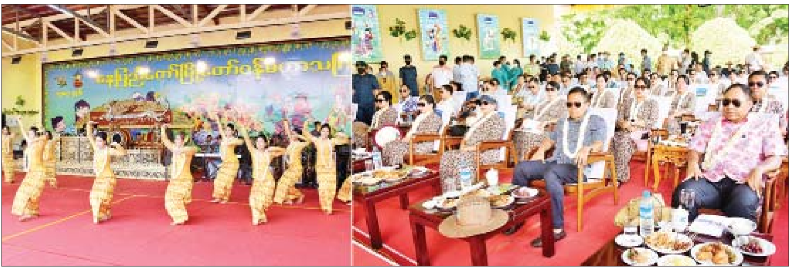
နိုင်ငံတော်စီမံအုပ်ချုပ်ရေးကောင်စီဒုတိယဥက္ကဋ္ဌ ဒုတိယဝန်ကြီးချုပ် ဒုတိယတပ်မတော်ကာကွယ်ရေးဦးစီးချုပ် ကာကွယ်ရေးဦးစီးချုပ်(ကြည်း) ဒုတိယဗိုလ်ချုပ်မှူးကြီးစိုးဝင်းနှင့် အဖွဲ့ဝင်များ နေပြည်တော်မြို့တော်ဝန်မဟာသင်္ကြန်မဏ္ဍပ်၌ မိသားစုသင်္ကြန်ယမ်းအကအဖွဲ့များ၏ သီဆိုကပြပျော်ဖြေမှုအား ကြည့်ရှုအားပေးစဉ်။

နေပြည်တော် ဧပြီ ၁၅ မြန်မာသက္ကရာဇ် ၁၃၈၃ ခုနှစ် မြန်မာ့ရိုးရာနှစ်သစ်ကူး မဟာသင်္ကြန်အကြတ်နေ့ဖြစ်သော ယနေ့တွင် နေပြည်တော်ကောင်စီနယ်မြေအတွင်းရှိ ရေကစားမဏ္ဍပ်များ၌ သင်္ကြန်ချစ်သူပြည်သူများ၊ အရာရှိ၊ စစ်သည်၊ မိသားစုများက မဟာသင်္ကြန် ရေသဘင်ပွဲတော်အား ပျော်ရွှင်စွာပါဝင်ဆင်နွှဲလျက်ရှိသည်။ ယနေ့ မနက်ပိုင်းတွင် နေပြည်တော် ဇေယျာသီရိရှိ ကာကွယ်ရေးဦးစီးချုပ်ရုံး (ကြည်း၊ ရေ၊ လေ) မိသားစု ရေကစားမဏ္ဍပ်၌ နိုင်ငံကျော် အနုပညာရှင်များနှင့် စာမျက်နှာ ၄ ကော်လံ ၁ သို့ ❖