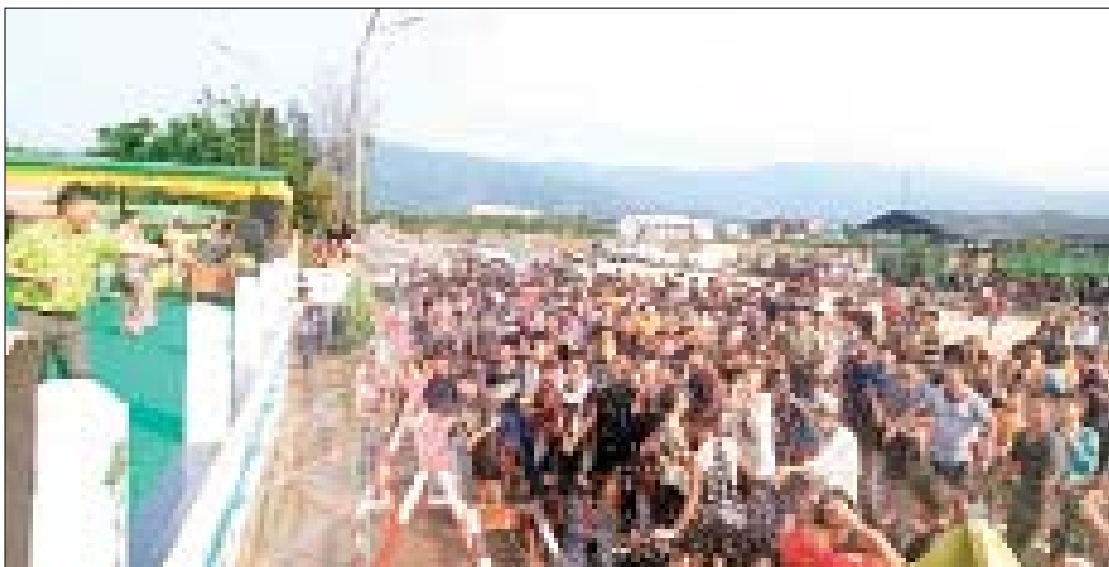
မိုးညှင်းမြို့ ဗဟိုမဏ္ဍပ်၌ အဆိုအကများဖြင့်ဖျော်ဖြေကာ ရေကစားသူများဖြင့် စည်ကားနေမှုကို တွေ့ရစဉ်။