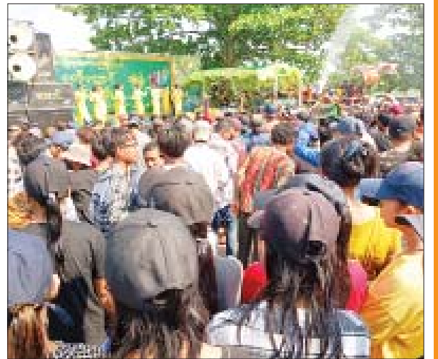
ကျောင်းကုန်းမြို့နယ် ဗဟိုမဏ္ဍပ်၌ အေးချမ်းပျော်ရွှင်စွာ ရေကစားကြသူများကို တွေ့ရစဉ်။