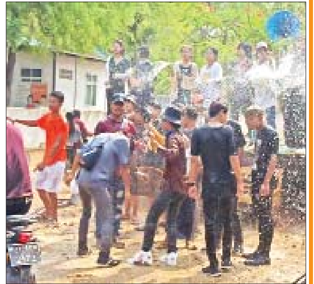
ရမည်းသင်းမြို့နယ် မြို့လှကျေးရွာတွင် ပျော်ရွှင်စွာ ရေကစားကြသူများကို တွေ့ရစဉ်။