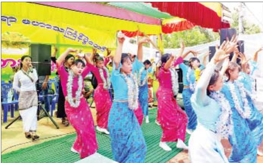
ဒလမြို့နယ်၌ ယိမ်းအကများဖြင့် ပျော်ဖြေတင်ဆက်နေစဉ်။