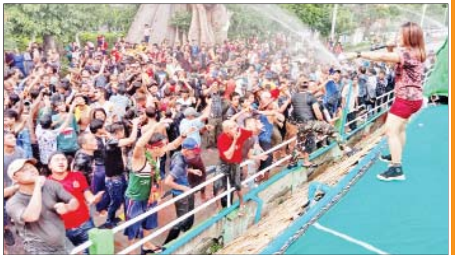
စစ်ကိုင်းမြို့၌ အဆိုအကများဖြင့် ဖျော်ဖြေကာ ရေကစားသူများဖြင့် စည်ကားနေမှုကို တွေ့ရစဉ်။