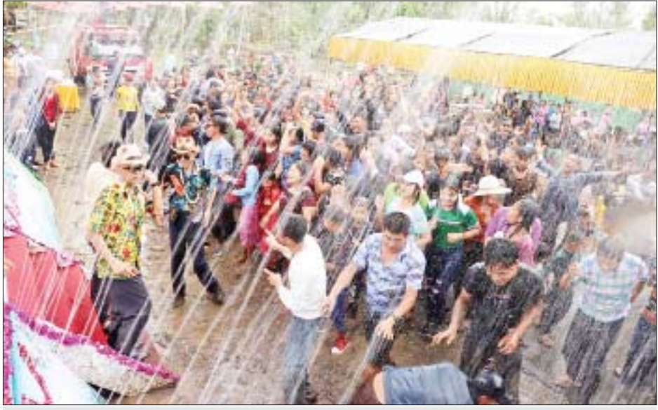
မြောက်ပိုင်းတိုင်းစစ်ဌာနချုပ် မြန်မာ့ရိုးရာမဟာသင်္ကြန်ပွဲတော် သင်္ကြန်အကြတ်နေ့ ကျင်းပစဉ်။