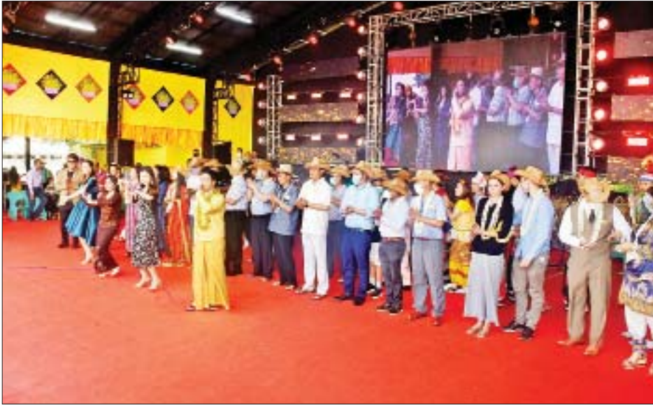
ရန်ကုန်မြို့ရှိ နိုင်ငံခြားသံရုံးများမှ သံရုံးမိသားစုဝင်များနှင့် သံတမန်မိသားစုများက အနုပညာရှင်များ၊ ယိမ်းအဖွဲ့များနှင့်အတူ မြန်မာသံစဉ်တေးသီချင်းများဖြင့် သီဆိုကပြကြစဉ်။

ရန်ကုန် ဧပြီ ၁၅ မြန်မာနိုင်ငံဆိုင်ရာ ကိုရီးယား ဒီမိုကရက်တစ် ပြည်သူ့သမ္မတနိုင်ငံ သံအမတ်ကြီး H.E.Mr.Jong Ho Bom ဦးဆောင်သော ရန်ကုန်မြို့ရှိ နိုင်ငံခြားသံရုံးများမှ သံရုံးမိသားစုဝင်များနှင့် သံတမန်မိသားစုများသည် နိုင်ငံခြားရေးဝန်ကြီးဌာန မဟာဗျူဟာလေ့လာရေးနှင့် လေ့ကျင့်ရေးဦးစီးဌာန ခေတ္တညွှန်ကြားရေးမှူးချုပ် ဦးဇော်ဖြိုးဝင်း၊ သံတမန်ရေးရာဦးစီးဌာန ဒုတိယ ညွှန်ကြားရေးမှူးချုပ် ဦးဇော်ထွန်းဦး၊ တာဝန်ရှိသူများနှင့် အတူ ယနေ့ (သင်္ကြန်အကြတ်နေ့) နံနက်ပိုင်းတွင် ရန်ကုန်မြို့တော် မဟာသင်္ကြန်ရေကစားမဏ္ဍပ်၌ မြန်မာ့ရိုးရာ အတာရေသဘင်