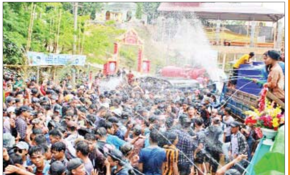
မအီမြို့၌ ပျော်ရွှင်စွာရေကစားကြသူများကို တွေ့ရစဉ်။