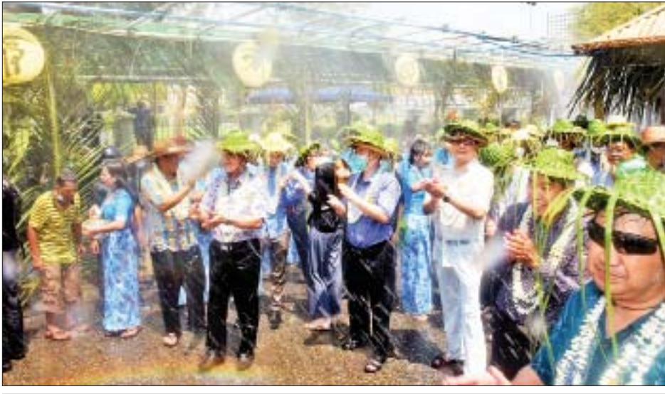
ရန်ကုန်တိုင်းဒေသကြီး ဝန်ကြီးချုပ် ဦးစိုးသိန်းနှင့် တာဝန်ရှိသူများ၊ ရန်ကုန်မြို့ရှိ နိုင်ငံခြားသံရုံးများမှ သံရုံးမိသားစုဝင်များနှင့် သံတမန်မိသားစုများ မြို့တော်ခန်းမအနီး မဟာဗန္ဓုလပန်းခြံလမ်းလမ်းလျှောက်သင်္ကြန်တွင် ပျော်ရွှင်စွာဆင်နွှဲကြစဉ်။

သီဆိုကြပြီး ပျော်ရွှင်စွာ ရေပတ်ကစားကြသည်။ ယင်းနောက် တိုင်းဒေသကြီး ဝန်ကြီးချုပ်၊ ရန်ကုန်မြို့တော်ဝန်နှင့် တာဝန်ရှိသူများနှင့်အတူ သံအမတ်ကြီးနှင့် သံရုံးမိသားစုဝင်များ၊ သံတမန်မိသားစုများသည် မြို့တော်ခန်းမအနီး မဟာဗန္ဓုလပန်းခြံလမ်း လမ်းလျှောက်သင်္ကြန်အား လှည့်လည်ကြည့်ရှုပြီး ပြည်သူများနှင့်အတူ ပျော်ရွှင်စွာ ရေပတ်ကစားကြသည်။ ယနေ့ သင်္ကြန်အကြတ်နေ့တွင် မဏ္ဍပ်ရှေ့၌ ရေပတ်ခံထွက်သူ၊ ရေကစားသူများဖြင့် စည်ကားလျက်ရှိရာ ဖျော်ဖြေရေးအစီအစဉ်များ၊ တိုင်းရင်းသားရိုးရာတေးသီချင်းအကတို့ဖြင့် ယှဉ်ပြိုင်သူများအပြင် ရန်ကုန်မြို့တော် မဟာသင်္ကြန်မဏ္ဍပ်သို့ လာရောက်လည်ပတ်သူများဖြင့် စည်ကားလျက်ရှိသည်။ သတင်း - ကိုသိုက်