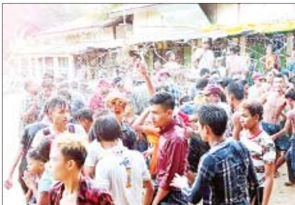
အင်္ဂပူမြို့၌ ပျော်ရွှင်စွာ ရေကစားကြသူများကို တွေ့ရစဉ်။