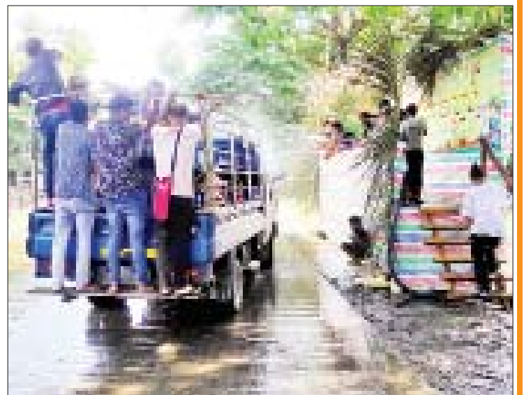
လွန်မြို့၌ အေးချမ်းပျော်ရွှင်စွာ ရေကစားကြသူများကို တွေ့ရစဉ်။