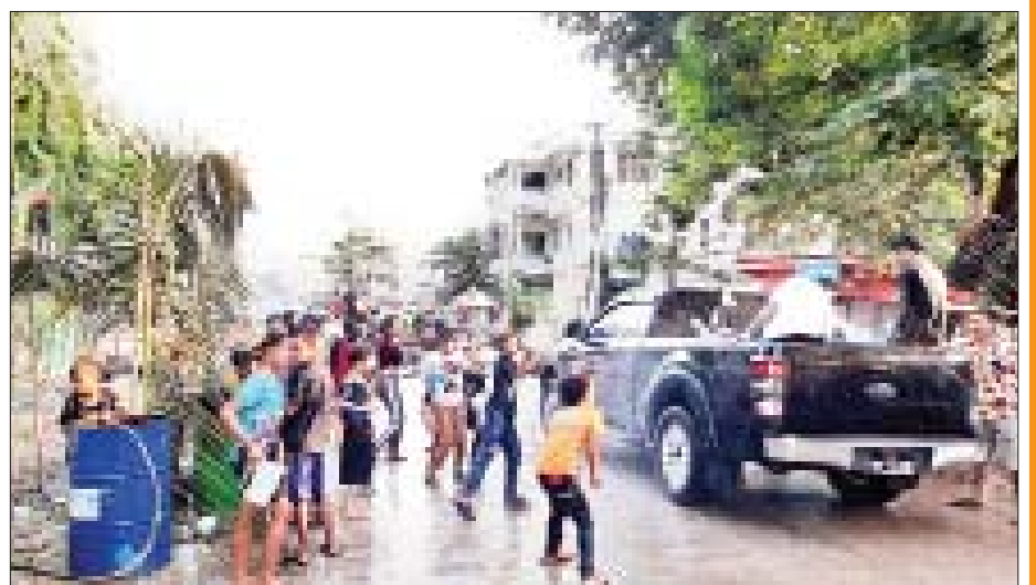
မြဝတီမြို့၌ ပျော်ရွှင်စွာ ရေကစားကြသူများကို တွေ့ရစဉ်။