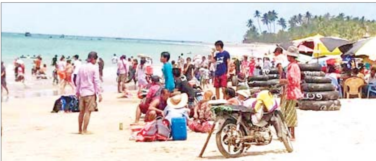
ငွေဆောင်ကမ်းခြေ၌ အပန်းဖြေကြသူများဖြင့် စည်ကားလှက်ရှိသည်ကို တွေ့ရစဉ်။