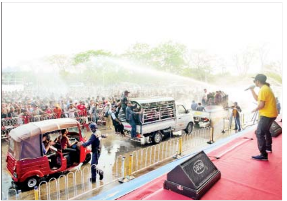
နေပြည်တော် မြို့တော်ဝန်မဟာသင်္ကြန်မဏ္ဍပ်၌ ရေသဘင်ပွဲတော်ကို ပျော်ရွှင်စွာဆင်နွှဲနေကြစဉ်။