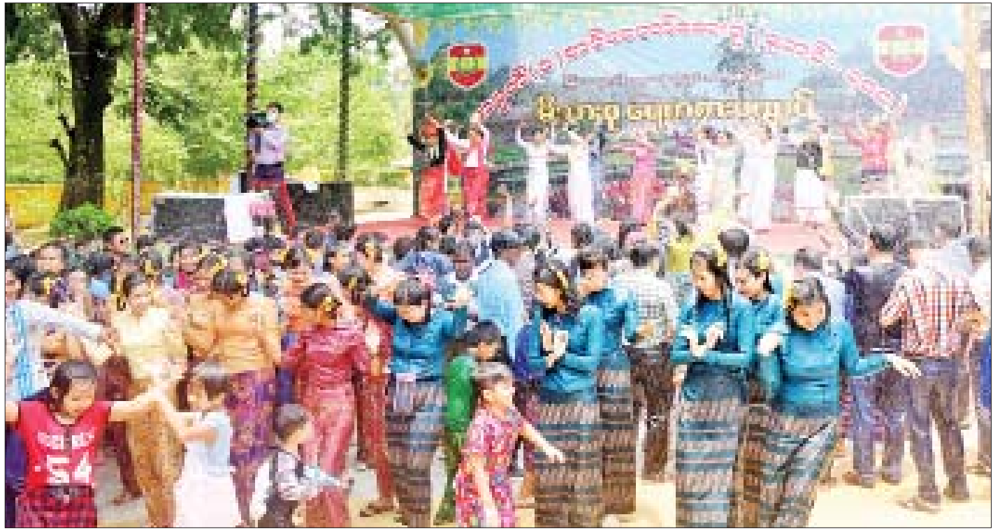
အမှတ်(၁)တပ်မတော်ဆေးရုံ(ခုတင်-၇၀၀)မိသားစု အတာရေသဘင်မဏ္ဍပ်၌ ရေသဘင်ပွဲတော်ကို ပျော်ရွှင်စွာဆင်နွှဲနေကြစဉ်။

ကြည့်ရှုအားပေး ဆက်လက်ပြီး နိုင်ငံတော်စီမံအုပ်ချုပ်ရေး ကောင်စီဥက္ကဋ္ဌ တပ်မတော်ကာကွယ်ရေးဦးစီးချုပ်၊ ဇနီးနှင့် အဖွဲ့ဝင်များသည် တပ်မတော်ဆက်သွယ်ရေး နှင့် အီလက်ထရောနစ်ကျောင်း၊ ပြင်ဦးလွင် တပ်မတော်ဆေးရုံ၊ တပ်မတော်အင်ဂျင်နီယာကျောင်း တို့ရှိ မိသားစုအတာရေသဘင်မဏ္ဍပ်များသို့ ရောက်ရှိ ကြပြီး မိသားစုယိမ်းအဖွဲ့များ၏ သီဆိုကပြပျော်ဖြေ မှုများ၊ အရာရှိ၊ စစ်သည်များ၏ တေးသီချင်းများဖြင့် ပျော်ဖြေမှုများနှင့် အရာရှိ၊ စစ်သည်၊ မိသားစုဝင်များ ရေသဘင်ပွဲတော်ကို ပျော်ရွှင်စွာဆင်နွှဲနေမှုများကို ကြည့်ရှုအားပေးပြီး အရာရှိ၊ စစ်သည် မိသားစုများ အား အတာရေများ ပက်ဖျန်းပေးသည်။ ညနေပိုင်းတွင် နိုင်ငံတော်စီမံအုပ်ချုပ်ရေး ကောင်စီဥက္ကဋ္ဌ တပ်မတော်ကာကွယ်ရေးဦးစီးချုပ်၊