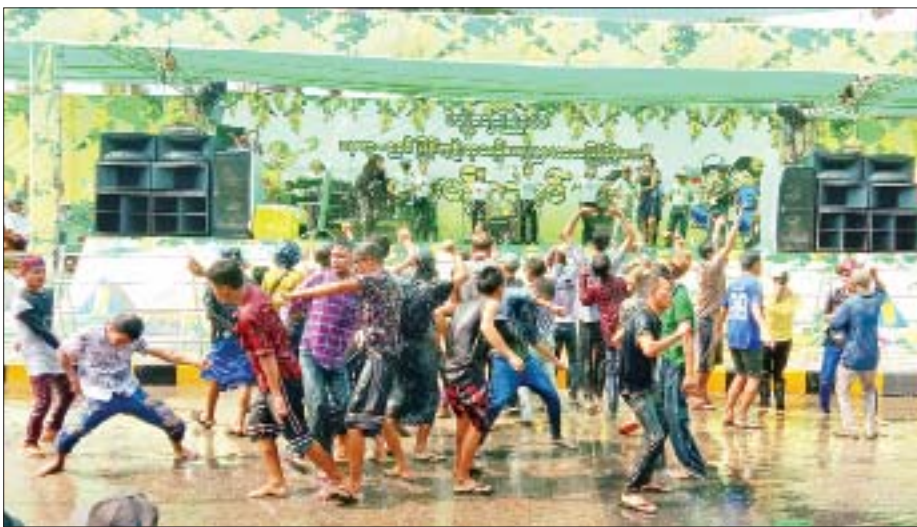
ကျိုပျော်မြို့နယ် ဗဟိုမဏ္ဍပ်၌ အဆိုအကများဖြင့် ဖျော်ဖြေကာ ရေကစားသူများဖြင့် စည်ကားနေမှုကို တွေ့ရစဉ်။