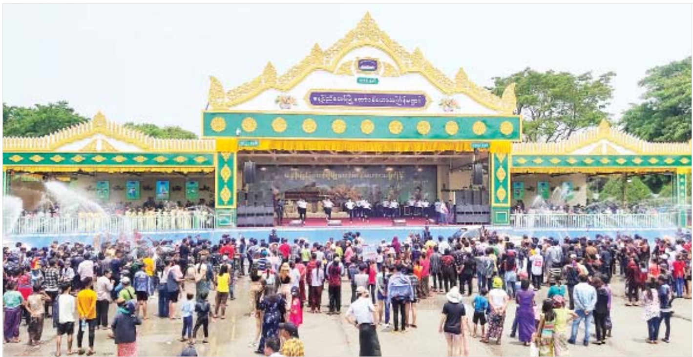
နေပြည်တော်မြို့တော်ဝန် မဟာသင်္ကြန်မဏ္ဍပ်၌ ပျော်ရွှင်စွာရေကစားနေသူများဖြင့် စည်ကားလျက်ရှိသည်ကို တွေ့ရစဉ်။

နေပြည်တော် ဧပြီ ၁၅ မြန်မာ့ရိုးရာမဟာသင်္ကြန် (အကြတ်နေ့)တွင် နေပြည်တော်ကောင်စီနယ်မြေအတွင်း၌ ရေပက်ခံကားများ၊ ရေပက်ခံထွက်ကြသူများ၊ စတုဒိသာကျွေးမွေးအလှူဒါနပြုကြသူများနှင့် ကုသိုလ်ကောင်းမှုပြုသူများဖြင့် စည်ကားလျက်ရှိသည်။ ယနေ့နံနက်ပိုင်းမှစတင်၍ နေပြည်တော်ဥပုတသန္တိစေတီတော်မြတ်ကြီး၊ ဓာတုဗေဒတော်ပေါင်းစုစေတီတော်၊ လှေခွင်းတောင်ဘုရား၊ အခြားတန်ခိုးကြီးဘုရားများနှင့် ဘုန်းတော်ကြီးကျောင်းများတွင် တရားဘာဝနာပွားများအားထုတ်ကြသူများ၊ ဥပုသ်သီလဆောက်တည်ကြသူများ၊ ဘုရားဖူးလာသူများဖြင့် စည်ကားလျက်ရှိသည်။ ထို့ပြင် နေပြည်တော်မြို့တော်ဝန် မဟာသင်္ကြန်မဏ္ဍပ်နှင့် ကာကွယ်ရေးဦးစီးချုပ် (ကြည်း) မဟာသင်္ကြန်ရေကစားမဏ္ဍပ်များတွင်လည်း နိုင်ငံကျော်အနုပညာရှင်များ၊ တေးသံရှင်များက တေးသီချင်းများဖြင့်လည်းကောင်း၊ ဝန်ကြီးဌာနများနှင့် နေပြည်တော်မြို့နယ်အတွင်းရှိ မြို့နယ်များမှ ယိမ်းအဖွဲ့များက ယိမ်းအကအလှများဖြင့်လည်းကောင်း ဖျော်ဖြေခဲ့ကြပြီး ရေပက်ခံကားများ၊ ရေကစားကြသူများဖြင့် စည်ကားခဲ့သည့်အပြင် စတုဒိသာမဏ္ဍပ်တွင်လည်း လာရောက်ရေပက်ကစားကြသူများကို အကျွေးအမွေးများဖြင့် ဧည့်ခံခဲ့ကြသည်ကိုလည်း တွေ့ရသည်။ ထို့အတူ နေပြည်တော်ရေပန်းဥယျာဉ်အတွင်းရှိ လမ်းလျှောက်သင်္ကြန်ပွဲတော်တွင်လည်း သင်္ကြန်ချစ်သူများ၊ လာရောက်ရေပက်ခံသူများ၊ ရေကစားကြသူများဖြင့် စည်ကားလျက်ရှိသည်။