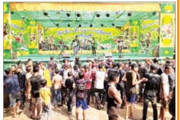
ငပုတောမြို့ ဗဟိုမဏ္ဍပ်၌ အတာရေသဘင်ပွဲတော်ကို ပျော်ရွှင်စွာဆင်နွှဲနေစဉ်။