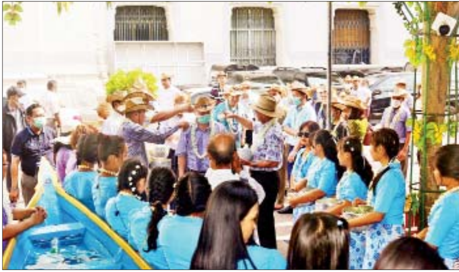
ရန်ကုန်တိုင်းဒေသကြီး ဝန်ကြီးချုပ် ဦးစိုးသိန်းနှင့် တာဝန်ရှိသူများက ရန်ကုန်မြို့ရှိ နိုင်ငံခြားသံရုံးများမှ သံရုံးမိသားစုဝင်များနှင့် သံတမန်မိသားစုများအား အတာရေပတ်ဖျန်းကြိုဆိုကြစဉ်။

ပွဲတော်ကို ပျော်ရွှင်စွာလာရောက်ဆင်နွှဲကြသည်။ ဦးစွာ သံအမတ်ကြီးနှင့် သံရုံးမိသားစုဝင်များ၊ သံတမန်မိသားစုများအား ရန်ကုန်တိုင်းဒေသကြီး ဝန်ကြီးချုပ် ဦးစိုးသိန်း၊ ရန်ကုန်မြို့တော်ဝန် ဦးဗိုလ်ဌေးနှင့် တာဝန်ရှိသူများက ကြိုဆိုကြပြီး သင်္ကြန်ယိမ်းအဖွဲ့ လှံမပျံလေးများက သပြေခက်များဖြင့် ရေပတ်ဖျန်းကြသည်။ ရန်ကုန်မြို့တော် မဟာသင်္ကြန်မဏ္ဍပ်တွင် လာရောက်ရေကစားသည့် သံအမတ်ကြီးနှင့် သံရုံးမိသားစုဝင်များ၊ သံတမန်မိသားစုများသည် ယိမ်းအဖွဲ့များ၊ တိုင်းရင်းသား ရိုးရာယဉ်ကျေးမှုအဖွဲ့၊ မြန်မာနိုင်ငံရုပ်ရှင်အစည်းအရုံးမှ အမေများအဖွဲ့နှင့် အနုပညာရှင်များ၊ မြန်မာနိုင်ငံ ဂီတအစည်းအရုံးမှ အနုပညာရှင်များ၊ မြန်မာနိုင်ငံ သဘင်အစည်းအရုံးမှ အနုပညာရှင်များ၏ ပုဂံအက၊ ဇော်ဂျီရုပ်သေးအစွမ်းပြအကတို့ဖြင့် သီဆိုကပြပျော်ဖြေမှုကို ကြည့်ရှုအားပေး