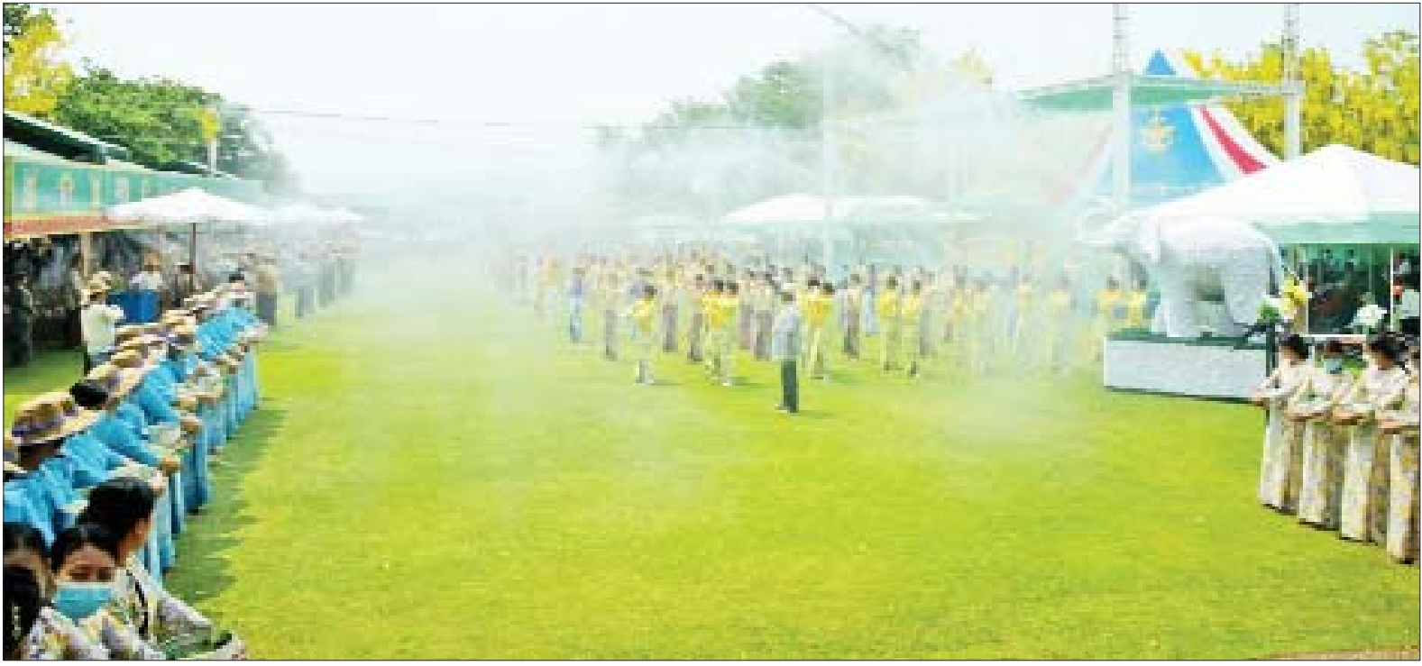
ကာကွယ်ရေး ဦးစီးချုပ်ရုံး (ကြည်း၊ ရေ၊ လေ) မိသားစု ရေကစားမဏ္ဍပ်၌ ရေသဘင် ပွဲတော်ကို ပျော်ရွှင်စွာဆင်နွှဲနေ ကြစဉ်။