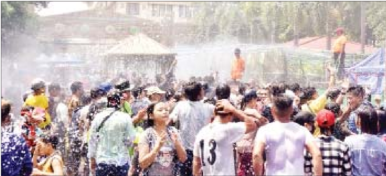
ရန်ကုန်မြို့ မဟာဗန္ဓုလပန်းခြံဘေးရှိ လမ်းလျှောက်သင်္ကြန်တွင် ပျော်ရွှင်စွာ ရေကစားကြသူများကို တွေ့ရစဉ်။