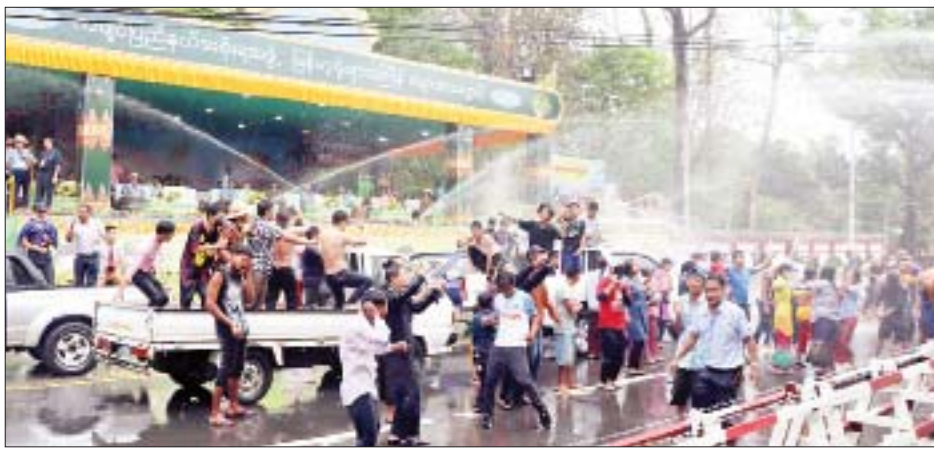
နှင့် ၎င်းတို့၏ ဇနီးများ၊ တပ်မတော်အရာရှိကြီးများ၊ ဌာနဆိုင်ရာများသည် မြစ်ကြီးနားလေတပ်စခန်း ဌာနချုပ်မိသားစု အတာရေသဘင်ပွဲတော်သို့ တက်ရောက်ကြပြီး လေတပ်စခန်းဌာနယိမ်းအဖွဲ့များ၊ ခေတ်ပေါ်တေးသီချင်းများ သီဆိုဖျော်ဖြေမှုတို့ကို ကြည့်ရှုအားပေးခဲ့ကြကာ လေတပ်စခန်းဌာနချုပ်

မြစ်ကြီးနား ဧပြီ ၁၅ ကချင်ပြည်နယ် မြစ်ကြီးနားမြို့၌ မြန်မာ့ရိုးရာ ယဉ်ကျေးမှုမဟာသင်္ကြန်ပွဲတော် ယနေ့ (အကြတ်နေ့) တွင် ဗဟိုမဏ္ဍပ်၊ ရေကစားမဏ္ဍပ်နှင့် လမ်းလျှောက် သင်္ကြန်ပွဲတော်တို့၌ ရေကစားသူများ၊ လည်ပတ် သူများဖြင့် အေးချမ်းပျော်ရွှင်စွာ ကျင်းပလျက်ရှိရာ ပြည်နယ်ဝန်ကြီးချုပ် ဦးခက်ထိန်နန်နှင့် တာဝန်ရှိ သူများက ရေသဘင်မဏ္ဍပ်များသို့ သွားရောက်ပြီး ပြည်သူများနှင့်အတူ ပျော်ရွှင်စွာ ပါဝင်ဆင်နွှဲခဲ့ကြ သည်။