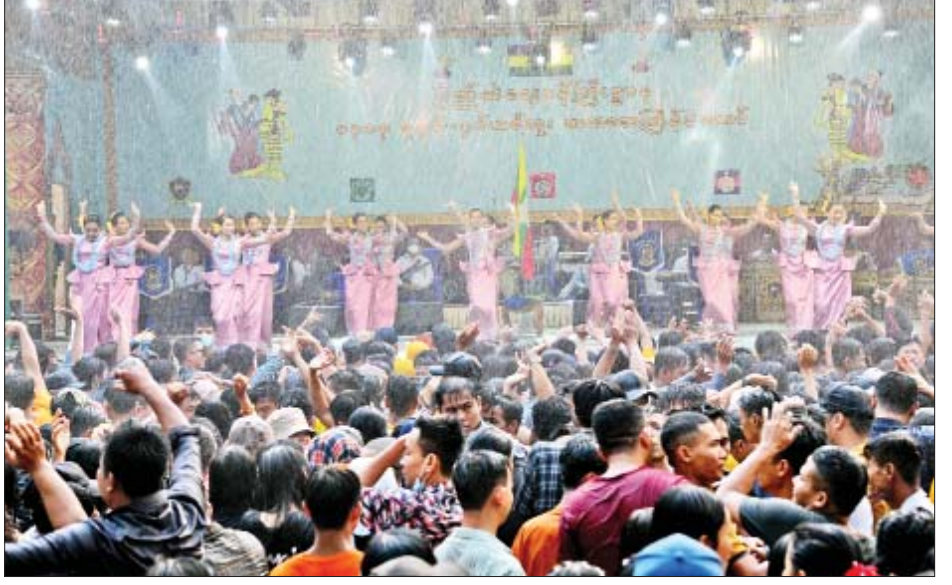
ပြည်ထဲရေးဝန်ကြီးဌာန မိသားစုသင်္ကြန်မဏ္ဍပ်၌ မိသားစုသင်္ကြန်ယိမ်းအဖွဲ့များ၏ သီဆိုကပြဖျော်ဖြေမှုအား ကြည့်ရှုအားပေးသူများဖြင့် စည်ကားလျက်ရှိသည်ကို တွေ့ရစဉ်။

☆ ကျောစိုးမှ တေးသံရှင်များ၊ မိသားစု သင်္ကြန်ယိမ်းအကအဖွဲ့များ က သီဆိုကပြဖျော်ဖြေကြရာ နိုင်ငံတော်စီမံအုပ်ချုပ် ရေးကောင်စီ ဒုတိယဥက္ကဋ္ဌ ဒုတိယဝန်ကြီးချုပ် ဒုတိယတပ်မတော်ကာကွယ်ရေးဦးစီးချုပ် ကာကွယ် ရေးဦးစီးချုပ်(ကြည်း) ဒုတိယဗိုလ်ချုပ်မှူးကြီးစိုးဝင်း သည် နိုင်ငံတော်စီမံအုပ်ချုပ်ရေးကောင်စီအဖွဲ့ဝင် များ၊ ပြည်ထောင်စုဝန်ကြီးများ၊ ဒုတိယဝန်ကြီးများ၊ ကာကွယ်ရေးဦးစီးချုပ်ရုံးမှ တပ်မတော်အရာရှိကြီး