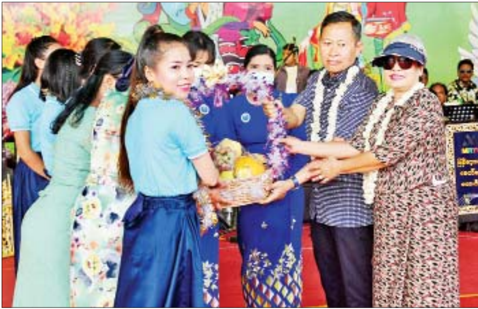
နိုင်ငံတော်စီမံအုပ်ချုပ်ရေးကောင်စီ ဒုတိယဥက္ကဋ္ဌ ဒုတိယဝန်ကြီးချုပ် ဒုတိယတပ်မတော် ကာကွယ်ရေးဦးစီးချုပ် ကာကွယ်ရေးဦးစီးချုပ် (ကြည်း) ဒုတိယဗိုလ်ချုပ်မှူးကြီးစိုးဝင်း နေပြည်တော် မြို့တော်ဝန်မဟာသင်္ကြန်မဏ္ဍပ်၌ သီဆိုကပြဖျော်ဖြေကြသည့် အနုပညာရှင်များနှင့် ယိမ်းအဖွဲ့များအား ဂုဏ်ပြုလက်ဆောင်ပေးအပ်စဉ်။