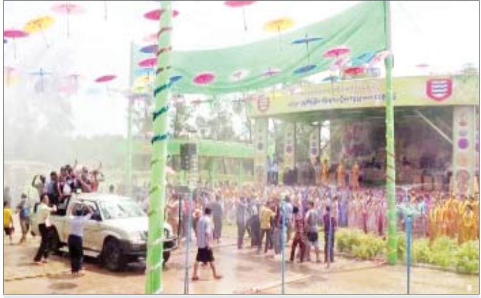
အနောက်တောင်တိုင်းစစ်ဌာနချုပ် မြန်မာ့ရိုးရာမဟာသင်္ကြန် အကြတ်နေ့ ကျင်းပစဉ်။

များ၏ ယှဉ်ပြိုင်ဖျော်ဖြေမှုများကို ကြည့်ရှုအားပေးပြီး ဂုဏ်ပြုဆုငွေ များ ပေးအပ်ကြသည်။ ထို့ပြင် ဧရာဝတီတိုင်းဒေသကြီး ပုသိမ်မြို့နယ် ချောင်းသာ ကမ်းခြေ၊ ငွေဆောင်ကမ်းခြေနှင့် ရခိုင်ပြည်နယ် သံတွဲမြို့နယ် ငပလီ ကမ်းခြေတို့၌လည်း လာရောက်အပန်းဖြေအနားယူနေသော ပြည်သူ များဖြင့် စည်ကားလျက်ရှိပြီး စားသောက်ဆိုင်များ၊ ဒေသထွက်ကုန် ရောင်းချနေသော ဈေးဆိုင်များ ဖွင့်လှစ်ထားရှိကာ စည်ကားသိုက်မြိုက် လျက်ရှိသည်။ ယင်းအပြင် မဏ္ဍပ်များအသီးသီး၌ ရေသဘင်ဆင်နွှဲကြသူများအား စတုဒိသာ အကျွေးအမွှေးဖြင့်လည်းကောင်း၊ နိဗ္ဗာန်ဈေးပွဲတော်များ ပြုလုပ်၍လည်းကောင်း ဧည့်ခံကျွေးမွေးကြပြီး ရေသဘင်ဆင်နွှဲခဲ့ကြ ကြောင်း သိရသည်။ သတင်းစဉ်