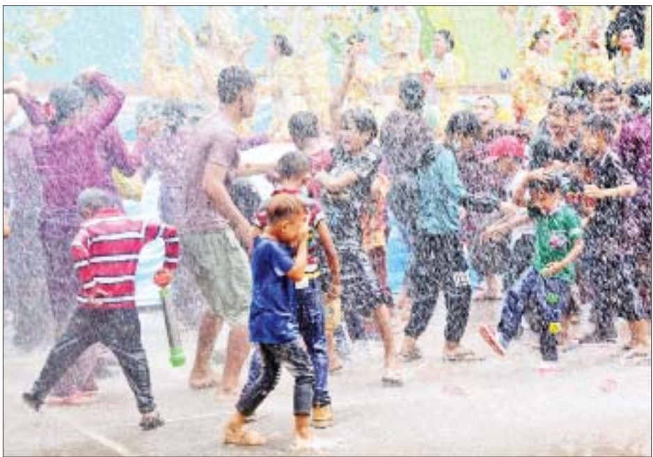
တပ်မတော်အုပ်ချုပ်မှုကျောင်းမိသားစု အတာရေသဘင်မဏ္ဍပ်၌ ရေသဘင်ပွဲတော်ကို ပျော်ရွှင်စွာ ဆင်နွှဲနေကြစဉ်။