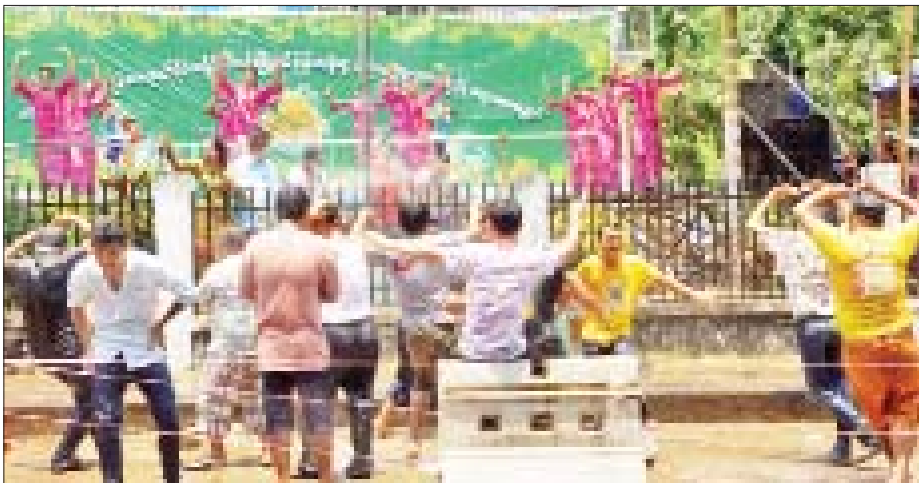
တောင်ကြီးမြို့ ဗဟိုမဏ္ဍပ်၌ တိုင်းရင်းသားရိုးရာအကများဖြင့် ကပြဖျော်ဖြေနေစဉ်။ ဒေသခံလင်း