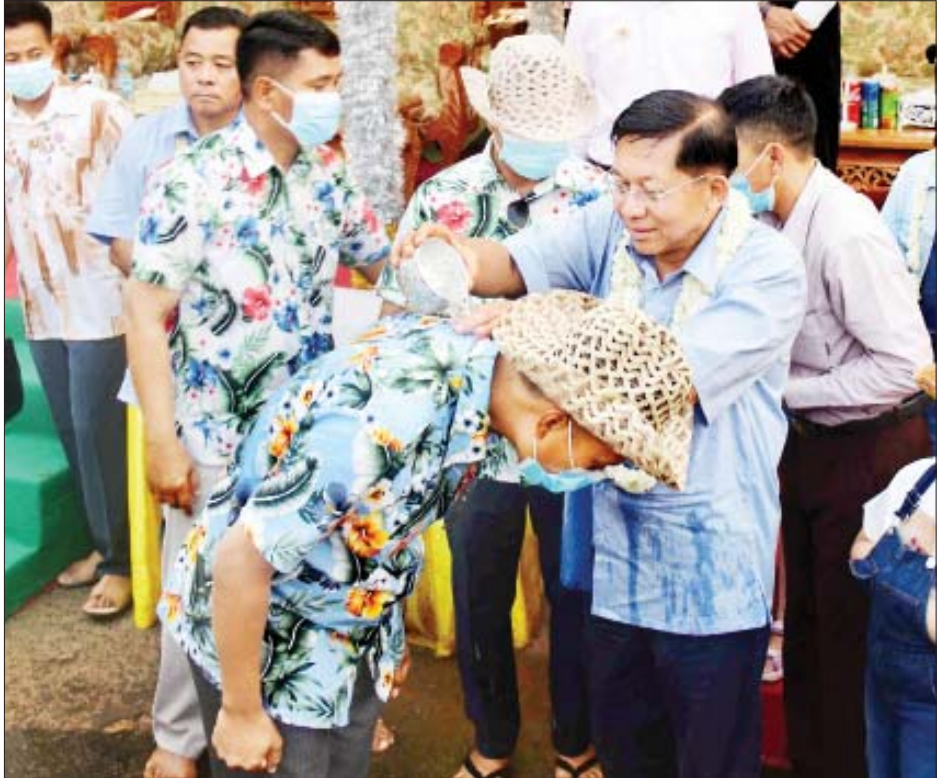
နိုင်ငံတော်စီမံအုပ်ချုပ်ရေးကောင်စီဥက္ကဋ္ဌ တပ်မတော်ကာကွယ်ရေးဦးစီးချုပ် ဗိုလ်ချုပ်မှူးကြီး မင်းအောင်လှိုင်တပ်မတော်နည်းပညာတက္ကသိုလ်မိသားစုအတာရေသဘင်မဏ္ဍပ်၌ အတာရေပက်ဖျန်းစဉ်။