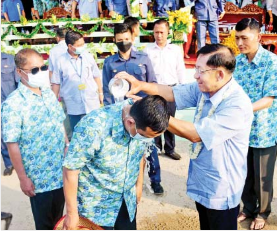
နိုင်ငံတော်စီမံအုပ်ချုပ်ရေးကောင်စီဥက္ကဋ္ဌ တပ်မတော်ကာကွယ်ရေးဦးစီးချုပ် ဗိုလ်ချုပ်မှူးကြီး မင်းအောင်လှိုင် စစ်တက္ကသိုလ်မိသားစုအတာရေသဘင်မဏ္ဍပ်၌ အတာရေပက်ဖျန်းစဉ်။