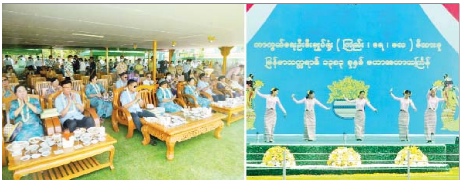
နိုင်ငံတော်စီမံအုပ်ချုပ်ရေးကောင်စီဒုတိယဥက္ကဋ္ဌ ဒုတိယဝန်ကြီးချုပ် ဒုတိယတပ်မတော်ကာကွယ်ရေးဦးစီးချုပ် ကာကွယ်ရေးဦးစီးချုပ်(ကြည်း) ဒုတိယဗိုလ်ချုပ်မှူးကြီး စိုးဝင်းနှင့်အဖွဲ့ဝင်များ ကာကွယ်ရေးဦးစီးချုပ်ရုံး(ကြည်း၊ ရေ လေ) မိသားစုရေကစားမဏ္ဍပ်၌ မိသားစုသင်္ကြန်ယမ်းအကအဖွဲ့များ၏ သီဆိုကပြဖျော်ဖြေမှုများကို ကြည့်ရှု အားပေးစဉ်။

နေပြည်တော် ဧပြီ ၁၄ မြန်မာသက္ကရာဇ် ၁၃၈၃ ခုနှစ် မြန်မာ့ ရိုးရာနှစ်သစ်ကူး မဟာသင်္ကြန်အကျနေ့ ဖြစ်သော ယနေ့တွင် ကာကွယ်ရေးဦးစီး ချုပ်ရုံး(ကြည်း)ဝင်းအတွင်းရှိ ရေကစား မဏ္ဍပ်များ၌ သင်္ကြန်ချစ်သူပြည်သူများ၊ အရာရှိ၊ စစ်သည်၊ မိသားစုများက မဟာ သင်္ကြန်ရေသာသင်ပွဲအား ပျော်ရွှင်စွာ ပါဝင် ဆင်နွှဲကြသည်။ ယနေ့ နံနက်ပိုင်းတွင် နေပြည်တော် ဇေယျာသီရိမြို့နယ်ရှိ ကာကွယ်ရေးဦးစီး ချုပ်ရုံး(ကြည်း၊ ရေ လေ) မိသားစုရေကစား မဏ္ဍပ်၌ နိုင်ငံကျော်အနုပညာရှင်များနှင့် တေးသံရှင်များ၊ မိသားစုသင်္ကြန် ယမ်း အကအဖွဲ့များက သီဆိုကပြဖျော်ဖြေ ကြရာ နိုင်ငံတော်စီမံအုပ်ချုပ်ရေးကောင်စီ ဒုတိယဥက္ကဋ္ဌ ဒုတိယဝန်ကြီးချုပ် ဒုတိယတပ်မတော်ကာကွယ်ရေးဦးစီးချုပ် စာမျက်နှာ ၄ ကော်လံ ၁ သို့ ❖