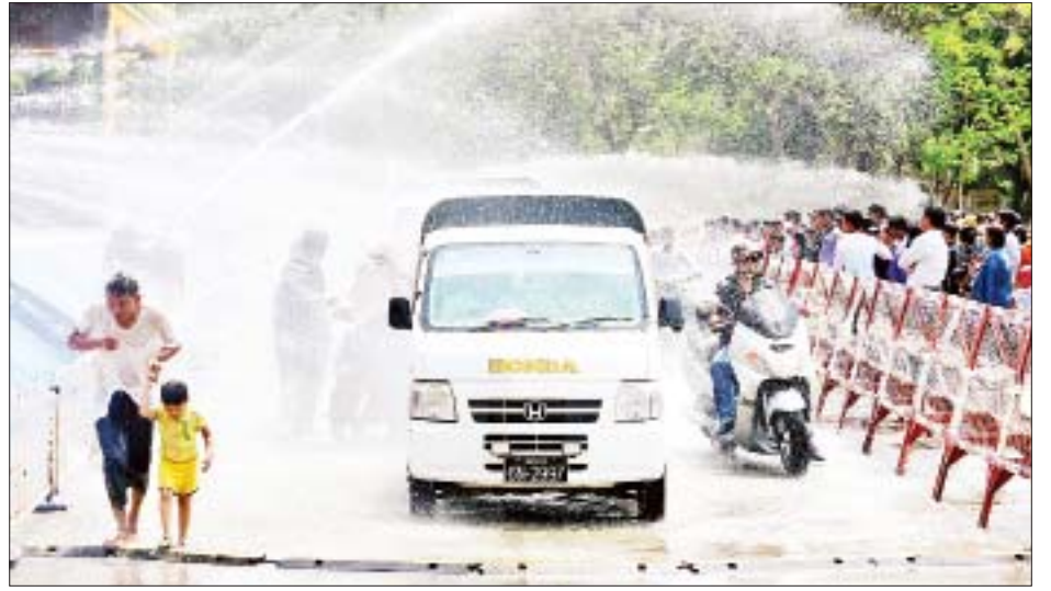
နေပြည်တော်မြို့တော်ဝန်မဟာသင်္ကြန်မဏ္ဍပ်၌ ပျော်ရွှင်စွာရေကစားနေသူများဖြင့် စည်ကားလျက်ရှိသည်ကို တွေ့ရစဉ်။

နေပြည်တော် ဧပြီ ၁၄ ယနေ့ကျရောက်သည့် မြန်မာ့ရိုးရာမဟာသင်္ကြန်(အကျနေ့)တွင် နေပြည်တော် ကောင်စီနယ်မြေအတွင်းရှိ ဘုရားစေတီပုထိုးများ၌ ကုသိုလ်ကောင်းမှုပြုကြသူများ၊ စတုဒိသာကျွေးမွေးလှူဒါန်းကြသူများ၊ အေးချမ်းပျော်ရွှင်စွာ ရေကစားကြသူများနှင့် အပန်းဖြေစခန်းများ၌ လာရောက်အပန်းဖြေကြသူများဖြင့် စည်ကားလျက်ရှိသည်။ စည်ကားလျက်ရှိ ယနေ့နံနက်ပိုင်းမှစတင်၍ နေပြည်တော်ဥပတိတသန္တိစေတီတော်မြတ်ကြီး၊ ဓာတုစယဓာတ်ပေါင်းစုစေတီတော်၊ လှေခင်းတောင်ဘုရား၊ အခြားတန်ခိုးကြီးဘုရားများနှင့် ဘုန်းတော်ကြီးကျောင်းများတွင်