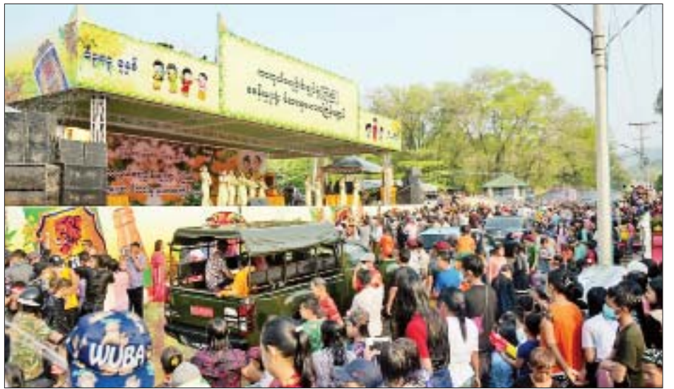
ကာကွယ်ရေးဦးစီးချုပ်ရုံး (ကြည်း) စခန်းမှူးရုံး မိသားစုမဟာသင်္ကြန်မဏ္ဍပ်၌ ရေသဘင်ပွဲတော်ကို ပျော်ရွှင်စွာ ဆင်နွှဲနေကြစဉ်။