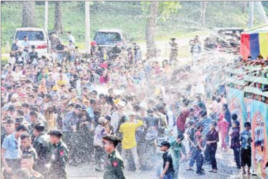
စစ်တက္ကသိုလ်မိသားစုအတာရေသဘင်မဏ္ဍပ်၌ ရေသဘင်ပွဲတော်ကို ပျော်ရွှင်စွာဆင်နွှဲနေကြစဉ်။