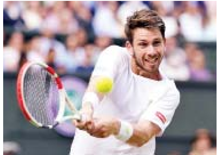
ဗြိတိန်နံပါတ်တစ် တင်းနစ်ကစားသမား ကာမီရွန်နော်ရီး။

ဗြိတိန် နံပါတ်တစ် တင်းနစ်ကစားသမား ကာမီရွန်နော်ရီးဟာ မွန်တီကာလို မာစတာတင်းနစ်ပြိုင်ပွဲရဲ့ ဒုတိယအဆင့်မှာ စပိန်တင်းနစ်ကစားသမား ရာမိုစ်ဗီနိုလက် ကို ၆-၄၊ ၂-၆၊ ၆-၄ နဲ့ ရှုံးနိမ့်ခဲ့တာဖြစ်ပါတယ်။ ကမ္ဘာ့အဆင့်(၃၇)နေရာမှာရပ်တည်နေတဲ့ ရာမိုစ်ဗီနိုလက်ဟာ ကမ္ဘာ့အဆင့်(၁၀) နေရာမှာရပ်တည်နေတဲ့ ကာမီရွန်နော်ရီးနဲ့ ယှဉ်ပြိုင်ကစားခဲ့တဲ့ ရှုံးစေးကွင်းပွဲစဉ်လေးပွဲစလုံး အနိုင်ရရှိခဲ့သူလည်း ဖြစ်ပါတယ်။ ဗြိတိန်နံပါတ်နှစ် တင်းနစ်ကစားသမား ဒန်အီဗန်ဟာလည်း မွန်တီကာလိုမာစတာ တင်းနစ်ပြိုင်ပွဲ ဒုတိယအဆင့်မှာ ဘယ်လ်ဂျီယံတင်းနစ်ကစားသမား ဒေးဗစ်ဂျေဖင်ကို ၇-၆(၇-၃)၊ ၆-၂ နဲ့ ရှုံးနိမ့်ခဲ့တာကြောင့် ပြိုင်ပွဲကနေထွက်ခဲ့ရတာဖြစ်ပါတယ်။ ဒန်အီဗန် ဟာ ပြီးခဲ့တဲ့နှစ်က မွန်တီကာလိုမာစတာတင်းနစ်ပြိုင်ပွဲမှာ ဆီမီးဖိုင်နယ်အဆင့်အထိ တက်လှမ်းခွင့်ရရှိခဲ့သူဖြစ်ပါတယ်။