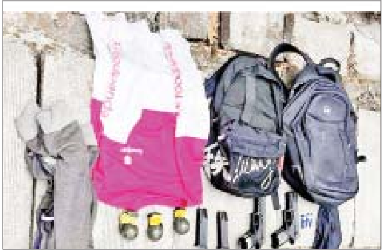
တရားခံ သုံးဦးနှင့်အတူ သိမ်းဆည်းရမိသည့် လက်နက်/ခဲယမ်းများ မှတ်တမ်းဓာတ်ပုံ။