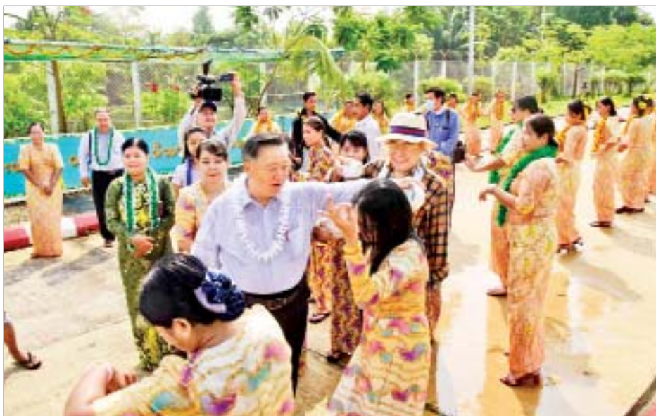
လူမျိုးများရေးရာဝန်ကြီးဌာနဖြစ်သည့်အတွက် တိုင်းရင်းသားများ စည်းလုံးညီညွတ်ရေးနှင့် ငြိမ်းချမ်း ရေးကို ပိုင်းဝန်းကြိုးစားဖော်ဆောင်ကြစေလိုပါ ကြောင်းနှင့် မိသားစုသင်္ကြန်တွင် တစ်နှစ်ပတ်လုံး

ရေသဘင်ပွဲတော်တွင် တိုင်းရင်းသားလူမျိုးများ ရေးရာဝန်ကြီးဌာန ပြည်ထောင်စုဝန်ကြီး ဦးစောထွန်း အောင်မြင့်က မိမိတို့ဌာနသည် တိုင်းရင်းသား