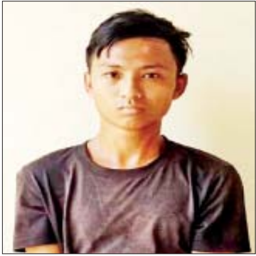
ခန့်ကြည်သာ (၂၅)နှစ်