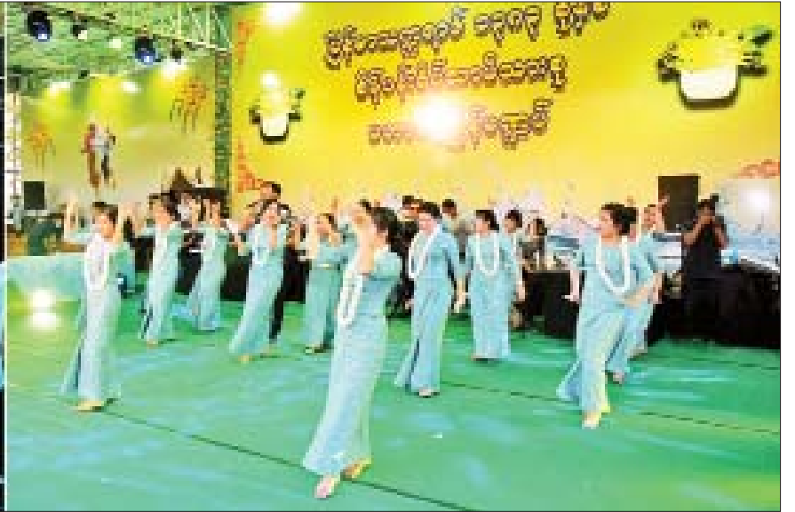
နိုင်ငံတော်စီမံအုပ်ချုပ်ရေးကောင်စီ ဒုတိယဥက္ကဋ္ဌ ဒုတိယဝန်ကြီးချုပ် ဒုတိယတပ်မတော်ကာကွယ်ရေးဦးစီးချုပ် ကာကွယ်ရေးဦးစီးချုပ်(ကြည်း) ဒုတိယဗိုလ်ချုပ်မှူးကြီး စိုးဝင်းနှင့် အဖွဲ့ဝင်များ စိန်ပန်းရိပ်သာမိသားစု မဟာသင်္ကြန်မဏ္ဍပ်၌ မိသားစုသင်္ကြန်ယိမ်းအကအဖွဲ့များ၏ သီဆိုကပြ ဖျော်ဖြေနေမှုများကို ကြည့်ရှုအားပေးစဉ်။