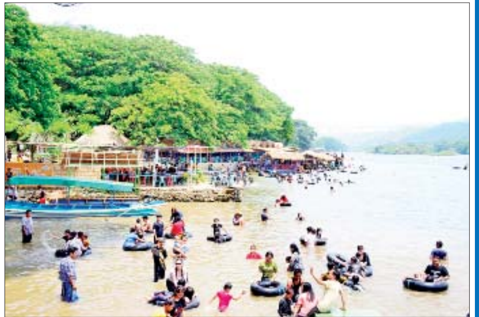
နေပြည်တော် ဇေယျာသီရိမြို့နယ်အတွင်းရှိ ပေါင်းလောင်းမြစ်ကမ်းတစ်လျှောက် လာရောက်အပန်းဖြေလည်ပတ်သူများအား တွေ့ရစဉ်။ မြို့နယ်(ပြန်/ဆက်)