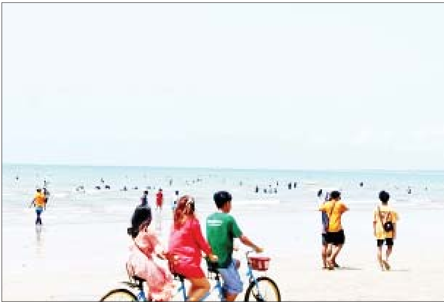
ဧရာဝတီတိုင်းဒေသကြီး ချောင်းသာမြို့ရှိ ချောင်းသာကမ်းခြေတွင် လာရောက်အပန်းဖြေသူများကို တွေ့ရစဉ်။