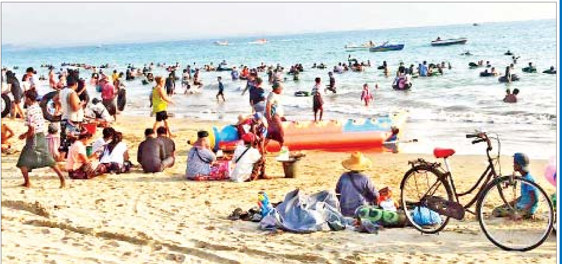
ဧရာဝတီတိုင်းဒေသကြီး ငွေဆောင်မြို့ရှိ ငွေဆောင်ကမ်းခြေ၌ စိတ်အေးချမ်းသာစွာ လာရောက်အပန်းဖြေအနားယူသူများဖြင့် စည်ကားလှက်ရှိသည်ကို တွေ့ရစဉ်။