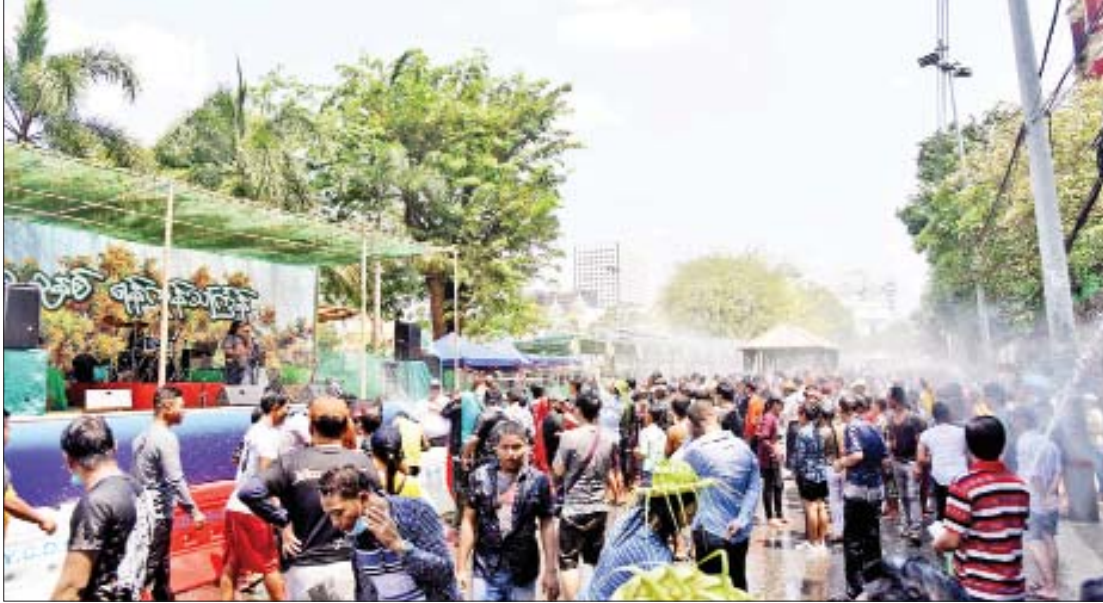
ရန်ကုန်မြို့ မဟာဗန္ဓုလပန်းခြံဘေးရှိ လမ်းလျှောက်သင်္ကြန်တွင် ပါဝင်ဆင်နွှဲသူများဖြင့် စည်ကားလှက်ရှိသည်ကို တွေ့ရစဉ်။