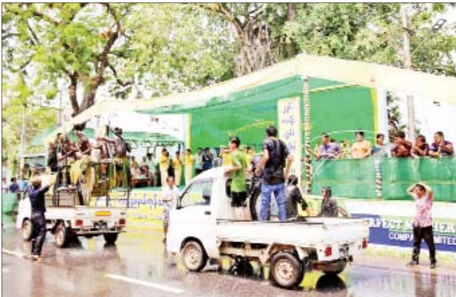
အတာရေအေး ပက်ဖျန်းပေးကြ ကာ ဂုဏ်ပြုဆုငွေများ ပေးအပ် ချီးမြှင့်ကြသည်။ ထို့နောက် ပြည်နယ်ဝန်ကြီးချုပ် နှင့်အဖွဲ့သည် ဘားအံမြို့ ကမ်းနား လမ်းရှိ စိုက်ပျိုးရေး၊ မွေးမြူရေးနှင့် ဆည်မြောင်းဝန်ကြီးဌာန ရေကစား မဏ္ဍပ်၊ လမ်းပန်းဆက်သွယ်ရေး ဝန်ကြီးဌာန ရေကစားမဏ္ဍပ်၊ ပိတောက်အချစ်ဆုံး အမှတ်(၃)

မဟာသင်္ကြန်အကျနေ့ နံနက် ပိုင်းတွင် ကရင်ပြည်နယ် ဝန်ကြီး ချုပ်ဦးစောမြင့်ဦး၊ ပြည်နယ်တရား လွှတ်တော် တရားသူကြီးချုပ် ဒေါ်ခင်ဆွေထွန်း၊ ပြည်နယ်အစိုးရ အဖွဲ့ဝင်များ၊ ဖိတ်ကြားထားသော ဧည့်သည်တော်များ၊ ပြည်နယ်၊ ခရိုင်၊ မြို့နယ်အဆင့် ဌာနဆိုင်ရာ များနှင့် ဒေသခံတိုင်းရင်းသား ပြည်သူများသည် ဘားအံမြို့ သီရိကွင်းရှိ မဟာသင်္ကြန်ပဟို မဏ္ဍပ်တွင် သင်္ကြန်ယိမ်းအကအဖွဲ့ များ၊ တပင်တိုင်အကများ၊ အနု ပညာရှင်များ၏ တေးသီချင်းဖြင့် သီဆိုဖျော်ဖြေမှုများကို ကြည့်ရှု အားပေးပြီး အောင်သပြေခက်ဖြင့်