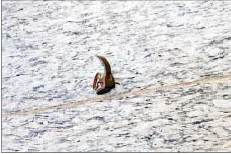
၂၀၂၂ ခုနှစ် ဧပြီ ၁၁ ရက်တွင် ဗဟန်းမြို့နယ် ဆရာစံရပ်ကွက် ကမ္ဘာအေးဘုရားလမ်းနှင့် စက်မှု(၁)လမ်းထောင့် မြန်မာပလာဇာ မြေညီထပ်ရှိ Harry's Bar တွင် ပေါက်ကွဲမှုဖြစ်ပွားခဲ့သည့် မှတ်တမ်းဓာတ်ပုံ။