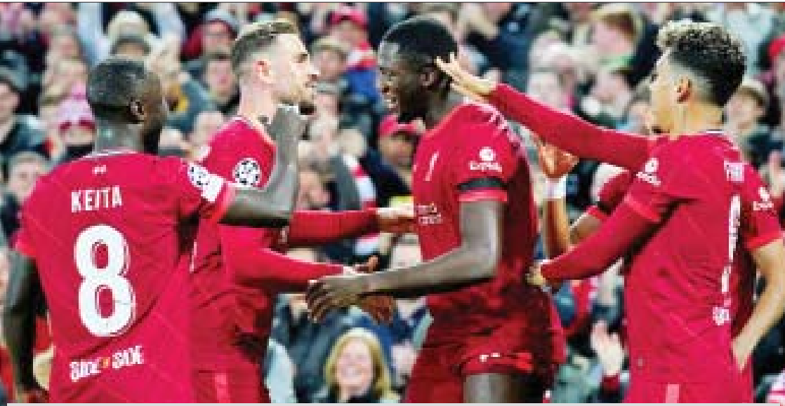
လီဗာပူးအသင်း ကစားသမားများ အောင်ပွဲခံနေစဉ်။