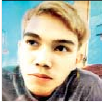
တင့်ထူးနိုင်(ခ)ဂူးဂူး (၁၈)နှစ်