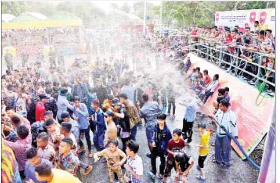
တပ်မတော်နည်းပညာတက္ကသိုလ် မိသားစုအတာရေသဘင်မဏ္ဍပ်၌ ရေသဘင်ပွဲတော်ကို ပျော်ရွှင်စွာ ဆင်နွှဲနေကြစဉ်။

❖ ရှေးဖုံးမှ သီဆိုကပြပျော်ဖြေမှုများ၊ ဗိုလ်လောင်းများ၏ တေးသီချင်းများ သီဆိုပျော်ဖြေမှုများ၊ တေးသံရှင်များ၏ သီဆိုပျော်ဖြေမှုများနှင့်အတူ ဗိုလ်လောင်းများ၊ အရာရှိ၊ စစ်သည်၊ မိသားစုဝင်များက ရေသဘင်ပွဲတော်ကို ပျော်ရွှင်စွာဆင်နွှဲနေမှုများကို ကြည့်ရှုအားပေးကြသည်။ ယင်းနောက် နိုင်ငံတော်စီမံအုပ်ချုပ်ရေးကောင်စီဥက္ကဋ္ဌ တပ်မတော်ကာကွယ်ရေးဦးစီးချုပ်၊ ဇနီးနှင့် အဖွဲ့ဝင်များသည် ရေသဘင်ပွဲတော်ကို ပျော်ရွှင်စွာဆင်နွှဲနေကြသည့် ဗိုလ်လောင်းများနှင့် စစ်တက္ကသိုလ်မှ