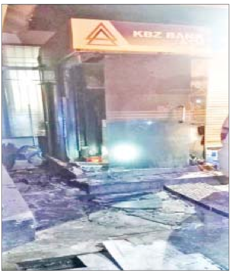
၂၀၂၂ ခုနှစ် မတ် ၂၅ ရက်တွင် ဒဂုံမြို့သစ်(မြောက်ပိုင်း)မြို့နယ်ရှိ KBZ ဘဏ်ခွဲ(၃)မှ ATM စက် တစ်လုံးအား မီးရှို့ဖျက်ဆီးခံခဲ့ရသည့် မှတ်တမ်းဓာတ်ပုံ။