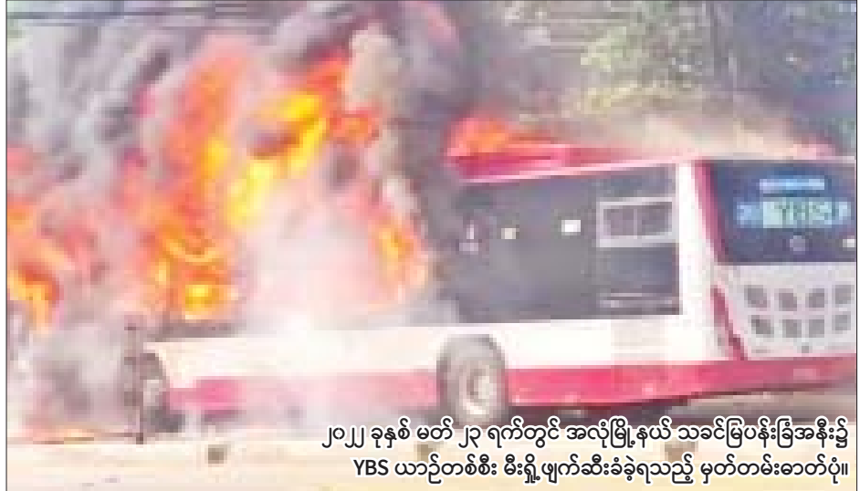
၂၀၂၂ ခုနှစ် မတ် ၂၃ ရက်တွင် အလိုမြို့နယ် သခင်မြပန်းခြံအနီး၌ YBS ယာဉ်တစ်စီး မီးရှို့ဖျက်ဆီးခံခဲ့ရသည့် မှတ်တမ်းဓာတ်ပုံ။

နေပြည်တော် ဧပြီ ၁၄ နိုင်ငံတော်အစိုးရအနေဖြင့် CRPH၊ NUG နှင့် PDF အမည်ခံ အကြမ်းဖက်အဖွဲ့များက ပြည်သူ လူထုကို လုပ်ကြံသတ်ဖြတ်ခြင်းနှင့် နိုင်ငံတော် အစိုးရ၏ အုပ်ချုပ်မှုယန္တရားပျက်ပြားစေရန်အတွက် နိုင်ငံတော်အစိုးရနှင့် ချိတ်ဆက်ဆောင်ရွက်လျက် ရှိသည့် ပြည်သူလူထုပိုင်အဆောက်အအုံများကို အကြောင်းမဲ့ဖောက်ခွဲဖျက်ဆီးခြင်း၊ သင်္ကြန်ကာလ အတွင်း အပြစ်မဲ့ပြည်သူများကို ထိတ်လန့်ကြောက်ရွံ့ စေရန် ဖောက်ခွဲဖျက်ဆီးခြင်း စသည့် အကြမ်းဖက် လုပ်ရပ်များကို ဆောင်ရွက်နိုင်မှုမရှိစေရေး ဖော်ထုတ် ဖမ်းဆီးခြင်းများ နေ့ညမပြတ် ဆောင်ရွက်လျက် ရှိသည်။ စာမျက်နှာ ၁၅ ကော်လံ ၁ သို့ *