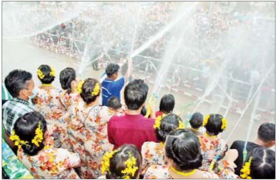
စိန်ပန်းရိပ်သာမိသားစု မဟာသင်္ကြန်မဏ္ဍပ်၌ ပျော်ရွှင်စွာ ရေကစားနေကြသူများကိုတွေ့ရစဉ်။

❖ ကျောဖုံးမှ ကာကွယ်ရေးဦးစီးချုပ် (ကြည်း) ဒုတိယ ဗိုလ်ချုပ်မှူးကြီး စိုးဝင်းသည် နိုင်ငံတော်စီမံအုပ်ချုပ်ရေးကောင်စီအဖွဲ့ဝင်များ၊ ပြည်ထောင်စုဝန်ကြီးများ၊ ဒုတိယဝန်ကြီးများ၊ ကာကွယ်ရေးဦးစီးချုပ်ရုံးမှ တပ်မတော်အရာရှိကြီးများ၊ ဇနီးများနှင့်အတူ တက်ရောက်ကြည့်ရှု အားပေးကြပြီး သီဆိုကပြ ဖျော်ဖြေကြသည့် အနုပညာရှင်များနှင့် ယိမ်းအဖွဲ့များကို ဂုဏ်ပြုဆုငွေများ ချီးမြှင့်ပေးအပ်သည်။ ကြည့်ရှုအားပေး အလားတူ ညနေပိုင်းတွင် နိုင်ငံတော်စီမံအုပ်ချုပ်ရေးကောင်စီ ဒုတိယဥက္ကဋ္ဌ ဒုတိယဝန်ကြီးချုပ် ဒုတိယတပ်မတော်ကာကွယ်ရေး