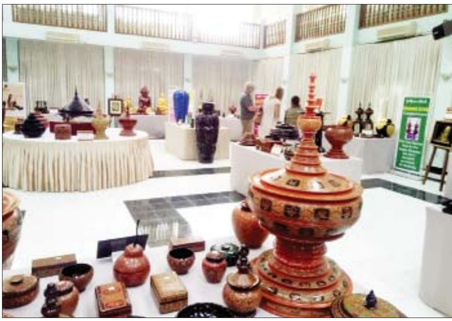
ယွန်းပညာကောလိပ်(ပုဂံ)တွင် ၂-၂၀၁၉ ရက်နေ့က ကျင်းပခဲ့သည့် ယွန်းပညာပြပွဲ။

တွေကို ပိုမိုအားပေးနိုင်မယ်။ နည်းပညာသင်တန်းတွေ ပိုပေးနိုင်မယ်။ အရင်းအနှီးချိတ်ဆက်မှုတွေ ပိုလုပ်နိုင်မယ်။ ချေးငွေချိတ်ဆက်မှုတွေ ပိုလုပ်နိုင်မယ်ဆိုရင် ဒီကဏ္ဍ ရှင်သန်လာမယ်လို့ ယုံကြည်ပါတယ်။ ပြည်နယ်/ တိုင်းဒေသကြီးအားလုံးမှာ စံပြုကျေးရွာစီမံကိန်းတွေ Pilot လုပ်နေပါတယ်။ အဲဒီရွာတွေမှာ ကျေးရွာရဲ့ ရှိပြီးစိုက်ပျိုးရေး၊ မွေးမြူရေးအရင်းအမြစ်တွေကို အခြေခံပြီး ကုန်ထုတ်လုပ်မှုဆောင်ရွက်နိုင်ဖို့ စီမံဆောင်ရွက်ရမှာဖြစ်ပါတယ်။ နိုင်ငံအတွင်း အသေးစားစက်မှုလက်မှုလုပ်ငန်းများ၏ ဖွံ့ဖြိုးမှုအခြေအနေ အသေးစား စက်မှုလက်မှုလုပ်ငန်းဦးစီးဌာနအနေနဲ့ ME ပိုင်းကို အဓိကထား လုပ်ကိုင်တာဖြစ်ပြီး အသေးစားနဲ့ အလတ်စားလုပ်ငန်းပေါင်းသိန်းကျော်ရှိနေပါတယ်။ SME မှတ်ပုံတင်ပြီး အဖွဲ့ဝင်ကတ်ထုတ်ပေးထားတဲ့ လုပ်ငန်း ၇၀၀၀ ကျော်နဲ့ ME အနေနဲ့ မှတ်ပုံတင်ပြီးလုပ်ငန်းပေါင်း ၁၄၀၀၀ ကျော် ရှိနေပြီဖြစ်ပါတယ်။ အိမ်တွင်း စက်မှုလက်မှုလုပ်ငန်းတွေ စုပေါင်းပြီး အသေးစားမှ တစ်ဆင့် အငယ်စား၊ အလတ်စား၊ အကြီးစား စသဖြင့် တဖြည်းဖြည်း အဆင့်မြှင့်တင်ဆောင်ရွက်သွားကြမှာ ဖြစ်ပါတယ်။ ဥပမာ မန္တလေးက အာရှအချိုရည်လုပ်ငန်းဆိုရင် ဌာနက ဖွင့်လှစ်တဲ့ သစ်သီးယိုစုံနှင့် ဖျော်ရည်သင်တန်းတွေကို သင်တန်းသားစေလွှတ်တက်ရောက်စေခဲ့ရာမှ အခုဆိုရင် လုပ်ငန်းကလည်း အသေးစားကနေ အလတ်စားအဆင့်ကို ရောက်ရှိနေတာ တွေ့ရပါတယ်။ ဒီလိုမျိုး အောင်မြင်