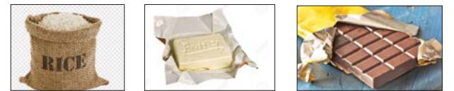
1. A ___ of rice 2. A ___ of butter 3. A ___ of chocolate

(၄) ရုပ်ပုံများကိုကြည့်ပြီး သင့်လျော်သောစကားလုံးဖြည့်စွက်ပါ။