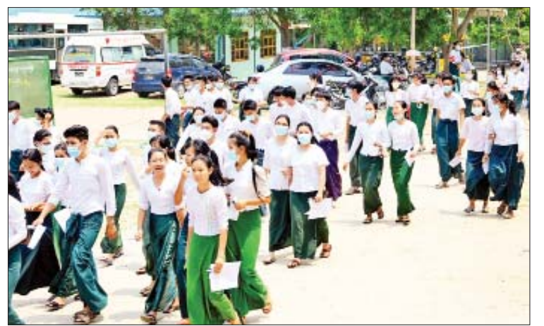
၂၀၂၂ ခုနှစ် တက္ကသိုလ်ဝင်စာမေးပွဲ ဒုတိယနေ့အဖြစ် အင်္ဂလိပ်စာဘာသာရပ် ဖြေဆိုကြသည့် ကျောင်းသား ကျောင်းသူများကို တွေ့ရစဉ်။

ပေးလျက်ရှိသည်။ အဆိုပါ တက္ကသိုလ်ဝင်စာမေးပွဲကို မတ် ၃၁ ရက်တွင် မြန်မာစာဘာသာရပ်ကို စတင်ဖြေဆို၍ ဧပြီ ၁ ရက် သောကြာ နေ့တွင် အင်္ဂလိပ်စာဘာသာရပ်ကို ဆက်လက်ဖြေဆိုလျက်ရှိပြီး ဧပြီ ၂ ရက် စနေနေ့တွင် သင်္ချာဘာသာရပ်များကို ဖြေဆိုသွားမည်ဖြစ်ကာ ဧပြီ ၃ ရက် တနင်္ဂနွေနေ့ကို ပိတ်ရက်အဖြစ် သတ်မှတ်