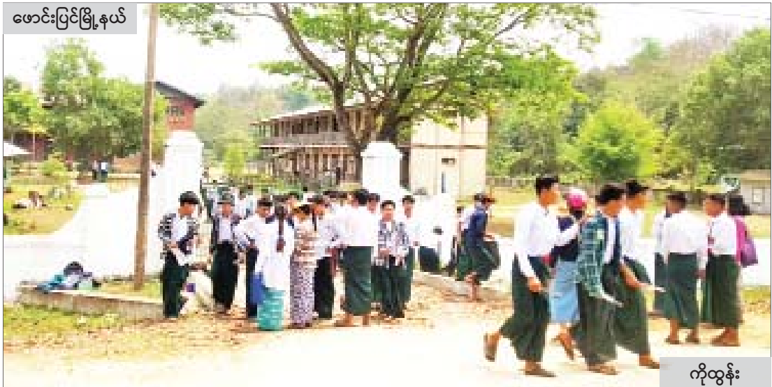
ဖောင်းပြင်မြို့နယ်