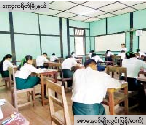
ကော့ကရိတ်မြို့နယ်