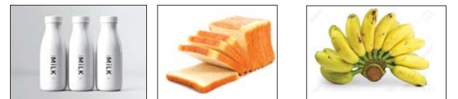
4. A ___ of milk 5. A ___ of bread 6. A ___ of bananas