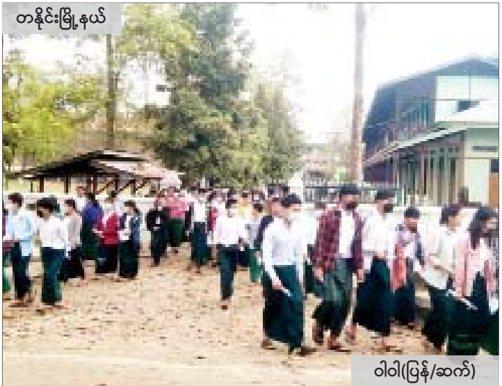
တနိုင်းမြို့နယ်