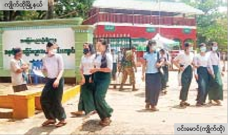
ကျိုက်ထိုမြို့နယ်