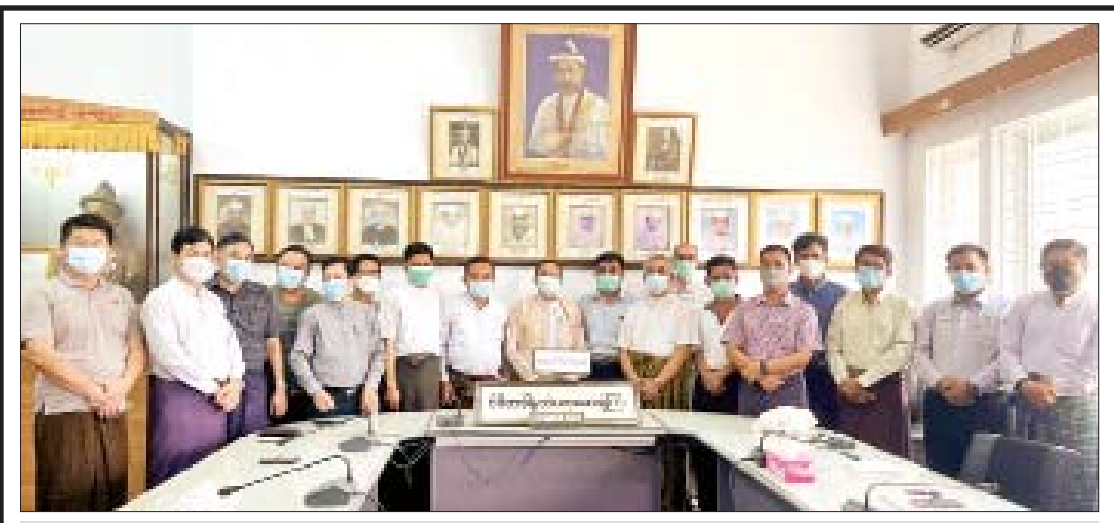
ဧပြီ ၁ ရက်တွင် စစ်တက္ကသိုလ်ဗိုလ်လောင်းသင်တန်းအမှတ်စဉ် (၂၉) သင်တန်းဆင်းများက (၃၄) နှစ်မြောက် အထိမ်းအမှတ်အဖြစ် ဇီဝိတဒါနသံဃာ့ဆေးရုံကြီးတွင် အလှူငွေကျပ် ၂၁ သိန်း ၁ သောင်းပေးအပ် လှူဒါန်းရာ ဆေးရုံမှာတာဝန်ရှိသူများက လက်ခံရယူစဉ်။