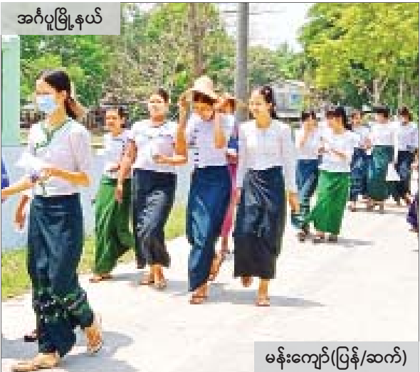
အင်္ဂုမြို့နယ်