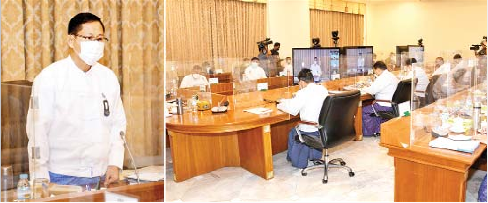
နိုင်ငံတော်စီမံအုပ်ချုပ်ရေးကောင်စီဒုတိယဥက္ကဋ္ဌ ဒုတိယဝန်ကြီးချုပ် ဒုတိယဗိုလ်ချုပ်မှူးကြီး စိုးဝင်း ရွေးကောက်ပွဲအတွက် မဲစာရင်းပြုစုရေးဆိုင်ရာ အစည်းအဝေးတွင် အမှာစကားပြောကြားစဉ်။

စာရင်းဇယားများ တိကျမှန်ကန်စေရန် ဆန္ဒမဲပေးပိုင်ခွင့်ရှိသူ တစ်ဦးချင်းစီတိုင်း နိုင်ငံသားစိစစ်ရေးကတ်ရှိ၊ မရှိ၊ လဝက ပုံစံ ၆၆/၆ ရှိ၊ မရှိ စိစစ်ဆောင်ရွက်