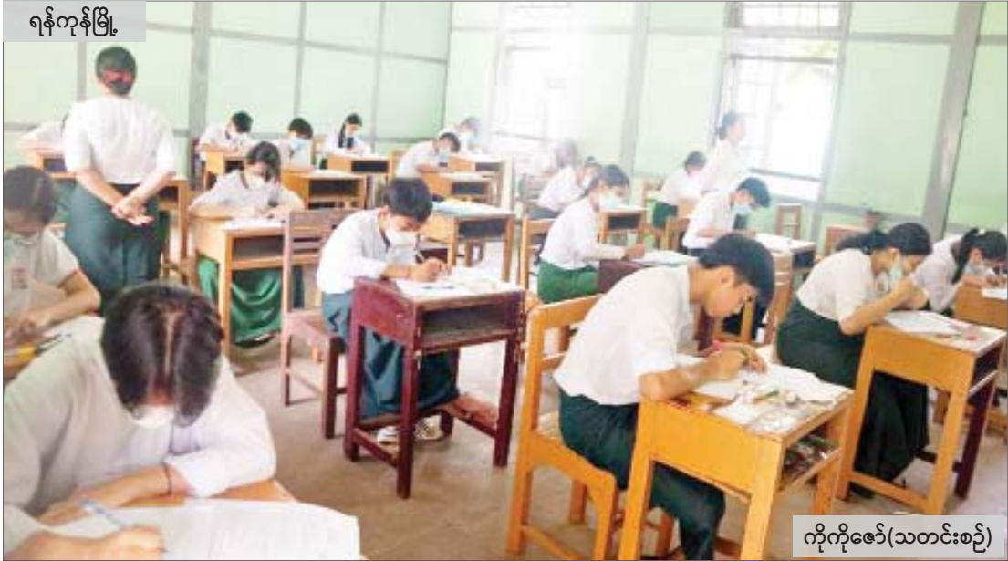
ရန်ကုန်မြို့

နိုင်ငံတစ်ဝန်း၌ ၂၀၂၂ ခုနှစ် တက္ကသိုလ်ဝင်စာမေးပွဲ(ဒုတိယနေ့)ကို ကျန်းမာရေးဝန်ကြီးဌာန၏ ကိုဗစ်-၁၉ ရောဂါ ကြိုတင်ကာကွယ်ရေးနည်းလမ်းများနှင့်အညီ စနစ်တကျကျင်းပလျက်ရှိရာ ယနေ့တွင် အင်္ဂလိပ်ဘာသာရပ် လာရောက်ဖြေဆိုသူ စုစုပေါင်း ၂၈၃၉၇ ဦး(၉၀ ဒသမ ၀၇ )ရာခိုင်နှုန်းရှိကြောင်း သိရပြီး ကျောင်းသား ကျောင်းသူများ အေးချမ်းစွာဖြေဆိုမှု မြင်ကွင်းများကို ဖော်ပြလိုက်ပါသည်-