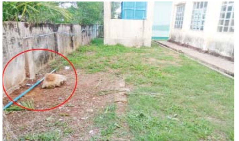
ရေဖြူမြို့ရှိ အခြေခံပညာအထက်တန်းကျောင်း အသံဖုံးပေါက်ကွဲသည့် နေရာ။

သိရသည်။ အဆိုပါပေါက်ကွဲမှုကြောင့် လူ၊ တိရစ္ဆာန်နှင့် အဆောက်အအုံများ ထိခိုက် ပျက်စီးမှုမရှိကြောင်း၊ တက္ကသိုလ်ဝင်တန်း စာမေးပွဲ ဒုတိယနေ့အဖြစ် အင်္ဂလိပ်စာ ဘာသာရပ်ကို ကျောင်းသား ကျောင်းသူ များက အေးချမ်းစွာဖြေဆိုနိုင်ခဲ့ကြောင်း နှင့် အဆိုပါ နေရာတစ်ဝိုက်အား လုံခြုံရေး တပ်ဖွဲ့ဝင်များ၊ ကျန်းမာရေးဝန်ထမ်းများ၊ မီးသတ်တပ်ဖွဲ့ဝင်များနှင့် ရပ်ကွက် အုပ်ချုပ်ရေးအဖွဲ့ဝင်များက စနစ်တကျ စောင့်ကြပ်ကြည့်ရှုပေးလျက်ရှိကြောင်း သိရသည်။ သတင်းစဉ်