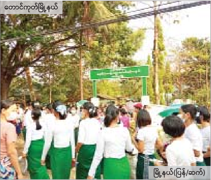
တောင်ကုတ်မြို့နယ်