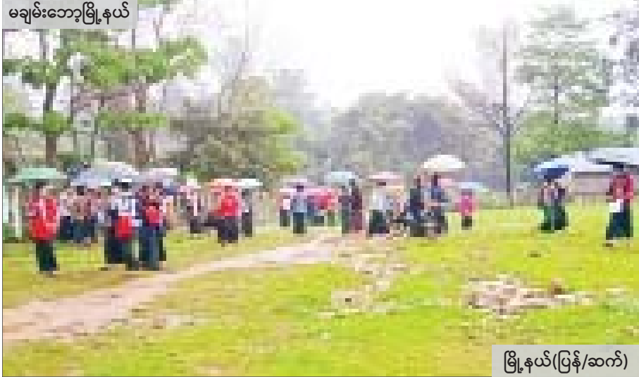
မချမ်းဘော့မြို့နယ်