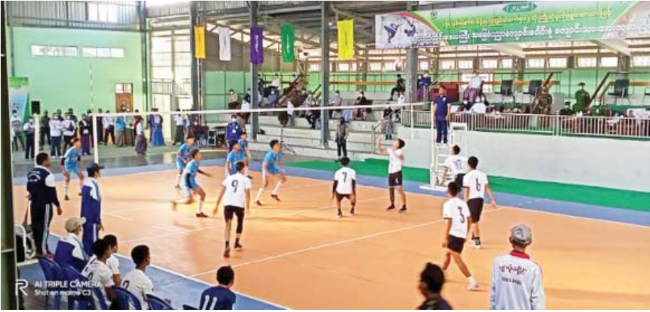
(၇၅)နှစ်မြောက် စိန်ရတုပြည်ထောင်စုနေ့အထိမ်းအမှတ် ဧရာဝတီတိုင်းဒေသကြီး အခြေခံပညာကျောင်းပေါင်းစုံ ဘော်လီဘောပြိုင်ပွဲ။

လူ့ဘဝသည် နိမ့်တိုမြင့်တိုပါ။ အတက်ရှိလျှင် အကျရှိသည်။ နိုင်သည်ရှိသလို ရှုံးသည်လည်းရှိသည်မှာ မဇ္ဈတာပါ။ အမြန်နိုင်သူမရှိသလို အမြဲရှုံးသူလည်းမရှိပါ။ ထိုသဘောကိုသိ၍ ခံနိုင်ရည်ရှိရန် ကျောင်းများတွင် အားကစားဖြင့် လေ့ကျင့်ပေးနေခြင်း