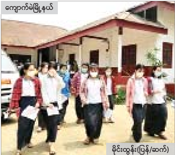
ကျောက်မဲမြို့နယ်