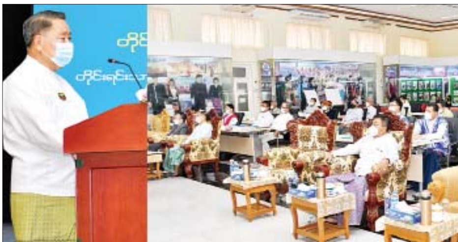
ပြည်ထောင်စုဝန်ကြီး ဦးစောထွန်းအောင်မြင့် တိုင်းရင်းသားကိုယ်စားလှယ်များ တွေ့ဆုံဆွေးနွေးမှု (ဖိုရမ်)ဖွင့်ပွဲအခမ်းအနားတွင် အမှာစကားပြောကြားစဉ်။

ရှေးဦးစွာ ပြည်ထောင်စုဝန်ကြီး ဦးစောထွန်း အောင်မြင့်က တိုင်းရင်းသားစည်းလုံးညီညွတ်မှု ပိုမိုရရှိရေးနှင့် ငြိမ်းချမ်းရေးဖော်ဆောင်မှု အထောက် အကူပြုစေရေးအတွက် ဆောင်ရွက်သင့်သည့်အချက် များကိုသိရှိပြီး သက်ဆိုင်ရာဌာန၊ အဖွဲ့အစည်းများနှင့် ပူးပေါင်းဆောင်ရွက်နိုင်ရန်၊ မြန်မာနိုင်ငံ၏ ငြိမ်းချမ်းရေးဖြစ်စဉ်များနှင့် ငြိမ်းချမ်းရေးအတွက်