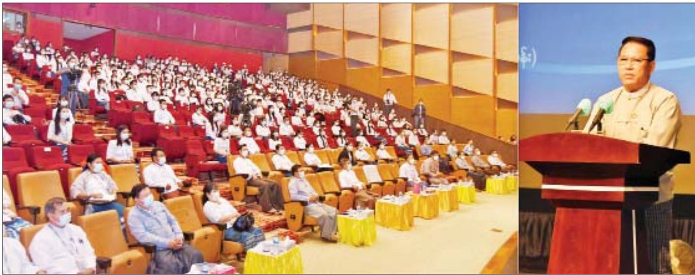
ပြည်ထောင်စုဝန်ကြီး ဦးမောင်မောင်အုန်း မြန်မာ့အသံနှင့် ရုပ်မြင်သံကြား ဝန်ထမ်းသစ်များ ကြိုဆိုပွဲနှင့် စွမ်းရည်မြှင့်တင်တန်းဖွင့်ပွဲတွင် အမှာစကားပြောကြားစဉ်။

ထို့နောက် ပြည်ထောင်စုဝန်ကြီး ဦးမောင်မောင် အုန်းက အမှာစကားပြောကြားရာတွင် မြန်မာ့အသံ နှင့် ရုပ်မြင်သံကြားအနေဖြင့် ပြောင်းလဲတိုးတက် နေသော နည်းပညာ၊ အတတ်ပညာများနှင့်အညီ စီစဉ်တင်ဆက်လျက်ရှိသည့် သတင်းနှင့် အစီအစဉ် များ အရည်အသွေးပိုမိုကောင်းမွန်စေရန်၊ Content ပိုင်းဆိုင်ရာ အသစ်အသစ်များ ဖန်တီးထုတ်လုပ်နိုင်ရန် အတွက် ဝန်ထမ်းအင်အားများ ပြည့်မီအောင် ဖြည့်တင်းရေးနှင့် ဝန်ထမ်းသစ်များ စွမ်းဆောင်ရည် မြှင့်တင်ရေးကို အလေးပေးဆောင်ရွက်လျက်ရှိ ကြောင်း၊ MRTV ၏ လုပ်ငန်းစဉ်များသည် တစ်ဦး တစ်ယောက်၊ တစ်ဖွဲ့တည်းနှင့် လုပ်ဆောင်၍မရဘဲ အားလုံးပူးပေါင်းလုပ်ဆောင်မှုနှင့်သာ အကောင် အထည်ဖော်ဆောင်ရွက်ရသည်ကို တွေ့မြင်ရမည် ဖြစ်ကြောင်း။