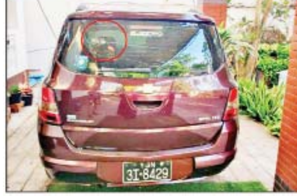
မတ် ၅ ရက်တွင် သင်္ဃန်းကျွန်းမြို့နယ် သုဝဏ္ဏ(၂၄)ရပ်ကွက် ဘော်စင်လမ်းသွယ်(၂)ရှိ အပြစ်မဲ့ပြည်သူ တစ်ဦး၏ နေအိမ်၌ ပေါက်ကွဲမှုဖြစ်ပွားခဲ့သည့် မှတ်တမ်းဓာတ်ပုံ။