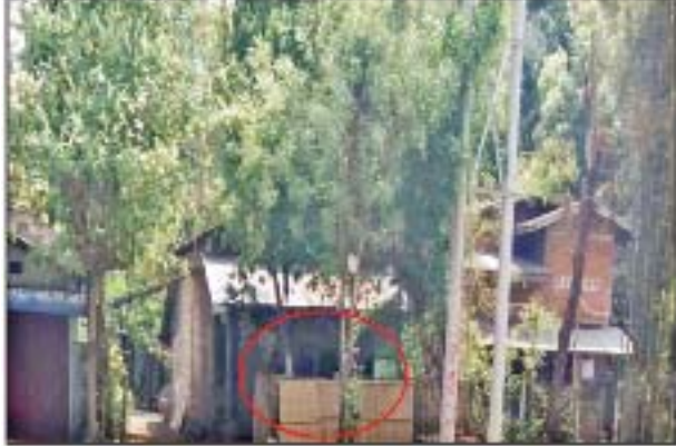
မတ် ၁၇ ရက်တွင် မှော်ဘီမြို့နယ် မြောင်းတကာကျေးရွာရှိ အပြစ်မဲ့ပြည်သူတစ်ဦး၏ နေအိမ်၌ ပေါက်ကွဲမှုဖြစ်ပွားခဲ့သည့် မှတ်တမ်းဓာတ်ပုံ။