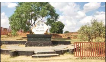
ဆောင်းပါး စာမျက်နှာ » ၆

ကမ္ဘာ့အမွေအနှစ်စာရင်းဝင် ပျူမြို့ဟောင်းသုံးမြို့ (ဟန်လင်း၊ ဗိဿနိုး၊ သရေခေတ္တရာ)