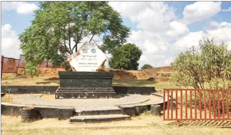
Heritage Committee) ၏ သဘောတူဆုံးဖြတ်ချက် များဖြင့် ကမ္ဘာ့အမွေအနှစ်အဖြစ် သတ်မှတ်ကာ စာရင်းဝင်နိုင်ငံဖြစ်စေပါသည်။

ကမ္ဘာ့အမွေအနှစ်စာရင်းဝင်အဖြစ် အဆိုပြုတင်သွင်းမှုလုပ်ငန်းစဉ် ကမ္ဘာ့အမွေအနှစ်အဖြစ် စာရင်းတင်သွင်း မည့်နိုင်သည့် မိမိအဆိုပြုတင်သွင်းမည့် ယဉ်ကျေး မှုဆိုင်ရာ(သို့မဟုတ်) သဘာဝဆိုင်ရာ ထူးခြား ထင်ရှားသည့်နေရာဒေသများကို ဦးစွာရှာဖွေ လေ့လာပြုစုမှုများ ဆောင်ရွက်ရမည်။ ယင်းပြုစု ထားသော အဆိုပြုတင်ပြလွှာကို ပဏာမစာရင်း (Tentative List) တင်သွင်းမှုဆောင်ရွက်ရပါသည်။ ပဏာမစာရင်း တင်သွင်းထားခြင်းမရှိသော နိုင်ငံ သည် ယင်းနိုင်ငံ၏ အမွေအနှစ်များကို ကမ္ဘာ့အမွေ အနှစ်အဖြစ် အဆိုပြုတင်သွင်းခွင့် မရနိုင်ပေ။ ထို့နောက် တင်သွင်းလာသော အဆိုပြုနေရာဒေသ များကို ကမ္ဘာ့အမွေအနှစ်ကော်မတီ (World