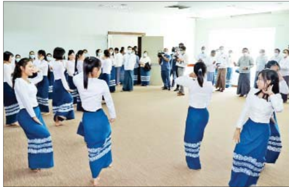
ပြည်ထောင်စုဝန်ကြီး ဦးမောင်မောင်အုန်း မဟာသင်္ကြန်တွင် နေပြည်တော်ရှိ မဏ္ဍပ်များ၌ လှည့်လည် သီဆိုကပြဖျော်ဖြေကြမည့် ပြန်ကြားရေးဝန်ကြီးဌာန ကိုယ်စားပြု မြန်မာ့အသံနှင့် ရုပ်မြင်သံကြားမှ ဝန်ထမ်းများ၏ သင်္ကြန်ယိမ်းအကများ ကြိုတင်ပြင်ဆင်လေ့ကျင့်နေမှုကို ကြည့်ရှုအေးပေးစဉ်။

ဆက်လက်၍ မြန်မာ့အသံနှင့် ရုပ်မြင်သံကြား ၏ နေ့လေးထိန်းကျောင်းသို့ ရောက်ရှိပြီး ဝန်ထမ်းများ၏ သားသမီးများအတွက် စီစဉ် ဆောင်ရွက်ပေးနေမှုများကို ကြည့်ရှုစစ်ဆေးကာ ကလေးများအတွက် သင်္ကြန်ရေပက်ကစားစရာအရပ် များ ပေးအပ်ခဲ့သည်။ သတင်းစဉ်