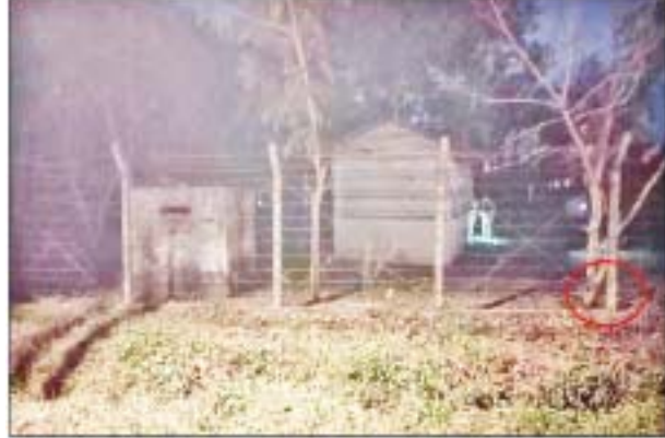
ဖေဖော်ဝါရီ ၂၁ ရက်တွင် မင်္ဂလာဒုံမြို့နယ်ရှိ တပ်ဝင်းအနီး၌ ပေါက်ကွဲမှုဖြစ်ပွားခဲ့သည့် မှတ်တမ်းဓာတ်ပုံ။