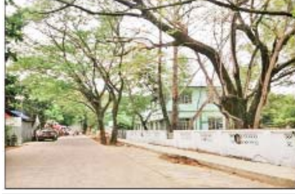
ဖေဖော်ဝါရီ ၂၆ ရက်တွင် မြောက်ဥက္ကလာပမြို့နယ် အမှတ်(၁) အခြေခံပညာ အထက်တန်းကျောင်းဝင်းအနီး၌ လက်လုပ်မိုင်း ပေါက်ကွဲခဲ့သည့် မှတ်တမ်းဓာတ်ပုံ။