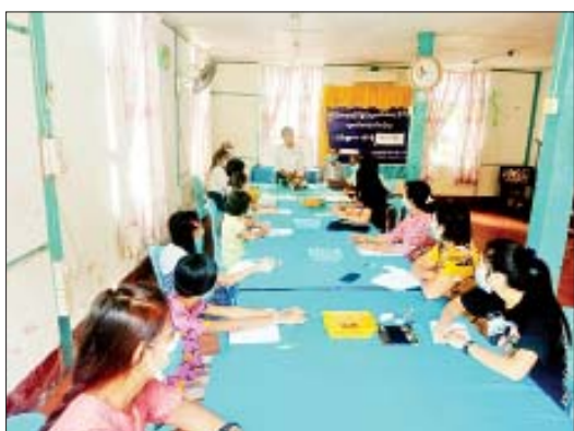
မတ် ၂၀ ရက်အထိ နေ့စဉ် နံနက် ၁၀ နာရီမှ မွန်းတည့် ၁၂ နာရီအထိ စာတွေ့လက်တွေ့ သင်ကြားပို့ချသွားမည်ဖြစ် ကြောင်း သိရသည်။

ကျောင်းသားများ အတွက် ငွေကျပ် ငါးသိန်းကို ပေးအပ်ခဲ့ရာ အလုံတပ်မြို့ အမှတ်(၂) အခြေခံပညာအထက်တန်းကျောင်းမှ ကျောင်း အုပ်ကြီးက လက်ခံရယူပြီး အနောက်မြောက် တိုင်းစစ်ဌာနချုပ် တိုင်းမှူး ဗိုလ်မှူးချုပ်သန်းထိုက်က အားကစားပစ္စည်းများ ထောက်ပံ့ပေးအပ်ရာ ဆရာမ တစ်ဦးက လက်ခံရယူခဲ့ကြောင်း သိရသည်။ တိုင်းဒေသကြီး(ပြန်/ဆက်)