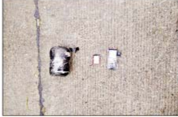
မတ် ၁၇ ရက်တွင် မှော်ဘီမြို့နယ် မြောင်းတကာကျေးရွာရှိ အပြစ်မဲ့ပြည်သူတစ်ဦး၏ နေအိမ်၌ ပေါက်ကွဲမှုဖြစ်ပွားခဲ့သည့် မှတ်တမ်းဓာတ်ပုံ။