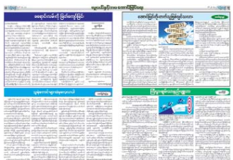
စာမျက်နှာ » ၁၈၊ ၁၉