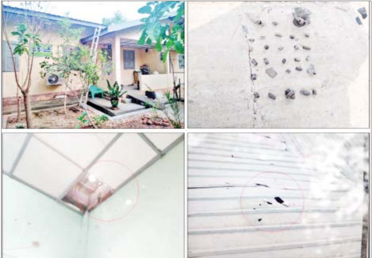
မုံရွာမြို့စီးပွားရေးတက္ကသိုလ်အား PDF အမည်ခံအကြမ်းဖက်သမားများက လက်လုပ်စိန်ပြောင်းဖြင့် ပစ်ခတ်ခဲ့သည့် မှတ်တမ်းဓာတ်ပုံများ။