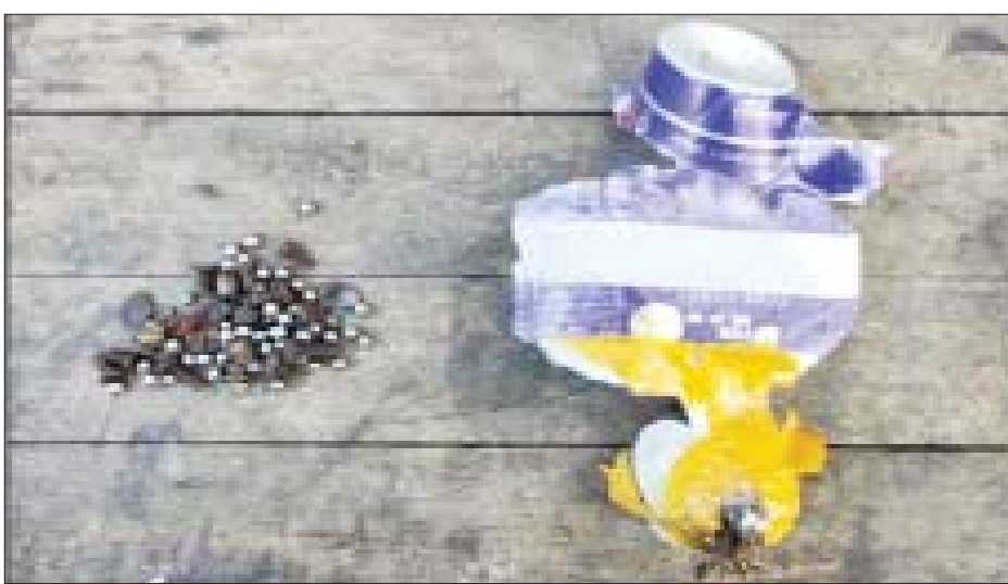
မြောက်ဥက္ကလာပမြို့နယ်၌ မြို့နယ်ပညာရေးမှူးရုံးအား လက်လုပ်ဗုံးဖြင့် ပစ်ပေါက်မှု မှတ်တမ်းဓာတ်ပုံ။