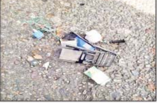
ဖေဖော်ဝါရီ ၁၅ ရက်တွင် မြောက်ဥက္ကလာပမြို့နယ် (၁၆)ရပ်ကွက်ရှိ လျှပ်စစ်ရုံးရှေ့၌ လက်လုပ်မိုင်းပေါက်ကွဲခဲ့သည့် မှတ်တမ်းဓာတ်ပုံ။