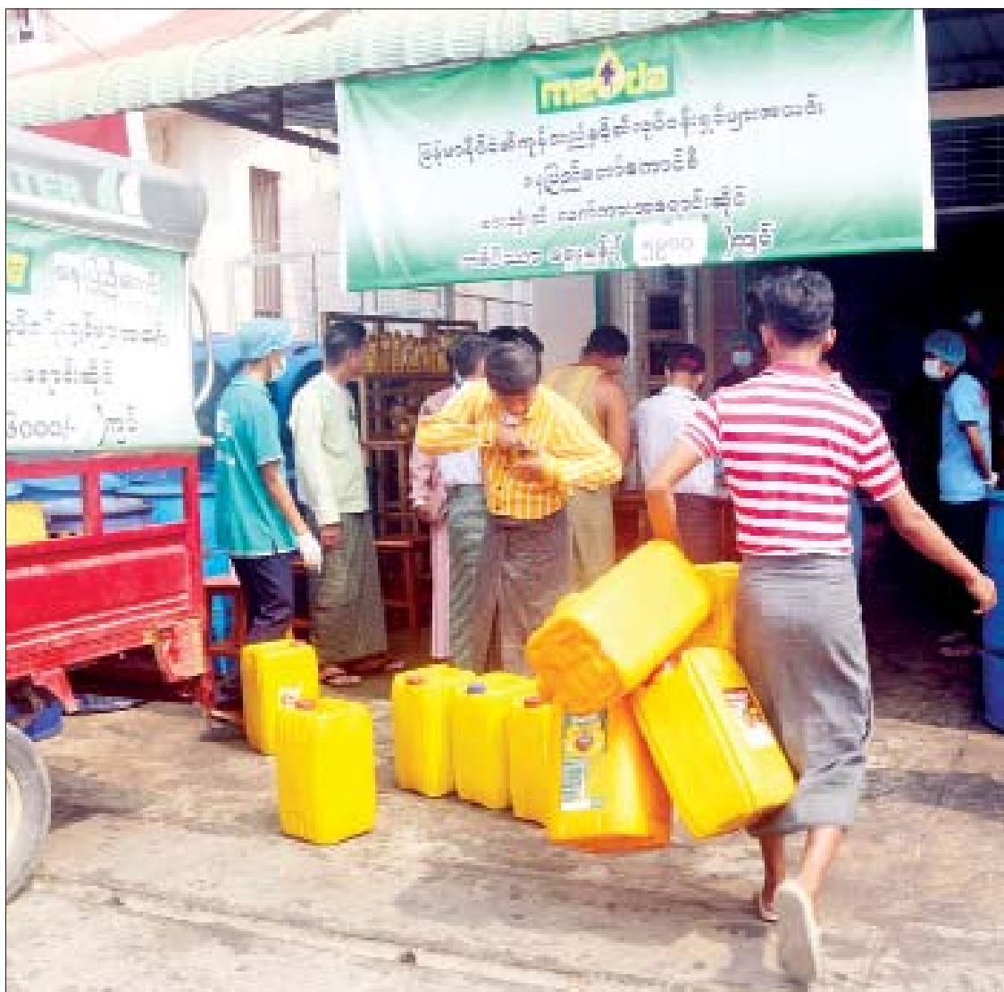
နေပြည်တော်ကောင်စီ ဆီကုန်သည်နှင့် ဆီလုပ်ငန်းရှင်များအသင်း၏ စားသုံးဆီ လက်ကားအရောင်းဆိုင်၌ စားသုံးသူ ပြည်သူများကို သက်သာသောဈေးနှုန်းဖြင့် စားသုံးဆီများ ရောင်းချပေးနေစဉ်။

နေပြည်တော် မတ် ၂၈ နေပြည်တော်ကောင်စီ ဆီကုန်သည်နှင့် ဆီလုပ်ငန်းရှင်များအသင်း ရုံးခန်းဖွင့်လှစ်ခြင်း အခမ်းအနားကို ယနေ့ နံနက်ပိုင်းတွင် နေပြည်တော်ကောင်စီ နယ်မြေ မြေသီရိမြို့နယ် မြို့မဈေးပွဲရုံတန်း(၁/၂၃၈)၌ ကျင်းပခဲ့ပြီး စားသုံးသူ ပြည်သူများကို သက်သာသော ဈေးနှုန်းဖြင့် စားသုံးဆီများကို ဖြန့်ဖြူးရောင်းချပေးလျက်ရှိကြောင်း သိရသည်။