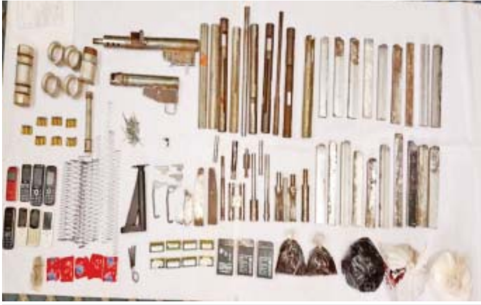
မတ် ၂၂ ရက်တွင် မင်္ဂလာဒုံမြို့နယ် ပုလဲမြို့သစ် ဥက္ကလာပမြို့နယ် အမှတ်(၁၆၄)၌ သိမ်းဆည်းရမိခဲ့ သည့် ပစ္စည်းများ၏ မှတ်တမ်းဓာတ်ပုံ။