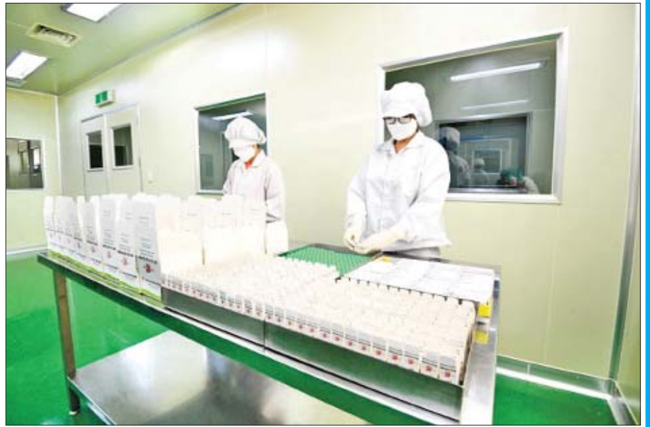
Myancopharm ကိုဗစ်-၁၉ ရောဂါ ကာကွယ်ဆေး ထုတ်ပိုးနေမှုကို တွေ့ရစဉ်။