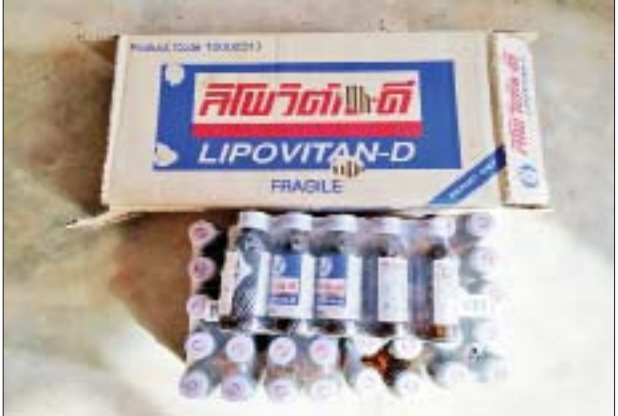
ကရင်ပြည်နယ် ကော့ကရိတ် (တံတားကျိုး) စုပေါင်းစစ်ဆေးရေး စခန်း၌ တရားမဝင် စားသောက်ကုန်ပစ္စည်းများ သိမ်းဆည်းရမိမှုကို တွေ့ရစဉ်။

နေပြည်တော် မတ် ၂၂ တရားမဝင် ကုန်သွယ်မှု တိုက်ဖျက်ရေး ဦးဆောင် ကော်မတီ၏ ကြီးကြပ်ကွပ်ကဲ မှုဖြင့် တရားမဝင်ကုန်သွယ်မှု များကို ဥပဒေနှင့်အညီ ထိရောက် စွာ တားဆီးအရေးယူနိုင်ရေး ဆောင်ရွက်လျက်ရှိရာ မတ် ၁၉ ရက်တွင် ရန်ကုန်တိုင်းဒေသကြီး တရားမဝင် ကုန်သွယ်မှု တိုက်ဖျက်ရေး အထူးအဖွဲ့၏ စီမံခန့်ခွဲမှုဖြင့် တိုင်းဒေသကြီး သစ်တောဦးစီးဌာန ဦးဆောင် သော ပူးပေါင်းစစ်ဆေးရေးအဖွဲ့ သည် စစ်ဆေးမှုများ ဆောင်ရွက် ခဲ့ရာ ရန်ကုန်မြောက်ပိုင်းခရိုင် လှည်းကူးမြို့နယ် ရန်ကုန်- မန္တလေး အမြန်လမ်းမကြီး မိုင်တိုင်(၀/၇) တိုးဂိတ်အနီး၌ တရားမဝင်ကျွန်းခွဲသား သူညီ ဒသမ ၄၉၆၆ တန် ခန့်မှန်းတန်ဖိုး ငွေကျပ် ၁၄၈၉၈၀ နှင့် အဆိုပါ သစ်များ တင်ဆောင်လာသော IPSUM အမျိုးအစား ယာဉ်တစ်စီး (ခန့်မှန်း တန်ဖိုးငွေကျပ် ၁၅၀၀၀၀၀) စုစုပေါင်း ခန့်မှန်း တန်ဖိုးငွေကျပ် ၁၅၁၄၈၉၈၀ သိမ်းဆည်းရမိခဲ့ပြီး သစ်တော ဥပဒေနှင့်အညီ အရေးယူ ဆောင်ရွက်လျက်ရှိသည်။ ထို့အတူ မတ် ၂၁ ရက်တွင် အကောက်ခွန် ဦးစီးဌာန၏ စီမံခန့်ခွဲမှုဖြင့် မြန်ပြည်နယ် မရမ်းချောင်း အမြဲတမ်းစစ်ဆေး ရေးစခန်း၌ တာဝန်ကျူးပေါင်း