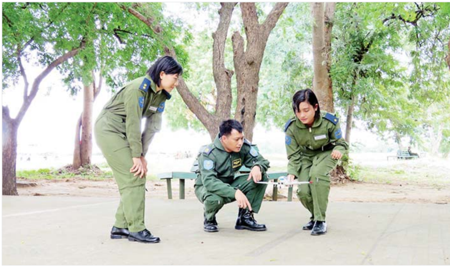
တပ်မတော်(လေ)က သင်တန်းပေးနေသည့် အမျိုးသမီး လေသူရဲအရာရှိများ။

စာမျက်နှာ ၆ မှ တစ်ရပ်မရှိခဲ့ခြင်းကြောင့် မိမိတို့ထက် လူလက်နက် အင်အားအရာတွင် အဆများစွာ သာလွန်သည့် ဗြိတိသျှနယ်ချဲ့တို့အား အားမတန်၍ မာန်လျှော့ ခဲ့ခြင်းဖြစ်သည်ကို နိုင်ငံသားအားလုံး အသိပင် ဖြစ်သည်။ မြန်မာလူမျိုးတို့သည် ဓားကိုဓားချင်း၊ လှံကို လှံချင်း အသက်ချင်းလဲ၍ ယှဉ်ပြိုင်တိုက်ခိုက် နိုင်သူများဖြစ်ကြသော်လည်း အင်္ဂလိပ်-မြန်မာ စစ်ပွဲများတွင် ဓားနှင့် သေနတ်၊ လှံနှင့် အမြောက် ယှဉ်ပြိုင်ခဲ့ခြင်း ဖြစ်သည်။