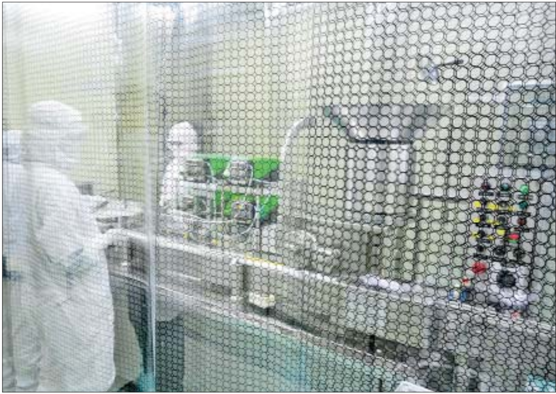
Myancopharm ကိုဗစ်-၁၉ ရောဂါ ကာကွယ်ဆေး ထုတ်လုပ်နေမှုကို တွေ့ရစဉ်။

၂၀၁၉ ခုနှစ် ဒီဇင်ဘာလ ၃၁ ရက်နေ့တွင် တရုတ်ပြည်သူ့သမ္မတနိုင်ငံ ဂူဟန်မြို့၌ စတင်ဖြစ်ပွားသည့် ကိုဗစ်-၁၉ ရောဂါသည် ယခုအချိန်အထိဆိုလျှင် အချိန်ကာလအားဖြင့် နှစ်နှစ်နှင့်သုံးလနီးပါး ကြာမြင့်ပြီဖြစ်ကြောင်း တွေ့ရှိရပါသည်။ ၂၀၂၂ ခုနှစ် မတ်လ ၂၀ ရက်နေ့အထိ ကမ္ဘာပေါ်တွင် ကိုဗစ်-၁၉ ရောဂါ ဖြစ်ပွားသူ သန်းပေါင်း ၄၇၀ ကျော်ရှိပြီး သေဆုံးသူ ၆ ဒသမ ၁ သန်းကျော်သွားပြီ ဖြစ်ပါသည်။ မြန်မာနိုင်ငံတွင်လည်း ကျန်းမာရေးဝန်ကြီးဌာနမှ ကိန်းဂဏန်းအချက်အလက်များအရ ကိုဗစ်-၁၉ ရောဂါ ဖြစ်ပွားသူ ၆၀၈၇၆၃ ဦးရှိပြီး သေဆုံးသူ ၁၉၄၂၃ ဦး ရှိပြီဖြစ်ကြောင်း တွေ့ရှိရပါသည်။ ကိုဗစ်-၁၉ ရောဂါအား လုံးဝကင်းစင်အောင် ပြုလုပ်နိုင်စွမ်း မရှိသေးခြင်းကြောင့် ကိုဗစ်-၁၉ ရောဂါနှင့်အတူ ယှဉ်တွဲနေထိုင်ရေးအတွက် ကာကွယ်ဆေးများကို လူတိုင်းထိုးနှံနိုင်ရေးနှင့် စွမ်းအားမြှင့် “Booster” ထိုးနှံနိုင်ရေးတို့အတွက် ကိုဗစ်-၁၉ ရောဂါ ကာကွယ်ဆေးအား ပြည်တွင်း၌ ထုတ်လုပ်နိုင်ရေးမှာ အရေးကြီးသော အခန်းကဏ္ဍမှ ပါဝင်နေကြောင်း တွေ့ရှိရပါသည်။