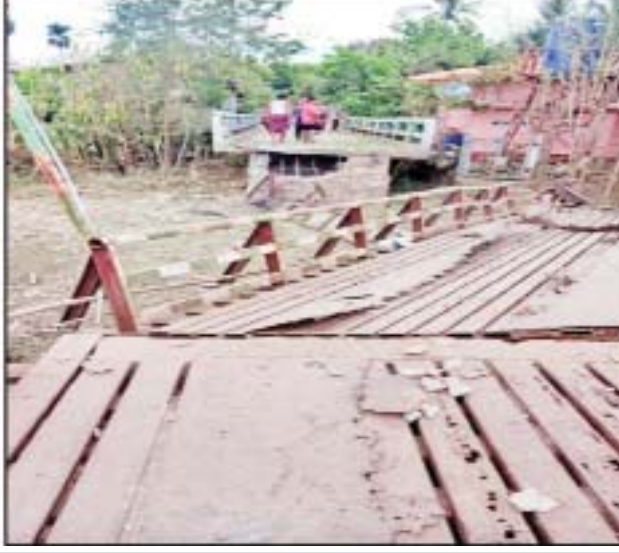
ကျိုက်ထိုမြို့နယ် စစ်တောင်းကျေးရွာနှင့် ခဝါချောင်းကျေးရွာချင်းဆက်လမ်းပေါ်ရှိ သံပေါင်ဘေလီတံတားအား အကြမ်းဖက်သမားများက မိုင်းထောင်ဖောက်ခွဲဖျက်ဆီးမှု မှတ်တမ်းဓာတ်ပုံ။