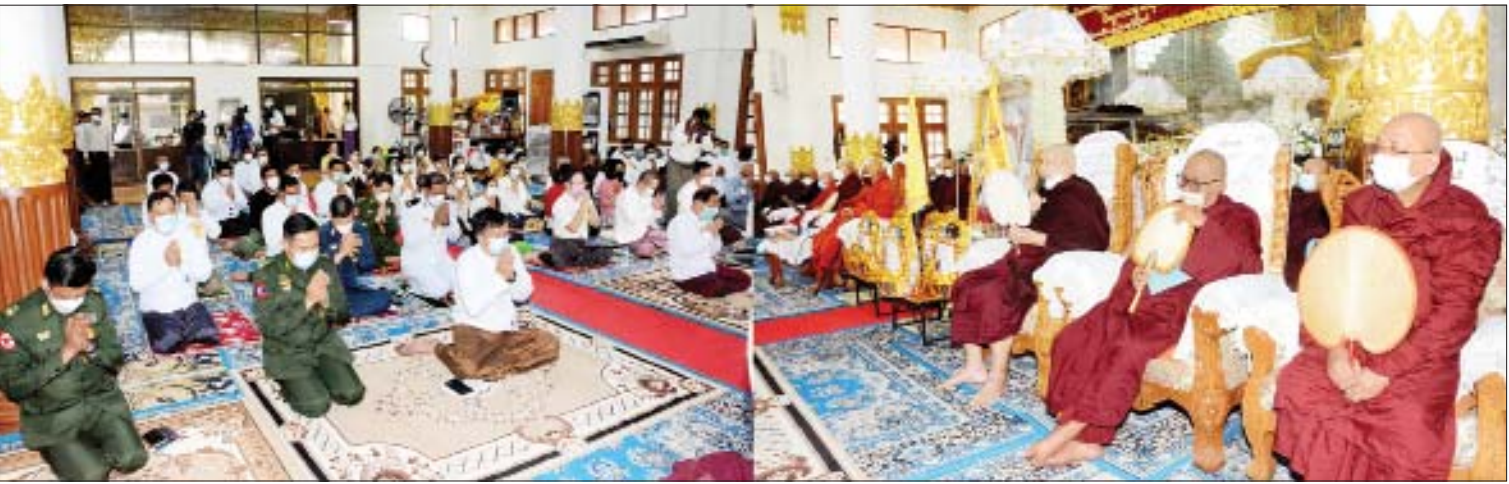
နိုင်ငံတော်စီမံအုပ်ချုပ်ရေးကောင်စီ အတွင်းရေးမှူး ဒုတိယဗိုလ်ချုပ်ကြီးအောင်လင်းဒွေး၊ ပြည်ထောင်စုဝန်ကြီး ဦးကိုကိုနှင့် တာဝန်ရှိသူများ ဒေါပုံမြို့ သာသနာ့အလင်းရောင်ကျောင်းတိုက် ပဓာနနာယက ရန်ကုန်တိုင်း ဝိနည်းပြန်ဌာန အကျိုးတော်ဆောင်ဆရာတော် ဘဒ္ဒန္တဇောတိကထံမှ ငါးပါးသီလ ခံယူဆောက်တည်ကြစဉ်။

ရန်ကုန် မတ် ၂၂ ရန်ကုန်တိုင်းဒေသကြီး မရမ်းကုန်း မြို့နယ် ဝိဇ္ဇောတာရုံစာသင်တိုက် ဦးစီးပဓာန မဟာနာယက ရွှေကျင်နိကာယာဓိပတိဥက္ကဋ္ဌ မဟာနာယက ဓမ္မသေနာပတိ ပန္နရသမ ရွှေကျင်သာသနာပိုင် အဘိဓမ္မမဟာရဋ္ဌဂုရု အဘိဓမ္မအဂ္ဂမဟာသဒ္ဓမ္မဇောတိက နိုင်ငံတော်ဩဝါဒါစရိယ သက်တော်(၉၃)နှစ် သိက္ခာဝါတော် (၇၃) ဝါ ဝိဇ္ဇောတာရုံဆရာတော်ဘုရားကြီး၏ အန္တိမအဂ္ဂိဈာပန သာဓုကိဋ္ဌန ပူဇာအခမ်းအနားကို ယနေ့ မွန်းလွဲ ၁ နာရီတွင် အဆိုပါကျောင်းတိုက်ရှိ သီလဝိသောဇောဓိဓမ္မသင်္ဂါယနာတော်ကြီး၌ ကျင်းပသည်။ အခမ်းအနားသို့ သီတဂူကမ္ဘာ့ဗုဒ္ဓတက္ကသိုလ်ကြီးများနှင့် သီတဂူဆေးရုံများ၏ အဓိပတိ ရွှေကျင်နိကာယ ဥပဥက္ကဋ္ဌ မဟာနာယက တွဲဖက်ရွှေကျင်သာသနာပိုင် အဘိဓမ္မမဟာရဋ္ဌဂုရု အဘိဓမ္မ အဂ္ဂမဟာသဒ္ဓမ္မဇောတိက ဒေါက်တာဘဒ္ဒန္တဉာဏိဿရ သီတဂူဆရာတော်ကြီး အမှူးပြုသော ဆရာတော်ကြီးများ၊ သံဃာတော်များ ကြွရောက်တော်မူကြပြီး နိုင်ငံတော်စီမံအုပ်ချုပ်ရေး