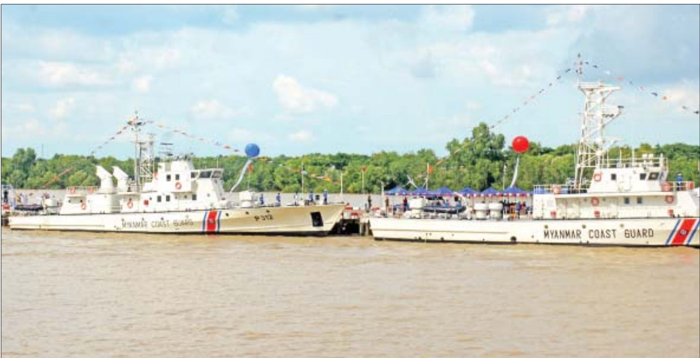
မြန်မာနိုင်ငံ ကမ်းခြေစောင့်တပ်ဖွဲ့ Myanmar Coast Guard

ပထမမြန်မာနိုင်ငံတော်ကြီးကို တည်ထောင်ခဲ့သူ ပထမမြန်မာနိုင်ငံတော်ကြီးကို တည်ထောင် ခဲ့သူဟု သမိုင်းမှတ်တမ်းတွင်ခုံညား အနော်ရထာ မင်း(အေဒီ ၁၀၄၄-၁၀၇၇)သည် နိုင်ငံတော်၏ ကာကွယ်ရေးအင်အား တောင့်တင်းခိုင်မာစေရန် အတွက် ပဒေသရာဇ်မြို့ပြနိုင်ငံများဖြစ်သည့် သထုံ၊ ပဲခူး၊ ရခိုင် စသည့် နယ်ပယ်များကို မိမိကြံဉာဏ်အာဏာ အောက်ကို သိမ်းသွင်းခဲ့သည်။ စစ်သည်ရဲမက် များကို ဖွဲ့စည်းရာ၌ ကျေးရွာ၊ မြို့နယ်၊ ခရိုင်တို့၏ အင်အားအလိုက် ရာပြုမြို့၊ ထောင်ပြုမြို့များ သတ်မှတ်တည်ထောင်ခဲ့သည်။ နိုင်ငံတော်ကာကွယ် ရေးအတွက် အရေးအခင်း ပေါ်ပေါက်လာသည့်အခါ ယင်းခရိုင် မြို့ရွာများမှ သတ်မှတ်ဦးရေအတိုင်း လက်နက်ကိုင်တပ်ဖွဲ့များ စုစည်းစေလွှတ်ပေး ရသည်။ အေဒီ ၁၀၆၀ ပြည့်နှစ်ခန့်က နန်းစောနှင့် အခြား ပြည်ပကျူးကျော်မှုအန္တရာယ်များကို ခုခံ