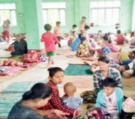
ရောဂါတိုင်းဒေသကြီးအတွင်းရှိ ဒေသပြည်သူများ ယာယီပြင်ဆင်ထားသော မှန်တိုင်းဒေသအဆောက်အအုံများတွင် ပြောင်းရွှေ့ခိုလှုံနေကြစဉ်။

နေပြည်တော် မတ် ၂၂ ရခိုင်ပြည်နယ်အတွင်းရှိ မြို့နယ် များအလိုက် သဘာဝဘေးအန္တရာယ် ဆိုင်ရာ စီမံခန့်ခွဲမှုအဖွဲ့များဖြင့် မြို့နယ်၊ ကျေးရွာအသီးသီးတွင် သဘာဝဘေး အန္တရာယ်ဆိုင်ရာ ကြိုတင်သတိပေးခြင်း များ၊ မှန်တိုင်းနှင့် သဘာဝဘေးအန္တရာယ် ကျရောက်ပါက တုံ့ပြန်ဆောင်ရွက်နိုင်ရန် ကြိုတင်ပြင်ဆင်ခြင်းများ၊ အရေးပေါ် ဖြစ်ပေါ်လာပါက စုဝေးရမည့်နေရာနှင့် လမ်းကြောင်းများ၊ ပြောင်းရွှေ့နေထိုင် ရမည့် အဆောက်အအုံနေရာများကို ကြိုတင်ပြင်ဆင်ခြင်းများ၊ ဦးစားပေး ကယ်ဆယ်ရမည့် အုပ်စုများအား အရေးပေါ် အသက်ကယ်ဆယ်နည်းများ ဖြင့် ဆောင်ရွက်ရမည့် နည်းလမ်းများကို စနစ်တကျလမ်းညွှန်အသိပေးခြင်းများနှင့် အချိန်နှင့်တစ်ပြေးညီ သတင်းရယူ ပူးပေါင်းဆောင်ရွက်နိုင်ရန် ပြည်နယ် အစိုးရရုံး၌ command center ဖွင့်လှစ် ထားပြီး တပ်မတော်နှင့် ဌာနဆိုင်ရာ တာဝန်ရှိသူများက ၂၄ နာရီ စုပေါင်းရုံး ဖွင့်လှစ်ဆောင်ရွက်လျက်ရှိသည်။