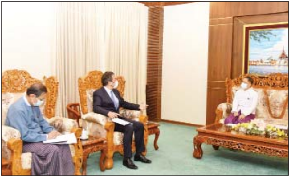
သတင်းစဉ်

နေပြည်တော် မတ် ၂၂ အပြည်ပြည်ဆိုင်ရာပူးပေါင်းဆောင်ရွက်ရေးဝန်ကြီးဌာန ပြည်ထောင်စုဝန်ကြီး ဦးကိုကိုလှိုင်သည် အပြည်ပြည်ဆိုင်ရာကြက်ခြေနီကော်မတီ (ICRC) ၏ မြန်မာနိုင်ငံဆိုင်ရာ ဌာနကော်မတီလှယ် Mr. Stephan Sakalian အား ယနေ့ မွန်းတည့် ၁၂ နာရီတွင် အပြည်ပြည်ဆိုင်ရာပူးပေါင်းဆောင်ရွက်ရေးဝန်ကြီးဌာန ပြည်ထောင်စုဝန်ကြီး၏ ဧည့်ခန်းမ၌ လက်ခံတွေ့ဆုံသည်။ တွေ့ဆုံစဉ် ICRC မှ ပေးအပ်နေသည့် လူသားချင်းစာနာထောက်ထားမှုဆိုင်ရာအကူအညီများနှင့် မြန်မာနိုင်ငံနှင့် ICRC အကြား ပိုမိုပူးပေါင်းဆောင်ရွက်နိုင်ခြေရှိသည့်နယ်ပယ်များအပေါ် အမြင်ချင်းဖလှယ် ဆွေးနွေးခဲ့ကြသည်။