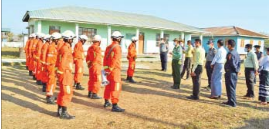
ဆောင်ရွက်နိုင်ရေးအတွက် ကျေးတောရွာရှိ အခြေခံ ပညာအလယ်တန်းကျောင်း၌ တပ်ဖွဲ့ဝင်များ အသင့် စုဖွဲ့ပြင်ဆင်ထားရှိမှုများကို တာဝန်ရှိသူများက သွားရောက်ကြည့်ရှုပြီး လိုအပ်သည်များ ပေါင်းစပ်ညှိနှိုင်း ဆောင်ရွက်ပေးခဲ့ကြောင်း သိရသည်။ သတင်းစဉ်

သဘာဝဘေးအန္တရာယ်ကျရောက်ပါက တုံ့ပြန် ဆောင်ရွက်နိုင်ရန် ကြိုတင်ပြင်ဆင်ဆောင်ရွက် ထားမှုများ၊ အရေးပေါ်ဖြစ်ပေါ်လာပါက စုဝေးရမည့် နေရာနှင့် လမ်းကြောင်းများ၊ ကူညီကယ်ဆယ်ရမည့် သက်ကြီးရွယ်အိုများ၊ နာမကျန်းသူများ၊ ကိုယ်ဝန် ဆောင်နှင့် ကလေးသူငယ်များ၊ မသန်စွမ်းသူများအား စာရင်းကောက်ယူခြင်း၊ ရှေးဦးသူနာပြုစုနည်းများ အရေးပေါ်အသက်ကယ်ဆယ်နည်းများဖြင့် ပိုင်းဝန်း ဆောင်ရွက်ကြရမည့်နည်းလမ်းများ၊ သဘာဝဘေး အန္တရာယ်စီမံခန့်ခွဲမှုကော်မတီ၏ လမ်းညွှန်ချက်များ စသည်တို့နှင့်ပတ်သက်၍ သက်ဆိုင်ရာကဏ္ဍအလိုက် တာဝန်ရှိသူများက ရှင်းလင်းဆေးနွေးပြောကြား သည်။ ထို့နောက် စစ်တွေမြို့ မြို့နယ်စီးသတ်တပ်ဖွဲ့က သဘာဝဘေးအန္တရာယ် ကျရောက်လာပါက အချိန် နှင့်တစ်ပြေးညီ ကူညီကယ်ဆယ်ရေးလုပ်ငန်းများ