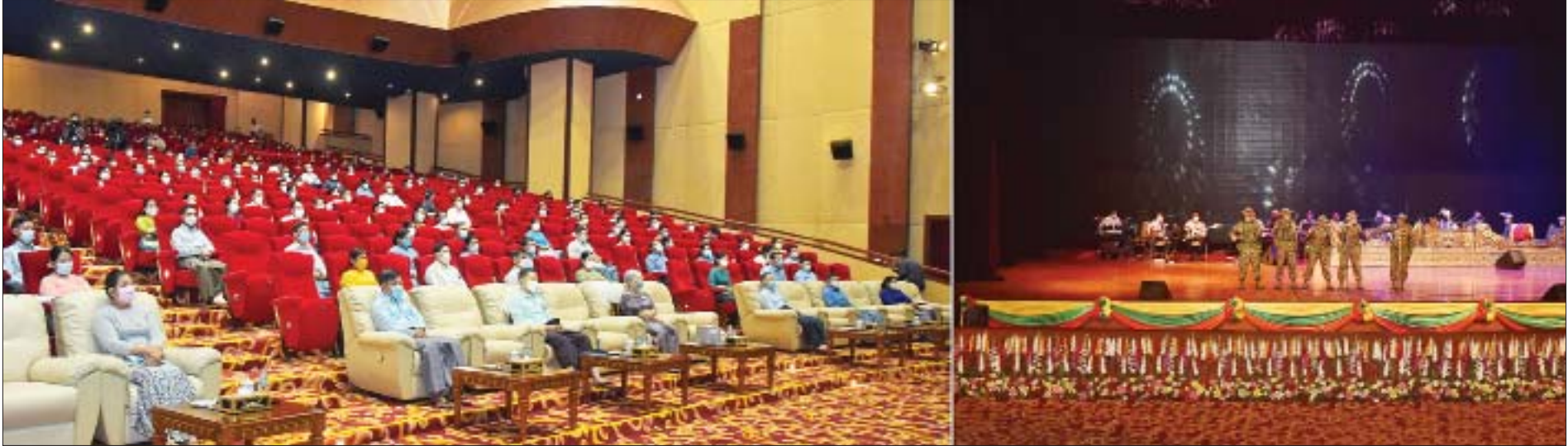
နိုင်ငံတော်စီမံအုပ်ချုပ်ရေးကောင်စီ ဒုတိယဥက္ကဋ္ဌ ဒုတိယတပ်မတော်ကာကွယ်ရေးဦးစီးချုပ် ကာကွယ်ရေးဦးစီးချုပ်(ကြည်း) ဒုတိယဗိုလ်ချုပ်မှူးကြီးစိုးဝင်းနှင့် ဇနီး ဒေါ်သန်းသန်းနွယ်၊ ကာကွယ်ရေး ဦးစီးချုပ်ရုံးမှ တပ်မတော်အရာရှိကြီးများနှင့် ဇနီးများ၊ အရာရှိ၊ စစ်သည်များ၊ မိသားစုဝင်များ (၇၇)နှစ်မြောက် တပ်မတော်နေ့ ဂုဏ်ပြုဂီတဖျော်ဖြေပွဲကို ကြည့်ရှုအားပေးစဉ်။

နေပြည်တော် မတ် ၂၂ ၂၀၂၂ ခုနှစ် မတ် ၂၇ ရက်တွင် ကျရောက်သည့် (၇၇)နှစ်မြောက် တပ်မတော်နေ့ကို ဂုဏ်ပြုသောအားဖြင့် နိုင်ငံကျော် အနုပညာရှင်များက ဂီတဖျော်ဖြေပွဲကို ယနေ့ညပိုင်းတွင် နေပြည်တော်ရှိ ဇေယျာသီရိဗိမာန် သဘင်ဆောင်၌ ကျင်းပသည်။ အဆိုပျော်ဖြေပွဲတွင် နိုင်ငံကျော် အနုပညာရှင်များက မြဝတီ တေးဂီတအဖွဲ့နှင့် တွဲဖက်၍ မြန်မာသံစဉ်တေးသီချင်းများနှင့် ခေတ်ပေါ် တေးသီချင်းများကို သီဆိုဖျော်ဖြေကြသည်။ ဖျော်ဖြေပွဲသို့ နိုင်ငံတော်စီမံအုပ်ချုပ်ရေးကောင်စီ ဒုတိယဥက္ကဋ္ဌ ဒုတိယတပ်မတော်ကာကွယ်ရေးဦးစီးချုပ် ကာကွယ်ရေးဦးစီးချုပ်(ကြည်း) ဒုတိယဗိုလ်ချုပ်မှူးကြီးစိုးဝင်းနှင့် ဇနီး ဒေါ်သန်းသန်းနွယ်၊ ကာကွယ်ရေး ဦးစီးချုပ်ရုံးမှ တပ်မတော်အရာရှိကြီးများနှင့် ဇနီးများ၊ အရာရှိ၊ စစ်သည် များ၊ မိသားစုဝင်များ တက်ရောက်ကြည့်ရှုအားပေးကြသည်။ ဂုဏ်ပြုတေးဂီတဖျော်ဖြေပွဲအပြီးတွင် နိုင်ငံတော်စီမံအုပ်ချုပ်ရေး ကောင်စီ ဒုတိယဥက္ကဋ္ဌ ဒုတိယတပ်မတော်ကာကွယ်ရေးဦးစီးချုပ် ကာကွယ်ရေးဦးစီးချုပ်(ကြည်း) ဒုတိယဗိုလ်ချုပ်မှူးကြီးစိုးဝင်းနှင့် ဇနီး၊ တာဝန်ရှိသူများက သီဆိုဖျော်ဖြေခဲ့ကြသည့် အနုပညာရှင်များကို ရင်းရင်းနှီးနှီး လိုက်လံနှုတ်ဆက်ခဲ့ကြကြောင်း သိရသည်။ သတင်းစဉ်