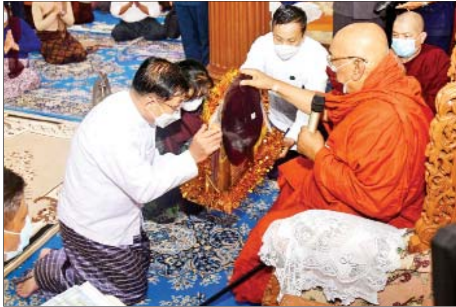
နိုင်ငံတော်စီမံအုပ်ချုပ်ရေးကောင်စီဥက္ကဋ္ဌ နိုင်ငံတော်ဝန်ကြီးချုပ် ဗိုလ်ချုပ်မှူးကြီးမင်းအောင်လှိုင် နှင့်ဇနီး ဒေါ်ကြူကြူလှ သီတဂူကမ္ဘာ့ဗုဒ္ဓတက္ကသိုလ်များနှင့် သီတဂူဆေးရုံတော်များ၏ အဓိပတိ အဘိဓဇ မဟာရဋ္ဌဂုရု အဘိဓဇအဂ္ဂမဟာ သဒ္ဓမ္မဇောတိက အဂ္ဂမဟာပဏ္ဍိတ မဟာဓမ္မ ကထိက ဗဟုဇနဟိတဓရ တွဲဖက်ရွှေကျင်သာသနာပိုင် သီတဂူဆရာတော် ဘဒ္ဒန္တ ဉာဏိဿရအား လှူဖွယ်ပစ္စည်းများ ဆက်ကပ် လှူဒါန်းစဉ်။