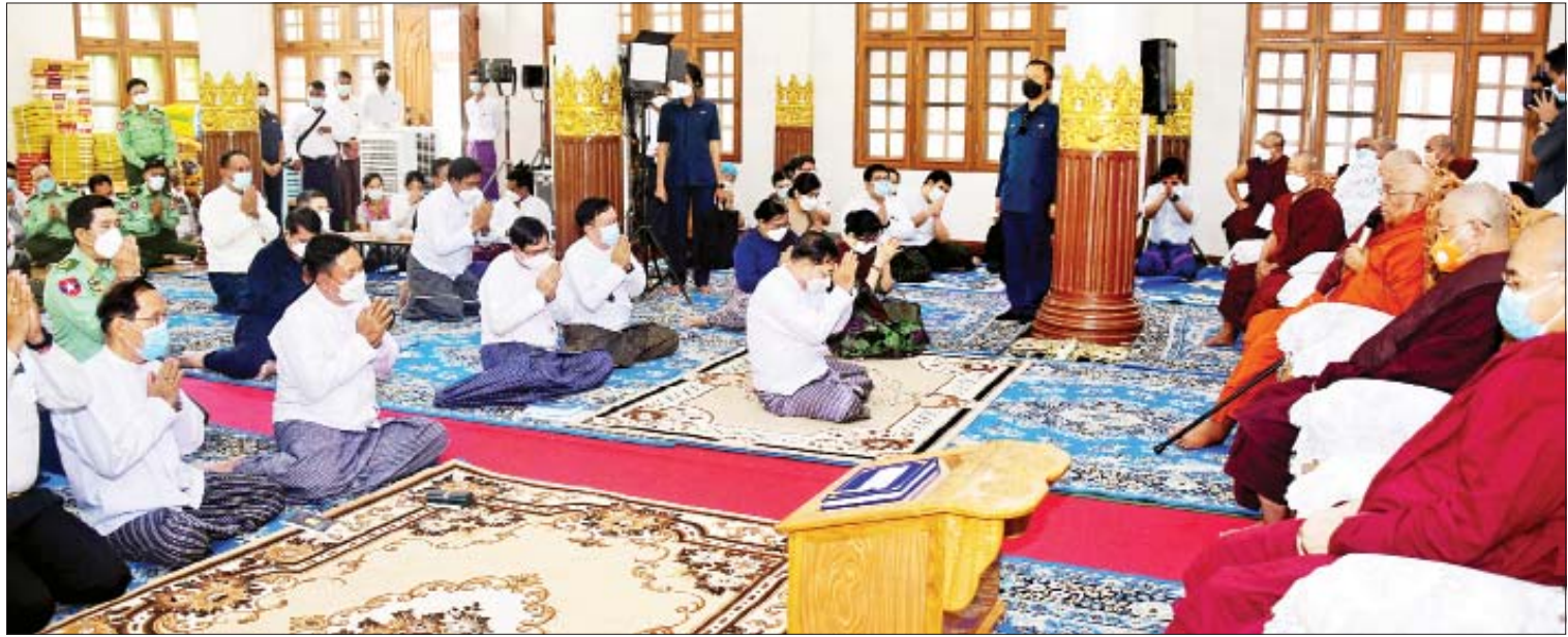
နိုင်ငံတော်စီမံအုပ်ချုပ်ရေးကောင်စီဥက္ကဋ္ဌ နိုင်ငံတော်ဝန်ကြီးချုပ် ဗိုလ်ချုပ်မှူးကြီးမင်းအောင်လှိုင်နှင့်ဇနီး ဒေါ်ကြူကြူလှ၊ အဖွဲ့ဝင်များ သီတဂူကမ္ဘာ့ဗုဒ္ဓတက္ကသိုလ် များနှင့် သီတဂူဆေးရုံတော်များ၏ အဓိပတိ အဘိဓဇမဟာရဋ္ဌဂုရု အဘိဓဇအဂ္ဂမဟာ သဒ္ဓမ္မဇောတိက အဂ္ဂမဟာပဏ္ဍိတ မဟာဓမ္မကထိက ဗဟုဇနဟိတဓရ တွဲဖက်ရွှေကျင် သာသနာပိုင် သီတဂူဆရာတော် ဘဒ္ဒန္တ ဉာဏိဿရထံမှ အနုမောဒနာတရား နာယူကြစဉ်။

ဖူးမြော်ကြည်ညို ဆရာတော်ဘုရားကြီး၏ ကြွင်းကျန် ရစ်သည့် ရုပ်ကလာပ်တော်မြတ်အား နိုင်ငံတော်စီမံအုပ်ချုပ်ရေးကောင်စီဥက္ကဋ္ဌ နိုင်ငံတော်ဝန်ကြီးချုပ် ဗိုလ်ချုပ်မှူးကြီး မင်းအောင်လှိုင်သည် ဇနီး ဒေါ်ကြူကြူလှ၊ ကောင်စီဝင် ဒုတိယဗိုလ်ချုပ်ကြီး မိုးမြင့်ထွန်း၊ ကောင်စီအတွင်းရေးမှူး ဒုတိယဗိုလ်ချုပ်ကြီး အောင်လင်းဒွေး၊ သာသနာရေးနှင့် ယဉ်ကျေးမှုဝန်ကြီးဌာန ပြည်ထောင်စုဝန်ကြီး ဦးကိုကို၊ ရန်ကုန် တိုင်းဒေသကြီးဝန်ကြီးချုပ် ဦးစိုးသိန်း၊ ကာကွယ်ရေးဦးစီးချုပ်(ရေ) ဗိုလ်ချုပ်ကြီး မိုးအောင်၊ ကာကွယ်ရေးဦးစီးချုပ်(လေ) ဗိုလ်ချုပ်ကြီးထွန်းအောင်၊ ကာကွယ်ရေး ဦးစီးချုပ်ရုံးမှ တပ်မတော်အရာရှိကြီး များ၊ ရန်ကုန်တိုင်းစစ်ဌာနချုပ်တိုင်းမှူး နှင့် တာဝန်ရှိသူများ လိုက်ပါ၍ ယနေ့ မွန်းလွဲပိုင်းတွင် သွားရောက်ဖူးမြော် ကြည်ညိုသည်။ ဦးစွာ နိုင်ငံတော်စီမံအုပ်ချုပ်ရေး ကောင်စီဥက္ကဋ္ဌ နိုင်ငံတော်ဝန်ကြီးချုပ်နှင့် ဇနီး၊ အဖွဲ့ဝင်များသည် သီတဂူကမ္ဘာ့ဗုဒ္ဓ တက္ကသိုလ်များနှင့် သီတဂူဆေးရုံတော် များ၏ အဓိပတိ အဘိဓဇမဟာရဋ္ဌဂုရု အဘိဓဇအဂ္ဂမဟာ သဒ္ဓမ္မဇောတိက အဂ္ဂမဟာ ပဏ္ဍိတ မဟာဓမ္မ ကထိက ဗဟုဇနဟိတဓရ တွဲဖက်ရွှေကျင်