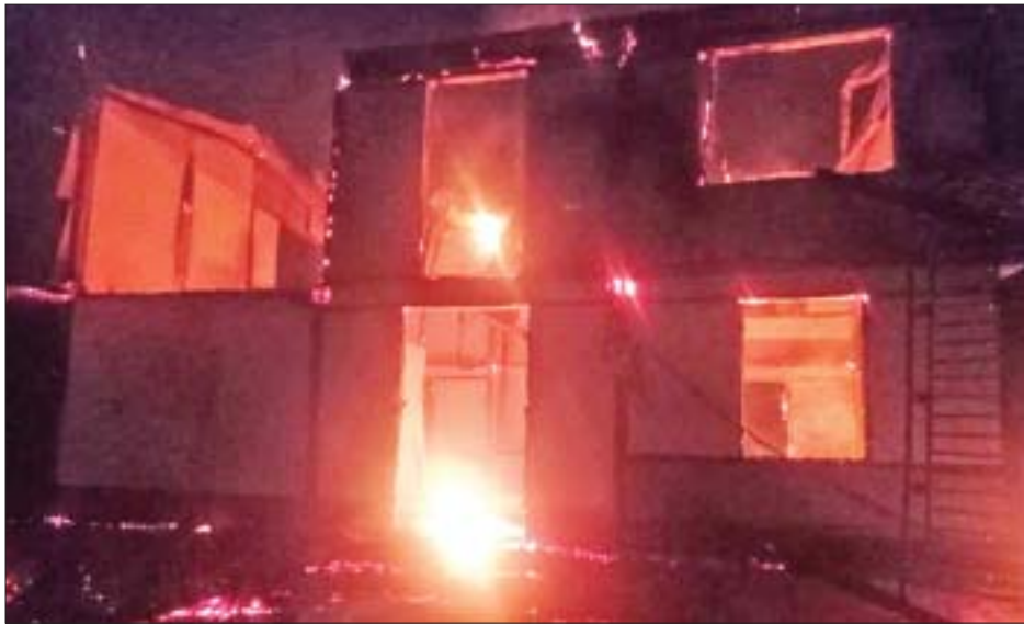
ရွာငုံမြို့နယ်၌ အပြစ်မဲ့ပြည်သူများပိုင်ဆိုင်သည့် နေအိမ်များအား PDF အမည်ခံ အကြမ်းဖက်သမားများက မီးရှို့ဖျက်ဆီးမှု မှတ်တမ်းဓာတ်ပုံ။