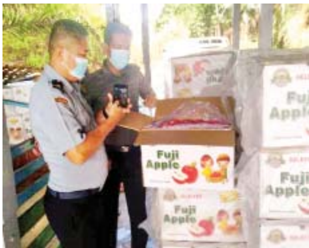
မွန်ပြည်နယ် မရမ်းချောင်း အမြဲတမ်းစစ်ဆေးရေးစခန်း၌ စားသောက်ကုန်ပစ္စည်းများ သိမ်းဆည်းရမိမှုကို တွေ့ရစဉ်။

တရားမဝင် ကုန်သွယ်မှု တိုက်ဖျက်ရေး ဦးဆောင် ကော်မတီ၏ ကြီးကြပ်ကွပ်ကဲ မှုဖြင့် တရားမဝင်ကုန်သွယ်မှု များကို ဥပဒေနှင့်အညီ ထိရောက်စွာ တားဆီးအရေးယူနိုင်ရေး ဆောင်ရွက်လျက်ရှိရာ မတ် ၁၈ ရက်တွင် ရန်ကုန် တိုင်းဒေသကြီး တရားမဝင် ကုန်သွယ်မှုတိုက်ဖျက်ရေး အထူး အဖွဲ့၏ စီမံခန့်ခွဲမှုဖြင့် တရားမဝင် ကုန်သွယ်မှုတိုက်ဖျက်ရေး အထူး အဖွဲ့ အတွင်းရေးမှူး ဦးဆောင် သော ပူးပေါင်းစစ်ဆေးရေးအဖွဲ့က ရန်ကုန် မြောက်ပိုင်းခရိုင် လှည်းကူးမြို့နယ် မင်းလှိုင်ကုန်း ဂိတ်၌ ရှောင်တင်စစ်ဆေးမှုများ ဆောင်ရွက်ခဲ့ရာ ခွင့်ပြုလိုက်စင် ထက် ပိုမိုသယ်ဆောင်လာသော တရားမဝင် မီးဖိုချောင်သုံး ဂက်စ် အိုးများ (ခန့်မှန်းတန်ဖိုးငွေကျပ် ၄၈၀၀၀၀)ကို အကောက်ခွန် ဥပဒေအရ လည်းကောင်း၊ သစ်တောဦးစီးဌာန ဦးဆောင် သော ပူးပေါင်းစစ်ဆေးရေးအဖွဲ့က စစ်ဆေးမှုများ ဆောင်ရွက်ခဲ့ရာ ရန်ကုန် မြောက်ပိုင်းခရိုင် လှည်းကူးမြို့နယ် ရန်ကုန်- မန္တလေး အမြန်လမ်း မိုင်တိုင် (၁၈/၅) အနီး၌ တရားမဝင် ကုန်သွယ်မှု ၈ ဒသမ ၇၄၂ တန် (ခန့်မှန်း တန်ဖိုးငွေကျပ် ၆၁၀၉၄၀)နှင့် အဆိုပါသစ်များ သယ်ဆောင်လာသော FUSO