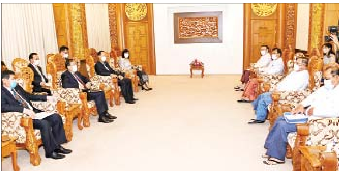
ပြည်ထောင်စုဝန်ကြီး ဦးဝဏ္ဏမောင်လွင် အာဆီယံအလှည့်ကျဥက္ကဋ္ဌ၏ မြန်မာနိုင်ငံဆိုင်ရာအထူးကိုယ်စားလှယ် ကမ္ဘောဒီးယားနိုင်ငံ ဒုတိယဝန်ကြီးချုပ်၊ နိုင်ငံခြားရေးနှင့် အပြည်ပြည်ဆိုင်ရာ ပူးပေါင်းဆောင်ရွက်ရေးဝန်ကြီး မစ္စတာ ပရပ်ဆုတ်ခွန်းနှင့် အာဆီယံအတွင်းရေးမှူးချုပ် မစ္စတာ ဒါတိုလင်ကျောက်ဟိုရှင်တို့အား လက်ခံတွေ့ဆုံစဉ်။