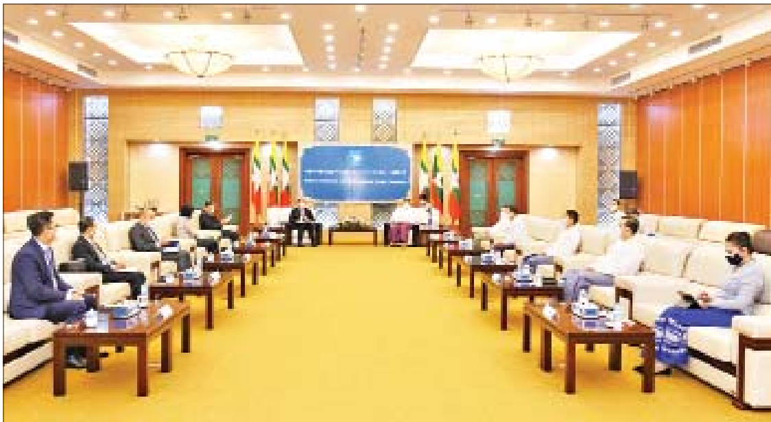
တွေ့ဆုံစဉ် နိုင်ငံတော်စီမံအုပ်ချုပ်ရေး အဖွဲ့ရုံးဝန်ကြီးဌာန(၁) ပြည်ထောင်စု နှင့် ငြိမ်းချမ်းရေးဖော်ဆောင်မှုညှိနှိုင်းရေး ကောင်စီအဖွဲ့ဝင် ပြည်ထောင်စုအစိုးရ ဝန်ကြီး အမျိုးသားစည်းလုံးညီညွတ်ရေး ကော်မတီဥက္ကဋ္ဌ ဒုတိယဗိုလ်ချုပ်ကြီး

နိုင်ငံတော်စီမံအုပ်ချုပ်ရေးကောင်စီ အဖွဲ့ဝင် ပြည်ထောင်စုအစိုးရအဖွဲ့ရုံး ဝန်ကြီးဌာန(၁) ပြည်ထောင်စုဝန်ကြီး အမျိုးသား စည်းလုံးညီညွတ်ရေးနှင့် ငြိမ်းချမ်းရေးဖော်ဆောင်မှု ညှိနှိုင်းရေး ကော်မတီဥက္ကဋ္ဌ ဒုတိယဗိုလ်ချုပ်ကြီး ရာပြည့်သည် အာဆီယံအလှည့်ကျဥက္ကဋ္ဌ ၏ မြန်မာနိုင်ငံဆိုင်ရာ အထူးကိုယ်စား လှယ် ကမ္ဘောဒီးယားနိုင်ငံ ဒုတိယ ဝန်ကြီးချုပ်၊ နိုင်ငံခြားရေးနှင့် အပြည်ပြည်ဆိုင်ရာ ပူးပေါင်းဆောင်ရွက် ရေးဝန်ကြီး မစ္စတာ ပရပ်ဆုတ်ခွန်း ဦးဆောင်သည့် ကိုယ်စားလှယ်အဖွဲ့အား ယနေ့ ညနေ ၄ နာရီ ၄၅ မိနစ်တွင် နေပြည်တော်ရှိ အမျိုးသားစည်းလုံး ညီညွတ်ရေးနှင့် ငြိမ်းချမ်းရေးဖော်ဆောင်မှု ဗဟိုဌာန၌ လက်ခံတွေ့ဆုံသည်။