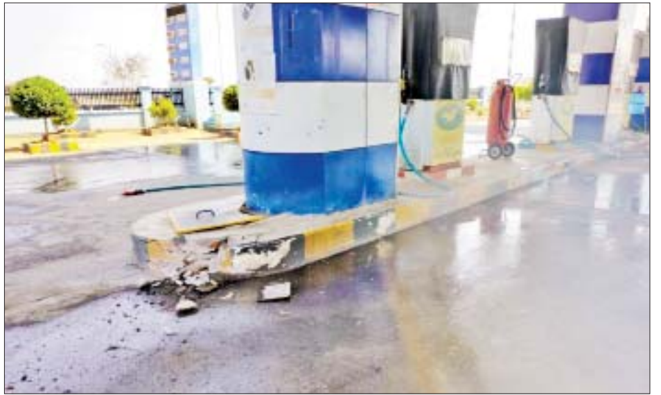
ပခုက္ကူမြို့နယ် မြို့ရှောင်လမ်းတွင် ဖွင့်လှစ်ထားသည့် ရွှေမျိုင်းဖြူစက်သုံးဆီဆိုင်တွင် လက်နက်ကိုင် အကြမ်းဖက်သမားများက လက်လုပ်မိုင်းဖြင့် ဖောက်ခွဲဖျက်ဆီးမှု မှတ်တမ်းဓာတ်ပုံ။