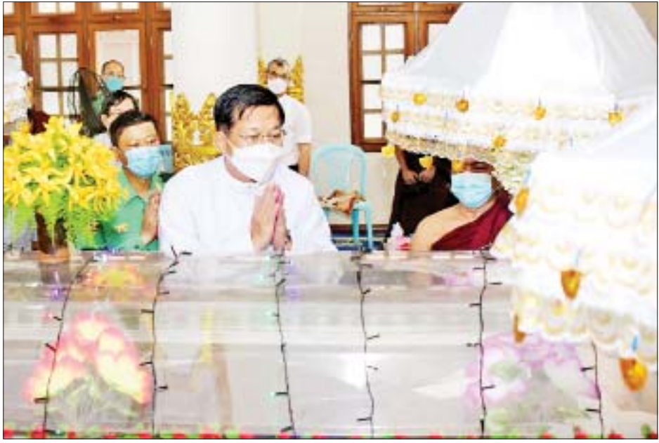
နိုင်ငံတော်စီမံအုပ်ချုပ်ရေးကောင်စီဥက္ကဋ္ဌ နိုင်ငံတော်ဝန်ကြီးချုပ် ဗိုလ်ချုပ်မှူးကြီးမင်းအောင်လှိုင် ဘဝနတ်ထံပျံလွန်တော်မူခဲ့သည့် နိုင်ငံတော်ဩဝါဒါစရိယ ရွှေကျင်နိကာယာဓိပတိဥက္ကဋ္ဌ ဓမ္မသေနာပတိ ပန္နရသမရွှေကျင်သာသနာပိုင် ဘဒ္ဒန္တဝိဇ္ဇောတ မဟာထေရ်မြတ်ကြီး၏ ဥတုဇရုပ်ကလာပ်တော်မြတ်အား ဖူးမြော်ကြည်ညိုစဉ်။

နေပြည်တော် မတ် ၂၁ ရန်ကုန်တိုင်းဒေသကြီး မရမ်းကုန်း မြို့နယ် အမှတ်(၉)ရပ်ကွက် ဝိဇ္ဇောတာရုံ စာသင်တိုက်၏ ဦးစီးပေးအမှုဆောင် နိုင်ငံတော်ဩဝါဒါစရိယ ရွှေကျင် နိကာယာဓိပတိ ဥက္ကဋ္ဌ ဓမ္မသေနာပတိ ပန္နရသမရွှေကျင်သာသနာပိုင် အဘိဓဇ မဟာရဋ္ဌဂုရု၊ အဘိဓဇ အဂ္ဂမဟာသဒ္ဓမ္မဇောတိက ဘဒ္ဒန္တ ဝိဇ္ဇောတ မဟာထေရ် မြတ်ကြီးသည် သက်တော်(၉၃) နှစ်၊ သိက္ခာတော်(၇၃) ဝါအရ ၁၃၈၃ ခုနှစ် တပေါင်းလပြည့်ကျော် ၄ ရက်၊ ခရစ်နှစ် ၂၀၂၂ ခုနှစ် မတ် ၂၀ ရက် (တနင်္ဂနွေနေ့) နံနက် ၂ နာရီ ၁၂ မိနစ်တွင် ဘဝနတ်ထံ ပျံလွန်တော်မူခဲ့သည်။