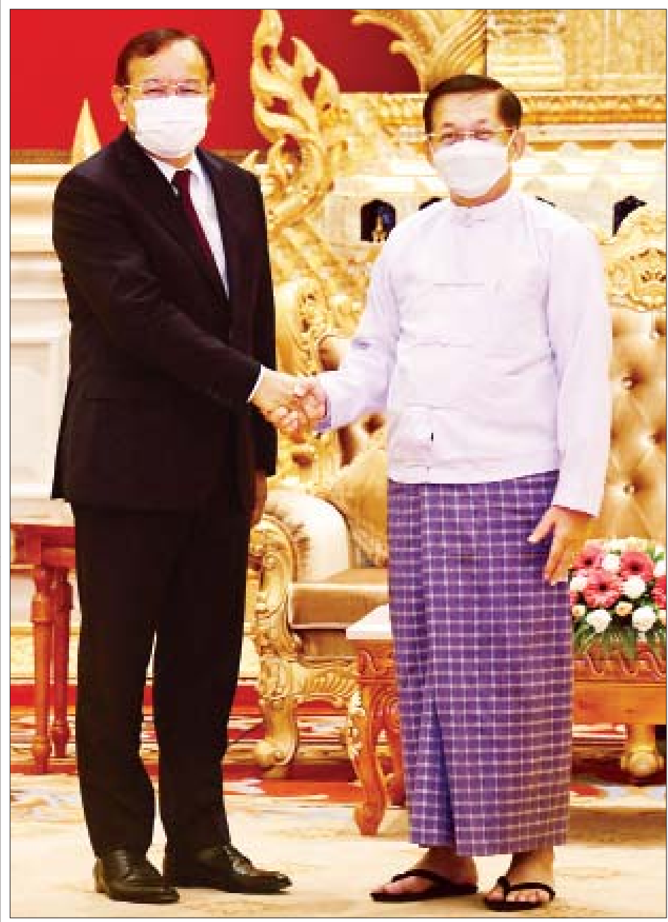
နိုင်ငံတော်စီမံအုပ်ချုပ်ရေးကောင်စီဥက္ကဋ္ဌ နိုင်ငံတော်ဝန်ကြီးချုပ် ဗိုလ်ချုပ်မှူးကြီး မင်းအောင်လှိုင် အာဆီယံအလှည့်ကျဥက္ကဋ္ဌ၏ မြန်မာနိုင်ငံဆိုင်ရာ အထူးကိုယ်စားလှယ် ကမ္ဘောဒီးယားနိုင်ငံ ဒုတိယဝန်ကြီးချုပ် H.E. Mr. Prak Sokhonn အား ရင်းရင်းနှီးနှီးဆက်စဉ်။

နေပြည်တော် မတ် ၂၁ နိုင်ငံတော် စီမံအုပ်ချုပ်ရေးကောင်စီဥက္ကဋ္ဌ နိုင်ငံတော်ဝန်ကြီးချုပ် ဗိုလ်ချုပ်မှူးကြီး မင်းအောင်လှိုင်သည် အာဆီယံအလှည့်ကျဥက္ကဋ္ဌ၏ မြန်မာနိုင်ငံဆိုင်ရာ အထူးကိုယ်စားလှယ် ကမ္ဘောဒီးယားနိုင်ငံ ဒုတိယဝန်ကြီးချုပ် နိုင်ငံခြားရေးနှင့် အပြည်ပြည်ဆိုင်ရာ ပူးပေါင်းဆောင်ရွက်ရေးဝန်ကြီး H.E. Mr. Prak Sokhonn နှင့် အာဆီယံအတွင်းရေးမှူးချုပ် H.E. Dato Lim Jock Hoi တို့အား ယနေ့ နံနက် ၁၀ နာရီခွဲတွင် နေပြည်တော်ရှိ နိုင်ငံတော်စီမံအုပ်ချုပ်ရေးကောင်စီဥက္ကဋ္ဌရုံး သံတမန်ဆောင်ဧည့်ခန်းမ၌ လက်ခံတွေ့ဆုံသည်။ အမြင်ချင်းဖလှယ်ဆွေးနွေး ထိုသို့တွေ့ဆုံရာတွင် မြန်မာနိုင်ငံအနေဖြင့် ၂၀၁၀ ပြည့်နှစ်မှ စ၍ ပါတီစုံဒီမိုကရေစီလမ်းကြောင်းပေါ်တွင် လျှောက်လှမ်းခဲ့မှုနှင့် ၂၀၂၀ ပြည့်နှစ် ပါတီစုံဒီမိုကရေစီအထွေထွေ ရွေးကောက်ပွဲတွင် မဲမသမာမှုများ ဖြစ်ပေါ်ခဲ့မှုကြောင့် နိုင်ငံတော် စီမံအုပ်ချုပ်ရေးကောင်စီအနေဖြင့် လူထုဆန္ဒခံယူ၍ အတည်ပြုထားသည့် ဖွဲ့စည်းပုံအခြေခံဥပဒေ(၂၀၀၈ ခုနှစ်)နှင့်အညီ နိုင်ငံတော်၏တာဝန်ကို ထမ်းဆောင်ခဲ့ရမှုအခြေအနေများ၊ နိုင်ငံရေးသဘောထား မတိုက်ဆိုင်မှုကြောင့် ဖြစ်ပေါ်လာသည့် ဆန္ဒပြမှုများမှတစ်ဆင့် ဆူပူအကြမ်းဖက်မှုများ၊ အကြောင်းမဲ့ စာမျက်နှာ ၄ ကော်လံ ၁ သို့ ။