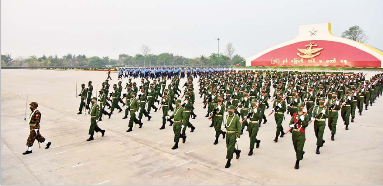
၂၀၂၁ ခုနှစ် (၇၆)နှစ်မြောက် တပ်မတော်နေ့ စစ်ရေးပြအခမ်းအနား ကျင်းပစဉ်။

အထူးအပါးအတိမ်အနက် နားမလည်တော့ ကိုယ့်ကိုနစ်မြွန်းအောင် ဖျက်ဆီးမယ့်ရန်သူကို ခြေသလုံးသွားဖက်။ အချင်းချင်းအသက်ပေးပြီး သွေးစည်းချစ်ကြည်ရမယ့် နိုင်ငံသားချင်းကိုတော့ ရန်သူလုပ်