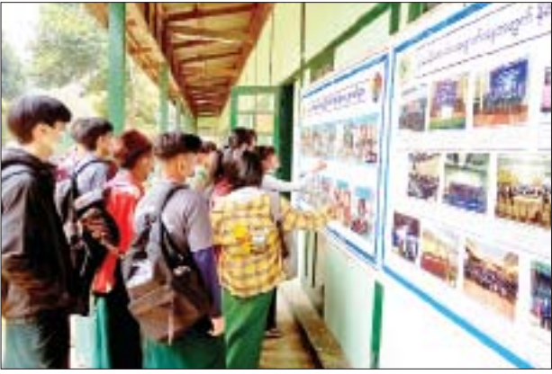
ကွမ်းလုံ

ရှမ်းပြည်နယ်(မြောက်ပိုင်း) ကွမ်းလုံမြို့၌ လူငယ်ရေးရာ အသိပညာပေးဟောပြောပွဲကို ယနေ့နံနက် ၁၁ နာရီက ကွမ်းလုံမြို့ အခြေခံပညာအထက်တန်းကျောင်းရှိ သံလွင်ဆောင်ခန်းမတွင် ပြန်ကြားရေးနှင့် ပြည်သူ့ဆက်ဆံရေးဦးစီးဌာနနှင့် အားကစားနှင့် ကာယပညာဦးစီးဌာနတို့ ပူးပေါင်းကျင်းပရာ အဋ္ဌမတန်းနှင့် နဝမတန်း ကျောင်းသား ကျောင်းသူ ၂၀၀ တက်ရောက်ခဲ့ကြသည်။