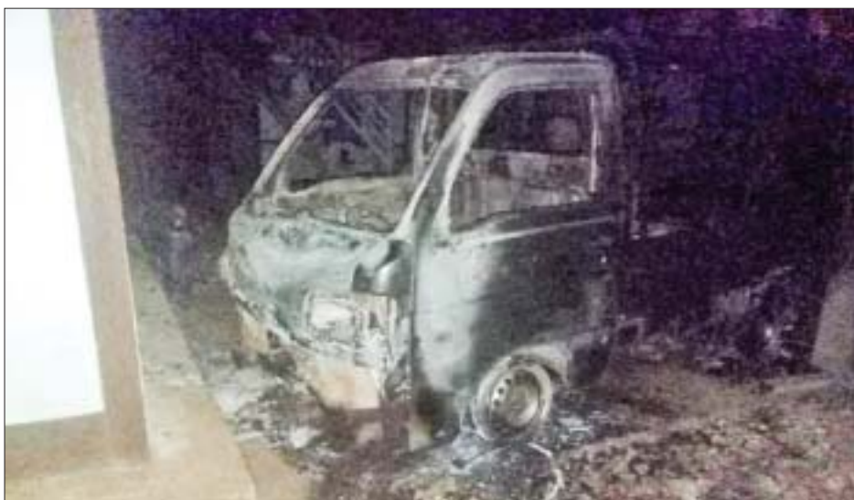
ရွာငုံမြို့နယ်၌ မော်တော်ယာဉ်တစ်စီးကို PDF အမည်ခံ အကြမ်းဖက်သမားများက မီးရှို့ဖျက်ဆီးမှု မှတ်တမ်းဓာတ်ပုံ။