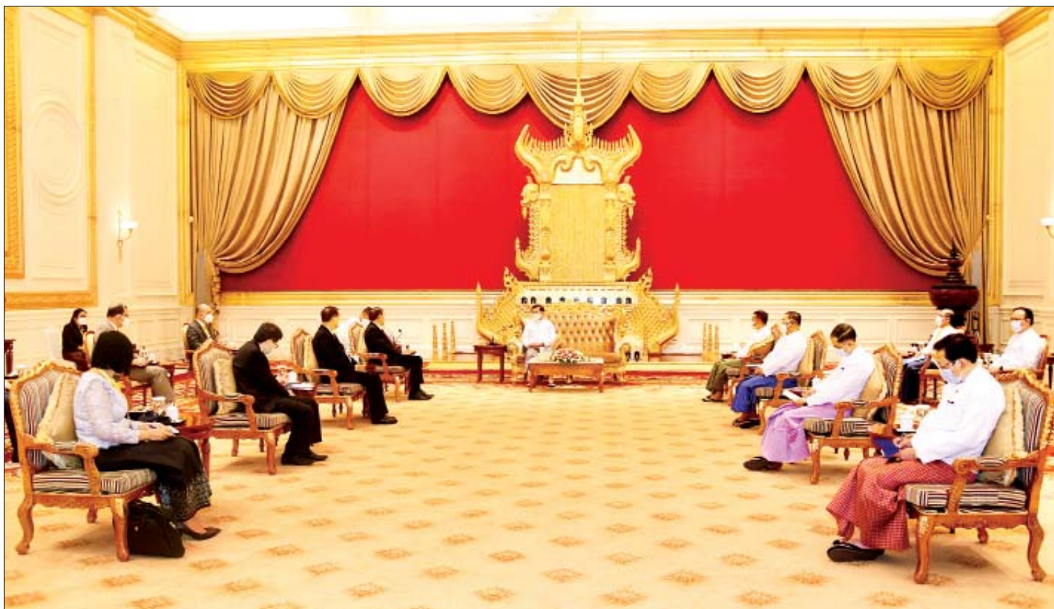
နိုင်ငံတော်စီမံအုပ်ချုပ်ရေးကောင်စီဥက္ကဋ္ဌ နိုင်ငံတော်ဝန်ကြီးချုပ် ဗိုလ်ချုပ်မှူးကြီး မင်းအောင်လှိုင် အာဆီယံအလှည့်ကျဥက္ကဋ္ဌ၏ မြန်မာနိုင်ငံဆိုင်ရာ အထူးကိုယ်စားလှယ် ကမ္ဘောဒီးယားနိုင်ငံ ဒုတိယဝန်ကြီးချုပ် H.E. Mr. Prak Sokhonn နှင့် အာဆီယံအတွင်းရေးမှူးချုပ် H.E. Dato Lim Jock Hoi တို့အား လက်ခံတွေ့ဆုံစဉ်။

အဆိုပါတွေ့ဆုံပွဲသို့ နိုင်ငံတော်စီမံအုပ်ချုပ်ရေးကောင်စီဥက္ကဋ္ဌ နိုင်ငံတော်ဝန်ကြီးချုပ်နှင့်အတူ ကောင်စီတွဲဖက်အတွင်းရေးမှူး ဒုတိယဗိုလ်ချုပ်ကြီး ရဲဝင်းဦး၊ ပြည်ထောင်စုဝန်ကြီးများဖြစ်ကြသည့် ဦးဝဏ္ဏမောင်လွင်၊ ဦးကိုကိုလှိုင်၊ ဒုတိယဝန်ကြီးများနှင့် တာဝန်ရှိသူများ