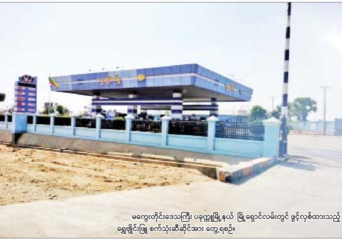
မကွေးတိုင်းဒေသကြီး ပခုက္ကူမြို့နယ် မြို့ရှောင်လမ်းတွင် ဖွင့်လှစ်ထားသည့် ရွှေမျိုင်းဖြူ စက်သုံးဆီဆိုင်အား တွေ့ရစဉ်။

နေပြည်တော် မတ် ၂၁ ရှမ်းပြည်နယ်(တောင်ပိုင်း) ရွာငံမြို့နယ်၌ အပြစ်မဲ့ပြည်သူများပိုင်ဆိုင်သည့် လူနေအိမ် သုံးလုံး၊ ဆိုင်ကယ် သုံးစီးနှင့် မော်တော်ယာဉ်တစ်စီးတို့ကို PDF အမည်ခံအကြမ်းဖက်သမားများက မီးရှို့ဖျက်ဆီးခဲ့ကြောင်း သိရသည်။ ဖြစ်စဉ်မှာ မတ် ၂၀ ရက် ည ၁၀ နာရီခန့်တွင် ရှမ်းပြည်နယ်(တောင်ပိုင်း) ရွာငံမြို့နယ် ပဲရင်းတောင်ကျေးရွာရှိ နေအိမ်အချို့အား PDF အမည်ခံ အကြမ်းဖက်အဖွဲ့များက မီးရှို့ဖျက်ဆီးခဲ့ကြောင်း သတင်းအရ လုံခြုံရေးတပ်ဖွဲ့ဝင်များက သွားရောက်စစ်ဆေးခဲ့ရာ ည ၁၀ နာရီ မိနစ် ၅၀ တွင် PDF အမည်ခံအကြမ်းဖက်အဖွဲ့ အင်အား ၃၀ ခန့်တို့သည် တူမီးသေနတ်၊ လက်နက်ငယ်နှင့် တုတ်၊ ဓားများကိုင်ဆောင်ကာ အော်ဟစ်ဆဲဆို၍ ကျေးရွာအတွင်း စာမျက်နှာ ၁၅ ကော်လံ ၁ သို့ *