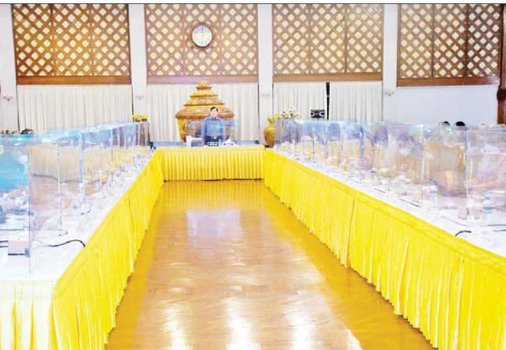
ဝန်ကြီးဌာနမှ ထုတ်ပြန်ထားသည့် အလေးထားဆောင်ရွက်ကြရန် ပြော ကိုဗစ်-၁၉ ရောဂါ ကျန်းမာရေးဆိုင်ရာ ကြားသည်။ လမ်းညွှန်ချက်များနှင့်အညီ ကျင်းပနိုင်ရေး တိုင်းဒေသကြီး (ပြန်/ဆက်)

ယင်းနောက် တိုင်းဒေသကြီး ဝန်ကြီးချုပ်က သင်္ကြန်ပွဲတော် အောင်မြင် စွာ ကျင်းပနိုင်ရေးအတွက် လိုအပ်ချက် များကို ဌာနဆိုင်ရာများမှ တာဝန်ရှိသူ များအားလုံး ပေါင်းစပ်ညှိနှိုင်းပြီး ဆောင်ရွက်ပေးကြရန်နှင့် ကျန်းမာရေး