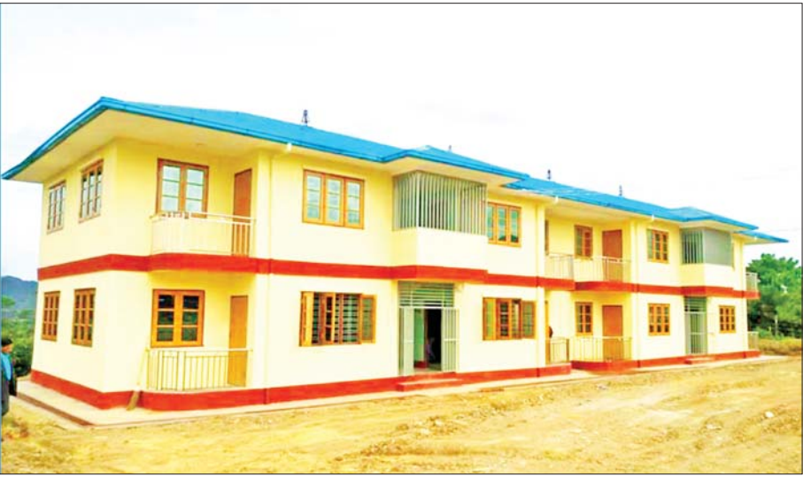
ချင်းပြည်နယ် ထန်တလန်မြို့မှ ဝန်ထမ်းအိမ်ရာများကိုတွေ့ရစဉ်။

ဟားခါးမြို့၌ ဝန်ထမ်းအိမ်ရာ လေးခန်းတွဲ သုံးထပ် RCC အဆောက်အအုံတစ်လုံး၊ ဝန်ထမ်းအိမ်ရာ လေးခန်းတွဲနှစ်ထပ် RCC အဆောက်အအုံနှစ်လုံး၊ ဝန်ထမ်းအိမ်ရာ နှစ်ခန်းတွဲနှစ်ထပ် RCC အဆောက် အအုံနှစ်လုံး၊ ဖလမ်းမြို့၌ ဝန်ထမ်းအိမ်ရာ လေးခန်း တွဲနှစ်ထပ် RCC အဆောက်အအုံတစ်လုံး၊ ဝန်ထမ်း အိမ်ရာ နှစ်ခန်းတွဲနှစ်ထပ် နှစ်လုံး၊ ဝန်ထမ်းအိမ်ရာ နှစ်ခန်းတွဲသုံးထပ်တစ်လုံး၊ မင်းတပ်မြို့၌ ဝန်ထမ်း အိမ်ရာ လေးခန်းတွဲနှစ်ထပ် နှစ်လုံး၊ ဝန်ထမ်းအိမ်ရာ နှစ်ခန်းတွဲသုံးထပ် တစ်လုံး၊ ကန်ပက်လက်မြို့၌ ဝန်ထမ်းအိမ်ရာ လေးခန်းတွဲနှစ်ထပ်နှစ်လုံး၊ မတူပီ မြို့၌ ဝန်ထမ်းအိမ်ရာ လေးခန်းတွဲနှစ်ထပ် သုံးလုံး၊ ထန်တလန်မြို့၌ ဝန်ထမ်းအိမ်ရာ နှစ်ခန်းတွဲနှစ်ထပ် တစ်လုံး၊ တွန်းဇံမြို့၌ ဝန်ထမ်းအိမ်ရာ လေးခန်းတွဲ နှစ်ထပ် တစ်လုံး၊ ခိုင်ကမ်းမြို့၌ ဝန်ထမ်းအိမ်ရာ လေးခန်းတွဲနှစ်ထပ် တစ်လုံး၊ မက္ခီအိမ်နွဲ့မြို့၌ ဝန်ထမ်းအိမ်ရာ လေးခန်းတွဲနှစ်ထပ် တစ်လုံး စုစုပေါင်းခွင့်ပြုရန်ပုံငွေ ကျပ်သန်းပေါင်း ၄၁၉၄ ဒသမ ၇၆၅ တို့ဖြစ်ကြောင်း သိရသည်။ ။