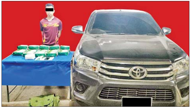
စိုင်းဆိုင်(ခ)အိုက်ဆမ်အား သိမ်းဆည်းရမိသည့် ကတ်တမင်းများနှင့်အတူ တွေ့ရစဉ်။

သို့ဖြစ်ပါ၍ မတ် ၁၈ ရက်၊ ၁၉ ရက်နှင့် ၂၀ ရက်တို့တွင် ဖမ်းဆီးရမိမှု စုစုပေါင်းမှာ အမှုတွဲ ၁၀ မှု (ခန့်မှန်းတန်ဖိုးငွေ ၁၀၉၂၀၂၃၈ ကျပ်) ဖြစ်ကြောင်း တရားမဝင်ကုန်သွယ်မှုတိုက်ဖျက်ရေး ဦးဆောင်ကော်မတီမှ သိရသည်။ သတင်းစဉ်