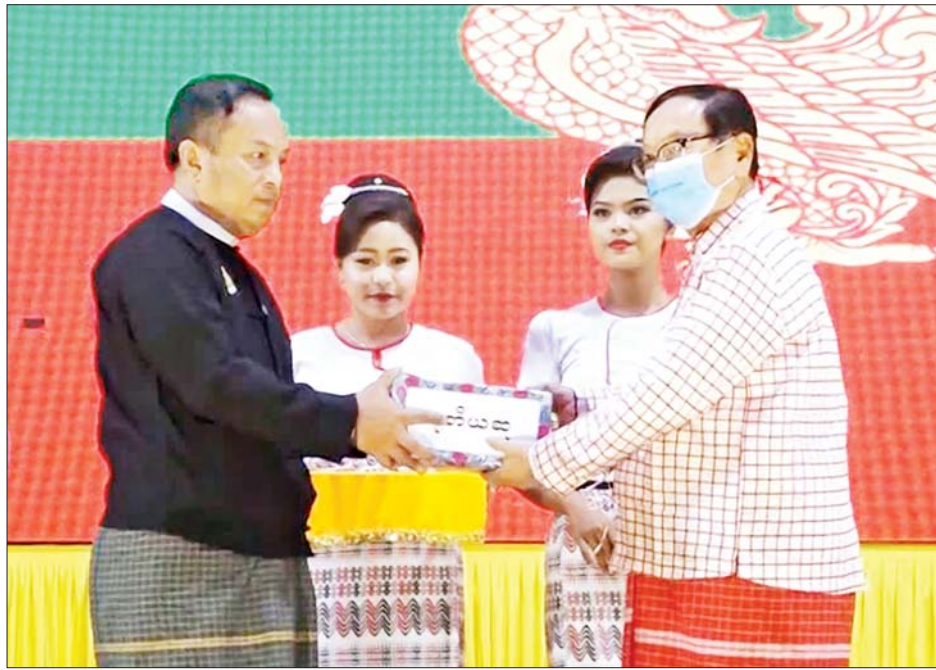
နိုင်ငံတော်စီမံအုပ်ချုပ်ရေးကောင်စီအဖွဲ့ဝင် ဒေါက်တာဗညားအောင်မိုးက ဒုတိယဆရာ ပြည်နယ် ငါးလုပ်ငန်းဦးစီးဌာနကို ဆုပေးအပ်ချီးမြှင့်စဉ်။

ပေးအပ်သည်။ ထို့နောက် နိုင်ငံတော်စီမံအုပ်ချုပ်ရေး ကောင်စီဒုတိယဥက္ကဋ္ဌ ဒုတိယတပ်မတော် ကာကွယ်ရေးဦးစီးချုပ် ကာကွယ်ရေးဦးစီး ချုပ်(ကြည်း)သည် ဆေးရုံတွင်တာဝန် ထမ်းဆောင်လျက်ရှိသည့် ကျန်းမာရေး ဝန်ထမ်းများအတွက် ချီးမြှင့်ငွေများကို ပေးအပ်ရာ ဆေးရုံတပ်မှူးက လက်ခံရယူ ခဲ့ကြောင်း သိရသည်။ သတင်းစဉ်