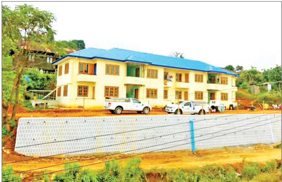
မင်းတပ်မြို့မှ ဝန်ထမ်းအိမ်ရာများကိုတွေ့ရစဉ်။