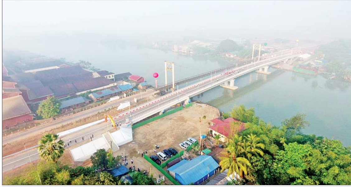
ကျွန်းကုန်းတံတားသစ်ကို တွေ့ရစဉ်။

ဆက်လက်၍ ကျွန်းကုန်းတံတားကမ္ဘာ့မော်ကွန်းကျောက်စာတိုင်အား နိုင်ငံတော်စီမံအုပ်ချုပ်ရေးကောင်စီဝင် ဒေါ်အေးနုစိန်နှင့် ဦးမောင်းဟာတို့က စက်ခလုတ်နှိပ်ဖွင့်လှစ်ပေးပြီး အမွှေးနံ့သာရည်များ ပက်ဖျန်းပေးကာ တံတားကြီးပေါ်မှ ဖြတ်သန်းကြည့်ရှုစစ်ဆေးခဲ့ကြောင်း သိရသည်။ သတင်းစဉ်