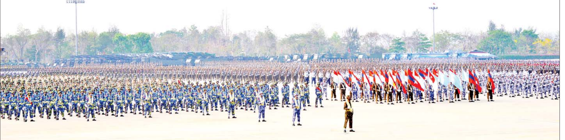
၂၀၂၁ ခုနှစ် (၇၆)နှစ်မြောက် တပ်မတော်နေ့ စစ်ရေးပြအခမ်းအနား ကျင်းပစဉ်။

နိုင်ငံတော်တွင် တစ်ခုတည်းသော တပ်မတော်တစ်ရပ်ရှိသည်။ တပ်မတော်တိုင်းသည် မိမိနိုင်ငံတော်ကို ကာကွယ်စောင့်ရှောက်လျက်ရှိသည်။ တပ်မတော်၏ အဓိက တာဝန်မှာ ကာကွယ်ရေးတာဝန်ဖြစ်သည်။ တိုင်းပြည်တစ်ပြည်လုံး လူမျိုး၊ နယ်ပယ်၊ အစိုးရ၊ အချုပ်အခြာအာဏာဟူသည့် အင်္ဂါရပ်လေးခုရှိရာ ထိုအင်္ဂါရပ်လေးခုကို ထိပါးလာသည့် အန္တရာယ်ဟူသမျှအား တပ်မတော်သည် ကာကွယ်စောင့်ရှောက်ပေးရန် တာဝန်ရှိသည်။