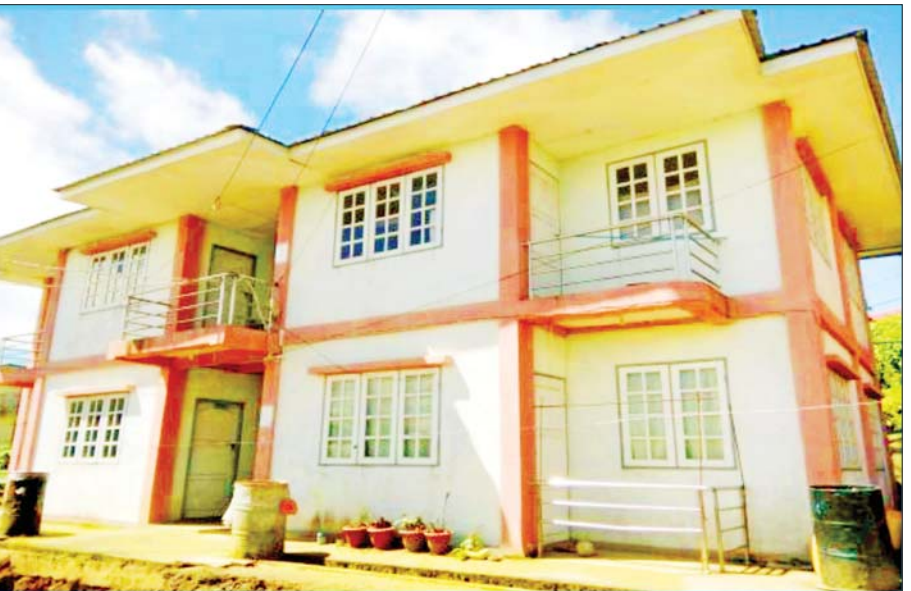
ချင်းပြည်နယ်၏မြို့တော် ဟားခါးမြို့မှ ဝန်ထမ်းအိမ်ရာများကိုတွေ့ရစဉ်။