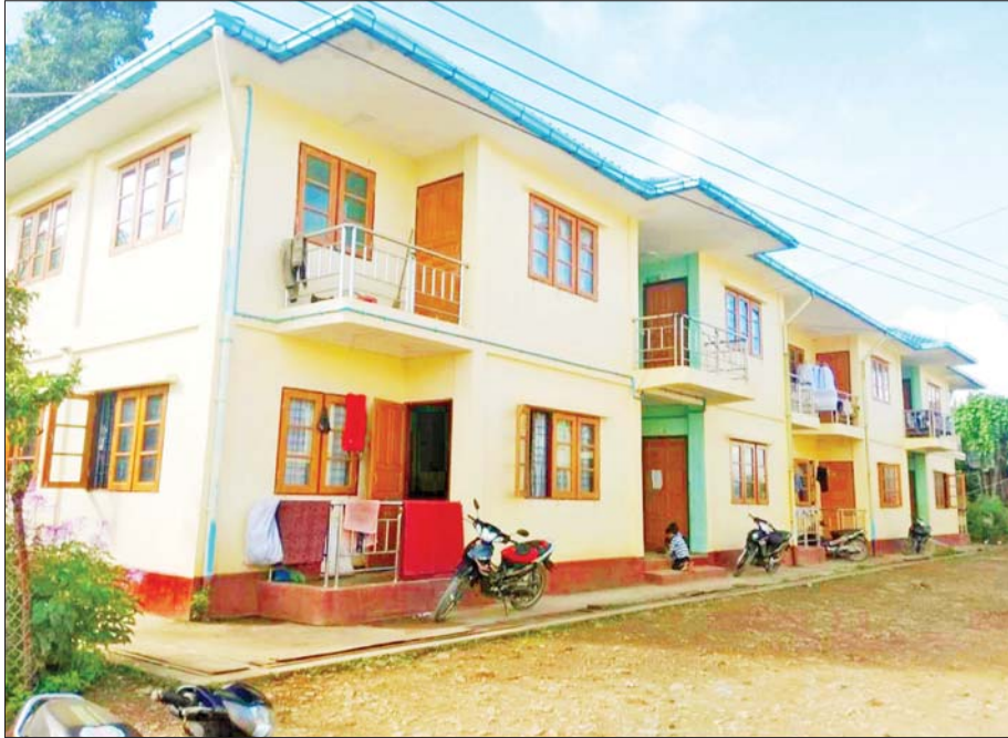
ဖလမ်းမြို့မှ ဝန်ထမ်းအိမ်ရာများကိုတွေ့ရစဉ်။

ချင်းပြည်နယ်အတွင်းရှိ ဟားခါးမြို့၊ ထန်တလန်မြို့၊ ဖလမ်းမြို့၊ ရဲခေါင်မြို့၊ တီးတိန်မြို့၊ ကျိခါးမြို့၊ မင်းတပ်မြို့၊ ကန်ပက်လက်မြို့၊ မတူပီမြို့၊ ရေဇာမြို့ နှင့် ဆမီးမြို့တို့တွင် ၂၀၁၉-၂၀၂၀ ဘဏ္ဍာနှစ်ထိ ဝန်ထမ်းအိမ်ရာတိုက် ၁၂၇ လုံး၊ အခန်းပေါင်း ၄၃၅ ခန်း တည်ဆောက်ပြီးစီး၍ နိုင်ငံ့ဝန်ထမ်းများကို နေရာချထားပေးခဲ့သည်။ နိုင်ငံ့ဝန်ထမ်းအိမ်ရာတွင် နေထိုင်ခွင့်ရရှိသော နေအိမ်ခန်းများအတွက်