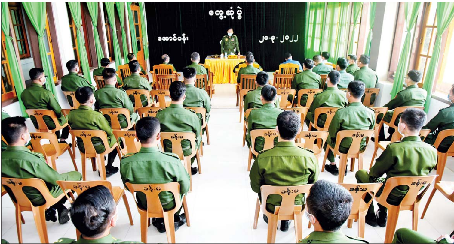
နိုင်ငံတော်စီမံအုပ်ချုပ်ရေးကောင်စီဒုတိယဥက္ကဋ္ဌ ဒုတိယတပ်မတော်ကာကွယ်ရေးဦးစီးချုပ် ကာကွယ်ရေးဦးစီးချုပ်(ကြည်း) ဒုတိယဗိုလ်ချုပ်မှူးကြီးစိုးဝင်း အောင်ပန်းမြို့ တပ်မတော်ဆေးရုံခန်းမ၌ ပါရဂူ ဆေးမှူးနှင့် သူနာပြုများကို တွေ့ဆုံအမှာစကားပြောကြားစဉ်။

နေပြည်တော် မတ် ၂၀ နိုင်ငံတော်စီမံအုပ်ချုပ်ရေးကောင်စီ ဒုတိယဥက္ကဋ္ဌ ဒုတိယတပ်မတော် ကာကွယ်ရေးဦးစီးချုပ် ကာကွယ်ရေး ဦးစီးချုပ်(ကြည်း) ဒုတိယဗိုလ်ချုပ်မှူးကြီး စိုးဝင်းသည် ဇနီး ဒေါ်သန်းသန်းနွယ်၊ ကာကွယ်ရေးဦးစီးချုပ်ရုံး(ကြည်း)မှ ဒုတိယဗိုလ်ချုပ်ကြီး အောင်ဇော်အေး၊ ကာကွယ်ရေးဦးစီးချုပ်ရုံး(ကြည်း)၊ ရေ၊ လေ)မှ တပ်မတော်အရာရှိကြီးများ၊ အရှေ့ပိုင်းတိုင်းစစ်ဌာနချုပ် တိုင်းမှူး ဗိုလ်ချုပ်နီလင်းအောင်တို့ လိုက်ပါ၍ ယနေ့နံနက်ပိုင်းတွင် ရှမ်းပြည်နယ် (တောင်ပိုင်း) အောင်ပန်းမြို့ရှိ တပ်မတော် ဆေးရုံ၌ တက်ရောက်ဆေးကုသမှုခံယူ လျက်ရှိသည့် အရာရှိ၊ စစ်သည်၊ မိသားစု များနှင့် ပြည်သူများကို သွားရောက် ကြည့်ရှုအားပေးစကား ပြောကြားပြီး ဆေးရုံရှိ ပါရဂူ ဆေးမှူးနှင့် သူနာပြု များကို သီးခြားစီတွေ့ဆုံအမှာစကား ပြောကြားသည်။ ဦးစွာ နိုင်ငံတော်စီမံအုပ်ချုပ်ရေး ကောင်စီဒုတိယဥက္ကဋ္ဌ ဒုတိယတပ်မတော် ကာကွယ်ရေးဦးစီးချုပ် ကာကွယ်ရေး