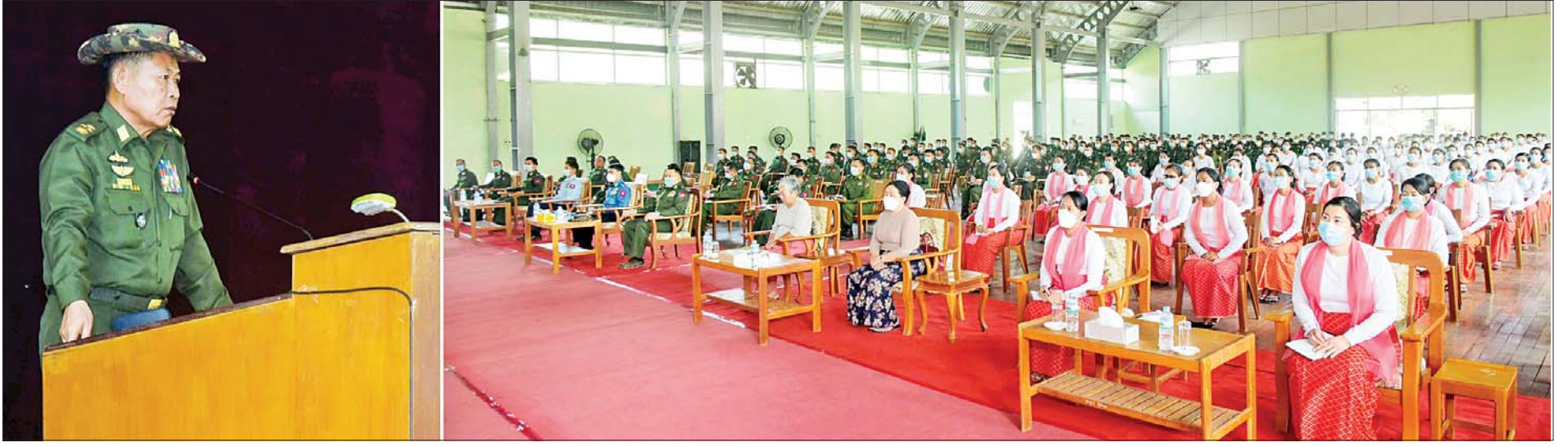
နိုင်ငံတော်စီမံအုပ်ချုပ်ရေးကောင်စီဒုတိယဥက္ကဋ္ဌ ဒုတိယတပ်မတော်ကာကွယ်ရေးဦးစီးချုပ် ကာကွယ်ရေးဦးစီးချုပ်(ကြည်း) ဒုတိယဗိုလ်ချုပ်မှူးကြီးစိုးဝင်း မိုင်းမောတပ်နယ်မှ အရာရှိ၊ စစ်သည်၊ မိသားစုဝင်များအား တွေ့ဆုံအမှာစကား ပြောကြားစဉ်။