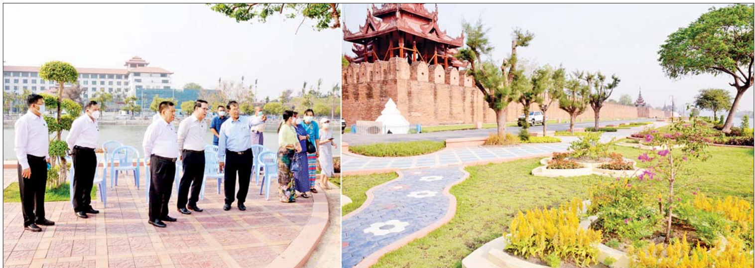
ပြည်ထောင်စုဝန်ကြီး ဦးမောင်မောင်အုန်းနှင့် မန္တလေးတိုင်းဒေသကြီးဝန်ကြီးချုပ် ဦးမောင်ကိုတို့ မန္တလေးမြို့ ရတနာပုံအပန်းဖြေဥယျာဉ် တည်ဆောက်မှုလုပ်ငန်းများကို ကြည့်ရှုစဉ်။

နေပြည်တော် မတ် ၂၀ ပြန်ကြားရေး ဝန်ကြီးဌာန ပြည်ထောင်စုဝန်ကြီး ဦးမောင်မောင်အုန်း နှင့် မန္တလေးတိုင်းဒေသကြီးဝန်ကြီးချုပ် ဦးမောင်ကိုတို့သည် ယနေ့နံနက်ပိုင်းတွင် မန္တလေးမြို့ ရတနာပုံအပန်းဖြေဥယျာဉ် တည်ဆောက်မှုလုပ်ငန်းများကို ကြည့်ရှု၍ ပြည်သူများ အနားယူအပန်းဖြေနိုင်မည့် အစီအစဉ်များကို အကြံပြုဆွေးနွေးကြ သည်။