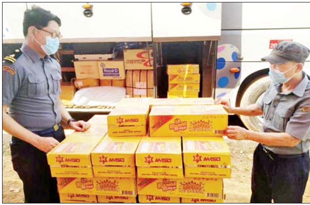
သိမ်းဆည်းရမိသည့် အကောက်ခွန်မဲ့ စားသောက်ကုန်များအား တွေ့ရစဉ်။

ထို့အတူ မတ် ၂၀ ရက်တွင် စစ်ကိုင်းတိုင်းဒေသကြီး တရားမဝင်ကုန်သွယ်မှုတိုက်ဖျက်ရေး အထူးအဖွဲ့၏ စီမံခန့်ခွဲမှုဖြင့် တိုင်းဒေသကြီးအတွင်း စစ်ဆေးမှုများဆောင်ရွက်ခဲ့ရာ မြန်မာနိုင်ငံရတပ်ဖွဲ့ ဦးဆောင်သော စစ်ဆေးရေးအဖွဲ့က နာဂကိုယ်ပိုင်အုပ်ချုပ်ခွင့်ရဒေသ လဟယ်မြို့နယ်အတွင်း CANDA နှင့် KENBO အမျိုးအစား (လိုင်စင်မဲ့) ဆိုင်ကယ် ငါးစီး (ခန့်မှန်းတန်ဖိုးငွေကျပ် ၁၆၀၀၀၀)ကို ပို့ကုန်သွင်းကုန်ဥပဒေအရလည်းကောင်း၊ သစ်တောဦးစီးဌာန ဦးဆောင်သော