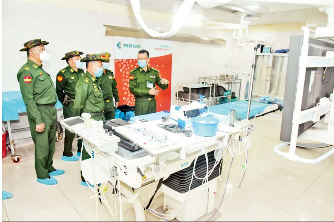
နိုင်ငံတော်စီမံအုပ်ချုပ်ရေးကောင်စီဒုတိယဥက္ကဋ္ဌ ဒုတိယတပ်မတော်ကာကွယ်ရေးဦးစီးချုပ်(ကြည်း) ဒုတိယဗိုလ်ချုပ်မှူးကြီးစိုးဝင်းနှင့် အဖွဲ့ဝင်များ နှလုံးသွေးကြောရောဂါစမ်းသပ်ကုသစက်(Angiogram)အား ကြည့်ရှုစစ်ဆေးစဉ်။

ဦးစီးချုပ်(ကြည်း)နှင့် အဖွဲ့ဝင်များအား ဆေးရုံတပ်မှူးနှင့် တာဝန်ရှိသူများက ကြိုဆိုနှုတ်ဆက်ကြသည်။ ထို့နောက် ဆေးရုံတွင် တက်ရောက်ဆေးကုသမှု ခံယူလျက်ရှိသည့် အရာရှိ၊ စစ်သည်၊ မိသားစုများနှင့် ဒေသခံပြည်သူများကို ကြည့်ရှု၍ တစ်ဦးချင်း၏ ရောဂါအခြေ အနေများ မေးမြန်းအားပေးစကား ပြောကြားကာ စားသောက်ဖွယ်ရာများ နှင့် ထောက်ပံ့ပစ္စည်းများ ပေးအပ်သည်။ ယင်းနောက် နိုင်ငံတော်စီမံအုပ်ချုပ် ရေးကောင်စီဒုတိယဥက္ကဋ္ဌ ဒုတိယ တပ်မတော် ကာကွယ် ရေးဦးစီးချုပ် ကာကွယ်ရေးဦးစီးချုပ်(ကြည်း)သည် ဆေးရုံခန်းမအတွင်း၌ ပါရဂူ ဆေးမှူး များနှင့်သူနာပြုများကို သီးခြားစီတွေ့ဆုံ၍ လုပ်ငန်းတာဝန် ထမ်းဆောင်ရာတွင်