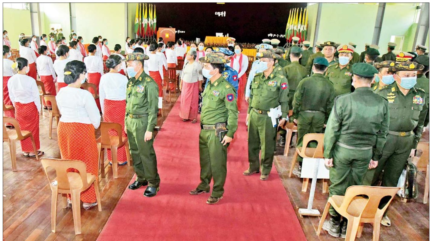
နိုင်ငံတော်စီမံအုပ်ချုပ်ရေးကောင်စီဒုတိယဥက္ကဋ္ဌ ဒုတိယတပ်မတော်ကာကွယ်ရေးဦးစီးချုပ် ကာကွယ်ရေးဦးစီးချုပ်(ကြည်း) ဒုတိယဗိုလ်ချုပ်မှူးကြီးစိုးဝင်း မိုင်းမောတပ်နယ်မှ အရာရှိ၊ စစ်သည်၊ မိသားစုဝင်များအား ရင်းရင်းနှီးနှီး နှုတ်ဆက်စဉ်။

နေပြည်တော် မတ် ၂၀ နိုင်ငံတော်စီမံအုပ်ချုပ်ရေးကောင်စီ ဒုတိယဥက္ကဋ္ဌ ဒုတိယတပ်မတော်ကာကွယ်ရေးဦးစီးချုပ် ကာကွယ်ရေးဦးစီးချုပ်(ကြည်း) ဒုတိယဗိုလ်ချုပ်မှူးကြီး စိုးဝင်းသည် ယနေ့မနက်လွဲပိုင်းတွင် အလယ်ပိုင်းတိုင်း စစ်ဌာနချုပ် မိုင်းမောတပ်နယ်ရှိ အရာရှိ၊ စစ်သည်၊ မိသားစုဝင်များအား တွေ့ဆုံအမှာစကား ပြောကြားသည်။ တက်ရောက် တွေ့ဆုံပွဲသို့ နိုင်ငံတော်စီမံအုပ်ချုပ်ရေးကောင်စီ ဒုတိယဥက္ကဋ္ဌ ဒုတိယတပ်မတော်ကာကွယ်ရေးဦးစီးချုပ် ကာကွယ်ရေးဦးစီးချုပ်(ကြည်း)၏ ဇနီး ဒေါ်သန်းသန်းနွယ်၊ ကာကွယ်ရေးဦးစီးချုပ်ရုံး(ကြည်း)မှ ဒုတိယဗိုလ်ချုပ်ကြီးအောင်ဇော်အေး၊ ကာကွယ်ရေးဦးစီးချုပ်ရုံး (ကြည်း၊ ရေ၊ လေ)မှ တပ်မတော်အရာရှိကြီးများ၊ အလယ်ပိုင်းတိုင်း စစ်ဌာနချုပ် တိုင်းမှူး ဗိုလ်ချုပ်ကိုကိုဦး၊ မိုင်းမောတပ်နယ်မှ အရာရှိ၊ စစ်သည်၊ မိသားစုဝင်များ တက်ရောက်ကြသည်။ တွေ့ဆုံပွဲတွင် နိုင်ငံတော်စီမံအုပ်ချုပ်ရေးကောင်စီ ဒုတိယဥက္ကဋ္ဌ ဒုတိယတပ်မတော်ကာကွယ်ရေးဦးစီးချုပ် ကာကွယ်ရေးဦးစီးချုပ်(ကြည်း) စာမျက်နှာ ၃ ကော်လံ ၁ သို့ □