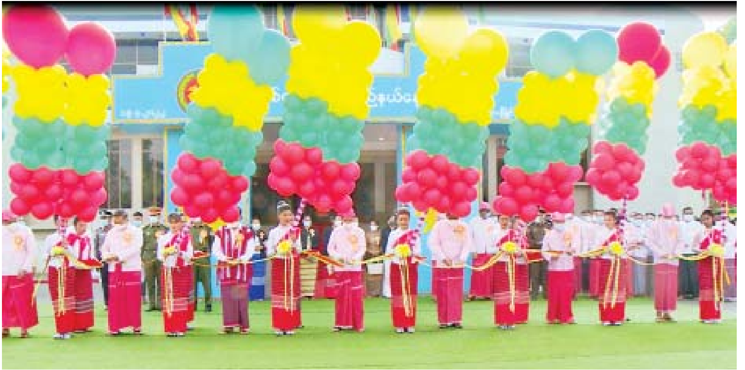
နိုင်ငံတော်စီမံအုပ်ချုပ်ရေးကောင်စီအဖွဲ့ဝင် ဒေါက်တာ ဗညားအောင်မိုးနှင့် မန်းငြိမ်းမောင်၊ နယ်စပ်ရေးရာဝန်ကြီးဌာန ပြည်ထောင်စုဝန်ကြီး ဒုတိယဗိုလ်ချုပ်ကြီး ထွန်းထွန်းနောင်၊ တိုင်းရင်းသားလူမျိုးများရေးရာဝန်ကြီးဌာန ပြည်ထောင်စုဝန်ကြီး ဦးစောထွန်းအောင်မြင့်နှင့် တာဝန်ရှိသူများ (၄၈)နှစ်မြောက် မွန်ပြည်နယ်နေ့ အထိမ်းအမှတ်ပြခန်းများကို ဖဲကြိုးဖြတ်ဖွင့်လှစ်ပေးစဉ်။

ထို့နောက် မွန်ပြည်နယ်နေ့ အထိမ်းအမှတ်အခမ်းအနားကို ဆက်လက်ကျင်းပရာ သဘာပတိအဖွဲ့ဝင်များအဖြစ် မွန်ပြည်နယ်ဝန်ကြီးချုပ် ဦးဇော်လင်း