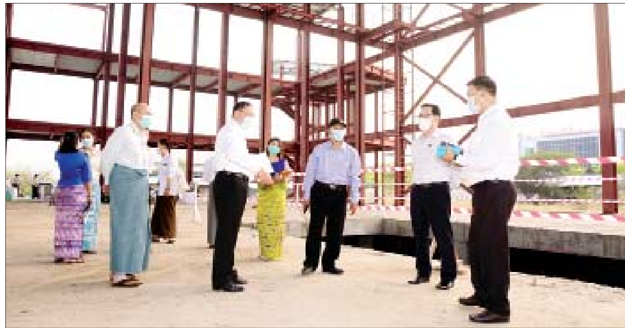
ပြည်ထောင်စုဝန်ကြီး ဦးမောင်မောင်အုန်း မန္တလေးမြို့ရှိ မြန်မာအနုပညာဗဟိုဌာန တည်ဆောက်ပြီးစီးမှုကို ကြည့်ရှုစစ်ဆေးစဉ်။