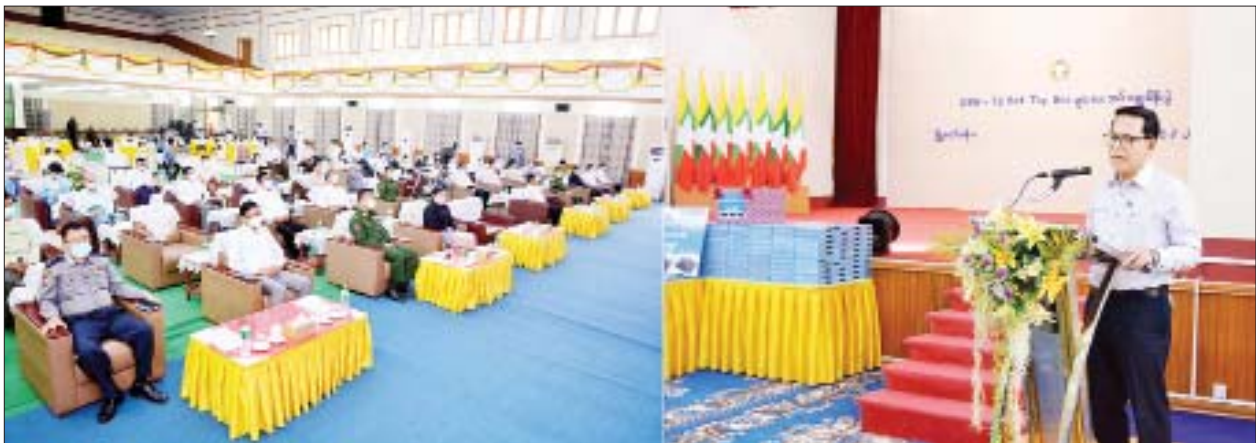
ပြည်ထောင်စုဝန်ကြီး ဦးမောင်မောင်အုန်း မြန်မာ့အသံနှင့်ရုပ်မြင်သံကြား ဖမ်းယူကြည့်ရှုမှုလွယ်ကူစေရန် DVB-T2 Set Top Box များ ပေးအပ်လျှင်ဒါန်းပွဲအခမ်းအနားတွင် အမှာစကားပြောကြားစဉ်။

ယဉ်ကျေးမှုအနုပညာ အရည်အသွေးသည် နိုင်ငံတစ်နိုင်ငံ၊ လူမျိုးတစ်မျိုး၏တန်ဖိုး (သို့မဟုတ်) ဂုဏ်ဒြပ်ဟု ဆိုရမည်ဖြစ်ပါကြောင်း၊