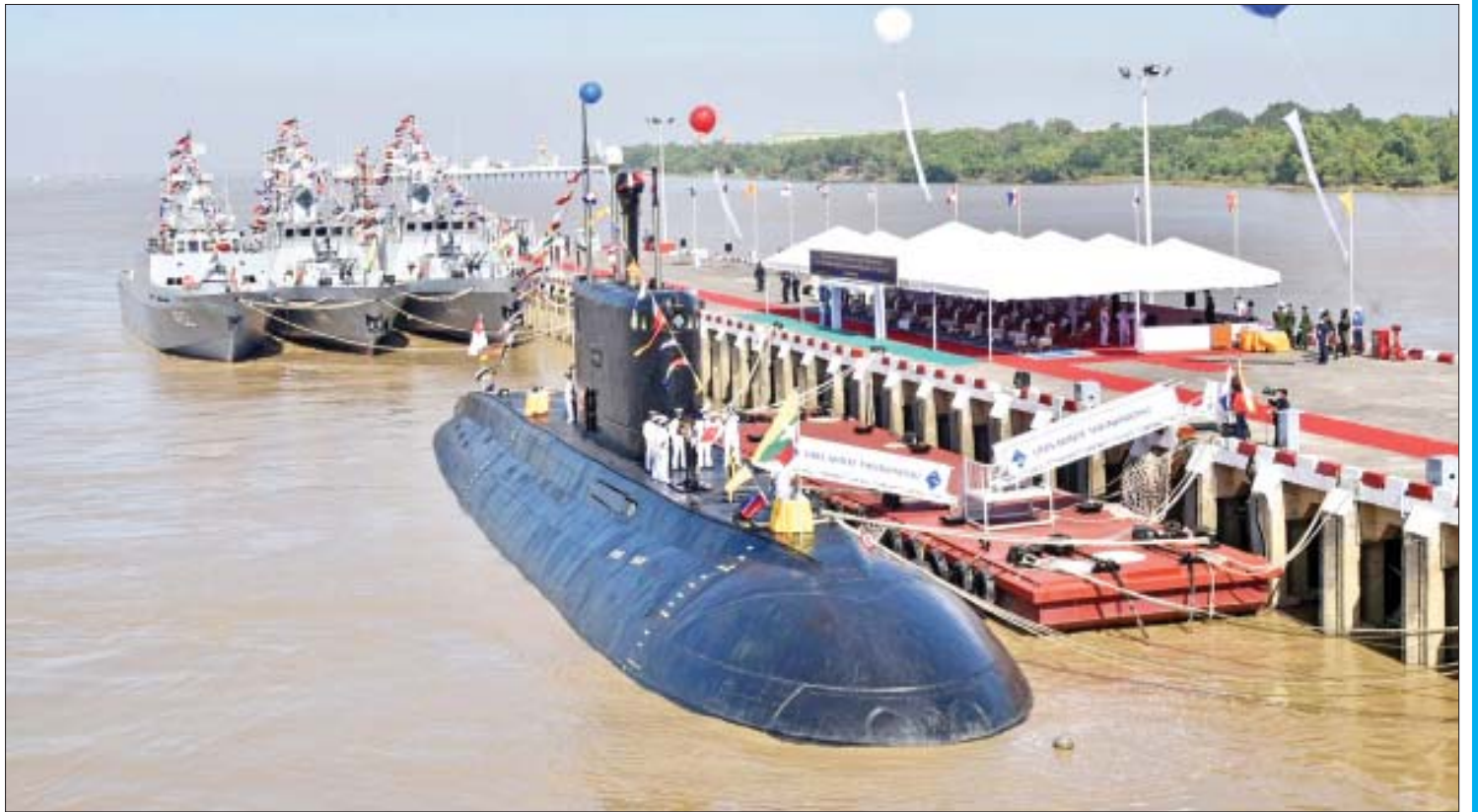
မြန်မာ့တပ်မတော် (ရေ) ပိုင် ပထမဆုံး ရေငုပ်သင်္ဘောစစ်ရေယာဉ် မင်းရဲသိင်္ခီသူကို တွေ့ရစဉ်။

စစ်ရေးနည်းအရ ကျူးကျော်သိမ်းပိုက်တဲ့ နမူနာပုံစံတွေကို အာဖဂန်နစ္စတန်၊ အီရတ်၊ ဆီးရီးယား၊ လစ်ဗျားစစ်ပွဲတွေမှာ မြင်ကြည့်နိုင်ပါတယ်။ စစ်အင်အား၊ စီးပွားရေးအင်အား၊ နည်းပညာအင်အား အဘက်ဘက်က အဆမတန်သာလွန်တောင့်တင်းတဲ့ နိုင်ငံတွေဟာ အင်အားကြီးနိုင်ငံတွေပဲ ဖြစ်ပါတယ်။