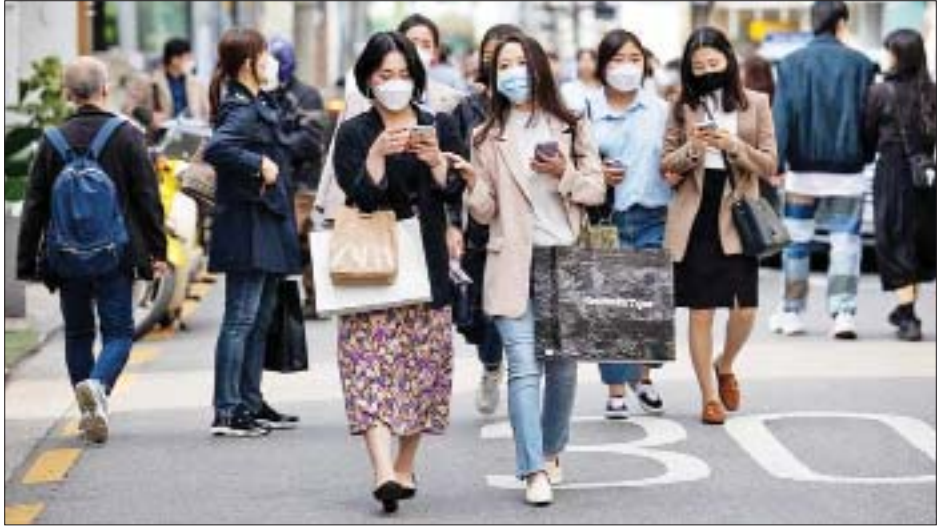
ရေ၏ ၈၆ ဒသမ ၆ ရာခိုင်နှုန်း)အား ကာကွယ်ဆေး ၆၃ ရာခိုင်နှုန်း) သည် ကာကွယ်ဆေး ထပ်ဆောင်း အပြည့်အဝထိုးနှံပေးပြီးဖြစ်သည်။ ထိုးနှံမှုခံယူပြီးဖြစ်သည်။ ကိုးကား - ဆင်ဟွာ ထိုပြင် ပြည်သူ ၃၃၃၇၆၀၀ ဦး (နိုင်ငံလူဦးရေ၏ ဘာသာပြန် - အောင်ကျော်ကျော်

လက်ရှိအချိန်အထိ နိုင်ငံရပ်ခြားမှ ပြန်လည်ရောက်ရှိလာသည့် ရောဂါကူးစက်ခံရသူအရေအတွက် ၃၀၆၀၂ ဦးရှိသည်။ သေဆုံးသူပေါင်း ၁၂၀၀၀ ဦးရှိ ရောဂါပြင်းထန်စွာ ခံစားနေရသူ ၁၀၄၉ ဦးရှိကြောင်း ကျန်းမာရေးအာဏာပိုင်များက ဆိုသည်။ လက်ရှိတွင် ကိုဗစ်-၁၉ ရောဂါကူးစက်မှုကြောင့် ၃၁၉ ဦး ထပ်မံသေဆုံးခဲ့ရာ အဆိုပါရောဂါကြောင့် သေဆုံးသူပေါင်း ၁၂၀၀၀ ဦးရှိပြီဖြစ်သည်။ တောင်ကိုရီးယားအစိုးရက ကိုဗစ်-၁၉ ရောဂါကာကွယ်ဆေးထိုးနှံပေးမှုအစီအစဉ်ကို အရှိန်မြှင့်ဆောင်ရွက်လျက်ရှိရာ လက်ရှိအချိန်ထိ ပြည်သူ ၄၄၉၂၅၈၀၅ ဦး (နိုင်ငံလူဦးရေ၏ ၈၇ ဒသမ ၅ ရာခိုင်နှုန်း)အား ကာကွယ်ဆေးပထမအကြိမ်ထိုးနှံပေးပြီးဖြစ်သည်။ ပြည်သူ ၄၄၄၅၆၀၃ ဦး (နိုင်ငံလူဦး