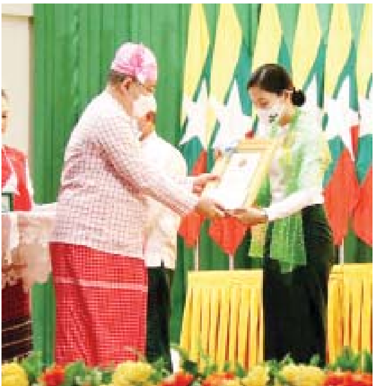
ပြည်ထောင်စုဝန်ကြီး ဦးစောထွန်းအောင်မြင့် မွန်ပြည်နယ်နေ့အထိမ်းအမှတ် ပြည်နယ်ဂုဏ်ဆောင်ထူးချွန်သူတစ်ဦးအား ဆုပေးအပ်ချီးမြှင့်စဉ်။