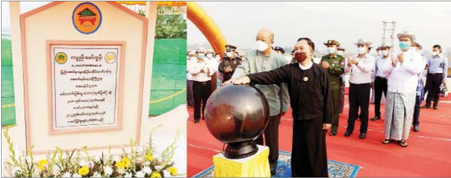
နိုင်ငံတော်စီမံအုပ်ချုပ်ရေးကောင်စီဝင် Jeng Phang နော်တောင်နှင့် ဦးရွှေကြိမ်းတို့က စစ်တောင်းတံတား (အုတ်ဖြတ်) ကမ္ဘည်းမော်ကွန်းကျောက်စာတိုင်ကို စက်ခလုတ်နှိပ်ဖွင့်လှစ်ပေးစဉ်။

ရှေးဦးစွာ နိုင်ငံတော်စီမံအုပ်ချုပ်ရေး ကောင်စီဝင် Jeng Phang နော်တောင်က မြန်မာနိုင်ငံသည် တိုင်းရင်းသားလူမျိုး ၁၃၅ မျိုးနှင့် စုစည်းညီညွတ်စွာနေထိုင်ကြသော ပြည်ထောင်စုမြန်မာနိုင်ငံတော်ကြီးဖြစ်ပါကြောင်း၊ တိုင်းဒေသကြီး/ပြည်နယ် အသီးသီးတွင် တိုင်းရင်းသားပြည်သူများ၏ လူမှုရေး၊ စီးပွားရေး၊ ပညာရေး၊ ကျန်းမာရေး များ လူတန်းစေ့နေထိုင်နိုင်စေရန် အခြေခံ အဆောက်အအုံများဖြစ်သည့် ပို့ဆောင် ဆက်သွယ်ရေးကဏ္ဍတွင် ပါဝင်သော လမ်း၊ တံတားများ ကောင်းမွန်ရေးနှင့် လျှပ်စစ်မီး ရရှိရေးကို ဦးစားပေးဆောင်ရွက်ပေးလျက် ရှိပါကြောင်း၊ လမ်းပန်းဆက်သွယ်ရေးများ ကောင်းမွန်၍ လုံခြုံချောမွေ့မှသာ တိုင်းရင်းသားပြည်သူများ အပြန်အလှန် ကူးလူးဆက်သွယ် သွားလာနိုင်ပြီး ချစ်ကြည်ရင်းနှီးမှုများရရှိစေမည်ဖြစ်ပါ ကြောင်း။