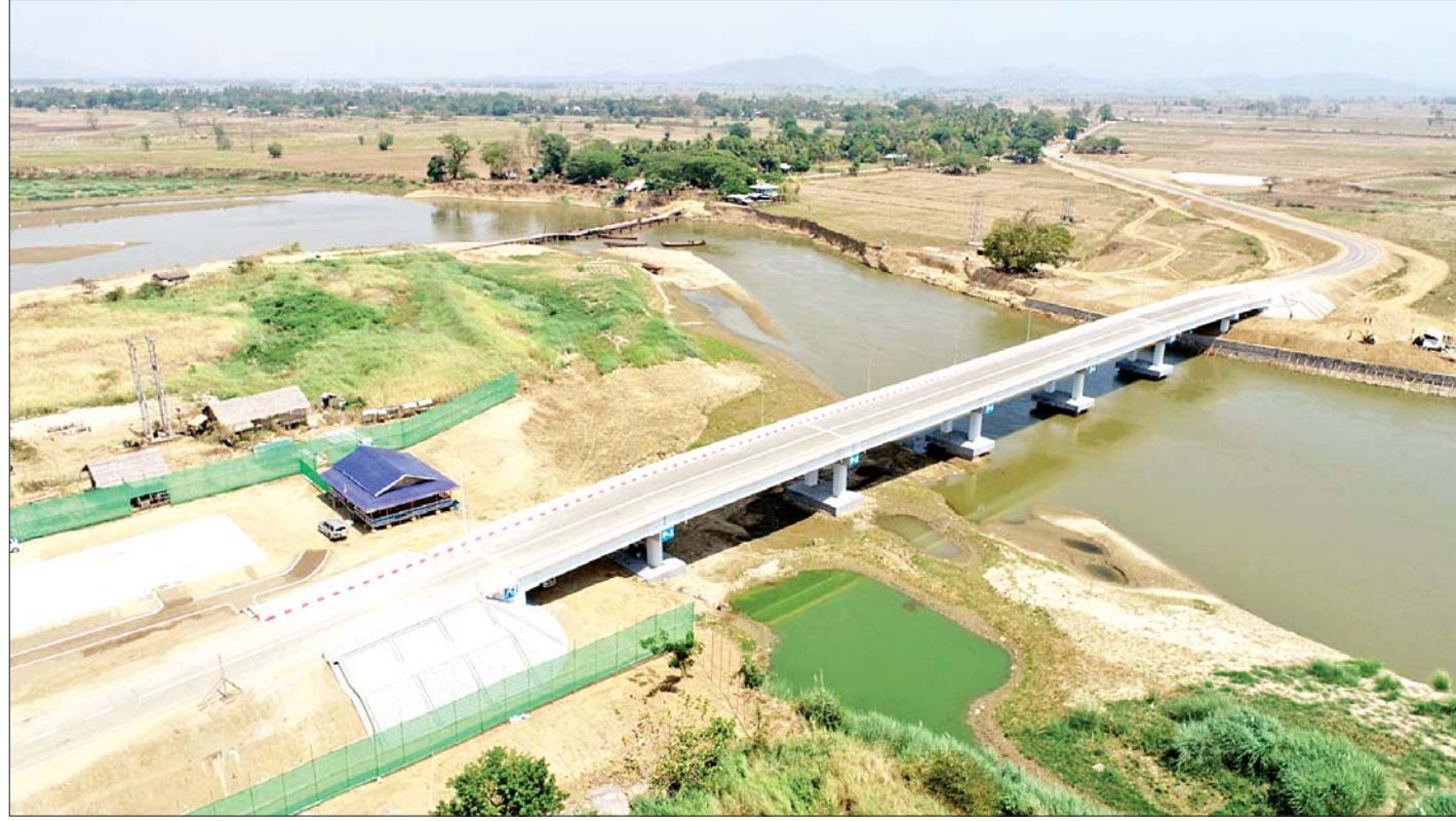
စစ်တောင်းမြစ်ကူးတံတား(အုတ်ဖြတ်)ကို တွေ့ရစဉ်။

နိုင်ငံတစ်ဝန်း၌ လူငယ်ရေးရာ အသိပညာပေးဟောပြောပွဲများ ကျင်းပ စာမျက်နှာ » ၁၁