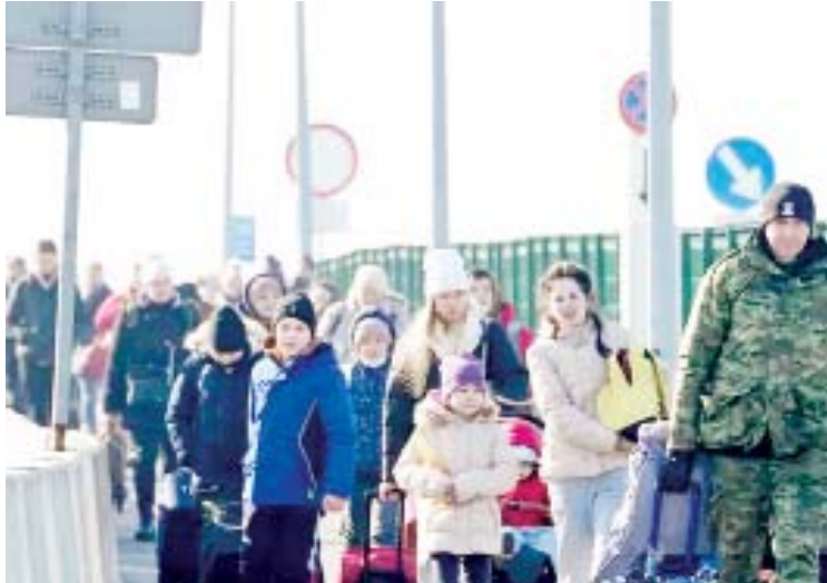
ဒုက္ခသည်များသည် ပိုလန်နိုင်ငံမှ အခြားရိုကြောင်း သိရသည်။ ပိုလန်အစိုးရက ယူကရိန်းဒုက္ခသည်

ကီဗ် မတ် ၃ ရုရှား-ယူကရိန်း ပဋိပက္ခဖြစ်ပွားမှုကြောင့် ယူကရိန်းနိုင်ငံမှ အိမ်နီးချင်းနိုင်ငံများသို့ ရွှေ့ပြောင်းသွားသည့် စစ်ဘေးရှောင်ဒုက္ခသည် ၈၇၀၀၀၀ ကျော် ရှိလာပြီဖြစ်ကြောင်း ကုလသမဂ္ဂ ဒုက္ခသည်များဆိုင်ရာ မဟာမင်းကြီးရုံးက ယနေ့ ပြောကြားသည်။ ယင်းတို့အနက် ၄၅၀၀၀၀ သည် ပိုလန်နိုင်ငံအတွင်းသို့ ရောက်ရှိနေပြီဖြစ်ကြောင်း သိရသည်။ ပိုလန်နိုင်ငံမြို့တော် ဝါဆောရှိ ဘူတာရုံတစ်ခု၌ ခရီးဆောင်လက်ဆွဲသေတ္တာများ ကိုင်ဆောင်ထားသည့် စစ်ဘေးရှောင် ယူကရိန်းနိုင်ငံသားများနှင့် ပြည့်နှက်လျက်ရှိကြောင်းနှင့် အဆိုပါ