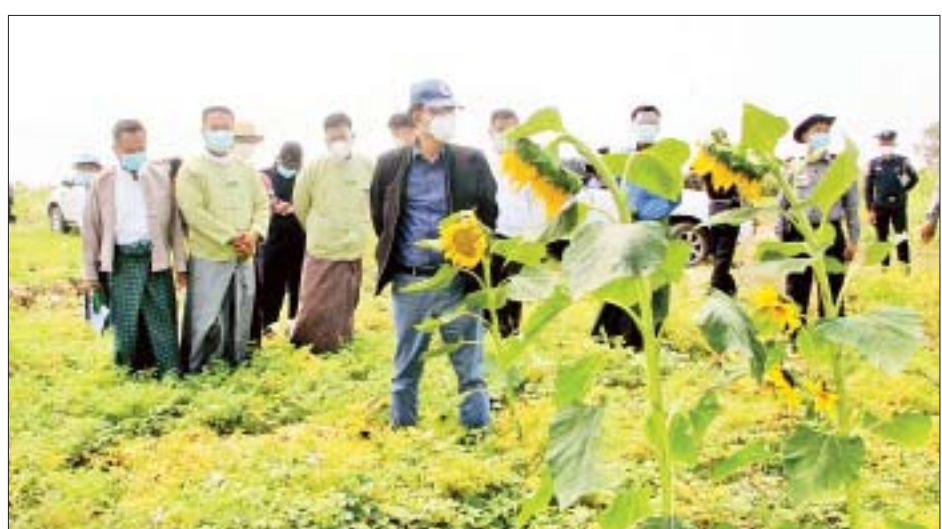
ခရမ်းချဉ် ရှစ်ဧက စိုက်ပျိုးအောင်မြင်မှုကို လည်းကောင်း၊ သာယာဝတီဘူတာသို့ လည်းကောင်း