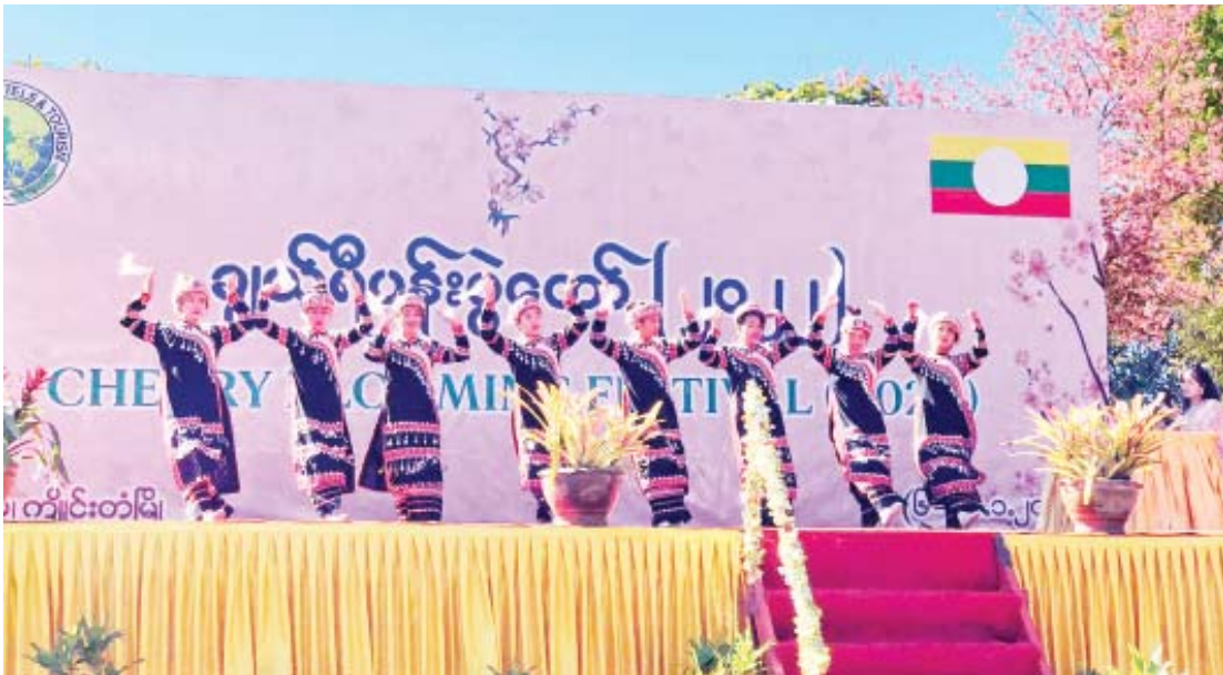
လွိုင်မွေတောင်စခန်းမြို့လေး၌ ဇန်နဝါရီ ၆ ရက်မှ ၁၀ ရက်အထိ ကျင်းပသည့် ချယ်ရီပန်းပွဲတော်တွင် တိုင်းရင်းသားရိုးရာအကဖြင့် ဖျော်ဖြေစဉ်။

ကျိုင်းတုံ၊ လွိုင်မွေတောင်စခန်းမြို့လေးတွင် ပထမဆုံးအကြိမ် ကျင်းပပြုလုပ်သော ချယ်ရီပန်းပွဲတော်ဖွင့်ပွဲအခမ်းအနားသို့ မမျှော်လင့်စွာ ရောက်ဖြစ်ခဲ့သည်။ လွိုင်မွေတောင်စခန်းမြို့သည် ပင်လယ်ရေမျက်နှာပြင်အထက် ၅၅၄၂ ပေ အမြင့်တွင်တည်ရှိပြီး တစ်နှစ်ပတ်လုံး ရာသီဥတုအေးမြသဖြင့် ကိုလိုနီခေတ်ကာလက အင်္ဂလိပ်အာဏာပိုင်များ ရုံးစိုက်ရာမြို့ဖြစ်ခဲ့သည်။ ၁၉၁၈ ခုနှစ်မှ ၁၉၄၂ ခုနှစ်အထိ ရုံးစိုက်ခဲ့သည်ဟု သိရှိရပြီး မြို့ပေါ်တွင် ကိုလိုနီခေတ်လက်ရာများဖြစ်သော နှစ်တစ်ရာခံအိမ် (Governor House)၊ Catholic Church၊ စာတိုက်ဟောင်း စသည့် လေ့လာလည်ပတ်စရာ အဆောက်အအုံအများအပြား ကျန်ရှိနေသည့်အတွက် ကျိုင်းတုံနှင့် လွိုင်မွေဒေသခရီးသွားလုပ်ငန်း ဖွံ့ဖြိုးရေးအတွက် များစွာအထောက်အကူပြုလျက်ရှိသည်။