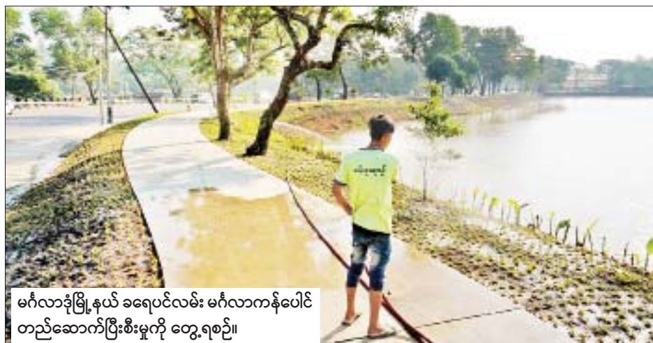
မင်္ဂလာဒုံမြို့နယ် ခရေပင်လမ်း မင်္ဂလာကန်ပေါင် တည်ဆောက်ပြီးစီးမှုကို တွေ့ရစဉ်။

မင်္ဂလာဒုံမြို့နယ် ခရေပင်လမ်းရှိ မင်္ဂလာကန် သည် ပြည်လမ်း အင်းလျားကန်နှင့် ကန်တော်ကြီး သဘာဝဥယျာဉ်များကဲ့သို့ သဘာဝပတ်ဝန်းကျင် အခြေခံကောင်းသော နေရာတစ်ခုအဖြစ် အပန်းဖြေ နားနေနိုင်ရန်၊ ပြည်သူများအတွက် စိမ်းလန်းသော ဧရိယာတစ်ခု ဖြစ်တည်ပေါ်ပေါက်လာစေရန် ရန်ကုန် မြို့တော်စည်ပင်သာယာရေးကော်မတီက အကောင် အထည်ဖော် တည်ဆောက်လျက်ရှိရာ ယခုအခါတွင် ကန်ပေါင် စိမ်းလန်းစိုပြည်သာယာလှပရေးနှင့် စက်ဘီးလမ်း၊ စင်္ကြံလမ်း၊ အရည်ပေ ၁၂၀၀ ခန့် ကွန်ကရစ်လမ်းတို့ကို တည်ဆောက်ပြီးစီးနေပြီ ဖြစ်သည်။