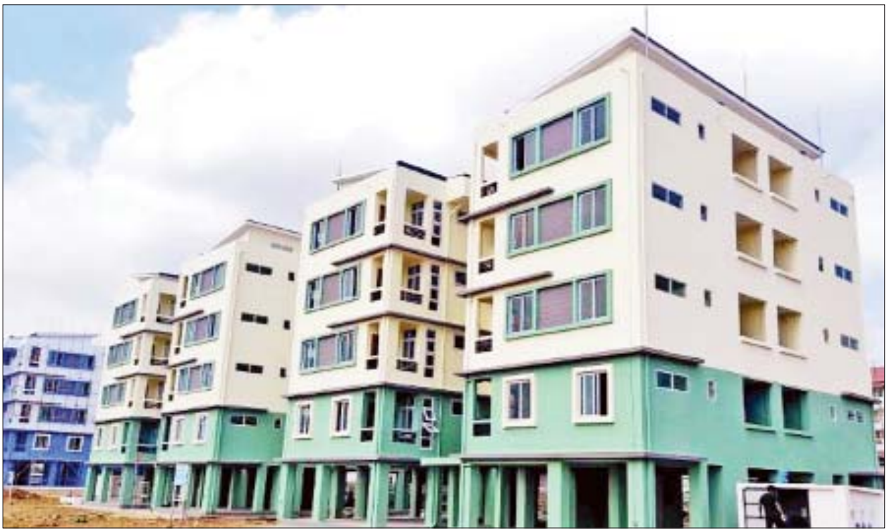
ပြည်သူ့အငှားအိမ်ရာစီမံကိန်း(ရန်ကုန်) ပထမအဆင့်ဆောင်ရွက်ပြီးစီးမှုကို တွေ့ရစဉ်။

ထိုင်း-မြန်မာနှစ်နိုင်ငံ နယ်စပ်ဒေသတွင် ဘတ်/ကျပ် တိုက်ရိုက်အသုံးပြုပေးချေမှု ဆောင်ရွက်ခွင့်ပြု ပြည်ထောင်စုသမ္မတမြန်မာနိုင်ငံတော် မြန်မာနိုင်ငံတော်ဗဟိုဘဏ် အမိန့်ကြော်ငြာစာအမှတ် ၅/၂၀၂၂ ၁၃၈၃ ခုနှစ်၊ တပေါင်းလဆန်း ၂ ရက် (၂၀၂၂ ခုနှစ်၊ မတ်လ ၃ ရက်) ၁။ မြန်မာနိုင်ငံတော်ဗဟိုဘဏ်သည် နိုင်ငံခြားသုံးငွေစီမံခန့်ခွဲမှုဥပဒေပုဒ်မ ၁၇ နှင့် ပုဒ်မ ၂၂ တို့အရ အပ်နှင်းထားသော လုပ်ပိုင်ခွင့်ကို ကျင့်သုံး၍ ဤအမိန့်ကြော်ငြာစာအား ထုတ်ပြန်လိုက်သည်။ ၂။ ထိုင်း-မြန်မာ နှစ်နိုင်ငံကုန်သွယ်မှုကို တိုးမြှင့်ရန်နှင့် ကုန်စည်စီးဆင်းမှုမြန်ဆန်ချောမွေ့စေရန်၊ နှစ်နိုင်ငံငွေပေးချေမှုနှင့် စာရင်းရှင်းလင်းမှုစနစ် လွယ်ကူချောမွေ့စေရန်နှင့် ASEAN Financial Integration ၏ ရည်ရွယ်ချက်များနှင့်အညီ ပြည်တွင်း ငွေကြေးသုံးစွဲမှုကို တိုးမြှင့်ရန်အတွက် ရည်ရွယ်၍ ထိုင်း-မြန်မာနှစ်နိုင်ငံ နယ်စပ်ဒေသတွင် ဘတ်/ကျပ် တိုက်ရိုက်အသုံးပြု ပေးချေမှုကို ဆောင်ရွက်ခွင့်ပြုလိုက်သည်။ ၃။ ဘတ်/ကျပ် တိုက်ရိုက်အသုံးပြုပေးချေမှုကို ဆောင်ရွက်ခွင့်ရသည့်ဘဏ်(Designated Bank)များတွင် နယ်စပ်ကုန်သွယ်မှု ဆောင်ရွက်မည့် သွင်းကုန်တင်သွင်းသူများနှင့် ပို့ကုန်တင်ပို့သူများ၏ ဘတ်စာရင်းဖွင့်လှစ်ခွင့်ပြုသည်။ ၄။ သို့ဖြစ်၍ ဆောင်ရွက်ခွင့်ပြုသည့် Designated Bank များသည် ထိုင်း-မြန်မာ နှစ်နိုင်ငံ နယ်စပ်ကုန်သွယ်မှုတွင် ဘတ်/ကျပ် တိုက်ရိုက်အသုံးပြုပေးချေရေးလုပ်ငန်းစဉ်များဆိုင်ရာလမ်းညွှန်ချက် (Guideline) အား လိုက်နာဆောင်ရွက်ရန်ဖြစ်သည်။ ၅။ ဤအမိန့်ကြော်ငြာစာသည် ထုတ်ပြန်သည့်နေ့မှစ၍ အကျိုးသက်ရောက်စေရမည်။ သန်းညိုနိုး ဥက္ကဋ္ဌ မြန်မာနိုင်ငံတော်ဗဟိုဘဏ်