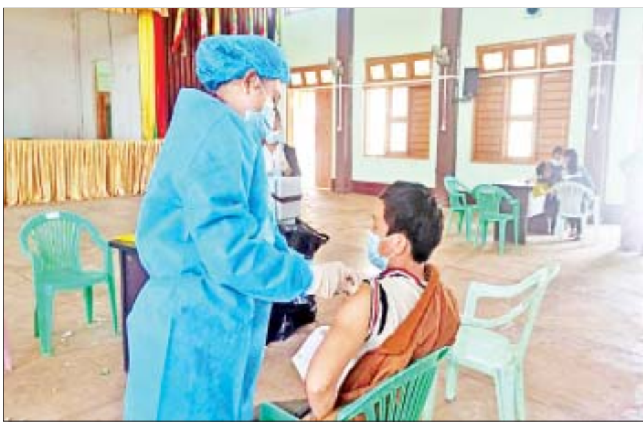
မြို့နယ် ခုနစ်မြို့နယ်တို့၌ ဒေသခံပြည်သူ ၃၁၁၁ ဦး၊ မွန်ပြည်နယ်နှင့် ကရင်ပြည်နယ်အတွင်းရှိ မြို့နယ် ၂၆ ရှစ်မြို့နယ်တို့၌ ဒေသခံပြည်သူ ၁၄၉၃ ဦး၊ ရန်ကုန်တိုင်းဒေသကြီး တာမွေမြို့နယ်၌ ဒေသခံပြည်သူ ၄၄၀၊ ဧရာဝတီတိုင်းဒေသကြီးအတွင်းရှိ မြို့နယ် ၂၆ မြို့နယ်၌ ဒေသခံပြည်သူ ၁၀၇၄၃ ဦး၊ ရခိုင်ပြည်နယ်

နေပြည်တော် မတ် ၃ တိုင်းဒေသကြီးနှင့် ပြည်နယ်အသီးသီးတို့၌ သံဃာတော်များ၊ သာသနာ့နယ်ဝင်သီလရှင်များ၊ ဘာသာရေးခေါင်းဆောင်များအပါအဝင် လူမျိုးမရွေး ဘာသာမရွေး အသက် ၄၀ အထက် ဒေသခံပြည်သူများ၊ အကျဉ်းသား အကျဉ်းသူများ၊ မသန်စွမ်းသူများ၊ တိုင်းရင်းသားလက်နက်ကိုင်အဖွဲ့များ၊ နာတာရှည်ရောဂါအခံရှိသူများ၊ ကယ်ဆယ်ရေးစခန်းများ၊ ယာယီတိုက်ပွဲရောင်စခန်းများအတွင်းရှိ ပြည်သူများ၊ အသက် ၁၂ နှစ်နှင့်အထက် အခြေခံပညာအလယ်တန်းနှင့် အထက်တန်းအဆင့် ကျောင်းသား ကျောင်းသူများ စသည့် ဦးတည်အုပ်စုများ သတ်မှတ်၍ တပ်မတော်ဆေးအဖွဲ့များ၊ ပြည်သူ့ဆေးရုံများမှ ဆရာဝန်များ၊ သူနာပြုများ၊ ကျန်းမာရေးဝန်ထမ်းများနှင့် စေတနာ့ဝန်ထမ်းများက ကာကွယ်ဆေးထိုးခြင်း လုပ်ငန်းများကို ဆောင်ရွက်ပေးလျက်ရှိသည်။