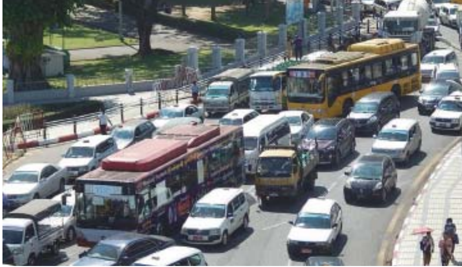
ခရီးသည်တင်ယာဉ်များ၊ တက္ကစီအရောင်းအဝယ်ဈေးကွက်နှင့် ကိုယ်ပိုင်ယာဉ်များ မောင်းနှင်နေသည့် ရန်ကုန်မြို့လယ်ကောင်၏ စည်ကားမှုမြင်ကွင်းကို တွေ့ရစဉ်။

“ဒီရက်ပိုင်းတွေမှာ ပြည်တွင်းစက်သုံးဆီ ဈေးနှုန်းတွေက အဆမတန်မြင့်တက်နေတော့ အင်ဂျင်ပါဝါနည်းတဲ့ 660 CC Suzuki အုပ်စုနဲ့ Dihatsu အမျိုးအစားတွေအပါအဝင် အင်ဂျင်ပါဝါသေးတဲ့ တိုယိုတာအမျိုးအစားကားလေးတွေကိုပဲတော်တော် များများက အဝယ်လိုက်လာကြတယ်။ ဓာတ်ဆီသုံး အင်ဂျင်ပါဝါ 1500 CC၊ 1800 CC၊ ဒီဇယ် 2C နဲ့ 3C ယာဉ်တွေကတော့ ဒီကာလမှာ နည်းနည်း အဝယ်အေးနေပြီး CNG သုံး ကားတွေကျပြန်တော့ လည်း အဝယ်လိုက်လာပါတယ်။ ဒါက လက်ရှိ လမ်းကြောင်းပေါ်မှာ အသုံးပြုနေကြတဲ့ ကားတွေရဲ့ ဈေးကွက်ဖြစ်ပြီး ကားကုမ္ပဏီကြီးတွေ၊ စက်ရုံတွေနဲ့ ကားအရောင်းပြခန်း Show Room တွေက ရောင်းတဲ့ အိမ်စီးအသစ်စက်စက်ကားတွေကတော့ ဒီရက်ပိုင်း အရောင်းအဝယ်အေးနေပါတယ်” ဟု ရန်ကုန် ကားဈေးကွက်အသိုင်းအဝိုင်းရှိ ကားအရောင်းအဝယ် လုပ်ကိုင်နေသူတစ်ဦးက ပြောသည်။