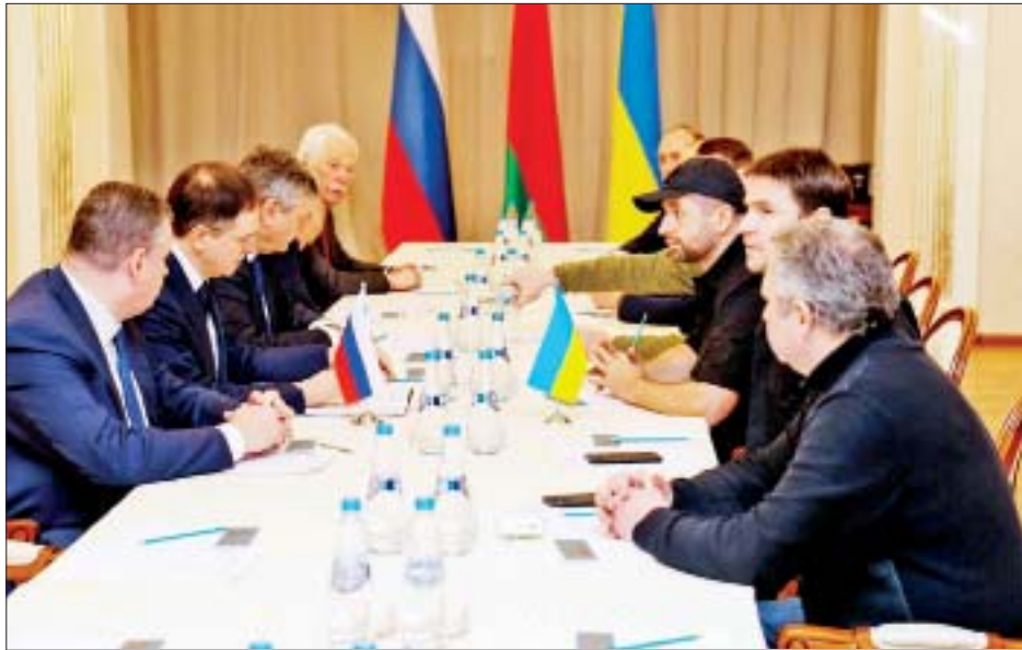
ဖေဖော်ဝါရီ ၂၈ ရက်က ရုရှား-ယူကရိန်းငြိမ်းချမ်းရေးဆွေးနွေးသူများ ပထမအကြိမ် ဆွေးနွေးစဉ်။

ဖေဖော်ဝါရီ ၂၈ ရက်တွင် ကျင်းပခဲ့သည့် နှစ်နိုင်ငံ ပထမအကြိမ် ဆွေးနွေးပွဲသည် နှစ်ဖက်