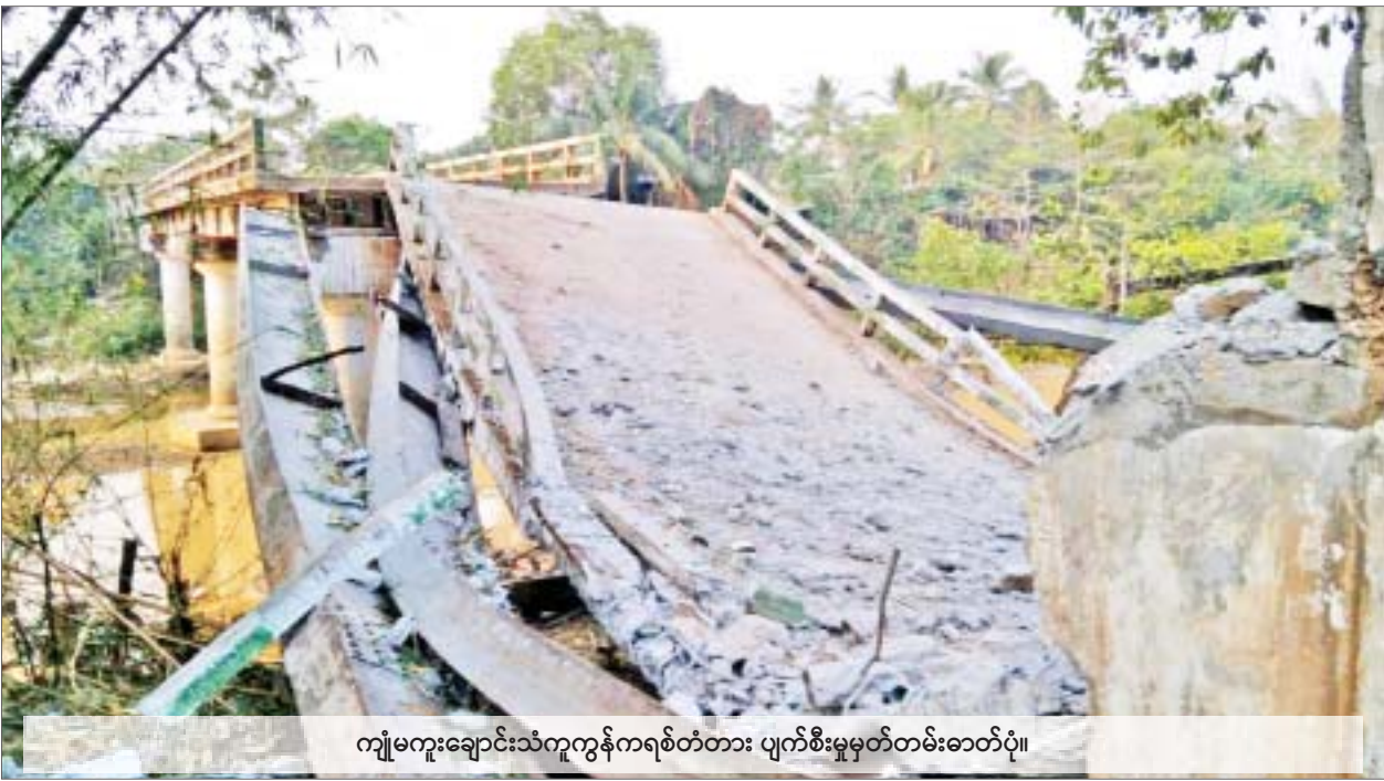
ကျုံမကူးချောင်းသံကူကွန်ကရစ်တံတား ပျက်စီးမှုမှတ်တမ်းဓာတ်ပုံ။

အမျိုးသားစည်းလုံးညီညွတ်ရေးနှင့် ထာဝရငြိမ်းချမ်းရေးအတွက် အမျိုးသားစည်းလုံး ညီညွတ်ရေးနှင့် ငြိမ်းချမ်းရေးဖော်ဆောင်မှုပဟိကော်မတီ၊ လုပ်ငန်းကော်မတီ၊ ညှိနှိုင်းရေး ကော်မတီ စတဲ့ကော်မတီ ၃ ရပ်ကိုဖွဲ့စည်းခဲ့ပြီး ဆောင်ရွက်နေလျက်ရှိပါတယ်။ ကျွန်တော် တို့ရဲ့ ညှိနှိုင်းရေးကော်မတီဟာ ယနေ့အထိ NCA လက်မှတ်ရေးထိုးပြီးတဲ့ တိုင်းရင်းသား လက်နက်ကိုင်အဖွဲ့အစည်းတွေနဲ့ ၁၆ ကြိမ်၊ NCA လက်မှတ်ရေးထိုးထားခြင်းမပြုသေး တဲ့ EAO တွေနဲ့ ၉ ကြိမ်၊ နိုင်ငံရေးပါတီတွေနဲ့ ၇ ကြိမ်၊ ဘာသာရေးခေါင်းဆောင်တွေ၊ ငြိမ်းချမ်းရေးအကျိုးဆောင်အဖွဲ့တွေနဲ့ ၂ ကြိမ် စုစုပေါင်း ၃၄ ကြိမ်တွေ့ဆုံခဲ့ပါတယ်။ တပ်မတော်အနေနဲ့ ၂၀၁၈ ခုနှစ်၊ ဒီဇင်ဘာလ ၂၁ ရက်နေ့မှစပြီး ၂၀၂၂ ခုနှစ်၊ ဖေဖော်ဝါရီလ ၂၈ ရက်နေ့အထိ ပစ်ခတ်တိုက်ခိုက်မှုရပ်စဲရေးအတွက် ထုတ်ပြန်ချက်ပေါင်း အကြိမ်(၂၀)ပြုလုပ်ပေးခဲ့ပြီးဖြစ်ပါတယ်။ ၂၀၂၂ ခုနှစ် နှစ်ဆန်းပိုင်းမှာ ကမ္ဘောဒီးယား ဝန်ကြီးချုပ်နဲ့တွေ့ဆုံမှုအပြီး နှစ်နိုင်ငံသဘောတူထုတ်ပြန်ချက်မှာ ယခုနှစ်ကုန်ပိုင်းအထိ ပစ်ခတ်တိုက်ခိုက်မှုရပ်စဲရေးကို ဆောင်ရွက်ပေးသွားမှာဖြစ်ပါတယ်။ (နိုင်ငံတော်စီမံအုပ်ချုပ်ရေးကောင်စီဥက္ကဋ္ဌ နိုင်ငံတော်ဝန်ကြီးချုပ် ဗိုလ်ချုပ်မှူးကြီးမင်းအောင်လှိုင်၏ နိုင်ငံတော်စီမံအုပ်ချုပ်ရေးကောင်စီ(၁)နှစ်ပြည့် နိုင်ငံတော်တာဝန် ထမ်းဆောင်ခဲ့မှုနှင့်ပတ်သက်၍ ပြောကြားခဲ့သည့်မိန့်ခွန်းမှ ကောက်နုတ်ချက်)