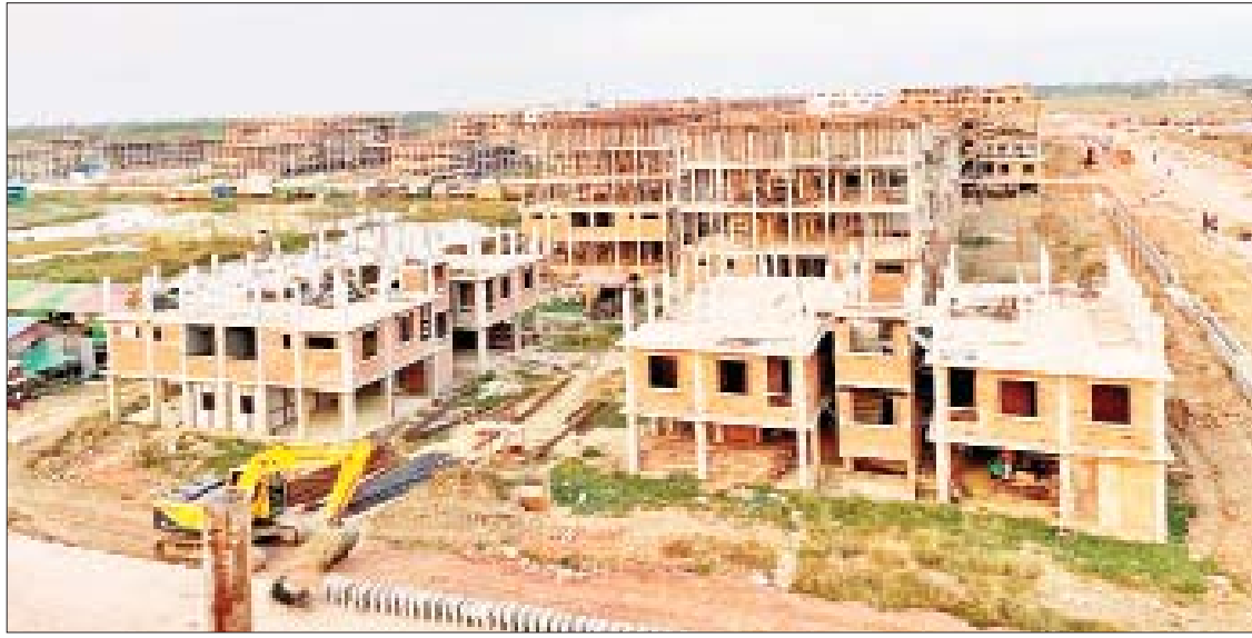
ပြည်သူ့အငှားအိမ်ရာစီမံကိန်း(ရန်ကုန်) ပထမအဆင့် ဆောင်ရွက်ပြီးစီးနေမှုကို တွေ့ရစဉ်။

ဒဂုံမြို့သစ် (တောင်ပိုင်း) မြို့နယ် အမှတ်(၂)လမ်းနှင့် မြို့ပတ်လမ်းဆုံမှ သရက်ပင်ချောင်း ရွာသွားလမ်းရှိ မြေ ဧရိယာ ၁၇၁ ဧကပေါ်၌ တည်ဆောက် လျက်ရှိသော ပြည်သူ့အငှားအိမ်ရာ စီမံကိန်း(ရန်ကုန်)ကို နိုင်ငံတော် အစိုးရဌာနအဖွဲ့ဖြင့် အကုန်ကျခံ ဆောင်ရွက်နေခြင်းဖြစ်ပြီး အဆင့်မြင့် နေအိမ်တိုက်ခန်းများအား တိုင်းဒေသကြီး အတွင်းရှိ အိမ်ရာမဝယံယူနိုင်သေးသည့် ဝင်ငွေနည်း ပြည်သူများ၊ အငြိမ်းစား ဝန်ထမ်းများ၊ အငြိမ်းစားယူရန် နီးကပ်နေ သည့် ဝန်ထမ်းများ၊ ဝင်ငွေနည်းကုမ္ပဏီ ဝန်ထမ်းများ ငှားရမ်းနေထိုင်နိုင်ရေး အဆင်ပြေစေရန် ရည်ရွယ်၍ မြို့ပြနှင့် အိမ်ရာဖွံ့ဖြိုးရေးဦးစီးဌာနက ဆောင်ရွက် နေခြင်း ဖြစ်သည်။