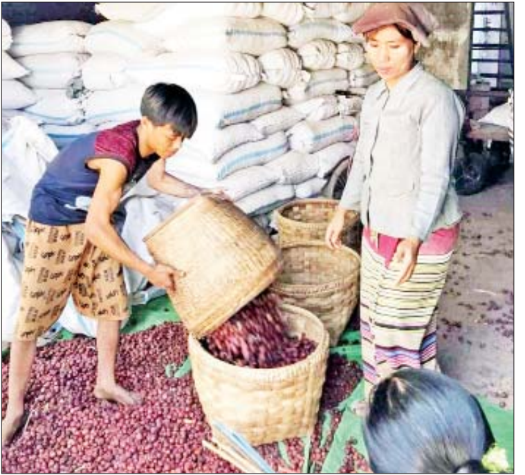
သွေးတိုးရောဂါပျောက်ဆေး စသည့် အဓိကထည့်သွင်း အသုံးပြုကြောင်း သိတိုင်းရင်းဆေးဝါးများ ဖော်စပ်ရာတွင် ရသည်။ လူလေး

ပြီးခဲ့သည့် ၁၀ နှစ်ခန့် ၂၀၁၀ ပြည့်နှစ် ဧပြီလကုန်က တရုတ်-မြန်မာ နယ်စပ်ကုန်သွယ်ရေး၏ အချက်အချာ မူဆယ် ၁၀၅ မိုင် လမ်းကြောင်းမှ ဝင်လာသည့် မြန်မာ့ပို့ကုန်များထဲတွင် နံပါတ်(၁) ပို့ကုန်အများဆုံးအဖြစ် ဆီးသီးခြောက်များဖြစ်ခဲ့ကြောင်း သိရသည်။ ထိုကာလက ၂ ရက်၊ ၃ ရက်အတွင်း တစ်ရက်လျှင် အနည်းဆုံးဆီးသီးခြောက် တန်ချိန် ၂၀၀ ကျော်မှ ၃၆၀ အထိရှိခဲ့ကြောင်း ဈေးကွက်မှတ်တမ်းများမှ သိရသည်။ ထိုကာလက ဆီးဆန်တစ်တန်လျှင် ၄၇၀၅ ဒေါ်လာ၊ မြန်မာငွေအားဖြင့် သိန်း ၄၀ အထိ တန်ဖိုးသတ်မှတ် အခွန်ပေးဆောင်ရသည့် ကုန်စည်ဖြစ်ကြောင်း သိရသည်။ ဆီးသီးအဆန်ကို တရုတ်နိုင်ငံက ဦးနှောက်နှင့် အာရုံကြောရောဂါပျောက်ဆေး၊ ကျောက်ကပ်နုလုံးအားတိုးဆေးနှင့်