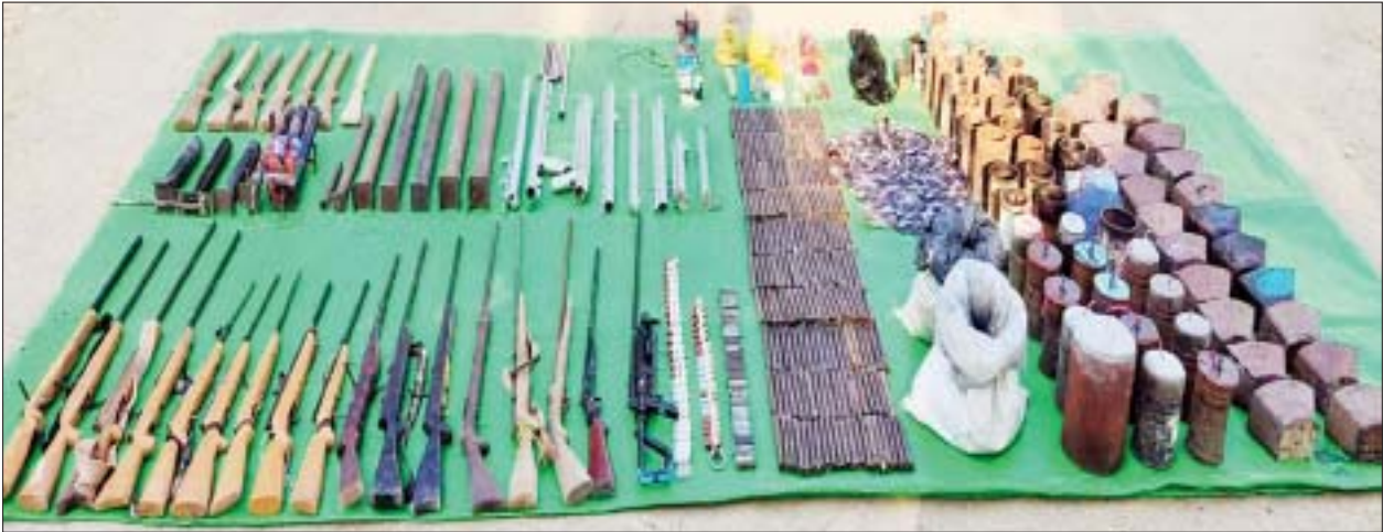
စစ်ကိုင်းတိုင်းဒေသကြီး ဝက်လက်မြို့နယ် ကျောက်တိုင်ကျေးရွာအတွင်း သိမ်းဆည်းရမိသည့် PDF အမည်ခံ အကြမ်းဖက်သမားများ၏ လက်နက်ခဲယမ်းများ၊ လက်လုပ်ခိုင်းနှင့် ဆက်စပ်ပစ္စည်းများကို တွေ့ရစဉ်။

နေပြည်တော် မတ် ၂ စစ်ကိုင်းတိုင်းဒေသကြီး ဝက်လက်မြို့နယ်၊ ယင်းမာပင်မြို့နယ်နှင့် ကျွန်းလှမြို့နယ်တို့အတွင်းရှိ အချို့ကျေးရွာများ၌ PDF အမည်ခံ အကြမ်းဖက်အဖွဲ့များ ခိုအောင်းနေထိုင်၍ အပြစ်မဲ့ဒေသခံပြည်သူ များနှင့် နိုင်ငံ့ဝန်ထမ်းများကို ခြိမ်းခြောက်သတ်ဖြတ်ခြင်း၊ နိုင်ငံပိုင် အဆောက်အအုံများ၊ အများပြည်သူနှင့်သက်ဆိုင်သော နေရာများကို ဖောက်ခွဲမီးရှို့ဖျက်ဆီးခြင်း၊ ဒေသခံပြည်သူလူထုနှင့် ခရီးသွားများကို အဓမ္မဆက်ကြေးတောင်းခံခြင်း စသည့် အဖျက်အမှောင့်လုပ်ရပ်များ လုပ်ဆောင်လျက်ရှိကြောင်း ရိုးသားစွာနေထိုင်လုပ်ကိုင် စားသောက်လို သည့် တာဝန်သိပြည်သူအချို့က စာမျက်နှာ ၁၅ ကော်လံ ၁ သို့ ၂