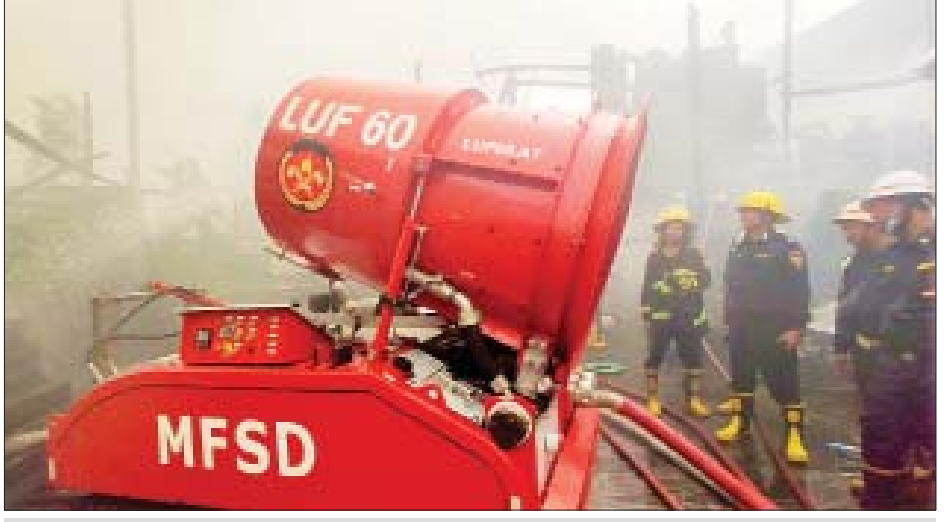
ဖေဖော်ဝါရီ ၂၈ ရက်က လှိုင်သာယာမြို့နယ် စက်မှုဇုန်(၄)ရှိ အထည်ချုပ်စက်ရုံ မီးလောင်မှုအား ငြိမ်းသတ်နေမှုကို တွေ့ရစဉ်။

✽ စာမျက်နှာ ၁၀ မှ သတင်းစဉ် နိုင်ငံရေးကဏ္ဍတွင် ဖောက်ကလန်စစ်ပွဲအကြောင်း ပါလာသည်။ ဖောက်ကလန်စစ်ပွဲဟူသည် နယ်မြေပိုင်ဆိုင်မှုဆိုင်ရာ သမိုင်းရန်ကြေးကို အာဂျင်တီးနားနှင့် ဗြိတိန်နိုင်ငံတို့စစ်တိုက်ပြီး စာရင်းရှင်းကြခြင်းဖြစ်သည်။ ဖောက်ကလန်ကျွန်းစုသည် အတ္တလန္တိတ်သမုဒ္ဒရာတောင်ပိုင်း မက်ဂျယ်လန်ရေလက်ကြား၏ အရှေ့ဘက် မိုင် ၃၀၀ ခန့်တွင် တည်ရှိသည်။ ၁၈၃၃ ခုနှစ်ကတည်းက ဗြိတိသျှတို့က ဖောက်ကလန်ကျွန်းစုကို သိမ်းပိုက်ထားခဲ့ပြီး ဗြိတိသျှ ပိုင်နယ်မြေအဖြစ် နှစ် ၁၀၀ ကျော်မျှရှိခဲ့သည်ဟု ဆိုသည်။ အာဂျင်တီးနားနိုင်ငံကလည်း ခေတ်အဆက်ဆက် ၎င်းတို့ပိုင်နယ်မြေ အဖြစ်ကြေညာကာ ပြန်လည်ရရှိရေး တောင်းဆိုခဲ့ကြသည်။ နှစ်ပေါင်း ၁၅၀ ခန့် နှစ်နိုင်ငံအငြင်းပွားခဲ့ကြသည်။ ၁၉၈၂ ခုနှစ် ဧပြီ ၂ ရက်တွင် အာဂျင်တီးနားတပ်များက ဖောက်ကလန် ကျွန်းစုကိုတက်ရောက် သိမ်းပိုက်ခဲ့ရာမှ စစ်ပွဲစတင်ခဲ့ခြင်းဖြစ်သည်။ စစ်ပွဲမှာ ရက်သတ္တပတ် ခြောက်ပတ်ကြာမြင့်ခဲ့သည်။ ၁၄-၆-၁၉၈၂ ရက်တွင် ဖောက်ကလန်ကျွန်းစုတွင် တပ်စွဲထားသော အာဂျင်တီးနား စစ်သည် တစ်သောင်းကျော် လက်နက်ချခဲ့၍ စစ်ပွဲပြီးဆုံးသွားခဲ့လေ သည်။ တကယ်တော့ ဇာတိပညာဂုဏ်မာနကြောင့်သာ နယ်မြေပိုင်ဆိုင် မှုကို တောင်းဆိုနေခြင်းဖြစ်သော်လည်း ဖောက်ကလန်ကျွန်းစုတွင် လူဦးရေ သောင်းဂဏန်းမျှပင်မရှိ။ ထောင်ဂဏန်းမျှသာ နေထိုင်သည်။ ဖောက်ကလန်စစ်ပွဲတွင် အမေရိကန်၏အခန်းကဏ္ဍနှင့်ပတ်သက်၍ ထူးခြားမှုများ ရှိခဲ့သည်။ စစ်ပွဲစတင်ချင်းကာလတွင် ဗြိတိန်နှင့် အာဂျင် တီးနား နှစ်နိုင်ငံစလုံးသည် အမေရိကန်၏ မဟာမိတ်များဖြစ်ခဲ့၍