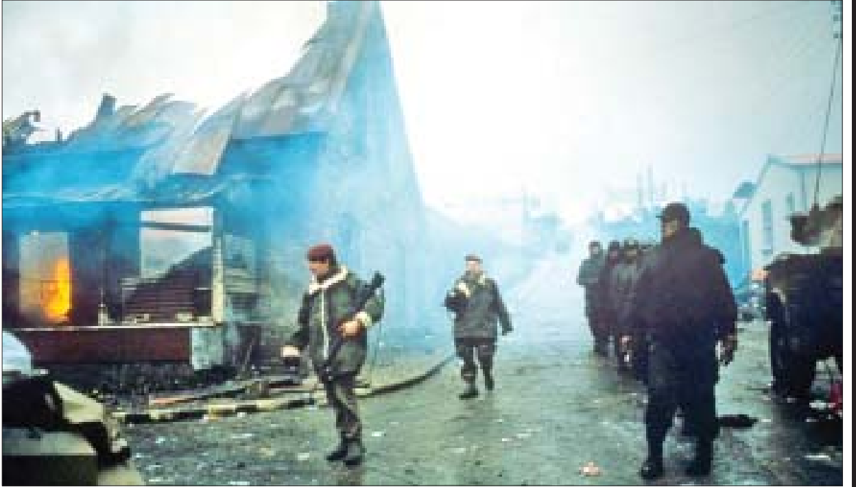
နယ်မြေပိုင်ဆိုင်မှုဆိုင်ရာ သမိုင်းရန်ကြေးကို အာဂျင်တီးနားနှင့် ဗြိတိန်နိုင်ငံတို့စစ်တိုက်ပြီး စာရင်းရှင်းကြသည့် ဖောက်ကလန်စစ်ပွဲကြောင့် ပျက်စီးနေသည့် အဆောက်အအုံများနှင့် မီးလောင်နေသည့် အဆောက်အအုံများအကြားမှ ဗြိတိန်တပ်ဖွဲ့များကို တွေ့ရစဉ်။

ကိုရီးယားစစ်ပွဲကြီးပြီးဆုံးသွားသော်လည်း အရှေ့၊ အနောက် အုပ်စု အားပြိုင်မှုမှာ မပြီးစီးနိုင်ပါ။ ကမ္ဘာတင်းမာမှုများက ပိုလှိုပင် မြင့်တက်လာသည်။ ဒုတိယကမ္ဘာစစ်ပြီးစ အချိန်တွင် အမေရိကန်က ကွန်မြူနစ်စနစ် ပြန်လည်လိမ့်ဝင်ရေးပေါ်လစီကို ချမှတ်ကျင့်သုံးခဲ့