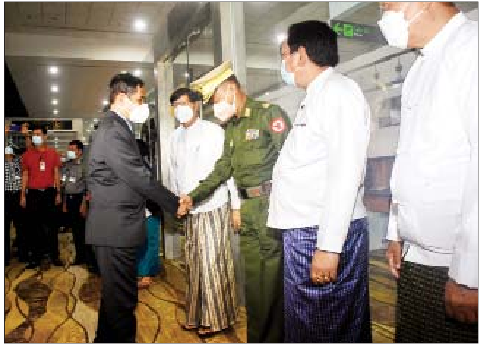
ပြည်ထောင်စုဝန်ကြီး ဦးကိုကိုလှိုင်နှင့် ဒေါက်တာသီတာဦးတို့ ဦးဆောင်သော မြန်မာ့ကိုယ်စားလှယ်အဖွဲ့အား ရန်ကုန်တိုင်းဒေသကြီးဝန်ကြီးချုပ် ဦးစိုးသိန်း၊ ရန်ကုန်တိုင်းစစ်ဌာနချုပ်တိုင်းမှူး ဗိုလ်ချုပ်ညွန့်ဝင်းဆွေ၊ နိုင်ငံခြားရေးဝန်ကြီးဌာန ဒုတိယဝန်ကြီး ဦးကျော်မျိုးထွဋ်နှင့် တာဝန်ရှိသူများက ရန်ကုန်အပြည်ပြည်ဆိုင်ရာလေဆိပ်၌ ကြိုဆိုနှုတ်ဆက်ကြစဉ်။

★ ရှေ့ဖိုးမှ နိုင်ငံခြားရေးဝန်ကြီးဌာန ဒုတိယဝန်ကြီး ဦးကျော်မျိုးထွဋ်၊ တိုင်းဒေသကြီးဝန်ကြီး များနှင့် ဌာနဆိုင်ရာတာဝန်ရှိသူများက ရန်ကုန် အပြည်ပြည်ဆိုင်ရာလေဆိပ်၌ ကြိုဆိုနှုတ်ဆက်ကြသည်။