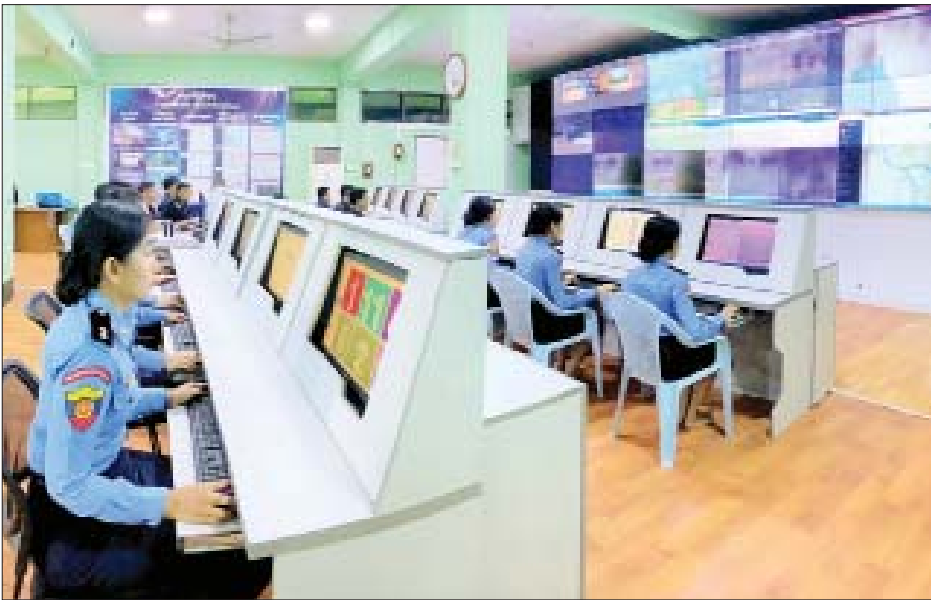
ရန်ကုန်မြို့ မရမ်းကုန်းမြို့နယ်ရှိ Command and Control Center ဌာနတွင် ရန်ကုန်မြို့၏ မီးဘေး အန္တရာယ်အား ကြီးကြပ်ကွပ်ကဲဆောင်ရွက်နေမှုကို တွေ့ရစဉ်။

ဆောင်းအကုန် နွေအကူးသို့ စတင်ဝင်ရောက် လာချိန်တွင် မီးဘေးအန္တရာယ်ကို အထူးဂရုပြုရန် လိုအပ်လျက်ရှိပြီး မြန်မာနိုင်ငံ မီးသတ်တပ်ဖွဲ့ အနေဖြင့် မီးလောင်မှုဖြစ်ပေါ်လာပါက ထိခိုက်နစ်နာ ဆုံးရှုံးမှု အနည်းဆုံးဖြစ်စေရန် ကြိုးပမ်းဆောင်ရွက် လျက်ရှိသည်။ ၂၀၂၂ ခုနှစ် ဇန်နဝါရီလတွင် နိုင်ငံတစ်ဝန်း မီးလောင်မှုအကြိမ် ၁၅၀ ဖြစ်ပွားခဲ့ပြီး ငွေကျပ်သိန်းပေါင်း ၄၀၀၀ ကျော်၊ ဖေဖော်ဝါရီလတွင် မီးလောင်မှု ၂၅၄ ကြိမ်ဖြစ်ပွား၍ ငွေကျပ်သိန်းပေါင်း ၉၀၀၀ ကျော်ဖြင့် ထိုနှစ်လတွင်မီးလောင်မှုကြောင့် ငွေကျပ်သိန်း ၁၄၂၀ ခန့် ဆုံးရှုံးခဲ့ကြောင်း မြန်မာနိုင်ငံ မီးသတ်တပ်ဖွဲ့ဌာနချုပ်၏ ထုတ်ပြန်မှုအရ သိရသည်။