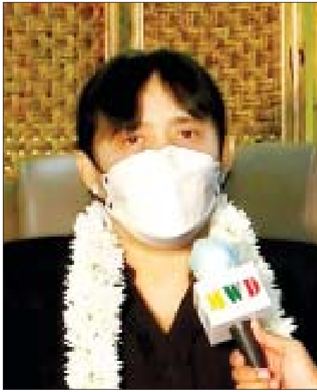
ပြည်ထောင်စုဝန်ကြီးနှင့် ပြည်ထောင်စုရှေ့နေချုပ် ဒေါက်တာသီတာဦး