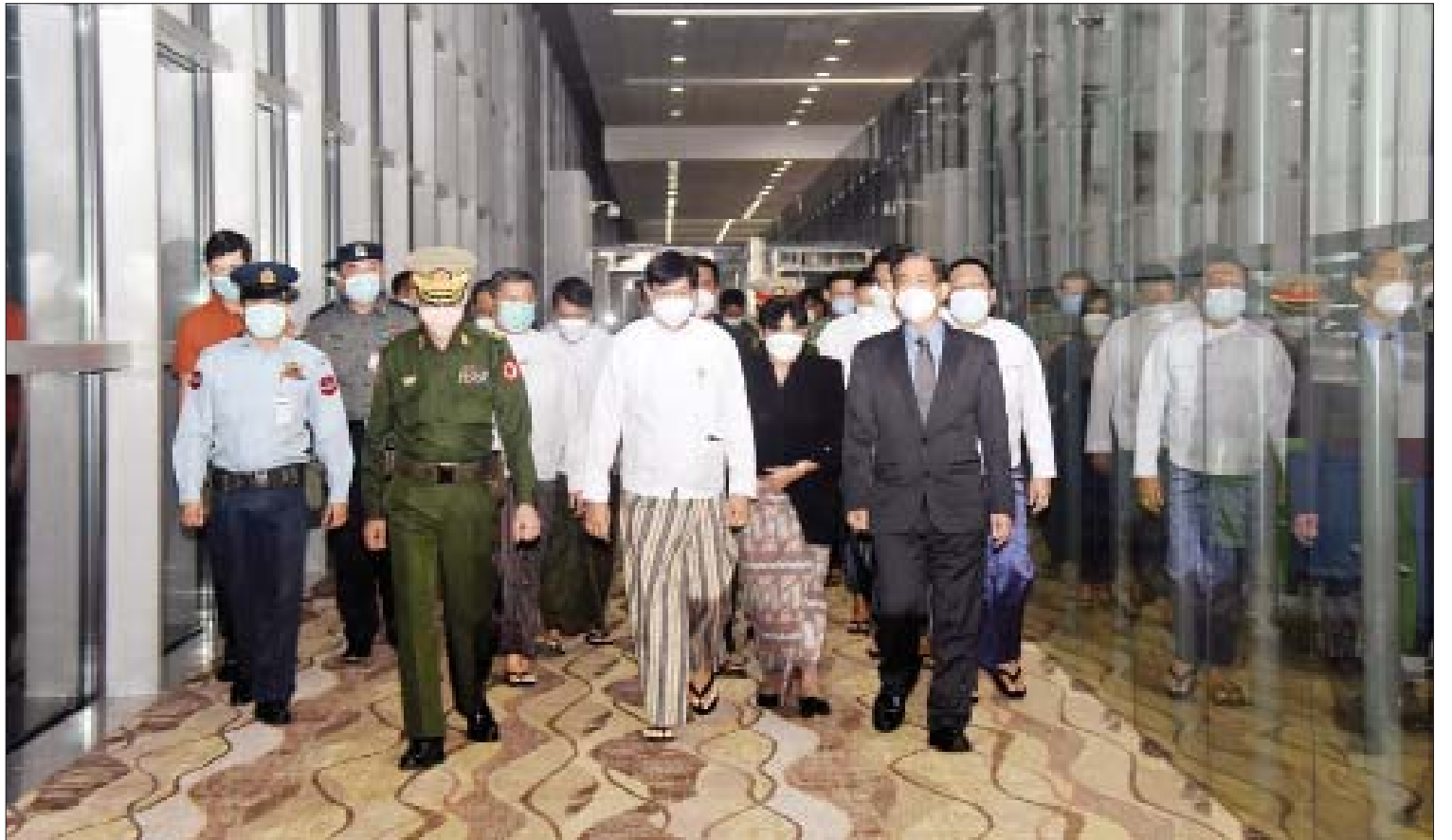
ပြည်ထောင်စုဝန်ကြီး ဦးကိုကိုလှိုင်နှင့် ဒေါက်တာသီတာဦးတို့ ဦးဆောင်သော မြန်မာ့ကိုယ်စားလှယ်အဖွဲ့အား ရန်ကုန်တိုင်းဒေသကြီးဝန်ကြီးချုပ် ဦးစိုးသိန်း၊ ရန်ကုန်တိုင်းစစ်ဌာနချုပ်တိုင်းမှူး ဗိုလ်ချုပ်ညွန့်ဝင်းဆွေ၊ နိုင်ငံခြားရေးဝန်ကြီးဌာန ဒုတိယဝန်ကြီး ဦးကျော်မျိုးထွဋ်နှင့် တာဝန်ရှိသူများက ရန်ကုန်အပြည်ပြည်ဆိုင်ရာလေဆိပ်၌ ကြိုဆိုနှုတ်ဆက်ကြစဉ်။

သောင်းသောင်းဖြဖြကြိုဆို ထိုပြင် မြန်မာ့ကိုယ်စားလှယ်အဖွဲ့၏ ဆောင်ရွက်မှုကို ထောက်ခံအားပေးကြ သည့် နိုင်ငံရေးပါတီများမှ တာဝန်ရှိ သူများ၊ မြန်မာနိုင်ငံ ဘာသာပေါင်းစုံ ချစ်ကြည်ညီညွတ်ရေးအဖွဲ့ (ဗဟို)မှ တာဝန်ရှိသူများ၊ ဗုဒ္ဓဘာသာကလျာဏ ယုဝအသင်းကြီး (YMBA) (ဗဟို)မှ တာဝန် ရှိသူများ၊ ဌာနဆိုင်ရာဝန်ထမ်း များနှင့် ရဟန်းရှင်လူ့ပြည်သူများက ပြည်ထောင်စုသမ္မတမြန်မာနိုင်ငံတော် အလံများနှင့် အပြည်ပြည်ဆိုင်ရာတရား ရုံး (ICJ) တွင် တိုင်းပြည်နှင့် လူမျိုးအမျိုး အတွက် ရဲဝံ့ပြတ်သားစွာ ဆောင်ရွက်ခဲ့ကြ သော မြန်မာ့ကိုယ်စားလှယ်အဖွဲ့အား ဂုဏ်ယူဝမ်းမြောက်စွာ ကြိုဆိုပါသည် ဟူသည့် ဗီဒီယိုဆိုင်ရာများကို ကိုင်ဆောင်ကာ ရန်ကုန်လေဆိပ်၌ သောင်းသောင်းဖြဖြ ကြိုဆိုနှုတ်ဆက်ကြ သည်။