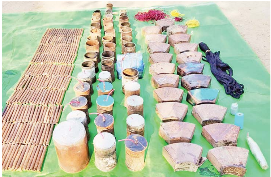
စစ်ကိုင်းတိုင်းဒေသကြီး ဝက်လက်မြို့နယ် ကျောက်တိုင်ကျေးရွာအတွင်း သိမ်းဆည်းရမိသည့် PDF အမည်ခံအကြမ်းဖက်သမားများ၏ လက်လုပ်မိုင်းနှင့် ဆက်စပ်ပစ္စည်းများကို တွေ့ရစဉ်။