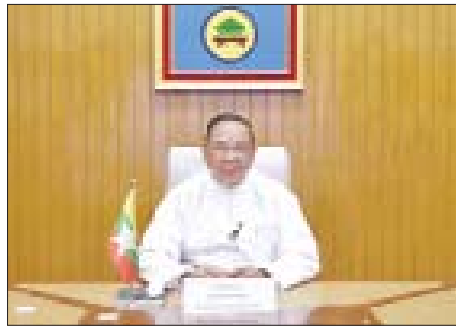
ပြည်ထောင်စုဝန်ကြီး ဦးရွှေလေး

အခမ်းအနားတွင် ဆောက်လုပ်ရေးဝန်ကြီးဌာန ပြည်ထောင်စုဝန်ကြီး ဦးရွှေလေး၊ စက်မှုဝန်ကြီးဌာန ပြည်ထောင်စုဝန်ကြီး ဒေါက်တာချာလီသန်း၊ သိပ္ပံနှင့် နည်းပညာဝန်ကြီးဌာန ပြည်ထောင်စုဝန်ကြီး