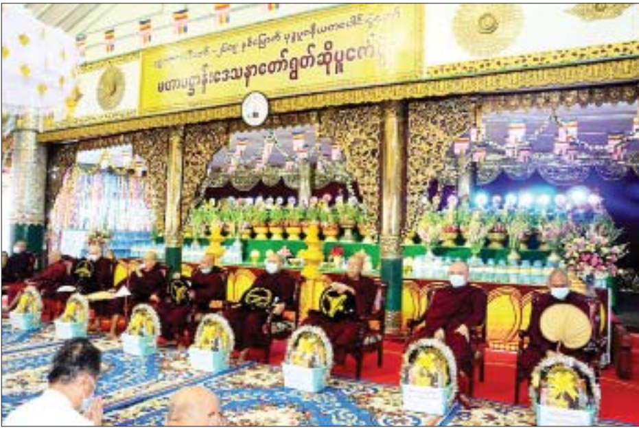
ရွှေတိဂုံစေတီတော် (၂၆၀၉) နှစ်မြောက် ဗုဒ္ဓပူဇော်ယုတ္တပေါင်းပွဲတော်ကြီး ကျင်းပခဲ့စဉ်။

တပေါင်းလပြည့်နေ့ဖြစ်သော မတ် ၁၆ ရက် နံနက် ၅ နာရီတွင် လည်းကောင်း၊ လှူဒါန်းမှုအစုစုတို့ အတွက် ရေစက်သွန်းချအမျိုးမျိုးပေးခြင်းကို ရွှေတိဂုံ စေတီတော်ရင်ပြင် ရာဟုထောင့် ချမ်းသာကြီး တန်ဆောင်း၌ နံနက် ၉ နာရီတွင် လည်းကောင်း