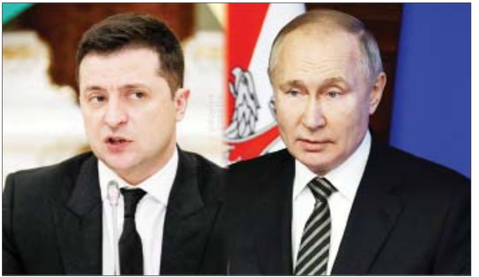
အရေးနှင့်ပတ်သက်ပြီး လာမည့်ရက်သတ္တပတ်တွင် ကြားနာစစ်ဆေးမှုများ ပြုလုပ်သွားမည်ဖြစ်သည်။ ယူကရိန်းနိုင်ငံအပေါ် ရုရှားတပ်ဖွဲ့ဝင်များ၏ စစ်ဆင်ရေးဆင်နွှဲမှုများကို ရပ်တန့်ရန် ယူကရိန်း