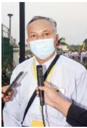
ဦးသက်ထွန်း

နယ်သာလန်နိုင်ငံ သည်ဟိဂ်မြို့ရှိ အပြည်ပြည်ဆိုင်ရာ တရားရုံး (ICJ)တွင် မြန်မာနိုင်ငံက တင်သွင်းခဲ့သော ကနဦး ကန့်ကွက်လွှာဆိုင်ရာ ကြားနာပွဲသို့ တက်ရောက်ခဲ့သည့် အပြည်ပြည်ဆိုင်ရာ ပူးပေါင်းဆောင်ရွက်ရေးဝန်ကြီးဌာန ပြည်ထောင်စုဝန်ကြီး ဦးကိုကိုလှိုင်နှင့် ဥပဒေရေးရာ ဝန်ကြီးဌာန ပြည်ထောင်စုဝန်ကြီးနှင့် ပြည်ထောင်စုရှေ့နေချုပ် ဒေါက်တာသီတာဦး ဦးဆောင်သော မြန်မာကိုယ်စားလှယ်အဖွဲ့သည် ယနေ့ညပိုင်းတွင် လေကြောင်းခရီးဖြင့် ရန်ကုန်မြို့သို့ ပြန်လည်ရောက်ရှိလာရာ မြန်မာကိုယ်စားလှယ်အဖွဲ့၏ဆောင်ရွက်မှုကို ထောက်ခံအားပေးကြသည့် နိုင်ငံရေးပါတီများမှ တာဝန်ရှိသူများ၊ မြန်မာနိုင်ငံဘာသာပေါင်းစုံချစ်ကြည်ညီညွတ်ရေးအဖွဲ့ (ဗဟို)မှ တာဝန်ရှိသူများ၊ ဗုဒ္ဓဘာသာကလျာဏယုဝအသင်းကြီး-YMBA(ဗဟို)မှ တာဝန်ရှိသူများ၊ ဌာနဆိုင်ရာဝန်ထမ်းများနှင့် ရဟန်းရှင်လူပြည်သူများက ရန်ကုန်လေဆိပ်တွင် သောင်းသောင်းဖြူဖြူ ကြိုဆိုနှုတ်ဆက်ကြသည်။