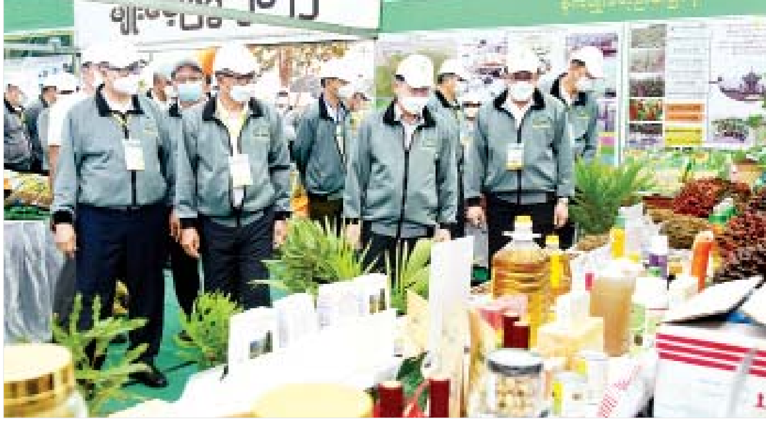
နိုင်ငံတော်စီမံအုပ်ချုပ်ရေးကောင်စီဥက္ကဋ္ဌ နိုင်ငံတော်ဝန်ကြီးချုပ် ဗိုလ်ချုပ်မှူးကြီးမင်းအောင်လှိုင် မျိုးစေ့ပြပွဲ ၂၀၂၂ တွင် ခင်းကျင်းပြသထားသည့် ပြခန်းများကို လှည့်လည်ကြည့်ရှုစဉ်။

တောင်သူလယ်သမားအခွင့်အရေးကာကွယ်ရေးနှင့် အကျိုးစီးပွားမြှင့်တင်ရေး ဥပဒေပါ ရည်ရွယ်ချက်များနှင့် ဦးဆောင်အဖွဲ့၏ လုပ်ငန်းတာဝန်များတွင် အပါအဝင်ဖြစ်သည့် “တောင်သူလယ်သမားများ သွင်းအားစု(မျိုးစေ့)များကို လွယ်ကူအဆင်ပြေစွာ ရရှိသုံးစွဲနိုင်ရေးအတွက် ပံ့ပိုးကူညီစီမံဆောင်ရွက်ရန်” ဆိုသည့် ပြဋ္ဌာန်းချက်နှင့်အညီ မျိုးစေ့ပြပွဲများကို ၂၀၁၈ ခုနှစ်မှစတင်၍ ကျင်းပပြုလုပ်ခဲ့ရာ ယခု “Seed Fair 2022” သည် စတုတ္ထအကြိမ်မြောက်ဖြစ်ပြီး ပြည်ထောင်စုနယ်မြေမှသည် တိုင်းဒေသကြီး/ ပြည်နယ်၊ ခရိုင်အဆင့်များအထိ ကျယ်ကျယ်ပြန့်ပြန့် စာမျက်နှာ ၅ သို့ »»