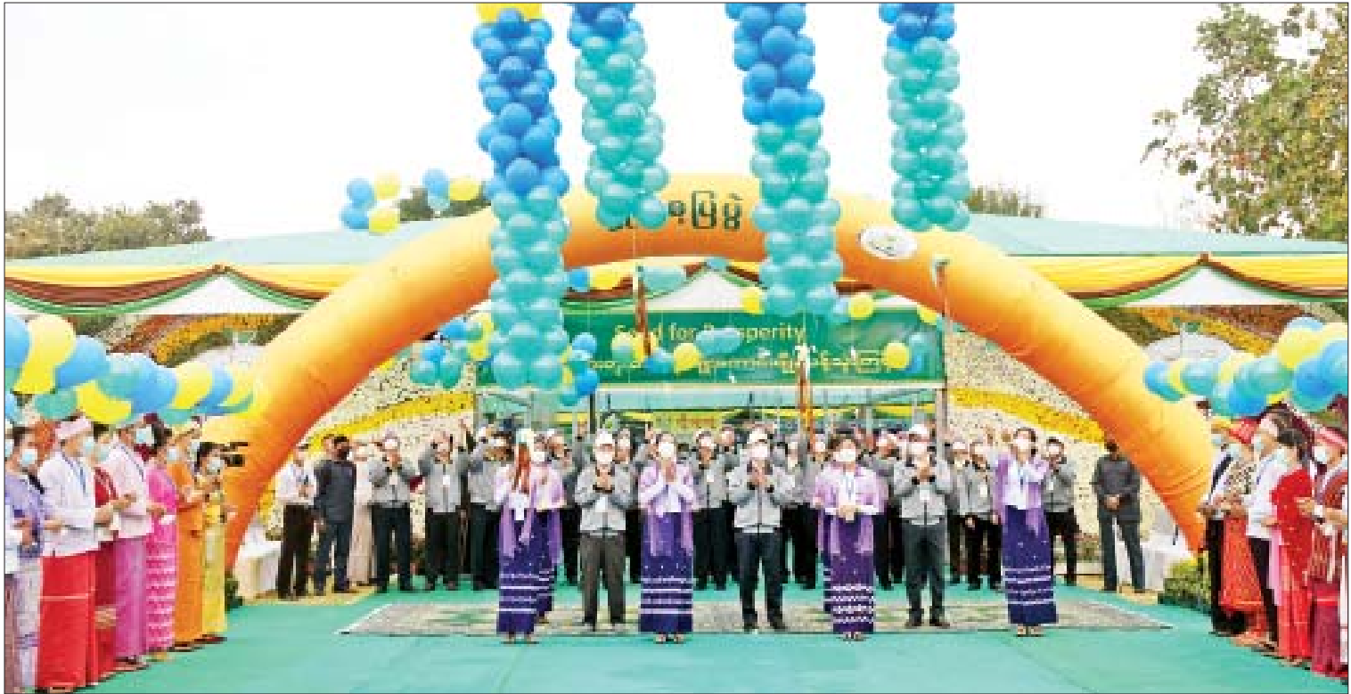
နိုင်ငံတော်စီမံအုပ်ချုပ်ရေးကောင်စီဥက္ကဋ္ဌ နိုင်ငံတော်ဝန်ကြီးချုပ် ဗိုလ်ချုပ်မှူးကြီးမင်းအောင်လှိုင်၊ စိုက်ပျိုးရေး၊ မွေးမြူရေးနှင့် ဆည်မြောင်းဝန်ကြီးဌာန ပြည်ထောင်စုဝန်ကြီး ဦးတင်ထွဋ်ဦးနှင့် နေပြည်တော်ကောင်စီဥက္ကဋ္ဌ ဒေါက်တာမောင်မောင်နိုင်တို့က မျိုးစေ့ပြပွဲ ၂၀၂၂ ဖွင့်ပွဲအခမ်းအနားကို ဖဲကြိုးဖြတ်ဖွင့်လှစ်ပေးကြစဉ်။

အကျိုးကျေးဇူးများ ရရှိနိုင်မည် မျိုးကောင်းမျိုးသန့် သုံးစွဲခြင်းဖြင့် ရောဂါပိုးမွှားဒဏ်ခံနိုင်မှု၊ ရေငတ်ဒဏ် ခံနိုင်မှု၊ ရေဝပ်ဒဏ်ခံနိုင်မှု၊ အပူချိန်နိမ့်မြင့် ဒဏ်ခံနိုင်မှု၊ အထွက်ပိုမိုရရှိမှုစသည့် အကျိုးကျေးဇူးများကို ရရှိနိုင်မည်ဖြစ်ပါ ကြောင်း၊ သို့မှသာ တောင်သူများအနေဖြင့် သီးနှံများ အရည်အသွေးနှင့် အထွက်နှုန်း ပါ တိုးတက်လာပြီး ပြည်တွင်းစားသုံးမှု ဖူလုံရုံသာမက ပိုလျှံသော လယ်ယာ ထွက်ကုန်ပစ္စည်းများကို နိုင်ငံတကာ ဈေးကွက်သို့ ချိတ်ဆက်တင်ပို့ရောင်းချနိုင် ခြင်းဖြင့် ဝင်ငွေများမြင့်မားတိုးတက်လာ စေမည် ဖြစ်ပါကြောင်း၊ ထို့ကြောင့် ယခုနှစ်မျိုးစေ့ပြပွဲ၏ ဆောင်ပုဒ်အနေဖြင့် “လူမှုစီးပွားတိုးတက်ဖို့၊ မျိုးကောင်း မျိုးသန့်သုံးကြစို့” ဟု သတ်မှတ်ပြီး ကျင်းပ ခြင်းဖြစ်ပါကြောင်း။ စာမျက်နှာ ၄ သို့။