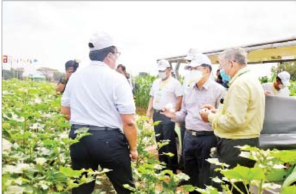
နိုင်ငံတော်စီမံအုပ်ချုပ်ရေးကောင်စီဥက္ကဋ္ဌ နိုင်ငံတော်ဝန်ကြီးချုပ် ဗိုလ်ချုပ်မှူးကြီးမင်းအောင်လှိုင်နှင့်အဖွဲ့ ပျဉ်းမနား စိုက်ပျိုးရေးသိပ္ပံကျောင်းအတွင်းရှိ စိုက်ခင်းများကို လှည့်လည်ကြည့်ရှုစဉ်။

၁၉၁၉ ခုနှစ်တွင် စတင်ဖွင့်လှစ် အဆိုပါ စိုက်ပျိုးရေးသိပ္ပံ(ပျဉ်းမနား) ကို ၁၉၁၉ ခုနှစ်တွင် လယ်ယာစိုက်ပျိုးရေး ဌာနအဖြစ် စတင်ဖွင့်လှစ်ခဲ့ပြီး ၁၉၂၀ ပြည့်နှစ်တွင် စိုက်ပျိုးရေးကျောင်းအဖြစ် တရားဝင်ဖွင့်လှစ်ခဲ့ကြောင်း၊ စိုက်ပျိုးရေး သင်တန်းကျောင်းကို ၁၉၂၃ ခုနှစ်တွင် စတင်ဖွင့်လှစ်ခဲ့ကြောင်း၊ ၁၉၅၄ ခုနှစ်တွင် စိုက်ပျိုးရေးသိပ္ပံကျောင်းအဖြစ် ပြောင်းလဲ ဖွင့်လှစ်နိုင်ခဲ့ကြောင်း၊ ၁၉၈၂ ခုနှစ်မှစ၍ စိုက်ပျိုးရေးသင်တန်းများအပြင် မွေးမြူ ရေးသင်တန်းများကိုပါ စတင်ဖွင့်လှစ်ခဲ့ ကြောင်း၊ ၁၉၈၂ ခုနှစ်မှ ၁၉၉၉ ခုနှစ်အထိ မွေးမြူရေးဒီပလိုမာလက်မှတ်ရ ၁၁၄ ဦး ကိုမွေးထုတ်ပေးနိုင်ခဲ့ကြောင်း၊ ၂၀၀၀ ပြည့်နှစ်နောက်ပိုင်းတွင် ထူးချွန်ဆရာ ဆရာမများကိုလည်း မွေးထုတ်ပေးနိုင်ခဲ့ ကြောင်း၊ အဆိုပါ စိုက်ပျိုးရေးသိပ္ပံ (ပျဉ်းမနား)သည် မြန်မာနိုင်ငံ၏ ခေတ်မီ စိုက်ပျိုးရေးအတွက် သန္ဓေချပေးခဲ့သည့် နေရာတစ်ခုဖြစ်သည့်အပြင် ၁၉၄၂ ခုနှစ် တွင် ဗမာ့ကာကွယ်ရေးတပ်မတော် (ဘီဒီအေ)၏ ဌာနချုပ်အဖြစ် တပ်စွဲခဲ့ သည့် သမိုင်းဝင်နေရာတစ်ခုလည်းဖြစ် ကြောင်း သိရသည်။ သတင်းစဉ်