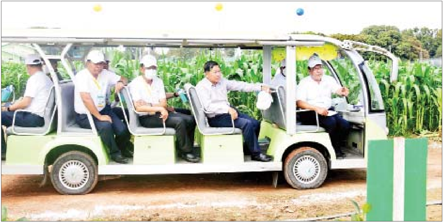
နိုင်ငံတော်စီမံအုပ်ချုပ်ရေးကောင်စီဥက္ကဋ္ဌ နိုင်ငံတော်ဝန်ကြီးချုပ် ဗိုလ်ချုပ်မှူးကြီးမင်းအောင်လှိုင်နှင့်အဖွဲ့ ပျဉ်းမနားစိုက်ပျိုးရေးသိပ္ပံကျောင်းအတွင်းရှိ စိုက်ခင်းများကို လှည့်လည်ကြည့်ရှုစဉ်။

ဖွင့်ပွဲအခမ်းအနားအပြီးတွင် နိုင်ငံတော် စီမံအုပ်ချုပ်ရေးကောင်စီဥက္ကဋ္ဌ နိုင်ငံတော် ဝန်ကြီးချုပ်နှင့် အခမ်းအနားသို့ တက်ရောက်ကြသူများသည် မျိုးစေ့ပြပွဲ အတွင်း ခင်းကျင်းပြသထားသော ပြခန်း များနှင့် ပျဉ်းမနားစိုက်ပျိုးရေးသိပ္ပံ ကျောင်းအတွင်းရှိ စိုက်ခင်းများကို စိတ်ပါဝင်စားစွာဖြင့် လေးနာရီခန့်ကြာ အသေးစိတ်ပြန်လည် လှည့်လည်ကြည့်ရှု ပြီး တာဝန်ရှိသူများ၏ တင်ပြချက်များ အပေါ် နိုင်ငံတော်စီမံအုပ်ချုပ်ရေးကောင်စီ ဥက္ကဋ္ဌ နိုင်ငံတော်ဝန်ကြီးချုပ်က သိရှိ လိုသည်များ မေးမြန်းဆွေးနွေးပြီး