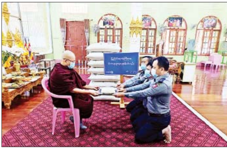
တိုက်သို့လည်းကောင်း၊ ရှမ်းပြည်နယ် ဆွမ်းဆန်တော်များကို တာဝန်ရှိသူများက တာချီလိတ်မြို့နယ်ရှိ နောင်ခမ်းအောင် သွားရောက် ဆက်ကပ်လှူဒါန်းခဲ့ကြ ကျောင်းတိုက်သို့ လည်းကောင်း၊ ကြောင်း သိရသည်။

ထိုသို့ဆောင်ရွက်လျက်ရှိရာ ယနေ့ တွင် စစ်ကိုင်းတိုင်းဒေသကြီး ကလေး မြို့နယ်ရှိ စကားလှပရိယတ္တိစာသင်တိုက် နှင့် ရွှေဘိုမြို့နယ်ရှိ အောင်မြေပရိယတ္တိ စာသင်တိုက်တို့သို့လည်းကောင်း၊ မကွေး တိုင်းဒေသကြီး မကွေးမြို့နယ်ရှိ မဟာ ဝိသုတာရာမ ပရိယတ္တိစာသင်တိုက်သို့ လည်းကောင်း၊ မန္တလေးတိုင်းဒေသကြီး ချမ်းအေးသာစံမြို့နယ်ရှိ စပယ်ရုံကျောင်း ဆရာတော်၊ သံဃာတော်များအား သတင်းစဉ်