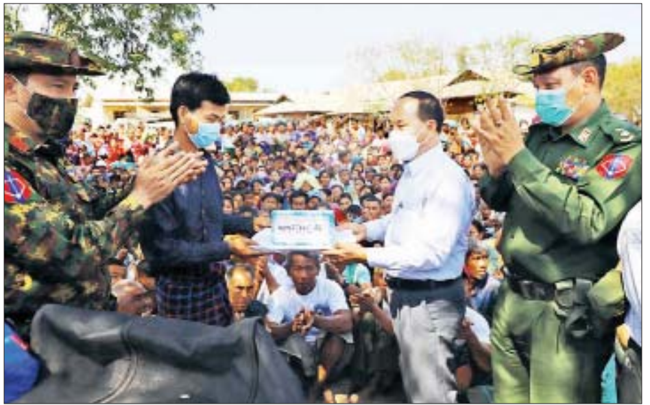
ငွေကျပ် ၁၀ သိန်းနှုန်းဖြင့် နှစ်ဦးအတွက် သိန်း ၂၀ နှင့် အနောက်မြောက်တိုင်းစစ်ဌာနချုပ်မှ စားသောက် ဖွယ်ရာများနှင့် အဝတ်အထည်များ၊ လူမှုဝန်ထမ်း၊ ကယ်ဆယ်ရေးနှင့် ပြန်လည်နေရာချထားရေးဝန်ကြီး ဌာန ဘေးအန္တရာယ်ဆိုင်ရာ စီမံခန့်ခွဲမှုဦးစီးဌာနမှ အိမ်ထောင်စုများအတွက် တစ်အိမ်ထောင်လျှင် ငွေကျပ်နှစ်သိန်းနှုန်းဖြင့် အိမ်ထောင်စု ၂၁၉ စုတို့ အတွက် စုစုပေါင်းငွေကျပ် ၄၄၁ ဒသမ ၅ သိန်းတို့အား ပေးအပ်ခဲ့ကြောင်း သိရသည်။ တိုင်းဒေသကြီး (ပြန်/ဆက်)

အကြမ်းဖက်အဖွဲ့များ၏ မီးရှို့ဖျက်ဆီးမှုများ ကြောင့် ပုလဲမြို့နယ် မီးဖြူကုန်းကျေးရွာ အိမ်ထောင်စု များအတွက် ငွေကျပ် ၉၃ သိန်း၊ ဆန်အိတ် ၃၁ အိတ် နှင့် ဆီပိဿာ ၃၁၀၊ သေဆုံးသူများအတွက် ငွေကျပ် ၁၀ သိန်းနှုန်းဖြင့် လေးဦးအတွက် ငွေကျပ်သိန်း ၄၀ နှင့် အနောက်မြောက်တိုင်းစစ်ဌာနချုပ်မှ ငါးခြောက် များ၊ အဝတ်အထည်များ၊ စားသောက်ဖွယ်ရာများ၊ လူမှုဝန်ထမ်း၊ ကယ်ဆယ်ရေးနှင့် ပြန်လည်နေရာ ချထားရေးဝန်ကြီးဌာန ဘေးအန္တရာယ်ဆိုင်ရာ စီမံ ခန့်ခွဲမှုဦးစီးဌာနမှ အိမ်ထောင်စုများအတွက် တစ်အိမ်လျှင် ကျပ်နှစ်သိန်းနှုန်းဖြင့် အိမ်ထောင်စု ၃၁ စုအတွက် စုစုပေါင်းငွေကျပ် ၆၂၀၀၀၀ နှင့် ကယ်ဆယ်ရေးပစ္စည်းများ ထောက်ပံ့ပေးအပ်ခဲ့ပြီး အင်မထီးကျေးရွာအတွက် တိုင်းဒေသကြီးအစိုးရ အဖွဲ့မှ ငွေကျပ် ၄၀၇ သိန်း၊ သေဆုံးသူများအတွက်