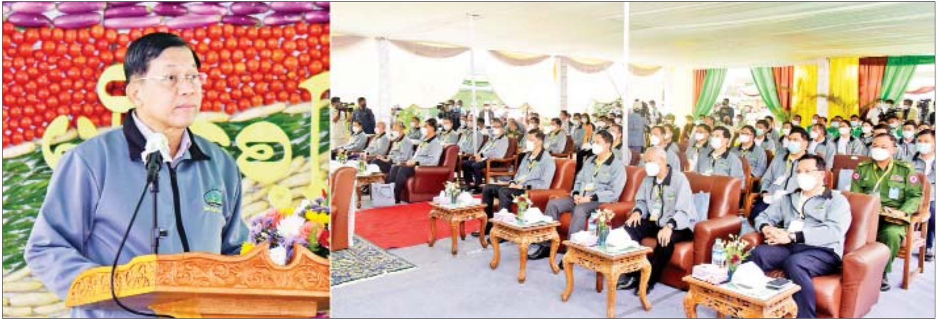
နိုင်ငံတော်စီမံအုပ်ချုပ်ရေးကောင်စီဥက္ကဋ္ဌ နိုင်ငံတော်ဝန်ကြီးချုပ် ဗိုလ်ချုပ်မှူးကြီးမင်းအောင်လှိုင် မျိုးစေ့ပြပွဲ ၂၀၂၂ ဖွင့်ပွဲအခမ်းအနား၌ အမှာစကားပြောကြားစဉ်။

☆ ရှေ့ဖုံးမှ ပြည်ထောင်စုဝန်ကြီးများ၊ နေပြည်တော် ကောင်စီဥက္ကဋ္ဌ၊ တပ်မတော်အရာရှိကြီး များ၊ နေပြည်တော်တိုင်းစစ်ဌာနချုပ် တိုင်းမှူး၊ ဒုတိယဝန်ကြီးများ၊ တာဝန်ရှိသူ များ၊ မြန်မာနိုင်ငံ မျိုးစေ့အသင်းနှင့် မျိုးစေ့ ကုမ္ပဏီများမှ တာဝန်ရှိသူများ၊ ဖိတ်ကြား ထားသည့် ဧည့်သည်တော်များ၊ တိုင်းရင်းသား တိုင်းရင်းသူများ၊ စိုက်ပျိုးရေး တောင်သူများ တက်ရောက်ကြသည်။