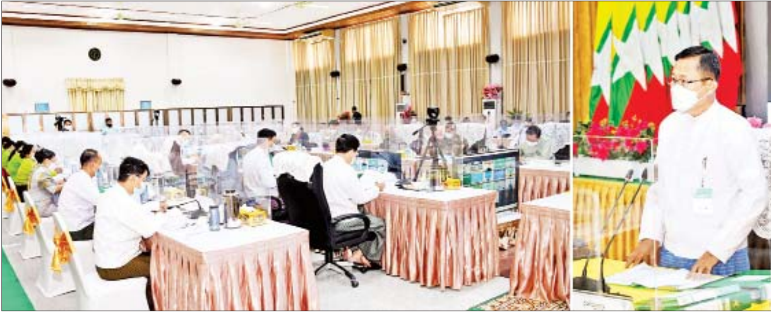
နိုင်ငံတော်စီမံအုပ်ချုပ်ရေးကောင်စီ ဒုတိယဥက္ကဋ္ဌ ဒုတိယဝန်ကြီးချုပ် ဒုတိယဗိုလ်ချုပ်မှူးကြီးစိုးဝင်း တရားမဝင်ကုန်သွယ်မှုတိုက်ဖျက်ရေးဦးဆောင်ကော်မတီ အစည်းအဝေး (၁/၂၀၂၂) တွင် အမှာစကားပြောကြားစဉ်။

နေပြည်တော် ဖေဖော်ဝါရီ ၁၈ တရားမဝင်ကုန်သွယ်မှုတိုက်ဖျက်ရေးဦးဆောင်ကော်မတီ အစည်းအဝေး(၁/၂၀၂၂) ကို ယနေ့ မွန်းလွဲပိုင်းတွင် နေပြည်တော်ရှိစီးပွားရေးနှင့် ကူးသန်းရောင်းဝယ်ရေး ဝန်ကြီးဌာန အစည်းအဝေးခန်းမ၌ ကျင်းပရာ တရားမဝင်ကုန်သွယ်မှုတိုက်ဖျက်ရေးဦးဆောင်ကော်မတီ ဥက္ကဋ္ဌ နိုင်ငံတော်စီမံအုပ်ချုပ်ရေးကောင်စီ ဒုတိယဥက္ကဋ္ဌ ဒုတိယဝန်ကြီးချုပ် ဒုတိယဗိုလ်ချုပ်မှူးကြီး စိုးဝင်း တက်ရောက်အမှာစကားပြောကြားသည်။ အစည်းအဝေးသို့ ပြည်ထောင်စုဝန်ကြီးများ ဖြစ်ကြသည့် ဦးဝင်းရှိန်နှင့် ဒေါက်တာပွင့်ဆန်း၊ ဒုတိယဝန်ကြီးများ၊ နေပြည်တော်ကောင်စီဝင်၊ အမြဲတမ်းအတွင်းဝန်များ၊ စာမျက်နှာ ၆ ကော်လံ ၁ သို့ ❖