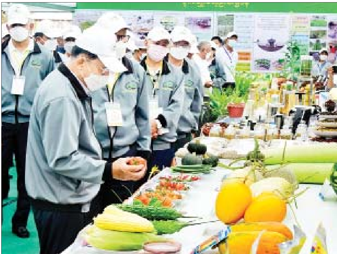
နိုင်ငံတော်စီမံအုပ်ချုပ်ရေးကောင်စီဥက္ကဋ္ဌ နိုင်ငံတော်ဝန်ကြီးချုပ် ဗိုလ်ချုပ်မှူးကြီးမင်းအောင်လှိုင် မျိုးစေ့ပြပွဲ ၂၀၂၂ တွင် ခင်းကျင်းပြသထားသည့် ပြခန်းများကို လှည့်လည်ကြည့်ရှုစဉ်။

စကားအတိုင်း မျိုးစေ့မကောင်းပါက အထွက်နှုန်းလျော့နည်းပြီး တောင်သူလယ်သမားများ နစ်နာဆုံးရှုံးမှုများ ဖြစ်ပေါ်လာမည်ဖြစ်သဖြင့် မျိုးစေ့ကဏ္ဍ ဖွံ့ဖြိုးတိုးတက်ရေးကို အားပေးသည့် အနေဖြင့် ပုဂ္ဂလိကအခန်းကဏ္ဍမှ ရင်းနှီးမြှုပ်နှံလိုသူများကို စိုက်ပျိုးရေး၊ မွေးမြူရေးနှင့် ဆည်မြောင်းဝန်ကြီးဌာန၏ ကူညီပံ့ပိုးထောက်ခံချက်များဖြင့် နိုင်ငံသားကုမ္ပဏီများသာမက နိုင်ငံခြားသားကုမ္ပဏီများပါ ၁၀၀ ရာခိုင်နှုန်း ရင်းနှီးမြှုပ်နှံမှုကို ဆောင်ရွက်နိုင်ကြပြီဖြစ်ပါကြောင်း၊ မျိုးစေ့ထုတ်လုပ်ရေးလုပ်ငန်းသည် ပြည်တွင်းလိုအပ်ချက်အတွက်သာမက ပြည်ပသို့ မျိုးစေ့တင်ပို့မှုအတွက် ကိုပါ ဆောင်ရွက်နိုင်ပြီး အကျိုးအမြတ်ကောင်းစွာရရှိနိုင်သည့် ရင်းနှီးမြှုပ်နှံမှုလုပ်ငန်းကြီးတစ်ခုလည်း ဖြစ်ပါကြောင်း၊ ထိုသို့ဆောင်ရွက်ရာတွင် နိုင်ငံအကျိုး၊