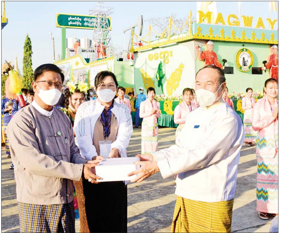
ပြည်ထောင်စုဝန်ကြီး ဦးချစ်နိုင် ပထမဆုရရှိခဲ့သည့် မကွေးတိုင်းဒေသကြီး ယဉ်ကျေးမှုအဖွဲ့အား လက်ဆောင်ပစ္စည်းများ ပေးအပ်ချီးမြှင့်စဉ်။

သတင်း - မျိုးဆက်သစ်