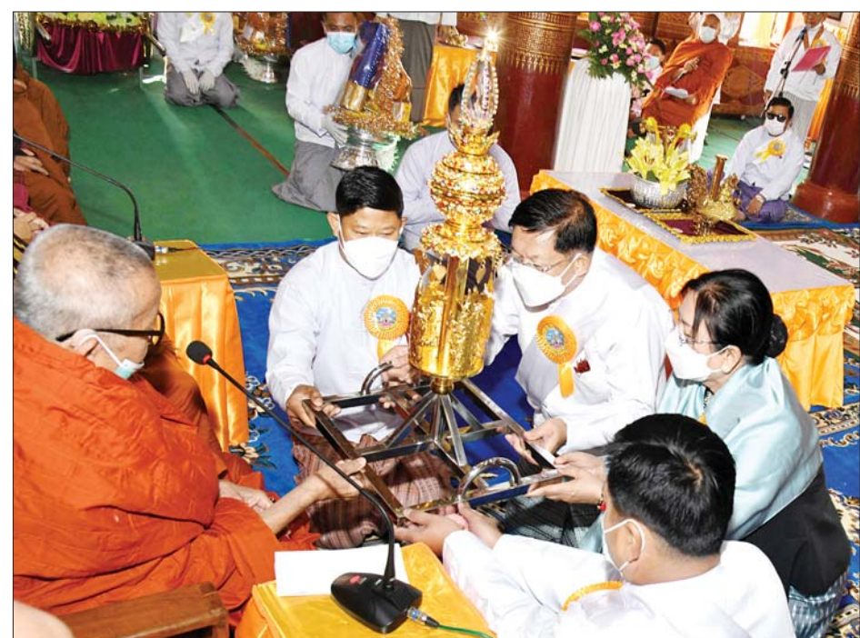
နိုင်ငံတော်စီမံအုပ်ချုပ်ရေးကောင်စီဥက္ကဋ္ဌ နိုင်ငံတော်ဝန်ကြီးချုပ် ဗိုလ်ချုပ်မှူးကြီးမင်းအောင်လှိုင် နှင့်ဇနီး ဒေါ်ကြူကြူလှ ကျိုင်းယင်းကျောင်းတိုက်ဆရာတော်ကြီးထံ ရတနာစိန်ဖူးတော် ဆက်ကပ် လှူဒါန်းစဉ်။

စေတနာရှင်အလှူရှင်များ၊ အရာရှိ၊ စစ်သည်၊ မိသားစုများ၊ ဝတ်အသင်း အဖွဲ့များ၊ ဒေသခံတိုင်းရင်းသား ပြည်သူများနှင့် ရိုးရာယဉ်ကျေးမှု အသင်းအဖွဲ့များ တက်ရောက်ကြ သည်။ ကပ်လှူပူဇော် ဦးစွာနိုင်ငံတော်စီမံအုပ်ချုပ်ရေး ကောင်စီဥက္ကဋ္ဌ နိုင်ငံတော်ဝန်ကြီး ချုပ်သည် မဟာမြတ်မုနိဘုရား ပွား တော်မြတ်ကြီးအား ဖူးမြော် ကြည်ညို၍ မြသပိတ်ဆွမ်းတော်၊ သောက်တော်ချမ်း၊ သစ်သီး ဆွမ်းတော်၊ ပန်းမန်နံ့သာနှင့် ဆီမီးတို့ကို ကပ်လှူပူဇော်သည်။ ထို့နောက် အစီအစဉ်အရ နိုင်ငံတော်စီမံအုပ်ချုပ်ရေးကောင်စီ ဥက္ကဋ္ဌ နိုင်ငံတော်ဝန်ကြီးချုပ်နှင့် အခမ်းအနား တက်ရောက်လာကြ သူများက ကျိုင်းယင်းကျောင်း တိုက် ဆရာတော်ကြီးထံမှ ကိုးပါး သီလ ခံယူဆောက်တည်ကြပြီး ဥပါသကာများက ပရိတ်ပန်း၊ ပရိတ်ရေ၊ ပရိတ်ချည်၊ ပရိတ်သံ များကို သံဃာတော်များထံ ဆက်ကပ်သည်။ ထို့နောက် သံဃာတော် အရှင်သုမြတ်တို့ ရွတ်ပွားချီးမြှင့်တော်မူကြသည့် ပရိတ်တရားတော်များကို နာယူ ကြည်ညိုကြသည်။