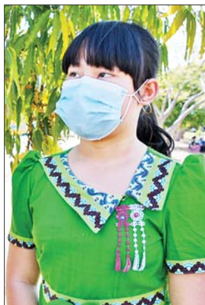
မအိမ်မြတ်ခြယ်