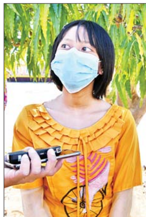
မလဝန်းအိမ်

လာရောက် လေ့လာကြည့်ရှု ကြတဲ့ တိုင်းရင်းသားညီအစ်ကို မောင်နှမတွေအားလုံး ကရင် အစားအစာတွေကို မစားဖူးတဲ့ သူလည်း စားဖူးအောင်၊ ကြိုက်နှစ် သက်တဲ့သူတွေလည်း ဝယ်ယူ အားပေးလို့ရအောင် စီစဉ်ပေး ထားပါတယ်။ ကရင်ရိုးရာအစား အစာတွေထဲမှာ ကရင်ရိုးရာ ကြက်သားသုပ်၊ ကရင်ရိုးရာ တာလပေါ၊ ကရင်ရိုးရာဒါဟဲဖိုး အပြင်တောထမင်းတောဟင်းတွေ ရောင်းချပေးပါတယ်။ ဒီအစား အစာတွေထဲမှာ တာလပေါကို အများဆုံးအားပေးတာ တွေ့ရ ပါတယ်။ ပြပွဲတတ်ယနေ့မှာဆိုရင် မနက်ပိုင်း ၁၁ နာရီကတည်းက အားလုံး ကုန်သွားတဲ့အတွက် ညနေပိုင်းရောင်းချပေးဖို့အတွက် ပြန်လည်ချက်ပြုတ်နေရပါတယ်။ ဒီလိုအခမ်းအနားကြီး ပြုလုပ်ပေး တဲ့အတွက် အတိုင်းမသိဝမ်းသာ မိပါတယ်။ ကိုယ့်တိုင်းရင်းသား အစားအစာတွေကို ရောင်းချပေးရ တဲ့အခါ စားသုံးသူတွေအနေနဲ့ လည်း အဆင်ပြေစွာစားသုံးနိုင်ခဲ့ တယ်ဆိုတဲ့ မှတ်ချက်ပေးမှုလေး တွေကြောင့် ဝမ်းသာမိပါတယ်။