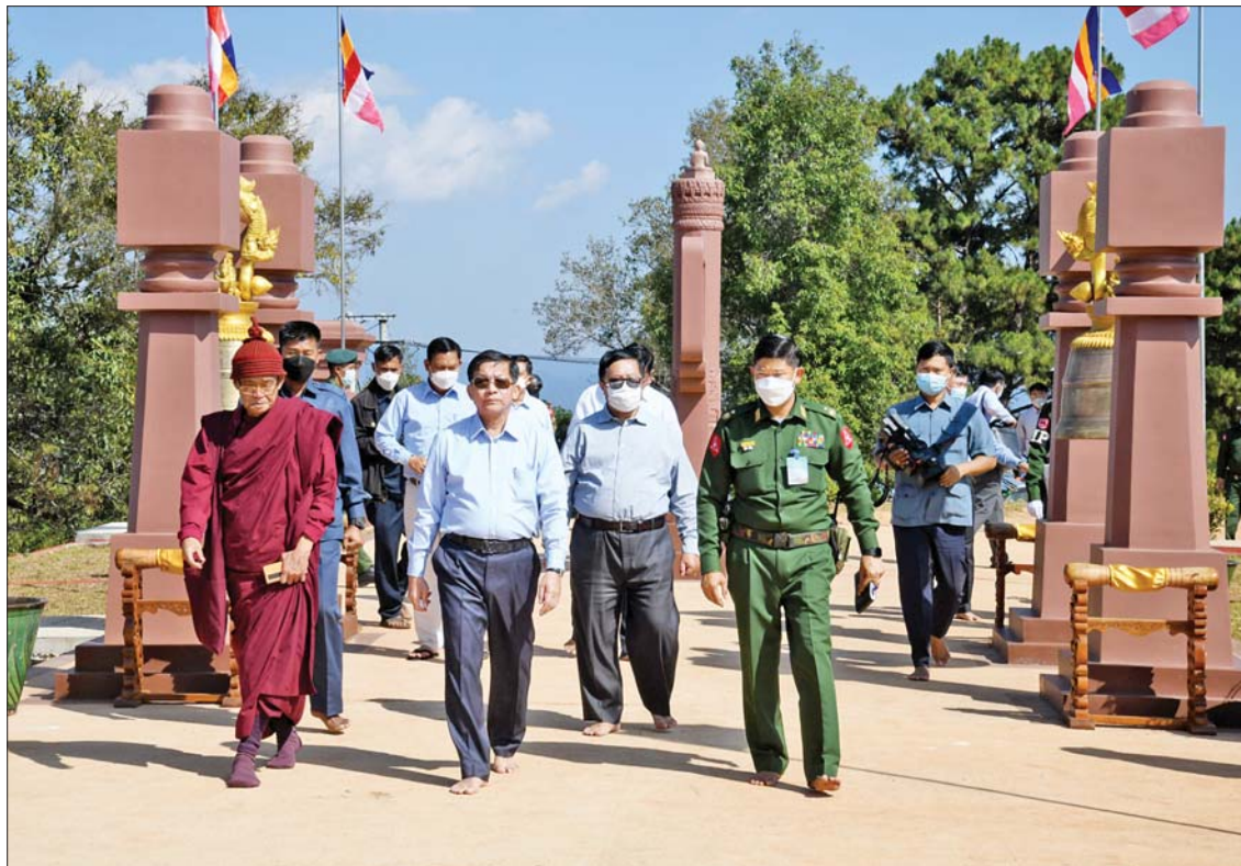
နိုင်ငံတော်စီမံအုပ်ချုပ်ရေးကောင်စီဥက္ကဋ္ဌ နိုင်ငံတော်ဝန်ကြီးချုပ် ဗိုလ်ချုပ်မှူးကြီးမင်းအောင်လှိုင်နှင့် အဖွဲ့ဝင်များ ဗုဒ္ဓဥယျာဉ်ပရိဝုဏ်အတွင်း လှည့်လည်ကြည့်ရှုစဉ်။

ကြည့်ရှု ယင်းနောက် ဝစီပိတ်ဆရာတော်ကြီးကိုယ်တိုင် ဦးဆောင် ကမကထပြု၍ တည်ဆောက်ပူဇော်လျက်ရှိသည့် သတ္တသတ္တာဟ မဟာဗောဓိစေတီတော်မြတ်ကြီး တည်ဆောက်ပူဇော်ပြီးစီးမှု အခြေအနေ၊ ကမ္ဘာ့သုဒ္ဓိဇ္ဇာ သိမ်တော်တည်ဆောက်ပြီးစီးမှု အခြေအနေများကို လိုက်လံကြည့်ရှုပြီး လိုအပ်သည်များ မှာကြားသည်။ ထို့နောက် နိုင်ငံတော်စီမံအုပ်ချုပ်ရေးကောင်စီဥက္ကဋ္ဌ နိုင်ငံတော်ဝန်ကြီးချုပ်နှင့် အဖွဲ့ဝင်များသည် ဗုဒ္ဓဥယျာဉ်တော်အတွင်း လှည့်လည်ကြည့်ရှုလေ့လာခဲ့ကြကြောင်း သိရသည်။ သတင်းစဉ်