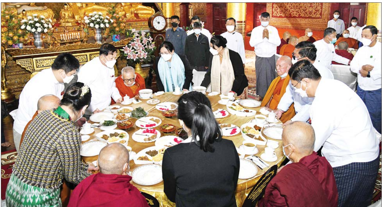
နိုင်ငံတော်စီမံအုပ်ချုပ်ရေးကောင်စီဥက္ကဋ္ဌ နိုင်ငံတော်ဝန်ကြီးချုပ် ဗိုလ်ချုပ်မှူးကြီးမင်းအောင်လှိုင်နှင့်ဇနီး ဒေါ်ကြူကြူလှ၊ အခမ်းအနား တက်ရောက်လာကြသူများက ဆရာတော်၊ သံဃာတော်များအား နေ့ဆွမ်းဆက်ကပ်လှူဒါန်းစဉ်။

ဆက်လက်ပြီး သံဃာတော် အရှင်သုမြတ်များက ဗုဒ္ဓါဘိသေက အနေကဇာတင်၍ ဗုဒ္ဓါဘိသိက် သွန်းတော်မူကြပြီး ဗုဒ္ဓသာသနာ စိရံတိဋ္ဌတု သုံးကြိမ်ရွတ်ဆို ဆုတောင်း၍ မဟာမင်္ဂလာအခမ်း အနားကို ရုပ်သိမ်းခဲ့သည်။ အခမ်း အနားအပြီးတွင် နိုင်ငံတော် စီမံအုပ်ချုပ်ရေးကောင်စီဥက္ကဋ္ဌ နိုင်ငံတော်ဝန်ကြီးချုပ်နှင့် ဇနီး၊ အခမ်းအနား တက်ရောက်လာကြ သူများသည် ဆရာတော်၊ သံဃာ တော်များအား နေ့ဆွမ်းဆက်ကပ် လှူဒါန်းကြကာ တက်ရောက် လာကြသည့် ဧည့်သည်တော် များကို နေ့လယ်စာဖြင့် တည်ခင်း ဧည့်ခံခဲ့ကြသည်။