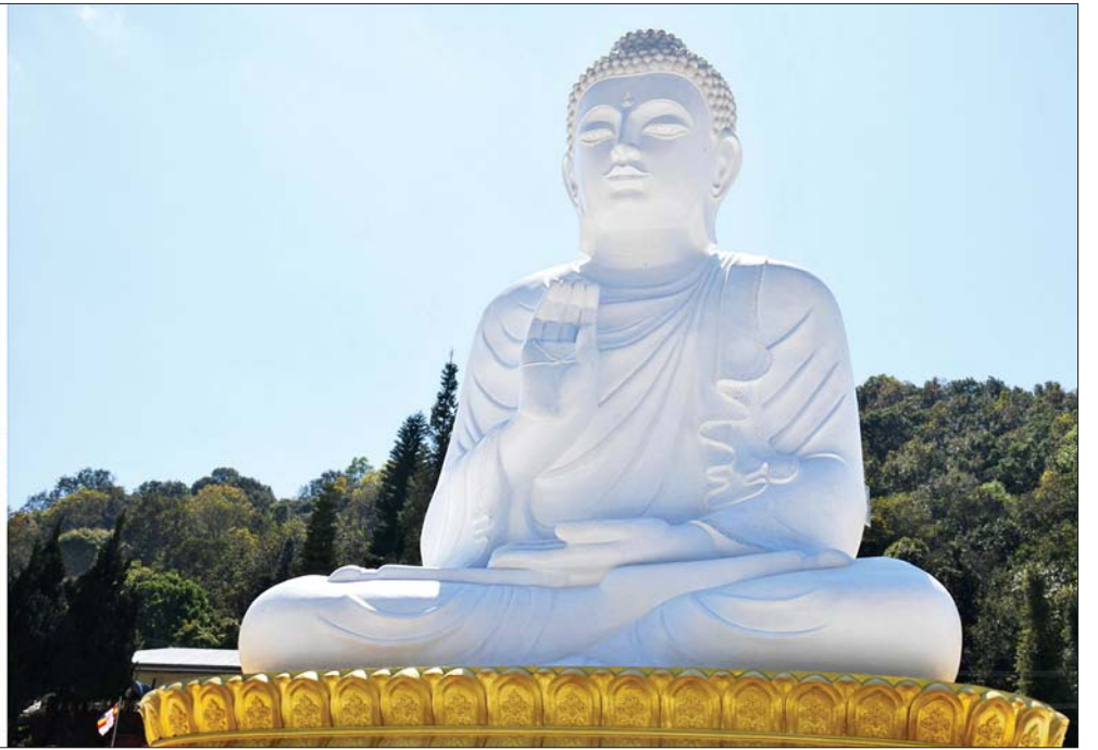
နိုင်ငံတော်စီမံအုပ်ချုပ်ရေးကောင်စီဥက္ကဋ္ဌ နိုင်ငံတော်ဝန်ကြီးချုပ် ဗိုလ်ချုပ်မှူးကြီးမင်းအောင်လှိုင် အာယရာဇေဗန် ရုပ်ပွားတော်မြတ်ကြီးအား ပန်း၊ ရေချမ်း ကပ်လှူပူဇော်စဉ်။

မှုကို သွားရောက်ကြည့်ရှုရာ တာဝန်ရှိသူများက ရေလှောင်တံခံဆောင်ရွက်နေမှုအခြေအနေနှင့် ကျိုင်းတုံမြို့နယ် ရေကြီး