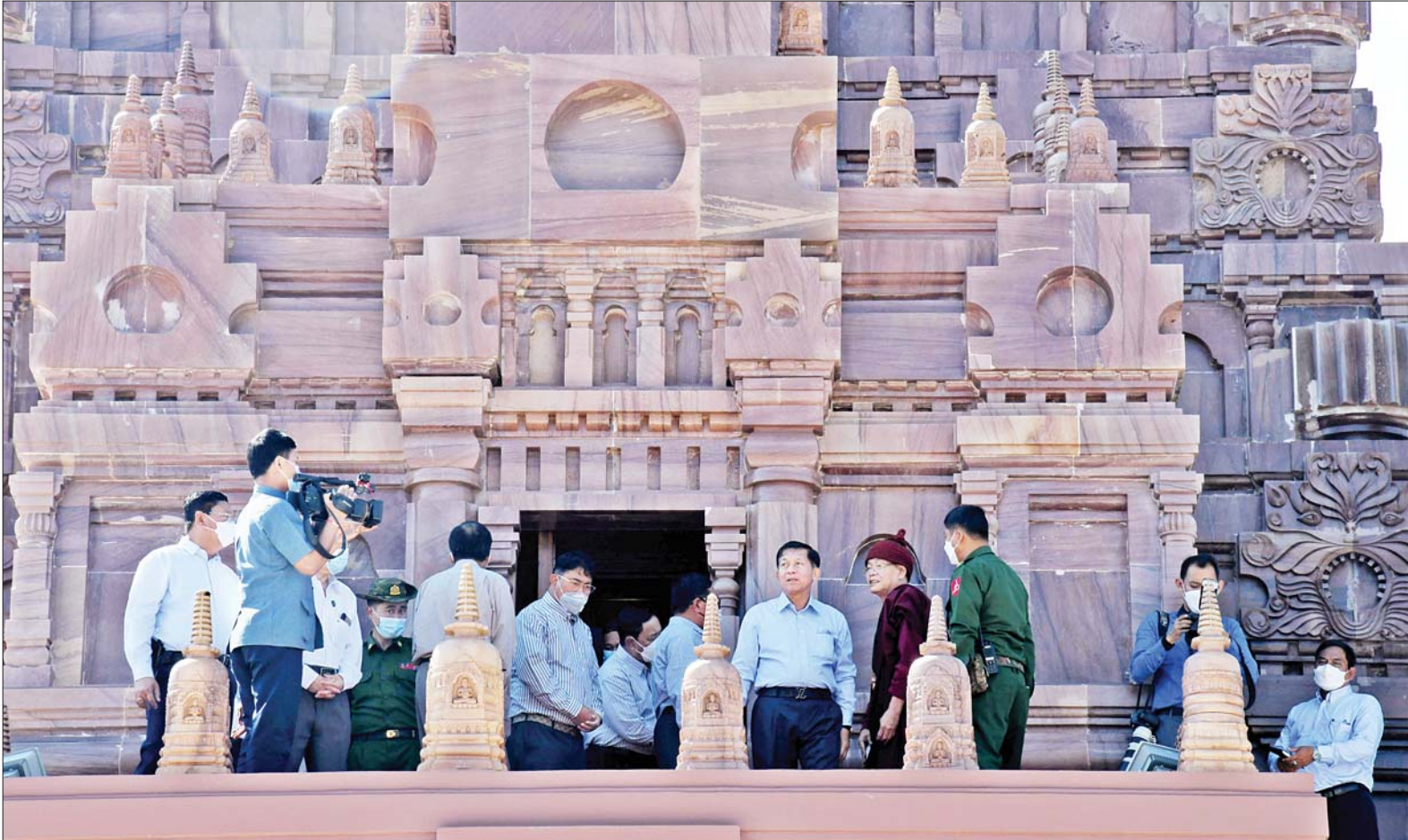
နိုင်ငံတော်စီမံအုပ်ချုပ်ရေးကောင်စီဥက္ကဋ္ဌ နိုင်ငံတော်ဝန်ကြီးချုပ် ဗိုလ်ချုပ်မှူးကြီးမင်းအောင်လှိုင် သတ္တသတ္တာဟ မဟာဗောဓိစေတီတော်မြတ်ကြီး တည်ဆောက်ပြီးစီးမှုကို ကြည့်ရှုစဉ်။

နေပြည်တော် ဖေဖော်ဝါရီ ၁၅ နိုင်ငံတော် စီမံအုပ်ချုပ်ရေး ကောင်စီဥက္ကဋ္ဌ နိုင်ငံတော်ဝန်ကြီးချုပ် ဗိုလ်ချုပ်မှူးကြီး မင်းအောင်လှိုင် နှင့် အဖွဲ့ဝင်များသည် သီလဓမ္မ ကုန်းသာ တောရကျောင်းတိုက် ဦးစီးပဓာန နာယက (ဝစီပိတ်) ဆရာတော် ဘဒ္ဒန္တကောဝိဒ အမှူး ပြု၍ ယနေ့ မွန်းလွဲပိုင်းတွင် ကျိုင်းတုံမြို့ အရှေ့တောင်ဘက် ၁၅ မိုင်ခန့်အကွာ ပန်ကွဲကျေးရွာ အနီးရှိ ဗုဒ္ဓဥယျာဉ်ပရိဝုဏ်တော် အတွင်း သတ္တသတ္တာဟ မဟာ ဗောဓိစေတီတော်မြတ်ကြီး တည် ဆောက်နေမှုအခြေအနေများအား သွားရောက်ကြည့်ရှုသည်။ ဦးစွာ နိုင်ငံတော်စီမံအုပ်ချုပ် ရေးကောင်စီဥက္ကဋ္ဌ နိုင်ငံတော် ဝန်ကြီးချုပ်နှင့် အဖွဲ့ဝင်များသည် ပရိဝုဏ်တော်အတွင်းသို့ ရောက်ရှိ ကြပြီး အဘယရာဇမုနိ ရုပ်ပွား တော်မြတ်ကြီးအား ဖူးမြော် ကြည့်ညို၍ ပန်း၊ ရေချမ်း ကပ်လှူ ပူဇော်၍ လက်ယာရစ်လှည့်လည် ပူဇော်ကြကာ ငြိမ်းချမ်းသာယာ ဖွံ့ဖြိုးရေးခေါင်းလောင်းတော်အား ထိုးခတ်ပူဇော်သည်။ စာမျက်နှာ ၃ ကော်လံ ၁ သို့ ☆