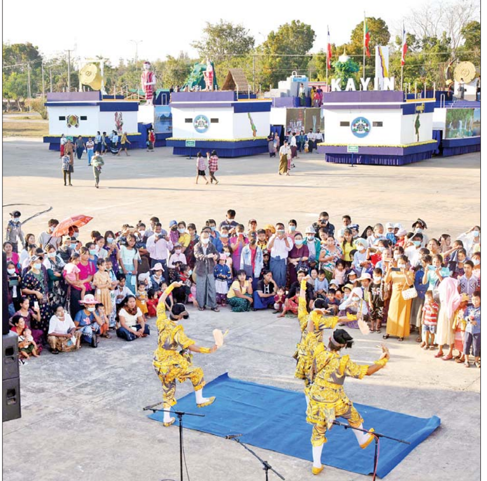
လာရောက်လေ့လာကြည့်ရှုကြသူများအား မင်းသားအကဖြင့် ဖျော်ဖြေစဉ်။