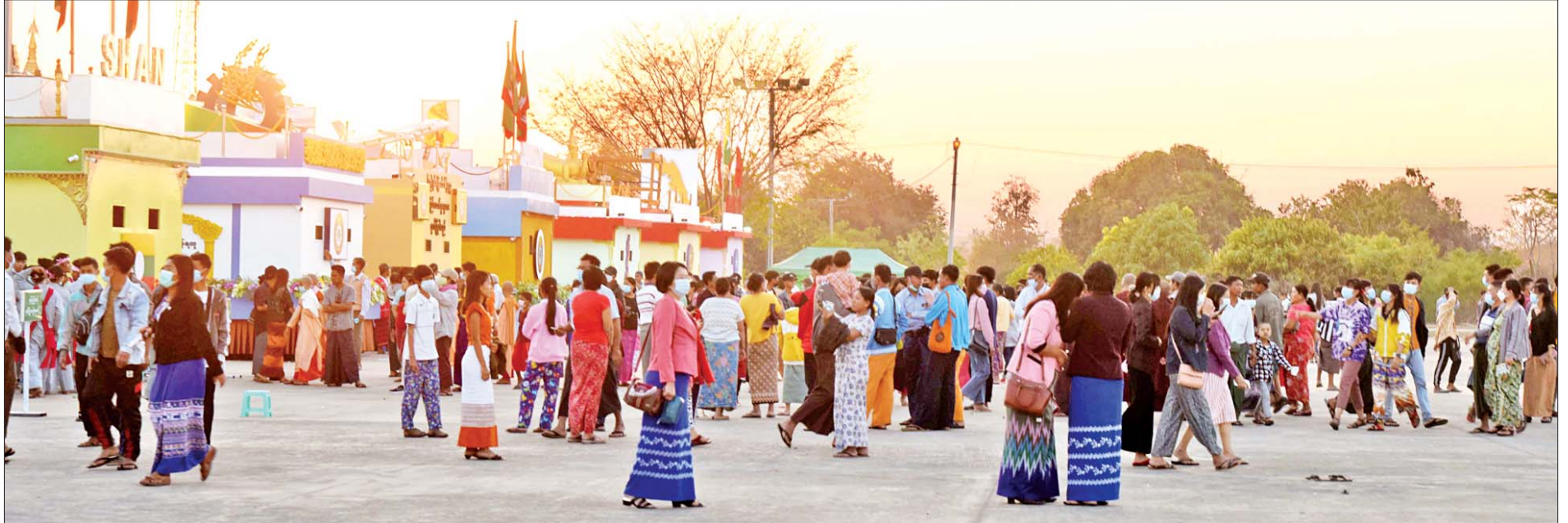
တိုင်းဒေသကြီး/ပြည်နယ်များကိုယ်စားပြု ဂုဏ်ပြုယာဉ်များအား လာရောက်လေ့လာကြည့်ရှုကြသူများဖြင့် စည်ကားလျက်ရှိသည်ကို တွေ့ရစဉ်။