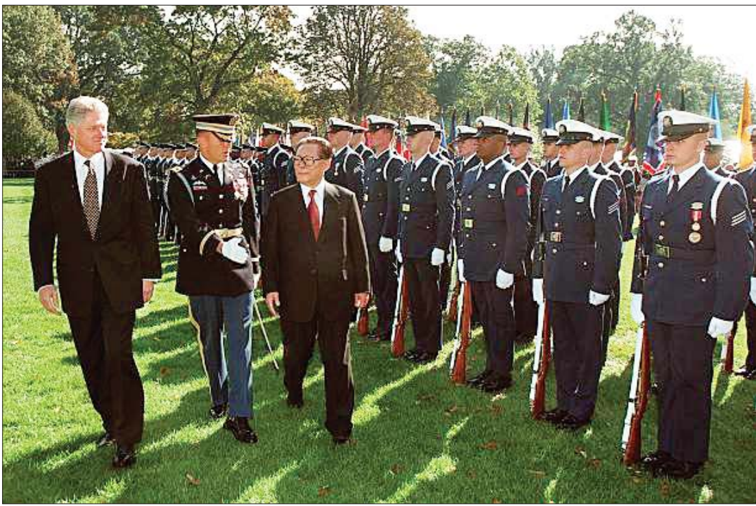
၁၉၉၇ ခုနှစ်က အမေရိကန်သမ္မတ ဘီကလင်တန်က တရုတ်နိုင်ငံသမ္မတ ကျန်စီမင်းအား ဂုဏ်ပြုတပ်ဖွဲ့ဖြင့် ကြိုဆိုဂုဏ်ပြုစဉ်။

မြန်မာဝေဟာရတွေအရ ဒီမိုကရေစီ (Democracy)၊ လွတ်လပ်မှု (Freedom)၊ လွတ်လပ်ရေး (Independence)၊ လွတ်မြောက်မှု (Liberation)၊ လူ့အခွင့်အရေး (Human Rights)၊ အတိုက်အခံပါတီ (Opposition Party)၊ ပြည်သူ့ဝန်ထမ်း (Public Servant)၊ အစိုးရဝန်ထမ်း (Government Servant)၊ အစိုးရမဟုတ်တဲ့အဖွဲ့အစည်း (NGO) စတဲ့ဆိုလိုရင်းအဓိပ္ပာယ်တွေနဲ့ နားလည် သူတွေဟာ သာမန်မြန်မာလူထုထဲမှာ ရှုပ်ထွေးနေတတ်ပါတယ်။ ဒါကြောင့် ဒီမိုကရေစီကို ကျင့်သုံးကြပေမယ့် အကျိုးဆက်ရလဒ်မှာတော့ တစ်နိုင်နဲ့ တစ်နိုင် မတူတာကို တွေ့ရပါတယ်။ အတိုက်အခံပါတီဆိုတိုင်း အစိုးရလုပ် သမျှ စီမံသမျှ တိုက်ထုတ်ဆန့်ကျင်နေဖို့ မဟုတ်။ ဒီမိုကရေစီကျင့်စဉ်အရ ကောင်းဖို့နည်းလမ်း၊ ကောင်းဖို့အတွက် အကျိုးအကြောင်းနဲ့ ဝေဖန်သုံးသပ်ခြင်း၊ ညှိနှိုင်းခြင်းသည်သာ အတိုက်အခံရဲ့ အဓိပ္ပာယ်ဖြစ်ပါတယ်။ ဆန့်ကျင်တိုက်ပွဲဝင်ခြင်းဟာ ဒီမို