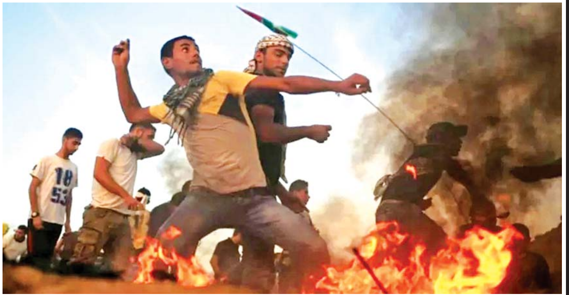
အစွဲရေး - ပါလက်စတိုင်း ပဋိပက္ခအတွင်း ၂၀၁၇ ခုနှစ်က ပါလက်စတိုင်းလူငယ်များက အစွဲရေးတပ်များကို ခဲများနှင့် ပစ်ခတ်နေသည့်ကို တွေ့ရစဉ်။

သမ္မတ ကျန်ဇီမင်းကမူ နောင်တရ ဝမ်းနည်းတဲ့လက္ခဏာမပြ။ ပြန်လည် ဆွေးနွေးရာမှာ “၁၉၈၉ ခုနှစ် နွေရာသီ အတွင်း ဖြစ်ပွားခဲ့တဲ့ နိုင်ငံရေးပယောဂ အနှောင့်အယှက်ဟာ လူမှုရေးတည်ငြိမ်မှုနဲ့ နိုင်ငံရဲ့လုံခြုံရေးအထိ ကြီးမားစွာ အန္တရာယ်ပြုလာတာကြောင့် တရုတ် အစိုးရဟာ လိုအပ်တဲ့တုံ့ပြန်မှုတွေကို ဥပဒေနဲ့အညီ အခြေအနေကို ဖြေရှင်းခဲ့ရကြောင်း” ပြောကြားခဲ့တာတွေ့ရပါတယ်။