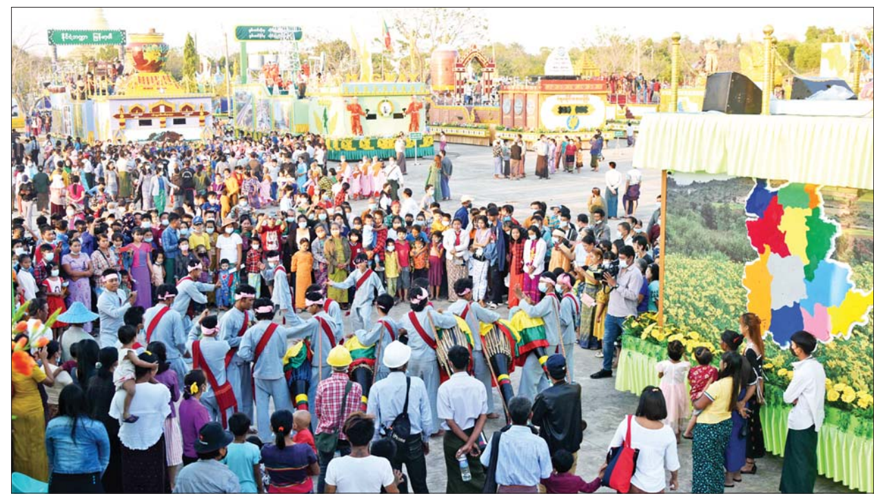
လာရောက်လေ့လာကြည့်ရှုကြသူများအား ရှမ်းတိုင်းရင်းသားရဲရာယဉ်ကျေးမှုအကဖြင့် ဖျော်ဖြေစဉ်။

နေပြည်တော် ဖေဖော်ဝါရီ ၁၅ (၇၅)နှစ်မြောက် စိန်ရတုပြည်ထောင်စုနေ့ ဂုဏ်ပြုအခမ်းအနားတွင် ပါဝင်ပြသခဲ့ကြသည့် ပြည်ထောင်စုနယ်မြေနှင့် တိုင်းဒေသကြီး၊ ပြည်နယ်အသီးသီးမှ ဂုဏ်ပြုယာဉ်များအား နေပြည်တော်ဥပျာတက္ကသိုလ် စေတီတော်ရှေ့ တပေါင်းကွင်း၌ ခင်းကျင်းပြသလျက်ရှိရာ ယနေ့ တတိယနေ့တွင် ပြည်သူများစိတ်ပါဝင်စားစွာ တစ်ခဲနက်လာရောက် လေ့လာကြည့်ရှုကြသည်။