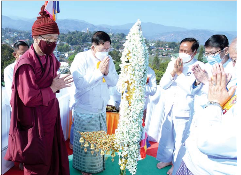
နိုင်ငံတော်စီမံအုပ်ချုပ်ရေးကောင်စီဥက္ကဋ္ဌ နိုင်ငံတော်ဝန်ကြီးချုပ် ဗိုလ်ချုပ်မှူးကြီးမင်းအောင်လှိုင် ရတနာစိန်ဖူးတော်၊ ငှက်မြတ်နားတော်တို့အား ဂန္ဓကုဋ်ကျောင်းဆောင်တော်အထွတ်သို့ ပင့်ဆောင် တင်လှူပူဇော်စဉ်။