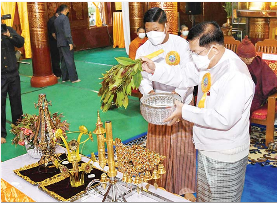
နိုင်ငံတော်စီမံအုပ်ချုပ်ရေးကောင်စီဥက္ကဋ္ဌ နိုင်ငံတော်ဝန်ကြီးချုပ် ဗိုလ်ချုပ်မှူးကြီးမင်းအောင်လှိုင် ငှက်မြတ်နားတော်ကို ပရိတ်နံ့သာရည်များ ပက်ဖျန်းစဉ်။

ပက်ဖျန်းကြပြန် ယင်းနောက် ဥပါသကာများက ပရိတ်ပန်း၊ ပရိတ်ရေ၊ ပရိတ်ချည်၊ ပရိတ်သံများကို ယူဆောင်၍ မဟာမြတ်မုနိဘုရားကြီး ဂန္ဓကုဋ် ကျောင်းဆောင်တော်ပရိဝုဏ်တွင် ပက်ဖျန်းကြပြန် ချည်နှောင်ကြ သည်။ ဆက်လက်၍ နိုင်ငံတော်စီမံ အုပ်ချုပ်ရေး ကောင်စီဥက္ကဋ္ဌ နိုင်ငံတော်ဝန်ကြီးချုပ်နှင့် ဇနီး တို့က ရတနာစိန်ဖူးတော်နှင့် လှူဖွယ် ပစ္စည်းများအား ကျိုင်းယင်း ကျောင်းတိုက် ဆရာတော်ကြီးထံလည်းကောင်း၊ မိသားစုဝင်များက ငှက်မြတ်