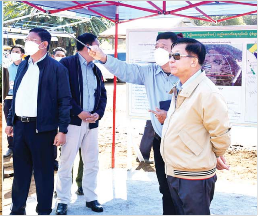
နိုင်ငံတော်စီမံအုပ်ချုပ်ရေးကောင်စီဥက္ကဋ္ဌ နိုင်ငံတော်ဝန်ကြီးချုပ် ဗိုလ်ချုပ်မှူးကြီးမင်းအောင်လှိုင် ရေလှောင်တံခံတည်ဆောက်နေမှုကို ကြည့်ရှုစဉ်။