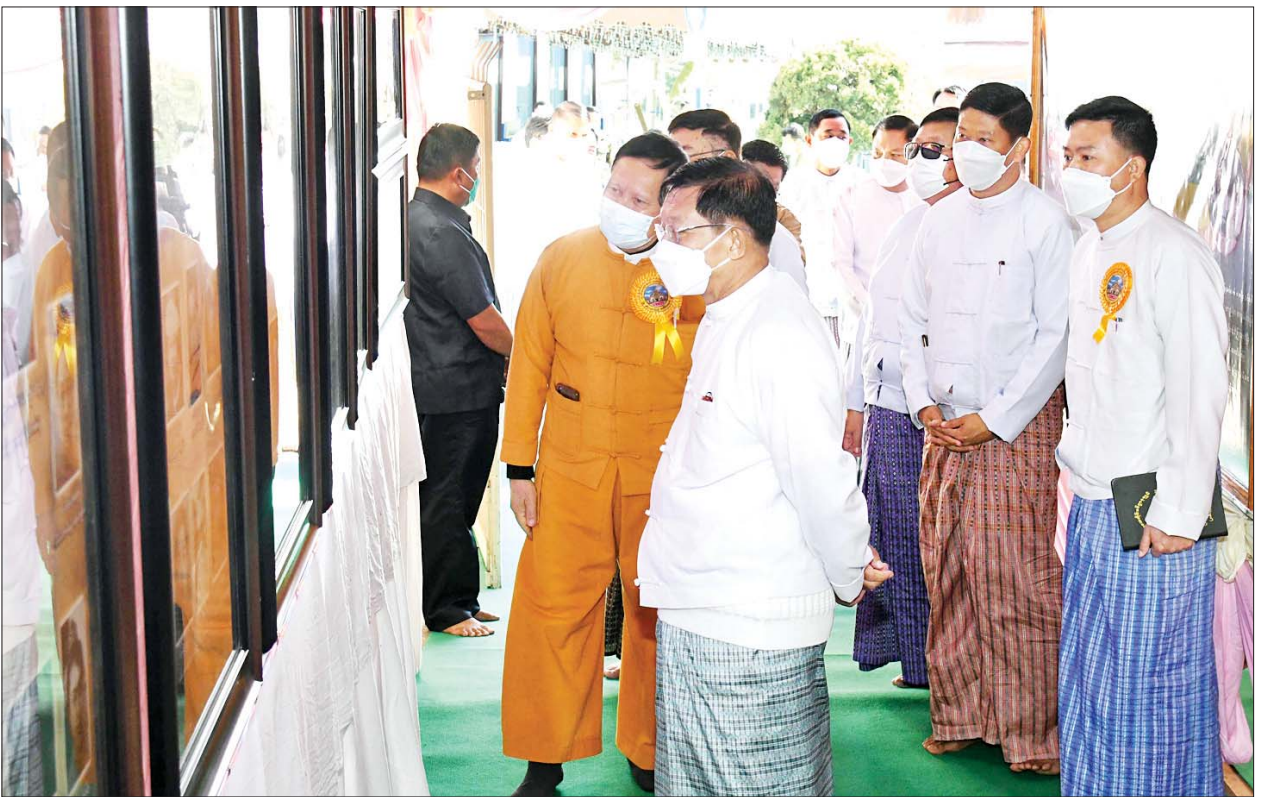
နိုင်ငံတော်စီမံအုပ်ချုပ်ရေးကောင်စီဥက္ကဋ္ဌ နိုင်ငံတော်ဝန်ကြီးချုပ် ဗိုလ်ချုပ်မှူးကြီး မင်းအောင်လှိုင်နှင့်အဖွဲ့ဝင်များ ကျိုင်းတုံမြို့ မဟာမြတ်မုနိ ဘုရားကြီး နှစ် (၁၀၀)ပြည့် အထိမ်းအမှတ်ပြခန်းအတွင်း လှည့်လည်ကြည့်ရှုစဉ်။

မဟာမြတ်မုနိ ဘုရားကြီးသည် နှစ်ပေါင်း ၁၀၀ သက်တမ်းရှိပြီ ဖြစ်ပြီး သမိုင်းဝင်ဘုရားကြီး ရေရှည်တည်တံ့ ခိုင်မြဲစေရေး ဆက်လက်ပြုပြင်မွမ်းမံထိန်းသိမ်း ဆောင်ရွက်လျက် ရှိကြောင်းနှင့် ဘုရားကြီး နှစ်(၁၀၀) ပြည့် အထိမ်းအမှတ်အဖြစ် ဦးဆောင် ဘုရားဒါယကာ နိုင်ငံတော်စီမံ အုပ်ချုပ်ရေး ကောင်စီဥက္ကဋ္ဌ နိုင်ငံတော်ဝန်ကြီးချုပ် ဗိုလ်ချုပ် မှူးကြီး မင်းအောင်လှိုင်၊ ဇနီး ဒေါ်ကြူကြူလှနှင့် မိသားစုဝင် များ၊ စေတနာရှင်အလှူရှင်များ၊ ဒေသခံတိုင်းရင်းသား ပြည်သူ တို့၏ စုပေါင်းလှူဒါန်းမှုဖြင့် ရတနာ စိန်ဖူးတော်၊ ရွှေထီးတော်တင်လှူ ပူဇော်ပွဲနှင့် ဗုဒ္ဓါဘိသေက အနေ ကဇာတင် မဟာမင်္ဂလာအခမ်း အနားကို ယနေ့တွင်အောင်မြင်စွာ ကျင်းပနိုင်ခဲ့ခြင်း ဖြစ်သည်။ သတင်းစဉ်