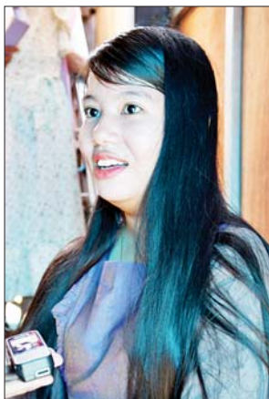
မကေသီဝင်းထွဋ်