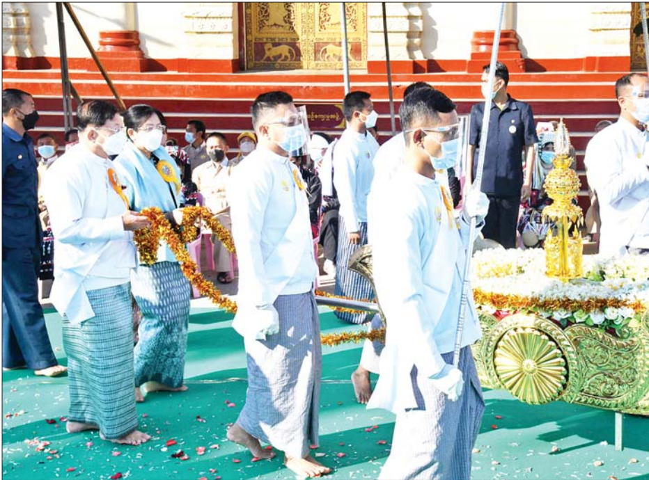
နိုင်ငံတော်စီမံအုပ်ချုပ်ရေးကောင်စီဥက္ကဋ္ဌ နိုင်ငံတော်ဝန်ကြီးချုပ် ဗိုလ်ချုပ်မှူးကြီးမင်းအောင်လှိုင် နှင့်ဇနီး ဒေါ်ကြူကြူလှ ရတနာစိန်ဖူးတော်၊ ငှက်မြတ်နားတော်တို့အား ပင့်ဆောင်၍ ဂန္ဓကုဋ်ကျောင်းဆောင်တော်အား လက်ယာရစ်လှည့်လည်ပူဇော်စဉ်။