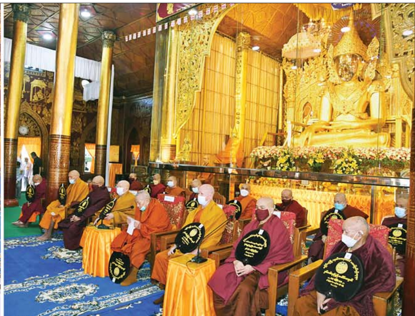
နိုင်ငံတော်စီမံအုပ်ချုပ်ရေးကောင်စီဥက္ကဋ္ဌ နိုင်ငံတော်ဝန်ကြီးချုပ် ဗိုလ်ချုပ်မှူးကြီးမင်းအောင်လှိုင်နှင့် အခမ်းအနားတက်ရောက်လာကြသူများ ကျိုင်းယင်းကျောင်းတိုက်ဆရာတော်ကြီးထံမှ ကိုးပါးသီလ ခံယူဆောက်တည်ကြစဉ်။