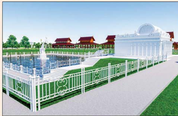
မုစလိန္နုအိုင်

၁။ နိုင်ငံတော်စီမံအုပ်ချုပ်ရေးကောင်စီဥက္ကဋ္ဌ၊ တပ်မတော်ကာကွယ်ရေးဦးစီးချုပ် ဗိုလ်ချုပ်မှူးကြီးမင်းအောင်လှိုင် ဦးဆောင်သည့် (၇)ရက်သား၊ သမီး၊ ဘုရားဒါယကာ၊ ဒါယိကာမတို့က မာရဝိဇယပုဒ္ဒရုပ်ပွားတော်မြတ်ကြီးအား မြန်မာနိုင်ငံတွင် ထေရဝါဒပုဒ္ဒသာသနာတော်ထွန်းလင်းတောက်ပလျက်ရှိသည်ကို ကမ္ဘာကိုပြသရန်၊ တိုင်းပြည်အေးချမ်းသာယာမှုရှိစေရန်၊ ရုပ်ပွားတော် မြတ်ကြီးအား ပြည်တွင်း၊ ပြည်ပဘုရားဖူးများလာရောက်ခြင်းဖြင့် ဒေသတိုးတက်စည်ကားမှုကို အထောက်အကူဖြစ်စေရန်၊ နိုင်ငံတော်ဖွံ့ဖြိုးတိုးတက်မှုအား အထောက်အကူဖြစ်စေရန် ရည်သန်လျက် ပြည်ထောင်စုနယ်မြေ နေပြည်တော်၊ ဒက္ခိဏသီရိမြို့နယ်အတွင်း၌ သာသနာတော်ထုံး၊ ရုပ်ပွားဆင်းတုတော်ထုံး၊ မြန်မာ့ရိုးရာတည်ထုံးများနှင့်အညီ တည်ဆောက်ပူဇော်လျက် ရှိပါသည်။