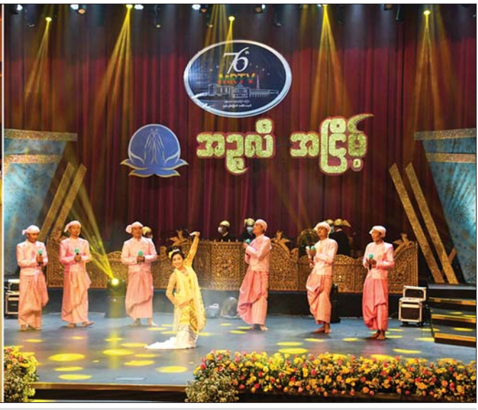
ပြည်ထောင်စုဝန်ကြီး ဦးမောင်မောင်အုန်း၊ ပြည်ထောင်စုဝန်ကြီး ဦးအောင်နိုင်ဦး၊ ပြည်ထောင်စုဝန်ကြီး ဦးအောင်သန်းဦး၊ ပြည်ထောင်စုဝန်ကြီး ဒေါက်တာပွင့်ဆန်းနှင့် တက်ရောက်လာကြသူများအား မြန်မာ့အသံနှင့် ရုပ်မြင်သံကြား ဝန်ထမ်းများက အခွင့်အလမ်းအဖြစ်ဖြင့် ဖျော်ဖြေကြသည်။

ရုပ်ရှင်၊ သဘင်၊ ဂီတ၊ စာပေ အနုပညာရှင်များနှင့်လည်း လက်တွဲဆောင်ရွက်လျက်ရှိကြောင်း၊ MRTV News Channel အသစ်တစ်ခုကို ဖေဖော်ဝါရီ ၁ ရက်တွင် ထပ်မံထုတ်လွှင့်နိုင်ခဲ့ပြီး နောက်ပိုင်းတွင်လည်း အစီအစဉ်အသစ်များ၊ ရုပ်သံလိုင်းအသစ်များ ထပ်မံ