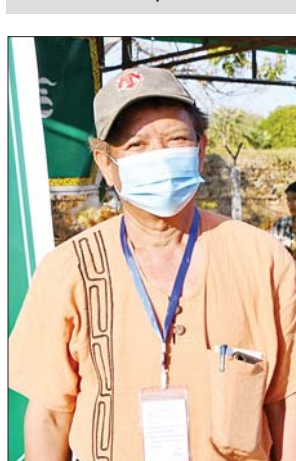
ဦးမျိုးဦး

မခင်သီတာအောင် လာရောက်လေ့လာသူ အလက မင်္ဂလာဇေယျျ (၇၅) နှစ်ပြည့် စိန်ရတု ပြည်ထောင်စုနေ့ အထိမ်းအမှတ် အဖြစ် တိုင်းဒေသကြီးနဲ့ ပြည်နယ် တွေရဲ့ အထင်ကရတွေကို ယာဉ် တွေနဲ့အတူ တိုင်းရင်းသားရိုးရာ အကတွေ ဖျော်ဖြေတင်ဆက်တာ တွေကို သတင်းစာတွေဖတ်၊ တီဗွီ တွေမှာကြည့်လိုက်ရတဲ့အတွက် သမီးတို့ကျောင်းက သူငယ်ချင်း တွေစုပြီး လာရောက်လေ့လာ တာပါ။ ကျောင်းသင်ခန်းစာမှာ သင်ခဲ့ရတဲ့ မင်းကွန်းခေါင်းလောင်း ကြီးနဲ့ ပင်လုံကျောက်တိုင်တွေကို ကြည့်ရှုလေ့လာခဲ့ပါတယ်။ ယာဉ် တွေအပေါ်တက်ပြီး လေ့လာတဲ့ အခါမှာ မကွေးတိုင်းဒေသကြီးက ဆီဆုံကြီးကို သမီးတို့ပိုပြီးစိတ်ဝင် စားကြပါတယ်။ ဒီလိုမျိုး တိုင်း ဒေသကြီးနဲ့ ပြည်နယ်တွေမှာရှိတဲ့ အထင်ကရ အထိမ်းအမှတ် အားလုံးကို တစ်နေရာတည်းမှာ