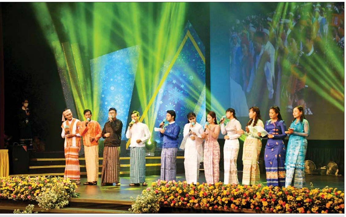
အနုပညာရှင်များက တေးသီချင်းများဖြင့် သီဆိုဖျော်ဖြေကြသည်။

မြန်မာနိုင်ငံအရပ်ရပ်မှ အများပြည်သူများအရပ်အဝန်းအရည်အသွေးကောင်းမွန်သည့် အစီအစဉ်များကို ဖမ်းယူကြည့်ရှု နားဆင်နိုင်ရန် မြန်မာနိုင်ငံတစ်ဝန်း ရုပ်မြင်သံကြား ထပ်ဆင့်လွှင့်စက်ရုံပေါင်း ၂၅၈ ရုံ ဖွင့်လှစ်ထားရှိပြီး မြန်မာ့အသံ FM ရေဒီယိုလွှင့်စက်များ တိုးချဲ့တပ်ဆင်ထားသည့် စက်ရုံ ၈၅ ရုံ၊ ဒစ်ဂျစ်တယ်စနစ်ဖြင့် ထုတ်လွှင့်သည့် DVB T2 လွှင့်စက် တပ်ဆင်ထားသည့် စက်ရုံပေါင်း ၁၅၃ ရုံဖြင့် ထုတ်လွှင့်လျက်ရှိသည်။ သတင်းစဉ်