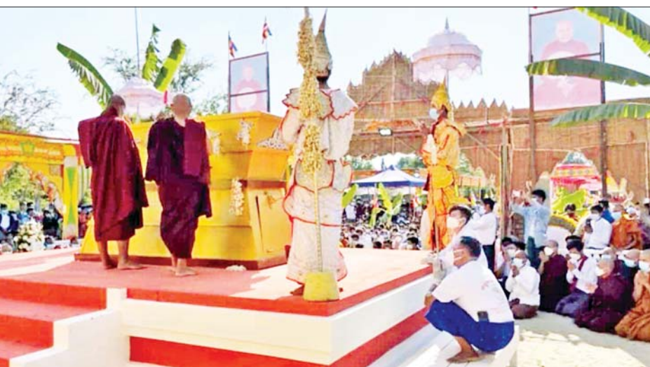
ရစ်ရပ်ခွဲကျင်းပခဲ့ပြီး ဒုတိယပိုင်းတွင် အစီအစဉ် ဆရာတော်၏ ရုပ်ကလာပ်တော်ကို ကြေးစည် တီး၊ သာသနာ့အလံကို၊ ပန်းအိုးကို၊ ပရိက္ခရာကို၊

မုံရွာ ဖေဖော်ဝါရီ ၁၃ ရန်ကုန်မြို့ သဒ္ဓမ္မမာန်တာရုံကျောင်းတိုက် ဦးစီးပဓာနနာယက မုံရွာမြို့ သဒ္ဓမ္မဇောတက သုဗောဓာရုံကျောင်းတိုက်နာယက ဒွါဒသမတပ်မတော်၏ အန္တိမအင်္ဂါပုဂ္ဂိုလ်များ ဖေဖော်ဝါရီ ၁၃ ရက် မွန်းလွဲပိုင်းက မုံရွာမြို့ သဒ္ဓမ္မဇောတက သုဗောဓာရုံကျောင်းတိုက်တွင် ကျင်းပသည်။ အန္တိမအင်္ဂါပုဂ္ဂိုလ်အခမ်းအနားကို အစီအစဉ် နှစ်ပိုင်းခွဲ၍ကျင်းပရာ ပထမပိုင်း အခမ်းအနားကို သဗ္ဗေသင်္ခါရာ အနိစ္စာ အစရှိသော သံဝေဂဂါထာ (၃)ဂါထာရွတ်ပွား၍ ဖွင့်လှစ်သည်။ ထို့နောက် မဟာသုဗောဓာရုံကျောင်းတိုက်ကြီး၏ တွဲဖက် ဦးစီးနာယက မတ္တရာဆရာတော်ကြီးထံမှ သရဏဂုံ သီလခံယူဆောင်တည်ကြပြီး ပါမောက္ခချုပ် ဆရာတော်ကြီးမှပေးပို့သော သံဝေဇနိယနှင့် ဥယောဇနကထာကို ဖတ်ကြားသည်။ ပထမပိုင်းကို အစီအစဉ်