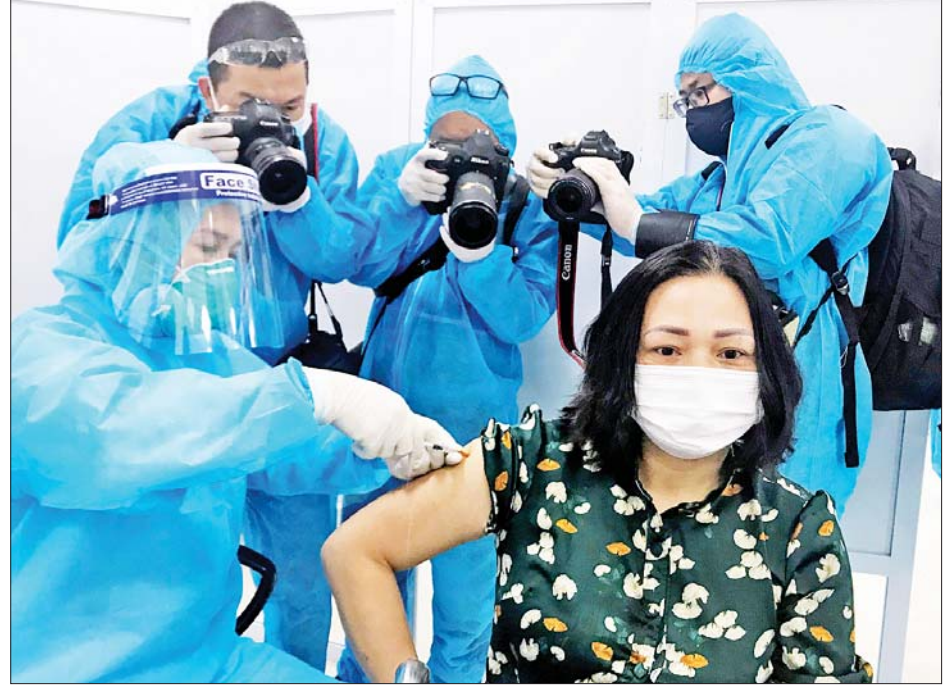
ကိုးကား-ဆင်ဟွာ ဘာသာပြန်-အလင်းသစ်

ဗီယက်နမ်နိုင်ငံ၌ နိုင်ငံတစ်ဝန်း ကိုဗစ်-၁၉ ရောဂါ ကာကွယ်ဆေးထိုးနှံမှု အစီအစဉ်အောက်တွင် ကာကွယ်ဆေးအလုံးရေ ၁၈၅ ဒသမ ၇ သန်းခန့် အသုံးပြုပြီးဖြစ်ကြောင်း၊ ယင်းကာကွယ်ဆေးများ အနက် ၃၁ ဒသမ ၈ သန်းအား တတိယအကြိမ် အပိုဆောင်းထိုးနှံရာတွင် အသုံးပြုခဲ့ကြောင်း သိရသည်။