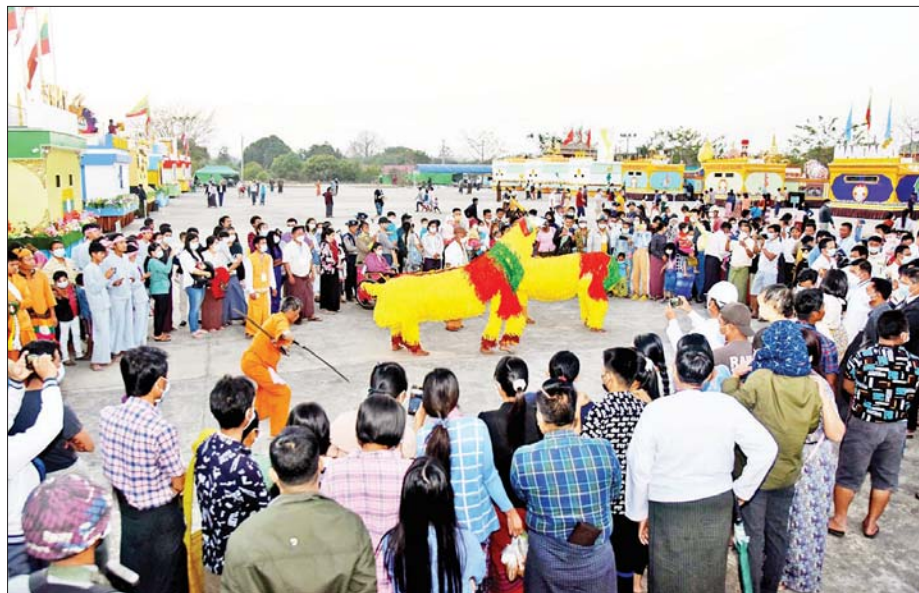
ရှမ်းပြည်နယ် ရိုးရာယဉ်ကျေးမှုအဖွဲ့က ရှမ်းရိုးရာအကအလှများဖြင့် ကပြဖျော်ဖြေစဉ်။