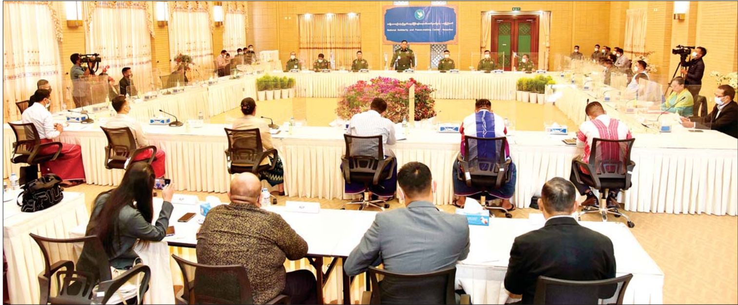
အမျိုးသားစည်းလုံးညီညွတ်ရေးနှင့် ငြိမ်းချမ်းရေးဖော်ဆောင်မှုညှိနှိုင်းရေးကော်မတီနှင့် တိုင်းရင်းသားလက်နက်ကိုင်အဖွဲ့အစည်းများမှ ကိုယ်စားလှယ်များ တွေ့ဆုံဆွေးနွေးစဉ်။

နေပြည်တော် ဖေဖော်ဝါရီ ၁၃ အမျိုးသားစည်းလုံးညီညွတ်ရေးနှင့် ငြိမ်းချမ်းရေးဖော်ဆောင်မှု ညှိနှိုင်းရေး ကော်မတီနှင့် တိုင်းရင်းသားလက်နက် ကိုင်အဖွဲ့အစည်းများမှ ကိုယ်စားလှယ် များသည် နေပြည်တော်ရှိ အမျိုးသား စည်းလုံးညီညွတ်ရေးနှင့် ငြိမ်းချမ်းရေး ဖော်ဆောင်မှုပဟိုဠာနှင့် ယနေ့နံနက် ပိုင်းတွင် အလွတ်သဘော တွေ့ဆုံဆွေးနွေး ကြသည်။ တက်ရောက် တွေ့ဆုံဆွေးနွေးပွဲသို့ နိုင်ငံတော် စီမံအုပ်ချုပ်ရေးကောင်စီ အဖွဲ့ဝင် ပြည်ထောင်စုအစိုးရအဖွဲ့ရုံးဝန်ကြီးဌာန(၁) ပြည်ထောင်စုဝန်ကြီး အမျိုးသားစည်းလုံး ညီညွတ်ရေးနှင့် ငြိမ်းချမ်းရေး ဖော်ဆောင်မှုညှိနှိုင်းရေးကော်မတီ ဥက္ကဋ္ဌ ဒုတိယဗိုလ်ချုပ်ကြီးရာပြည့်နှင့် ကော်မတီ စာမျက်နှာ ၁၀ ကော်လံ ၁ သို့ ။