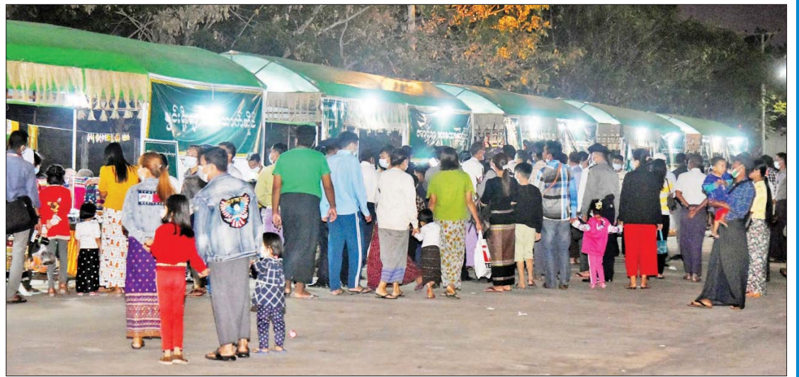
တိုင်းရင်းသားရိုးရာစားသောက်ဆိုင်များတွင် ဝယ်ယူအားပေးနေကြသူများကို တွေ့ရစဉ်။