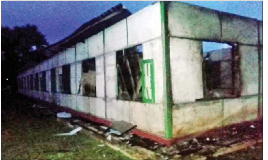
ဒီမိုကရေစီအတွက်ဟု တွင်တွင်ပြောဆိုကာ ချင်းပြည်နယ် ဖလမ်းမြို့နယ် တလန်လိုရပ်ကွက်ရှိ အမှတ်(၅)အခြေခံပညာမူလတန်းကျောင်းနှင့် ကျောက်ပန်းတောင်းမြို့နယ် နတ်ကန်လည်ကျေးရွာ အထက်တန်းကျောင်းတို့အား အကြမ်းဖက်သောင်းကျန်းသူများက မိုင်းထောင်ဖောက်ခွဲမှုများနှင့် မီးရှို့ဖျက်ဆီးမှုများပြုလုပ်စဉ်။