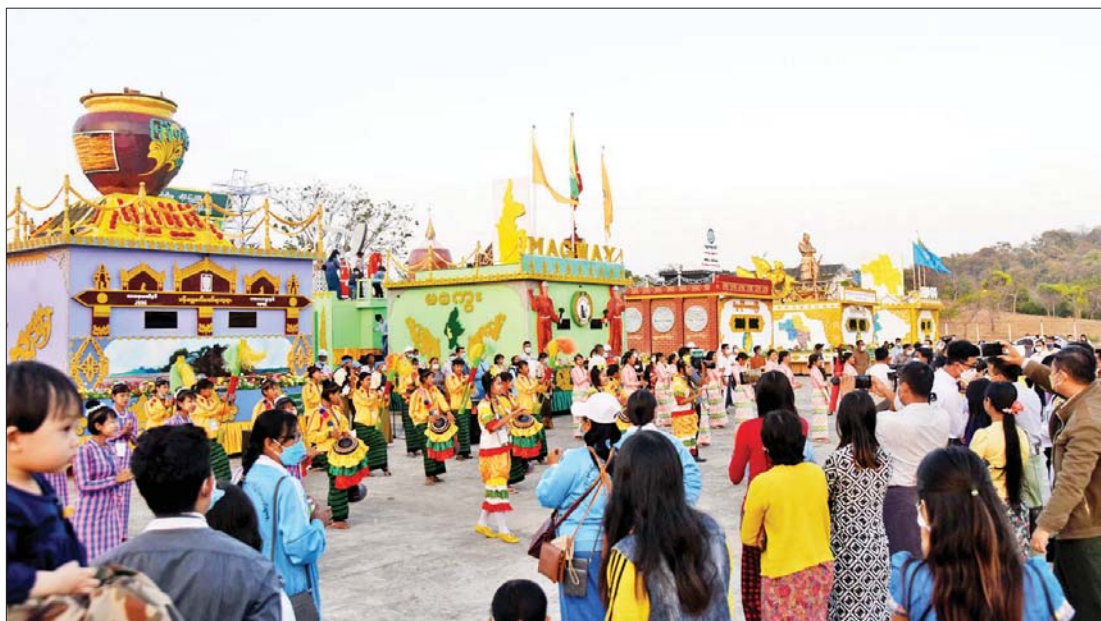
မကွေးတိုင်းဒေသကြီး ရိုးရာယဉ်ကျေးမှုအဖွဲ့က ရိုးရာအကအလှများဖြင့် ကပြဖျော်ဖြေစဉ်။