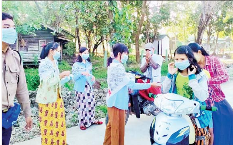
သင်တန်းသူများက အိုမီခရွန်ရောဂါပိုး များအား နှာခေါင်းစည်း ၁၀၀၀ ကို(အခမဲ့) ကူးစက်မှု မဖြစ်ပွားစေရေးအတွက် ဖြန့်ဝေပေးခဲ့ကြောင်း သိရသည်။ အသိပညာပေးပြောကြားခဲ့ပြီး ပြည်သူ ဝါးခယ်မ(ပြန်/ဆက်)

ဝါးခယ်မ ဖေဖော်ဝါရီ ၁၃ ဧရာဝတီတိုင်းဒေသကြီး ဝါးခယ်မ မြို့နယ် ကြက်ခြေနီအသင်းခွဲမှ ဦးဆောင် ၍ ကိုဗစ်-၁၉ မျိုးရိုးဗီဇပြောင်း အိုမီခရွန် ရောဂါ ကြိုတင်ကာကွယ်ထိန်းချုပ်ရေး အသိပညာပေးခြင်းနှင့် နှာခေါင်းစည်း တပ်ဆင်ရေးလှုပ်ရှားမှု ပြုလုပ်ခြင်းကို ယနေ့နံနက် ၇ နာရီခွဲက စက်ရုံလမ်း သံကြိုးတိုင်ရပ်ကွက် မြို့နယ်ကြက်ခြေနီ အသင်းခွဲရုံးရှေ့တွင် ပြုလုပ်ခဲ့ကြောင်း သိရသည်။ ထိုသို့ဆောင်ရွက်ရာ ကြက်ခြေနီ အသင်းခွဲ ဒုတိယဥက္ကဋ္ဌနှင့် အမှုဆောင် များ၊ မြို့နယ်ကြက်ခြေနီ သူနာပြုတပ်ဖွဲ့၊ မြို့နယ်တပ်ဖွဲ့မှူးနှင့် တပ်ဖွဲ့ဝင်များ၊ ရှေးဦးပြုစုခြင်း(အခြေခံ)သင်တန်းသား