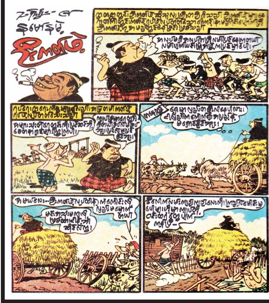
ဆရာကြီးသန်းကြွယ်၏ ကာတွန်းလက်ရာများကို မူရင်းအတိုင်း ဖော်ပြပါသည်။

သောအခါ ကုန်းသမားအလောင်းသည် စကားမဆိုဘဲ ငြိမ်နေပါသည်။ ထိုသူတို့လည်း မင်းကြီးထံပြန်၍ ကုန်းသမားအလောင်း စကားမဆိုကြောင်း လျှောက် တင်ကြပါသည်။ ထိုအခါ မင်းကြီးက ပထမမင်းချင်းအား... “နင်သည် ငါ့ကိုခြောက်၍ လိမ်လည်လျှောက်ရ သလော” ဟူ၍ဆိုကာ ထိုမင်းချင်းကိုသတ်စေပါသည်။ မင်းချင်းကို အဆုံးစီရင်ပြီးသောအခါ ကုန်းသမား အလောင်းက ခေါင်းထောင်၍ “ဘယ့်နယ်ရှိစ” ဟု ဆိုပါသည်။ ထိုအကြောင်းကို မင်းကြီးကြားသိသော် ကုန်းသမားကြောင့် ငါသည် အပြစ်မဲ့သောမင်းချင်း ကိုသတ်မိလေပြီဆိုကာ ကြီးစွာနောင်တရခဲ့ပါသည်။ ထို့နောက်... “ကုန်းသမားအလောင်းကိုလူမြင်အောင် ထား ၍မသင့်၊ မြေမြုပ်လော့” ဟုဆိုကာ မြေမြုပ်စေခဲ့ပါ သည်။ “အရှင်မင်းကြီး ဤပုံသက်သေကို ထောက်၍ ကုန်းသမားတို့ကို သတ်ပြုသင့်ပါသည်။ ကုန်းသမား တို့ ကုန်းချောသည့်စကားကိုလည်း မယုံကြည်သင့် ပါ။” ဤသို့ လုလင်က လျှောက်တင်သောအခါ ဘောဒကမင်းကြီးက “လုလင်၊ သင်သည် ပညာရှိ ပါပေသည်။ သင့်စကားထူးကိုကြားနာရသဖြင့် ငါ့မှာအကျိုးထူးပါပေသည်” ဟူ၍ ချီးမွမ်းပြောဆို သည်။ ထို့နောက် ရွှေစင်တစ်ထောင် ချီးမြှင့်လိုက် လေသည်။ ။ ဆရာကြီး မင်းယုဝေ၏ လက်ရွေးစင်ပုံပြင် ပေါင်းချုပ်စာအုပ်မှ ပုံပြင်ကို စာရေးသူမိသားစု၏ ခွင့်ပြုချက်ဖြင့် ကူးယူဖော်ပြပါသည်။