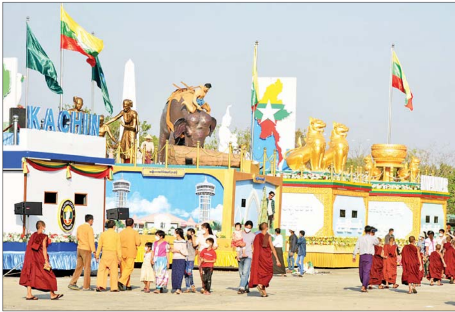
ပြည်ထောင်စုနယ်မြေကိုယ်စားပြု ဂုဏ်ပြုယာဉ်များအား လာရောက်လေ့လာကြည့်ရှုကြသူများကို တွေ့ရစဉ်။