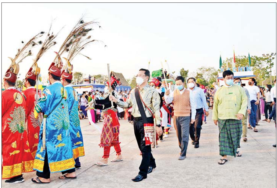
(၇၅)နှစ်မြောက် စိန်ရတု ပြည်ထောင်စုနေ့ဂုဏ်ပြုအခမ်း

ကြရာ ပြည်ထောင်စုဝန်ကြီး ဦးမောင်မောင်အုန်း၊ ဦးစောထွန်းအောင်မြင့်၊ နေပြည်တော်ကောင်စီ ဥက္ကဋ္ဌ ဒေါက်တာမောင်မောင်နိုင်၊ ကချင်ပြည်နယ် ဝန်ကြီးချုပ် ဦးခက်ထိန်နန်၊ ဒုတိယဝန်ကြီးများနှင့် နေပြည်တော်ကောင်စီဝင်များက ပြည်သူများနှင့်အတူ ပါဝင်ဆင်နွှဲကြသည်။ (ယာပုံ)