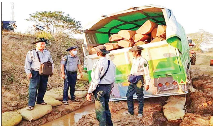
သိမ်းဆည်းရမိသည့် တရားမဝင်စားသောက်ကုန်ပစ္စည်းများနှင့် သစ်များကို တွေ့ရစဉ်။

နေပြည်တော် ဖေဖော်ဝါရီ ၁၃ တရားမဝင် ကုန်သွယ်မှုတိုက်ဖျက်ရေး ဦးဆောင်ကော်မတီ၏ ကြီးကြပ်ကွပ်ကဲမှုဖြင့် တရားမဝင်ကုန်သွယ်မှုများကို ဥပဒေနှင့်အညီ ထိရောက်စွာ တားဆီးအရေးယူနိုင်ရေး ဆောင်ရွက်လျက်ရှိရာ ဖေဖော်ဝါရီ ၁၂ ရက် တွင် ပဲခူးတိုင်းဒေသကြီး တရားမဝင်ကုန်သွယ် မှု တိုက်ဖျက်ရေးအဖွဲ့၏ စီမံခန့်ခွဲမှုဖြင့် တိုင်းဒေသကြီးအကောက်ခွန်ဦးစီးဌာနနှင့် တာဝန်ကျ ပူးပေါင်းအဖွဲ့များက ဝေါမြို့နှင့် ရွှေသံလွင်တိုင်းကိတ်အကြား ရှောင်တခင်စစ်ဆေး ရာ စားသောက်ကုန်များ (ခန့်မှန်းတန်ဖိုး ငွေကျပ် ၁၀၂၁၀၀၀) ကို ဖမ်းဆီးရမိခဲ့ပြီး