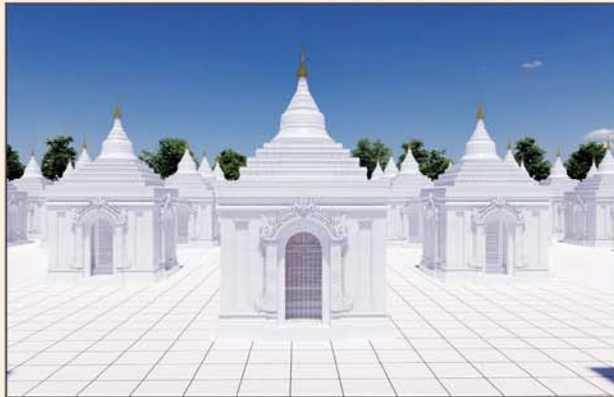
ကျောက်စာရုံစေတီ(၁၂ x ၁၂x ၁၈)ပေ ၁ ဆူ တန်ဖိုး- ၂၇၉ သိန်း