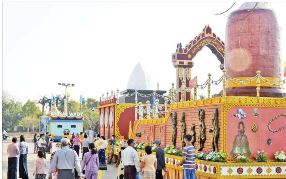
ပဲခူးတိုင်းဒေသကြီး ကိုယ်စားပြု ဂုဏ်ပြုယာဉ်များအား လာရောက်လေ့လာကြည့်ရှုကြသူများကို တွေ့ရစဉ်။