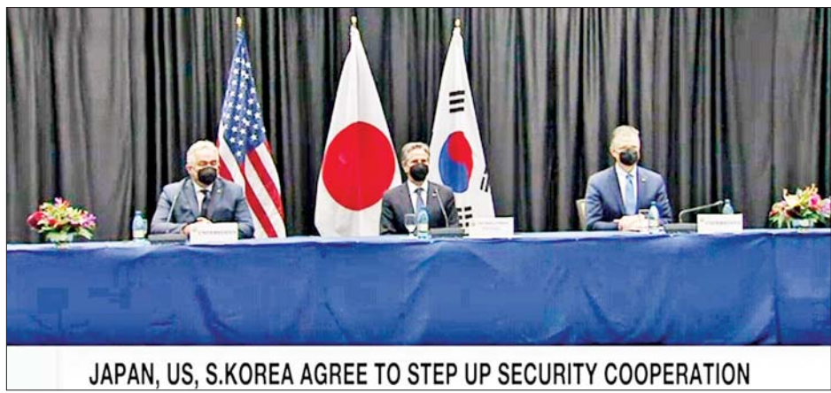
JAPAN, US, S.KOREA AGREE TO STEP UP SECURITY COOPERATION

ကိုးကား-အင်န်အိတ်ချ်ကေ ဘာသာပြန်-အလင်းသစ်