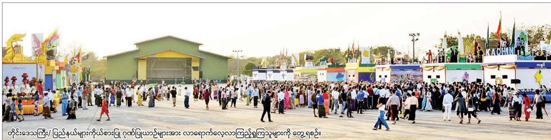
တိုင်းဒေသကြီး/ ပြည်နယ်များကိုယ်စားပြု ဂုဏ်ပြုယာဉ်များအား လာရောက်လေ့လာကြည့်ရှုကြသူများကို တွေ့ရစဉ်။