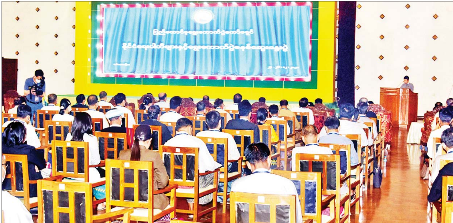
စစ်မှန်စည်းကမ်းပြည့်ဝသည့် ဒီမိုကရေစီပေါ်ထွန်းရေး ၂၀၂၁ ခုနှစ် ဒီဇင်ဘာလ ၂၄ ရက်နေ့က ပြည်ထောင်စုရွေးကောက်ပွဲကော်မရှင်နှင့် နိုင်ငံရေးပါတီများ ရွေးကောက်ပွဲစနစ်ဆိုင်ရာဆွေးနွေးပွဲ ကျင်းပစဉ်။

ဒီမိုကရေစီထွန်းကားဖို့ဆိုရင် နိုင်ငံတစ်နိုင်ငံဟာ ဒီမိုကရေစီအမှန်တကယ် ထွန်းကားနိုင်စေတဲ့ လမ်းကြောင်းမှန်ပေါ်မှာ လျှောက်လှမ်းနေဖို့ မဖြစ်မနေလိုအပ်ပါတယ်။ ဒီမိုကရေစီစံနှုန်းတွေကို ပုံမှန်ဖွံ့ဖြိုးရှင်သန်လာစေရေး အင်တိုက်အားတိုက် ပြုစုပျိုးထောင်နေဖို့ မဖြစ်မနေလိုအပ်ပါတယ်။ နိုင်ငံသားတွေနဲ့ နိုင်ငံရေးအဖွဲ့အစည်း (နိုင်ငံရေးပါတီ) တွေမှာ ဒီမိုကရေစီလေ့စရိုက် ပေါ်ထွန်းစေဖို့ သင်ယူလေ့ကျင့်နေရန် မဖြစ်မနေလိုအပ်ပါတယ်။ နိုင်ငံရေးဆိုင်ရာ အင်စတီကျူးရှင်းတွေကို ဒီမိုကရေစီနဲ့ စပ်အပ်လျော်ညီပြီး ခိုင်မာတောင့်တင်းတဲ့ အင်စတီကျူးရှင်းတွေအဖြစ် တည်ဆောက်ဖို့ မဖြစ်မနေလိုအပ်ပါတယ်။ မြန်မာနိုင်ငံကို ဒီမိုကရေစီစနစ်ထွန်းကားပြီး တိုးတက်သာယာပြောတဲ့ ငြိမ်းချမ်းတဲ့ နိုင်ငံတစ်နိုင်ငံအဖြစ် မြင်လိုတွေ့လိုကြောင်း တွင်တွင်အော်နေကြတဲ့ နိုင်ငံတချို့ဟာ အမှန်စင်စစ်မှာတော့ မြန်မာနိုင်ငံကောင်းစားမှာကို လုံးဝမလိုလားကြောင်း အထင်အရှားတွေ့မြင်နိုင်တဲ့ အထောက်အထားတွေ မြောက်မြားစွာရှိနေပြီဆိုတာ တွေ့မြင်လာရပါတယ်။ အထူးသဖြင့် လစ်ဘရယ်ဒီမိုကရေစီစနစ်တစ်ခုတည်းကိုမှ ကောင်းတဲ့နိုင်ငံရေးစနစ်ပါလို့ ဟစ်ကြွေးကြော်ပြီးတော့ တစ်ကမ္ဘာလုံးမှာ လစ်ဘရယ်ဝါဒတစ်ခုတည်းသာ လွှမ်းမိုးစေလိုတယ်ဆိုတဲ့ အနောက်နိုင်ငံကြီးတွေရဲ့ စိတ်စေတနာကို အခုအချိန်အခါမှာ မျက်ဝါးထင်ထင်တွေ့မြင်လာရပြီဖြစ်ပါတယ်။