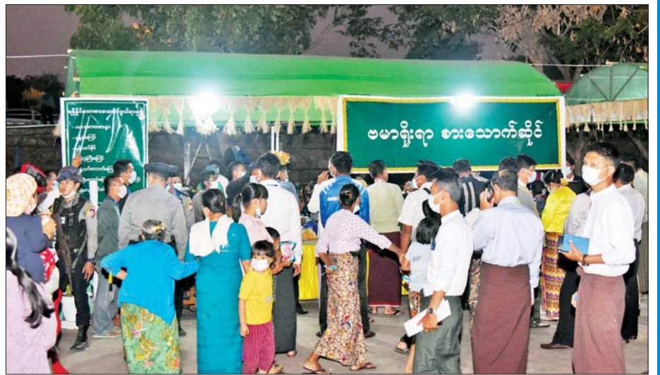
ဗမာရိုးရာစားသောက်ဆိုင်တွင် ဝယ်ယူအားပေးနေကြသူများကို တွေ့ရစဉ်။