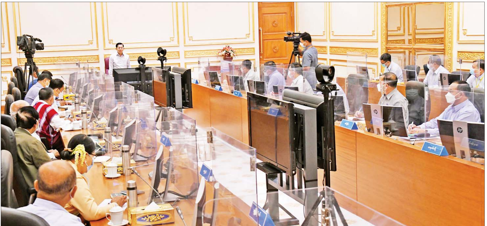
နိုင်ငံတော်စီမံအုပ်ချုပ်ရေးကောင်စီဥက္ကဋ္ဌ နိုင်ငံတော်ဝန်ကြီးချုပ် ဗိုလ်ချုပ်မှူးကြီးမင်းအောင်လှိုင် တိုင်းဒေသကြီးနှင့် ပြည်နယ်ဝန်ကြီးချုပ်များအား တွေ့ဆုံအမှာစကားပြောကြားစဉ်။