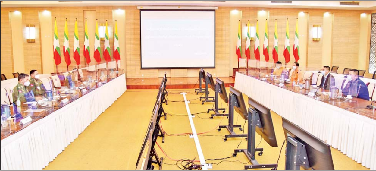
အမျိုးသားစည်းလုံးညီညွတ်ရေးနှင့် ငြိမ်းချမ်းရေးဖော်ဆောင်မှုညှိနှိုင်းရေးကော်မတီနှင့် တိုင်းရင်းသားလက်နက်ကိုင်အဖွဲ့အစည်းများမှ ကိုယ်စားလှယ်များ တွေ့ဆုံဆွေးနွေးစဉ်။

ကျော့ဖုံးမှ အဖွဲ့ဝင်များ၊ NCA လက်မှတ်ရေးထိုးထားသော တိုင်းရင်းသားလက်နက်ကိုင် အဖွဲ့အစည်းများ၊ NCA လက်မှတ်ရေးထိုးထားခြင်းမရှိသော တိုင်းရင်းသားလက်နက်ကိုင် အဖွဲ့အစည်းများ စုစုပေါင်းကိုးဖွဲ့မှ ဒုတိယဥက္ကဋ္ဌများ၊ အတွင်းရေးမှူးများ၊ ဗဟိုကော်မတီဝင်များနှင့် တာဝန်ရှိသူများ တက်ရောက်ကြသည်။