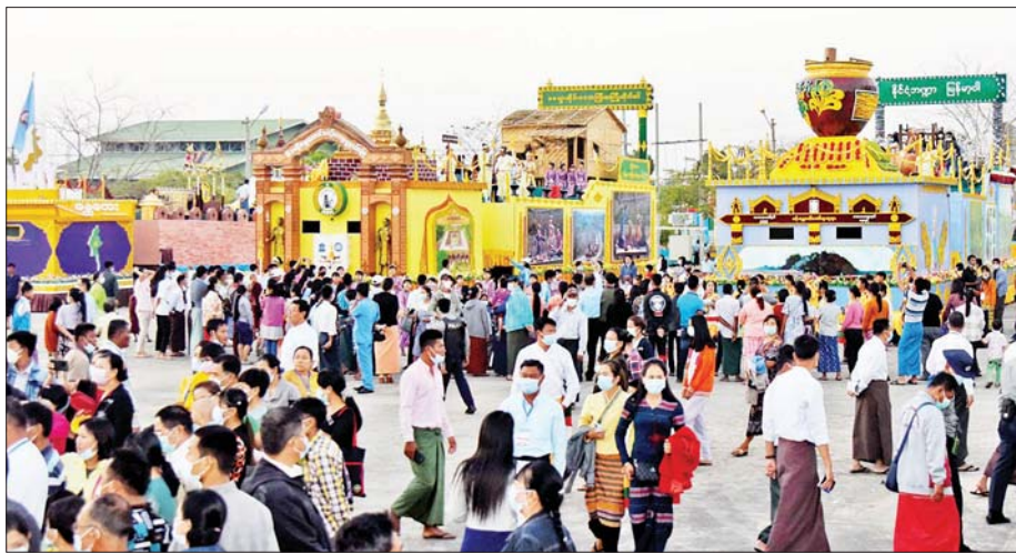
မကွေးတိုင်းဒေသကြီးကိုယ်စားပြု ဂုဏ်ပြုယာဉ်များအား လာရောက်လေ့လာကြည့်ရှုကြသူများကို တွေ့ရစဉ်။