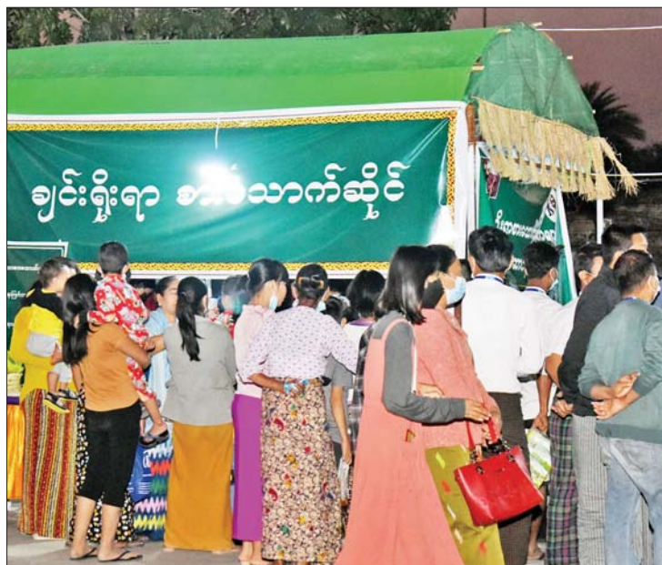
ချင်းရိုးရာစာပေသက်ဆိုင်တွင် ဝယ်ယူအားပေးနေသူကြည့်ရှုသူများကို တွေ့ရစဉ်။