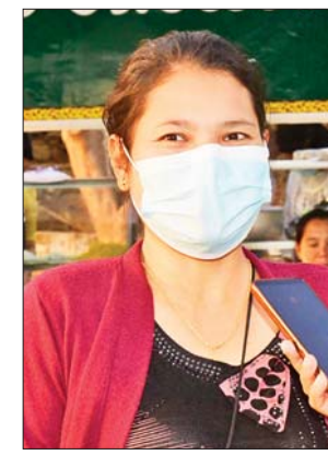
မချိုချိုလတ်