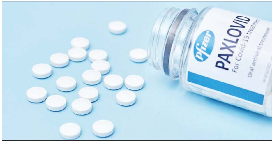
ပြီးခဲ့သည့် ရက်ပိုင်းအတွင်းက အတည်ပြုခဲ့ခြင်းဖြစ်ကြောင်း တရုတ်နိုင်ငံ၏ ဆေးဝါးအာဏာပိုင်အဖွဲ့က

တရုတ်နိုင်ငံသည် Pfizer မှ ထုတ်လုပ်သည့် Paxlovid အမည်ရှိ သောက်ဆေးအမျိုးအစား ကိုဗစ်-၁၉ ရောဂါ ကာကွယ်ဆေးတင်သွင်းမှုကို