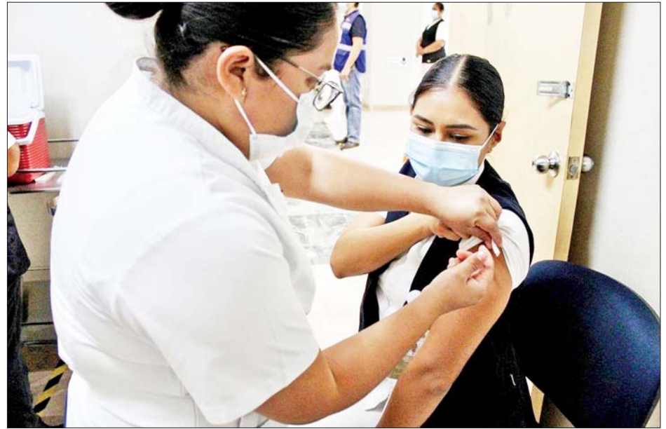
ကိုးကား - ဆင်ဟွာ ဘာသာပြန် - စိုးသူရ

အရ သိရသည်။ အမေရိကန်သမ္မတဟောင်း ထရမ်လက်ထက် အီရန်အား အရေးယူပိတ်ဆို့ ပြုလုပ်ခဲ့ပြီးနောက် အီရန်၏ ပြည်ပရေနံတင်ပို့မှုများ ကျဆင်းခဲ့ပြီး ၎င်းကာလမတိုင်မီ အီရန်သည် တစ်နေ့လျှင် ရေနံစည် နှစ်ဘီလီယံခန့် ပြည်ပသို့တင်ပို့ခဲ့သည်။ လက်ရှိကျင်းပလျက်ရှိသော နျူကလီးယားဆွေးနွေးပွဲ၌ အီရန်အပေါ် ချမှတ်ထားသော အရေးယူပိတ်ဆို့မှုများရုပ်သိမ်းရေးနှင့် ၂၀၁၅ နျူကလီးယား သဘောတူညီချက် ပြန်လည်အသက်ဝင်လာစေရေးအတွက် တာဝန်ရှိသူများအကြား ညှိနှိုင်းဆွေးနွေးလျက်ရှိကြောင်း သိရသည်။