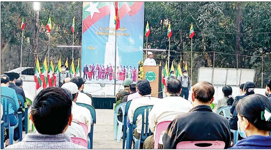
ဝန်ကြီးချုပ် ဗိုလ်ချုပ်မှူးကြီးမင်းအောင်လှိုင်ထံမှ ၂၀၂၂ ခုနှစ် (၇၅)နှစ်မြောက် စိန်ရတုပြည်ထောင်စုနေ့ အခမ်းအနားသို့ပေးပို့သော သဝဏ်လွှာကို မြို့နယ်

ထို့နောက် တက်ရောက်လာကြသူများက ဂုဏ်ပြုတပ်ဖွဲ့နှင့်အတူ ပြည်ထောင်စုသမ္မတ မြန်မာနိုင်ငံတော်အလံအား အလေးပြုခဲ့ကြပြီး နိုင်ငံတော်စီမံအုပ်ချုပ်ရေးကောင်စီဥက္ကဋ္ဌ နိုင်ငံတော်