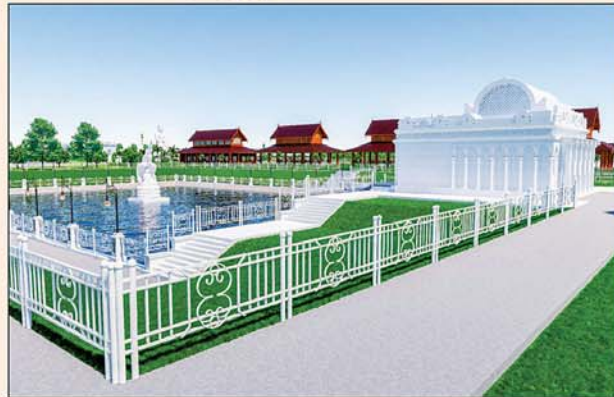
မုစလိန္နုစိုဉ်

၁။ နိုင်ငံတော်စီမံအုပ်ချုပ်ရေးကောင်စီဥက္ကဋ္ဌ၊ တပ်မတော်ကာကွယ်ရေးဦးစီးချုပ် ဗိုလ်ချုပ်မှူးကြီးမင်းအောင်လှိုင် ဦးဆောင်သည့် (၇)ရက်သား၊ သမီး၊ ဘုရားဒါယကာ၊ ဒါယိကာမတို့က မာရဝိဇယပုဒ္ဓရုပ်ပွားတော်မြတ်ကြီးအား မြန်မာနိုင်ငံတွင် ထေရဝါဒပုဒ္ဓသာသနာတော်ထွန်းလင်းတောက်ပလျက်ရှိသည်ကို ကမ္ဘာကိုပြသရန်၊ တိုင်းပြည်အေးချမ်းသာယာမှုရှိစေရန်၊ ရုပ်ပွားတော်မြတ်ကြီးအား ပြည်တွင်း၊ ပြည်ပဘုရားဖူးများလာရောက်ခြင်းဖြင့် ဒေသတိုးတက်စည်ကားမှုကို အထောက်အကူဖြစ်စေရန်၊ နိုင်ငံတော်ဖွံ့ဖြိုးတိုးတက်မှုအား အထောက်အကူဖြစ်စေရန် ရည်သန်လျက် ပြည်ထောင်စုနယ်မြေ နေပြည်တော်၊ ဒက္ခိဏသီရိမြို့နယ်အတွင်း၌ သာသနာတော်ထုံး၊ ရုပ်ပွားဆင်းတုတော်ထုံး၊ မြန်မာ့ရိုးရာတည်ထုံးများနှင့်အညီ တည်ဆောက်ပူဇော်လျက် ရှိပါသည်။