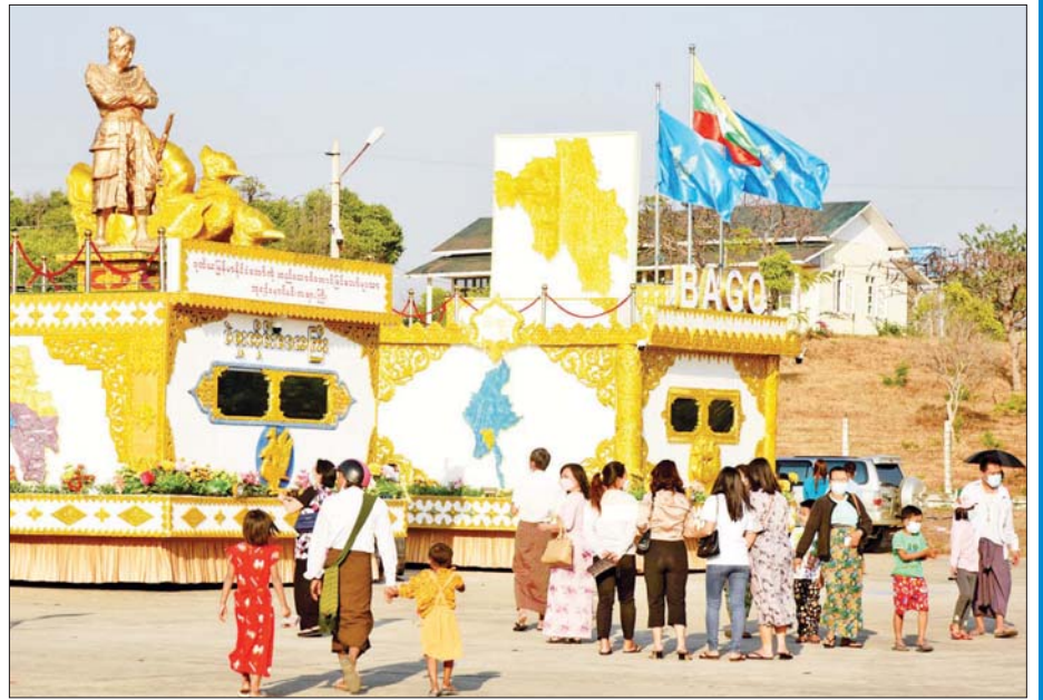
ပဲခူးတိုင်းဒေသကြီးကိုယ်စားပြု ဂုဏ်ပြုယာဉ်များအား လာရောက်လေ့လာကြည့်ရှုကြသူများကို တွေ့ရစဉ်။