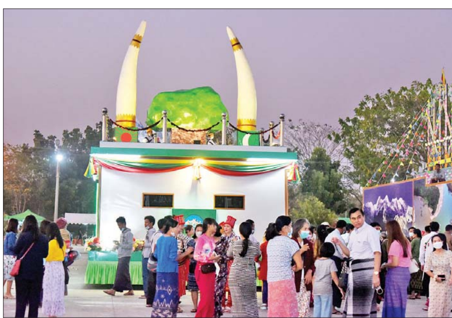
ကချင်ပြည်နယ်ကိုယ်စားပြု ဂုဏ်ပြုယာဉ်များအား လာရောက်လေ့လာကြည့်ရှုကြသူများကို တွေ့ရစဉ်။

ဒီလိုပွဲမျိုးကိုလာရောက်ကြည့်ရှုခွင့်ရတဲ့အတွက် ဝမ်းသာပီတိဖြစ်မိပါတယ်။ တိုင်းရင်းသားပေါင်းစုံရဲ့ အထိမ်းအမှတ်တွေနဲ့ အထင်ကရနေရာတွေကို ကြည့်ခွင့်ရတဲ့အတွက် ကလေးတွေအတွက်လည်း ဗဟုသုတတွေရပါတယ်။ ဒီလိုပြည်နယ်နဲ့ တိုင်းဒေသ ကြီးတွေရဲ့ အထင်ကရနေရာတွေကို တစု တစည်းတည်းတွေ့ရတာ ပထမဆုံးအကြိမ်ဖြစ်ပါ တယ်။ တိုင်းရင်းသားအစားအစာတွေနဲ့ အထိမ်း အမှတ်တွေကို အခုလို တွဲဖက်မြင်ရတော့ အဲဒီ ပြည်နယ်တွေကိုရောက်သွားသလိုခံစားရပါတယ်။ နောင်နှစ်တွေမှာလည်း ဒီလိုမြင်ကွင်းမျိုးတွေ တွေ့ချင်ပါသေးတယ်။ စာမျက်နှာ ၇ သို့ ○