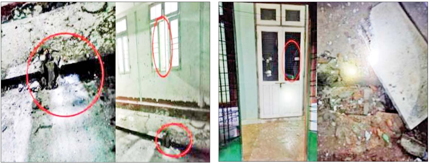
ဒီမိုကရေစီအရေခံ့ ဆူပူအကြမ်းဖက်သောင်းကျန်းသူများက ဒီမိုကရေစီရေးဟုဆိုကာ နိုင်ငံပိုင်ဘဏ်များကို မီးရှို့/ဖောက်ခွဲဖျက်ဆီးမှုများ ပြုလုပ်စဉ်။

နိုင်ငံတစ်နိုင်ငံဟာ သူ့အခြေခံ ဥပဒေနဲ့ သူ့နိုင်ငံရေးလည်ပတ်ရပါတယ်။ ဒီမိုကရေစီထွန်းကားပြီးသား ရင့်ကျက် ပြီးသား နိုင်ငံတွေအနေနဲ့ ဒါကိုမသိမရှိ သိကြပါတယ်။ မြန်မာနိုင်ငံဟာ မြန်မာ နိုင်ငံရဲ့ ဖွဲ့စည်းပုံအခြေခံဥပဒေနဲ့ သွားနေတာဖြစ်ပါတယ်။ ဒီမိုကရေစီကို အလွဲသုံးစားလုပ်ပြီးတော့ အာဏာကို ရယူဖို့ကြိုးစားရင် ဘယ်လိုအရေးယူ ဆောင်ရွက်ရမယ်ဆိုတာကို အဲဒီအခြေခံ ဥပဒေမှာ အတိအကျပြဋ္ဌာန်းထားပါ တယ်။ ရွေးကောက်ပွဲဝင်တဲ့ နိုင်ငံရေး ပါတီတိုင်း၊ နိုင်ငံရေးသမားတိုင်းဟာ ဒီအခြေခံဥပဒေမှာ ပြဋ္ဌာန်းထားတဲ့ ပဋိညာဉ်ကို လိုက်နာပြီးသားဖြစ်ရပါ မယ်။ ဒီအခြေခံဥပဒေကို အာဏာရယူ ရေးအတွက် ချိုးဖောက်ပြီးတော့ မဲဆန္ဒရှင် နိုင်ငံသားတွေရဲ့ အခွင့်အရေးတွေကို အလွဲသုံးစားပြုခြင်းဟာ ဒီမိုကရေစီ စံချိန်စံညွှန်းတွေကို ပြောင်ကျကျ ချိုးဖောက်ခြင်းသာ ဖြစ်ပါတယ်။ ဒါကို ဒီမိုကရေစီထွန်းကားပါတယ်ဆိုတဲ့ နိုင်ငံ တချို့၊ မြန်မာနိုင်ငံမှာ ဒီမိုကရေစီ အမှန်တကယ် ဖြစ်ထွန်းစေလိုပါတယ် ဆိုတဲ့ နိုင်ငံတချို့က မသိကျိုးကျွန်ပြု ရုံမကဘဲနဲ့ အဲဒီလိုဥပဒေချိုးဖောက်သူ တွေကို အားပေးအားမြှောက်ပြုပြီးတော့ နိုင်ငံရေး၊ စီးပွားရေး၊ လူမှုရေး အစစ