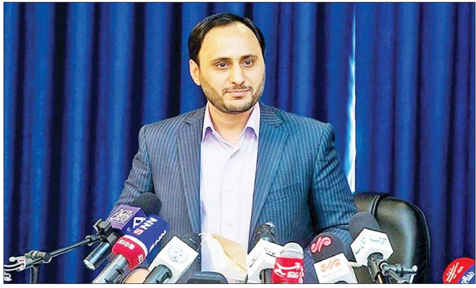
ကိုးကား - ဆင်ဟွာ၊ ဘာသာပြန် - အလင်းသစ်

ထို့ပြင် ရုရှားနိုင်ငံ၌ လွန်ခဲ့သည့်တစ်ရက်အတွင်း ကိုဗစ်-၁၉ ရောဂါမှ ပြန်လည်ကျန်းမာလာသဖြင့် ဆေးရုံအသီးသီးမှ ဆင်းခွင့်ရရှိသူ ၁၀၅၆၈ ဦးရှိခြင်းကြောင့် ရောဂါမှ ပြန်လည်ကျန်းမာလာသူပေါင်း ၁၁၂၅၈၅၉ ဦးရှိလာကြောင်း သိရသည်။ ရုရှားနိုင်ငံ၌ မြို့တော်မော်စကိုသည် ကိုဗစ်-၁၉ ရောဂါကူးစက်မှုအများဆုံးဖြစ်ပွားသည့် ဒေသဖြစ်ပြီး လွန်ခဲ့သည့် တစ်ရက်အတွင်း ကိုဗစ်-၁၉ ရောဂါ ကူးစက်ခံရသူ ၁၂၄၉၆ ဦးထပ်မံတွေ့ရှိခြင်းကြောင့် ယင်းအရေအတွက်သည် ရောဂါကူးစက်ခံရသူပေါင်း ၁၁၂၅၈၅၉ ဦးရှိလာကြောင်း သိရသည်။