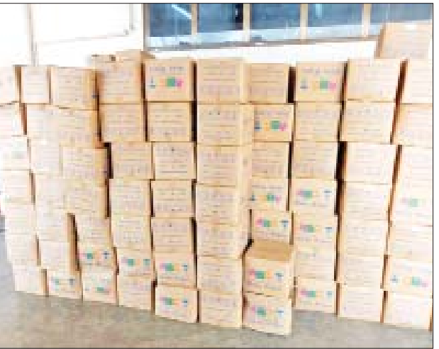
ရမိခဲ့ပြီး ပို့ကုန်၊ သွင်းကုန်ဥပဒေဖြင့် အရေးယူဆောင်ရွက်လျက်ရှိသည်။

ထို့အပြင် စစ်ကိုင်းတိုင်းဒေသကြီး တရားမဝင်ကုန်သွယ်မှု တိုက်ဖျက်ရေးအထူးအဖွဲ့၏ စီမံခန့်ခွဲမှုဖြင့် ပူးပေါင်းစစ်ဆေးရေးအဖွဲ့က ဧရာဝတီခရိုင်စစ်ဆေးရေးဌာန ရွှေဘိုမြို့တွင် ISUZU အမျိုးအစား လိုင်စင်မဲ့ မော်တော်ယာဉ်တစ်စီး (ခန့်မှန်းတန်ဖိုးငွေကျပ် ၆၀၀၀၀၀)ကို ဖမ်းဆီး