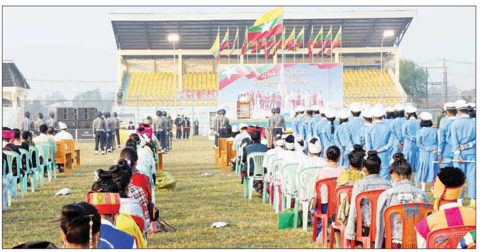
(၇၅) နှစ်မြောက် စိန်ရတုပြည်ထောင်စုနေ့ နိုင်ငံတော်အလံအလေးပြုခြင်းနှင့် သဝဏ်လွှာဖတ်ကြားခြင်းအခမ်းအနားကို စစ်တွေမြို့ ဝေသာလီအားကစားကွင်း၌ ဖေဖော်ဝါရီ ၁၂ ရက် နံနက်ပိုင်းက ကျင်းပစဉ်။ တင်ထွန်း(ပြန်/ဆက်)