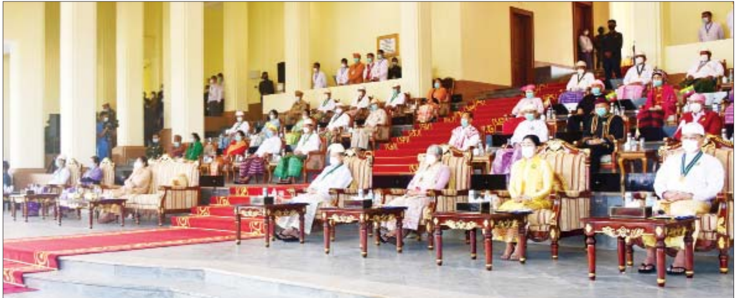
(၇၅)နှစ်မြောက် စိန်ရတုပြည်ထောင်စုနေ့ ဂုဏ်ပြုအခမ်းအနားသို့ တက်ရောက်ကြသူများကို တွေ့ရစဉ်။

ဝန်ကြီးဌာန အလံတော်အဖွဲ့၊ ကျန်းမာရေး ကိုယ်စားပြုတပ်ခွဲ၊ အ.ထ.က(၁) ဝန်ကြီးဌာန ကိုယ်စားပြုတပ်ခွဲ၊ သိပ္ပံနှင့် ကျောင်းသား ကျောင်းသူများ၏ ဘင်ခရာ နည်းပညာဝန်ကြီးဌာန ကိုယ်စားပြုတပ်ခွဲ၊ အားကစားနှင့်လူငယ်ရေးရာဝန်ကြီးဌာန အလံတော်အဖွဲ့၊ ဆောက်လုပ်ရေးဝန်ကြီးဌာန ကိုယ်စားပြုတပ်ခွဲ၊ လူမှုဝန်ထမ်း၊ ကယ်ဆယ်ရေးနှင့် ပြန်လည်နေရာချထားရေးဝန်ကြီးဌာန ကိုယ်စားပြုတပ်ခွဲ၊ ဟိုတယ်နှင့် ခရီးသွားလာရေးဝန်ကြီးဌာန ကိုယ်စားပြုတပ်ခွဲ၊ တိုင်းရင်းသားလူမျိုးများရေးရာဝန်ကြီးဌာန ကိုယ်စားပြုတပ်ခွဲ၊ နိုင်ငံတော်ဗဟိုစစ်တီးဝိုင်းတို့က ချီတက် အလေးပြုကြသည်။ စာမျက်နှာ ၈ သို့ ★