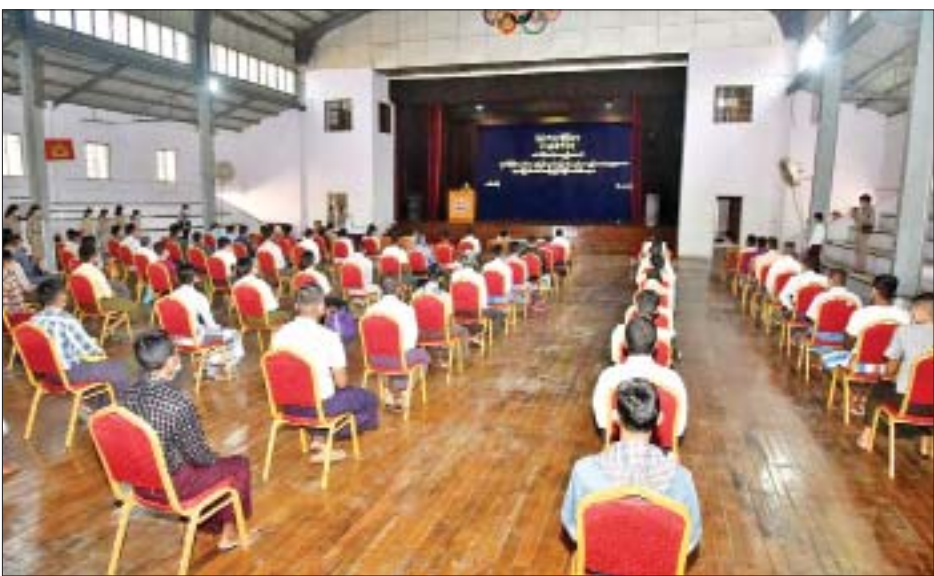
ထမ်းများနှင့် လွတ်မြောက်ခဲ့သည့် အကျဉ်းသား ပေးသော မော်တော်ယာဉ်များဖြင့် လိုက်ပါပို့ဆောင် အကျဉ်းသူများ တက်ရောက်ခဲ့ကြပြီး အကျဉ်းသား ပေးခဲ့သည်။ အကျဉ်းသူများကို သက်ဆိုင်ရာမြို့နယ်များအလိုက် ရန်ကုန်တိုင်းဒေသကြီးအစိုးရအဖွဲ့မှ စီစဉ်ဆောင်ရွက် သတင်းစဉ်

၈၂ ဦး၊ အကျဉ်းသူ ရှစ်ဦး စုစုပေါင်း ၉၀ နှင့် နိုင်ငံခြား သား(သိရိလင်္ကာနိုင်ငံသား) အကျဉ်းသားခုနစ်ဦး စုစုပေါင်း ၉၇ ဦးတို့အား ယနေ့တွင် လွတ်မြောက်သူ အကျဉ်းသား အကျဉ်းသူတစ်ဦးချင်းအား အကျဉ်း ထောင်မှတ်တမ်းနှင့် တိုက်ဆိုင်စစ်ဆေးကာ စနစ် တကျ လွှတ်ပေးခဲ့သည်။ ပို့ဆောင်ပေး အဆိုပါ နိုင်ငံတော်စီမံအုပ်ချုပ်ရေးကောင်စီ၏ ရာဇဝတ်ကျင့်ထုံးဥပဒေပုဒ်မ-၄၀၁၊ ပုဒ်မခွဲ(၁) တို့အရ ပြစ်ဒဏ်လွတ်ငြိမ်းခွင့်ဖြင့် လွတ်မြောက်သည့် အကျဉ်းသား အကျဉ်းသူ ၉၀ ကို လွှတ်ပေးပွဲ အခမ်းအနားကို အင်းစိန်ဗဟိုအကျဉ်းထောင် မိုးလုံလေလုံအားကစားရုံခန်းမ၌ ယနေ့နံနက် ၁၁ နာရီတွင် ကျင်းပခဲ့ရာ အခမ်းအနားသို့ ရန်ကုန်တိုင်း ဒေသကြီး လုံခြုံရေးနှင့် နယ်စပ်ရေးရာဝန်ကြီး ဗိုလ်မှူးကြီး ဝင်းတင့်၊ မြန်မာနိုင်ငံရဲတပ်ဖွဲ့ ရန်ကုန်တိုင်းဒေသကြီး ရဲတပ်ဖွဲ့မှူးရုံး ဒုတိယတိုင်း ရဲတပ်ဖွဲ့မှူး ရဲမှူးကြီးမျိုးကြည်၊ အကျဉ်းဦးစီးဌာနမှ တာဝန်ရှိသူများ၊ အကျဉ်းထောင် အရာထမ်း/အမှု