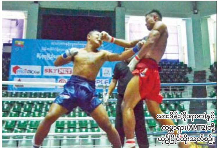
သာဒိန်း(ဖိုးရာဇာ)နှင့် ကမ္ဘာရှား(AMT2)တို့ ယှဉ်ပြိုင်ထိုးသတ်စဉ်။

အဆိုပါပြိုင်ပွဲသို့ ရန်ကုန်တိုင်း ဒေသကြီး အစိုးရအဖွဲ့လုံခြုံရေးနှင့် နယ်စပ် ရေးရာဝန်ကြီး ဗိုလ်မှူးကြီးဝင်းတင့်၊ တိုင်းဒေသကြီး အားကစားနှင့် ကာယ ပညာဦးစီးဌာနမှ ညွှန်ကြားရေးမှူးများ၊ မြန်မာနိုင်ငံရိုးရာလက်ဝှေ့အဖွဲ့ချုပ်ဥက္ကဋ္ဌ ဦးသိန်းအောင်နှင့် အမှုဆောင်များ၊ အားကစားသမားများ ကြည့်ရှုအားပေးကြ သည်။ ယင်းပြိုင်ပွဲကို ပရိသတ်မပါဘဲ ကျင်းပခဲ့ပြီး ကျန်းမာရေးဝန်ကြီးဌာနက ထုတ်ပြန်ထားသည့် ကိုဗစ်-၁၉ ရောဂါ စည်းကမ်းနဲ့အညီ ကျင်းပခဲ့ခြင်းဖြစ် သည်။