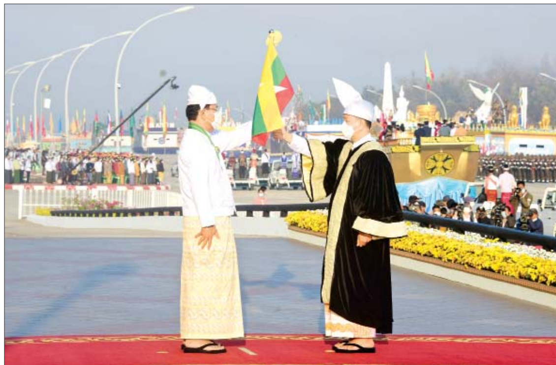
နေပြည်တော်ကောင်စီဥက္ကဋ္ဌ ဒေါက်တာမောင်မောင်နိုင် စိန်ရတုပြည်ထောင်စုနေ့ ဂုဏ်ပြုအခမ်းအနား ကျင်းပရေး ကော်မတီဥက္ကဋ္ဌ ပြန်ကြားရေးဝန်ကြီးဌာန ပြည်ထောင်စုဝန်ကြီး ဦးမောင်မောင်အုန်းထံ “ပြည်ထောင်စုအလံတော်”ကို လွှဲပြောင်း ပေးအပ်စဉ်။