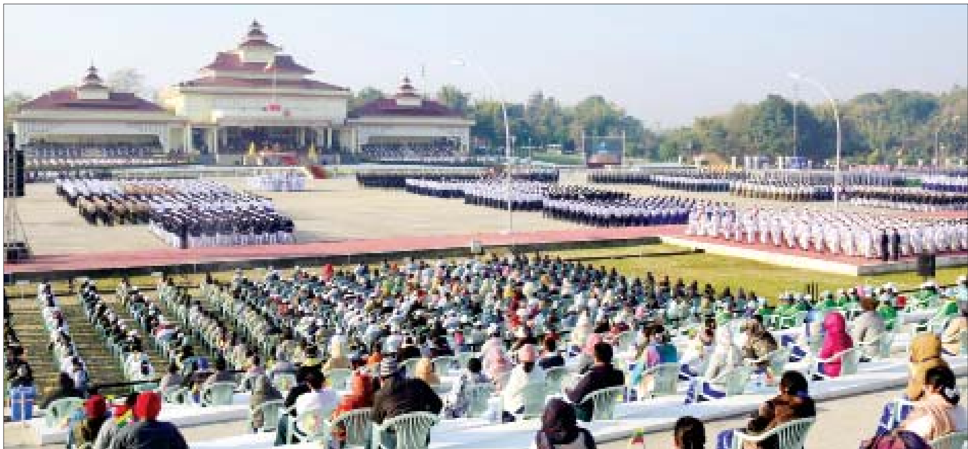
(၇၅)နှစ်မြောက် စိန်ရတုပြည်ထောင်စုနေ့ ဂုဏ်ပြုအခမ်းအနား ကျင်းပစဉ်။