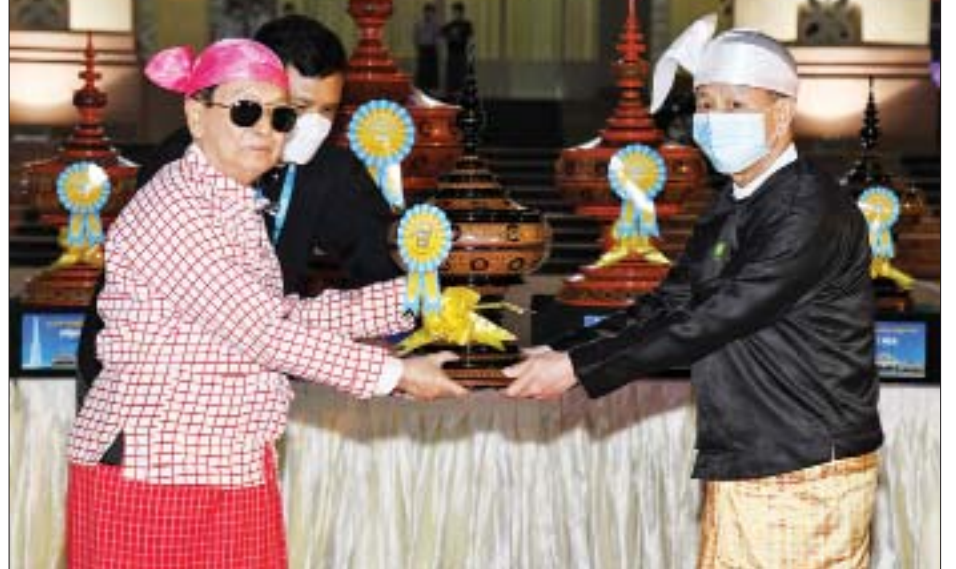
နိုင်ငံတော်စီမံအုပ်ချုပ်ရေးကောင်စီဝင် ဒေါက်တာဗညားအောင်မိုး ပြည်ထောင်စုနယ်မြေ ဂုဏ်ပြုယာဉ် အတွက် အထူးဆု ပေးအပ်ချီးမြှင့်စဉ်။