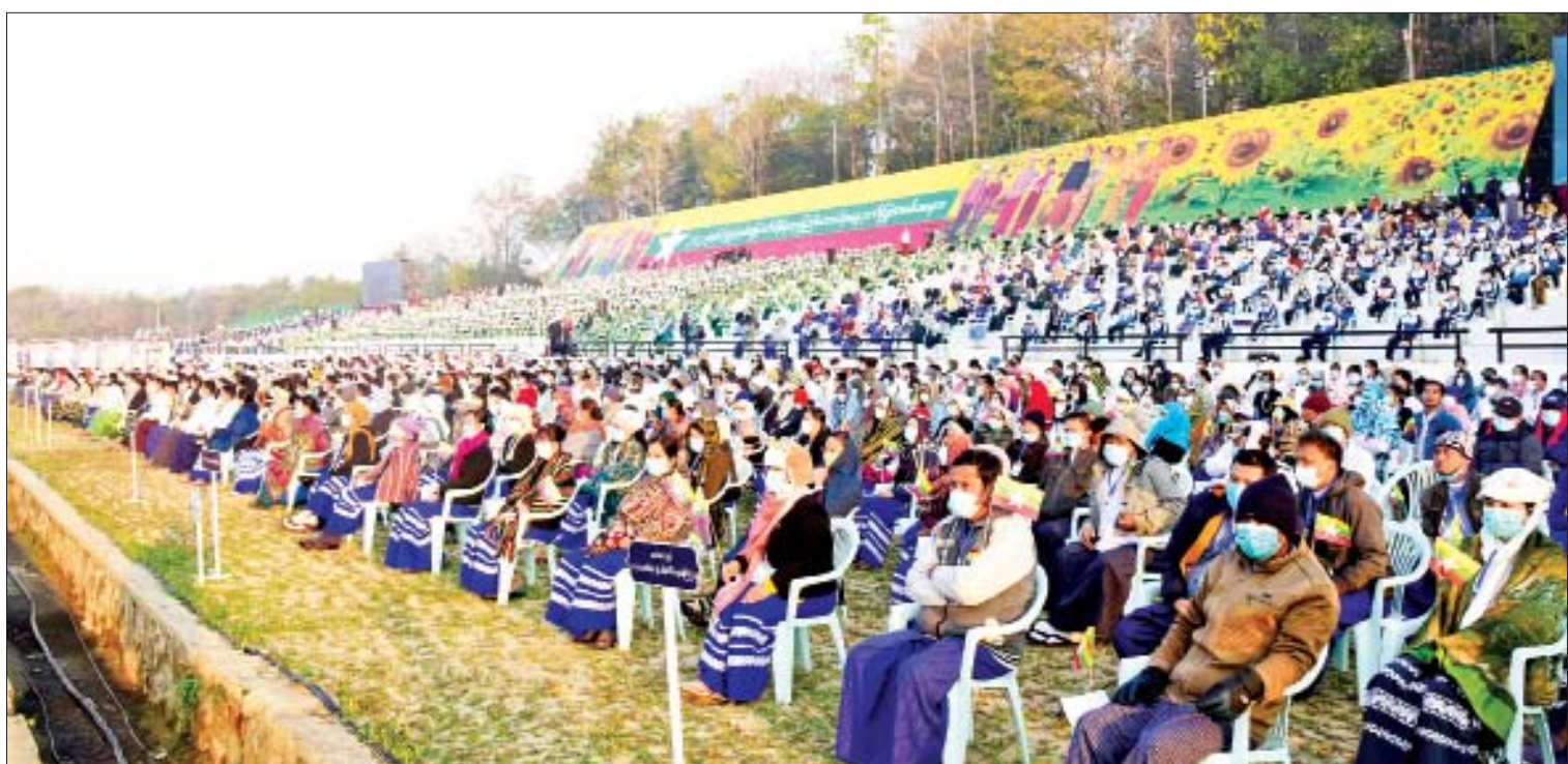
(၇၅)နှစ်မြောက် စိန်ရတုပြည်ထောင်စုနေ့ ဂုဏ်ပြုအခမ်းအနား တက်ရောက်လာသူများကို တွေ့ရစဉ်။

၍ ဂုဏ်ပြုပျံသန်းအလေးပြုသည်။ ဂုဏ်ပြု ဖျော်ဖြေနေစဉ်အတွင်း နေပြည်တော်ကောင်စီနယ်မြေ ဇေယျသီရိ မြို့နယ်နှင့် ပျဉ်းမနားမြို့နယ်တို့ရှိ အခြေခံ ပညာကျောင်းများမှ ကျောင်းသား ကျောင်းသူ ၁၁၀၀ တို့က ပြည်ထောင်စု နယ်မြေနှင့် တိုင်းဒေသကြီး၊ ပြည်နယ် အမည်စာလုံးများကို ညီညာလှပစွာ ပုံဖော်ပြသကြသည်။ အခမ်းအနားအပြီးတွင် နိုင်ငံတော်စီမံ အုပ်ချုပ်ရေးကောင်စီဥက္ကဋ္ဌ နိုင်ငံတော် ဝန်ကြီးချုပ်သည် တက်ရောက်လာကြသူ များအား လက်ပြနုတ်ဆက်၍ (၇၅)နှစ် မြောက် စိန်ရတုပြည်ထောင်စုနေ့ ဂုဏ်ပြု အခမ်းအနား ကျင်းပရာ ဥပစာရင်ပြင်မှ ပြန်လည်ထွက်ခွာသည်။ ထို့နောက် နိုင်ငံတော်စီမံအုပ်ချုပ်ရေး ကောင်စီဥက္ကဋ္ဌ နိုင်ငံတော်ဝန်ကြီးချုပ်နှင့် ဇနီးတို့သည် တိုင်းဒေသကြီးနှင့် ပြည်နယ်များအလိုက် ကိုယ်စားပြု ဂုဏ်ပြု ယာဉ်များနှင့် ဂုဏ်ပြုအကအဖွဲ့များအား ရင်းရင်းနှီးနှီး လက်ပြနုတ်ဆက်ခဲ့ကြောင်း သိရသည်။ သတင်းစဉ်