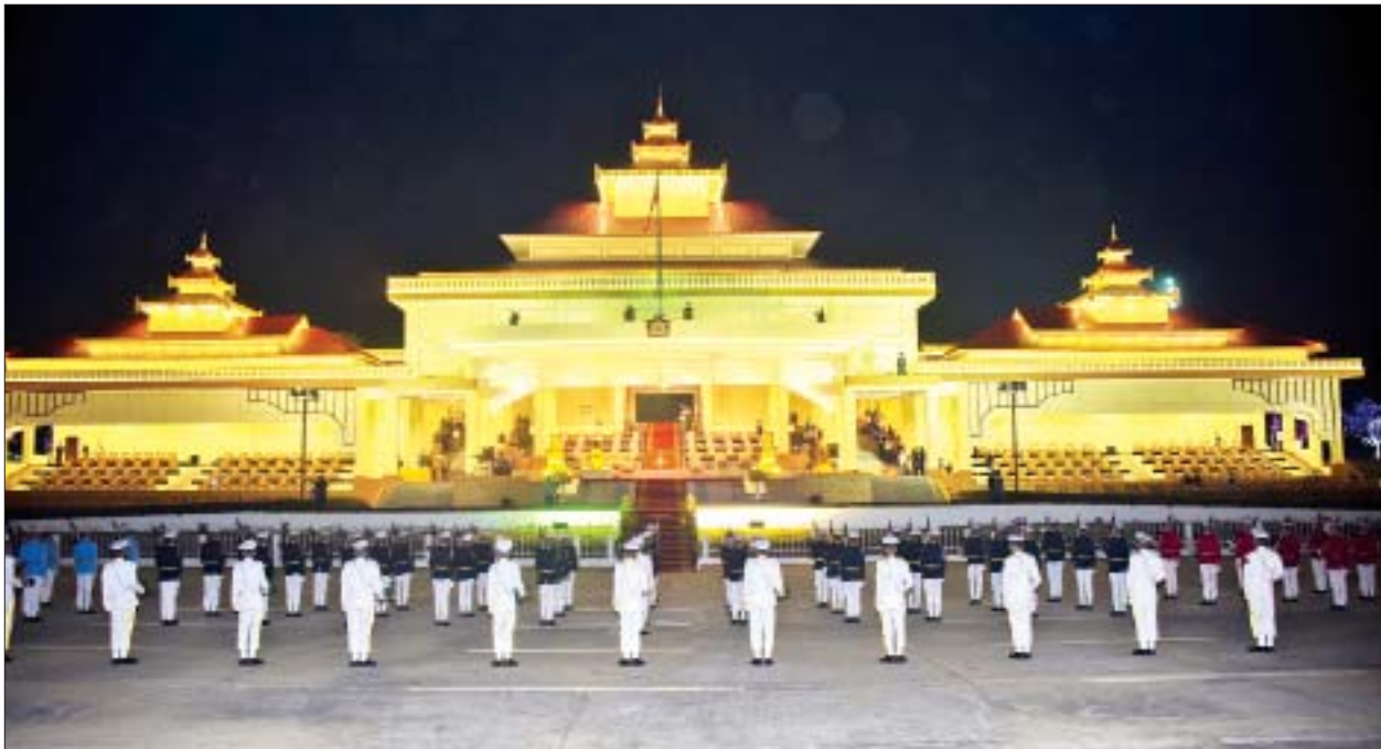
ဂုဏ်ပြုတပ်ဖွဲ့က ပြည်ထောင်စုသမ္မတမြန်မာနိုင်ငံတော်အလံကို လွှင့်တင်ပြီး တိုင်းရင်းသား တိုင်းရင်းသူများက ဂုဏ်ပြုတပ်ဖွဲ့နှင့်အတူ နိုင်ငံတော်အလံကို အလေးပြုကြသည်။ သတင်းစဉ်

ရှေးဦးစွာ နံနက် ၅ နာရီ မိနစ် ၂၀ တွင် ၂၀၂၂ ခုနှစ် (၇၅)နှစ်မြောက် စိန်ရတုပြည်ထောင်စုနေ့ နိုင်ငံတော်အလံတင်အခမ်းအနားကို ကျင်းပရာ