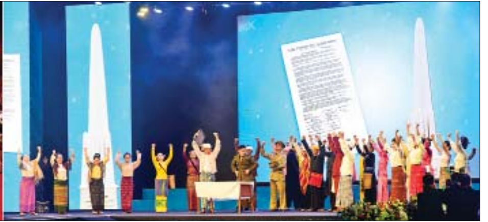
နိုင်ငံတော်စီမံအုပ်ချုပ်ရေးကောင်စီဥက္ကဋ္ဌ နိုင်ငံတော်ဝန်ကြီးချုပ် ဗိုလ်ချုပ်မှူးကြီး မဟာသရေစည်သူ မင်းအောင်လှိုင်နှင့်ဇနီး ဒေါ်ကြူကြူလှ၊ ညစာစားပွဲသို့ တက်ရောက်လာကြသည့် ဧည့်သည်တော်များ မြို့တော်ခန်းမ လဟာပြင်ဇာတ်ရုံ၌ တိုင်းရင်းသားရိုးရာ အကပဒေသာများဖြင့် ဖျော်ဖြေတင်ဆက်မှုများကို ကြည့်ရှုအားပေးစဉ်။