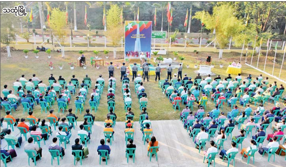
သထုံမြို့