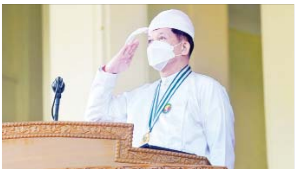
နိုင်ငံတော်စီမံအုပ်ချုပ်ရေးကောင်စီဥက္ကဋ္ဌ နိုင်ငံတော်ဝန်ကြီးချုပ် ဗိုလ်ချုပ်မှူးကြီး မဟာသရေစည်သူ မင်းအောင်လှိုင်အား ဂုဏ်ပြုစစ်ကြောင်းများက ချီတက်အလေးပြုကြစဉ်။

ဗိုလ်ချုပ်မှူးကြီး မဟာသရေစည်သူ မင်းအောင်လှိုင် ၏ဇနီး ဒေါ်ကြူကြူလှ၊ နိုင်ငံတော်စီမံအုပ်ချုပ်ရေး ကောင်စီ ဒုတိယဥက္ကဋ္ဌ ဒုတိယဝန်ကြီးချုပ် ဒုတိယ ဗိုလ်ချုပ်မှူးကြီး သရေစည်သူ စိုးဝင်းနှင့်ဇနီး ဒေါ်သန်းသန်းနွယ်၊ ကောင်စီအဖွဲ့ဝင်များဖြစ်ကြ သည့် ဗိုလ်ချုပ်ကြီးမြထွန်းဦး၊ ဗိုလ်ချုပ်ကြီး တင်အောင်စန်း၊ ဒုတိယဗိုလ်ချုပ်ကြီးမိုးမြင့်ထွန်း၊ မန်းငြိမ်းမောင်၊ ဦးသိန်းညွန့်၊ ဦးခင်မောင်ဆွေ၊ ဒေါ်အေးနုစိန်၊ Jeng Phang နော်တောင်၊ ဦးမောင်ဟာ စာမျက်နှာ ၆ ကော်လံ ၁ သို့ ☆