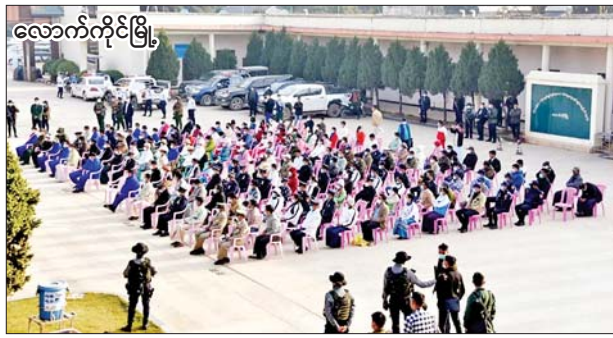
လောက်ကိုင်မြို့