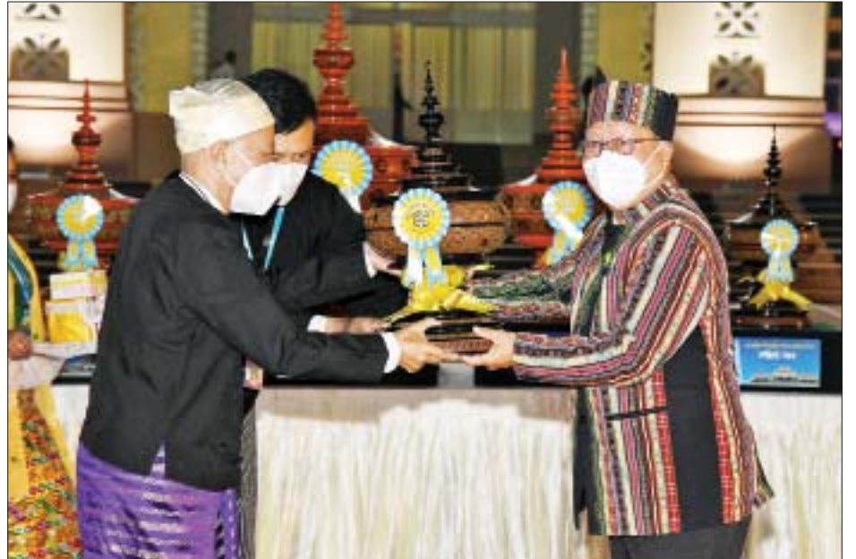
နိုင်ငံတော်စီမံအုပ်ချုပ်ရေးကောင်စီဝင် ဦးမောင်းဟာ ချင်းပြည်နယ် ဂုဏ်ပြုယာဉ်အတွက် အထူးဆု ပေးအပ်ချီးမြှင့်စဉ်။