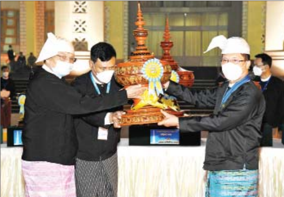
နိုင်ငံတော်စီမံအုပ်ချုပ်ရေးကောင်စီဝင် ဦးခင်မောင်ဆွေ ဂုဏ်ပြုယာဉ် တတိယဆုရရှိသည့် ဧရာဝတီ တိုင်းဒေသကြီးအတွက် ဂုဏ်ပြုဆုပေးအပ်ချီးမြှင့်စဉ်။