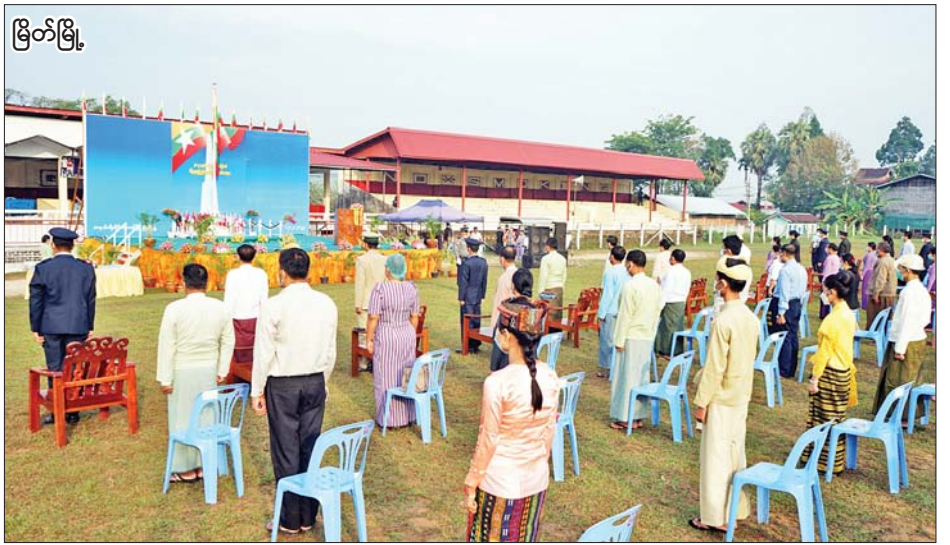
မြိတ်မြို့