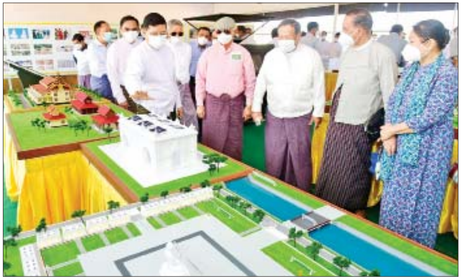
တပ်မတော်အငြိမ်းစားအရာရှိကြီးများ၊ တိုင်းဒေသကြီးနှင့် ပြည်နယ်ဝန်ကြီးချုပ်များနှင့် ၎င်းတို့၏ ဇနီးများ “မာရဝီဇယ”ဗုဒ္ဓရုပ်ပွားတော်မြတ်ကြီး တည်ထားကိုးကွယ်ရန် ဆောင်ရွက်နေမှုကို လေ့လာကြည့်ရှုကြစဉ်။

အလားတူ တပ်မတော်အငြိမ်းစားအရာရှိကြီးများ၊ တိုင်းဒေသကြီးနှင့် ပြည်နယ်ဝန်ကြီးချုပ်များနှင့် ၎င်းတို့၏ ဇနီးများသည်လည်း ဗုဒ္ဓရုပ်ပွားတော်မြတ်ကြီး တည်ထားကိုးကွယ်ရန် ဆောင်ရွက်နေမှု