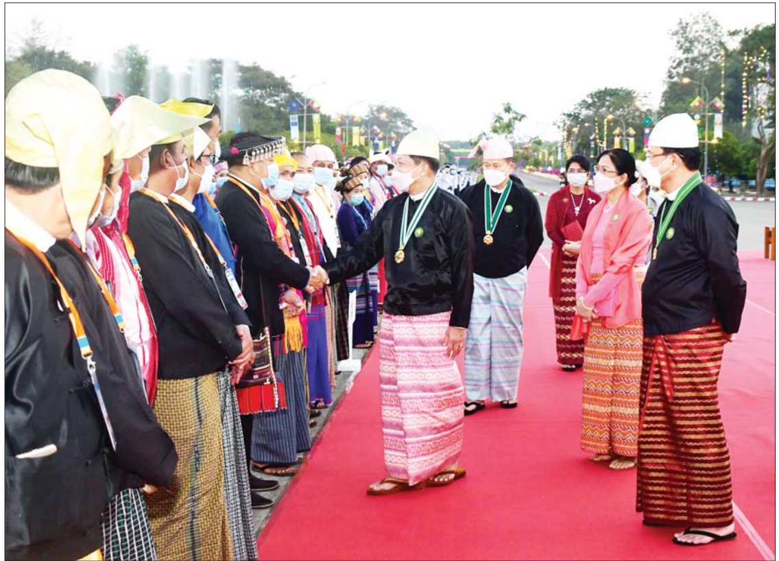
နိုင်ငံတော်စီမံအုပ်ချုပ်ရေးကောင်စီဥက္ကဋ္ဌ နိုင်ငံတော်ဝန်ကြီးချုပ် ဗိုလ်ချုပ်မှူးကြီး မဟာသရေစည်သူ မင်းအောင်လှိုင်နှင့် ဇနီး ဒေါ်ကြူကြူလှ၊ ဒုတိယဝန်ကြီးချုပ် ဒုတိယဗိုလ်ချုပ်မှူးကြီး သရေစည်သူစိုးဝင်းနှင့် ဇနီး ဒေါ်သန်းသန်းနွယ်တို့ ဂုဏ်ပြု ညစာစားပွဲသို့ တက်ရောက်လာကြသူများအား ရင်းရင်းနှီးနှီး လိုက်လံနှုတ်ဆက်စဉ်။

ဝန်ကြီးချုပ် ဦးတင်မောင်ဝင်းထံ လည်းကောင်း၊ နိုင်ငံတော်စီမံအုပ်ချုပ်ရေး ကောင်စီ ဒုတိယဥက္ကဋ္ဌ ဒုတိယဗိုလ်ချုပ် မှူးကြီး စိုးဝင်းက ဂုဏ်ပြုယာဉ် ဒုတိယဆု ရရှိသည့် ရှမ်းပြည်နယ်အတွက် ဂုဏ်ပြု ဆုနှင့် ဂုဏ်ပြုဆုငွေများကို ပြည်နယ် ဝန်ကြီးချုပ် ဒေါက်တာကျော်ထွန်းထံ လည်းကောင်း ပေးအပ်ချီးမြှင့်ကြသည်။