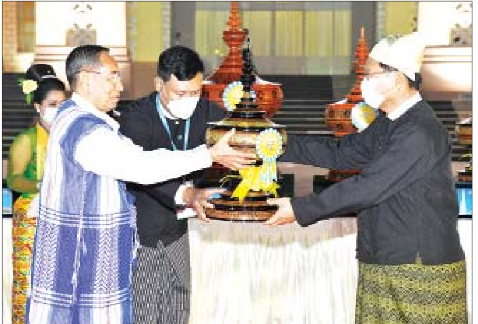
နိုင်ငံတော်စီမံအုပ်ချုပ်ရေးကောင်စီဝင် မန်းငြိမ်းမောင် ရခိုင်ပြည်နယ် ဂုဏ်ပြုယာဉ်အတွက် အထူးဆု ပေးအပ်ချီးမြှင့်စဉ်။