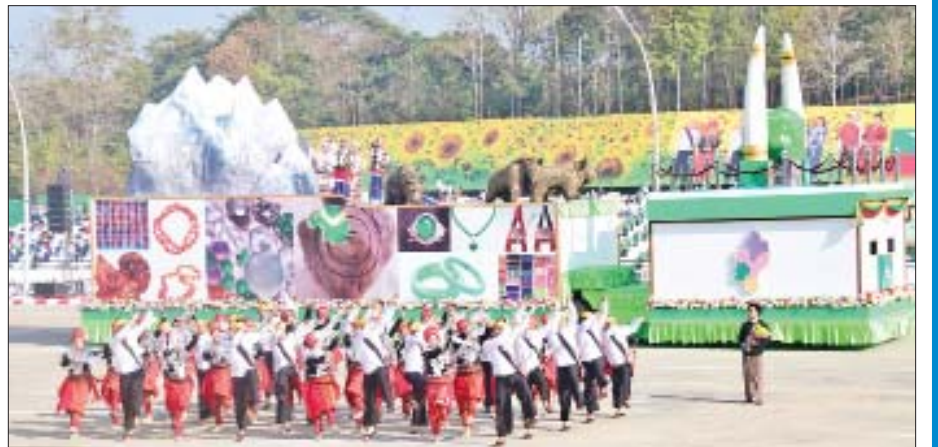
တိုင်းဒေသကြီးနှင့် ပြည်နယ်များအလိုက် ကိုယ်စားပြုဂုဏ်ပြုယာဉ်များနှင့် ဂုဏ်ပြုအကအဖွဲ့များကို တွေ့ရစဉ်။