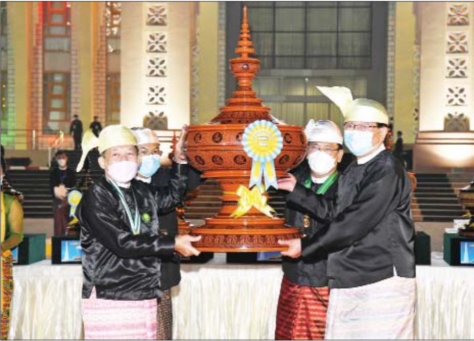
နိုင်ငံတော်စီမံအုပ်ချုပ်ရေးကောင်စီဥက္ကဋ္ဌ နိုင်ငံတော်ဝန်ကြီးချုပ် ဗိုလ်ချုပ်မှူးကြီး မဟာသရေစည်သူ မင်းအောင်လှိုင် ဂုဏ်ပြုယာဉ်ပထမဆုရရှိသည့် မကွေးတိုင်းဒေသကြီးအတွက် ဂုဏ်ပြုဆုပေးအပ်ချီးမြှင့်စဉ်။