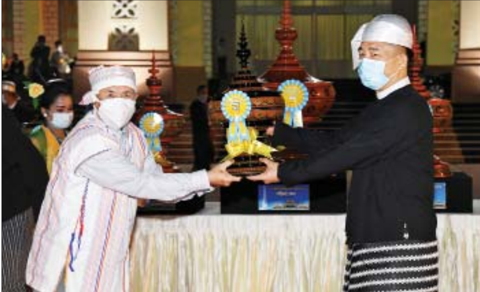
နိုင်ငံတော်စီမံအုပ်ချုပ်ရေးကောင်စီဝင် စောဒန်နီယယ် ကယားပြည်နယ် ဂုဏ်ပြုယာဉ်အတွက် အထူးဆု ပေးအပ်ချီးမြှင့်စဉ်။