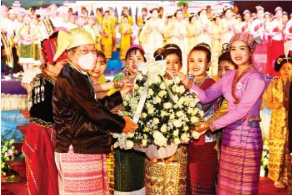
နိုင်ငံတော်စီမံအုပ်ချုပ်ရေးကောင်စီဥက္ကဋ္ဌ နိုင်ငံတော်ဝန်ကြီးချုပ် ဗိုလ်ချုပ်မှူးကြီး မဟာသရေစည်သူ မင်းအောင်လှိုင် (၇၅)နှစ်မြောက် စိန်ရတုပြည်ထောင်စုနေ့ အခမ်းအနားတွင် ကပြဖျော်ဖြေခဲ့ကြသည့် တိုင်းရင်းသားရိုးရာ ယဉ်ကျေးမှုအဖွဲ့ဝင်များကို ဂုဏ်ပြုပန်းခြင်းပေးအပ်စဉ်။