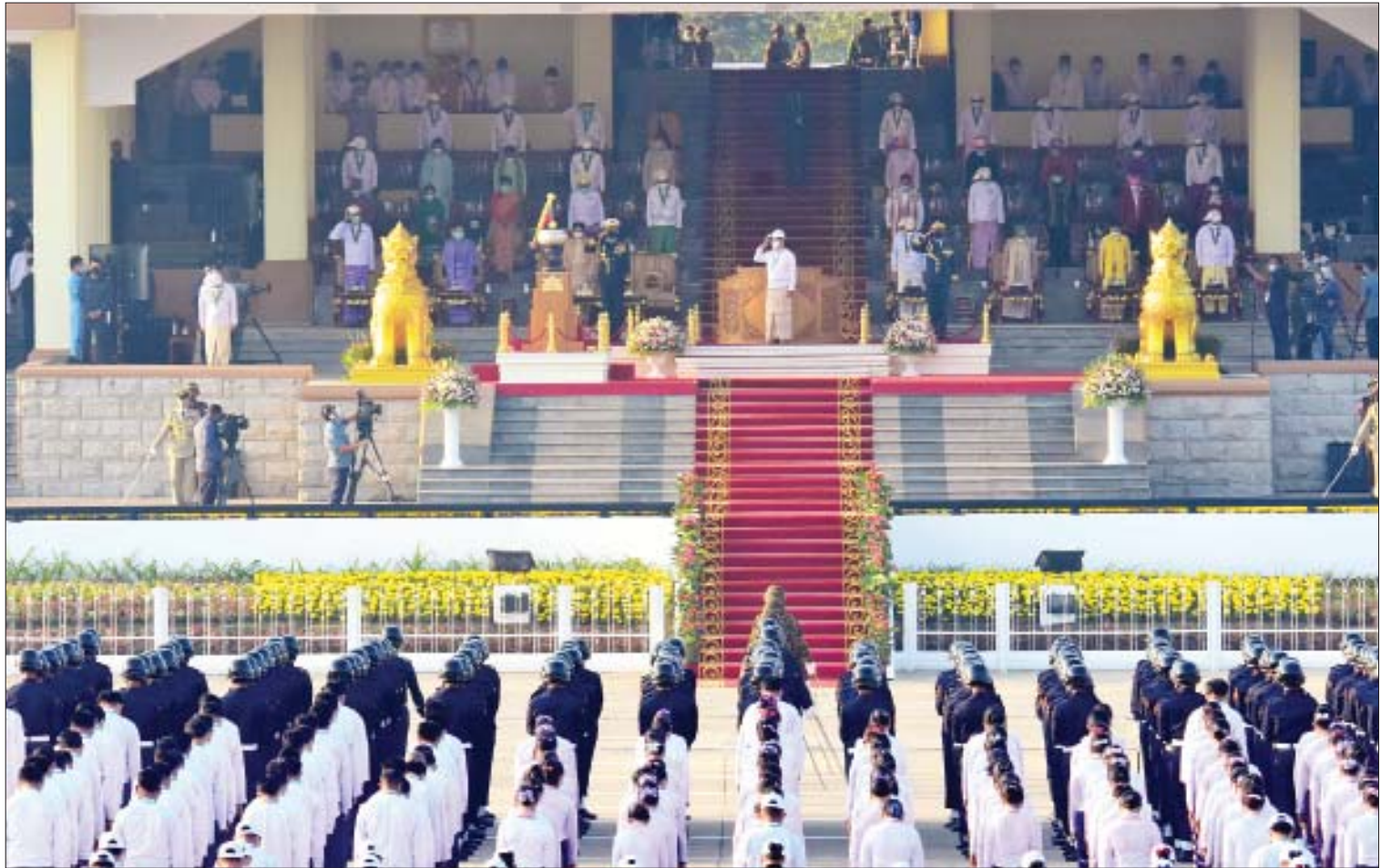
နိုင်ငံတော်စီမံအုပ်ချုပ်ရေးကောင်စီဥက္ကဋ္ဌ နိုင်ငံတော်ဝန်ကြီးချုပ် ဗိုလ်ချုပ်မှူးကြီး မဟာသရေစည်သူ မင်းအောင်လှိုင်နှင့် စစ်ကြောင်းတပ်ခွဲများ၊ အခမ်းအနားသို့ တက်ရောက်လာကြသူများက ပြည်ထောင်စုအလံတော်ကို အလေးပြုကြစဉ်။