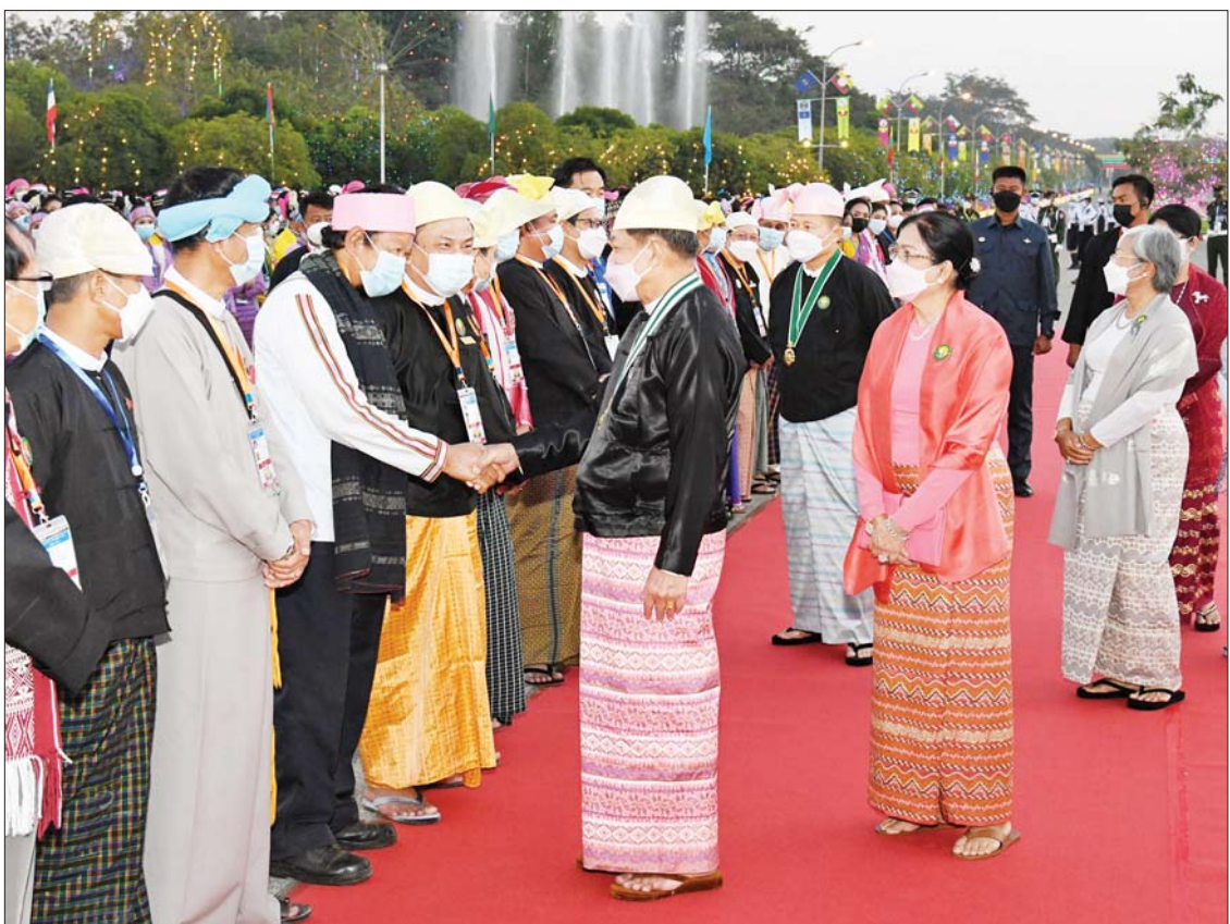
နိုင်ငံတော်စီမံအုပ်ချုပ်ရေးကောင်စီဥက္ကဋ္ဌ နိုင်ငံတော်ဝန်ကြီးချုပ် ဗိုလ်ချုပ်မှူးကြီး မဟာသရေစည်သူ မင်းအောင်လှိုင်နှင့် ဇနီး ဒေါ်ကြူကြူလှ၊ ဒုတိယဝန်ကြီးချုပ် ဒုတိယဗိုလ်ချုပ်မှူးကြီး သရေစည်သူစိုးဝင်းနှင့် ဇနီး ဒေါ်သန်းသန်းနွယ်တို့ ဂုဏ်ပြု ညစာစားပွဲသို့ တက်ရောက်လာကြသူများအား ရင်းရင်းနှီးနှီး လိုက်လံနှုတ်ဆက်စဉ်။

ပေးအပ်ချီးမြှင့် ထို့နောက် ၂၀၂၂ ခုနှစ် (၇၅)နှစ်မြောက် စိန်ရတုပြည်ထောင်စုနေ့ အထိမ်းအမှတ် ဂုဏ်ပြုယာဉ်များ ဆုချီးမြှင့်ခြင်းအစီအစဉ် ကို ဆက်လက်ကျင်းပရာ ဂုဏ်ပြုယာဉ် အထူးဆုရရှိကြသည့် တိုင်းဒေသကြီးနှင့် ပြည်နယ်များကို နိုင်ငံတော်စီမံအုပ်ချုပ် ရေးကောင်စီ အဖွဲ့ဝင်များဖြစ်ကြသည့် ဒေါက်တာဗညားအောင်မိုး၊ ဦးရွှေကြိမ်း၊