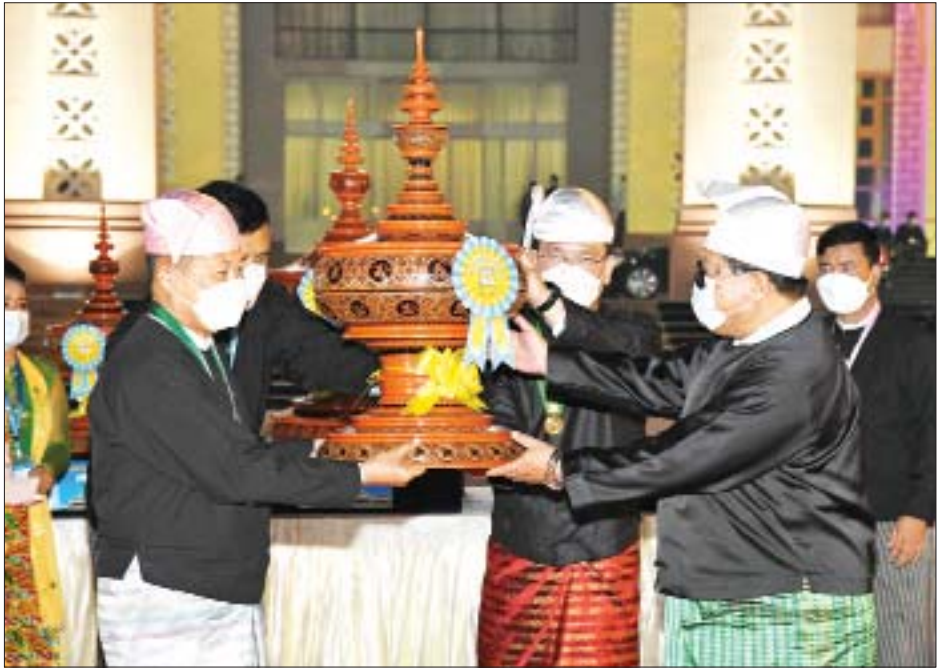
နိုင်ငံတော်စီမံအုပ်ချုပ်ရေးကောင်စီ ဒုတိယဥက္ကဋ္ဌ ဒုတိယဗိုလ်ချုပ်မှူးကြီး စိုးဝင်း ဂုဏ်ပြုယာဉ် ဒုတိယဆုရရှိသည့် ရှမ်းပြည်နယ်အတွက် ဂုဏ်ပြုဆုပေးအပ်ချီးမြှင့်စဉ်။