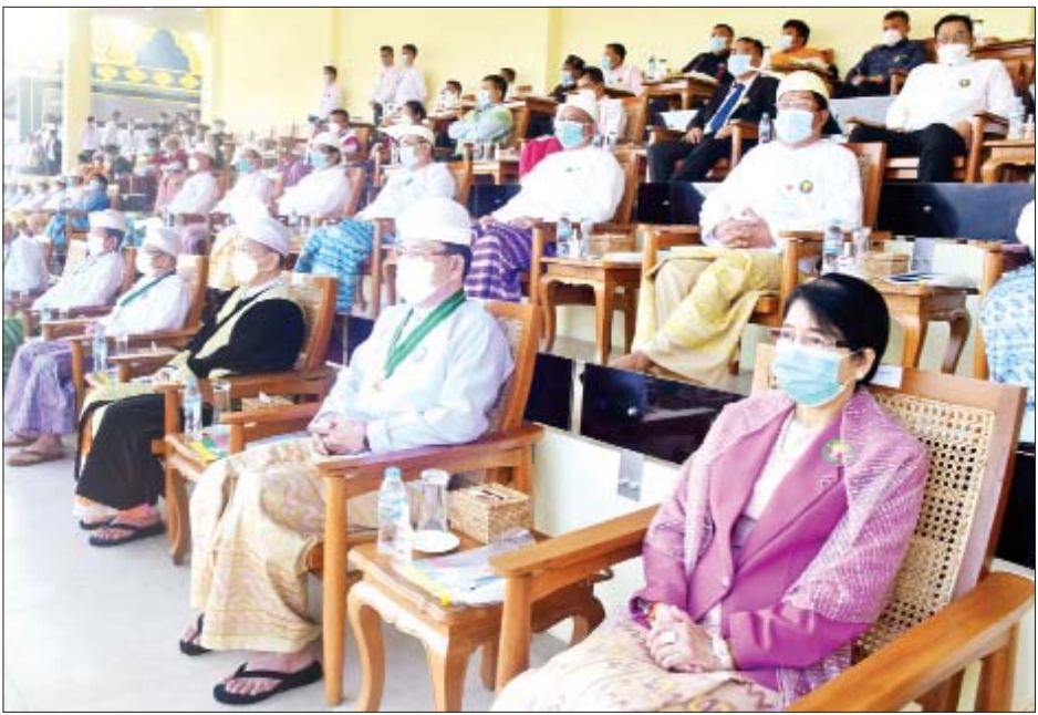
(၇၅)နှစ်မြောက် စိန်ရတုပြည်ထောင်စုနေ့ ဂုဏ်ပြုအခမ်းအနားသို့ တက်ရောက်ကြသူများကို တွေ့ရစဉ်။