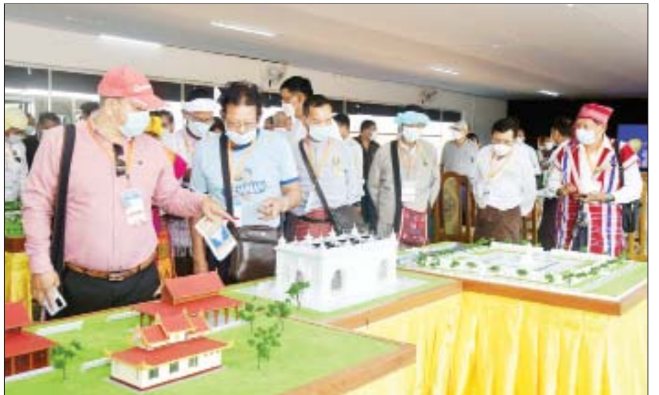
တိုင်းရင်းသားလက်နက်ကိုင်အဖွဲ့များ၊ NGO အဖွဲ့များနှင့် နိုင်ငံရေးပါတီ ကိုယ်စားလှယ်များပါဝင်သော လေ့လာရေးအဖွဲ့ “မာရဝီဇယ”ဗုဒ္ဓရုပ်ပွားတော်မြတ်ကြီး တည်ထားကိုးကွယ်ရန် ဆောင်ရွက်နေမှုကို လေ့လာကြည့်ပါကြစဉ်။

ညောင်လေးပင်မြို့၌ (၇၅)နှစ်မြောက် စိန်ရတုပြည်ထောင်စုနေ့အခမ်းအနား ကျင်းပ ညောင်လေးပင် ဖေဖော်ဝါရီ ၁၂ (၇၅)နှစ်မြောက် စိန်ရတုပြည်ထောင်စုနေ့ အခမ်းအနားကို ဖေဖော်ဝါရီ ၁၂ ရက် နံနက် ၅ နာရီခွဲတွင် ပဲခူးတိုင်းဒေသကြီး ညောင်လေးပင်မြို့ အထက(၁)၌ ကျင်းပသည်။ ရှေးဦးစွာ အထက(၁)ကျောင်းရှိ အလံတိုင်ရှေ့တွင် ဂုဏ်ပြုတပ်ပွဲနှင့်အတူ တက်ရောက်လာကြသော ဌာနဆိုင်ရာ တာဝန်ရှိသူများ၊ အသင်းအဖွဲ့ များမှ တာဝန်ရှိသူများက နိုင်ငံတော်အလံအား လွှင့်တင်ကာ အလေးပြုကြသည်။ ထို့နောက် နံနက် ၇ နာရီတွင် အထက(၁) ပညာဂုဏ်ရည်ခန်းမ၌ နိုင်ငံတော်စီမံအုပ်ချုပ်ရေးကောင်စီဥက္ကဋ္ဌ နိုင်ငံတော်ဝန်ကြီးချုပ် ဗိုလ်ချုပ်မှူးကြီး မဟာသရေ စည်သူမင်းအောင်လှိုင်ထံမှ ပေးပို့သော (၇၅)နှစ်မြောက် စိန်ရတုပြည်ထောင်စုနေ့ သဝဏ်လွှာကို မြို့နယ်စီမံအုပ်ချုပ်ရေးကောင်စီဥက္ကဋ္ဌ ဦးမြို့နိုင်က ဖတ်ကြားပြီး ကျောင်းသူတစ်ဦးက မြန်မာ့ကြွေးကြော်သံ သီချင်းဖြင့် ကပြဖျော်ဖြေသည်။ ဆက်လက်၍ (၇၅)နှစ်မြောက် စိန်ရတုပြည်ထောင်စုနေ့ စာစီစာကုံး၊ ကဗျာ၊ ပန်းချီ ဆောင်းပါး၊ ကျပန်းပြိုင်ပွဲ များတွင် ဆုရရှိကြသော ကျောင်းသား ကျောင်းသူများအား တာဝန်ရှိသူများက ဆုများ ပေးအပ်ချီးမြှင့်ကြကြောင်း သိရသည်။ နေလင်း(ညောင်လေးပင်)