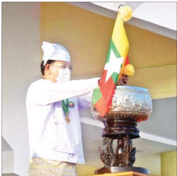
ပြည်ထောင်စုဝန်ကြီး ဦးမောင်မောင်အုန်းက “ပြည်ထောင်စုအလံတော်” အား စင်မြင့်ထက်ရှိ ငွေဖလား၌ စိုက်ထူစဉ်။

တိုင်းစစ်ဌာနချုပ် တိုင်းမှူးနှင့် ဇနီး၊ ဒုတိယဝန်ကြီးများ၊ ပြည်ထောင်စု ရာထူးဝန်အဖွဲ့ဝင်များ၊ မြန်မာနိုင်ငံတော် ဗဟိုဘဏ် ဒုတိယဥက္ကဋ္ဌများ၊ နေပြည်တော် ကောင်စီအဖွဲ့ဝင်များ၊ တိုင်းဒေသကြီးနှင့် ပြည်နယ်အစိုးရအဖွဲ့ဝန်ကြီးများ၊ အဂတိ လိုက်စားမှု တိုက်ဖျက်ရေးကော်မရှင် အဖွဲ့ဝင်များ၊ နေပြည်တော် စည်ပင် သာယာရေးကော်မတီ ဒုတိယမြို့တော်ဝန်၊ မြန်မာနိုင်ငံ အမျိုးသားလူ့အခွင့်အရေး ကော်မရှင်ဒုတိယဥက္ကဋ္ဌ၊ NCA စာချုပ် လက်မှတ်ရေးထိုးထားသည့် တိုင်းရင်းသား လက်နက်ကိုင်အဖွဲ့အစည်း ခုနစ်ဖွဲ့မှ ကိုယ်စားလှယ်များနှင့် NCA စာချုပ် လက်မှတ်ရေးထိုးထားခြင်းမရှိသေးသည့် တိုင်းရင်းသားလက်နက်ကိုင်အဖွဲ့အစည်း လေးဖွဲ့မှ ကိုယ်စားလှယ်များ၊ ဌာနဆိုင်ရာ အရာရှိကြီးများ၊ နေပြည်တော်တိုင်းစစ် ဌာနချုပ်နှင့် တပ်နယ်မှ အရာရှိကြီးများ၊