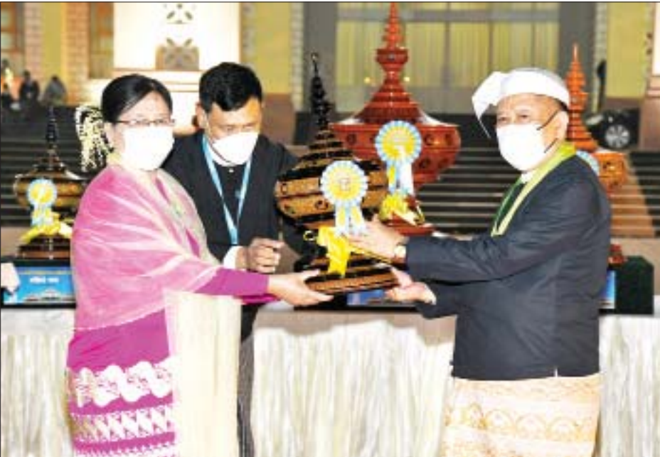
နိုင်ငံတော်စီမံအုပ်ချုပ်ရေးကောင်စီဝင် ဒေါ်အေးနုစိန် မန္တလေးတိုင်းဒေသကြီး ဂုဏ်ပြုယာဉ်အတွက် အထူးဆု ပေးအပ်ချီးမြှင့်စဉ်။