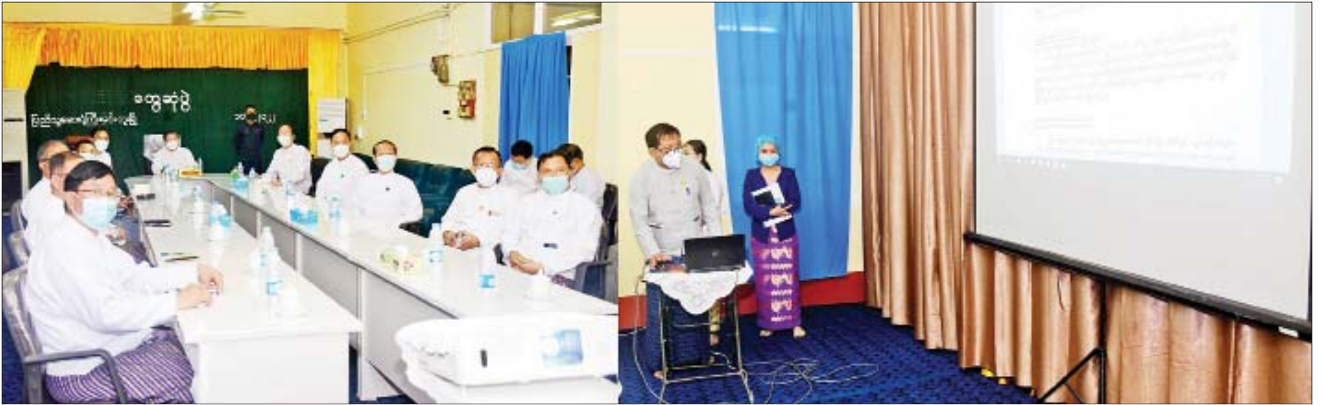
နိုင်ငံတော်စီမံအုပ်ချုပ်ရေးကောင်စီဥက္ကဋ္ဌ နိုင်ငံတော်ဝန်ကြီးချုပ် ဗိုလ်ချုပ်မှူးကြီး မင်းအောင်လှိုင်နှင့် အဖွဲ့ဝင်များအား မင်းဘူးမြို့ ခုတင်(၂၀၀)ဆုံ အထွေထွေရောဂါကုဆေးရုံကြီး၌ မကွေးတိုင်းဒေသကြီး ကျန်းမာရေးဦးစီးမှူး ဒေါက်တာသောင်းလှိုင်က ရှင်းလင်းတင်ပြစဉ်။