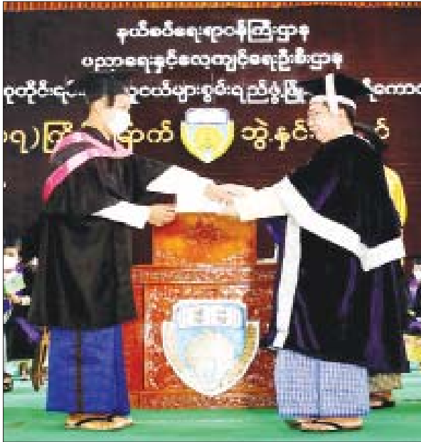
(၁၇)ကြိမ်မြောက် ဘွဲ့နှင်းသဘင်အခမ်းအနား(ဝိဇ္ဇာဘွဲ့)