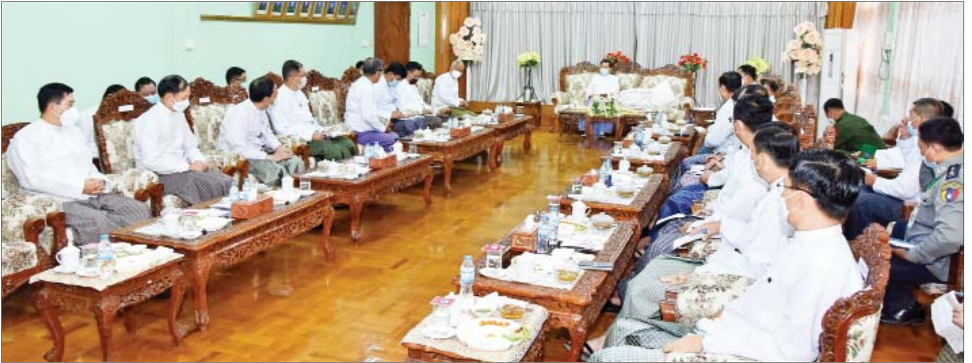
နိုင်ငံတော်စီမံအုပ်ချုပ်ရေးကောင်စီဥက္ကဋ္ဌ နိုင်ငံတော်ဝန်ကြီးချုပ် ဗိုလ်ချုပ်မှူးကြီးမင်းအောင်လှိုင် မကွေးတိုင်းဒေသကြီးအစိုးရအဖွဲ့ဝင်များ၊ ခရိုင်၊ မြို့နယ်အဆင့် ဌာနဆိုင်ရာတာဝန်ရှိသူများအား တွေ့ဆုံ၍ ဒေသဖွံ့ဖြိုးတိုးတက်ရေးဆိုင်ရာများအား ဆွေးနွေးပြောကြားစဉ်။