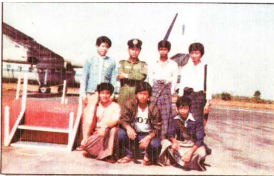
အလံတော်ခရီးစဉ်တွင် လွိုင်ကော်လေဆိပ်၌ တိုင်းရင်းသားကလေးများနှင့် အမှတ်တရ

ကလေးလေယာဉ်ကွင်းသို့ ချောချောမောမော ဆင်းသက်ခဲ့သည်။ လေယာဉ်ကွင်းထဲတွင် အလံတော်ကို စောင့်ကြည့်နေသော ပရိသတ်ကြီးကို တွေ့မြင်ရသည်။ လေယာဉ်ကို သတ်မှတ်နေရာတွင် ရပ်ပြီးသောအခါ အခမ်းအနားဝတ်စုံဝတ်ဆင်ထား သော ဗိုလ်မှူးကြီးသိန်းမြင့်က အလံတော်ကို မြောက်ကိုင်၍ ရှေ့ဆုံးမှ ဆင်းသည်။ အလံတော်