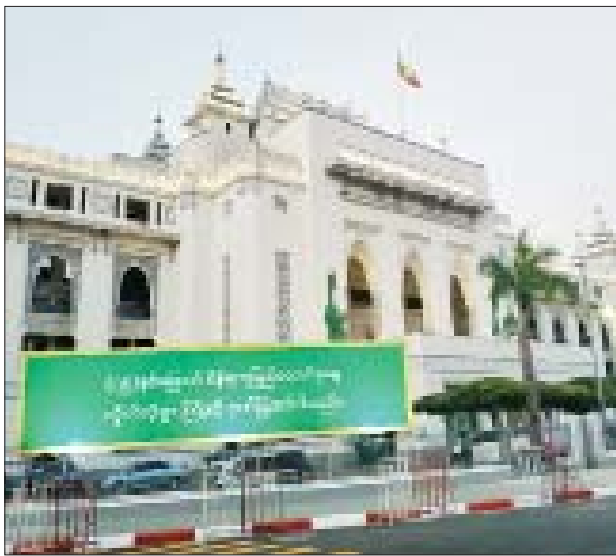
ရန်ကုန်မြို့တော်ခန်းမ၌ ဆိုင်းဘုတ်များ စိုက်ထူထားစဉ်။

နေပြည်တော် ဖေဖော်ဝါရီ ၁၀ ၂၀၂၂ ခုနှစ် ဖေဖော်ဝါရီ ၁၂ ရက်တွင် ကျရောက်မည့် (၇၅)နှစ်မြောက် စိန်ရတုပြည်ထောင်စုနေ့ အခမ်းအနားကို ပြည်ထောင်စုနယ်မြေ နေပြည်တော်နှင့် မြန်မာနိုင်ငံတစ်ဝန်း၌ ခမ်းနားထည်ဝါစွာ ကျင်းပသွားမည်ဖြစ်သည်။