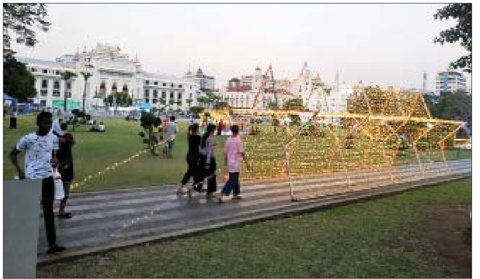
မဟာဗန္ဓုလပန်းခြံအတွင်း ရောင်စုံအလှမီးများ ထွန်းညှိပြင်ဆင်ထားစဉ်။

ဖြင့် အလှဆင်ထားရှိသည်။ အလားတူ ရန်ကုန်တိုင်းဒေသကြီး ကျောက်တံတားမြို့နယ်ရှိ ရန်ကုန်မြို့တော်ခန်းမ၌ ဆိုင်းဘုတ်များ ဂုဏ်ပြုစိုက်ထူထားခြင်း၊ မဟာဗန္ဓုလပန်းခြံအတွင်း ရောင်စုံအလှမီးများ ထွန်းညှိ