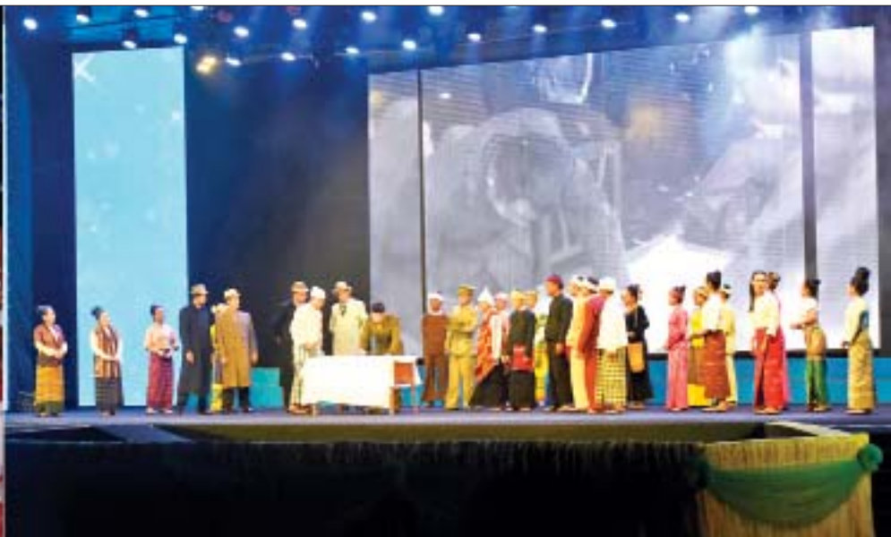
နိုင်ငံတော်စီမံအုပ်ချုပ်ရေးကောင်စီ ဒုတိယဥက္ကဋ္ဌ ဒုတိယဝန်ကြီးချုပ် ဒုတိယဗိုလ်ချုပ်မှူးကြီး စိုးဝင်း (၇၅)နှစ်မြောက် စိန်ရတုပြည်ထောင်စုနေ့ဂုဏ်ပြုအခမ်းအနားတွင် သီဆိုကပြဖျော်ဖြေကြမည့် တိုင်းရင်းသား တိုင်းရင်းသားများ ဝတ်စုံပြည့် အစမ်းလေ့ကျင့်နေမှုကို ကြည့်ရှုစဉ်။

* ကျောဖုံးမှ ထို့နောက် ၂၀၂၂ ခုနှစ် (၇၅)နှစ်မြောက် စိန်ရတုပြည်ထောင်စုနေ့ ဂုဏ်ပြုညစာစားပွဲ ခင်းကျင်းထားရှိမှုများကို ကြည့်ရှုစစ်ဆေးရာ တာဝန်ရှိသူများက လိုက်လံရှင်းလင်းပြသကြသည်။ ဆက်လက်၍ နိုင်ငံတော်စီမံအုပ်ချုပ်ရေးကောင်စီ ဒုတိယဥက္ကဋ္ဌ ဒုတိယဝန်ကြီးချုပ်သည် နေပြည်တော် လေဟာပြင် ကဇာတ်ရုံ၌ ၂၀၂၂ ခုနှစ် (၇၅)နှစ်မြောက် စိန်ရတုပြည်ထောင်စုနေ့ ဂုဏ်ပြုညစာစားပွဲ အခမ်းအနားတွင် သီဆိုကပြဖျော်ဖြေကြမည့် တိုင်းရင်းသား တိုင်းရင်းသားများ၏ ဝတ်စုံပြည့် အစမ်းလေ့ကျင့်နေမှုများကို ကြည့်ရှုစစ်ဆေးရာ တိုင်းရင်းသားများ၏ သွေးစည်းချစ်ကြည်မှုသမိုင်းကို မော်ကွန်းအဖြစ်