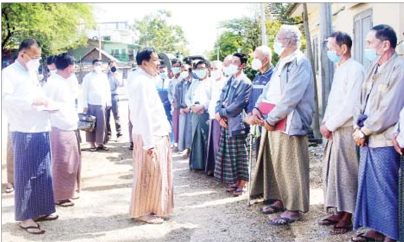
နိုင်ငံတော်စီမံအုပ်ချုပ်ရေးကောင်စီဥက္ကဋ္ဌ နိုင်ငံတော်ဝန်ကြီးချုပ် ဗိုလ်ချုပ်မှူးကြီးမင်းအောင်လှိုင် လယ်ကိုင်းကျေးရွာ ရပ်မိရပ်ဖများ၊ ကျေးရွာမိခင်နှင့် ကလေးစောင့်ရှောက်ရေးအသင်းမှ တာဝန်ရှိသူများ၊ ဒေသခံပြည်သူများနှင့် တွေ့ဆုံစဉ်။