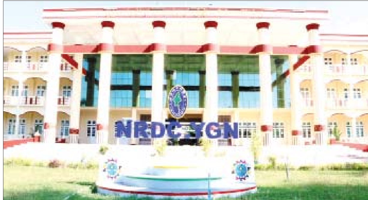
ပြည်ထောင်စုတိုင်းရင်းသားလူငယ်များ စွမ်းရည်ဖွံ့ဖြိုးရေးဒီဂရီကောလိပ်(ရန်ကုန်)။

ပြည်ထောင်စုသမ္မတ မြန်မာနိုင်ငံအနေဖြင့် ပြောင်းလဲလာသောအခြေအနေများနှင့်အညီ ကမ္ဘာ့နိုင်ငံများနှင့်ကူးလူးဆက်ဆံရာတွင် ဝန်းရံထိုးဖောက်လာသော Cultural Globalization များကို ဘေးတွင် အကာအဖြစ်သထားပြီး မျိုးချစ်ပြည်ချစ်စိတ်နှင့် ညီညွတ်မှုရှိသော ပြည်ထောင်စုစိတ်ဓာတ် (Union Spirit) ကို အနှစ်အဖြစ်ထားကာ ကိုယ်ပိုင်ယဉ်ကျေးမှုကိုယ်ခံအင်အားကို တည်ဆောက်ရမည်ဖြစ်သည်။ ကမ္ဘာ့နိုင်ငံများနှင့် ခေတ်မီရင်ပေါင်တန်းနိုင်ရန် တိုင်းရင်းသားအားလုံး စည်းလုံးညီညွတ်သည့် ပြည်ထောင်စုစိတ်ဓာတ် (Union Spirit) သည်သာ အဓိကစွမ်းအားဖြစ် ။