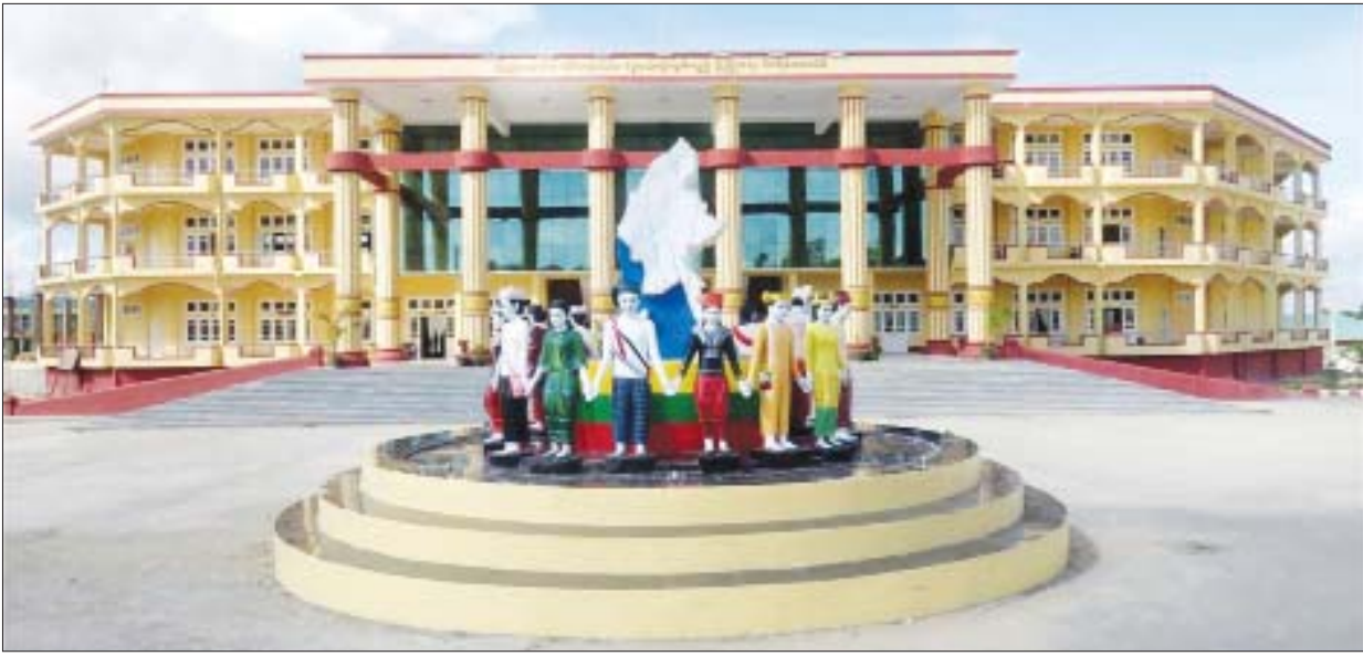
ပြည်ထောင်စုတိုင်းရင်းသားလူငယ်များ စွမ်းရည်ဖွံ့ဖြိုးရေး ဒီဂရီကောလိပ်(စစ်ကိုင်း)။

ထိုကဲ့သို့ပင် မတူညီသော ပညာရပ်များကို လိုအပ်သလို ပေါင်းစပ်