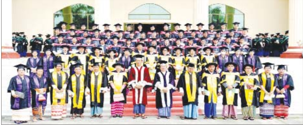
(၁၇)ကြိမ်မြောက် ဘွဲ့နှင်းသဘင်အခမ်းအနားအပြီး စုပေါင်းမှတ်တမ်းတင်ဓာတ်ပုံရိုက်စဉ်။