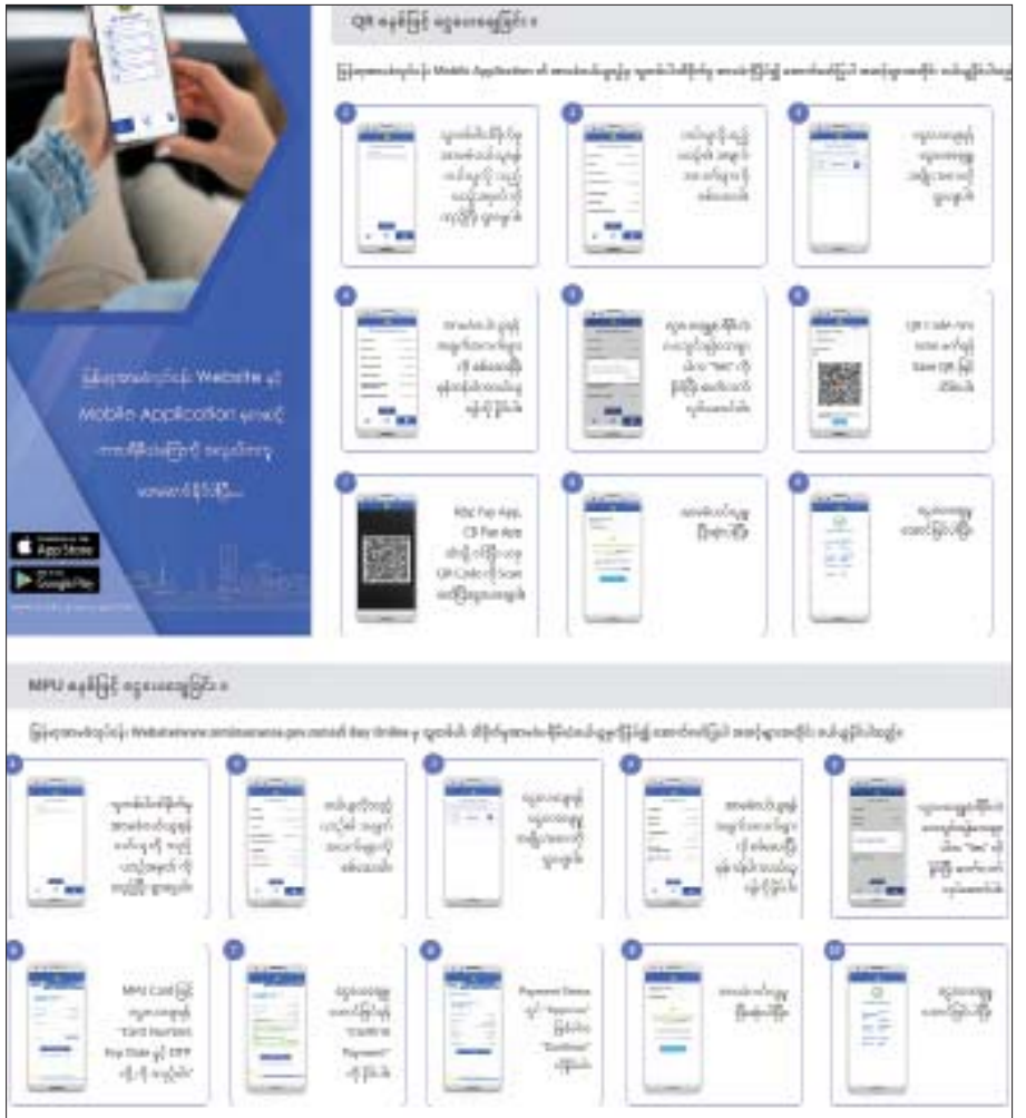
အာမခံဝယ်ယူမှု ပြီးဆုံးသည့်အတွက် ငွေပေးချေမှု အောင်မြင်ပြီဖြစ်သည်။ သူတစ်ပါးထိခိုက်မှုမော်တော်ယာဉ်အာမခံပရီမီယံကို အွန်လိုင်းမှ လွယ်ကူမြန်ဆန်စွာပေးသွင်းနိုင်ရန် မြန်မာ့အာမခံလုပ်ငန်း ဝန်ဆောင်မှုပေးလျက်ရှိပါသည်။

MPU စနစ်ဖြင့် ပေးချေခြင်း ကနဦးအနေဖြင့် သူတစ်ပါးထိခိုက်မှု အာမခံဝယ်ယူရန် ဝယ်ယူလိုသည့် ယာဉ်အမှတ်ကိုထည့်ပြီး ရှာဖွေရမည်ဖြစ်သည်။ ဝယ်ယူလိုသည့်ယာဉ်အချက်အလက်များကို စစ်ဆေးရမည်ဖြစ်ပြီး ငွေပေးချေရန် ငွေပေးချေမှု အမျိုးအစားကို ရှာဖွေရမည်ဖြစ်သည်။ ယင်းနောက် အာမခံဝယ်ယူရန် အချက်အလက်များကိုစစ်ဆေးပြီး မှန်ကန်ပါက ဝယ်ယူရန်နှိပ်ရမည်ဖြစ်သည်။ ငွေပေးချေ (ပရီမီယံ) ပေးသွင်းရန် သေချာပါက “Yes” ကို နှိပ်ပြီး ဆက်လက်လုပ်ဆောင်ရမည်ဖြစ်သည်။ MPU Card ဖြင့် ပေးချေရန် “Card Number၊ Exp Data နှင့် OTP တို့ကို ထည့်ရမည်ဖြစ်ပြီး ငွေပေးချေမှုအောင်မြင်ရန် “Confirm Payment” ကို နှိပ်ရမည်ဖြစ်သည်။ Payment Status တွင် Approve ဖြစ်ပါက Continue ကိုနှိပ်ပြီးလျှင်