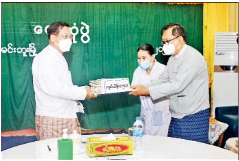
နိုင်ငံတော်စီမံအုပ်ချုပ်ရေးကောင်စီဥက္ကဋ္ဌ နိုင်ငံတော်ဝန်ကြီးချုပ် ဗိုလ်ချုပ်မှူးကြီး မင်းအောင်လှိုင် မင်းဘူးမြို့ ခုတင်(၂၀၀)ဆုံ ခရိုင်အထွေထွေရောဂါကုဆေးရုံကြီးအတွက် ဆေးပဒေသာပင်ရန်ပုံငွေကျပ်သိန်း ၁၅၀ ပေးအပ်လှူဒါန်းရာ ဆေးရုံအုပ်ကြီး ဒေါက်တာအေးမြဝင်းနှင့်တာဝန်ရှိသူများက လက်ခံရယူကြစဉ်။

ကလေးကုသဆောင်များ ပြင်ဆင်ထားရှိမှု အခြေအနေများနှင့် ဆေးရုံ၏လိုအပ်ချက်များကို တင်ပြသည်။ ရှင်းလင်းတင်ပြမှုများအပေါ် နိုင်ငံတော်စီမံအုပ်ချုပ်ရေးကောင်စီဥက္ကဋ္ဌ နိုင်ငံတော်ဝန်ကြီးချုပ်က ကိုဗစ်-၁၉ ရောဂါ ကုသရေးအတွက်လိုအပ်သည့် အောက်ဆီဂျင်စက် ပြန်လည်လည်ပတ်နိုင်ရေး ဆောင်ရွက်ပေးသွားမည်ဖြစ်ကြောင်း၊ မကွေးတိုင်းဒေသကြီး ဧရာဝတီမြစ်အနောက်ဘက်ခြမ်းရှိ မြို့နယ်များသည် မင်းဘူးဆေးရုံကြီးတွင် ကုသမှုခံယူရကြောင်း၊ ဆေးရုံအတွင်းပြည့်စုံမှုရှိသည်ကိုတွေ့ရှိရပြီး ဆေးရုံတွင်တာဝန်ထမ်းဆောင်နေသည့် ကျန်းမာရေးဝန်ထမ်း၏တာဝန်ထမ်းဆောင်မှုကိုလည်း ကျေးဇူးတင်အသိအမှတ်ပြုပြောကြောင်း၊ ဆေးရုံအတွင်း ပတ်ဝန်းကျင်သန့်ရှင်းသာယာလှပရေးအတွက် ဆောင်ရွက်ရန်လိုကြောင်း၊ ဆေးရုံတွင်လာရောက်ပြသသည့်လူနာများ အဆင်ပြေစွာကုသနိုင်ရေး စီမံဆောင်ရွက်ပြင်ဆင်ထားရန်လိုကြောင်း ပြောကြားသည်။ ယင်းနောက် နိုင်ငံတော်စီမံအုပ်ချုပ်ရေးကောင်စီဥက္ကဋ္ဌ နိုင်ငံတော်ဝန်ကြီးချုပ်နှင့် အလှူရှင်များက ဆေးရုံကြီးအတွက် ဆေးပဒေသာပင်ရန်ပုံငွေကျပ်သိန်း ၁၅၀ နှင့် ကျန်းမာရေးဝန်ထမ်းများနှင့် လူနာများအတွက် စားသောက်ဖွယ်ရာများပေးအပ်ရာ