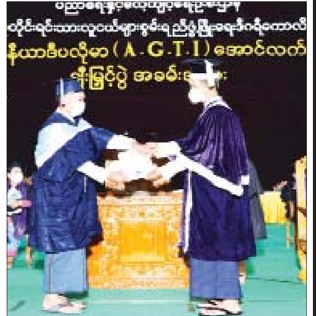
အင်ဂျင်နီယာဒီပလိုမာ(A.G.T.I) အောင်လက်မှတ်ချီးမြှင့်စဉ်။