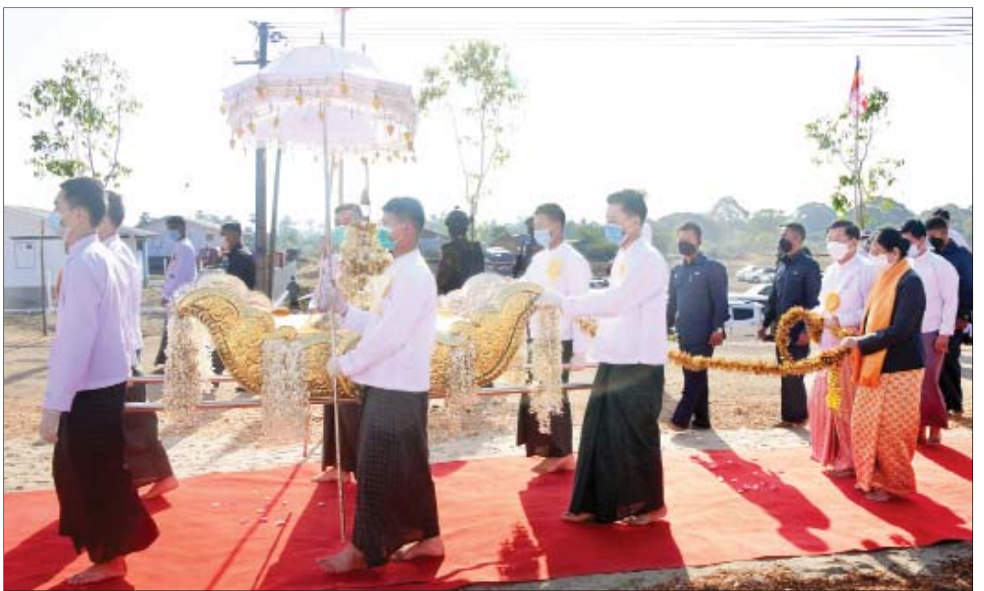
နိုင်ငံတော်စီမံအုပ်ချုပ်ရေးကောင်စီဥက္ကဋ္ဌ နိုင်ငံတော်ဝန်ကြီးချုပ် ဗိုလ်ချုပ်မှူးကြီးမင်းအောင်လှိုင်နှင့် ဇနီး ဒေါ်ကြူကြူလှတို့ ရတနာစိန်ဖူးတော်အား ပင့်ဆောင်၍ စေတီတော်မြတ်အား လက်ယာရစ် လှည့်လည်ပင့်ဆောင် ပူဇော်ကြစဉ်။

ထို့နောက် နိုင်ငံတော်စီမံအုပ်ချုပ်ရေးကောင်စီဥက္ကဋ္ဌ နိုင်ငံတော်ဝန်ကြီးချုပ်၊ ဇနီး၊ မိသားစုဝင်များနှင့် အဖွဲ့ဝင်များသည် ရတနာစိန်ဖူးတော်၊ ငှက်မြတ်