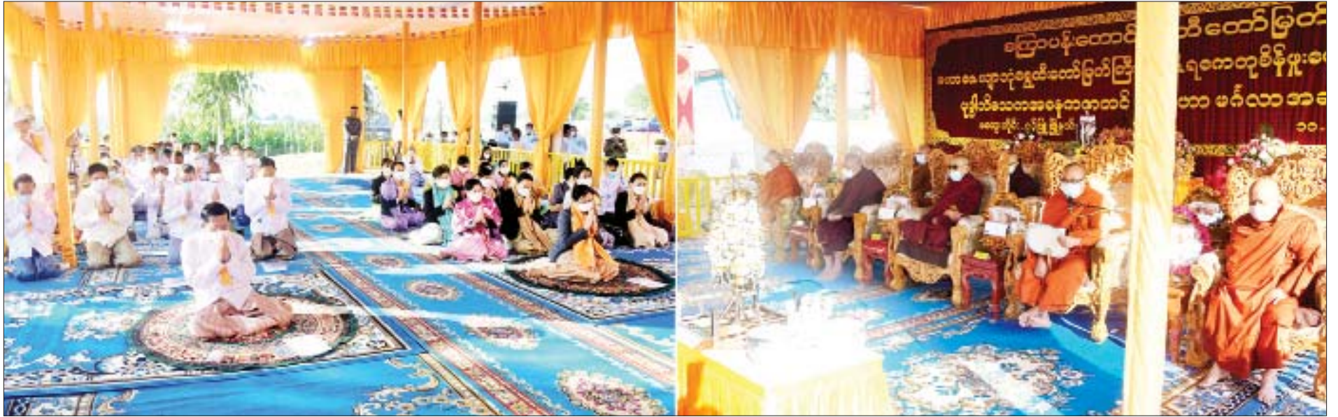
နိုင်ငံတော်စီမံအုပ်ချုပ်ရေးကောင်စီဥက္ကဋ္ဌ နိုင်ငံတော်ဝန်ကြီးချုပ် ဗိုလ်ချုပ်မှူးကြီးမင်းအောင်လှိုင်၊ ဇနီး ဒေါ်ကြူကြူလှနှင့် အခမ်းအနားတက်ရောက်လာကြသူများက မြို့နယ်သံဃာယကအဖွဲ့ဥက္ကဋ္ဌ စလင်းမြို့ မဟာဝိသုတာရာမစိန်ပန်းကျောင်းတိုက် ပဓာနနာယက မဟာဂန္ထဝါစကပဏ္ဍိတ ဓမ္မကထိက ဗဟုဇနဟိတရေ ဘဒ္ဒန္တကုမာရ ထံမှ ကိုးပါးသီလ ခံယူဆောက်တည်ကြစဉ်။