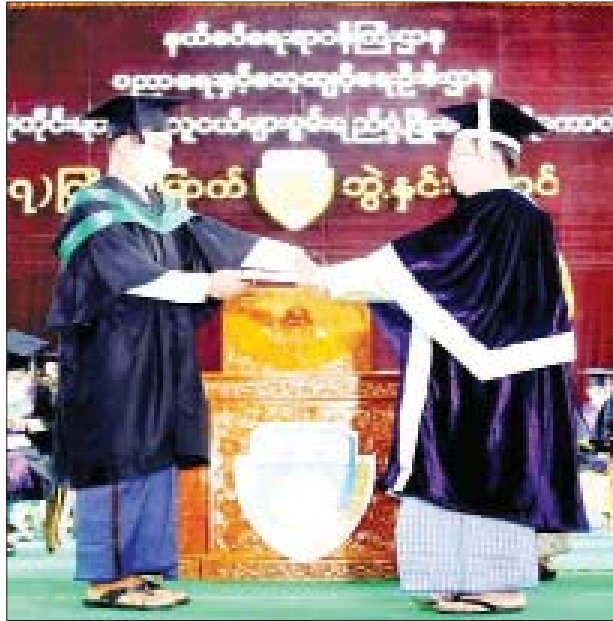
(၁၇)ကြိမ်မြောက် ဘွဲ့နှင်းသဘင်အခမ်းအနား(သိပ္ပံဘွဲ့)