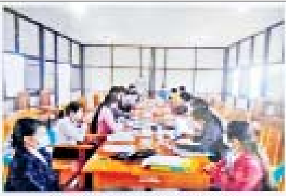
ကိုးကွယ်သည့်အဖွဲ့ဝင်များ၏ အစည်းဝေးခြင်း