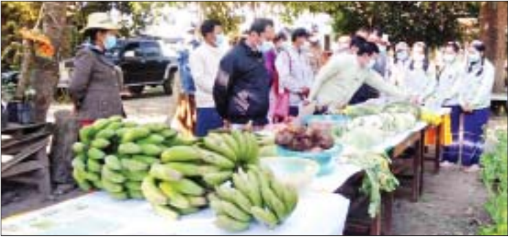
ခုနှစ်အတွက် စိုက်ပျိုးရေးလုပ်ငန်းများကို စွမ်းစွမ်းတမ်း ဆောင်ရွက်ခဲ့ကြသော တောင်သူကြီးများအား တာဝန်ရှိသူများက စုစုပေါင်း ၃၁ ဦး တက်ရောက်ခဲ့ကြောင်း ဆုချီးမြှင့်ခဲ့ကြပြီး အခမ်းအနားသို့ သိရသည်။ အေးမြသက်ထား

ဗန်းမောက် ဖေဖော်ဝါရီ ၉ စစ်ကိုင်းတိုင်းဒေသကြီး ဗန်းမောက်မြို့နယ်စိုက်ပျိုးရေးဦးစီးဌာန မြို့နယ်ဦးစီးမှူးရုံးခန်းမ၌ (၇၅) နှစ်မြောက် စိန်ရတုပြည်ထောင်စုနေ့ကို ကြိုဆိုဂုဏ်ပြုသော အားဖြင့် နည်းပညာပြန့်ပွားမှုစင်တာ နယ်မြေအလိုက် စိုက်ပျိုးရေးလုပ်ငန်းများကို စွမ်းစွမ်းတမ်း ဆောင်ရွက်ခဲ့ကြသော တောင်သူကြီးများကို ဆုချီးမြှင့်ခြင်းနှင့် သီးနှံမျိုးစေ့များ၊ ဟင်းသီးဟင်းရွက် သစ်သီးဝလံများ ပြသပွဲအခမ်းအနားကို ယနေ့နံနက် ၁၁ နာရီတွင် ကျင်းပသည်။ ဗန်းမောက်မြို့နယ်တွင် ၂၀၂၁-၂၀၂၂