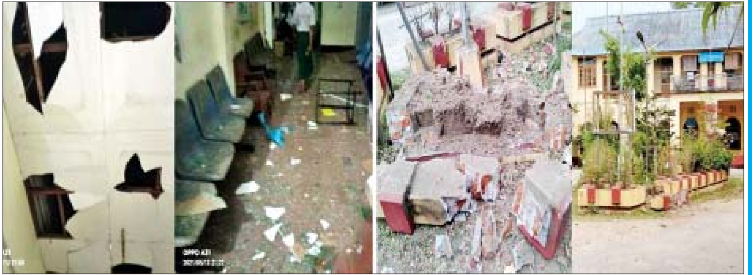
ဒီမိုကရေစီကို ဖြိုလှဲနေသည့် အကြမ်းဖက်သမားများ၏ ဗိုင်းထောင်ဖောက်ခွဲ၊ မီးရှို့ဖျက်ဆီးမှုများကြောင့် ဆေးရုံ/ ဆေးခန်းများ ပျက်စီးဆုံးရှုံးမှုကို တွေ့ရစဉ်။

၇။ တရားသောစီးပွားရေး လုပ်ဆောင်ခွင့် တရားဥပဒေက ခွင့်ပြုထားသော စီးပွားရေးလုပ်ငန်းများကို ပြည်သူတိုင်း လုပ်ပိုင်ခွင့်ရှိရမည်။ ဒီမိုကရေစီနိုင်ငံအများစုတွင် ဈေးကွက်စီးပွားရေးစနစ်