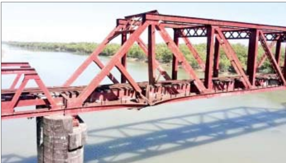
ရေး-မော်လမြိုင်သွား ရထားလမ်း တံတားအမှတ် (၁၇၃) သံပေါင်ဘေလီတံတားအား အကြမ်းဖက် သမားများက မိုင်းထောင်ဖောက်ခွဲဖျက်ဆီးခဲ့မှု မှတ်တမ်းဓာတ်ပုံ။