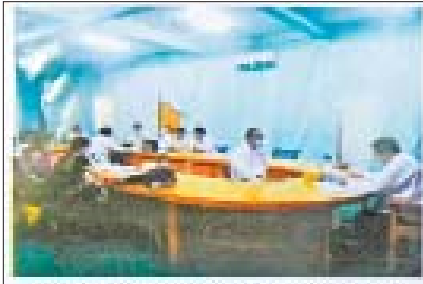
ပြည်ထောင်စုအဖွဲ့ဝင်များအဖွဲ့ဝင်များ၏ အစည်းဝေးခြင်း

၁။ နိုင်ငံသားတိုင်းပါဝင်မှု နိုင်ငံသားများ အစိုးရအဖွဲ့တွင် ပါဝင် ခွင့်ရှိခြင်းသည် ဒီမိုကရေစီ၏အရေးပါ သော အချက်ဖြစ်ပါသည်။ နိုင်ငံသားများ ပါဝင်ခြင်းသည် အခွင့်အရေးထက် တာဝန်ဖြစ်ပါသည်။ ပါဝင်ခြင်းဟုဆိုရာ တွင် ရွေးကောက်ပွဲတွင် ဝင်ရောက် ယှဉ်ပြိုင်အရွေးခံခြင်း၊ ရွေးကောက်ပွဲတွင် မဲပေးခြင်း၊ လူထုဆွေးနွေးပွဲများကို တက်ရောက်ခြင်း၊ လူမှုရေးအဖွဲ့အစည်း များတွင်ပါဝင်ခြင်း၊ အခွန်ပေးဆောင်ခြင်း၊