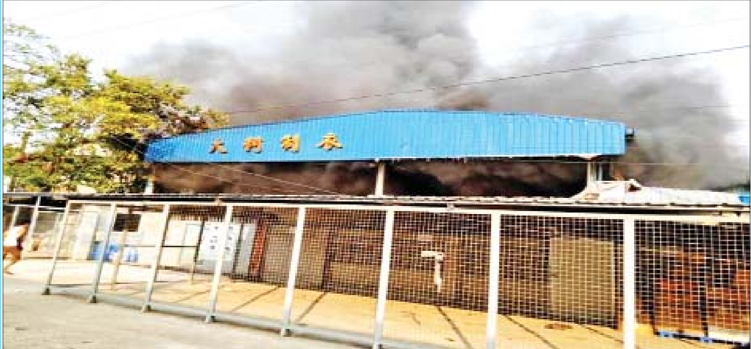
ငါနှင့်မတူ ငါ့ရန်သူဟု သတ်မှတ်ကာ ဒီမိုကရေစီစံနှုန်းများကို ချိုးဖောက်နေသည့် အကြမ်းဖက်သမားများက လှိုင်သာယာစက်ရုံများအား အကြမ်းဖက်မီးရှို့ဖျက်ဆီးမှုကို တွေ့ရစဉ်။

ဒီမိုကရေစီဆိုသည်မှာ ဥပဒေကို လေးစားလိုက်နာမှသာ စည်းကမ်း ပြည့်ဝသည့် ဒီမိုကရေစီဖြစ်ပါသည်။ မည်သူမျှ ဥပဒေအထက်တွင် မရှိရပါ။ နိုင်ငံသားတိုင်းသည် တည်ဆဲဥပဒေများကို လေးစားလိုက်နာရန်တာဝန်ရှိပြီး ချိုးဖောက်ပါက အပြစ်ပေးခြင်းကို ခံရမည်ဖြစ်ပါသည်။ တရားဥပဒေသည်လည်း ပြည်သူတိုင်းအပေါ်တွင် တရားမျှတမှုနှင့် တစ်သမတ်တည်းရှိမှသာ ဒီမိုကရေစီဖြစ်