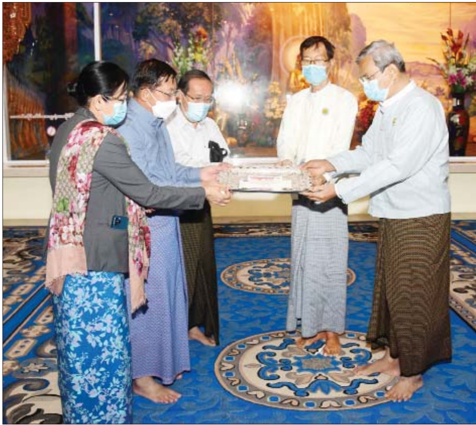
နိုင်ငံတော်စီမံအုပ်ချုပ်ရေးကောင်စီဥက္ကဋ္ဌ နိုင်ငံတော်ဝန်ကြီးချုပ် ဗိုလ်ချုပ်မှူးကြီး မင်းအောင်လှိုင်နှင့်ဇနီး ဒေါ်ကြူကြူလှ မြသလွန်စေတီတော် ဂေါပကအဖွဲ့ထံ အလှူငွေများ ပေးအပ်လှူဒါန်းစဉ်။

အတန်းပညာရှိမှသာ အတတ်ပညာရှိမည်ဖြစ်ကြောင်း၊ ထို့ကြောင့် အတန်းပညာရှိရေးအတွက် အရေးကြီးကြောင်း၊ စိုက်ပျိုးမွေးမြူရေးလုပ်ငန်းများတွင်လည်း အနည်းဆုံး ၉ တန်းအောင်ချိန်တွင် စိုက်ပျိုးမွေးမြူရေးကျောင်းများကို တက်ရောက်ခြင်းဖြင့် စိုက်ပျိုးမွေးမြူရေးပညာရပ်များကို ပိုမို