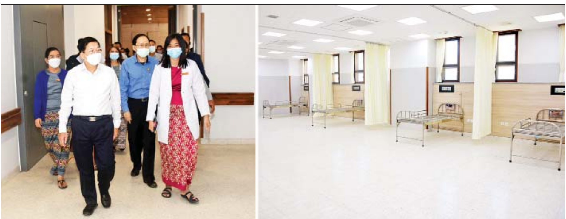
နိုင်ငံတော်စီမံအုပ်ချုပ်ရေးကောင်စီဥက္ကဋ္ဌ နိုင်ငံတော်ဝန်ကြီးချုပ် ဗိုလ်ချုပ်မှူးကြီးမင်းအောင်လှိုင် မကွေးပြည်သူ့ဆေးရုံကြီးရှိ အသစ်ထပ်မံဆောက်လုပ်ထားရှိသည့် သားဖွားမီးယပ်နှင့် မွေးကင်းစကလေး သုံးထပ်ကုသဆောင်အတွင်း ကြည့်ရှုစစ်ဆေးစဉ်။