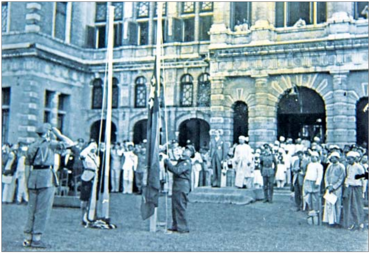
၁၉၄၈ ခုနှစ် ဇန်နဝါရီလ ၄ ရက်က ရန်ကုန်မြို့ အလုံလမ်းရှိ ဗြိတိသျှဘုရင်ခံအိမ်တော်(အစိုးရအိမ်တော်)တွင် ယူနိုက်တက်အလံကို မြေသို့ချပြီး မြန်မာနိုင်ငံတော်အလံကို လွှင့်တင်စဉ်။

ကျွန်တော်တို့တစ်တွေဟာ သံသရာတစ်ကွေ့မှာ အခုလိုဆုံတွေ့ရတဲ့ဘဝကို ချစ်မြတ်နိုးကြရပါမယ်။ မေတ္တာ၊ ကရုဏာ၊ မုဒိတာ၊ ဥပေက္ခာတွေထားခြင်းဖြင့် မိမိတစ်ဦးတည်းလည်းငြိမ်းချမ်း၊ တစ်တိုင်းပြည်လုံးလည်း အေးချမ်းဖွံ့ဖြိုးတိုးတက်မှုတွေ အသီးသီးရကြမှာ