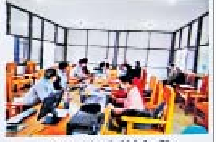
မူဝါဒပြင်ဆင်မှုအဖွဲ့ဝင်များ၏ အစည်းဝေးခြင်း

တရားမျှတသော ရွေးကောက်ပွဲဖြစ်ရန် နိုင်ငံရေးပါတီများအား ရွေးကောက်ပွဲကော်မရှင်ဥပဒေနှင့်အညီ စစ်ဆေးမှုများ ပြုလုပ်စဉ်။