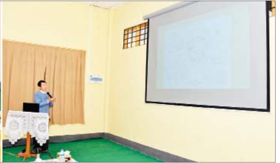
နိုင်ငံတော်စီမံအုပ်ချုပ်ရေးကောင်စီဥက္ကဋ္ဌ နိုင်ငံတော်ဝန်ကြီးချုပ် ဗိုလ်ချုပ်မှူးကြီး မင်းအောင်လှိုင်နှင့် အဖွဲ့ဝင်များအား ဗိဿနိုးရှေးဟောင်းသုတေသနပြတိုက်ရှင်းလင်းဆောင်၌ ညွှန်ကြားရေးမှူးချုပ် ဦးကျော်ဦးလွင်က ရှင်းလင်းတင်ပြစဉ်။