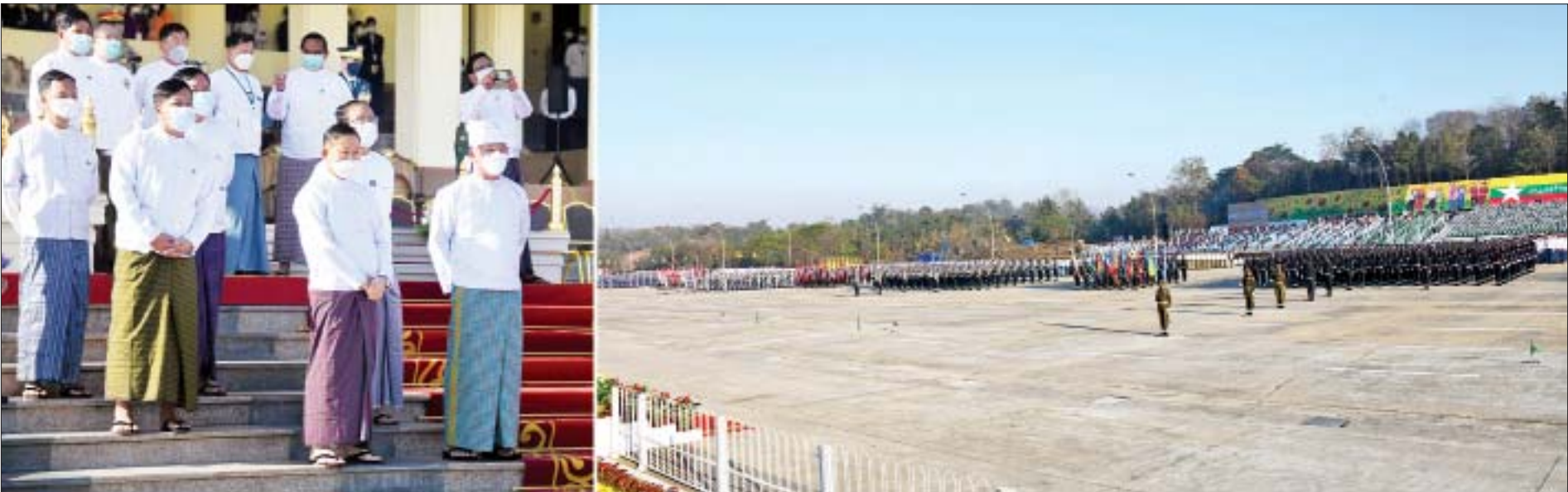
နိုင်ငံတော်စီမံအုပ်ချုပ်ရေးကောင်စီ ဒုတိယဥက္ကဋ္ဌ ဒုတိယဝန်ကြီးချုပ် ဒုတိယဗိုလ်ချုပ်မှူးကြီးစိုးဝင်း ၂၀၂၂ ခုနှစ် (၇၅)နှစ်မြောက် စိန်ရတုပြည်ထောင်စုနေ့ ဂုဏ်ပြုအခမ်းအနား ဝတ်စုံပြည့်အစမ်းလေ့ကျင့် နေမှုများကို ကြည့်ရှုစစ်ဆေးစဉ်။

နေပြည်တော် ဖေဖော်ဝါရီ ၉ နိုင်ငံတော်စီမံအုပ်ချုပ်ရေးကောင်စီ ဒုတိယ ဥက္ကဋ္ဌ ဒုတိယဝန်ကြီးချုပ် ဒုတိယဗိုလ်ချုပ်မှူးကြီး စိုးဝင်းသည် ယနေ့နံနက်ပိုင်းတွင် နေပြည်တော် ဗိုလ်ရှစ်ရင်ပြင်၌ ကျင်းပသည့် ၂၀၂၂ ခုနှစ် (၇၅) နှစ်မြောက် စိန်ရတုပြည်ထောင်စုနေ့ ဂုဏ်ပြု အခမ်းအနား အောင်မြင်စွာကျင်းပနိုင်ရေး ဝတ်စုံပြည့် အစမ်းလေ့ကျင့်နေမှုများကို ကြည့်ရှုစစ်ဆေးသည်။ စိန်ရတုပြည်ထောင်စုနေ့ ဂုဏ်ပြုအခမ်းအနား အစမ်းလေ့ကျင့်မှုတွင် စစ်ကြောင်း၊ တပ်ခွဲများ နေရာယူချိန်မှစ၍ တိုင်းဒေသကြီးနှင့် ပြည်နယ်တို့မှ ၂၀၂၂ ခုနှစ် (၇၅)နှစ်မြောက် စိန်ရတုပြည်ထောင်စုနေ့ အတွက် ဂုဏ်ပြုယာဉ်များ ချီတက်အလေးပြုခြင်း နှင့် တိုင်းရင်းသားရိုးရာယဉ်ကျေးမှုအဖွဲ့အလိုက် ရိုးရာတေးသီချင်းများဖြင့် ကပြဖျော်ဖြေမှုတို့ကို အစီအစဉ်အလိုက် လေ့ကျင့်ဆောင်ရွက်ကြမှုအား ကြည့်ရှု၍ လိုအပ်သည်များ မှာကြားသည်။ ထိုသို့ လေ့ကျင့်ဆောင်ရွက်နေမှုများကို (၇၅) နှစ်မြောက် စိန်ရတုပြည်ထောင်စုနေ့ ကျင်းပရေး ဗဟိုကော်မတီဥက္ကဋ္ဌ နိုင်ငံတော်စီမံအုပ်ချုပ်ရေး ကောင်စီ ဒုတိယဥက္ကဋ္ဌ ဒုတိယဝန်ကြီးချုပ် ဒုတိယ ဗိုလ်ချုပ်မှူးကြီးစိုးဝင်းနှင့်တကွ နိုင်ငံတော်စီမံ အုပ်ချုပ်ရေး စာမျက်နှာ ၇ ကော်လံ ၁ သို့ ▢