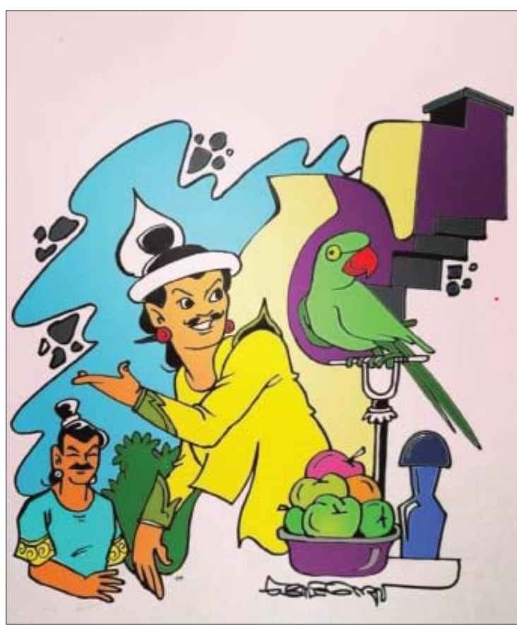
စာမျက်နှာ ၁၉ သို့ ၀

“ဒီကျေးကတော့ ယဉ်ကျေးဖော်ရွေ လှပါတယ်။ မယုံနိုင်စရာကို ဖြစ်ရတာပေါ့ ဘုရား” ဘုရင်မင်းမြတ်တို့ အနီးအနား တွင် နားစွင့်နေသော ကြက်တူရွေးက ဝင်ပြောပါတော့တယ်။ “အလို... အာဂန္တု ကြီးတို့ဟာ တောထဲမှာ ကျွန်တော်မျိုးရဲ့ ညီတော်နဲ့ တွေ့ခဲ့ကြတယ်ထင်ပါ” “ဝိုင်းကြဟေ့ ဝိုင်းကြ၊ ပစ္စည်းတွေ ကို လှယူကြပါတော့လားလို့ ဟစ်အော်တဲ့ ကျေးပေါ့” ရထားထိန်းက ကြက်တူရွေး ကို စကားဝင်ထောက်ပေးရာ ကြက်တူရွေး က ယဉ်ကျေးစွာဆက်ပြောတယ်။ “မှန်လှပါတယ် အာဂန္တုကြီးတို့ရယ်၊ သူဟာတကယ်တော့ ကျွန်တော်မျိုးရဲ့ ညီတော်အရင်းပါ” “အိုကွယ်-မယုံနိုင် စရာပါပဲလား၊ ညီအစ်ကိုအရင်းဖြစ်ပေ မယ့် ကွာခြားလိုက်တာ ကျေးလေး ရယ်” ဘုရင်မင်းမြတ်က စိတ်မကောင်း စွာနဲ့ သုံးသပ်စကားဆိုလိုက်ပြီး ခေါင်းတဆတ်ဆတ် ညိတ်နေတော့ တယ်။