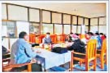
ကောင်စီအဖွဲ့ဝင်များ၏ အစည်းဝေးခြင်း