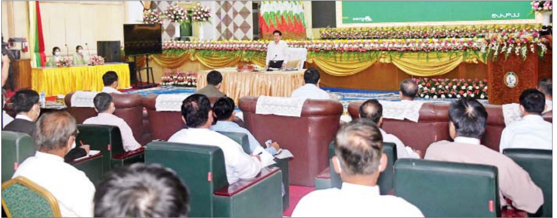
နိုင်ငံတော်စီမံအုပ်ချုပ်ရေးကောင်စီဥက္ကဋ္ဌ နိုင်ငံတော်ဝန်ကြီးချုပ် ဗိုလ်ချုပ်မှူးကြီး မင်းအောင်လှိုင် မကွေးတိုင်းဒေသကြီးအစိုးရအဖွဲ့ဝင်များ၊ ခရိုင်၊ မြို့နယ်အဆင့် ဌာနဆိုင်ရာများ၊ မြို့မိမြို့ဖများနှင့် စိုက်ပျိုးရေး တောင်သူများအားတွေ့ဆုံ၍ ဒေသဖွံ့ဖြိုးတိုးတက်ရေးဆိုင်ရာကိစ္စရပ်များအား ဆွေးနွေးပြောကြားစဉ်။