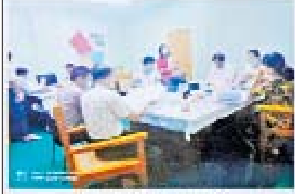
ဒီမိုကရေစီနိုင်ငံ၏ အစည်းဝေးခြင်း