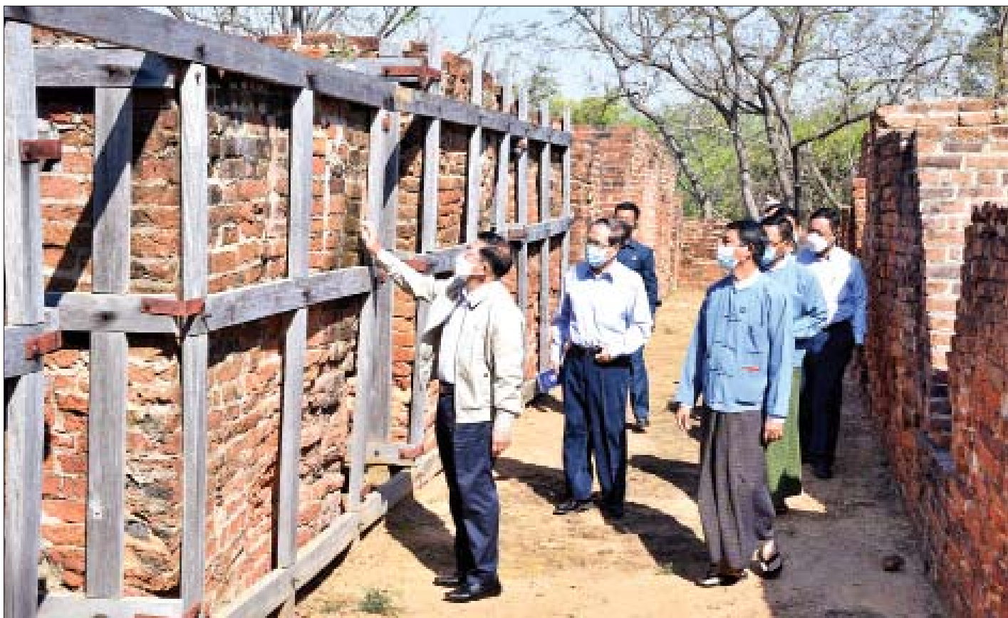
နိုင်ငံတော်စီမံအုပ်ချုပ်ရေးကောင်စီဥက္ကဋ္ဌ နိုင်ငံတော်ဝန်ကြီးချုပ် ဗိုလ်ချုပ်မှူးကြီး မင်းအောင်လှိုင် ကမ္ဘာ့အမွေအနှစ်စာရင်းဝင် ဗိဿနိုးမြို့ဟောင်းအတွင်း ကြည့်ရှုလေ့လာစဉ်။

ထို့နောက် နိုင်ငံတော်စီမံအုပ်ချုပ်ရေးကောင်စီဥက္ကဋ္ဌ နိုင်ငံတော်ဝန်ကြီးချုပ်၊ ဇနီးနှင့်အဖွဲ့ဝင်များသည် ပြတိုက်အတွင်းပြသထားရှိသည့် ဗိဿနိုးမြို့ဟောင်းမြေပုံ၊ မြို့ဝင်ပေါက်၊ မြို့ရိုး၊ ရှေးခေတ်အသုံးအဆောင်ပစ္စည်းများ၊ စာပေဆိုင်ရာအထောက်အထားများ၊ ပျူခေတ်အုတ်များ၊ တော်ဝင်ဗိသုကာများနှင့် ပျူခေတ်အသုံးအဆောင်ပစ္စည်းများ၊ ပြက္ခတ်များကို တစ်ခုချင်းအသေးစိတ် စိတ်ဝင်တစားကြည့်ရှုလေ့လာခဲ့ပြီး တာဝန်ရှိသူများ၏ ရှင်းလင်းတင်ပြမှုများအပေါ် ပြတိုက်အတွင်း ခင်းကျင်းပြသထားသည့် ဓာတ်ပုံများကို အရည်အသွေးကောင်းမွန်ပြီး မြင်ကွင်းကျယ်သည့် ဓာတ်ပုံများဖြစ်ရန်နှင့် ခုနစ်၊ သက္ကရာဇ်များ၊ တူးဖော်ရရှိသည့်နေရာများကို အလွယ်တကူလေ့လာသိရှိနိုင်ရေးအတွက်လည်း ရှင်းလင်းစွာ စာတန်းထိုးထားရန်လိုကြောင်း၊ ရှေးခေတ်လက်ရာဒင်္ဂါးပြားများ၊ လက်ဝတ်ရတနာများကို အနီးကပ်ကြည့်ရှုလေ့လာနိုင်ရေး ခေတ်မီနည်းစနစ်များအသုံးပြု၍ LED Screen များဖြင့် လေ့လာကြည့်ရှုနိုင်အောင် ဆောင်ရွက်ပေးထားရန်လိုကြောင်းနှင့် အခြားလိုအပ်သည်များကို မှာကြားဆွေးနွေးသည်။ ဆက်လက်ပြီး နိုင်ငံတော်စီမံအုပ်ချုပ်ရေး