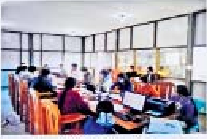
သမ္မတအဖွဲ့ဝင်များ၏ အစည်းဝေးခြင်း