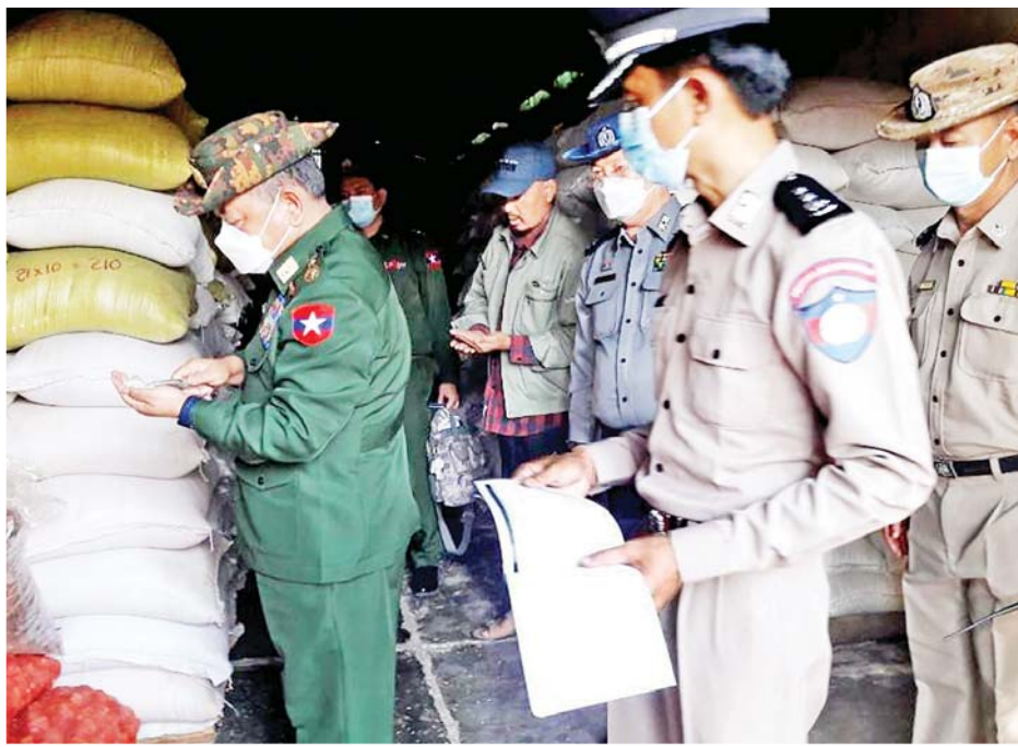
ပြည်ထောင်စုဝန်ကြီး ဒုတိယဗိုလ်ချုပ်ကြီး စိုးထွဋ် လှိုင်ကော်မြို့ အကျဉ်းထောင်အတွင်း ကြည့်ရှု စစ်ဆေးစဉ်။

နေပြည်တော် ဖေဖော်ဝါရီ ၃ ကယားပြည်နယ် လှိုင်ကော်မြို့တွင် ရောက်ရှိ နေသော နိုင်ငံတော်စီမံအုပ်ချုပ်ရေးကောင်စီ အဖွဲ့ဝင် ပြည်ထဲရေးဝန်ကြီးဌာန ပြည်ထောင်စု ဝန်ကြီး ဒုတိယဗိုလ်ချုပ်ကြီးစိုးထွဋ်သည် လှိုင်ကော် အကျဉ်းထောင်အား သွားရောက်ကြည့်ရှုစစ်ဆေးကာ ပြည်နယ်ရဲတပ်ဖွဲ့မှူးရုံး၌ မြန်မာနိုင်ငံရဲတပ်ဖွဲ့ဝင် များနှင့် မိသားစုဝင်များအား တွေ့ဆုံအမှာစကား ပြောကြားသည်။