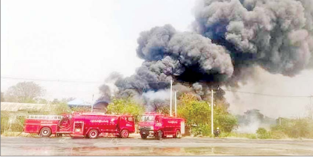
မန္တလေးမြို့၌ ဝိုးဥ၊ ဝိုးရွှင် အထည်အလိပ်စက်ရုံအား အကြမ်းဖက်မီးရှို့ဖျက်ဆီးမှုကို တွေ့ရစဉ်။

ဒီမိုကရေစီပြုပြင်ပြောင်းလဲရေးခရီး သည် လွယ်ကူချောမွေ့သည့် ခရီးစဉ် တော့မဟုတ်ပါ။ ပြည်သူတင်မြှောက် သည့်အစိုးရသည် ကောင်းမွန်သော အုပ်ချုပ်ရေးကို တည်ဆောက်ရမည်၊ ရိုးသားမှု၊ ပွင့်လင်းမြင်သာမှု၊ တရား ဥပဒေ စိုးမိုးမှုစသည်တို့ကို တာဝန်ယူမှု၊ တာဝန်ခံမှုအပြည့်ဖြင့် ကြိုးပမ်း ထမ်းဆောင်ရမည်ဖြစ်သကဲ့သို့ ပြည်သူ လူထုသည်လည်း စည်းလုံးညီညွတ်မှု၊ စည်းကမ်းပြည့်ဝမှုနှင့် တရားဥပဒေ စိုးမိုးစေဖို့ ကူညီထမ်းရွက်ကြဖို့လိုအပ် ပါသည်။ ဒီမိုကရေစီသည်အလိုအလျောက် ရရှိလာမည့် အခွင့်အရေးမဟုတ်၊ ပြည်သူ များက တက်ကြွစွာဖြင့် ဒီမိုကရေစီ