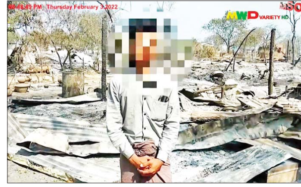
အမျိုးသားတစ်ဦး-လူလတ်ပိုင်း