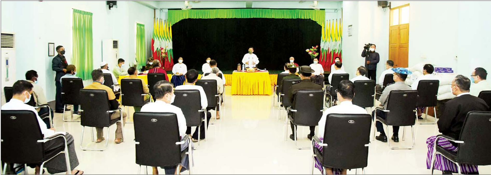
နိုင်ငံတော်စီမံအုပ်ချုပ်ရေးကောင်စီ ဒုတိယဥက္ကဋ္ဌ ဒုတိယတပ်မတော်ကာကွယ်ရေးဦးစီးချုပ် ကာကွယ်ရေးဦးစီးချုပ်(ကြည်း) ဒုတိယဗိုလ်ချုပ်မှူးကြီးစိုးဝင်း လွိုင်ကော်မြို့ရှိ ဘာသာရေးအသင်းအဖွဲ့ခေါင်းဆောင် များအား တွေ့ဆုံအမှာစကားပြောကြားစဉ်။