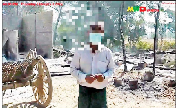
အမျိုးသားတစ်ဦး