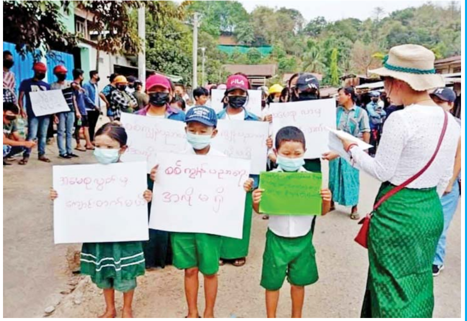
ဒီမိုကရေစီယဉ်ကျေးမှုကို အခြေခံပညာအဆင့်မှစ၍ သင်ကြားလေ့ကျင့်ပေးရမည့်အစား အရွယ်မရောက်သေးသော ကလေးငယ်များ ကျောင်းမတက်ရန် ဝါဒမှိုင်းတိုက်မှုများကို တွေ့ရစဉ်။

★ စာမျက်နှာ ၈ မှ နိုင်ငံရေးဖြတ်သန်းမှု၊ လူမျိုးရေး၊ ဘာသာရေး၊ ယဉ်ကျေးမှု၊ အလေ့အထနှင့် တိုင်းသူပြည်သားများ၏ တန်ဖိုးထားမှု စံနှုန်းများ၊ ပညာအရည်အချင်းများ၊ စိတ်ဓာတ်အခြေအနေများ၊ တွေးခေါ်မှု အယူအဆများ စသည့် မတူညီသည့် အချက်များကို ထည့်သွင်းစဉ်းစားပြီးမှသာ အသင့်လျော်ဆုံးဖြစ်မည့် ဒီမိုကရေစီ ပြုပြင်ပြောင်းလဲမှု (Democratization) အဆင့်ဆင့်ကို ပြည်သူများအားလုံးက ဝိုင်းဝန်းပံ့ပိုးကြရမည့် လိုအပ်မည်ဟု စာရေးသူကတော့ ထင်မြင်မိပါသည်။