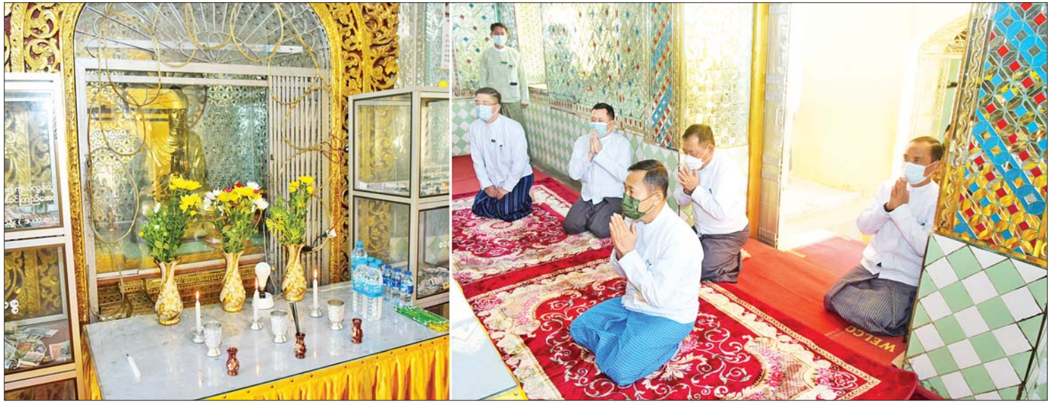
နိုင်ငံတော်စီမံအုပ်ချုပ်ရေးကောင်စီ ဒုတိယဥက္ကဋ္ဌ ဒုတိယတပ်မတော်ကာကွယ်ရေးဦးစီးချုပ် ကာကွယ်ရေးဦးစီးချုပ်(ကြည်း) ဒုတိယဗိုလ်ချုပ်မှူးကြီးစိုးဝင်း လွိုင်ကော်မြို့ရှိ မြို့နယ်ရွှေစေတီတော်အား ဖူးမြော်ကြည်ညိုစဉ်။

နေပြည်တော် ဖေဖော်ဝါရီ ၃ နိုင်ငံတော်စီမံအုပ်ချုပ်ရေးကောင်စီ ဒုတိယဥက္ကဋ္ဌ ဒုတိယတပ်မတော်ကာကွယ်ရေးဦးစီးချုပ် ကာကွယ်ရေးဦးစီးချုပ်(ကြည်း) ဒုတိယဗိုလ်ချုပ်မှူးကြီးစိုးဝင်းသည် အဖွဲ့ဝင်များ၊ ကယားပြည်နယ် ဝန်ကြီးချုပ်၊ အရှေ့ပိုင်းတိုင်းစစ်ဌာနချုပ် တိုင်းမှူး၊ တာဝန်ရှိသူများနှင့်အတူ ယနေ့ နံနက်ပိုင်းတွင် လွိုင်ကော်မြို့ရှိ မြို့နယ်ရွှေစေတီတော်အား သွားရောက်ဖူးမြော်ကြည်ညိုသည်။ ဖူးမြော်ကြည်ညို နိုင်ငံတော်စီမံအုပ်ချုပ်ရေးကောင်စီ ဒုတိယဥက္ကဋ္ဌ ဒုတိယဗိုလ်ချုပ်မှူးကြီးစိုးဝင်းနှင့် အဖွဲ့ဝင်များသည် စေတီတော်အား ပန်း၊ ရေချမ်း၊ ဆီမီးများ ကပ်လှူပူဇော်ကြပြီး စေတီတော်အား လက်ယာရစ်လှည့်လည်ဖူးမြော်ကြည်ညို၍ စေတီတော်