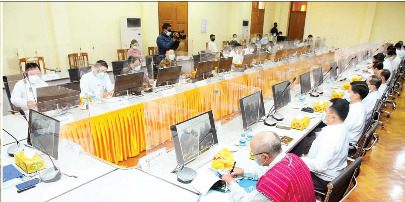
နိုင်ငံတော်စီမံအုပ်ချုပ်ရေးကောင်စီဒုတိယဥက္ကဋ္ဌ ဒုတိယတပ်မတော်ကာကွယ်ရေးဦးစီးချုပ် ကာကွယ်ရေးဦးစီးချုပ်(ကြည်း) ဒုတိယဗိုလ်ချုပ်မှူးကြီးစိုးဝင်း ကယားပြည်နယ်အစိုးရအဖွဲ့ဝင်များ၊ ပြည်နယ်အဆင့်ဌာနဆိုင်ရာများအား တွေ့ဆုံအမှာစကားပြောကြားစဉ်။

နေပြည်တော် ဖေဖော်ဝါရီ ၃ နိုင်ငံတော်စီမံအုပ်ချုပ်ရေးကောင်စီ ဒုတိယဥက္ကဋ္ဌ ဒုတိယတပ်မတော်ကာကွယ်ရေးဦးစီးချုပ် ကာကွယ်ရေးဦးစီးချုပ်(ကြည်း) ဒုတိယဗိုလ်ချုပ်မှူးကြီး စိုးဝင်းသည် နိုင်ငံတော်စီမံအုပ်ချုပ်ရေးကောင်စီဝင်များဖြစ်ကြသည့် စောဒန်နီယယ်၊ ဒုတိယဗိုလ်ချုပ်ကြီး စိုးထွဋ်၊ ကာကွယ်ရေးဦးစီးချုပ်ရုံးမှ တပ်မတော်အရာရှိကြီးများ၊ ကယားပြည်နယ်ဝန်ကြီးချုပ် ဦးဇော်မျိုးတင်၊ အရှေ့ပိုင်းတိုင်းစစ်ဌာနချုပ်တိုင်းမှူး ဗိုလ်ချုပ်နီလင်းအောင်၊ တာဝန်ရှိသူများနှင့်အတူ ယနေ့နံနက်ပိုင်းတွင် ကယားပြည်နယ်အစိုးရအဖွဲ့ဝင်များ၊ ပြည်နယ်အဆင့်ဌာနဆိုင်ရာဝန်ထမ်းများအား ပြည်နယ်အစိုးရအဖွဲ့ရုံးအစည်းအဝေးခန်းမ၌ တွေ့ဆုံအမှာစကား ပြောကြားသည်။