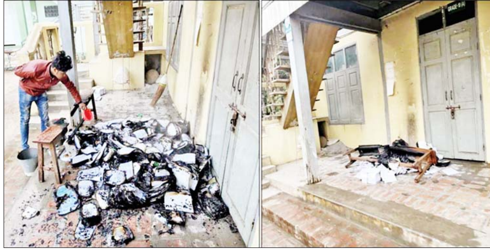
မန္တလေးတိုင်းဒေသကြီး ပုသိမ်ကြီးမြို့နယ် လက်ကောင်းကျေးရွာ အခြေခံပညာအထက်တန်းကျောင်းခွဲမှ သင်ရိုးညွှန်းတမ်းစာအုပ်များအား မီးရှို့ဖျက်ဆီးခဲ့သည့် မှတ်တမ်းဓာတ်ပုံ။

အကြမ်းဖက်သမားများအား ဖော်ထုတ်ဖမ်းဆီးရမိနိုင် စစ်ကြောင်းများနှင့် ပူးပေါင်း၍ ဆက်လက်ဆောင်ရွက် ရေး လုံခြုံရေးတပ်ဖွဲ့ဝင်များက နယ်မြေတပ်မတော် လျက်ရှိကြောင်း သတင်းရရှိသည်။ သတင်းစဉ်