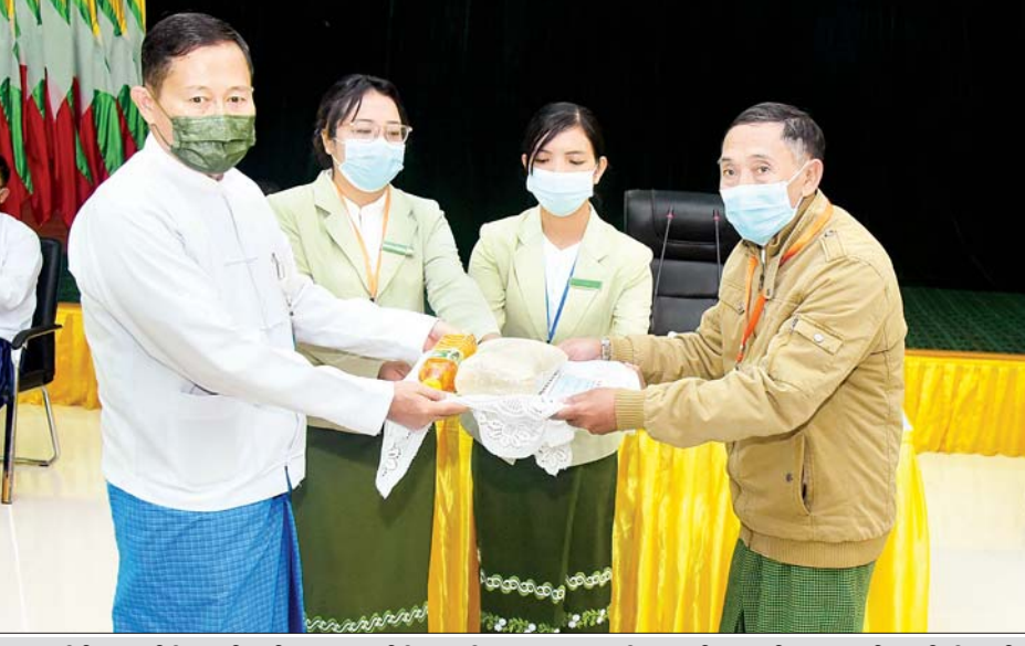
နိုင်ငံတော်စီမံအုပ်ချုပ်ရေးကောင်စီ ဒုတိယဥက္ကဋ္ဌ ဒုတိယတပ်မတော်ကာကွယ်ရေးဦးစီးချုပ် ကာကွယ်ရေးဦးစီးချုပ်(ကြည်း) ဒုတိယဗိုလ်ချုပ်မှူးကြီးစိုးဝင်း ဘာသာရေးအဖွဲ့ခေါင်းဆောင်များအား ဆန်၊ ဆီနှင့် စားသောက်ဖွယ်ရာများ ပေးအပ်စဉ်။

★ ရှေ့ဖုံးမှ သို့မှသာ ကယားပြည်နယ်သည် အမြန်ပြန်လည် တည်ငြိမ်အေးချမ်းစေပြီး မူလအခြေအနေအတိုင်း ဖွံ့ဖြိုးစည်ပင်အောင် ဆောင်ရွက်နိုင်မည်ဖြစ်ကြောင်း၊ အကြမ်းဖက်မှုများနှင့်ပတ်သက်၍ အေးချမ်းမှုကို လိုလားသည့်ပြည်သူများ၊ တာဝန်သိဝန်ထမ်းများ၊ လုံခြုံရေးတပ်ဖွဲ့ဝင်များ ညီညွတ်စွာ ပူးပေါင်းဆောင်ရွက်ခြင်းဖြင့် တားဆီးချေမှုန်းနိုင်မည်ဖြစ်ကြောင်း၊ တိုက်ပွဲဖြစ်ပွားမှုကြောင့် နစ်ဖက်ထိခိုက်ကျဆုံးသော ဆုံးရှုံးမှုများသည် မိမိတို့တိုင်းရင်းသားများသာ ဖြစ်၍ နိုင်ငံအတွက်ထိခိုက်ဆုံးရှုံးမှုပင်ဖြစ်ကြောင်း၊ တစ်နည်းအားဖြင့် နိုင်ငံ၏ လူသားအရင်းအမြစ်များ ဆုံးရှုံးနေခြင်းပင်ဖြစ်ကြောင်း၊ လုံခြုံရေးတပ်ဖွဲ့ဝင်များ အနေဖြင့် ထိတွေ့တိုက်ခိုက်မှုစည်းမျဉ်း ROE နှင့် အညီ ကျင့်သုံးလိုက်နာဆောင်ရွက်စေလျက်ရှိကြောင်း၊ အရေးပေါ်ကာလတစ်လျှောက် အနိမ့်ဆုံး အဆင့် အနည်းဆုံးအင်အားကိုအသုံးပြု၍ ဥပဒေနှင့် အညီ ထိန်းသိမ်းဆောင်ရွက်ခဲ့သော်လည်း အပြစ်မဲ့ ပြည်သူများ သတ်ဖြတ်ခြိမ်းခြောက်ခြင်း၊ ပြည်သူပိုင် အဆောက်အအုံများကို ဖောက်ခွဲဖျက်ဆီးမှုများ လုပ်ဆောင်နေကြောင်း၊ ငှဲညှာစွာ ထိန်းသိမ်း ကိုင်တွယ်မှုကို အခွင့်ကောင်းယူ၍ နိုင်ငံရေးမပါသော အကြမ်းဖက်မှုသက်သက်ကို လုပ်ဆောင်နေကြောင်း၊ ပြည်သူ၏ အသက်အိုးအိမ်စည်းစိမ် ထိခိုက်ပျက်စီးအောင် လုပ်ဆောင်သည်ကို လက်ခံ၍မရကြောင်း။