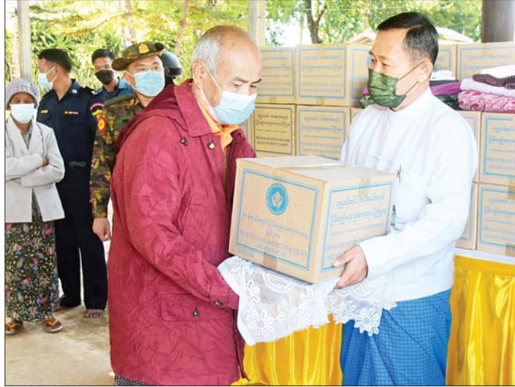
နိုင်ငံတော်စီမံအုပ်ချုပ်ရေးကောင်စီ ဒုတိယဥက္ကဋ္ဌ ဒုတိယတပ်မတော်ကာကွယ်ရေးဦးစီးချုပ် ကာကွယ်ရေးဦးစီးချုပ်(ကြည်း) ဒုတိယဗိုလ်ချုပ်မှူးကြီးစိုးဝင်း တိုက်ပွဲရှောင်ပြည်သူများအား ထောက်ပံ့ရေးပစ္စည်းများ ပေးအပ်စဉ်။