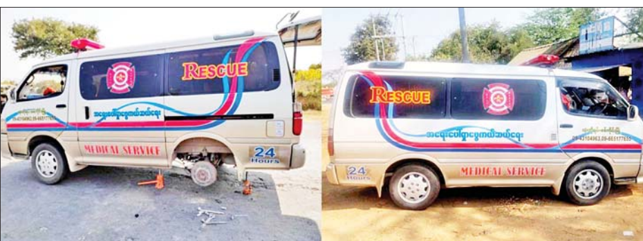
ကိုဗစ်-၁၉ ရောဂါကာကွယ်ဆေး သယ်ဆောင်လာသည့် လူမှုကူညီရေးယာဉ်အား PDF အမည်ခံ အကြမ်းဖက်သမားများက မိုင်းဆွဲတိုက်ခိုက်ခဲ့သည့် မှတ်တမ်းဓာတ်ပုံ။

နေပြည်တော် ဖေဖော်ဝါရီ ၃ စစ်ကိုင်းတိုင်းဒေသကြီးအတွင်းရှိ ပြည်သူများ အား ထိုးနှံပေးမည့် ကိုဗစ်-၁၉ ရောဂါကာကွယ်ဆေး သယ်ဆောင်လာသည့် လူမှုကူညီရေးယာဉ်အား PDF အမည်ခံ အကြမ်းဖက်သမားများက မိုင်းဆွဲတိုက်ခိုက် ခဲ့သဖြင့် လူမှုကူညီရေးယာဉ်တစ်စီး အနည်းငယ် ပျက်စီးခဲ့ကြောင်း သိရသည်။ ဖောက်ခွဲတိုက်ခိုက်ခဲ့ ဖြစ်စဉ်မှာ ဖေဖော်ဝါရီ ၂ ရက်က စစ်ကိုင်းမြို့နယ် အတွင်းရှိ ပြည်သူများအား ထိုးနှံပေးမည့် ကိုဗစ်-၁၉ ရောဂါ