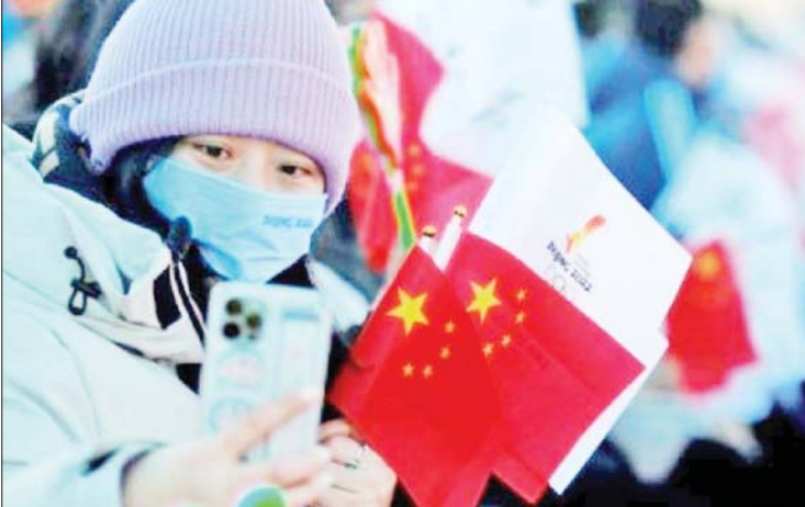
ငွေကြယ် - ရေးသားသည်

ပေကျင်းအိုလံပစ်အားကစားပြိုင်ပွဲနဲ့ ဆက်နွယ်သူတွေထဲက ဖေဖော်ဝါရီလ ၁ ရက်နေ့တစ်ရက်တည်းမှာ ၃၂ ဦးအထိ ကိုဗစ်-၁၉ ရောဂါ ကူးစက်ခံခဲ့ရတယ်လို့ ပေကျင်း ၂၀၂၂ ဆောင်းရာသီအိုလံပစ်အားကစားပြိုင်ပွဲရဲ့ ပြိုင်ပွဲစီစဉ်ဥက္ကဋ္ဌကြားရေးကော်မတီက ဖေဖော်ဝါရီ ၂ ရက်မှာ ပြောကြားခဲ့ပါတယ်။ ကိုဗစ်-၁၉ ရောဂါ ကူးစက်ခံရသူ ၃၂ ဦးအနက် ၁၅ ဦးဟာ လေဆိပ်ကိုအသစ် ရောက်ရှိလာသူတွေဖြစ်တယ်လို့လည်း အိုလံပစ်ပြိုင်ပွဲရဲ့ တရားဝင်ဝက်ဘ်ဆိုက်မှာ ရေးသားဖော်ပြထားပါတယ်။ အိုလံပစ်အားကစားပြိုင်ပွဲ ဝင်ရောက်ယှဉ်ပြိုင်မယ့် အားကစားသမားတွေနဲ့ အသင်းတာဝန်ရှိသူတွေထဲက ကိုးဦးအထိ ကိုဗစ်-၁၉ ရောဂါ ကူးစက်ခံထားရတယ်လို့လည်း အိုလံပစ်ပြိုင်ပွဲရဲ့ တရားဝင်ဝက်ဘ်ဆိုက်မှာ ဖော်ပြထားပါတယ်။