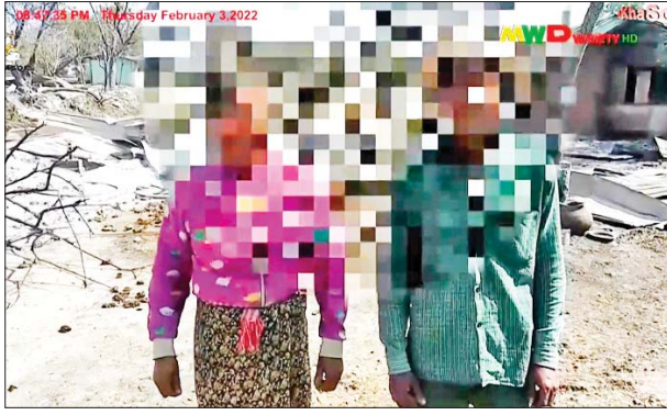
အမျိုးသမီးတစ်ဦး