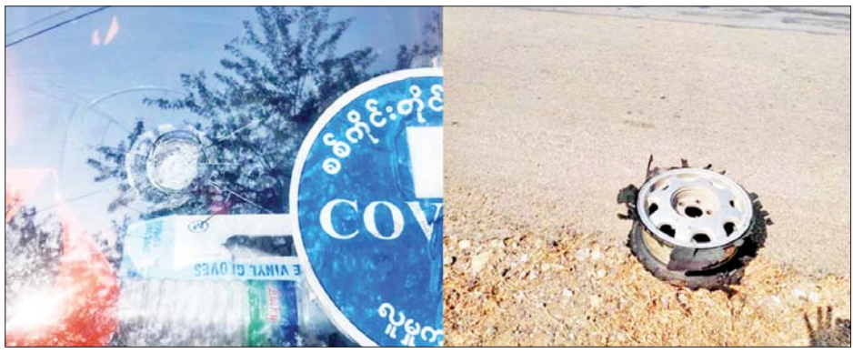
ကိုဗစ်-၁၉ ရောဂါကာကွယ်ဆေး သယ်ဆောင်လာသည့် လူမှုကူညီရေးယာဉ်အား PDF အမည်ခံ အကြမ်းဖက်သမားများက မိုင်းဆွဲတိုက်ခိုက်မှုကြောင့် ပျက်စီးခဲ့မှု မှတ်တမ်းဓာတ်ပုံ။

ထိုကဲ့သို့ ပြည်သူများအား ထိုးနှံပေးမည့် ကိုဗစ်-၁၉ ကာကွယ်ဆေးများ သယ်ဆောင်လာသည့် လူမှုကူညီရေးယာဉ်များအား မိုင်းဆွဲတိုက်ခိုက်ခဲ့သည့်