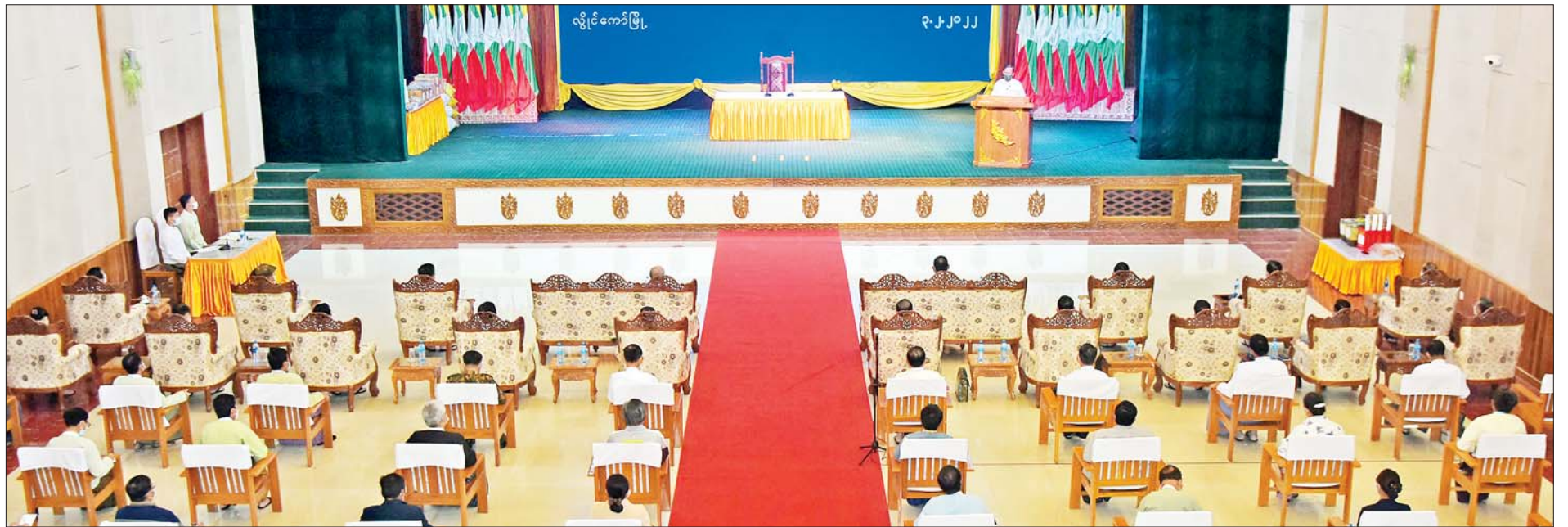
နိုင်ငံတော်စီမံအုပ်ချုပ်ရေးကောင်စီဒုတိယဥက္ကဋ္ဌ ဒုတိယတပ်မတော်ကာကွယ်ရေးဦးစီးချုပ် ကာကွယ်ရေးဦးစီးချုပ်(ကြည်း) ဒုတိယဗိုလ်ချုပ်မှူးကြီးစိုးဝင်း ကယားပြည်နယ်ရှိ ခရိုင်၊ မြို့နယ်အဆင့် ဌာနဆိုင်ရာ ဝန်ထမ်းများနှင့် မြို့မိမြို့ဖများအား တွေ့ဆုံအမှာစကားပြောကြားစဉ်။

နေပြည်တော် ဖေဖော်ဝါရီ ၃ နိုင်ငံတော်စီမံအုပ်ချုပ်ရေးကောင်စီ ဒုတိယဥက္ကဋ္ဌ ဒုတိယတပ်မတော်ကာကွယ်ရေးဦးစီးချုပ် ကာကွယ်ရေးဦးစီးချုပ်(ကြည်း) ဒုတိယဗိုလ်ချုပ်မှူးကြီးစိုးဝင်းသည် ခရီးစဉ်တွင် လိုက်ပါလာသည့် အဖွဲ့ဝင်များ၊ ကယားပြည်နယ်ဝန်ကြီးချုပ်၊ အရှေ့ပိုင်းတိုင်းစစ်ဌာနချုပ်တိုင်းမှူး၊ တာဝန်ရှိသူများနှင့်အတူ ကယားပြည်နယ်ရှိ ခရိုင်၊ မြို့နယ်အဆင့် ဌာနဆိုင်ရာ ဝန်ထမ်းများနှင့် မြို့မိမြို့ဖများအား ယနေ့နံနက်ပိုင်းတွင် လွိုင်ကော်မြို့ရှိ ပြည်နယ်ခန်းမ၌ တွေ့ဆုံအမှာစကားပြောကြားသည်။