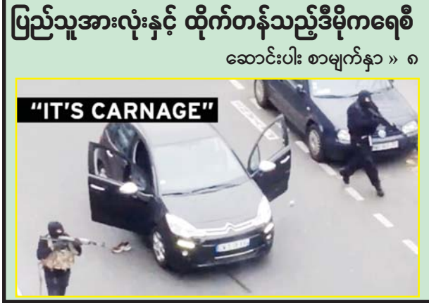
ပြည်သူ့အားလုံးနှင့် ထိုက်တန်သည့်ဒီမိုကရေစီ ဆောင်းပါး စာမျက်နှာ » ၈

နေပြည်တော် ဖေဖော်ဝါရီ ၃ နိုင်ငံတော်စီမံအုပ်ချုပ်ရေးကောင်စီ ဒုတိယဥက္ကဋ္ဌ ဒုတိယတပ်မတော်ကာကွယ်ရေးဦးစီးချုပ် ကာကွယ်ရေးဦးစီးချုပ်(ကြည်း) ဒုတိယဗိုလ်ချုပ်မှူးကြီး စိုးဝင်းသည် ခရီးစဉ်တွင် လိုက်ပါလာသည့် အဖွဲ့ဝင် များ၊ ကယားပြည်နယ်ဝန်ကြီးချုပ်ဦးဇော်မျိုးတင်၊ အရှေ့ပိုင်းတိုင်းစစ်ဌာနချုပ်တိုင်းမှူး ဗိုလ်ချုပ်နီလင်းအောင်၊ တာဝန်ရှိသူများလိုက်ပါ၍ လွိုင်ကော်မြို့ရှိ RC ခရစ်ယာန်ဘာသာ၊ အစ္စလာမ်ဘာသာ၊ ဟိန္ဒူဘာသာ၊ ဂေဟထိုးဘိုး (တံခွန်တိုင်)အဖွဲ့များမှ ဘာသာရေးခေါင်းဆောင်များအား ယနေ့တွင် ပြည်နယ်အစိုးရအဖွဲ့ရုံးခန်းမ၌ တွေ့ဆုံသည်။ ဦးစွာ နိုင်ငံတော်စီမံအုပ်ချုပ်ရေးကောင်စီ ဒုတိယဥက္ကဋ္ဌ ဒုတိယ ဗိုလ်ချုပ်မှူးကြီး စိုးဝင်းက အဖွဲ့အမှာ စကားပြောကြားရာတွင် ပြည်နယ်အကျိုးအတွက် ဘာသာရေးအသင်းအဖွဲ့များ၏ ပူးပေါင်းပါဝင်ပံ့ပိုးကူညီမှု သည် အရေးကြီးကြောင်း၊ ဘာသာရေးခေါင်းဆောင်များသည် ဒေသအလိုက်၊ ဘာသာအလိုက် ကိုးကွယ်သူ ဘာသာဝင်များအပေါ် သက်ရောက်မှုကြီးသူများဖြစ်၍ ဒေသ၏အကျိုးစီးပွားအတွက် ထိရောက်သော စွမ်းဆောင်ပေးနိုင်သူများဖြစ်ကြောင်း၊ ဘာသာရေး၏ အဆုံးအမတရားတို့ဖြင့် ဒေသကိုတည်ငြိမ်အေးချမ်း စေရေး ပူးပေါင်းဆောင်ရွက်ရန်လိုကြောင်း၊ စာမျက်နှာ ၃ ကော်လံ ၁ သို့ ၁၄