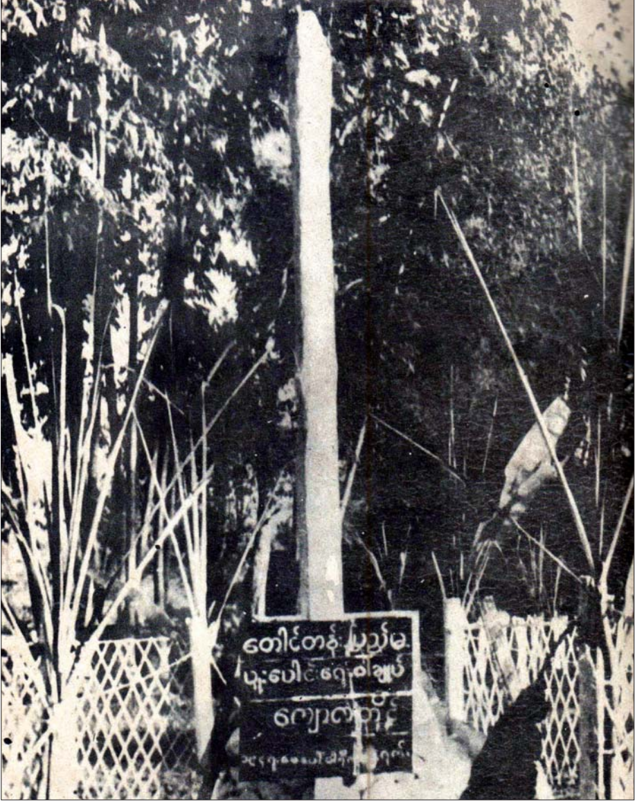
၁၉၄၇ ခုနှစ် ဖေဖော်ဝါရီ ၁၂ ရက်တွင် ပင်လုံစာချုပ်ကြီးကို အောင်မြင်စွာချုပ်ဆိုခဲ့သည့် အထိမ်းအမှတ်အဖြစ် စိုက်ထူခဲ့သော “တောင်တန်း- ပြည်မ ပူးပေါင်းရေးစာချုပ်” ကျောက်တိုင်

အာမခံချက်အပြည့်အဝရှိတဲ့ အနာဂတ်ကို လည်း မျှော်မှန်းလို့မရနိုင်ပါဘူး။ ဒါကြောင့် စည်းလုံး ညီညွတ်ရေး တစ်နည်းအားဖြင့် ပြည်ထောင်စု စိတ်ဓာတ်ဟာ နိုင်ငံသားတစ်ယောက်ချင်းစီမှာ ကိန်းဝပ်နေမှသာလျှင် ပြည်ထောင်စုနိုင်ငံတစ်ခုဟာ အမှန်တကယ် ဖွံ့ဖြိုးတိုးတက်ဖို့ မျှော်မှန်းနိုင်မယ် လို့ဆိုရမှာဖြစ်ပါတယ်။