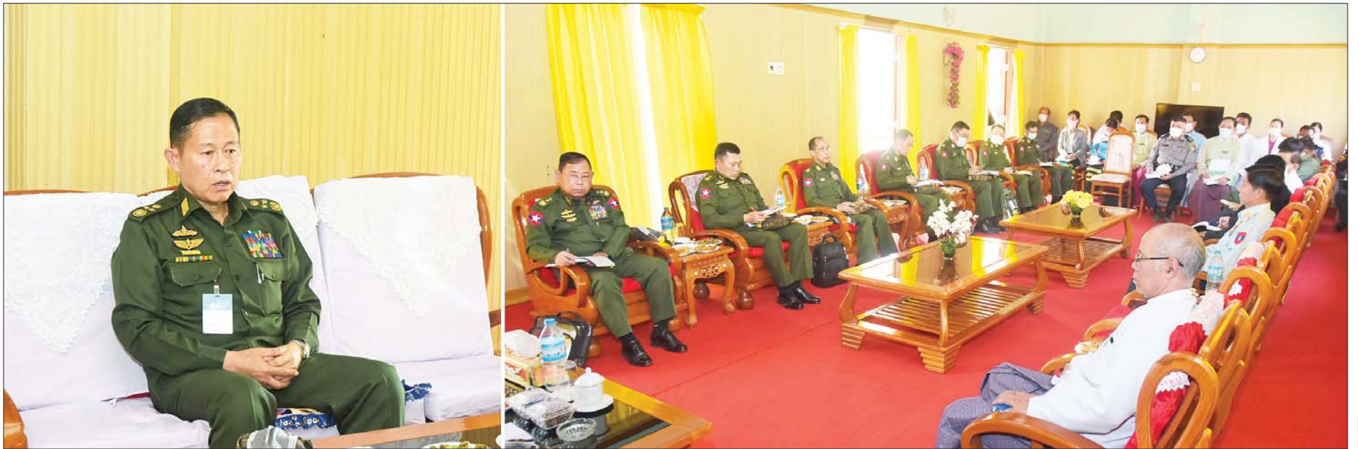
နိုင်ငံတော်စီမံအုပ်ချုပ်ရေးကောင်စီ ဒုတိယဥက္ကဋ္ဌ ဒုတိယတပ်မတော်ကာကွယ်ရေးဦးစီးချုပ် ကာကွယ်ရေးဦးစီးချုပ်(ကြည်း) ဒုတိယဗိုလ်ချုပ်မှူးကြီး စိုးဝင်း ဘောလခဲမြို့ရှိ ဌာနဆိုင်ရာများနှင့် မြို့မိမြို့ဖ များအား တွေ့ဆုံအမှာစကားပြောကြားစဉ်။

နေပြည်တော် ဖေဖော်ဝါရီ ၂ နိုင်ငံတော်စီမံအုပ်ချုပ်ရေးကောင်စီ ဒုတိယဥက္ကဋ္ဌ ဒုတိယတပ်မတော်ကာကွယ်ရေးဦးစီးချုပ် ကာကွယ်ရေးဦးစီးချုပ်(ကြည်း) ဒုတိယဗိုလ်ချုပ်မှူးကြီး စိုးဝင်းသည် နိုင်ငံတော်စီမံအုပ်ချုပ်ရေးကောင်စီဝင်များဖြစ်ကြသည့် စောဒန်နီယယ်၊ ဒုတိယဗိုလ်ချုပ်ကြီးစိုးထွဋ်၊ ကာကွယ်ရေးဦးစီးချုပ်မှူး တပ်မတော်အရာရှိကြီးများ၊ တာဝန်ရှိသူများလိုက်ပါ၍ ယနေ့တွင် ဘောလခဲမြို့ရှိ ဌာနဆိုင်ရာတာဝန်ရှိသူများ၊ မြို့မိမြို့ဖများအား နယ်မြေခံတပ်ဧည့်ရိပ်သာ၌ သွားရောက်တွေ့ဆုံ အမှာစကား ပြောကြားသည်။ အခက်အခဲများစွာ ကျော်လွှား ထိုသို့ တွေ့ဆုံအမှာစကားပြောကြားရာတွင် နိုင်ငံတော်စီမံအုပ်ချုပ်ရေးကောင်စီ အနေဖြင့် အရေးပေါ်ကာလ တစ်နှစ်ကို အခက်အခဲများစွာဖြင့် ကျော်လွှားခဲ့ရကြောင်း၊ အချို့သော ဝန်ထမ်းများသည် နိုင်ငံ၏မျက်နှာကိုမကြည့်ဘဲ CDM လုပ်ဆောင်ခဲ့၍ ဆူပူအကြမ်းဖက်မှုကိုမလိုလားသည့် ဝန်ထမ်းကောင်းများဖြင့် ကြိုးပမ်းဆောင်ရွက်ခဲ့ကြောင်း၊ ပြည်တွင်း၊ ပြည်ပ ဖိအားမျိုးစုံကို ကြုံတွေ့ခဲ့ရသော်လည်း ပြည်သူများ၏ ပူးပေါင်းပါဝင်မှုဖြင့် အောင်မြင်အောင် ဖြတ်သန်းခဲ့ကြောင်း၊ ကြီးမားသော စိန်ခေါ်မှုအဖြစ် ကိုဗစ်-၁၉ ရောဂါ ကာကွယ် ထိန်းချုပ်၊ ကုသမှုပင်ဖြစ်ကြောင်း၊ နိုင်ငံအချို့နှင့် INGO အဖွဲ့အချို့အနေဖြင့် မိမိတို့နိုင်ငံအား ကိုဗစ်-၁၉ ရောဂါအပေါ်