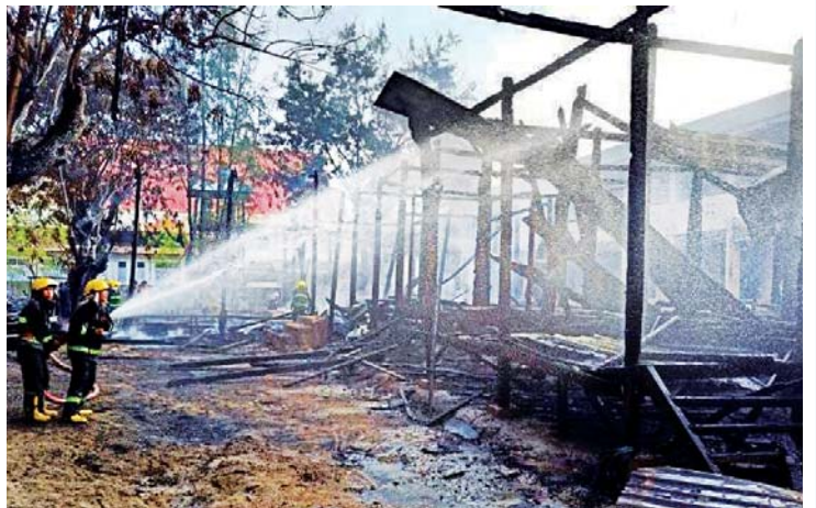
ဒီမိုကရေစီလိုလားပါသည်ဆိုသော CRPH၊ NUG၊ PDF အကြမ်းဖက်သမားများက ကလေးမြို့ တောင်ဖီလာရပ်ကွက်ရှိ စာသင်ကျောင်းအား မီးရှို့ဖျက်ဆီးထားမှုကို တွေ့ရစဉ်။

တိုက်ရိုက်ဒီမိုကရေစီသည် နိုင်ငံရေးအသိဉာဏ်မြှင့်မားသော လူထုက နိုင်ငံအကြီးအကဲကို တိုက်ရိုက်မဲပေးရွေးကောက်တင်မြှောက်သည့်နည်းဖြစ်သည်။ ကိုယ်စားပြုဒီမိုကရေစီတွင် လွှတ်တော်မဏ္ဍိုင်နှင့် လွှတ်တော်ကိုယ်စားလှယ်များက အစိုးရနှင့်အစိုးရအကြီးအကဲထက် ပို၍အားကောင်းသည်ကိုပြသည်။ ဖွဲ့စည်းပုံအခြေခံဥပဒေဘောင်အတွင်းကျင့်သုံးသော ဒီမိုကရေစီတွင် ဖွဲ့စည်းပုံအခြေခံဥပဒေကို