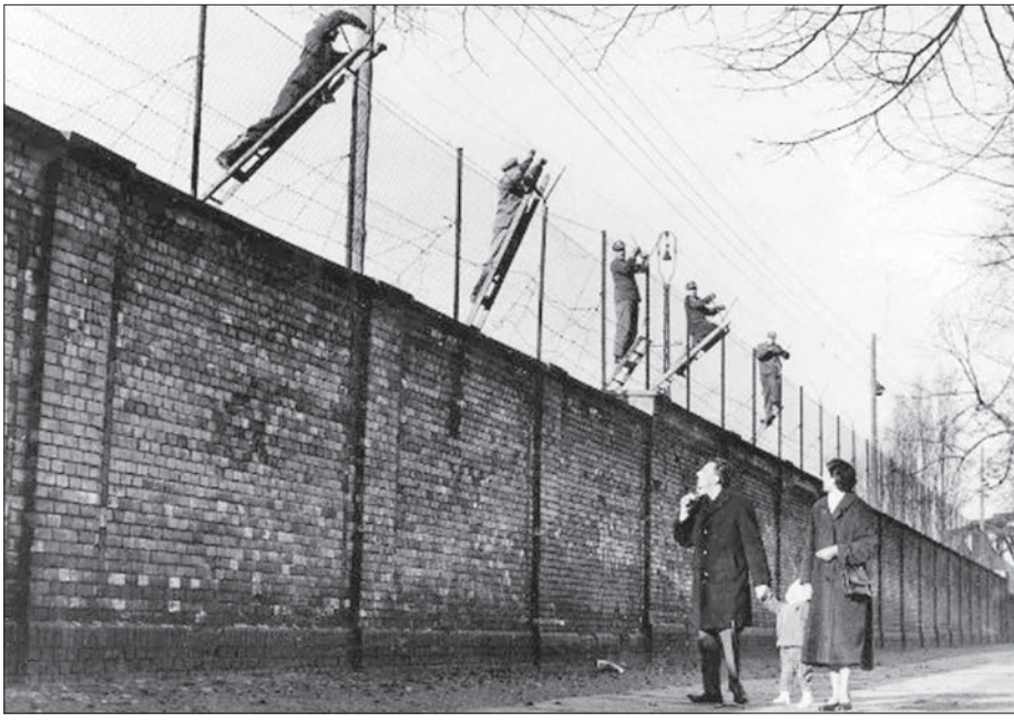
အရှေ့ဂျာမနီနှင့် အနောက်ဂျာမနီတို့ကို ပိုင်းခြားထားသည့် ဘာလင်တံတိုင်းကြီး။

အားလုံး ပေါင်းစည်းညီညာသည့် တော်လှန်ရေးအဖွဲ့၊ တစ်နည်းအားဖြင့် ဖက်ဆစ်တိုက်ဖျက်ရေး ပြည်သူ့ လွတ်မြောက်ရေးအဖွဲ့ကို ဖွဲ့စည်းခဲ့သည်။ ထိုအဖွဲ့ တွင် မြန်မာတိုင်းရင်းသားအစုအလင် လူတန်းစား မျိုးစုံ၊ ပါတီစုံ၊ ကွန်မြူနစ်ဝါဒ၊ အရင်းရှင်ဝါဒ၊ ဆိုရှယ်လစ်ဝါဒ ယုံကြည်သူများ၏ ပါတီအဖွဲ့ဝင်များ ပါဝင်ခဲ့ပေသည်။ သို့သော်အမျိုးသားရေးဝါဒ၊ တစ်နည်းအားဖြင့် မြန်မာတိုင်းရင်းသားများဟူသည့် တစ်အူထုံးဆင်း မောင်ရင်းနှမစိတ်ထားက အားလုံး၏ ရင်ထဲ၊ အသည်းထဲ၊ ဦးနှောက်ထဲ ကိန်းအောင်းသည့်အတွက် စည်းလုံးခဲ့၊ ညီညွတ်ခဲ့၍ အင်္ဂလိပ်တို့နှင့် ပြန်ပေါင်း ကာ ဂျပန်ကို ပြန်လည်မောင်းထုတ်နိုင်ခဲ့သည်။ ရောင်ပြ “အာရှတန်းတူဝါဒ” မှိုင်းကြားက မိမိတို့၏ အမျိုးမှန်၊ အဖိုးတန် အမျိုးသားညီညွတ်ရေးဝါဒကို မြင်အောင်ကြည့်နိုင်ခဲ့သည်။