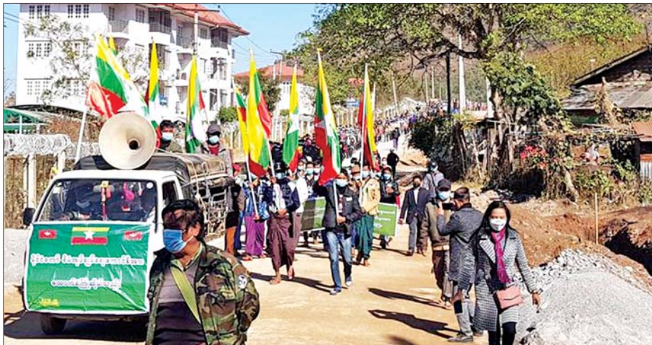
တောင်ကြီးမြို့၌ နိုင်ငံတော်စီမံအုပ်ချုပ်ရေးကောင်စီအား ထောက်ခံပွဲပြုလုပ်စဉ်။

နေပြည်တော် ဖေဖော်ဝါရီ ၂၂ ၂၀၂၁ ခုနှစ် ဖွဲ့စည်းပုံအခြေခံ ဥပဒေနှင့်အညီ ဆောင်ရွက်လျက် ရှိသည့် နိုင်ငံတော်စီမံအုပ်ချုပ်ရေးကောင်စီအား ထောက်ခံပွဲကို ယနေ့တွင် ရှမ်းပြည်နယ် (မြောက်ပိုင်း) နမ့်လန်မြို့၌ လည်းကောင်း၊ ရှမ်းပြည်နယ် (တောင်ပိုင်း)အတွင်းရှိ မြို့နယ် ခုနစ်မြို့နယ်တို့၌ လည်းကောင်း၊ ရန်ကုန်တိုင်းဒေသကြီး ဗဟန်းမြို့နယ်၊ ရန်ကင်းမြို့နယ်နှင့် သန်လျင်မြို့နယ်တို့၌ လည်းကောင်း၊ မန္တလေးတိုင်းဒေသကြီး မြင်းခြံမြို့နယ်နှင့် တောင်သာမြို့နယ်တို့၌ လည်းကောင်း၊ ပဲခူးတိုင်းဒေသကြီး အတွင်းရှိ မြို့နယ် လေးမြို့နယ်တို့၌ လည်းကောင်း ပြုလုပ်ကြပြီး ဆန္ဒဖော်ထုတ်ခဲ့ကြသည်။