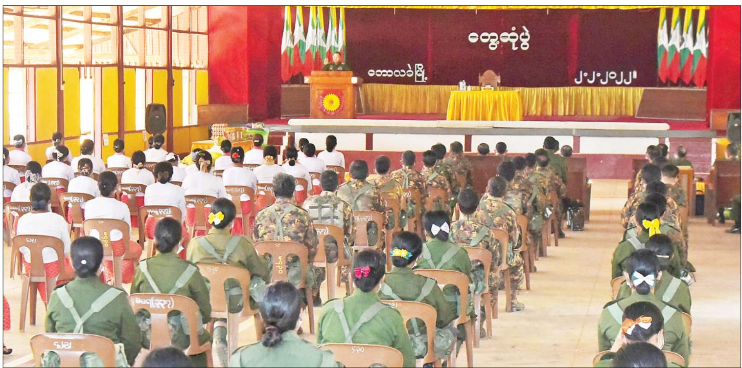
နိုင်ငံတော်စီမံအုပ်ချုပ်ရေးကောင်စီဒုတိယဥက္ကဋ္ဌ ဒုတိယတပ်မတော်ကာကွယ်ရေးဦးစီးချုပ် ကာကွယ်ရေးဦးစီးချုပ်(ကြည်း) ဒုတိယဗိုလ်ချုပ်မှူးကြီးစိုးဝင်း ဘောလခဲ တပ်နယ်မှ အရာရှိ၊ စစ်သည်၊ မိသားစုများအား တွေ့ဆုံအမှာစကားပြောကြားစဉ်။

နေပြည်တော် ဖေဖော်ဝါရီ ၂ နိုင်ငံတော်စီမံအုပ်ချုပ်ရေးကောင်စီ ဒုတိယဥက္ကဋ္ဌ ဒုတိယတပ်မတော် ကာကွယ်ရေးဦးစီးချုပ် ကာကွယ်ရေး ဦးစီးချုပ်(ကြည်း) ဒုတိယဗိုလ်ချုပ်မှူးကြီး စိုးဝင်းသည် ကာကွယ်ရေးဦးစီးချုပ်ရုံးမှ တပ်မတော်အရာရှိကြီးများနှင့် တာဝန်ရှိ သူများလိုက်ပါ၍ ယနေ့နံနက်ပိုင်းတွင် ဖားဆောင်း၊ ဘောလခဲ၊ ဖရူဆိုတပ်နယ် များမှ အရာရှိ၊ စစ်သည် မိသားစုများအား တပ်နယ်ခန်းမ၌ သီးခြားစီ သွားရောက် တွေ့ဆုံ၍ အမှာစကားပြောကြားသည်။ ထိုသို့တွေ့ဆုံအမှာစကားပြောကြား ရာတွင် တပ်မတော်အနေဖြင့် ၂၀၂၀ ပြည့်နှစ် ပါတီစုံဒီမိုကရေစီအထွေထွေ ရွေးကောက်ပွဲပြီးနောက် ဒီမိုကရေစီ လမ်းကြောင်းမှ သွေဖည်၍ မဲသမာမှု ၁၀ ဒသမ ၄ သန်းကျော် ဖြစ်ပေါ်နေမှုကို သက်ဆိုင်ရာ ရွေးကောက်ပွဲကော်မရှင်၊ ပြည်ထောင်စုလွှတ်တော်နှင့် အမျိုးသား ကာကွယ်ရေးနှင့် လုံခြုံရေးကောင်စီတို့သို့ စာမျက်နှာ ၅ ကော်လံ ၁ သို့