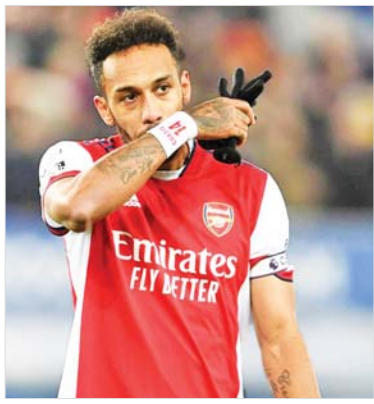
အင်္ဂလိပ်အသင်း

အင်္ဂလိပ်အသင်းအတွက် ပွဲစဉ် ၁၆၃ ပွဲမှာ သွင်းဂိုး ၉၂ ဂိုးအထိ သွင်းယူပေးနိုင်ခဲ့ ပေမယ့် ဒီဇင်ဘာလကတည်းက အင်္ဂလိပ်အသင်းနဲ့ အတူ ပုံမှန်ပွဲထွက်ကစားခွင့် ပျောက်ဆုံးခဲ့တာကြောင့် အင်္ဂလိပ်အသင်းအသင်းကနေ ဘာစီလိုနာ အသင်းဆီ ပြောင်းရွှေ့ခဲ့တာ ဖြစ်ပါတယ်။