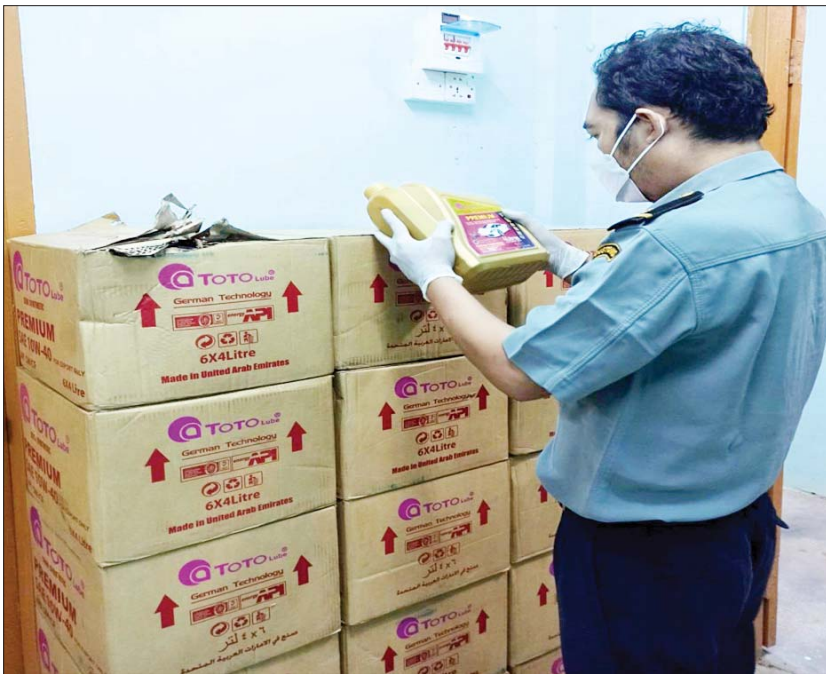
ပဲခူးတိုင်းဒေသကြီး၌ သိမ်းဆည်းရမိခဲ့သည့် တရားမဝင် စက်သုံးဆီများ။

ပို့ကုန်သွင်းကုန်ဥပဒေနှင့်အညီ အရေးယူ ဆောင်ရွက်လျက်ရှိသည်။ သို့ပါ၍ ဖေဖော်ဝါရီ ၁ ရက်နှင့် ၂ ရက် တို့တွင် ဖမ်းဆီးရမိမှုစုစုပေါင်းမှာ အမှုတွဲ သုံးမျှ ခန့်မှန်းတန်ဖိုးငွေကျပ် ၆၃၁၄၅၀ ဖြစ်ကြောင်း တရားမဝင်ကုန်သွယ်မှု တိုက်ဖျက်ရေး ဦးဆောင်ကော်မတီမှ သိရသည်။ သတင်းစဉ်