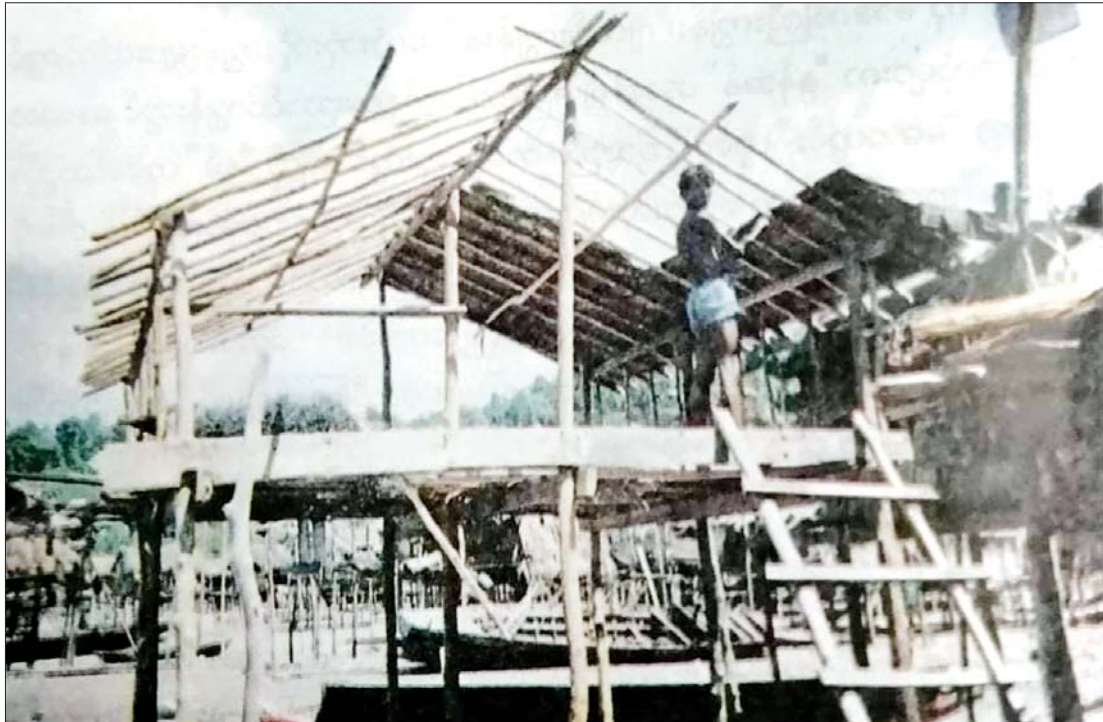
ဆလုံတိုင်းရင်းသားတို့၏ နေအိမ်ဆောက်လုပ်နေစဉ်။

အများအားဖြင့် နဖူးမကျဉ်းမကျယ်၊ မျက်ခုံးကောင်းကောင်း၊ မျက်ရစ်ပေါ်ပြီး မျက်ဆန်ညိုသည်။ နှာခေါင်းအနည်းငယ် ပြားပြီး နှုတ်ခမ်းအနည်းငယ်ထူသည်။ မေးရိုးကားကာ နားရွက်မှာ အနေတော်မျှသာဖြစ်ကြောင်း ဆလုံတိုင်းရင်းသားတို့၏ ရုပ်လက္ခဏာအဖြစ် မှတ်သားဖူးပါသည်။