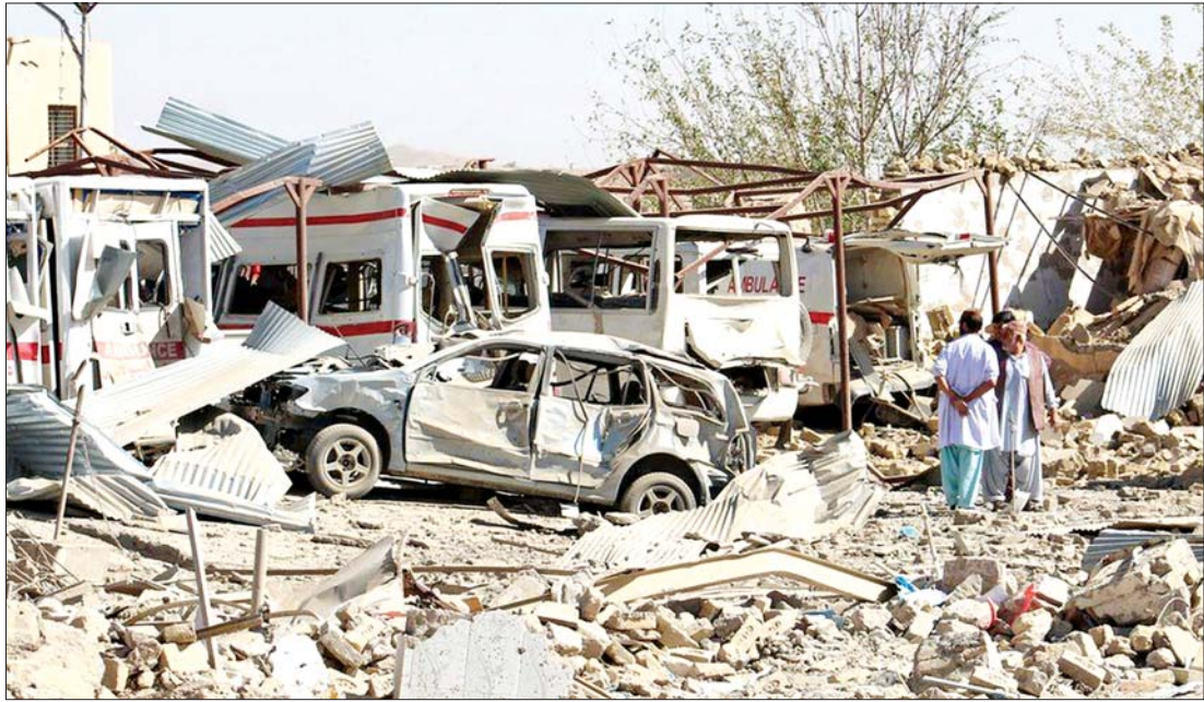
အာဖဂန်တွင် အမေရိကန်ဒီမိုကရက်တို့ နှစ် ၂၀ ခန့် ဒီမိုကရေစီစနစ်ဖြင့် အုပ်ချုပ်ခဲ့သော်လည်း နောက်ဆုံးတွင် အကြမ်းဖက်မှုများနှင့် ပျက်စီးဆုံးရှုံးမှုများသာ ကျန်ရစ်ခဲ့သည်။

အမေရိကန်သည်ပင် Deficient democracy ဟုခေါ်သည့် ဒီမိုကရေစီ အရည်အသွေးမပြည့်မီ ချို့တဲ့သည့်အုပ်စုတွင် ပါဝင်နေသည်ကို သတိထားမိသည်။ ထုတ်ပြန်ချက်အရ မြန်မာနိုင်ငံက