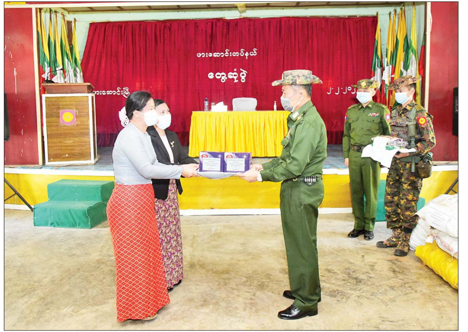
နိုင်ငံတော်စီမံအုပ်ချုပ်ရေးကောင်စီ ဒုတိယဥက္ကဋ္ဌ ဒုတိယတပ်မတော်ကာကွယ်ရေးဦးစီးချုပ် ကာကွယ်ရေးဦးစီးချုပ်(ကြည်း) ဒုတိယဗိုလ်ချုပ်မှူးကြီးစိုးဝင်း ဖရူဆိုတပ်နယ်ရှိ အရာရှိ၊ စစ်သည်၊ မိသားစုများအတွက် စားသောက်ဖွယ်ရာများ ပေးအပ်ရာ တာဝန်ရှိသူများက လက်ခံရယူစဉ်။