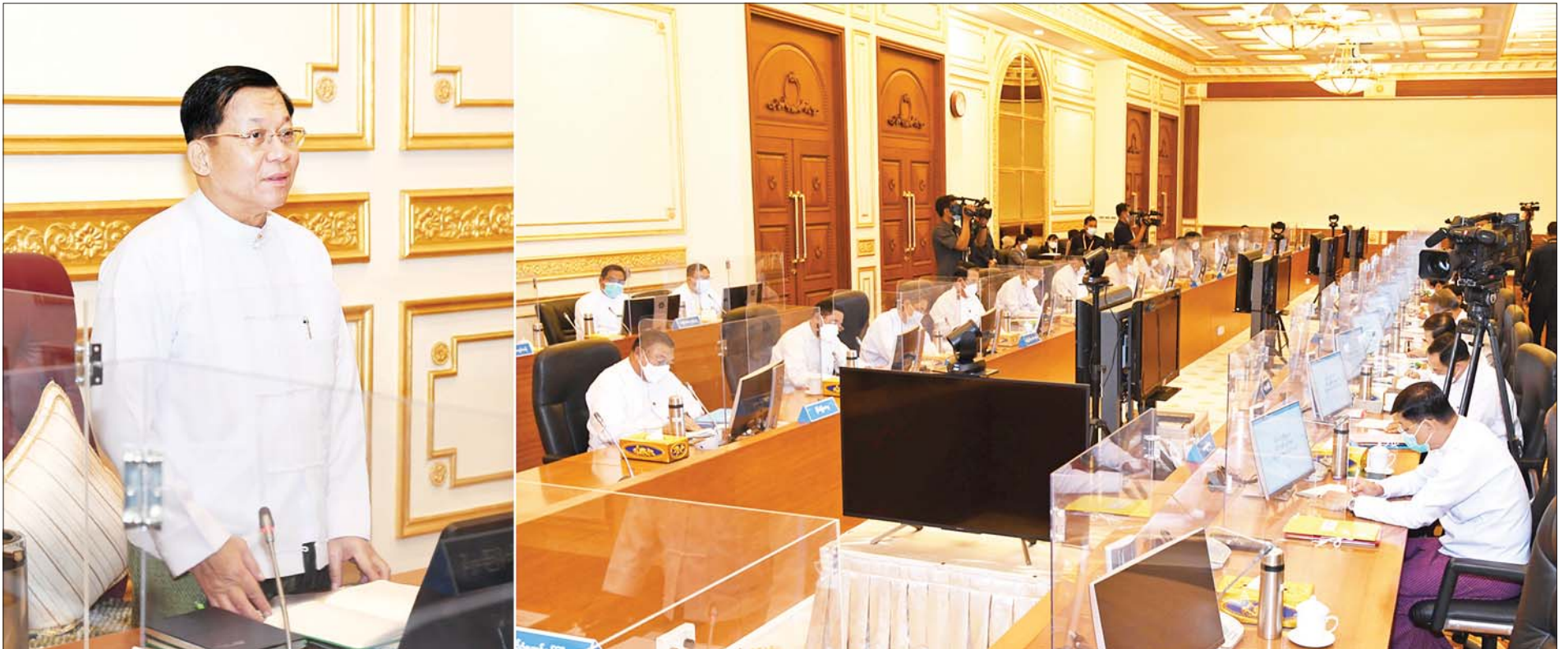
နိုင်ငံတော်စီမံအုပ်ချုပ်ရေးကောင်စီဥက္ကဋ္ဌ နိုင်ငံတော်ဝန်ကြီးချုပ် ဗိုလ်ချုပ်မှူးကြီးမင်းအောင်လှိုင် ပြည်ထောင်စုသမ္မတမြန်မာနိုင်ငံတော် ပြည်ထောင်စုအစိုးရအဖွဲ့ အစည်းအဝေးအမှတ်စဉ် (၁/၂၀၂၂) တွင် အမှာစကား ပြောကြားစဉ်။