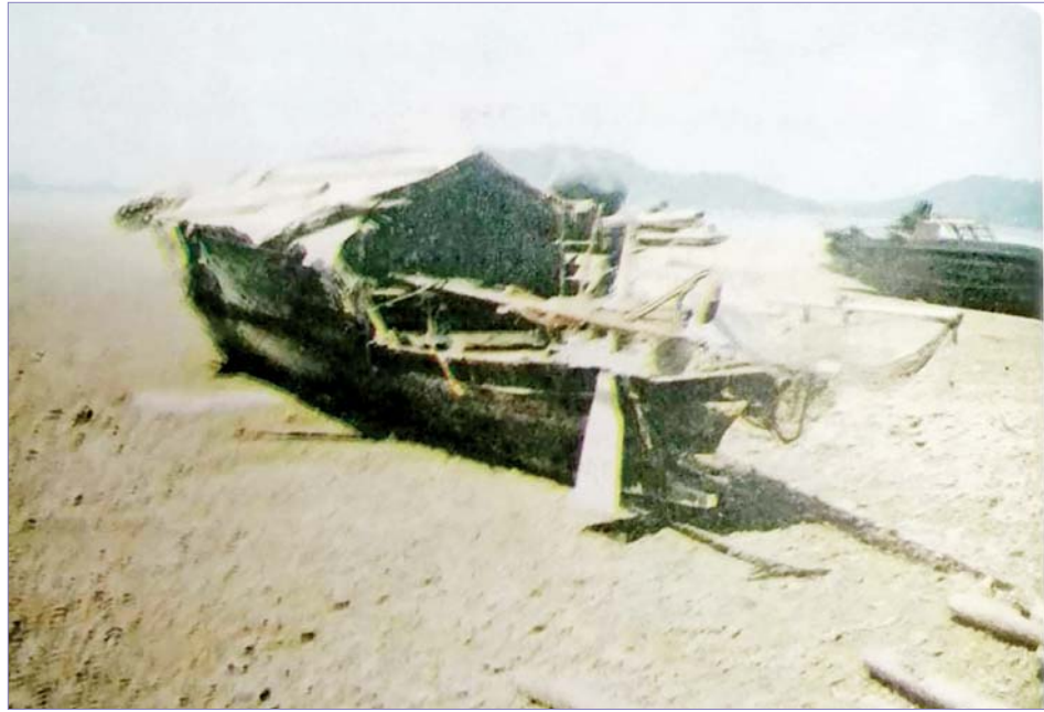
ဆလုံရိုးရာလှေအိမ်။

ရည်ညွှန်းနှင့် ဓာတ်ပုံ။ ။ ဆလုံတိုင်းရင်းသားများ လူမှုစီးပွားရေးဘဝ၊ ပါမောက္ခ ဒေါ်တင်ရီနှင့်အဖွဲ့