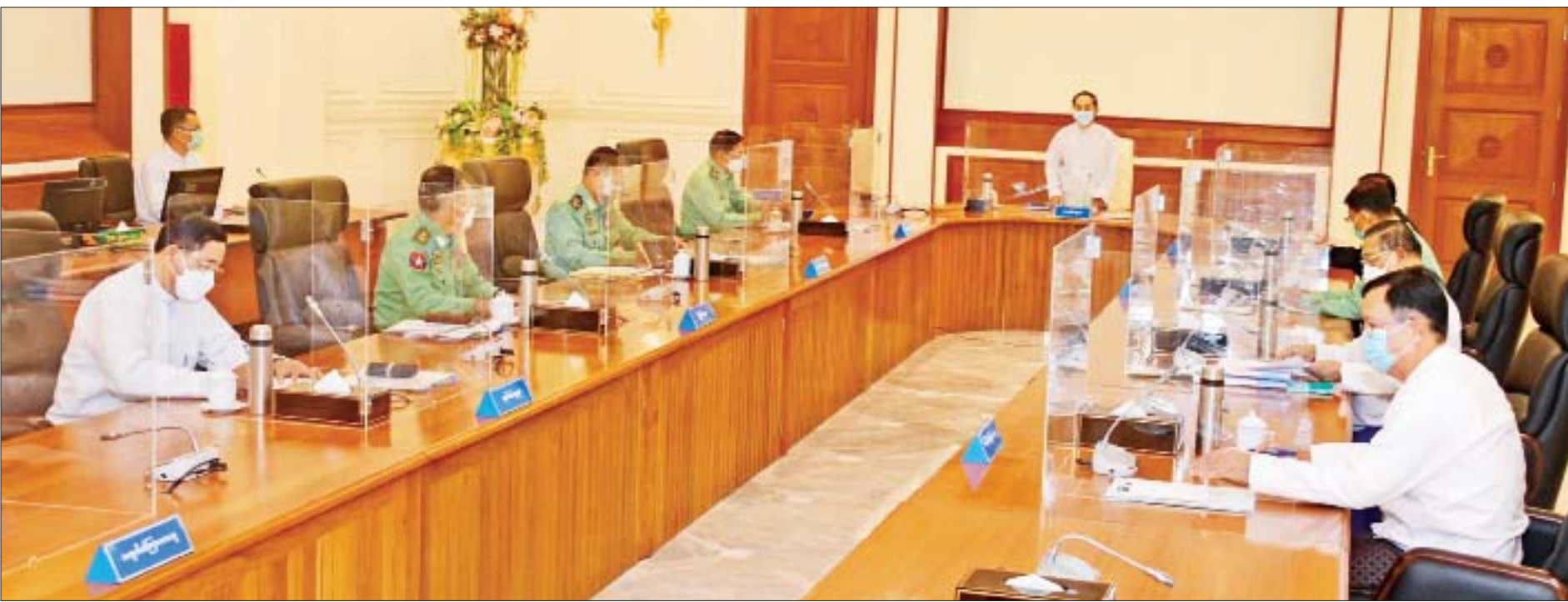
ယာယီသမ္မတ ဦးမြင့်ဆွေ ပြည်ထောင်စုသမ္မတမြန်မာနိုင်ငံတော် အမျိုးသားကာကွယ်ရေးနှင့် လုံခြုံရေးကောင်စီအစည်းအဝေး(၁/၂၀၂၂) တွင် ရှင်းလင်းပြောကြားစဉ်။

★ ရှေးဖုံးမှ ထိုသို့ပြောကြားရာတွင် နိုင်ငံတော်စီမံအုပ်ချုပ် ရေးကောင်စီ၏ (၁)နှစ်ပြည့် တာဝန်ထမ်းဆောင်ခဲ့မှု အခြေအနေ၊ နိုင်ငံရေးဆိုင်ရာကိစ္စရပ်များနှင့် စပ်လျဉ်း ၍ တပ်မတော်က နိုင်ငံတော်တာဝန်ရယူထိန်းသိမ်းခဲ့ရ သည့် အခြေအနေများနှင့်ပတ်သက်ပြီး တပ်မတော် ကာကွယ်ရေးဦးစီးချုပ်အနေဖြင့် ၂၀၂၀ ပြည့်နှစ် ရွေးကောက်ပွဲနှင့် ပတ်သက်၍ “လွတ်လပ်၍ တရားမျှတသော ရွေးကောက်ပွဲဖြစ်စေရေး”အတွက် ရွေးကောက်ပွဲမကျင်းပမီနှင့် ကျင်းပအပြီး နိုင်ငံတော် အဆင့်အခမ်းအနားများ၊ နိုင်ငံရေးပါတီများနှင့် တွေ့ဆုံခြင်း၊ သံတမန်များ၊ နိုင်ငံတကာကိုယ်စားလှယ် များနှင့် တွေ့ဆုံခြင်း၊ သတင်းမီဒီယာများနှင့်တွေ့ဆုံ ခြင်း၊ တပ်မိသားစုများနှင့် တွေ့ဆုံခြင်းစသည့် အခမ်း အနား ၂၄ ကြိမ်၌ ထုတ်ဖော်ပြောကြားခဲ့ပြီး တရားဝင် သတင်းထုတ်ပြန်ခဲ့ပါကြောင်း၊ အခြေခံဥပဒေပုဒ်မ(၈) အမျိုးသားနိုင်ငံရေးဦးဆောင်မှုအခန်းကဏ္ဍ၊ ပုဒ်မ ၂၀(င) ဒို့တာဝန်အရေးသုံးပါးကာကွယ်ရန်၊ ပုဒ်မ ၂၀(စ) အခြေခံဥပဒေကာကွယ်ရန် မှုများအရ ပြောသင့် သည့်များကို ကြိုတင်သတိပေးခြင်းဖြစ်ပါကြောင်း။