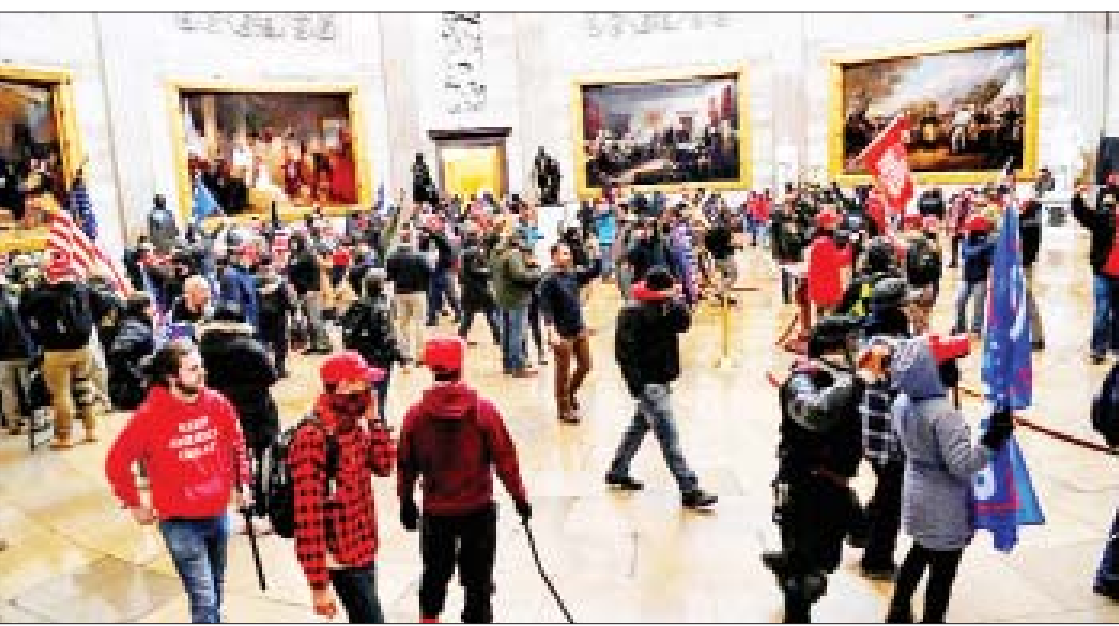
ဒီမိုကရေစီစနစ်ကို အလွန်အမင်း အမွမ်းတင်ကာ ပြည်ပနိုင်ငံများသို့ ထုတ်ကုန်တစ်ခုသဖွယ် ဖြန့်ချိနေသော အမေရိကန်နိုင်ငံသည် ၂၀၂၀ ပြည့်နှစ် ရွေးကောက်ပွဲရလဒ် အငြင်းပွားမှုကြောင့် ၂၀၂၁ ခုနှစ် ဇန်နဝါရီ ၆ ရက်တွင် အမေရိကန်လွှတ်တော် အဆောက်အအုံခန်းမကို ထရန်အား ထောက်ခံသူများက ဝင်ရောက်စီးနင်းခဲ့သည့်ဖြစ်စဉ် ဖြစ်ပွားခဲ့သည်။

တစ်ပါတီ ဗဟိုဦးစီးစနစ်အောက်တွင် လူလားမြောက် ကြီးပြင်းလာခဲ့ရသော်လည်း ဒီမိုကရေစီစနစ်ကို ကျွန်တော် စိတ်ဝင်စားပါသည်။ ထိုစဉ်ကာလ ကမ္ဘာ့စင်မြင့်ထက်တွင် အမြဲတစေ တွေ့မြင်ကြားသိနေရသော ရီဂင်၊ မာဂရက်သက်ချာစသည့် ကမ္ဘာ့ထိပ်တန်း ခေါင်းဆောင်ကြီးများကို ကြည့်ရင်း သူတို့နိုင်ငံ၏ ဒီမိုကရေစီစနစ်နှင့် သမ္မတရွေးကောက်ပွဲများ၊ ပါလီမန်ရွေးကောက်ပွဲများကို သဘောကျခဲ့ဖူးသည်။