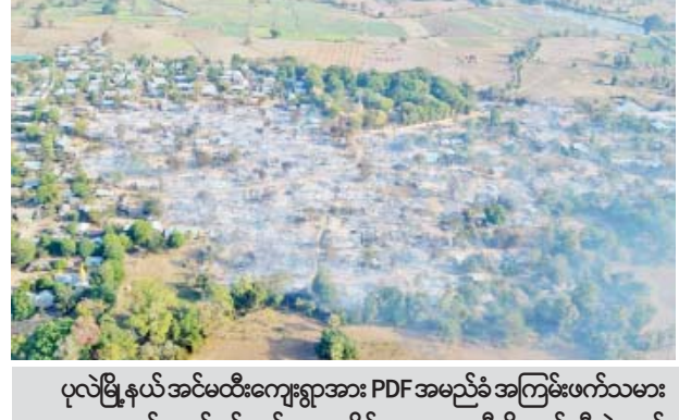
ပုလဲမြို့နယ် အင်မတော်ကျေးရွာအား PDF အမည်ခံ အကြမ်းဖက်သမားများက နှောင့်ယှက်ပစ်ခတ်၊ နေအိမ်များအား မီးရှို့ဖျက်ဆီးခဲ့သည့် မှတ်တမ်းဓာတ်ပုံ။