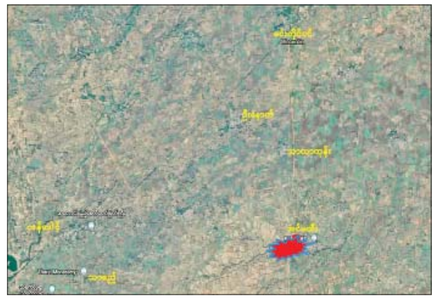
ပုလဲမြို့နယ် အင်မတော်ကျေးရွာအား PDF အမည်ခံ အကြမ်းဖက်သမားများက နှောင့်ယှက်ပစ်ခတ်၊ နေအိမ်များအား မီးရှို့ဖျက်ဆီးခဲ့သည့် ဖြစ်စဉ်နေရာပြပုံ။

NUG၊ CRPH နှင့် PDF အမည်ခံ အကြမ်းဖက်သမားများသည် နိုင်ငံတော်တည်ငြိမ်အေးချမ်းရေးနှင့် တရားဥပဒေစိုးမိုးရေးကို ပျက်ပြားစေရန် ရည်ရွယ်၍ နေရာဒေသအချို့၌ အကြမ်းဖက်လုပ်ရပ်များကို ကျူးလွန်လုပ်ကိုင်လျက်ရှိသည့်အပြင် ၎င်းတို့နှင့် ပူးပေါင်းပါဝင်ခြင်း မရှိသည့် ကျေးရွာများနှင့် အဆိုပါကျေးရွာများမှ ပြည်သူ့စစ်(ဌာန) တပ်ဖွဲ့ဝင်များကိုလည်း ချောင်းမြောင်းတိုက်ခိုက်ခြင်းများ လုပ်ဆောင်လျက်ရှိသည်။ ထိုသို့ အကြမ်းဖက်လုပ်ရပ်များကို မကြာခဏ ကျူးလွန်လုပ်ဆောင်၍ လူမှုကွန်ရက်စာမျက်နှာများမှတစ်ဆင့် နိုင်ငံအတွင်း တည်ငြိမ်အေးချမ်းမှုမရှိကြောင်း ဝါဒဖြန့်ဆောင်ရွက်လျက်ရှိသဖြင့်