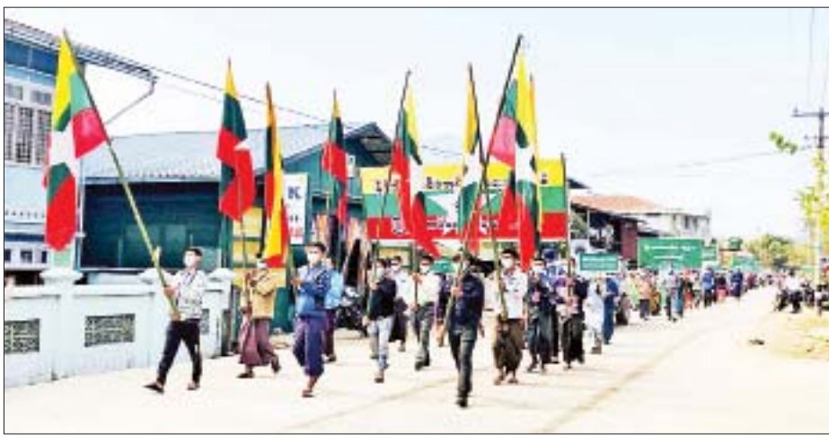
ခန္တီးမြို့၌ နိုင်ငံတော်စီမံအုပ်ချုပ်ရေးကောင်စီအား ထောက်ခံပွဲပြုလုပ်စဉ်။

၂၀၂၁ ခုနှစ် ဖွဲ့စည်းပုံအခြေခံ ဥပဒေနှင့်အညီ ဆောင်ရွက်လျက် ရှိသည့် နိုင်ငံတော်စီမံအုပ်ချုပ်ရေး ကောင်စီအား ထောက်ခံပွဲကို ယနေ့တွင် ကချင်ပြည်နယ် မြစ်ကြီးနားမြို့၌ လည်းကောင်း၊ ရှမ်းပြည်နယ် (မြောက်ပိုင်း)၊ ကွမ်းလုံမြို့နှင့် လောက်ကိုင်မြို့ တို့၌လည်းကောင်း၊ ရှမ်းပြည်နယ် (တောင်ပိုင်း)၊ လွိုင်လင်မြို့နှင့် နမ့်စန်မြို့၌လည်းကောင်း၊ ရှမ်း ပြည်နယ်(အရှေ့ပိုင်း)၊ အတွင်းရှိ မြို့နယ် ငါးမြို့နယ်တို့၌ လည်းကောင်း၊ မွန်ပြည်နယ် အတွင်းရှိ မြို့နယ် ခြောက်မြို့နယ် နှင့် ကရင်ပြည်နယ် လှိုင်းဘွဲ့မြို့၌ လည်းကောင်း၊ ရန်ကုန်တိုင်းဒေသ ကြီး မရမ်းကုန်းမြို့နယ်နှင့် ကမာရွတ်မြို့နယ်တို့၌ လည်း ကောင်း၊ ဧရာဝတီတိုင်းဒေသကြီး ကျိုက်လတ်မြို့၌လည်းကောင်း၊ ရခိုင်ပြည်နယ်အတွင်းရှိ မြို့နယ် ရှစ်မြို့နယ်နှင့် ချင်းပြည်နယ် ပလက်ဝမြို့တို့၌ လည်းကောင်း၊ စစ်ကိုင်းတိုင်းဒေသကြီး မုံရွာမြို့၊