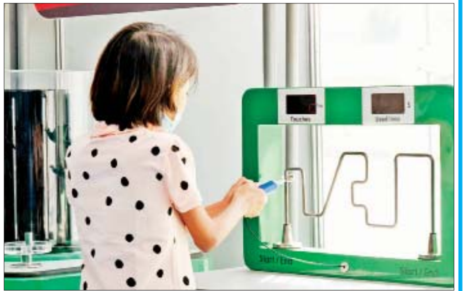
ပညာရေးဝန်ကြီးဌာနပြခန်းတွင် ကျောင်းသား ကျောင်းသူများ စိတ်ပါဝင်စားစွာ ကြည့်ရှုလေ့လာနေကြစဉ်။