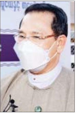
ပြည်ထောင်စုဝန်ကြီး ဦးမောင်မောင်အုန်း

ပစ္စည်းကိရိယာများနှင့် ဘဏ္ဍာရေးဝန်ကြီး ဌာန၊ အမျိုးသားမှတ်တမ်းများ မော်ကွန်းတိုက်ဦးစီးဌာန ပြခန်း မှာဆိုရင် လူငယ်တွေကိုပိုပြီးတော့ ကိုယ့်နိုင်ငံရဲ့ သမိုင်းကြောင်းကို သိစေဖို့အတွက် မော်ကွန်းစာတမ်း တွေ၊ မော်ကွန်းတိုက်က အထောက် အထားတွေ၊ ကျောက်စာ၊ ပေစာမိတ္တူတွေကိုလည်း ပြသ ထားပါတယ်။ ဒီပြခန်းမှာစာချုပ် တွေ အများကြီးပါပါတယ်။ ပင်လုံစာချုပ်နဲ့ ရန္တပိုစာချုပ် ပါသည်။