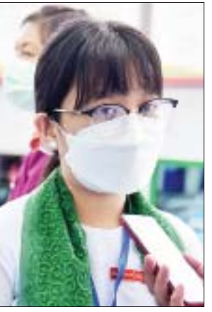
မခင်ပြည့်စုံ