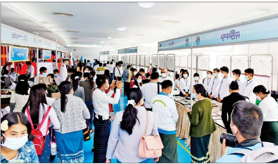
လူငယ်နှင့် စာပေပွဲတော်တွင် လာရောက်ကြည့်ရှုသူ ကျောင်းသား ကျောင်းသူများ၊ လူငယ်များနှင့် ပြည်သူများဖြင့် စည်ကားလျက်ရှိသည်ကိုတွေ့ရစဉ်။

ထို့ပြင် ပြည်သူများ သမိုင်းတန်ဖိုးများကို သိရှိ နားလည်စေရန် စေတနာဖြင့် အမျိုးသားမှတ်တမ်း များ မော်ကွန်းတိုက် ဦးစီးဌာနပြခန်းအတွင်း စစ်သူကြီးမဟာဗန္ဓုလမှ မဏိပူရမင်းသားထံ ပေးသည့် ပေစာ၊ လွတ်လပ်ရေးကြေညာစာတမ်း၊