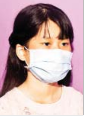
မအင်ကြင်းပွင့်

အခုကျင်းပတဲ့ လူငယ်နဲ့ စာပေပွဲတော်ဟာ တကယ်တော့ နိုင်ငံတော်ဝန်ကြီးချုပ်ကို အထူး ကျေးဇူးတင်ရမယ့်ကိစ္စ ဖြစ်ပါ တယ်။ အစကတော့ ပြန်ကြားရေး ဝန်ကြီးဌာနတစ်ခုအနေနဲ့ စာပေ ပွဲတော်တစ်ခုစီမံဖို့ စီစဉ်ထားတာ ဖြစ်ပါတယ်။ သို့သော်လည်း နိုင်ငံတော်ဝန်ကြီးချုပ် အနေနဲ့ လူငယ်ကဏ္ဍကို အင်မတန် အလေးထားပါတယ်။ ဒါကြောင့် လူငယ်နဲ့စာပေပွဲတော်ကို စီစဉ် တဲ့အခါမှာ ကျွန်တော်တို့ ဝန်ကြီး ဌာန တစ်ခုတည်းမဟုတ်တော့ဘဲ ကျန်တဲ့ဝန်ကြီးဌာနတွေနဲ့အားလုံး ပေါင်းစည်းပြီး ဆောင်ရွက်ပါ တယ်။ နိုင်ငံတော်ဝန်ကြီးချုပ်က လူငယ်တွေကို အသိပညာအတွေး အခေါ်တွေအပြင် နိုင်ငံတော် အတွက် သားကောင်းရတနာ၊ သမီးကောင်းရတနာဖြစ်စေချင်တဲ့ ရည်ရွယ်ချက်နဲ့ လုပ်ပါဆိုပြီး လမ်းညွှန်တဲ့အတွက် ယနေ့ နိုင်ငံတော်အဆင့် အခမ်းအနား တစ်ခုလို့ စီမံဆောင်ရွက်ခဲ့တာ ဖြစ်ပါတယ်။