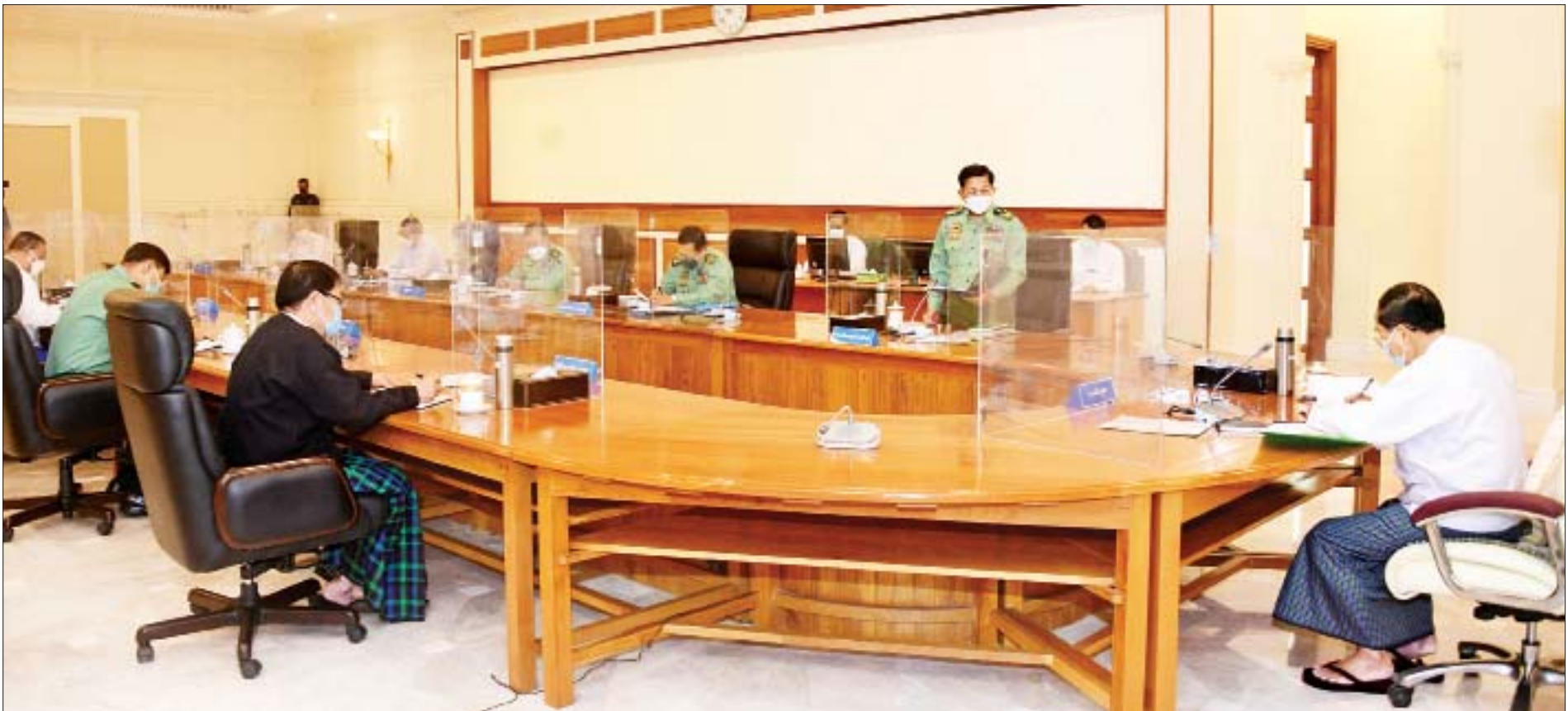
ပြည်ထောင်စုသမ္မတမြန်မာနိုင်ငံတော် အမျိုးသားကာကွယ်ရေးနှင့် လုံခြုံရေးကောင်စီအစည်းအဝေး(၁/၂၀၂၂) ကျင်းပစဉ်။