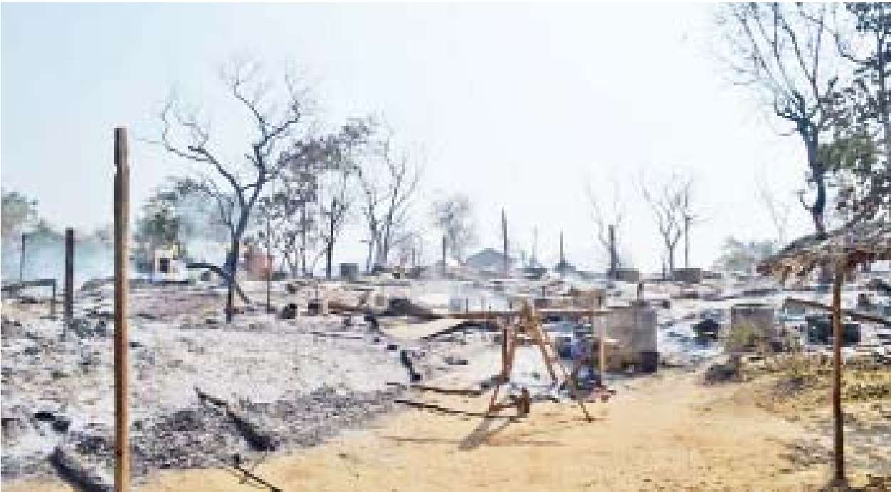
ပုလဲမြို့နယ် အင်မထီးကျေးရွာအား PDF အမည်ခံ အကြမ်းဖက်သမားများက နှောင့်ယှက်ပစ်ခတ်၊ နေအိမ်များအား မီးရှို့ဖျက်ဆီးခဲ့သည့် မှတ်တမ်းဓာတ်ပုံ။

ကိုဗစ်-၁၉ ရောဂါပိုးကူးစက်ပျံ့နှံ့မှုကို ဆက်လက်ထိန်းချုပ်ဆောင်ရွက်ရန် လိုအပ်ပါသဖြင့် ပြည်ထောင်စုအဆင့်အဖွဲ့အစည်းများ၊ ပြည်ထောင်စုဝန်ကြီးဌာနများမှ ကိုဗစ်-၁၉ ရောဂါ ကာကွယ်၊ ထိန်းချုပ်၊ တားဆီးရေးအတွက် ၂၀၂၂ ခုနှစ်၊ ဇန်နဝါရီလ ၃၁ ရက်နေ့အထိ ထုတ်ပြန်ထားသော ပြည်သူ့သို့ ပန်ကြားချက်၊ အမိန့်၊ အမိန့်ကြော်ငြာစာ၊ ညွှန်ကြားချက်များ (ဖြေလျှော့ပေးထားသည့်ကိစ္စရပ်များမပါ) အား ၂၀၂၂ ခုနှစ်၊ ဖေဖော်ဝါရီလ ၂၈ ရက်နေ့အထိ ရက်တိုးမြှင့်သတ်မှတ်ဆောင်ရွက်ထားပါကြောင်း အသိပေးကြေညာအပ်ပါသည်။