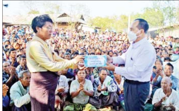
ပုလဲမြို့နယ် အင်မတော်ကျေးရွာရှိ ဒေသခံပြည်သူများအား ထောက်ပံ့ပစ္စည်းများ ပေးအပ်စဉ်။