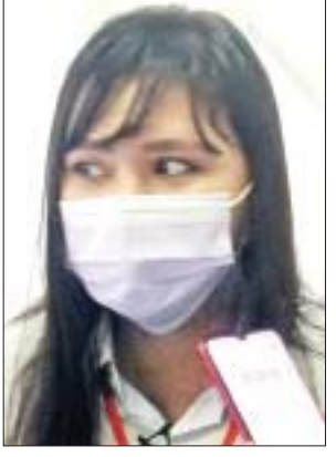
မအိချောချောမြ

ဦးမောင်မောင်အုန်း (ပြည်ထောင်စုဝန်ကြီး၊ ပြန်ကြားရေးဝန်ကြီးဌာန)