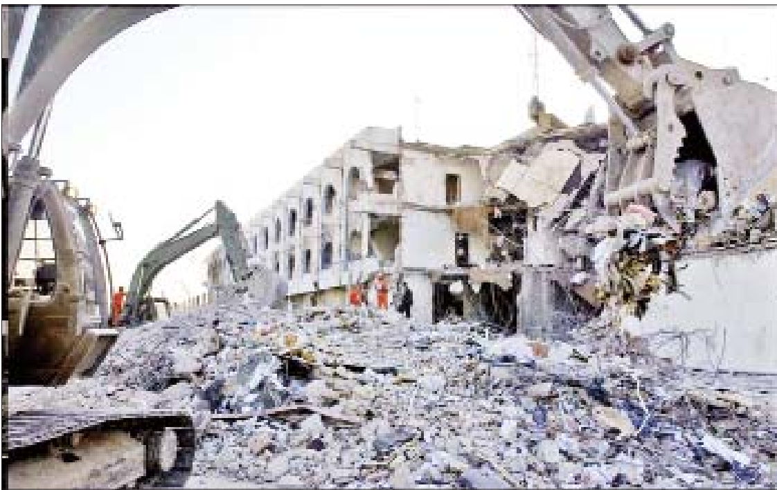
အမေရိကန်တို့က အီရတ်တွင် ဒီမိုကရေစီဖော်ဆောင်ရေးကို အကြောင်းပြပြီး ၂၀၀၃ ခုနှစ်အတွင်း စစ်ပွဲဆင်နွှဲမှုကြောင့် အိုးအိမ်၊ အဆောက်အအုံများ ပျက်စီးကာ ယနေ့ကာလအထိ ပြန်လည်ထူထောင်ရေးလုပ်ငန်းများကို ဆောင်ရွက်နေရဆဲ ဖြစ်သည်။

ပြီးခဲ့သည့် ၂၀၂၀ ပြည့်နှစ် သမ္မတ ရွေးကောက်ပွဲကမူ ဒီမိုကရေစီစနစ်ကို အလွန်အမင်း အမွမ်းတင်ကာ ပြည်ပ နိုင်ငံများသို့ ထုတ်ကုန်တစ်ခုသဖွယ် ဖြန့်ချိနေသော ဒီမိုကရေစီကို ဓားမိုးပြီး