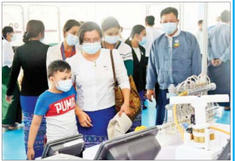
ပညာရေးဝန်ကြီးဌာနပြခန်းတွင် စိတ်ပါဝင်စားစွာ ကြည့်ရှုလေ့လာနေကြစဉ်။