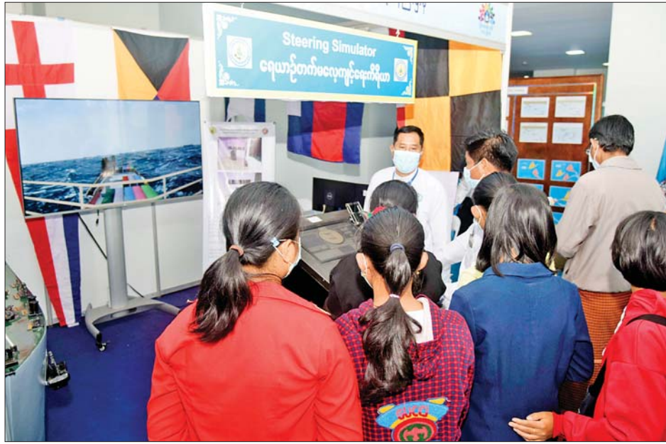
ပို့ဆောင်ရေးနှင့် ဆက်သွယ်ရေးဝန်ကြီးဌာန ပြခန်းတွင် ကျောင်းသား ကျောင်းသူများနှင့် လူငယ်များ ကြည့်ရှုလေ့လာနေကြစဉ်။

သတင်း - မျိုးဆက်သစ်