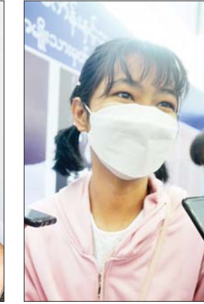
မအိမ်မြတ်နေခြည်အောင်

လာအောင် ဆွဲဆောင်စည်းရုံးပြီး လူငယ်တွေ လေကြောင်းအတတ် ပညာနဲ့ နိုင်ငံတော်ကို အကျိုးပြု လာနိုင်အောင် ကြိုးစားသွားမှာပါ။ လူမျိုးတစ်မျိုးက တိုင်းပြည်ကို ချစ်ဖို့ တိုင်းပြည်သမိုင်းကြောင်း သိဖို့လိုသလိုလေကြောင်းပညာကို ချစ်တဲ့သူတွေ ပေါ်လာဖို့ လေကြောင်း သမိုင်းကနေအစပြု ပြီး လေယာဉ်နဲ့ပတ်သက်တဲ့ စက်မှုလက်မှုနဲ့ ပတ်သက်ပြီး