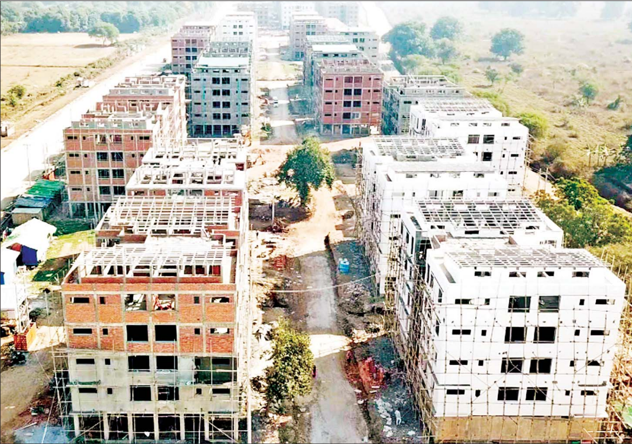
မင်္ဂလာရန်ကင်း ပြည်သူ့အငှားအိမ်ရာစီမံကိန်းကို တွေ့ရစဉ်။