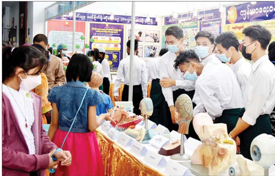
ကျန်းမာရေးဝန်ကြီးဌာနပြခန်းတွင် ကျောင်းသား ကျောင်းသူများ လေ့လာနေကြစဉ်။