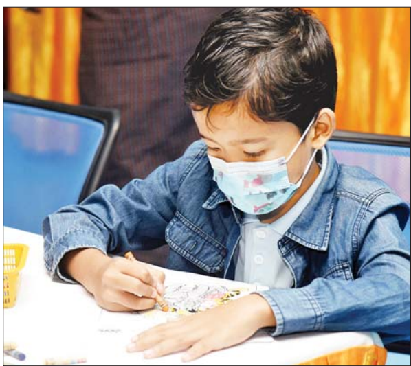
ဆေးရောင်ခြယ်ပြိုင်ပွဲ ပါဝင်ဆင်နွှဲနေသည့် ကလေးငယ်တစ်ဦး။