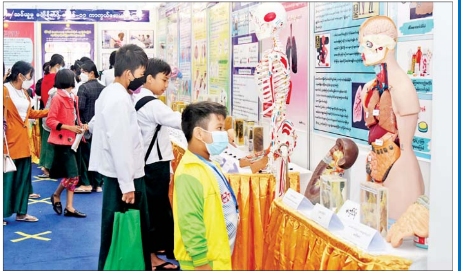
ကျန်းမာရေးဝန်ကြီးဌာနပြခန်းတွင် ကျောင်းသား ကျောင်းသူများ လေ့လာနေကြစဉ်။