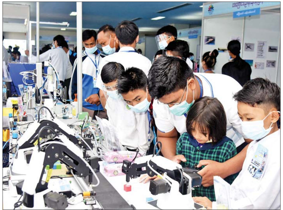
သိပ္ပံနှင့်နည်းပညာပြခန်းတွင် ကျောင်းသား ကျောင်းသူများ စိတ်ဝင်တစား လေ့လာကြစဉ်။