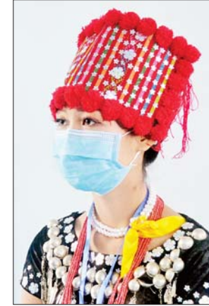
မမိုးပြည့်ပြည့်နိုင်

တယ်။ အဲဒီလိုအဆင့်ရောက်တဲ့သူတွေဟာ လုပ်ငန်းခွင်မှာ ဝန်ဆောင်လုပ်သားအနေနဲ့ အလုပ်လုပ်နိုင်ပါပြီ။ လူငယ်နှင့် စာပေပွဲတော်ကို လာရောက်လေ့လာကြတဲ့ လူငယ်တော်တော်များများက တီဗွီ 3D မျက်မှန်နဲ့ ဝန်ဆောင်နည်းကို စိတ်ဝင်တစား လက်တွေ့ လေ့ကျင့်တဲ့သူတွေရှိသလို လေ့လာမေးမြန်းသူတွေလည်း အများအပြားရှိပါတယ်။ အဲဒီအတွက် လူငယ်နှင့် စာပေပွဲတော်ကို လာရောက်ပြသပေးရတာ ကျွန်တော်တို့အတွက်လည်း များစွာဝမ်းသာပီတိဖြစ်ပါတယ်။ လူငယ်တွေအနေနဲ့လည်း ဒီပွဲကနေ အတွေးသစ်၊ အမြင်သစ်နဲ့ ဘဝတက်လမ်းတွေမှာ အထောက်အကူဖြစ်စေမယ်လို့ ယုံကြည်ပါတယ်။