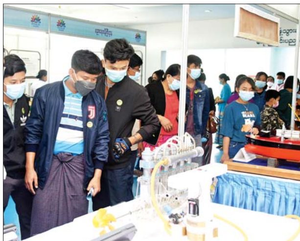
ပွဲတော်လာပြည်သူများ ရေကြောင်းပညာရပ်ဆိုင်ရာ အသိပညာပေးပြခန်းတွင် စိတ်ဝင်တစား လေ့လာကြည့်ရှုနေကြစဉ်။