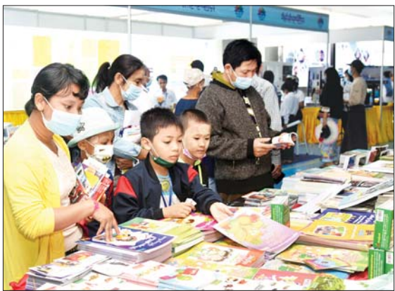
စာမျက်နှာ » ၉

စိန်ရတုပြည်ထောင်စုနေ့အထိမ်းအမှတ် လူငယ်နှင့်စာပေပွဲတော် ဒုတိယနေ့ ဆက်လက်ကျင်းပ ကျောင်းသား ကျောင်းသူများနှင့် လူငယ်များ စိတ်ပါဝင်စားစွာဖြင့် လာရောက်လေ့လာ