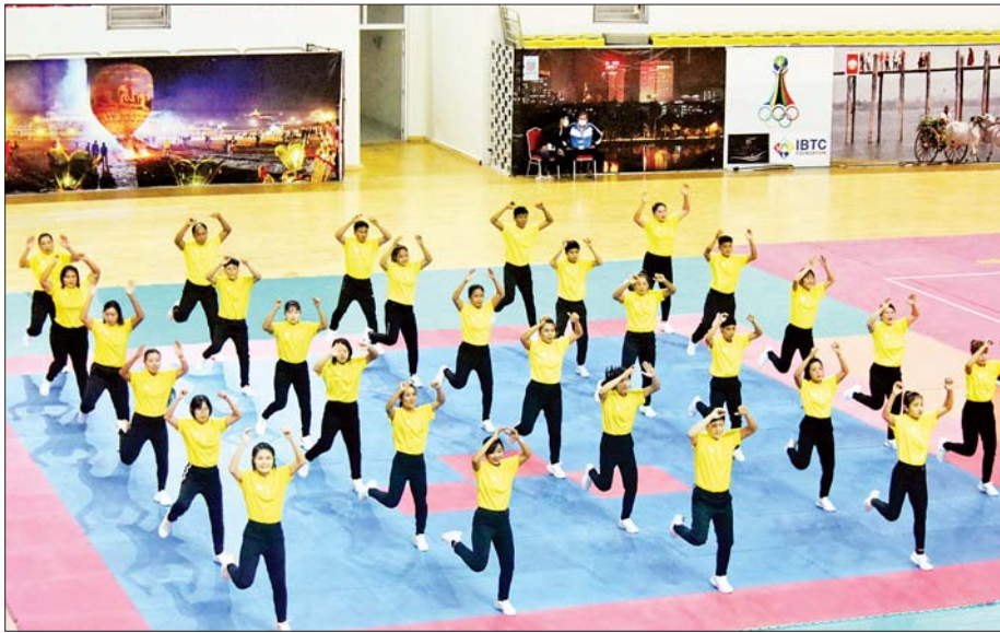
Myanmar Fitness Dance အဖွဲ့ ကပြဖျော်ဖြေနေစဉ်။