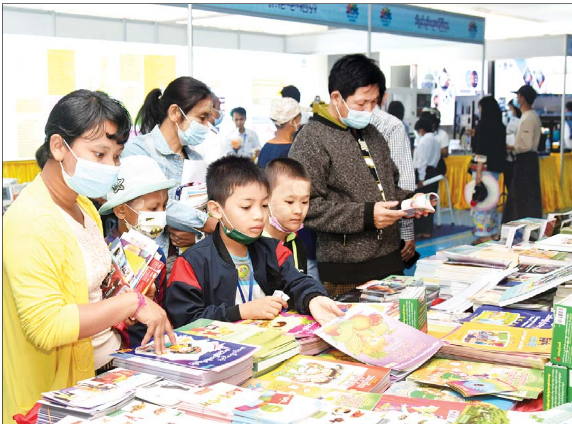
စာအုပ်အရောင်းဆိုင်တွင် ကြည့်ရှုလေ့လာဝယ်ယူနေကြသူများကို တွေ့ရစဉ်။

လေကြောင်းပညာရပ်ကို စိတ်ဝင်စားသည့် ကျောင်းသား ကျောင်းသူများ၊ လူငယ်များအတွက် လေယာဉ်ငယ် ပျံသန်းခြင်း သရုပ်ပြကွင်းကို ထားရှိပေးထားပြီး တာဝန်ရှိသူများက လေယာဉ်ငယ်များ ပျံသန်းပုံအဆင့်ဆင့်ကို သရုပ်ပြ