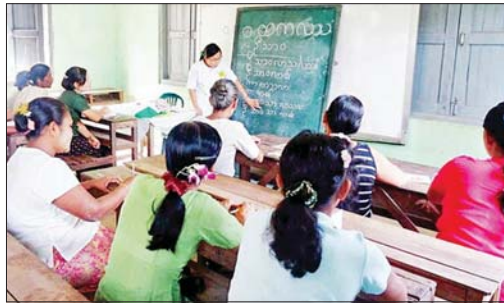
နည်းပညာအသုံးပြု အခြေခံစာတတ်မြောက်ရေး လုပ်ငန်းများ စာမျက်နှာ » ၂၃