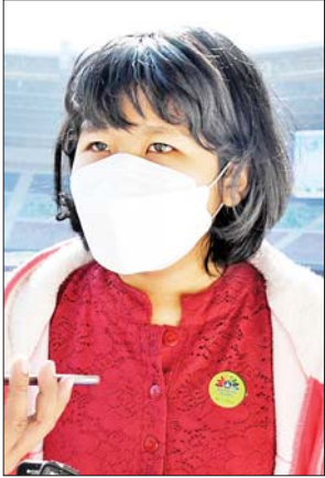
မအိမ့်မှူးကျော်သူ

မအိမ့်မှူးကျော်သူ Grade-9၊ အထက(ဇေယျာသီရိ)၊ နေပြည်တော်