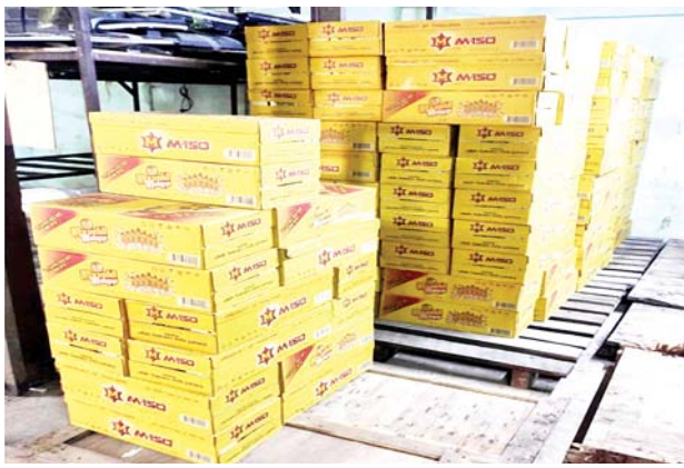
သိမ်းဆည်းရမိသည့် တရားမဝင်အားဖြည့်အချိန်ရည်များကို တွေ့ရစဉ်။

အလားတူ ဇန်နဝါရီ ၃၀ ရက်တွင် ပဲခူးတိုင်းဒေသကြီး တရားမဝင် ကုန်သွယ်မှုတိုက်ဖျက်ရေးအဖွဲ့၏ စီမံခန့်ခွဲမှုဖြင့် တိုင်းဒေသကြီး သစ်တောဦးစီးဌာနကဦးဆောင်၍ ပူးပေါင်းစစ်ဆေးရေးအဖွဲ့များဖြင့် သတင်းအရသွားရောက်စစ်ဆေးခဲ့ရာပဲခူး၊ တောင်ငူနှင့်သာယာဝတီခရိုင် သစ်တောကြီးပိုင်းများအတွင်း တရားမဝင်သစ်မျိုးစုံ ၁၆ ဒသမ ၃၉၆၂