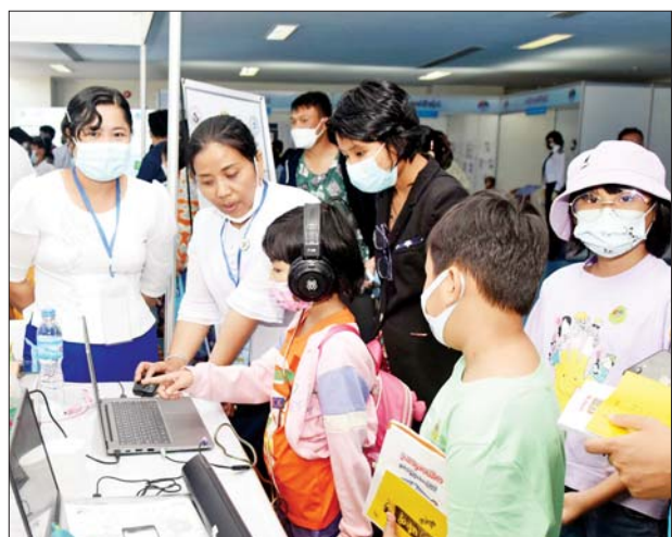
ပညာရေးဝန်ကြီးဌာနပြခန်းတွင် ကျောင်းသား ကျောင်းသူများ လေ့လာနေကြစဉ်။