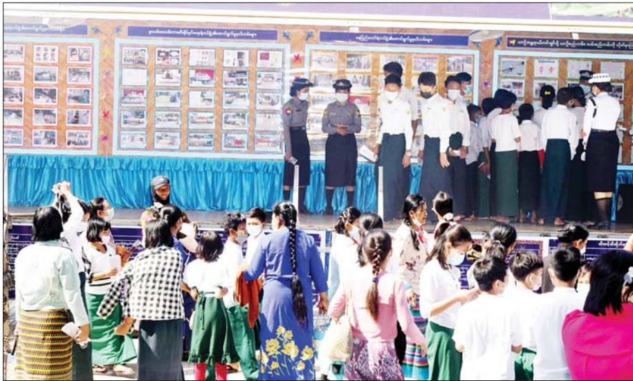
မူခင်းအသိပညာပေးမှတ်တမ်းများကို ကျောင်းသား ကျောင်းသူများ လေ့လာနေကြစဉ်။