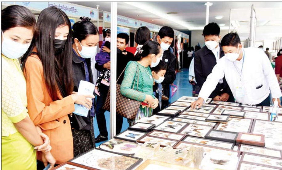
ရှားပါးလိပ်ပြာပြခန်းတွင် လေ့လာနေကြသူများကို တွေ့ရစဉ်။