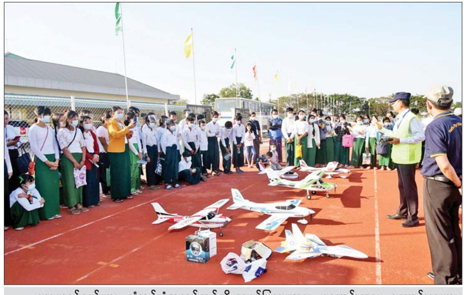
လေယာဉ်ငယ်များ ပျံသန်းပုံအဆင့်ဆင့်ကို သရုပ်ပြသမှုအား ကျောင်းသား ကျောင်းသူများ လေ့လာကြည့်ရှုကြစဉ်။