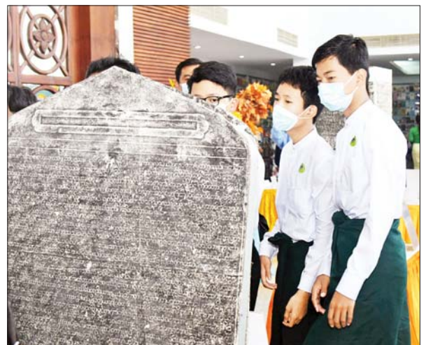
ခင်းကျင်းပြသထားသည့် ကျောက်စာအား ကျောင်းသားများ စိတ်ဝင်တစား လေ့လာနေကြစဉ်။