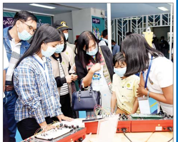
သိပ္ပံနှင့် နည်းပညာဝန်ကြီးဌာနပြခန်းတွင် ကျောင်းသား ကျောင်းသူများ လေ့လာနေကြစဉ်။