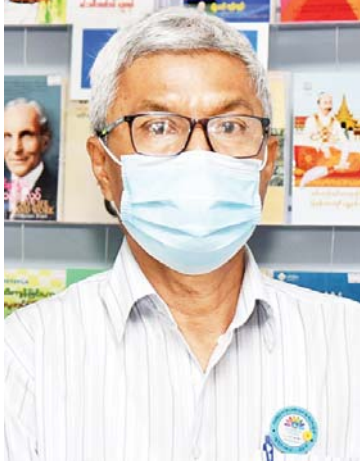
ဒုတိယဝန်ကြီး ဦးရဲတင့်

အခုကျင်းပနေတဲ့ လူငယ်စာပေ ပွဲတော်ဆိုတာ အရင်က လူငယ်စာပေ ပွဲတော်ဆိုပြီး ပြန်ကြားရေးဝန်ကြီးဌာနက နှစ်စဉ်ကျင်းပခဲ့တာဖြစ်ပါတယ်။ စာပေ ပွဲတော်ကနေ လူငယ်တွေကို စာပေတင် မကဘဲ အားကစား၊ နည်းပညာနဲ့ အခြား ကဏ္ဍတွေကနေ အထွေထွေအတွေ့အကြုံ ဗဟုသုတတွေရရှိအောင် နာမည်ကို လူငယ်စာပေပွဲတော်လို့ ပြောင်းလိုက် တာပါ။ လူငယ်တွေအတွက် ဒီအချိန်မှာ အရေးကြီးတာက အသိပညာ၊ အတတ် ပညာ၊ ဗဟုသုတ၊ အတွေ့အကြုံတွေအပြင် ကျန်းမာသန်စွမ်းဖို့နဲ့ ဗလငါးတန်ပြည့်စုံ ဖို့လိုတယ်ဆိုတဲ့ အသိစိတ်ကို ထည့်ပေး ချင်တဲ့အတွက် ဒီပွဲတော်ကို ကျင်းပခြင်း ဖြစ်ပါတယ်။