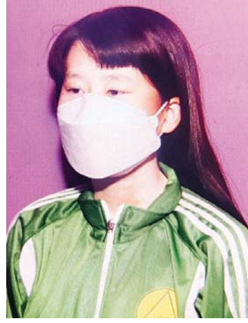
မအင်ကြင်းဖူး

လူငယ်နှင့် စာပေပွဲတော်ဖြစ်တဲ့ အတွက် ကျွန်တော်တို့ ကျောင်းက ကျောင်းသား ကျောင်းသူတွေ ၁၀၀၀ ကျော် လာရောက်လေ့လာနေပါတယ်။ ကျောင်းသား ကျောင်းသူတွေအနေနဲ့ ကိုဗစ်လှိုင်းတွေကြောင့် ကျောင်းတွေ နားထားရတဲ့အတွက် အခုလိုပွဲတော်ကြီး ကျင်းပပေးတဲ့အခါ လာရောက်လေ့လာပြီး ပျော်ရွှင်နေကြတာကို တွေ့ရပါတယ်။ ကလေးအများစုက ဖုန်းနဲ့ ဂိမ်းဆော့ပြီး အချိန်ကုန်နေကြတာများပါတယ်။ ဒီနေ့ ခေတ်မှာ ကျောင်းသားလူငယ်တွေ အားလုံး စာဖတ်ဖို့ ပိုမိုလိုလာပါပြီ။ သမိုင်း ဝင်စာအုပ်စာပေတွေ၊ လေ့လာစရာပြခန်း တွေကအစ ပြခန်းအားလုံးကို လေ့လာ ကြည့်ရှုရင်းနဲ့ အသိပညာဗဟုသုတတွေ ရရှိမယ်လို့ ယုံကြည်ပါတယ်။ ကျောင်းသား လူငယ်တွေ ပြခန်းတွေကို ကြည့်ခြင်း အားဖြင့် ရရှိလာမယ့် အသိပညာဗဟုသုတ တွေကနေတစ်ဆင့် ကျောင်းအတွက်၊ နိုင်ငံအတွက် အကျိုးပြုစေမယ့်