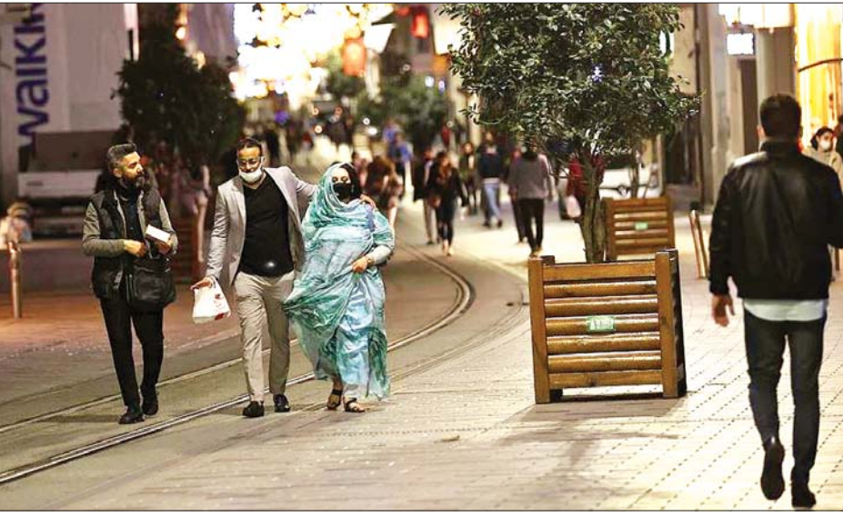
နိုင်ငံအတွင်း ကိုဗစ်-၁၉ ရောဂါကင်းစင်ရေးအတွက် ဆောင်ရွက်ခဲ့ကြောင်း သိရသည်။ ကိုးကား - စီဂျီတီအင်န် ဘာသာပြန် - စိုးသူရ

အစ္စတန်ဘူလ် ဇန်နဝါရီ ၃၀ တူရကီနိုင်ငံ၌ ပြီးခဲ့သည့်တစ်ရက်အတွင်း ကိုဗစ်-၁၉ ရောဂါကူးစက်ခံရသူ ၉၄၇၈၃ ဦးကို ထပ်မံတွေ့ရှိရပြီး ၎င်းအရေအတွက်သည် နိုင်ငံအတွင်း ကိုဗစ်-၁၉ ရောဂါ စတင်ဖြစ်ပွားခဲ့ပြီး နောက်တစ်ရက်အတွင်း အမြင့်ဆုံးရောက်ရှိကူးစက်သူအရေအတွက် ဖြစ်လာကြောင်း ကျန်းမာရေးဝန်ကြီး ဖာရတ်တင် ကိုကာက ပြောကြားသည်။