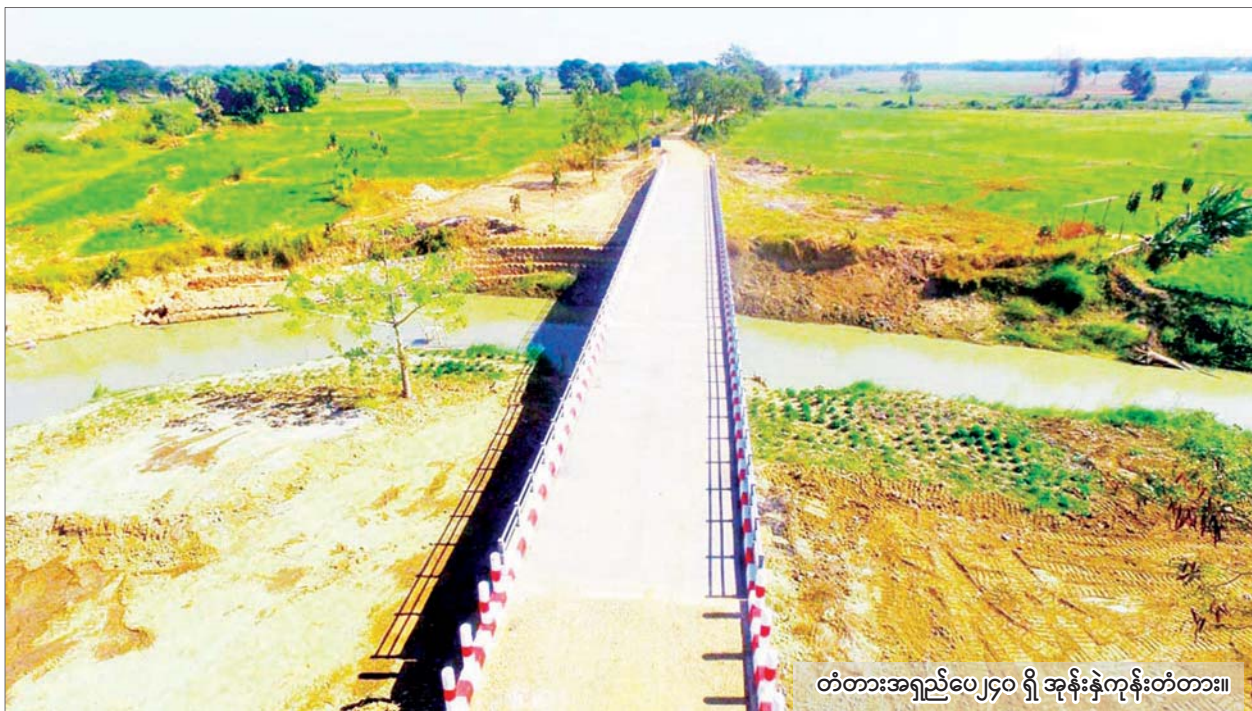
တံတားအရှည်ပေ၂၄၀ ရှိ အုန်းနဲကုန်းတံတား။