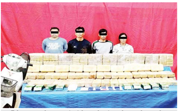
မြစ်မှုကျူးလွန်သူများကို သိမ်းဆည်းရမိသည့် မူးယစ်ဆေးဝါးများ နှင့်အတူ တွေ့ရစဉ်။

တာချီလိတ်မြို့နယ်တွင် ငွေကျပ် သိန်း ၇၆၀၀ ကျော်တန်ဖိုးရှိ မူးယစ်ဆေးဝါးများ သိမ်းဆည်း ရမိခဲ့ကြောင်း မြန်မာနိုင်ငံရဲတပ်ဖွဲ့ မှ သိရသည်။