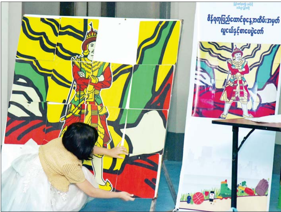
အရုပ်ဆက်ဖြိုင့်ပွဲ ဝင်ရောက်ယှဉ်ပြိုင်နေသည့် ကလေးငယ်တစ်ဦး။