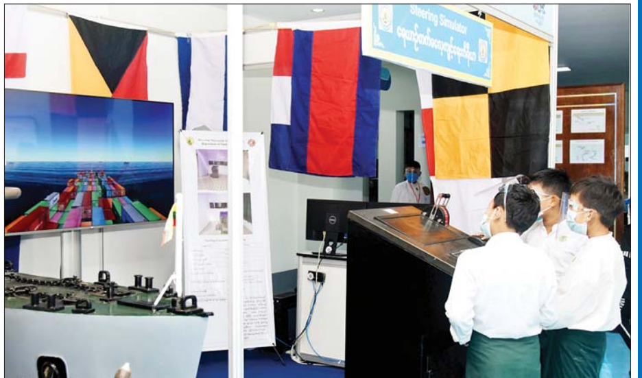
ကျောင်းသားများက Simulator ဖြင့် သင်္ဘောများ စမ်းသပ်မောင်းနှင်စဉ်။