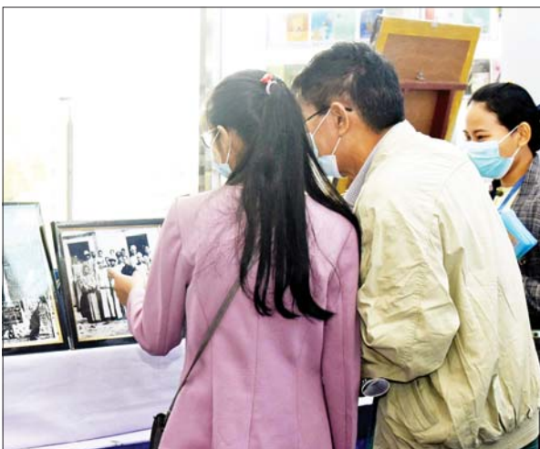
သမိုင်းဝင် စာချုပ်၊ စာတမ်းနှင့် မှတ်တမ်းမှတ်ရာများ ပြခန်းတွင် စိတ်ဝင်တစား လေ့လာကြည့်ရှုနေကြသူများကို တွေ့ရစဉ်။