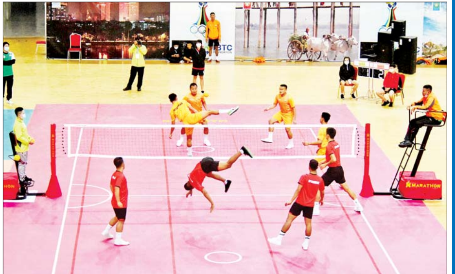
(၃၁)ကြိမ်မြောက် အရှေ့တောင်အာရှအားကစားပြိုင်ပွဲ ဝင်ရောက်ယှဉ်ပြိုင်ရန် စခန်းသွင်းလေ့ကျင့် လျက်ရှိသည့် မြန်မာ့လက်ရွေးစင် အားကစားသမားများ သရုပ်ပြလေ့ကျင့်နေကြစဉ်။