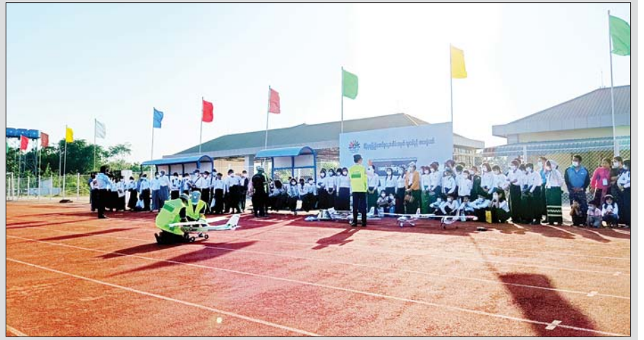
လေယာဉ်ငယ် ပျံသန်းပုံအဆင့်ဆင့် သရုပ်ပြသမှုအား ကျောင်းသား ကျောင်းသူများ စိတ်ဝင်တစား လေ့လာကြည့်ရှုကြစဉ်။