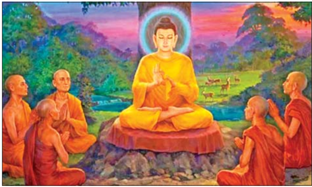
ဆောင်းပါး စာမျက်နှာ » ၁၈