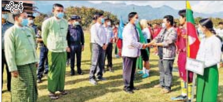
ဖိုရိုစန်

မန္တလေးတိုင်းဒေသကြီးမတ္တရာမြို့နယ် စီမံအုပ်ချုပ်ရေးအဖွဲ့၊ ပြန်ကြားရေးနှင့် ပြည်သူ့ဆက်ဆံ ရေးဦးစီးဌာနနှင့် ပညာ ရေးဌာနတို့ ပူးပေါင်းကျင်းပသည့် (၇၅)နှစ်မြောက် စိန်ရတု ပြည်ထောင်စုနေ့ အထိမ်းအမှတ် စာစီစာကုံး၊ ကဗျာရေးစပ်၊ ပန်းချီနှင့် ကဗျာရွတ်ဆိုပြိုင်ပွဲများကို ဇန်နဝါရီ ၂၆ ရက်မှ ၂၈ ရက်အထိ မတ္တရာ မြို့နယ် ပြန်ကြားရေးနှင့် ပြည်သူ့