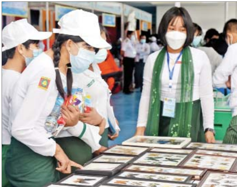
လူငယ်နှင့်စာပေပွဲတော်တွင် ပြသထားသည့် ရှားပါးလိပ်ပြာမျိုးစိတ်များကို ကျောင်းသူများ လေ့လာနေကြစဉ်။