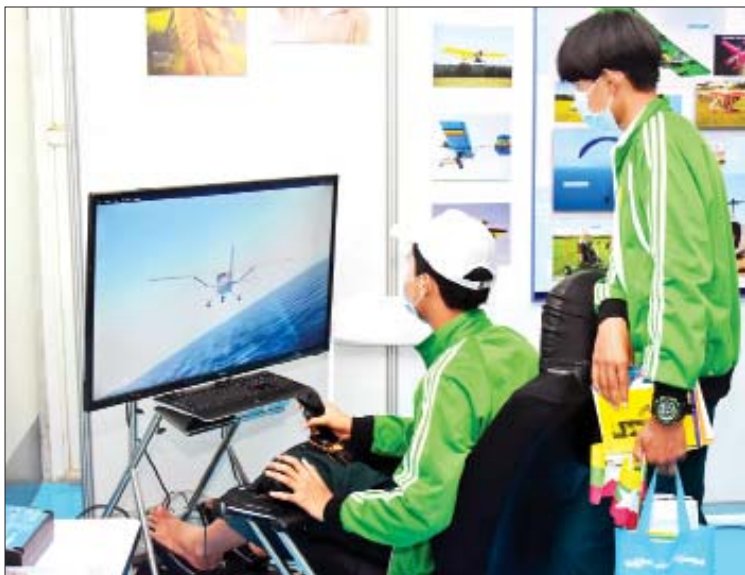
ကွန်ပျူတာဖြင့် လေယာဉ်စမ်းသပ် မောင်းနှင်စဉ်။