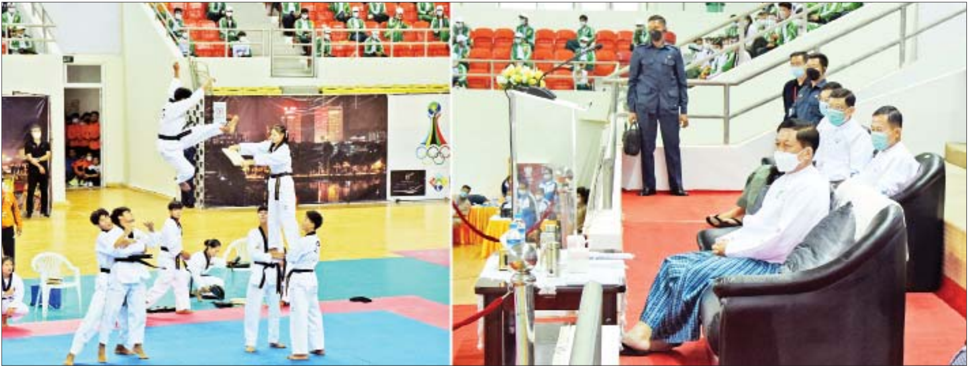
နိုင်ငံတော်စီမံအုပ်ချုပ်ရေးကောင်စီဥက္ကဋ္ဌ နိုင်ငံတော်ဝန်ကြီးချုပ် ဗိုလ်ချုပ်မှူးကြီးမင်းအောင်လှိုင် (၃၁)ကြိမ်မြောက် အရှေ့တောင်အာရှ အားကစားပြိုင်ပွဲသို့ ဝင်ရောက်ယှဉ်ပြိုင်ရန် စခန်းသွင်းလေ့ကျင့်လျက်ရှိသည့် မြန်မာ့လက်ရွေးစင်အားကစားသမားများ၏ လေ့ကျင့်သရုပ်ပြသမှုကို ကြည့်ရှုအားပေးစဉ်။

အားကစားဆိုသည်မှာ ရုပ်ပိုင်းနှင့်စိတ်ပိုင်းဆိုင်ရာများ၏ စွမ်းဆောင်ရည်ရှိမှုကို နိုင်ငံ၏ကိုယ်စားပြုသခြင်းဖြစ်