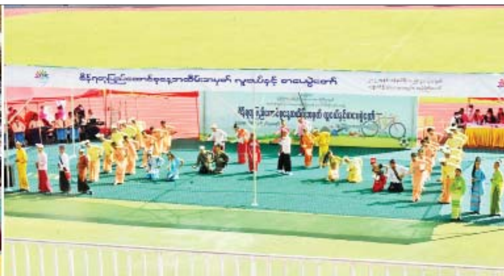
နိုင်ငံတော်စီမံအုပ်ချုပ်ရေးကောင်စီဥက္ကဋ္ဌ နိုင်ငံတော်ဝန်ကြီးချုပ် ဗိုလ်ချုပ်မှူးကြီးမင်းအောင်လှိုင်နှင့်ဇနီး ဒေါ်ကြူကြူလှ ကျောင်းသား ကျောင်းသူလေးများ၏ ဖျော်ဖြေတင်ဆက်မှုကို ကြည့်ရှုအားပေးစဉ်။