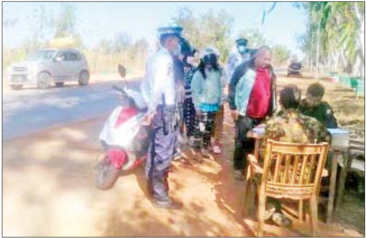
ပြန်လည်ဖွင့်လှစ်၍ အေးချမ်းတည်ငြိမ်စွာ ဖူး ဝတ်ပြုဆုတောင်းသူများနှင့် ပုံမှန် ရောင်းဝယ် ဖောက်ကားလျက်ရှိသည့် အတိုင်း သွားလာလှုပ်ရှားလျက်ရှိ အပြင် ဘုရား၊ စေတီများနှင့် အခြား ကြောင်း သိရသည်။ သတင်းစဉ်

ဆောင်ရွက်ပေးလျက်ရှိသည်။ ကယားပြည်နယ်အတွင်း NUG နှင့် PDF အမည်ခံ အကြမ်းဖက်သမားများကို လုံခြုံရေးတပ်ဖွဲ့ဝင်များက ဖော်ထုတ် ဖမ်းဆီးခဲ့ရာမှစတင်၍ PDF အမည်ခံ အကြမ်းဖက်အဖွဲ့များ၊ KNPP အဖွဲ့အချို့ နှင့် လုံခြုံရေးတပ်ဖွဲ့ဝင်များ ဇန်နဝါရီလ အတွင်း ထိတွေ့တိုက်ပွဲများ ဖြစ်ပွားခဲ့ပြီး အဆိုပါဒေသတစ်ဝိုက်အား လုံခြုံရေး တပ်ဖွဲ့ဝင်များက ဇန်နဝါရီ ၂၂ ရက်မှစ၍ ပြန်လည်ထိန်းချုပ်နိုင်ခဲ့ရာ နယ်မြေ တည်ငြိမ်အေးချမ်းမှုများ ပြန်လည်ရရှိ လာသဖြင့် ဈေးများ ပုံမှန်အတိုင်း