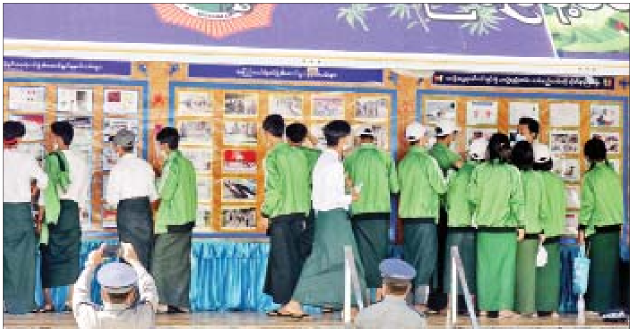
လူငယ်နှင့်စာပေပွဲတော်တွင် ပြည်ထဲရေးဝန်ကြီးဌာနက ပြသထားသည့်ဓာတ်ပုံများကို ကျောင်းသား ကျောင်းသူများ လေ့လာနေကြစဉ်။