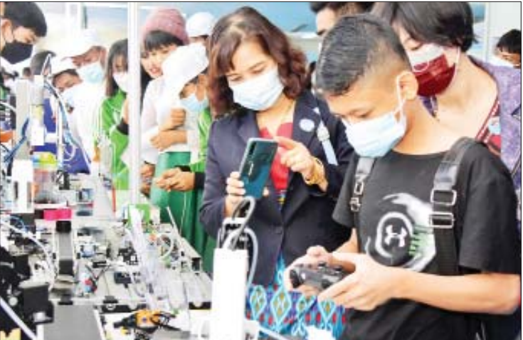
လူငယ်နှင့်စာပေ ပွဲတော်တွင် ခင်းကျင်းပြသ ထားသည်များကို ကျောင်းသား ကျောင်းသူများနှင့် ပြည်သူများ လာရောက်လေ့လာ နေကြစဉ်။