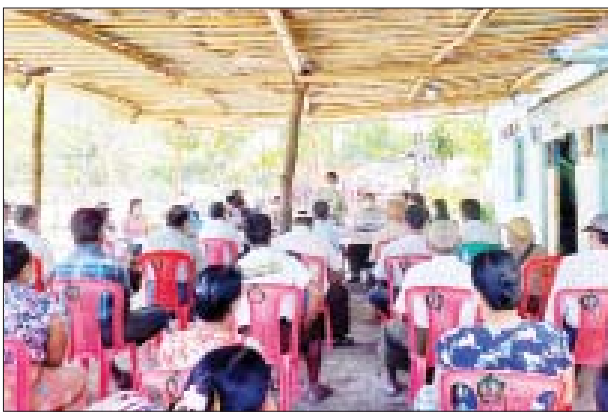
ဖရဲကျေးရွာသည် သနပ်ပင် မြို့နှင့် သုံးမိုင်ခန့်ကွာဝေးပြီး အိမ်ခြေ ၅၂၂ အိမ်နှင့် လူဦးရေ ၂၉၉၈ ဦး နေထိုင်ကာ စိုက်ပျိုးရေး အနေဖြင့် မိုးစပါ၊ နွေစပါ၊ ပဲမျိုးစုံတို့အား စိုက်ပျိုးကာ ငါးမွေးမြူရေး၊ ကြက်မွေးမြူရေး လုပ်ငန်းတို့ကို အဓိကထား လုပ်ကိုင်ကြကြောင်း သိရသည်။