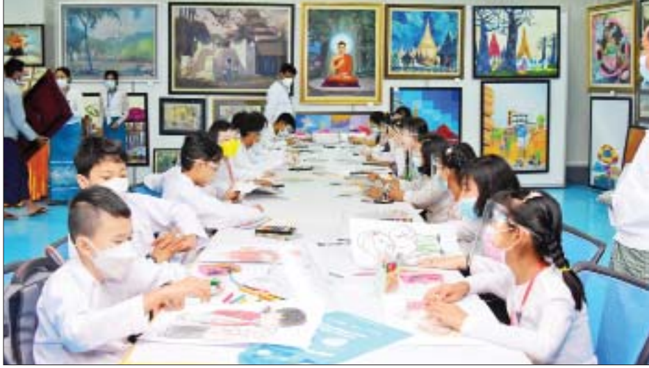
လူငယ်နှင့်စာပေပွဲတော်တွင် ကျောင်းသား ကျောင်းသူများ ပုံရေးဆွဲနေကြစဉ်။

ပြန်ကြားရေးဝန်ကြီးဌာန၊ ပညာရေးဝန်ကြီးဌာနနှင့် အားကစားနှင့်လူငယ်ရေးရာဝန်ကြီးဌာနတို့ ပူးပေါင်းစီစဉ်ကျင်းပသည့် စိန်ရတုပြည်ထောင်စုနေ့အထိမ်းအမှတ် လူငယ်နှင့်စာပေပွဲတော်ကို နေပြည်တော် ဝဏ္ဏသိဒ္ဓိအားကစားကွင်းအတွင်း ယနေ့မှစ၍ ကျင်းပလျက်ရှိရာ ဝန်ကြီးဌာနအလိုက် ပြခန်းပေါင်း ၄၀ ကျော် ပြသထားပြီး ဇန်နဝါရီ ၃၁ ရက်အထိ ပြသသွားမည်ဖြစ်ကာ ကျောင်းသား ကျောင်းသူများအနေဖြင့် လာရောက်လေ့လာနိုင်ကြောင်း သိရသည်။