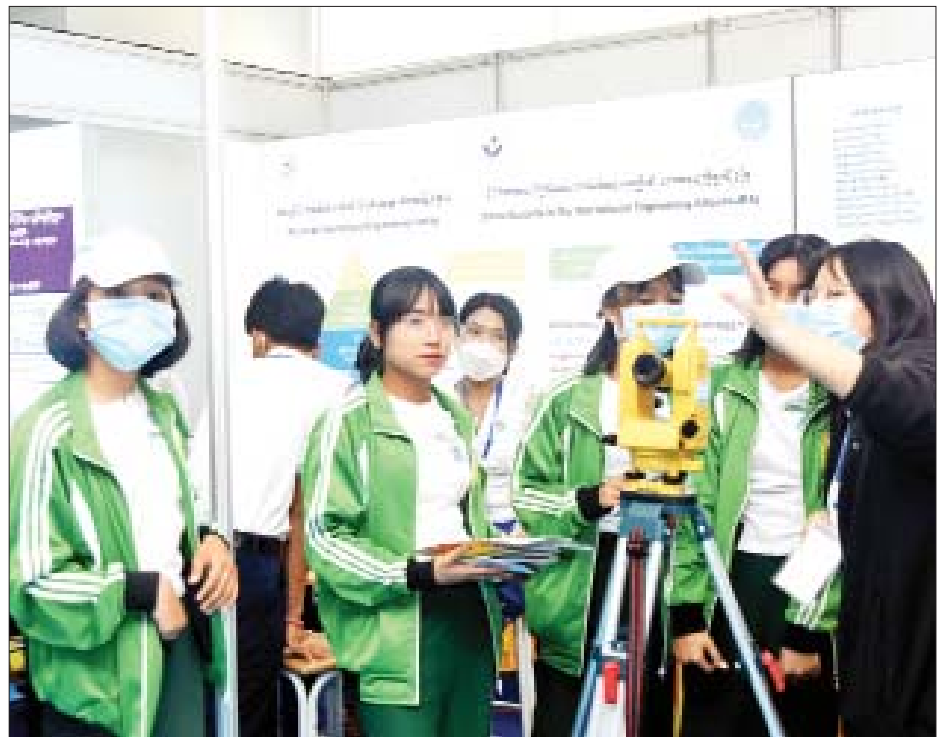
သိပ္ပံနှင့်နည်းပညာဝန်ကြီးဌာနပြခန်းတွင် ကျောင်းသူများလေ့လာနေကြစဉ်။