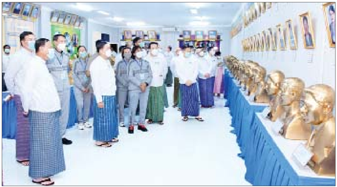
နိုင်ငံတော်စီမံအုပ်ချုပ်ရေးကောင်စီဥက္ကဋ္ဌ နိုင်ငံတော်ဝန်ကြီးချုပ် ဗိုလ်ချုပ်မှူးကြီးမင်းအောင်လှိုင် အာရှနှင့် အရှေ့တောင်အာရှ နိုင်ငံတကာအားကစားပြိုင်ပွဲများတွင် ရွှေတံဆိပ်ရရှိခဲ့သည့် နိုင်ငံ့ဂုဏ်ဆောင်အားကစားသမားများ၏ ပုံတူရုပ်တုများနှင့် ဓာတ်ပုံများကို ကြည့်ရှုစဉ်။

တက်ရောက် အဆိုပါ သရုပ်ပြပွဲသို့ နိုင်ငံတော်စီမံအုပ်ချုပ်ရေးကောင်စီ ဒုတိယဥက္ကဋ္ဌ ဒုတိယဝန်ကြီးချုပ် ဒုတိယဗိုလ်ချုပ်မှူးကြီး စိုးဝင်း၊ ကောင်စီအဖွဲ့ဝင်များဖြစ်ကြသည့် ဗိုလ်ချုပ်ကြီး မြထွန်းဦး၊ ဗိုလ်ချုပ်ကြီး တင်အောင်စန်း၊ ဒုတိယဗိုလ်ချုပ်ကြီး မိုးမြင့်ထွန်း၊ မန်းငြိမ်းမောင်၊ ဒေါ်အေးနုစိန်၊ Jeng Phang နော်တောင်၊ ဦးမောင်းဟာ၊ စောဒန်နီယယ်နှင့် တွဲဖက်အတွင်းရေးမှူး ဒုတိယဗိုလ်ချုပ်ကြီး ရဲဝင်းဦး၊ ပြည်ထောင်စုတရားသူကြီးချုပ် ဦးထွန်းထွန်းဦး၊ ပြည်ထောင်စုဝန်ကြီးများ၊ နေပြည်တော်ကောင်စီဥက္ကဋ္ဌ၊ ဒုတိယဝန်ကြီးများ၊ ဌာနဆိုင်ရာတာဝန်ရှိသူများနှင့် ကျောင်းသား ကျောင်းသူများ