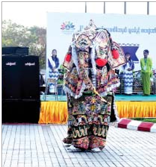
လူငယ်နှင့်စာပေပွဲတော်အခမ်းအနားဖျော်ဖြေရေးတွင် ပါဝင်ခဲ့သည့် ကျောက်ဆည်ဆင်၏အလှ။