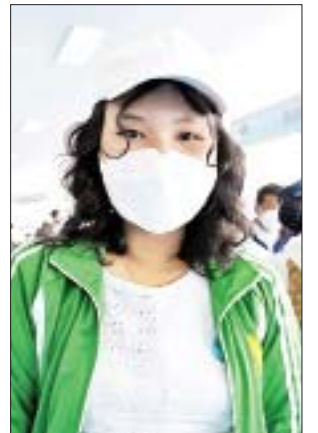
မနှင်းရတီရဲမင်း

ကျွန်တော်တို့ ဒီနေ့လူငယ်နှင့် စာပေပွဲတော်မှာလေ့လာရတဲ့ ပြခန်းတွေထဲက လျှပ်စစ်နဲ့သက်ဆိုင်တဲ့ ပြခန်းတွေ၊ ရေကြောင်းပညာနဲ့ ပတ်သက်တဲ့ သင်တန်းမောင်းတာ၊ လေကြောင်းပညာတွေနဲ့ ပတ်သက် တဲ့ ပြခန်းတွေကို စိတ်ဝင်စားပါတယ်။ လျှပ်စစ်နဲ့သက်ဆိုင်တဲ့ ပညာရပ် တွေကို ပိုပြီးလေ့လာဖြစ်ပါတယ်။ တကယ်လို့ အပြင်မှာ လက်တွေ့ လုပ်ကြည့်လို့ရမယ်ဆိုရင် ကျွန်တော်လေ့လာတဲ့ ကားတို့ တည်ဆောက် ကြည့်တာမျိုး လုပ်ချင်ပါတယ်။ ဒီလိုမျိုးပညာရပ်နဲ့ဆိုင်တဲ့ လှုပ်ရှားမှု တွေမှာ ပါဝင်လို့ရမယ်ဆိုရင် အစွမ်းကုန် ပါဝင်ချင်ပါတယ်။ အခုဆိုရင် ရေကြောင်းတို့ သိပ္ပံပညာနဲ့ စက်ပစ္စည်းတွေ၊ သဘာဝကိုအခြေခံတဲ့ ရှားပါးလိပ်ပြာ ပြခန်းတွေပါဝင်တာကို တွေ့ရတယ်။ လေယာဉ်နဲ့ ပတ်သက်တဲ့ပြခန်းမှာဆိုရင် လေယာဉ်တစ်စင်းရဲ့ ပုံသဏ္ဍာန်ကိုကြည့် ပြီးတော့ အမျိုးအစားခွဲခြားသိရှိနိုင်တဲ့ ဗဟုသုတတွေအပြင် လေယာဉ် တွေ၊ အာကာသယာဉ်မျိုးတွေနဲ့ပတ်သက်ပြီး တခြားဗဟုသုတတွေလဲ ရခဲ့ပါတယ်။ ဒီလိုပွဲတွေကနေ သိချင်တာတွေ သိခွင့်ရလာတဲ့အတွက် နောက်ထပ် ဒီလိုမျိုးပြပွဲတွေ လုပ်တဲ့အခါကျရင် သစ်ပင်ပန်းမန်တွေ၊ စိုက်ပျိုးရေးနဲ့ပတ်သက်တဲ့ ပြခန်းတွေကိုလည်း ပါဝင်စေချင်တယ်။ နောက်တစ်ခုက သိပ္ပံပညာနဲ့ပတ်သက်ပြီး ဆန်းသစ်တဲ့ နည်းပညာတွေနဲ့ ပတ်သက်တဲ့ အသိပညာပေးပြပွဲမျိုးတွေ ထပ်ပြီးလုပ်စေချင်ပါတယ်။ ဒီလူငယ်နှင့် စာပေပွဲတော်ကို မလာရသေးတဲ့လူငယ်ချင်းတွေကိုလည်း လာဖြစ်အောင်လာပြီးတော့ လေ့လာကြစေချင်ပါတယ်။