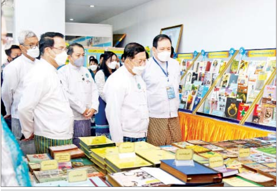
နိုင်ငံတော်စီမံအုပ်ချုပ်ရေးကောင်စီဥက္ကဋ္ဌ နိုင်ငံတော်ဝန်ကြီးချုပ် ဗိုလ်ချုပ်မှူးကြီးမင်းအောင်လှိုင် စာပေဗိမာန်က ခင်းကျင်းပြသထားသည့် စာအုပ်များကို ကြည့်ရှုလေ့လာစဉ်။