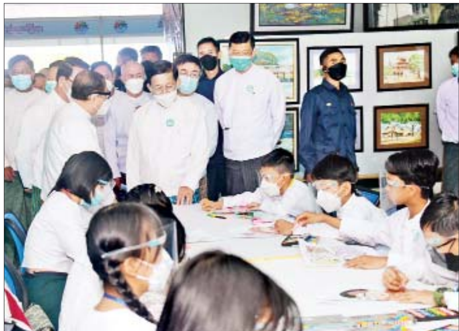
နိုင်ငံတော်စီမံအုပ်ချုပ်ရေးကောင်စီဥက္ကဋ္ဌ နိုင်ငံတော်ဝန်ကြီးချုပ် ဗိုလ်ချုပ်မှူးကြီးမင်းအောင်လှိုင် ကျန်းမာရေးဝန်ကြီးဌာနပြခန်းတွင် ကြည့်ရှုလေ့လာစဉ်။