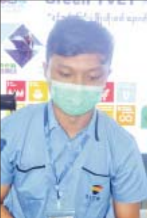
ကိုဟိန်းမင်းလတ်