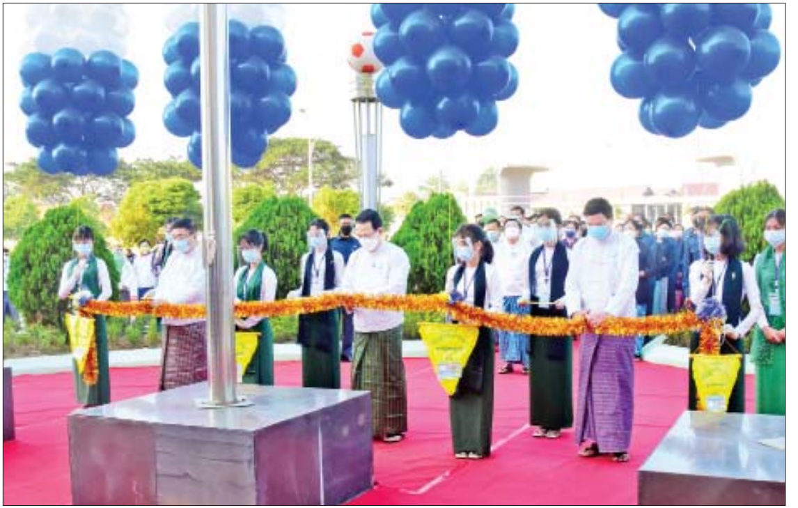
ပြန်ကြားရေးဝန်ကြီးဌာန ပြည်ထောင်စုဝန်ကြီး ဦးမောင်မောင်အုန်း၊ ပညာရေးဝန်ကြီးဌာန ပြည်ထောင်စုဝန်ကြီး ဒေါက်တာညွန့်ဖေနှင့် အားကစားနှင့် လူငယ်ရေးရာဝန်ကြီးဌာန ပြည်ထောင်စုဝန်ကြီး ဦးမင်းသိန်းဇံတို့ စိန်ရတုပြည်ထောင်စုနေ့ အထိမ်းအမှတ် လူငယ်နှင့်စာပေပွဲတော်ကို ဖဲကြိုးဖြတ်ဖွင့်လှစ်ပေးကြစဉ်။

ကျောင်းသား ကျောင်းသူများနှင့်အတူ စုပေါင်းမှတ်တမ်းတင် ဓာတ်ပုံရိုက်ကြသည်။ ထို့နောက် နိုင်ငံတော်စီမံအုပ်ချုပ်ရေးကောင်စီဥက္ကဋ္ဌ နိုင်ငံတော်ဝန်ကြီးချုပ်နှင့်ဇနီး၊ အခမ်းအနား တက်ရောက်လာကြသူများသည် လူငယ်နှင့်စာပေပွဲတော်တွင်ခင်းကျင်းပြသထားသည့်ပြန်ကြားရေးဝန်ကြီးဌာန ပြခန်းများ၊ ကျန်းမာရေးဝန်ကြီးဌာနပြခန်းများ၊ အမျိုးသားမှတ်တမ်းများ မော်ကွန်းတိုက်ဦးစီးဌာန ပြခန်း၊ ပို့ဆောင်ရေးနှင့် ဆက်သွယ်ရေးဝန်ကြီးဌာန ပြခန်း၊ သိပ္ပံနှင့်နည်းပညာဝန်ကြီးဌာန ပြခန်းများ၊ လေကြောင်းပညာရပ်ဆိုင်ရာ ပြခန်းများနှင့် ပညာရေးဝန်ကြီးဌာန ပြခန်းများအား ပြခန်းတစ်ခုချင်းစီအလိုက် အသေးစိတ်လှည့်လည်ကြည့်ရှု၍ တာဝန်ရှိသူများ၏ ရှင်းလင်းတင်ပြချက်များအပေါ် သိရှိလိုသည်များကိုမေးမြန်းပြီး လိုအပ်သည်များကို မှာကြားဖြည့်ဆည်းဆောင်ရွက်ပေးသည်။ စာမျက်နှာ ၄ သို့ *