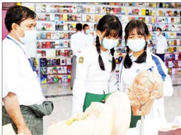
ကျန်းမာရေးဝန်ကြီးဌာနပြခန်းတွင် ကျောင်းသူများလေ့လာနေကြစဉ်။