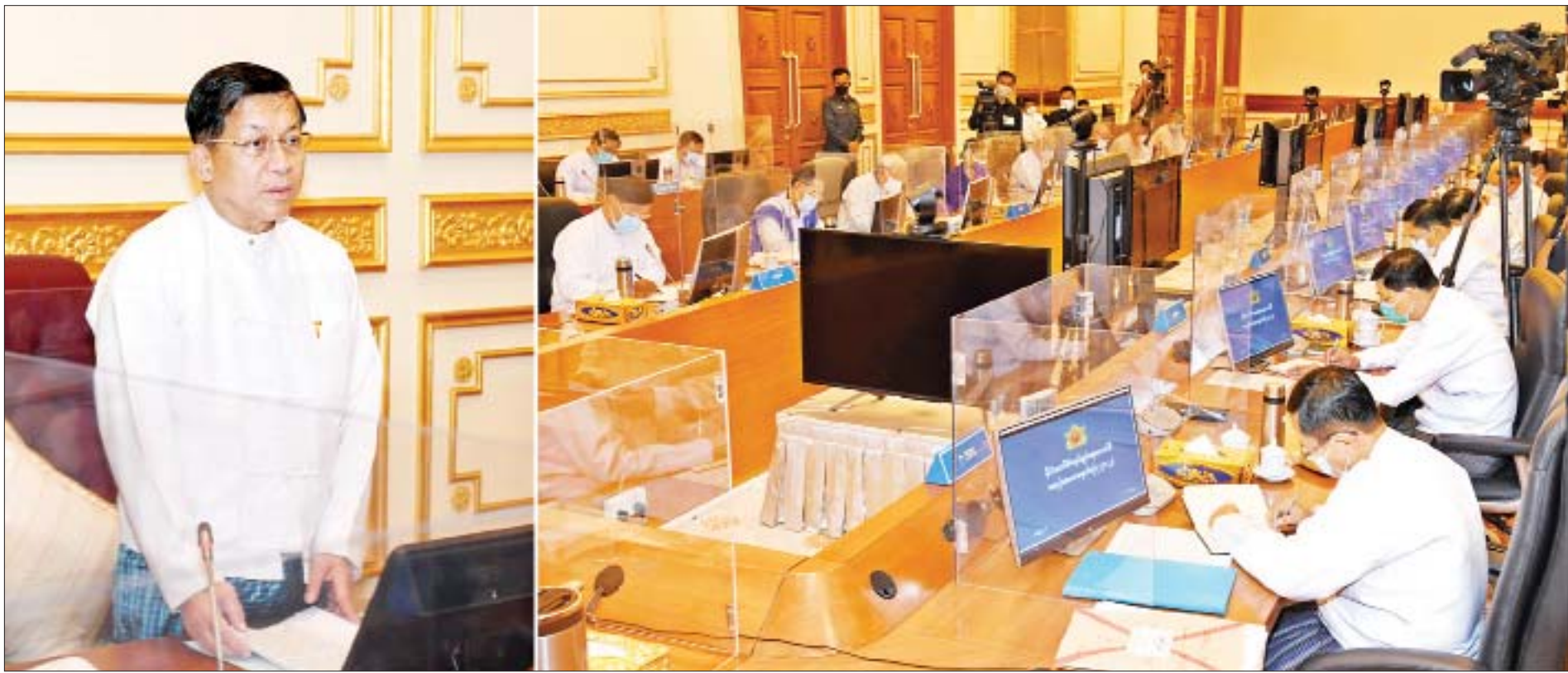
နိုင်ငံတော်စီမံအုပ်ချုပ်ရေးကောင်စီဥက္ကဋ္ဌ နိုင်ငံတော်ဝန်ကြီးချုပ် ဗိုလ်ချုပ်မှူးကြီးမင်းအောင်လှိုင် နိုင်ငံတော်စီမံအုပ်ချုပ်ရေးကောင်စီ အစည်းအဝေး (၂/၂၀၂၂)တွင် အမှာစကားပြောကြားစဉ်။