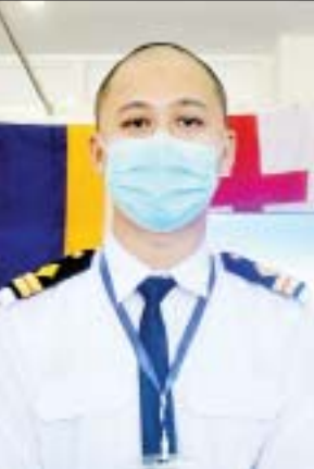
ကိုဝင်းထိုက်အောင်

နေပြည်တော် ဇန်နဝါရီ ၂၉ (၇၅)နှစ်မြောက်စိန်ရတုပြည်ထောင်စုနေ့ အထိမ်း အမှတ် လူငယ်နှင့်စာပေပွဲတော်ကို ပြန်ကြားရေး ဝန်ကြီးဌာန၊ ပညာရေးဝန်ကြီးဌာနနှင့် အားကစားနှင့် လူငယ်ရေးရာဝန်ကြီးဌာနတို့ ပူးပေါင်း၍ ယနေ့မှ စတင်ကာ ဇန်နဝါရီ ၃၁ ရက်အထိ နေပြည်တော် ဝဏ္ဏသိဒ္ဓိအားကစားကွင်း၌ စည်ကားသိုက်မြိုက်စွာ ကျင်းပလျက်ရှိသည်။ အဆိုပါလူငယ်နှင့်စာပေပွဲတော်တွင် စာအုပ် စာပေများ၊ ကလေးစာပေခန်းများ၊ ဓာတ်ပုံပြပွဲများ၊ ကာတွန်းပုံပြခန်းများ၊ အားကစားလှုပ်ရှားမှုပြခန်း များ၊ လေကြောင်းပညာရပ်ဆိုင်ရာသရုပ်ပြခန်း များ၊ ပြန်ကြားရေးဝန်ကြီးဌာန၊ ပညာရေးဝန်ကြီးဌာန၊ သိပ္ပံနှင့် နည်းပညာဝန်ကြီးဌာန၊ ပို့ဆောင်ရေးနှင့် ဆက်သွယ်ရေးဝန်ကြီးဌာန၊ ကျန်းမာရေးဝန်ကြီး ဌာနတို့မှ ပြခန်းများ ခင်းကျင်းပြသထားသည်ကို တွေ့ရသည်။ ထို့အပြင် ဖျော်ဖြေရေးအဖွဲ့များ၏ဖျော်ဖြေ တင်ဆက်မှုများ၊ လူငယ်နှင့်စာပေပွဲတော်ကို လာရောက်လေ့လာကြသည့် မြို့နယ်အသီးသီးရှိ