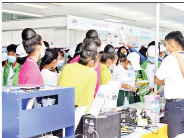
ကျောင်းသား ကျောင်းသူများ လူငယ်နှင့်စာပေပွဲတော်တွင် ခင်းကျင်းပြသထားသည်များကို ကြည့်ရှုလေ့လာကြစဉ်။