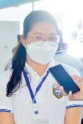
မသီရိယမင်းစံ

အခြေခံပညာကျောင်းများမှ ကျောင်းသား ကျောင်းသူ များ၊ တိုင်းဒေသကြီးနှင့် ပြည်နယ်များရှိ တက္ကသိုလ်၊ ဒီဂရီကောလိပ်များမှကျောင်းသား ကျောင်းသူများနှင့် ဌာနဆိုင်ရာများမှ ဝန်ထမ်းများ၊ ပြခန်းများဖြင့် စည်ကားလျက်ရှိသည်။ ထိုသို့ လူငယ်နှင့်စာပေပွဲတော်တွင် ခင်းကျင်းပြ