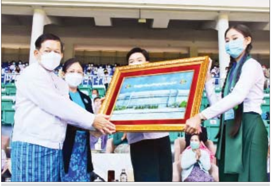
နိုင်ငံတော်စီမံအုပ်ချုပ်ရေးကောင်စီဥက္ကဋ္ဌ နိုင်ငံတော်ဝန်ကြီးချုပ် ဗိုလ်ချုပ်မှူးကြီးမင်းအောင်လှိုင်နှင့်ဇနီး ဒေါ်ကြူကြူလှတို့ထံ ကျောင်းသား ကျောင်းသူနှစ်ဦးက လူငယ်နှင့်စာပေပွဲတော်အထိမ်းအမှတ်တရပစ္စည်း ပေးအပ်စဉ်။

ပေါင်းစုစွမ်းအား မြန်ပြည်တစ်လွှား အစဉ်ရေးရှု ပြည်ထောင်စု