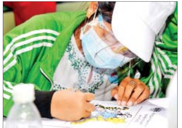
ကျောင်းသူတစ်ဦး ဆေးရောင်ခြယ်နေစဉ်။