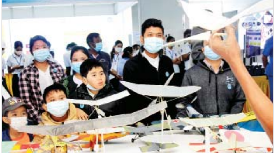
လေကြောင်းပညာရပ်ဆိုင်ရာပြခန်းတွင် ကျောင်းသား ကျောင်းသူများ လေ့လာနေကြစဉ်။