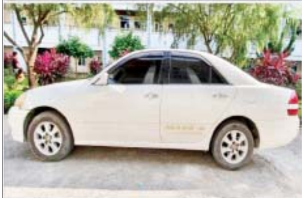
ရန်ကင်းမြို့နယ် မင်းရဲကျော်စွာလမ်း၌ လူယက်မှုကျူးလွန်ရာ တွင် အသုံးပြုခဲ့သည့် မော်တော်ယာဉ်၏ မှတ်တမ်းဓာတ်ပုံ။