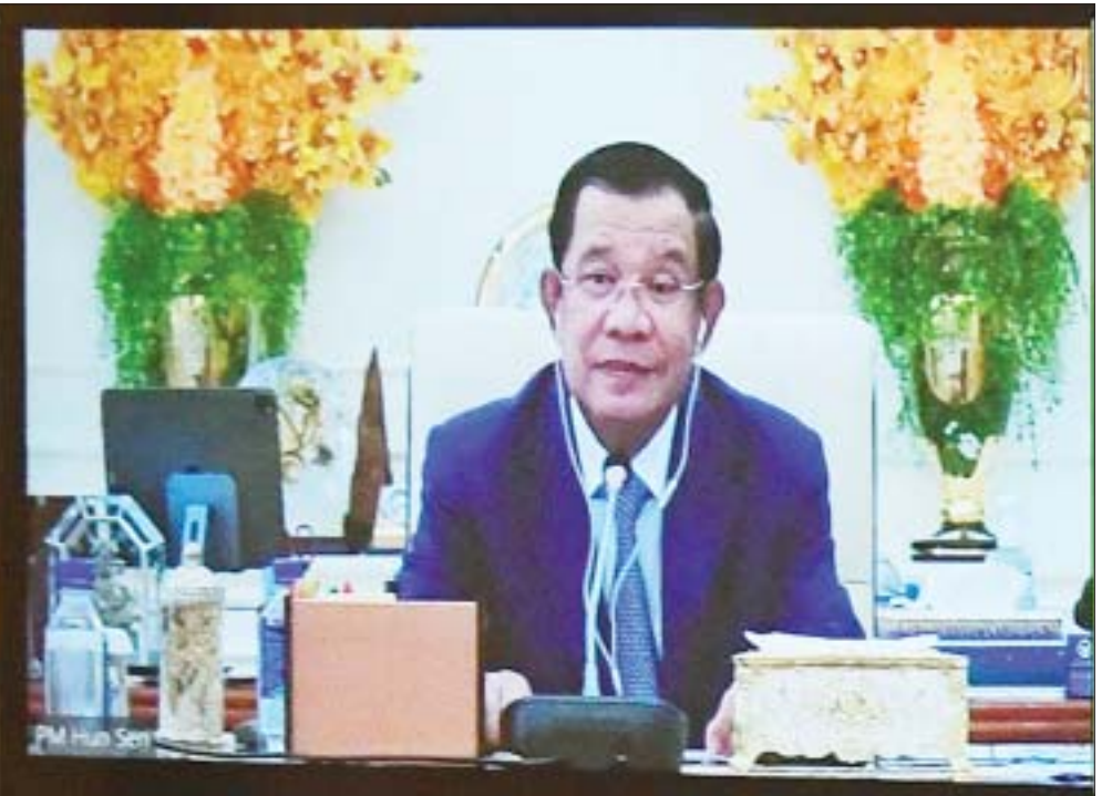
နိုင်ငံတော်စီမံအုပ်ချုပ်ရေးကောင်စီဥက္ကဋ္ဌ နိုင်ငံတော်ဝန်ကြီးချုပ် ဗိုလ်ချုပ်မှူးကြီးမင်းအောင်လှိုင်နှင့် ကမ္ဘောဒီးယားဝန်ကြီးချုပ် Samdech Akka Moha Sena Padei Techo HUN SEN တို့ Video Conferencing ဖြင့် တွေ့ဆုံဆွေးနွေးစဉ်။