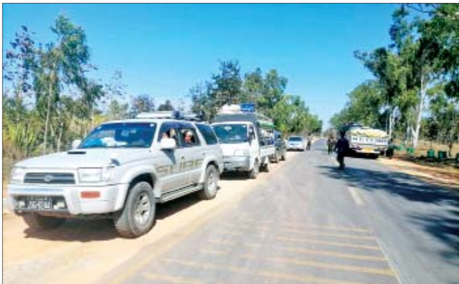
လွိုင်ကော်မြို့ပေါ်နှင့် ပတ်ဝန်းကျင်ကျေးရွာများမှ တိုက်ပွဲရှောင်ပြည်သူများ ၎င်းတို့နေရပ်သို့ ပြန်လည်ဝင်ရောက်လာမှုကို ဇန်နဝါရီ ၂၆ ရက်က တွေ့ရစဉ်။