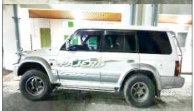
ရန်ကင်းမြို့နယ် မင်းရဲကျော်စွာလမ်း၌ လူယက်မှုကျူးလွန်ရာ တွင် အသုံးပြုခဲ့သည့် မော်တော်ယာဉ်၏ မှတ်တမ်းဓာတ်ပုံ။