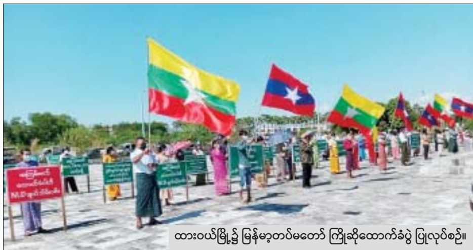
ထားဝယ်မြို့၌ မြန်မာ့တပ်မတော် ကြိုဆိုထောက်ခံပွဲ ပြုလုပ်စဉ်။

စတင်၍ PDF အမည်ခံ အကြမ်းဖက်အဖွဲ့များ၊ KNPP အဖွဲ့အချို့နှင့် လုံခြုံရေးတပ်ဖွဲ့ဝင်များ ဇန်နဝါရီလအတွင်း ထိတွေ့တိုက်ပွဲများ ဖြစ်ပွားခဲ့ပြီး အဆိုပါဒေသတစ်ဝိုက်အား လုံခြုံရေးတပ်ဖွဲ့ဝင်များက ဇန်နဝါရီ ၂၂ ရက်မှစ၍ ပြန်လည်ထိန်းချုပ်နိုင်ခဲ့ရာ နယ်မြေ တည်ငြိမ် အေးချမ်းမှုများ ပြန်လည်ရရှိလာသဖြင့် ဈေးများ ပုံမှန်အတိုင်း ပြန်လည် ဖွင့်လှစ်၍ အေးချမ်းတည်ငြိမ်စွာ ရောင်းဝယ်ဖောက်ကားလျက်ရှိသည့် အပြင် ဘုရားစေတီများနှင့် အခြားဘာသာရေးကျောင်းများ၌လည်း ဘုရားဖူးဝတ်ပြုဆုတောင်းသူများနှင့် ပုံမှန်အတိုင်း သွားလာလှုပ်ရှား လျက်ရှိကြောင်း သိရသည်။ သတင်းစဉ်