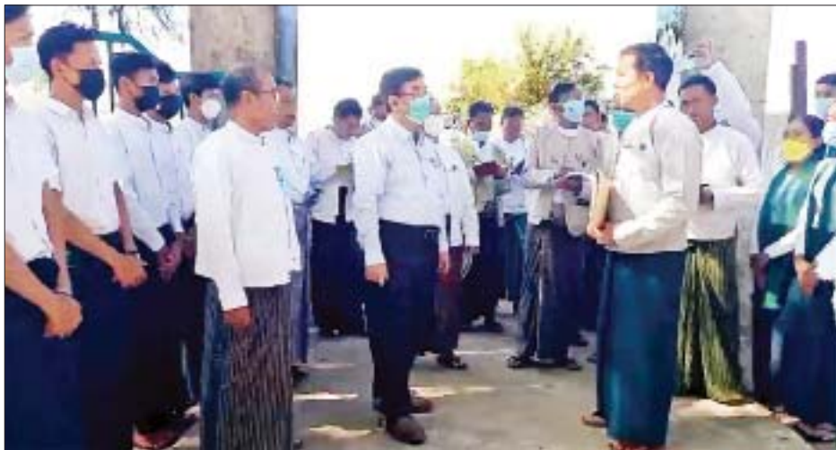
စာတတ်မြောက်၍ ပညာရေးအရည်အသွေး တိုးတက်အောင် စေတနာထား ကြိုးစားသင်ကြားပေးစေလိုပါကြောင်း မှာကြားသည်။

တွေ့ဆုံစဉ် နိုင်ငံတော်အကြီးအကဲ၏ လမ်းညွှန်ချက်များနှင့်အညီ ကျောင်းများ ဥပမိရုပ်ကောင်းမွန်ရေး၊ သင်ကြားသင်ယူမှု ကောင်းမွန်ရေးနှင့် ပညာရေးအရည်အသွေး တိုးတက်မြှင့်တင်ရေးအတွက် ပညာရေးမိသားစုများအားလုံး ညီညီညွတ်ညွတ် ပူးပေါင်းဆောင်ရွက်ကြရမည်ဖြစ်ပါကြောင်း၊ ပညာရေး ဖွံ့ဖြိုးတိုးတက်ရေးအတွက် အမှန်တကယ် လိုအပ်နေသောအရာများကို ဖြည့်ဆည်းဆောင်ရွက်ပေးသွားမည် ဖြစ်ပါကြောင်း၊ ဆရာ ဆရာမများအနေဖြင့် ကျောင်းသား ကျောင်းသူများ အမှန်တကယ်