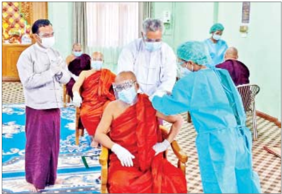
စာသင်တိုက်ကြီးများရှိ သံဃာတော်များနှင့် နိုင်ငံတော်ပရိယတ္တိသာသနာ့တက္ကသိုလ် (မန္တလေး) သင်ကြား/စီမံ၊ စာသင်သား ရဟန်း/သာမဏေများ စုစုပေါင်း ၄၀၇၈ ပါးတို့ကို လည်းကောင်း Sinopharm ကိုဗစ်-၁၉ ရောဂါ ကာကွယ်ဆေးများ ဆက်လက်ထိုးနှံသွားမည်ဖြစ်ကြောင်း သိရသည်။ သတင်းစဉ်

ကိုလည်းကောင်း၊ ဇန်နဝါရီ ၂၈ ရက်တွင် ရွှေတိဂုံစေတီတော် ရှေးဟောင်းတန်ဆောင်း၌ ရွှေတိဂုံစေတီတော်ဘဏ္ဍာတော်ထိန်းဂေါပကအဖွဲ့၏ ဩဝါဒါစရိယဆရာတော်ကြီးများ၊ ပစ္စာသမဏများ စုစုပေါင်း ၂၂ ပါးတို့ကိုလည်းကောင်း ကာကွယ်ဆေးထိုးနှံပေးသွားမည်ဖြစ်သည်။ ထို့အတူ မတ် ၄ ရက်မှ ၉ ရက်ထိ အဋ္ဌမအကြိမ် နိုင်ငံတော်သံသမဟာနာယကအဖွဲ့ (၄၇) ပါးစုံညီဒသမအစည်းအဝေးနှင့် မတ် ၁၁ ရက်မှ ၁၃ ရက်ထိ အဋ္ဌမအကြိမ် နိုင်ငံတော် ဗဟိုသံဃာ့ဝန်ဆောင်အဖွဲ့ တတိယနှင့် စတုတ္ထအစည်းအဝေးများကို ရန်ကုန်မြို့ သီရိမင်္ဂလာကမ္ဘာအေးကုန်းမြေ မဟာပါသာဏလိုဏ်ဂူသိမ်တော်ကြီး၌ ကျင်းပမည်ဖြစ်ရာ အဆိုပါအစည်းအဝေးများသို့ ကြွရောက်မည့် နိုင်ငံတော် ဩဝါဒါစရိယဆရာတော်ကြီးများ၊ နိုင်ငံတော် သံသမဟာနာယကဆရာတော်ကြီးများ၊ နိုင်ငံတော်ဗဟိုသံဃာ့ဝန်ဆောင် ဆရာတော်ကြီးများ စုစုပေါင်း ၅၁၄ ပါးကို လည်းကောင်း၊ မတ် ၁၄ ရက်မှ ၁၆ ရက်ထိ နေပြည်တော်ကောင်စီနယ်မြေ၊ ရန်ကုန်တိုင်းဒေသကြီး၊ မန္တလေးတိုင်းဒေသကြီးတို့မှ ပရိယတ္တိ