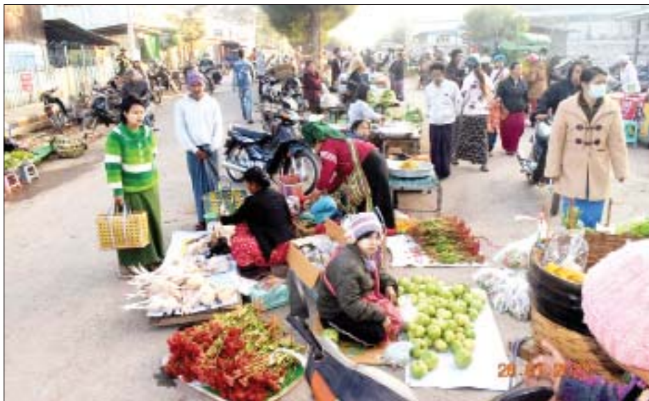
လွိုင်ကော်မြို့ သီရိမင်္ဂလာဈေးရှေ့တွင် ပြည်သူများ ရောင်းဝယ်နေမှုကို တွေ့ရစဉ်။