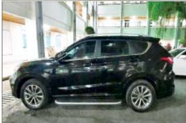
အင်းစိန်မြို့နယ် ဖော့ကန်ရပ်ကွက် မြို့တော်ဂေါက်ကွင်းအိမ်ရာ တိုက်(၁) အခန်း(၈) နေ တရားခံသက်ဦးထံမှ သိမ်းဆည်းရမိသည့် မော်တော်ယာဉ်၏ မှတ်တမ်းဓာတ်ပုံ။