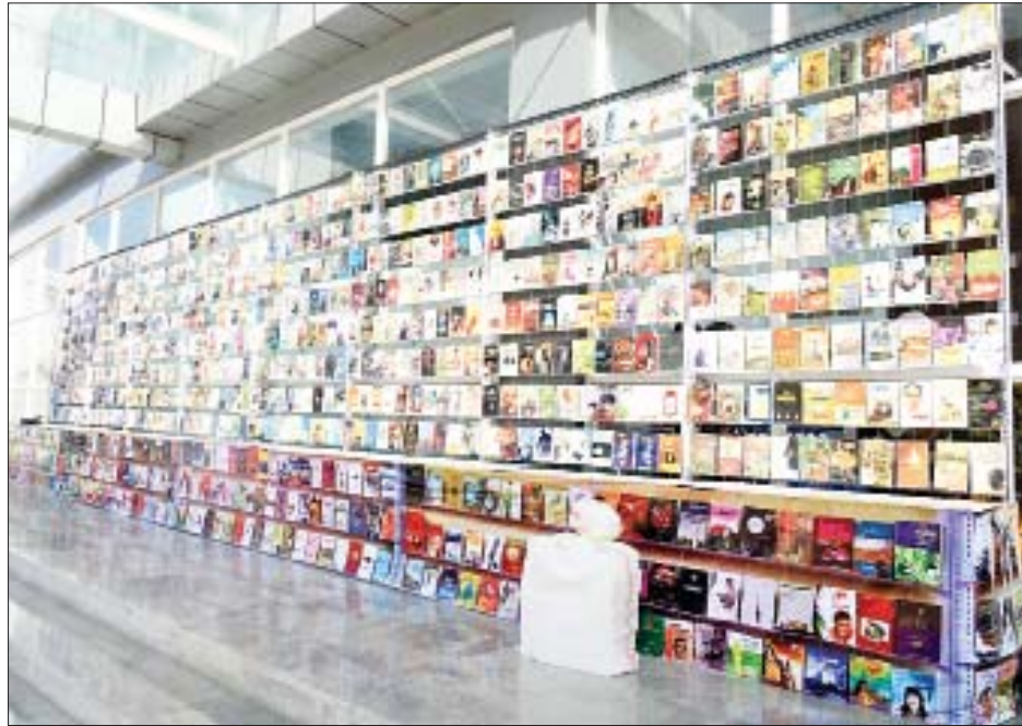
ထုတ်ဝေပြီးခဲ့သည့်စာအုပ်များအား ခင်းကျင်းပြသထားသည်ကို တွေ့ရစဉ်။

ထို့ပြင် လူငယ်နှင့်စာပေပွဲတော်ကြီး အောင်မြင်စွာ ကျင်းပနိုင်ရေးအတွက် ပြန်ကြားရေးဝန်ကြီးဌာန၊ ပညာရေးဝန်ကြီးဌာန၊ သိပ္ပံနှင့်နည်းပညာဝန်ကြီးဌာန၊