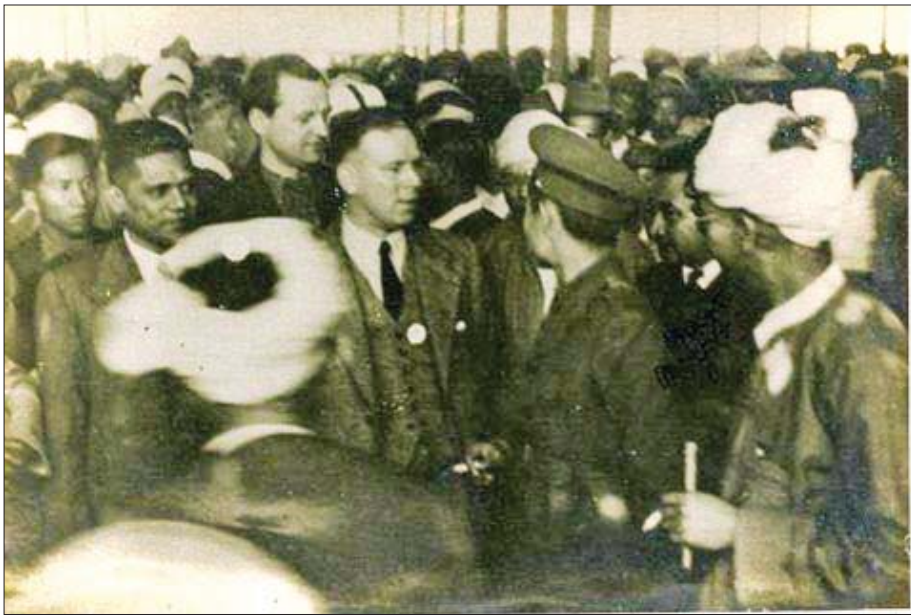
ဗိုလ်ချုပ်အောင်ဆန်းနှင့် အာသာဘော်တွန်မီလီ(လေဘာပါတီနိုင်ငံရေးပညာရှင်နှင့် ကိုယ်ပိုင်အုပ်ချုပ်ခွင့်ရပြည်နယ်များဆိုင်ရာ ဒုတိယအတွင်းရေးမှူးအဖြစ် လွှတ်တော်တွင် တာဝန်ယူနေသူ)တို့ တွေ့ဆုံစဉ်။

“ပြည်ထောင်စု”ကို ပြည်နယ်နှင့် တိုင်းများ ပေါင်းစည်း၍ ဗဟိုအာဏာပိုင်အဖွဲ့က စီမံခန့်ခွဲသည့် နိုင်ငံဟု မြန်မာအဘိဓာန်က ဖွင့်ဆိုသည်။ ‘a whole formed from parts or members’ ဟုလည်း ဆိုနိုင်သည်။ ၂၀၀၈ ခုနှစ် ဖွဲ့စည်းပုံအခြေခံဥပဒေက လည်း ပြည်ထောင်စုသမ္မတမြန်မာနိုင်ငံတော်ကို တိုင်းဒေသကြီး ခုနစ်ခုနှင့် ပြည်နယ်ခုနစ်ခုတို့ဖြင့်