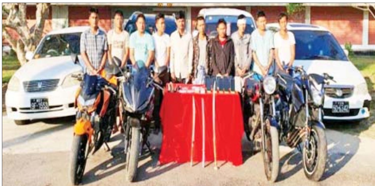
၂၀၂၂ ခုနှစ် ဇန်နဝါရီ ၁၈ ရက်တွင် ရန်ကင်းမြို့နယ် မင်းရဲကျော်စွာလမ်း၌ လူယက်မှုကျူးလွန်ခဲ့သော တရားခံများနှင့်အတူ သိမ်းဆည်း ရမိသည့်ပစ္စည်းများ မှတ်တမ်းဓာတ်ပုံ။