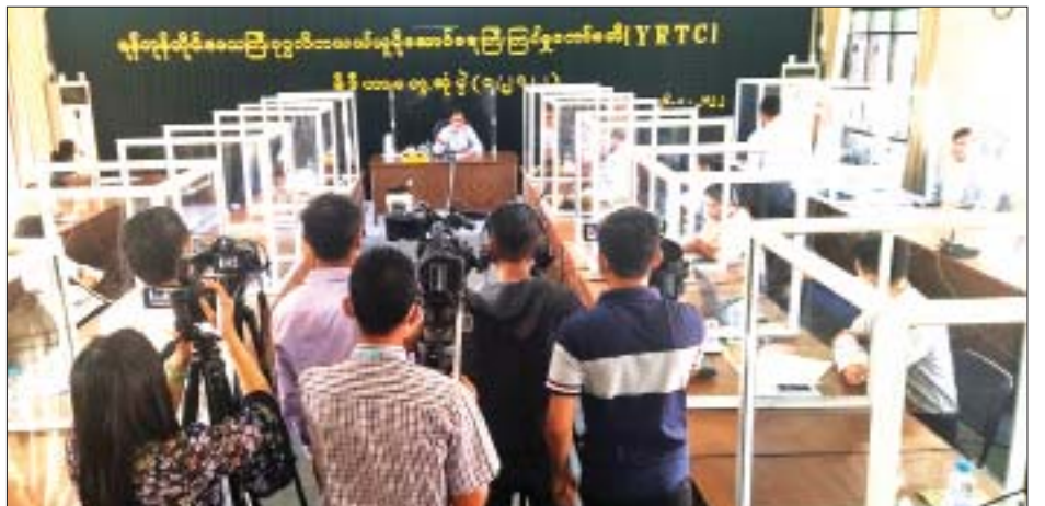
ရန်ကုန်တိုင်းဒေသကြီး ပုဂ္ဂလိကသယ်ယူပို့ဆောင်ရေး ကြီးကြပ်မှုကော်မတီ(YRTC)မှ မီဒီယာ ရှင်းလင်းပွဲ ကျင်းပစဉ်။

ယခုလတ်တလောတွင် YPS ကတ်များကို YUPT၊ YBPC၊ GYCY၊ ဗန္ဓုလနှင့် လူထုမိတ်ဆွေ ကုမ္ပဏီငါးခုမှ YBS ယာဉ်အစီးရေ ၁၉၄ စီးတွင် တပ်ဆင်အသုံးပြုလျက်ရှိသည်။ ကျန်သည့် ရန်ကုန် မြို့အတွင်း ပြေးဆွဲလျက်ရှိသော YBS ယာဉ်လိုင်း ကုမ္ပဏီများ၊ ယာဉ်ပိုင်ရှင်များနှင့်လည်း YPS ကတ် ကို ခရီးသွားပြည်သူများအကြား တွင်ကျယ်စွာ ဆက်လက်အသုံးပြုနိုင်ရေး အကောင်အထည်ဖော် ဆောင်ရွက်နိုင်ရန် YRTC နှင့် တွဲဖက်ပူးပေါင်းလုပ်ကိုင် လျက်ရှိသော Asia Starmar Transport Intelligent Co.,Ltd က ဆက်လက်ညှိနှိုင်း ဆောင်ရွက်မှုများ ပြုလုပ်သွားမည်ဖြစ်ကြောင်း သိရသည်။