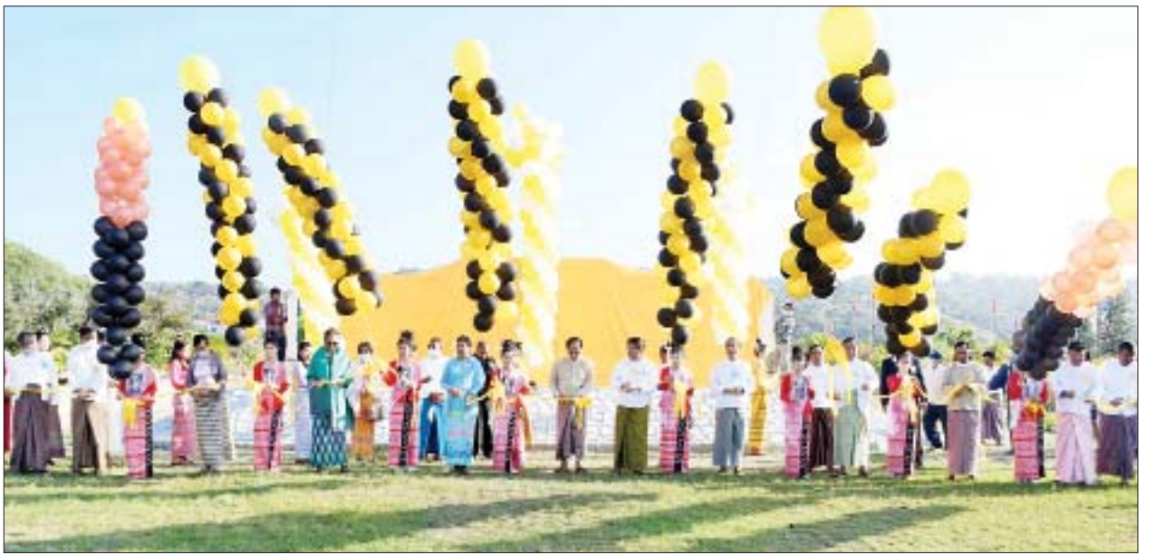
နိုင်ငံတော်စီမံအုပ်ချုပ်ရေးကောင်စီအဖွဲ့ဝင် ဒေါ်အေးနုစိန်နှင့် အဖွဲ့ဝင်များ Manaung Island Resort မာန်အောင်ကမ်းခြေဟိုတယ် ဆိုင်းဘုတ်ကို ဖဲကြိုးဖြတ်ဖွင့်လှစ်ပေးကြစဉ်။

နိုင်ငံတော်စီမံအုပ်ချုပ်ရေးကောင်စီအဖွဲ့ဝင် ဒေါ်အေးနုစိန်သည် ပြည်ထောင်စုဝန်ကြီး ဦးကိုကိုလှိုင်၊ ဒေါက်တာညွန့်ဖေ၊ ဦးစောထွန်းအောင်မြင့်၊ ပြည်နယ်ဝန်ကြီးချုပ် ဒေါက်တာအောင်ကျော်မင်း၊ အနောက်ပိုင်းတိုင်းစစ်ဌာနချုပ်တိုင်းမှူး ဗိုလ်ချုပ်ထင်လတ်ဦး၊ ဒုတိယဝန်ကြီး ဦးဇော်အေးမောင်၊ ပြည်ထောင်စုရွေးကောက်ပွဲကော်မရှင်အဖွဲ့ဝင် ဒေါ်နုမြင့်၊ နိုင်ငံတော်စီမံအုပ်ချုပ်ရေးကောင်စီဥက္ကဋ္ဌ အကြံပေးအဖွဲ့အဖွဲ့ဝင် ဒေါက်တာရင်ရင်နွယ်၊ ပြည်နယ်ဝန်ကြီးများ၊ ဌာနဆိုင်ရာ တာဝန်ရှိသူများနှင့်အတူ ယနေ့နံနက်ပိုင်းက မာန်အောင်မြို့နယ် ကအီးကျေးရွာအနီးရှိ မာန်အောင်ကျွန်းသဘာဝအခြေခံခရီးသွားလုပ်ငန်းနှင့် Manaung Island Resort မာန်အောင်ကမ်းခြေဟိုတယ်ဖွင့်ပွဲသို့ တက်ရောက်ကြသည်။