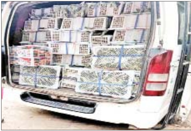
တရားမဝင်စားသောက်ကုန်နှင့် လူသုံးကုန်ပစ္စည်းများ သိမ်းဆည်းရမိသည့် မှတ်တမ်းဓာတ်ပုံများ။