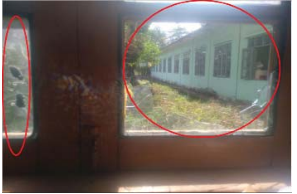
ဒဂုံမြို့သစ်(အရှေ့ပိုင်း)မြို့နယ်ရှိ အမက(၁)နှင့် အမက(၄) ကျောင်းအုပ်ကြီးရုံးခန်းအတွင်းသို့ ဖျက်ဆီးဝင်ရောက်၍ ပစ္စည်းခိုးယူခြင်းနှင့် ခြိမ်းခြောက်စာရေးသားမှုဖြစ်ပွားသည့် မှတ်တမ်းဓာတ်ပုံ။