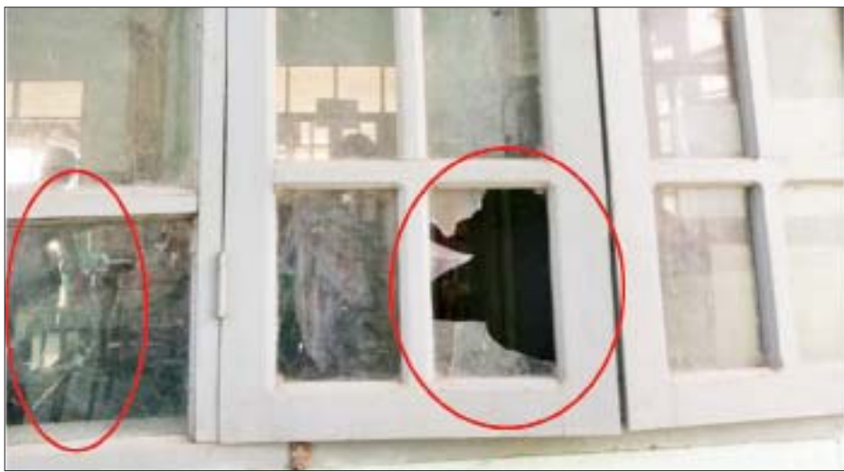
ဒဂုံမြို့သစ်(အရှေ့ပိုင်း)မြို့နယ်ရှိ အမက(၄) ကျောင်းအုပ်ကြီးရုံးခန်းကိုဖျက်ဆီးမှု မှတ်တမ်းဓာတ်ပုံ။

နေပြည်တော် ဇန်နဝါရီ ၂၆ နိုင်ငံတစ်နိုင်ငံ ဖွံ့ဖြိုးတိုးတက်ရေးအတွက် လူ့စွမ်းအားအရင်းအမြစ် ဖွံ့ဖြိုးတိုးတက်ရေးသည် အဓိကအခန်းကဏ္ဍမှပါဝင်ပြီး လူ့စွမ်းအားအရင်း အမြစ်ဖွံ့ဖြိုးတိုးတက်ရန်အတွက် ပညာရည်မြင့်မား ရေးမှာ အရေးအကြီးဆုံးဖြစ်သောကြောင့် နိုင်ငံတော် အစိုးရအနေဖြင့် ပညာရေးကဏ္ဍမြင့်မားတိုးတက်ရေး အတွက် အခြေခံလိုအပ်ချက်များဖြစ်သည့် စာသင် ကျောင်းများ တည်ဆောက်ပြုပြင်ပေးခြင်း၊ သင်ထောက်ကူပစ္စည်းများ ဖြည့်တင်းပေးခြင်း၊ အရည်အချင်းပြည့်ဝသည့် ဆရာ ဆရာမများ မွေးထုတ် ပေးခြင်း စသည်တို့ကို ဆောင်ရွက်ပေးလျက်ရှိ သည်။ ထို့ပြင် အနာဂတ်မျိုးဆက်သစ်လူငယ်များ ကျောင်းနေပျော်ရေးနှင့် ပညာသင်ကြားရေးတွင် စာမျက်နှာ ၁၇ ကော်လံ ၁ သို့ ◆