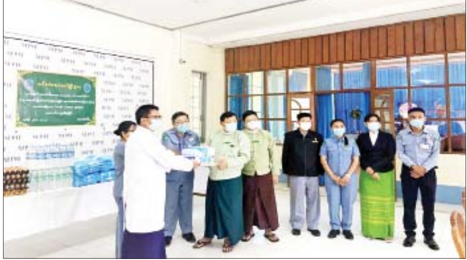
တနင်္သာရီတိုင်းဒေသကြီး ဖွံ့ဖြိုးမှုကြီးကြပ်ရေးရုံး(ထားဝယ်)ကွပ်ကဲမှုအောက်ရှိ မြိတ်ခရိုင်ဖွံ့ဖြိုးမှုကြီးကြပ်ရေးရုံးက မြိတ်ခရိုင် မြိတ်မြို့ပြည်သူ့ဆေးရုံကြီး၌ ဖွင့်လှစ်ထားရှိသည့် ကိုဗစ်စင်တာသို့ ဇန်နဝါရီ ၂၅ ရက်တွင် ထောက်ပံ့ပစ္စည်းများ လှူဒါန်းစဉ်။ သတင်းစဉ်

ဖော်ဆောင်ရွက်နေသည့် ထောက်ကြံ့ကုန်းကျေးရွာအုပ်စု ကုတင်ကျင်းကျေးရွာ၌ မြေသားရေကန်အနက်နှိုက်ခြင်းလုပ်ငန်းနှင့် ထက်မြတ်သစ္စာကုမ္ပဏီက အကောင်အထည်ဖော်ဆောင်ရွက်လျက်ရှိသည့် ကြိုးကြာကျေးရွာအုပ်စု ကြိုးကြာကျေးရွာ၌ ကျေးရွာကုန်ထုတ်လမ်း ဖောက်လုပ်ခြင်းလုပ်ငန်း ဆောင်ရွက်နေမှုများကို ကွင်းဆင်းကြည့်ရှုစစ်ဆေးပြီး လုပ်ငန်းနှင့်ပတ်သက်၍ သတ်မှတ်စံချိန်စံနှုန်းပြည့်မီနိုင်ရန်နှင့် သတ်မှတ်ကာလအတွင်း ပြီးစီးနိုင်ရေး အလေးထားလိုက်နာဆောင်ရွက်ကြရန် မှာကြားခဲ့ကြကြောင်း သိရသည်။ မင်းမြင့်မိုးရီ