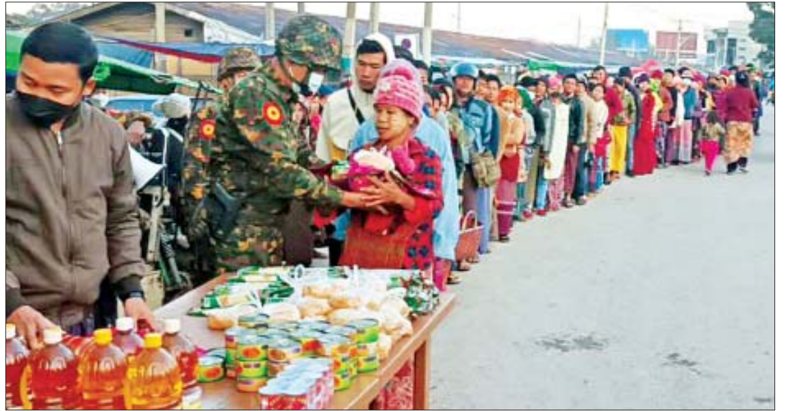
အကြမ်းဖက်အဖွဲ့အစည်းများအား ထောက်ပံ့ရန်အတွက် ပြင်ဆင်ထားသည့် သိမ်းဆည်းရမိ စားသောက်ကုန်နှင့် လူသုံးကုန်ပစ္စည်းများကို ဒေသခံပြည်သူများအား ထောက်ပံ့ပေးအပ်စဉ်။

နေပြည်တော် ဇန်နဝါရီ ၂၆ အကြမ်းဖက်အဖွဲ့အစည်းများဖြစ်သည့် NUG၊ CRPH နှင့် PDF အမည်ခံ အကြမ်းဖက်သမားများကို ထောက်ပံ့ရန်အတွက် လွိုင်ကော် မြို့နယ် ဘာဒိုကျေးရွာ အဆောက်အအုံ တစ်လုံးအတွင်း၌ သိမ်းဆည်း ထားရှိသည့် လက်ဆွဲအိတ် အလုံး ၁၂၀၊ ခေါက်ဆွဲထုပ် ၁၉၅၀၊ ကွေကာအုပ် အထုပ် ၁၂၀၊ အသားဘူးမျိုးစုံ ၇၆၀၊ ဆီဘူး ၅၅၀၊ စောင်အထည် ၁၀၀ နှင့် ကုလားပဲ၊ ဆပ်ပြာမှုန့်၊ ဆပ်ပြာခဲ အစရှိသည့် လူသုံးကုန်ပစ္စည်း မျိုးစုံကို ဇန်နဝါရီ ၂၄ ရက် မွန်းလွဲ ၃ နာရီခန့်တွင် လုံခြုံရေးတပ်ဖွဲ့ဝင် များက တွေ့ရှိသိမ်းဆည်းခဲ့သည်။ သိမ်းဆည်းရမိခဲ့သည့် စားသောက်ကုန်နှင့် လူသုံးကုန်ပစ္စည်း များကို လွိုင်ကော်မြို့နယ်အတွင်းရှိ ဒေသခံပြည်သူများအား ယနေ့