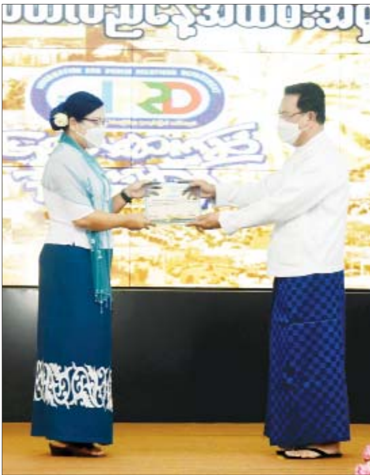
ပြည်ထောင်စုဝန်ကြီး ဦးမောင်မောင်အုန်း ခရိုင်အလိုက်ထူးချွန်ဆုများ ပေးအပ်ချီးမြှင့်စဉ်။

ပြန်ကြားရေးနှင့် ပြည်သူ့ဆက်ဆံရေးဦးစီးဌာနသည် တစ်နိုင်ငံလုံးတွင် တိုင်းဒေသကြီး၊ ပြည်နယ်၊ ခရိုင်၊ မြို့နယ်နှင့် မြို့ရုံးပေါင်း ၄၂၇ ရုံးဖြင့် ဖွဲ့စည်းထားသည့် ကြီးမားသော ကွန်ရက်ကြီး တစ်ခုဖြစ်ကြောင်း၊ ပြန်ကြားရေးဝန်ကြီးဌာန၏ အဓိက လုပ်ငန်းတာဝန်ကြီးသုံးရပ်ဖြစ်သည့် သတင်းအချက်အလက်များ ဖြန့်ဝေပေးခြင်း၊ အသိပညာပေးခြင်းနှင့် ဖျော်ဖြေပေးခြင်း