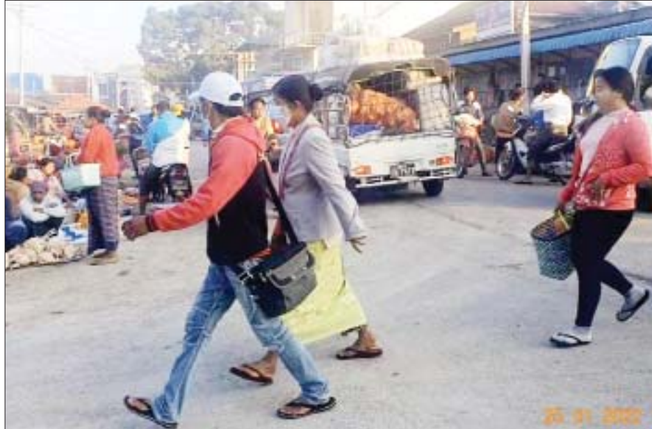
လျှိုင်ကော်မြို့ ဗဟိုဈေးရွာတွင် ပြည်သူများ ရောင်းဝယ်နေမှုကို တွေ့ရစဉ်။

ပုံမှန်အတိုင်း ပြန်လည်ဖွင့်လှစ် ကယားပြည်နယ်အတွင်း NUG နှင့် PDF အမည်ခံ အကြမ်းဖက် သမားများအား လုံခြုံရေးတပ်ဖွဲ့ဝင် များက ဖော်ထုတ်ဖမ်းဆီးခဲ့ရာမှ စတင်၍ PDF အမည်ခံအကြမ်းဖက် အဖွဲ့များ၊ KNPP အဖွဲ့အချို့နှင့် လုံခြုံရေးတပ်ဖွဲ့ဝင်များ ၂၀၂၂ ခုနှစ် ဇန်နဝါရီလအတွင်း ထိတွေ့ တိုက်ပွဲများ ဖြစ်ပွားခဲ့ပြီး အဆိုပါ ဒေသတစ်ဝိုက်အား လုံခြုံရေး တပ်ဖွဲ့ဝင်များက ဇန်နဝါရီ ၂၅ ရက် မှစ၍ ပြန်လည်ထိန်းချုပ်နိုင်ခဲ့ရာ နယ်မြေတည်ငြိမ်အေးချမ်းမှုများ ပြန်လည်ရရှိလာသဖြင့် ဈေးများ