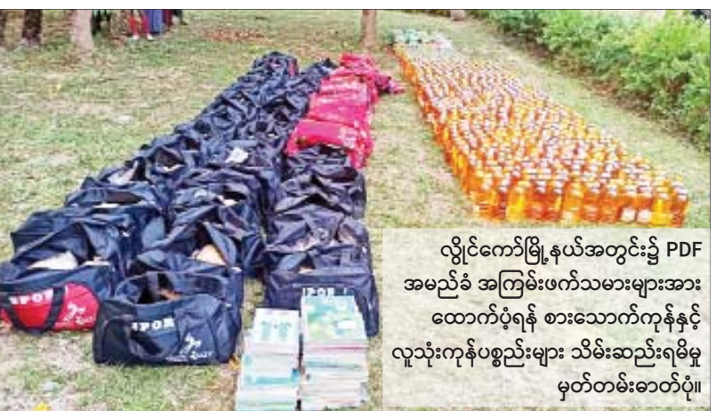
လွိုင်ကော်မြို့နယ်အတွင်း၌ PDF အမည်ခံ အကြမ်းဖက်သမားများအား ထောက်ပံ့ရန် စားသောက်ကုန်နှင့် လူသုံးကုန်ပစ္စည်းများ သိမ်းဆည်းရမိမှု မှတ်တမ်းဓာတ်ပုံ။

ထိုသို့ပြန်လည်ဝင်ရောက်လာသည့် တိုက်ပွဲရှောင်ပြည်သူများကို သက်ဆိုင်ရာ တာဝန်ရှိသူများက စာမျက်နှာ ၁၅ ကော်လံ ၁ သို့ ■