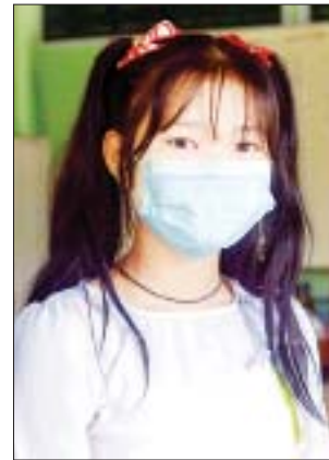
မပန်းမြတ်သီတာအောင်