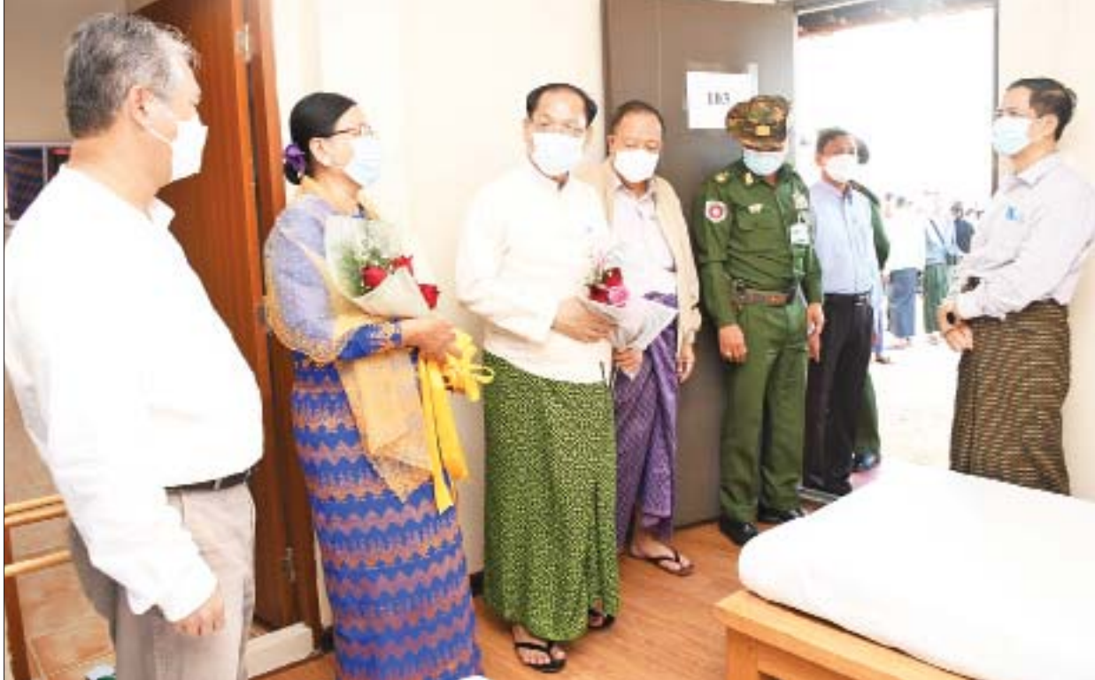
နိုင်ငံတော်စီမံအုပ်ချုပ်ရေးကောင်စီအဖွဲ့ဝင်နှင့် တာဝန်ရှိသူများ ခရီးသွားဧည့်သည်များ တည်းခိုနိုင်ရန် ဆောင်ရွက်ထားသည့် တည်းခို ဆောင်ဘန်ဂလိုများ၊ အခန်းများကို လှည့်လည်ကြည့်ရှုစဉ်။

ထို့နောက် နိုင်ငံတော်စီမံအုပ်ချုပ်ရေးကောင်စီအဖွဲ့ဝင်နှင့်အဖွဲ့ သည် မာန်အောင်ကျွန်းပတ်လမ်းပေါ်ရှိ ကမားချောင်းတံတား ပေ ၃၀၀