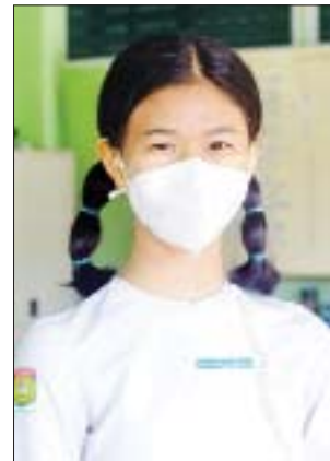
မ L-ဆန်းဂျာနူး