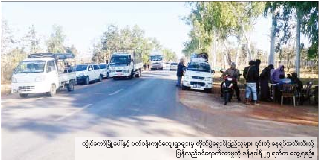
လွိုင်ကော်မြို့ပေါ်နှင့် ပတ်ဝန်းကျင်ကျေးရွာများမှ တိုက်ပွဲရှောင်ပြည်သူများ ၎င်းတို့ နေရပ်အသီးသီးသို့ ပြန်လည်ဝင်ရောက်လာမှုကို ဇန်နဝါရီ ၂၅ ရက်က တွေ့ရစဉ်။