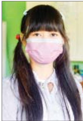
မမိုးပြည့်ပြည့်နိုင်