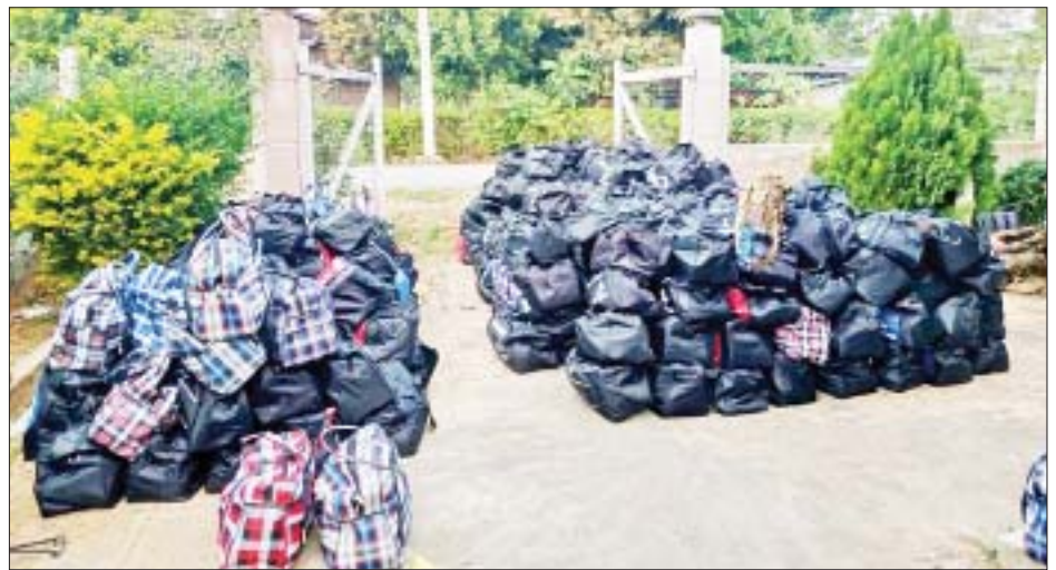
လျှိုင်ကော်မြို့နယ်အတွင်း၌ PDF အမည်ခံ အကြမ်းဖက်သမားများအား ထောက်ပံ့ရန် စားသောက်ကုန်နှင့် လူသုံးကုန်ပစ္စည်းများ သိမ်းဆည်းရမိမှု မှတ်တမ်းဓာတ်ပုံများ။

○ ကျောပိုးမှ ပစ်ခတ်တိုက်ခိုက်ခြင်းအပါအဝင် အခြားအကြမ်းဖက်မှုလုပ်ရပ်များကို လုပ်ဆောင်လျက်ရှိသောကြောင့် လုံခြုံရေးတပ်ဖွဲ့ဝင်များအနေဖြင့် ကယားပြည်နယ်အတွင်း လိုအပ်သည့်လုံခြုံရေးနှင့် နယ်မြေစိုးမိုးရေး လုပ်ငန်းများကို ဆောင်ရွက်လျက်ရှိပါသည်။