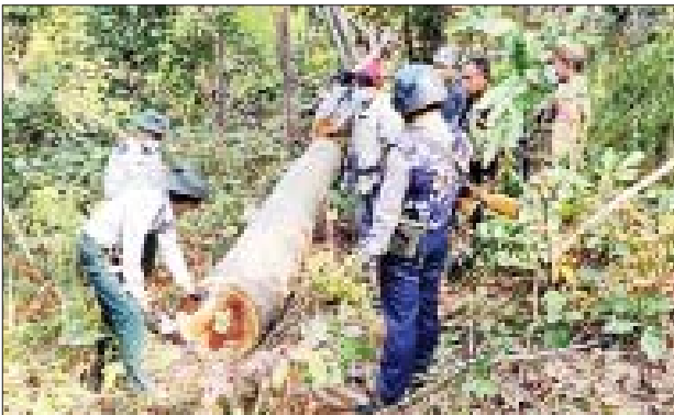
တရားမဝင်စားသောက်ကုန်များ၊ သစ်များ သိမ်းဆည်းရမိသည့် မှတ်တမ်းဓာတ်ပုံများ။

နေပြည်တော် ဇန်နဝါရီ ၂၅ - တရားမဝင် ကုန်သွယ်မှု တိုက်ဖျက်ရေး ဦးဆောင် ကော်မတီ၏ ကြီးကြပ်ကွပ်ကဲမှု ဖြင့် တရားမဝင် ကုန်သွယ်မှုများကို ဥပဒေနှင့်အညီ ထိရောက်စွာ တားဆီး အရေးယူနိုင်ရေး ဆောင်ရွက်လျက်ရှိရာ ဇန်နဝါရီ ၂၀၊ ၂၁၊ ၂၂၊ ၂၃ နှင့် ၂၄ ရက်တို့တွင် ရခိုင်ပြည်နယ် တရားမဝင် ကုန်သွယ်မှု တိုက်ဖျက်ရေး အထူးအဖွဲ့၏ စီမံခန့်ခွဲမှုဖြင့် သစ်တောဦးစီးဌာနမှ ဦးဆောင်၍ ပူးပေါင်းအဖွဲ့များဖြင့် စစ်ဆေးမှု များ ဆောင်ရွက်ခဲ့ရာ သံတွဲ မြို့နယ်၊ ဝှံမြို့နယ်၊ ကျောက်ဖြူ မြို့နယ်၊ အမ်းမြို့နယ်နှင့် တောင်ကုတ် မြို့နယ်များတွင် တရားမဝင်သစ်မျိုးစုံ ၇၀ ဒသမ ဖြင့် ၉၄ တန် (ခန့်မှန်းတန်ဖိုး ငွေကျပ် ၄၈၄၁၂၉၁) အား သိမ်းဆည်းရမိခဲ့ပြီး သစ်တော