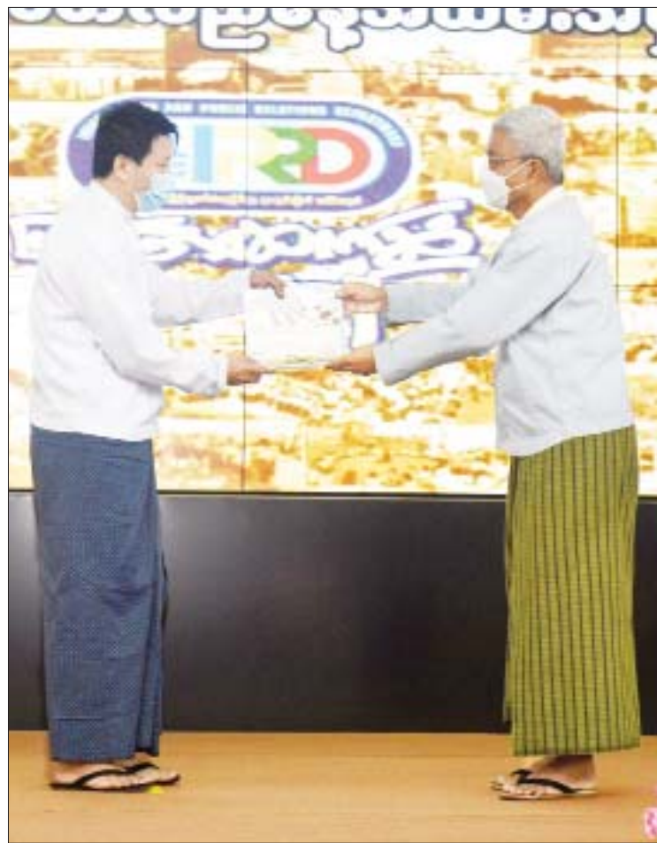
ဒုတိယဝန်ကြီး ဦးရဲတင့် မြို့နယ်အလိုက်ထူးချွန်ဆုများ ပေးအပ်ချီးမြှင့်စဉ်။

လုပ်ငန်းတာဝန်များကို ခေတ်မီသစ်လွင်သည့် အစီအစဉ်များဖြင့် ပြုပြင်ပြောင်းလဲဆောင်ရွက်လျက်ရှိကြောင်း။