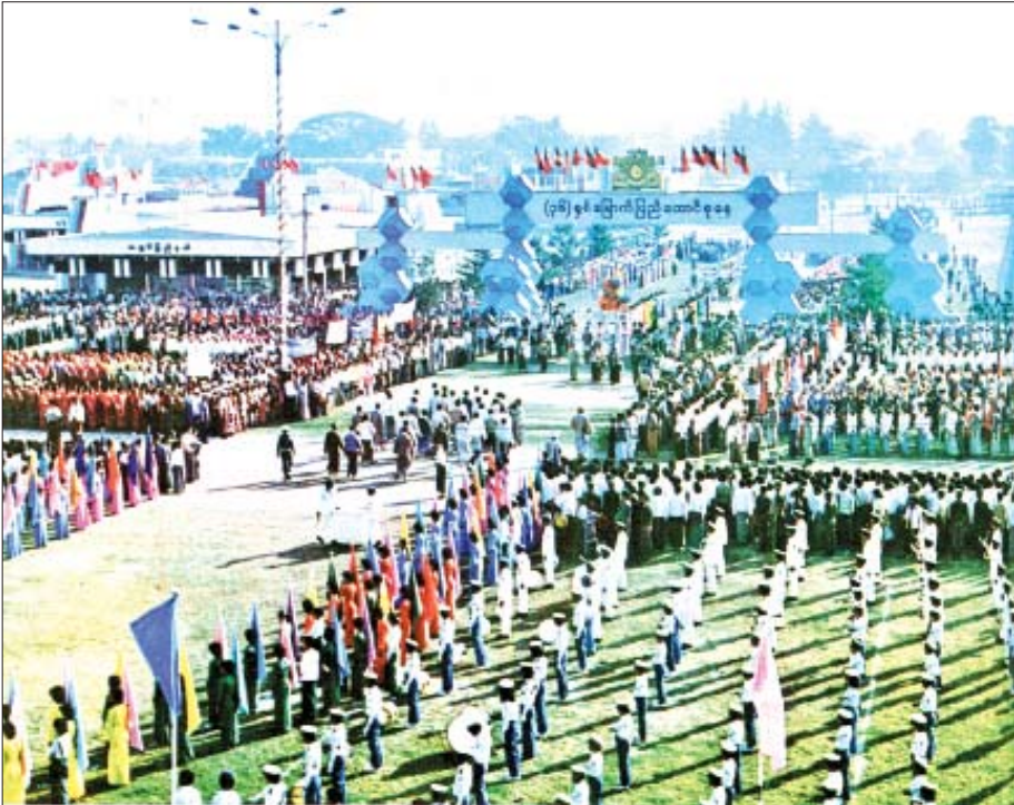
၁၉၈၃ ခုနှစ်က ရန်ကုန်မြို့၊ ကျိုက္ကဆံကွင်း၌ ပြည်ထောင်စုနေ့အခမ်းအနား ကျင်းပစဉ်။

အရွယ်ရောက်လို့ လုပ်ငန်းခွင်ရောက်တော့ လည်း လုပ်ငန်းသဘာဝအရ ပြည်ထောင်စုနယ်မြေ