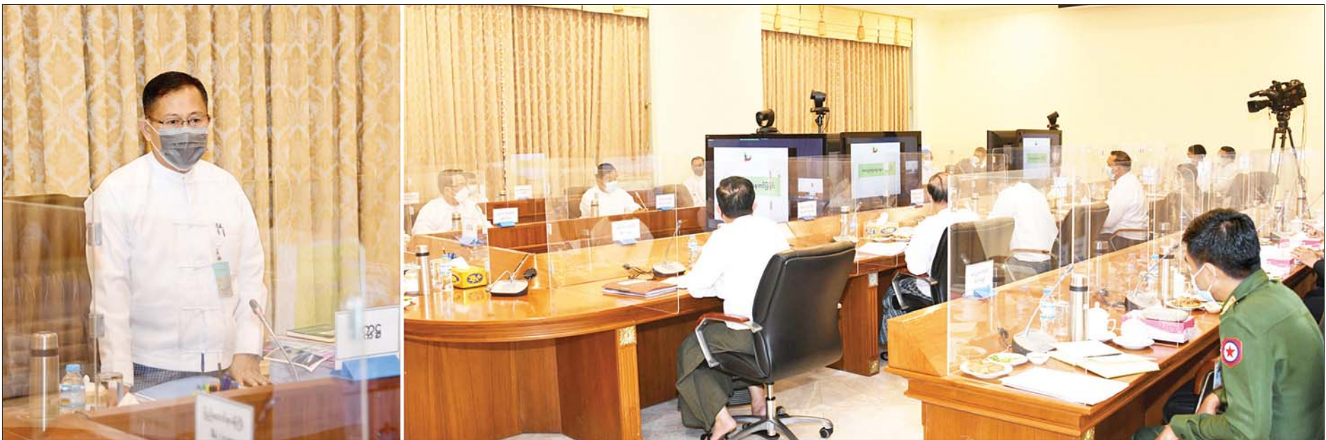
၂၀၂၂ ခုနှစ် (၇၅)နှစ်မြောက် စိန်ရတု ပြည်ထောင်စုနေ့ကျင်းပရေးဗဟိုကော်မတီဥက္ကဋ္ဌ၊ နိုင်ငံတော်စီမံအုပ်ချုပ်ရေးကောင်စီဒုတိယဥက္ကဋ္ဌ၊ ဒုတိယဝန်ကြီးချုပ် ဒုတိယဗိုလ်ချုပ်မှူးကြီးစိုးဝင်း ဗဟိုကော်မတီ ဒုတိယအကြိမ်ညှိနှိုင်းအစည်းအဝေးတွင် အမှာစကားပြောကြားစဉ်။

နေပြည်တော် ဇန်နဝါရီ ၂၅ ၂၀၂၂ ခုနှစ် (၇၅)နှစ်မြောက် စိန်ရတု ပြည်ထောင်စုနေ့ကျင်းပရေး ဗဟိုကော်မတီ ဒုတိယအကြိမ်ညှိနှိုင်းအစည်းအဝေးကို ယနေ့မွန်းလွဲ ၂ နာရီတွင် နေပြည်တော်ရှိ နိုင်ငံတော်စီမံအုပ်ချုပ်ရေးကောင်စီ ဥက္ကဋ္ဌရုံး အစည်းအဝေးခန်းမ၌ ကျင်းပရာ ၂၀၂၂ ခုနှစ် (၇၅)နှစ်မြောက် စိန်ရတု ပြည်ထောင်စုနေ့ကျင်းပရေး ဗဟိုကော်မတီဥက္ကဋ္ဌ၊ နိုင်ငံတော်စီမံ အုပ်ချုပ်ရေးကောင်စီဒုတိယဥက္ကဋ္ဌ၊ ဒုတိယဝန်ကြီးချုပ် ဒုတိယ ဗိုလ်ချုပ်မှူးကြီး စိုးဝင်း တက်ရောက်အမှာစကား ပြောကြားသည်။ တက်ရောက် အစည်းအဝေးသို့ ဗဟိုကော်မတီဝင် ပြည်ထောင်စုဝန်ကြီးများ၊ စီမံခန့်ခွဲမှုကော်မတီဥက္ကဋ္ဌ၊ နေပြည်တော်ကောင်စီဥက္ကဋ္ဌ၊ အမျိုးသား စည်းလုံးညီညွတ်ရေးနှင့် ငြိမ်းချမ်းရေးဖော်ဆောင်မှုညှိနှိုင်းရေး ကော်မတီ အတွင်းရေးမှူး၊ ဆပ်ကော်မတီဥက္ကဋ္ဌများဖြစ်ကြသည့် ဒုတိယဝန်ကြီးများနှင့် တာဝန်ရှိသူများ တက်ရောက်ကြပြီး ကျန် ဆပ်ကော်မတီဥက္ကဋ္ဌများနှင့် တာဝန်ရှိသူများက ဗီဒီယိုကွန်ဖရင့်ဖြင့် တက်ရောက်ကြသည်။ ဦးစွာ နိုင်ငံတော်စီမံအုပ်ချုပ်ရေးကောင်စီဒုတိယဥက္ကဋ္ဌ၊ ဒုတိယ ဝန်ကြီးချုပ်က စာမျက်နှာ ၃ ကော်လံ ၁ သို့ ▢