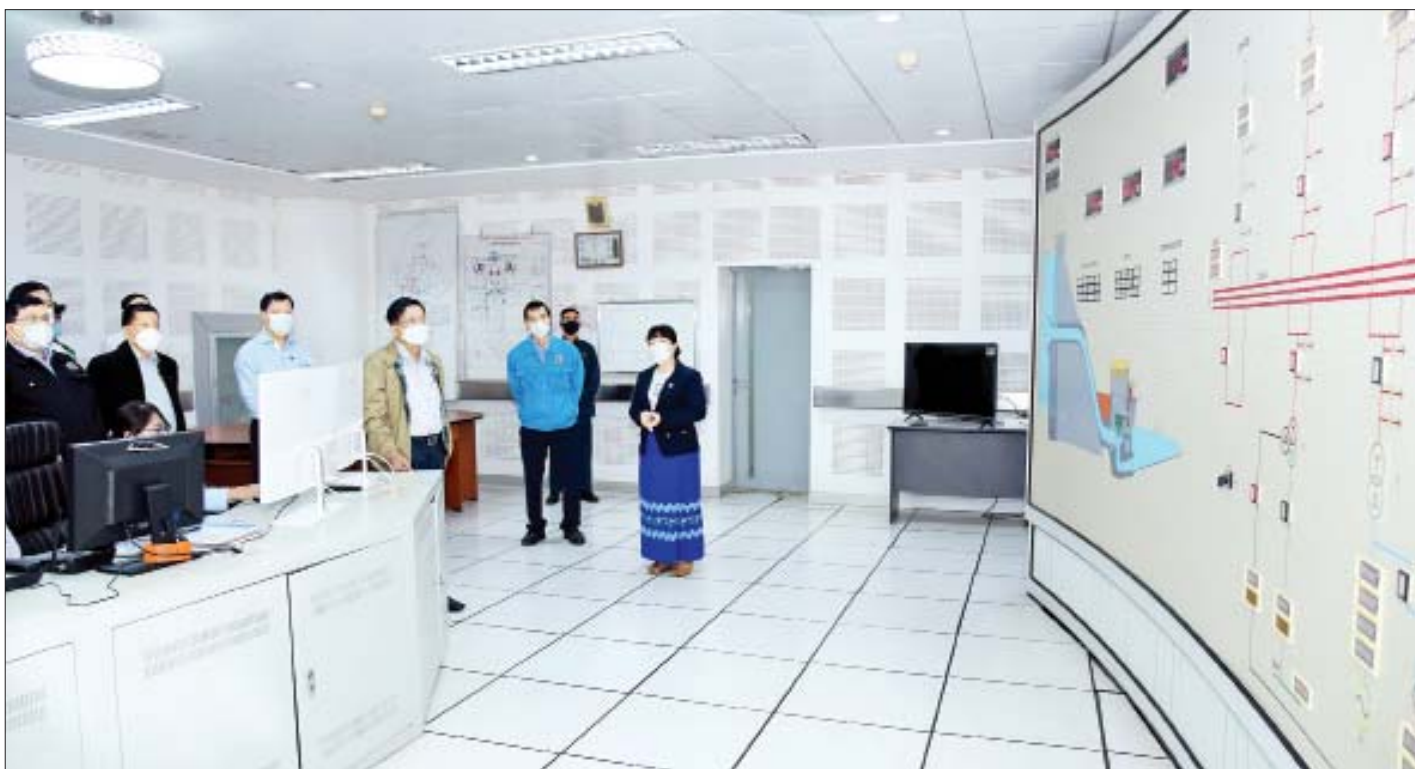
နိုင်ငံတော်စီမံအုပ်ချုပ်ရေးကောင်စီဥက္ကဋ္ဌ၊ နိုင်ငံတော်ဝန်ကြီးချုပ် ဗိုလ်ချုပ်မှူးကြီးမင်းအောင်လှိုင် ရဲရွာရေအားလျှပ်စစ်စီမံကိန်းတွင် လျှပ်စစ်ဓာတ်အားများ ထုတ်လုပ်နေမှုအခြေအနေကို ကြည့်ရှုစစ်ဆေးစဉ်။

ဦးစွာ စီမံကိန်းရှင်းလင်းဆောင်၍ လျှပ်စစ်နှင့် စွမ်းအင်ဝန်ကြီးဌာန ပြည်ထောင်စုဝန်ကြီး ဦးအောင်သန်းဦးက ဓာတ်အားပေးစက်ရုံဆိုင်ရာ အကျဉ်းချုပ် အချက်အလက်များ၊ နှစ်အလိုက် ရဲရွာတမံ ရေသိုလှောင်မှုအခြေအနေ၊ နှစ်အလိုက် ဓာတ်အားထုတ်လုပ်နိုင်မှုအခြေအနေ၊ ရဲရွာရေလှောင် တမံ နှစ်အလိုက် ရေဝင်ရောက်မှုအခြေအနေ၊ ရေလှောင်တမံရေအမြင့်အလိုက် စက်တစ်လုံး ထုတ်လုပ်နိုင်မှုစွမ်းအား၊ ဝန်ထမ်းအင်အားနှင့် ဝန်ထမ်းအိမ်ရာများ ပြုပြင်ဆောင်ရွက်နေမှု အခြေအနေ၊ ဓာတ်အားထုတ်လုပ်မှု ကုန်ကျစရိတ်၊ ၂၀၁၉-၂၀၂၀ ဘဏ္ဍာနှစ်အတွင်း စက်အမှတ်(၄) အကြီးစားပြုပြင်ခြင်းဆောင်ရွက်ခဲ့မှု အခြေအနေ၊ မြစ်ငယ်မြစ်ပေါ်ရှိ ရေအားလျှပ်စစ် အရင်းအမြစ်များ ၏ လျှပ်စစ်စီမံကိန်းများ၏ အခြေအနေ၊ နမူတူ (သီပေါ)ရေအားလျှပ်စစ်စီမံကိန်းဆိုင်ရာ အချက် အလက်များနှင့် လုပ်ငန်းဆောင်ရွက်မှု အခြေအနေ၊ အထက်ရဲရွာစီမံကိန်းဆိုင်ရာ အချက်အလက်များနှင့် လုပ်ငန်းဆောင်ရွက်နေမှု အခြေအနေ၊ အလယ်ရဲရွာ ရေအားလျှပ်စစ်စီမံကိန်းဆိုင်ရာ အချက်အလက်များ နှင့် လုပ်ငန်းဆောင်ရွက်နေမှု အခြေအနေ၊ ဒီးဒုတ် ရေအားလျှပ်စစ်စီမံကိန်းဆိုင်ရာ အချက်အလက်များ နှင့် လုပ်ငန်းဆောင်ရွက်နေမှု အခြေအနေ၊ ၂၀၂၂