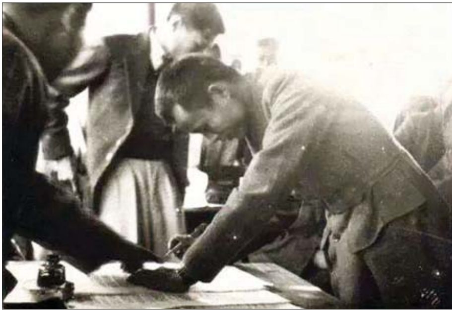
၁၉၄၇ ခုနှစ် ဖေဖော်ဝါရီ ၁၂ ရက်က ကျင်းပသည့် ပင်လုံညီလာခံ၌ ဗိုလ်ချုပ်အောင်ဆန်း ပင်လုံစာချုပ် လက်မှတ်ရေးထိုးစဉ်။

ပုံရိပ်စာပေ ပြည်ထောင်စုစိတ်ဓာတ်အခြေအနေအထားကို အကဲဖြတ်ချက်ပြုထားခဲ့သည်။ ပုံရိပ်စာပေ ပြည်ထောင်စုစိတ်ဓာတ်အခြေအနေအထားကို အကဲဖြတ်ချက်ပြုထားခဲ့သည်။ ပုံရိပ်စာပေ ပြည်ထောင်စုစိတ်ဓာတ်အခြေအနေအထားကို အကဲဖြတ်ချက်ပြုထားခဲ့သည်။ ပုံရိပ်စာပေ ပြည်ထောင်စုစိတ်ဓာတ်အခြေအနေအထားကို အကဲဖြတ်ချက်ပြုထားခဲ့သည်။