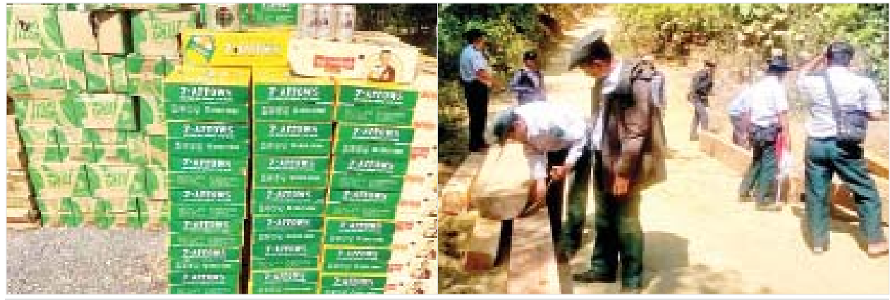
သိမ်းဆည်းရမိသည့် တရားမဝင် စားသောက်ကုန်၊ လူသုံးကုန်ပစ္စည်းများနှင့် သစ်မျိုးစုံများအား တွေ့ရစဉ်။

သို့ပါ၍ ဇန်နဝါရီ ၂၂ ရက်၊ ၂၃ ရက်နှင့် ၂၄ ရက်တို့တွင် သိမ်းဆည်းရမိမှု စုစုပေါင်းမှာ အမှုတွဲ(၁၃)မှု၊ စုစုပေါင်း(ခန့်မှန်းတန်ဖိုးငွေကျပ် ၂၈၆၅၀၇၅) ဖြစ်ကြောင်း တရားမဝင်ကုန်သွယ်မှုတိုက်ဖျက်ရေး ဦးဆောင်ကော်မတီမှ သိရသည်။ သတင်းစဉ်