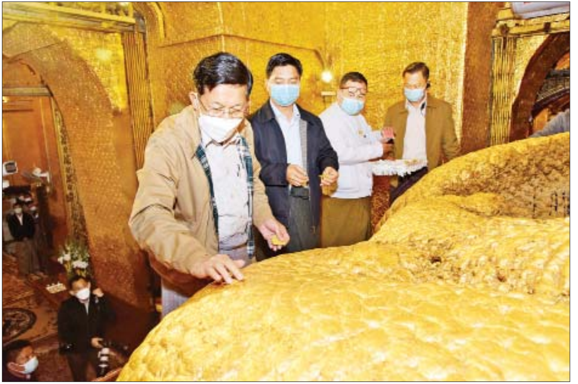
နိုင်ငံတော်စီမံအုပ်ချုပ်ရေးကောင်စီဥက္ကဋ္ဌ၊ နိုင်ငံတော်ဝန်ကြီးချုပ် ဗိုလ်ချုပ်မှူးကြီးမင်းအောင်လှိုင် မဟာမုနိရုပ်ရှင်တော်မြတ်ကြီးအား ရွှေသင်္ကန်းကပ်လှူပူဇော်စဉ်။

ဆက်လက်ပြီး နိုင်ငံတော်စီမံအုပ်ချုပ်ရေးကောင်စီဥက္ကဋ္ဌ၊ နိုင်ငံတော်ဝန်ကြီးချုပ်နှင့် အဖွဲ့ဝင်များသည် ဘုရားပရိဝုဏ်တော်အတွင်းရှိ မြန်မာ့လက်မှုအနုပညာပစ္စည်းများ ပြခန်းနှင့် သမိုင်းပန်းချီပြခန်းတို့အတွင်း လှည့်လည်ကြည့်ရှု၍ ပြခန်းများအတွင်း ခင်းကျင်းပြသထားသည့် ပစ္စည်းများနှင့် ပန်းချီကားများသည် တန်ဖိုးဖြတ်၍မရသည့် သမိုင်းဝင်ပစ္စည်းများ၊