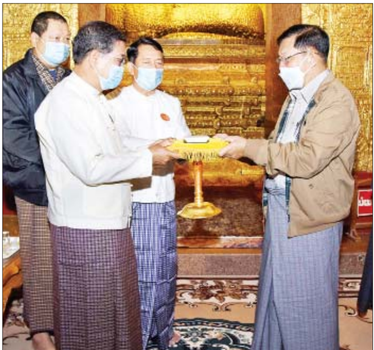
နိုင်ငံတော်စီမံအုပ်ချုပ်ရေးကောင်စီဥက္ကဋ္ဌ၊ နိုင်ငံတော်ဝန်ကြီးချုပ် ဗိုလ်ချုပ်မှူးကြီး မင်းအောင်လှိုင် မဟာမုနိရုပ်ရှင်တော်မြတ်ကြီးအတွက် ဘက်စုံအလှူငွေများပေးအပ်လှူဒါန်းရာ ဂေါပကဥက္ကဋ္ဌဦးစိုးလင်းနှင့် အဖွဲ့ဝင်များက လက်ခံရယူကြစဉ်။

လက်ရာများဖြစ်သည့်အတွက် ရေရှည် တည်တံ့ခိုင်မြဲအောင် ထိန်းသိမ်းထားရှိရန် လိုအပ်သည့်အခြေအနေ၊ သမိုင်းအချက်အလက်များကို စနစ်တကျ မှတ်တမ်းတင် ပြုစုထားမှသာလျှင် နောင်လာနောက် သားများ အလွယ်တကူလေ့လာနိုင်ပြီး တန်ဖိုးထားနိုင်မည်ဖြစ်သဖြင့် ရှေးဟောင်း ပစ္စည်းများ၏ အလှူရှင်များမှတစ်ဆင့် ခေတ်ကာလ အထောက်အထားများ၊ အချက်အလက်များကိုပြုစု၍ စနစ်တကျ မှတ်တမ်းတင်ထားရှိရန် လိုအပ်သည့် အခြေအနေ၊ ပြုပြင်မွမ်းမံမှုများ ပြုလုပ် ရာတွင် မူလအမှတ်အသားနှင့် အထောက်အထားများ ပျောက်ပျက်မှုမရှိစေရေး ကျွမ်းကျင်ပညာရှင်များနှင့် ဆောင်ရွက် ရန်လိုအပ်သည့် အခြေအနေများနှင့် ပတ်သက်၍ တာဝန်ရှိသူများကို မှာကြား ခဲ့ကြောင်း သိရသည်။ သတင်းစဉ်