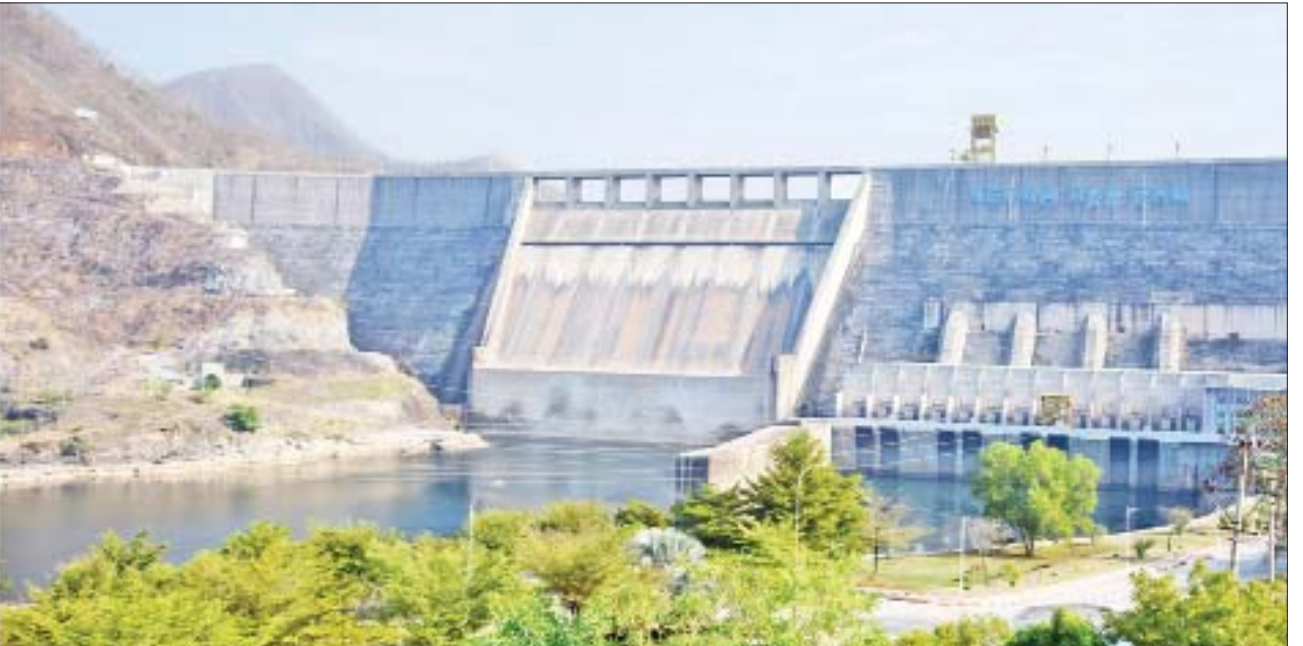
နိုင်ငံတော်စီမံအုပ်ချုပ်ရေးကောင်စီဥက္ကဋ္ဌ၊ နိုင်ငံတော်ဝန်ကြီးချုပ် ဗိုလ်ချုပ်မှူးကြီးမင်းအောင်လှိုင်နှင့် အဖွဲ့ဝင်များ ရဲရွာရေလှောင်တံမံအတွင်း ရေဝင်ရောက်မှုအခြေအနေကို ကြည့်ရှုစစ်ဆေးစဉ်။