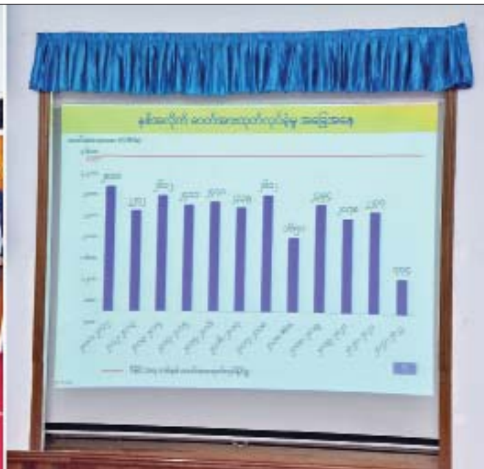
နိုင်ငံတော်စီမံအုပ်ချုပ်ရေးကောင်စီဥက္ကဋ္ဌ၊ နိုင်ငံတော်ဝန်ကြီးချုပ် ဗိုလ်ချုပ်မှူးကြီးမင်းအောင်လှိုင်အား လျှပ်စစ်နှင့် စွမ်းအင်ဝန်ကြီးဌာန ပြည်ထောင်စုဝန်ကြီး ဦးအောင်သန်းဦးက ရှင်းလင်းတင်ပြစဉ်။