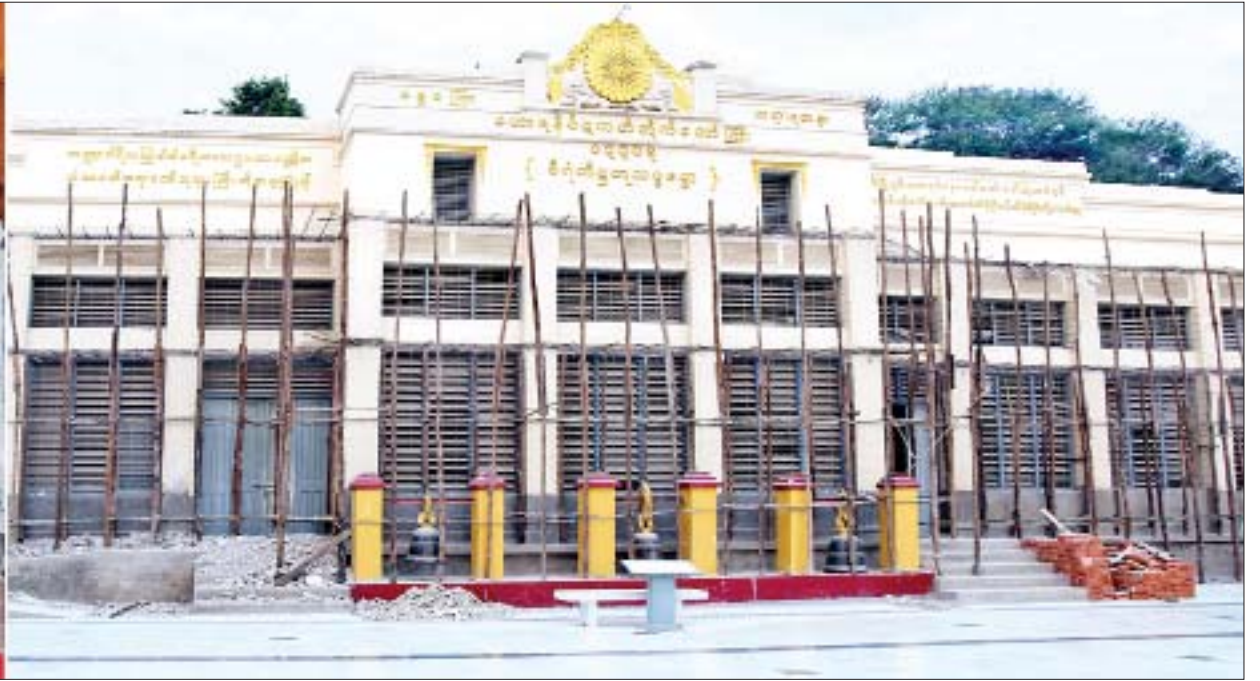
နိုင်ငံတော်စီမံအုပ်ချုပ်ရေးကောင်စီဥက္ကဋ္ဌ၊ နိုင်ငံတော်ဝန်ကြီးချုပ် ဗိုလ်ချုပ်မှူးကြီးမင်းအောင်လှိုင် မဟာမုနိပိဋကတ်တိုက်တော်ကြီး ပြုပြင်မွမ်းမံနေမှုအခြေအနေများကို ကြည့်ရှုစဉ်။