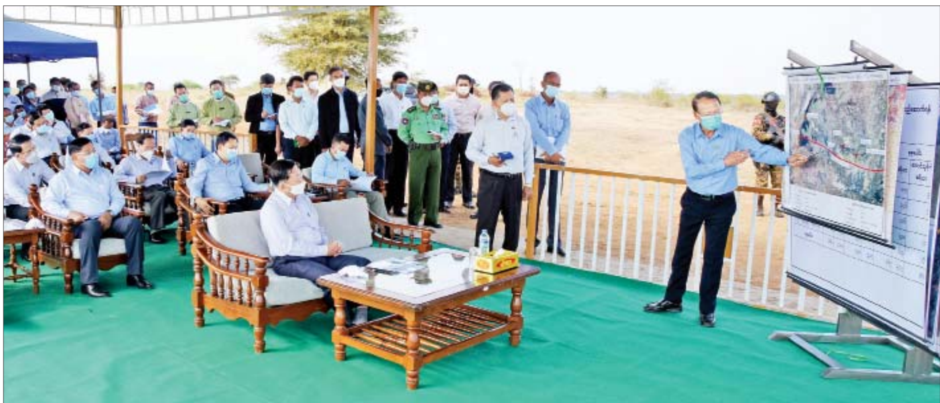
နိုင်ငံတော်စီမံအုပ်ချုပ်ရေးကောင်စီဥက္ကဋ္ဌ၊ နိုင်ငံတော်ဝန်ကြီးချုပ် ဗိုလ်ချုပ်မှူးကြီးမင်းအောင်လှိုင်အား မြင်းခြံမြို့နယ်နှင့် ငါးစွန်မြို့နယ်အတွင်း ဆောင်ရွက်မည့် တိုင်းဒေသကြီး မွေးမြူရေးဇုန်နှင့်ပတ်သက်၍ တာဝန်ရှိသူတစ်ဦးက ရှင်းလင်းတင်ပြစဉ်။

(နိုင်ငံတော်စီမံအုပ်ချုပ်ရေးကောင်စီဥက္ကဋ္ဌ၊ နိုင်ငံတော်ဝန်ကြီးချုပ် ဗိုလ်ချုပ်မှူးကြီး မင်းအောင်လှိုင် ၁၇-၁-၂၀၂၂ ရက်နေ့တွင် အဆင့်မြင့်ပညာကဏ္ဍ လုပ်ငန်းညှိနှိုင်းအစည်းအဝေး၌ ပြောကြားသည့် အမှာစကားမှ ကောက်နုတ်ချက်)