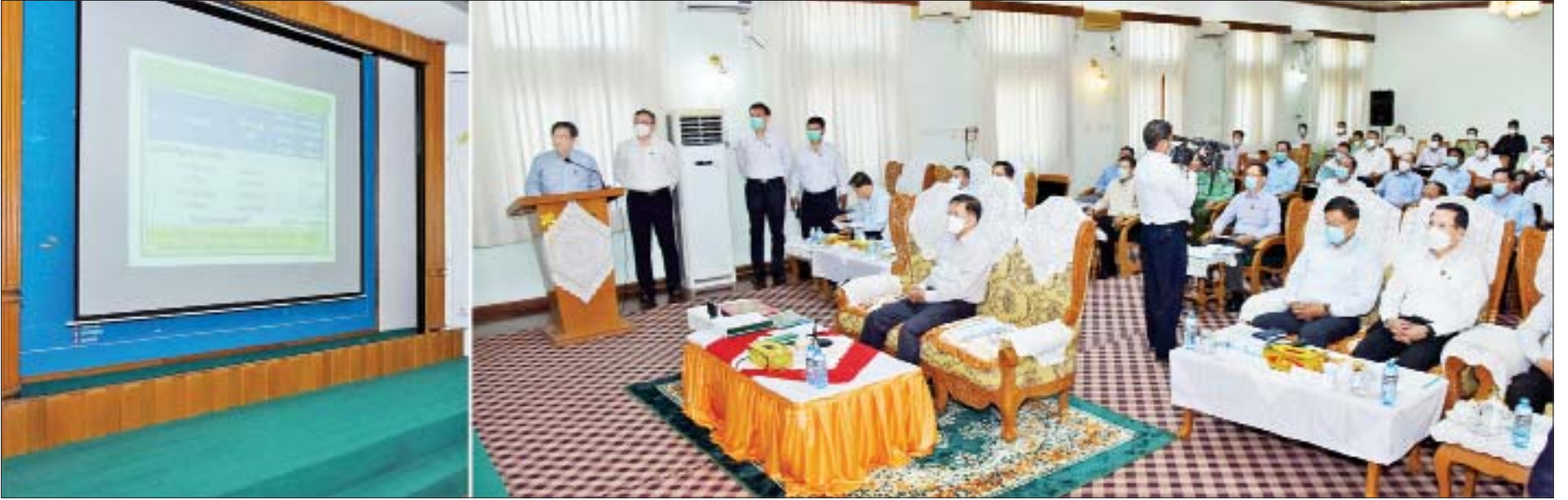
နိုင်ငံတော်စီမံအုပ်ချုပ်ရေးကောင်စီဥက္ကဋ္ဌ၊ နိုင်ငံတော်ဝန်ကြီးချုပ် ဗိုလ်ချုပ်မှူးကြီးမင်းအောင်လှိုင်အား စက်မှုဝန်ကြီးဌာန ပြည်ထောင်စုဝန်ကြီး ဒေါက်တာချာလီသန်းက ရှင်းလင်းတင်ပြစဉ်။