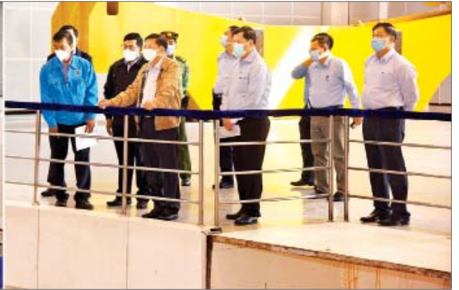
နိုင်ငံတော်စီမံအုပ်ချုပ်ရေးကောင်စီဥက္ကဋ္ဌ၊ နိုင်ငံတော်ဝန်ကြီးချုပ် ဗိုလ်ချုပ်မှူးကြီး မင်းအောင်လှိုင် ရဲရွာရေအားလျှပ်စစ်စီမံကိန်းတွင် လျှပ်စစ်ဓာတ်အားများ ထုတ်လုပ်နေမှုအခြေအနေကို ကြည့်ရှုစစ်ဆေးစဉ်။