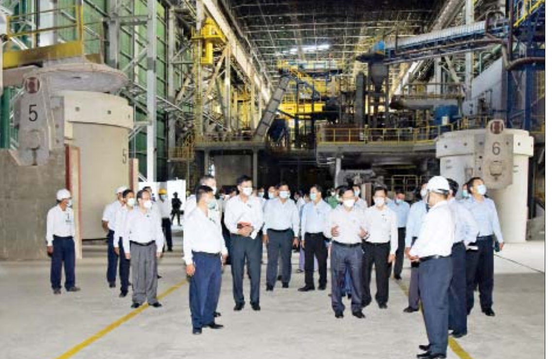
နိုင်ငံတော်စီမံအုပ်ချုပ်ရေးကောင်စီဥက္ကဋ္ဌ၊ နိုင်ငံတော်ဝန်ကြီးချုပ် ဗိုလ်ချုပ်မှူးကြီးမင်းအောင်လှိုင်နှင့် အဖွဲ့ဝင်များ အမှတ်(၁) သံမဏိစက်ရုံ(မြင်းခြံ)အတွင်း ကြည့်ရှုစစ်ဆေးစဉ်။

ရှင်းလင်းတင်ပြမှုများအပေါ် နိုင်ငံတော်စီမံအုပ်ချုပ်ရေးကောင်စီဥက္ကဋ္ဌ၊ နိုင်ငံတော်ဝန်ကြီးချုပ်က မိမိတို့အနေဖြင့် ပြည်တွင်း