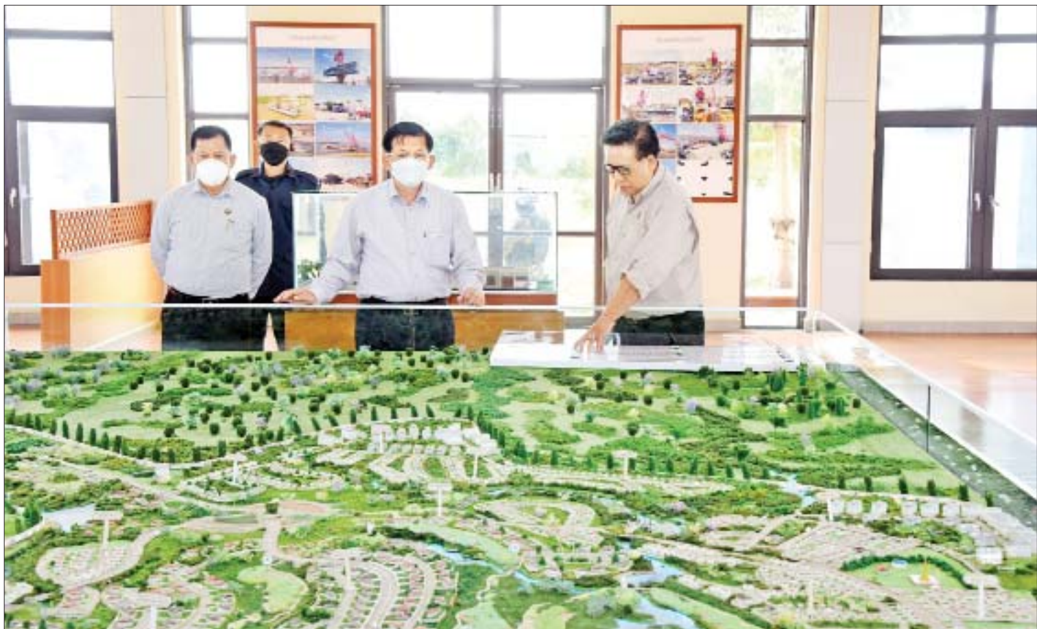
နိုင်ငံတော်စီမံအုပ်ချုပ်ရေးကောင်စီဥက္ကဋ္ဌ၊ နိုင်ငံတော်ဝန်ကြီးချုပ် ဗိုလ်ချုပ်မှူးကြီးမင်းအောင်လှိုင်အား စီမံကိန်းဥက္ကဋ္ဌ ဦးအောင်ဝင်းခိုင်က မန္တလေး-မြို့သာစက်မှုဥယျာဉ်မြို့တော် တည်ဆောက်ရေးစီမံကိန်း အကောင်အထည်ဖော်ဆောင်ရွက်နေမှုအခြေအနေများကို စီမံကိန်းအကွက်ချပုံစံဖော်ပြ၍ ရှင်းလင်းတင်ပြစဉ်။

နေပြည်တော် ဇန်နဝါရီ ၂၄ နိုင်ငံတော်စီမံအုပ်ချုပ်ရေးကောင်စီ ဥက္ကဋ္ဌ၊ နိုင်ငံတော်ဝန်ကြီးချုပ် ဗိုလ်ချုပ်မှူးကြီးမင်းအောင်လှိုင်သည် အဖွဲ့ဝင်များ၊ မန္တလေးတိုင်းဒေသကြီး ဝန်ကြီးချုပ်၊ အလယ်ပိုင်းတိုင်းစစ်ဌာနချုပ် တိုင်းမှူးနှင့် တာဝန်ရှိသူများ လိုက်ပါ၍ ယနေ့မုန်းလွဲပိုင်းတွင် မန္တလေးတိုင်းဒေသကြီး မန္တလေး-မြို့သာ စက်မှုဥယျာဉ်မြို့တော် တည်ဆောက်ရေးစီမံကိန်း အကောင်အထည်ဖော်ဆောင်ရွက်နေမှု အခြေအနေများကို သွားရောက်ကြည့်ရှုစစ်ဆေးသည်။