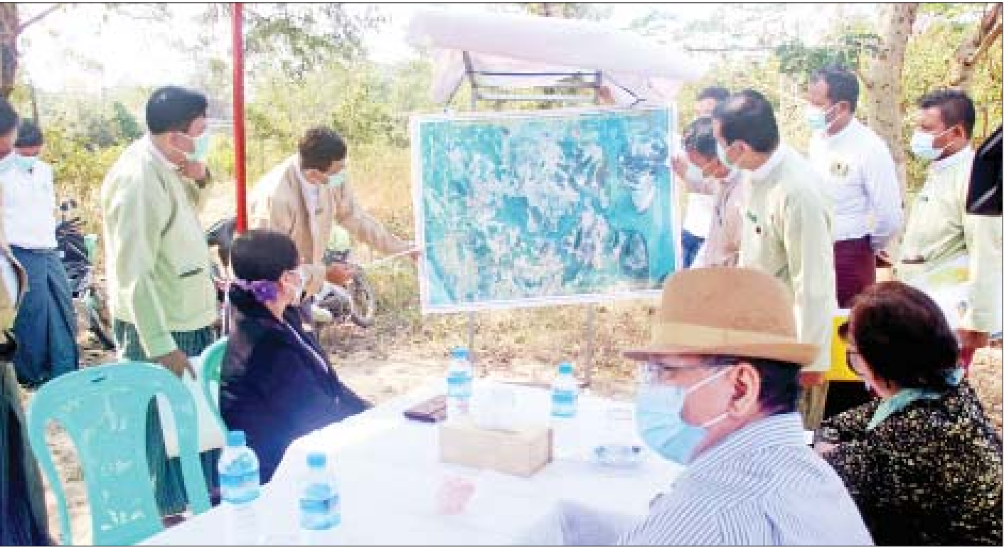
နိုင်ငံတော်စီမံအုပ်ချုပ်ရေးကောင်စီအဖွဲ့ဝင် ဒေါ်အေးနုစိန်နှင့်အဖွဲ့အား ဧက ၂၅၀ မြေနေရာတွင် SEZ အကောင်အထည်ဖော်ဆောင်ရွက်မည့် လုပ်ငန်းအခြေအနေကို တာဝန်ရှိသူတစ်ဦးက ရှင်းလင်းတင်ပြစဉ်။

ကျောက်ဖြူ ဇန်နဝါရီ ၂၄ နိုင်ငံတော်စီမံအုပ်ချုပ်ရေးကောင်စီအဖွဲ့ဝင် ဒေါ်အေးနုစိန်သည် ပြည်ထောင်စုဝန်ကြီးဦးစောထွန်းအောင်မြင့်၊ ဒုတိယဝန်ကြီး ဦးဇော်အေးမောင်၊ နိုင်ငံတော်စီမံအုပ်ချုပ်ရေးကောင်စီဥက္ကဋ္ဌ၏ (အကြံပေး)အဖွဲ့ဝင် ဒေါက်တာရင်ရင်နွယ်တို့နှင့်အတူ ယနေ့ညနေပိုင်းတွင် အစိုးရစက်မှုလက်မှုသိပ္ပံ(ကျောက်ဖြူ)ရှိ အစည်းအဝေးခန်းမ၌ ကျောင်းအုပ်ဆရာကြီး၊ ဆရာ ဆရာမများနှင့် တွေ့ဆုံသည်။