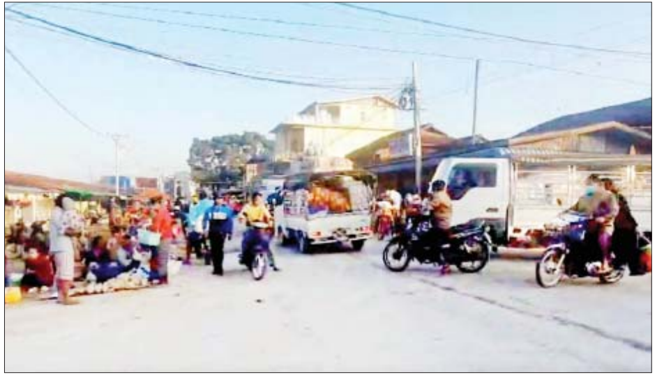
ကယားပြည်နယ်အတွင်း နယ်မြေတည်ငြိမ်အေးချမ်းမှုများ ပြန်လည်ရရှိလာသဖြင့် ဈေးများ ပုံမှန်အတိုင်း ပြန်လည်ဖွင့်လှစ် ရောင်းဝယ်ဖောက်ကားလျက်ရှိသည်ကို တွေ့ရစဉ်။

ကယားပြည်နယ်အတွင်းမှ စနစ်တကျလက်ခံခဲ့ပြီး လိုအပ်သည်များ ညှိနှိုင်းဖြည့်ဆည်း၍ ကူညီထောက်ပံ့မှုများ ဆောင်ရွက်ပေးလျက်ရှိသည်။