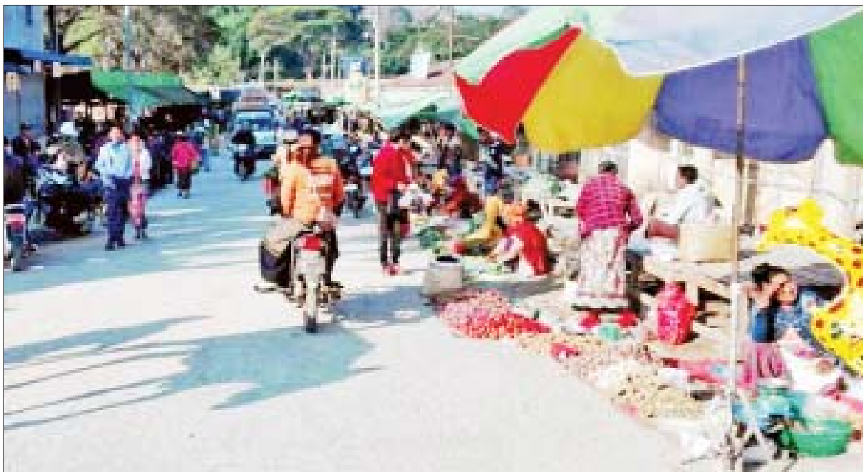
လွိုင်ကော်မြို့နယ် သီရိမင်္ဂလာဈေးရှေ့တွင် ပြည်သူများ ဈေးရောင်းဝယ်နေမှုများအား တွေ့ရစဉ်။