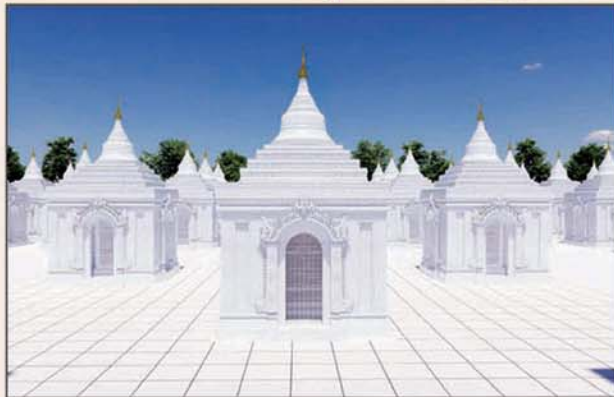
ကျောက်စာရုံစေတီ(၁၂ x ၁၂x ၁၈)ပေ ၁ ဆူ တန်ဖိုး- ၂၇၉ သိန်း