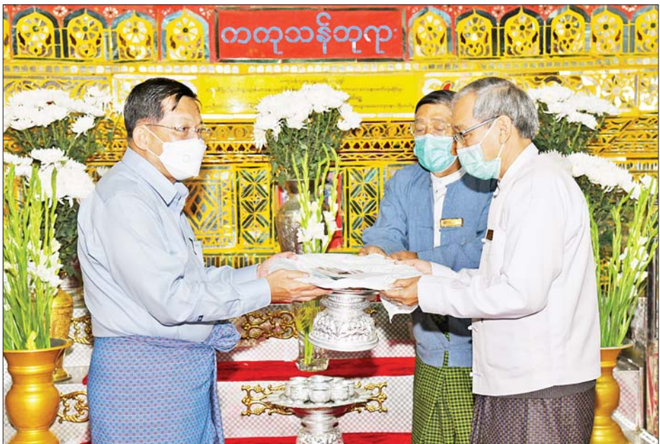
နိုင်ငံတော်စီမံအုပ်ချုပ်ရေး ကောင်စီဥက္ကဋ္ဌ၊ နိုင်ငံတော် ဝန်ကြီးချုပ် ဗိုလ်ချုပ်မှူးကြီး မင်းအောင်လှိုင် မန္တလေးမြို့ ကျက်သရေဆောင် မန္တလေး တောင်ဆုတောင်းပြည့်မြတ်စွာ ဘုရားကြီးအတွက် ဘက်စုံ အလှူငွေများ ပေးအပ်လှူဒါန်း စဉ်။

မှာကြား ယင်းနောက် မန္တလေးမြို့ကျက်သရေဆောင် မန္တလေးတောင် ဆုတောင်းပြည့် မြတ်စွာဘုရားကြီးအား လက်ယာရစ်လှည့်လည် ဖူးမြော်ကြည်ညိုပြီး သမိုင်းဝင်မန္တလေးတောင်တော်နှင့် ဆုတောင်းပြည့် မြတ်စွာဘုရားကြီး တောင်တက်လမ်း၊ စောင်းတန်းများ၊ ရင်ပြင်တော်နှင့် ဘုရားကြီး၏အမိုးပြာသာဒ်များ ရေရှည်တည်တံ့ခိုင်မြဲမှုရှိအောင် ထိန်းသိမ်းဆောင်ရွက်ရန် လိုအပ်သည်များနှင့် ပတ်သက်၍ တာဝန်ရှိ သူများအား မှာကြားသည်။ ထို့နောက် နိုင်ငံတော်စီမံအုပ်ချုပ်ရေးကောင်စီဥက္ကဋ္ဌ၊ နိုင်ငံတော် ဝန်ကြီးချုပ်သည် ဧည့်သည်တော်မှတ်တမ်းစာအုပ်တွင် လက်မှတ် ရေးထိုးပူဇော်ခဲ့ကြောင်း သိရသည်။