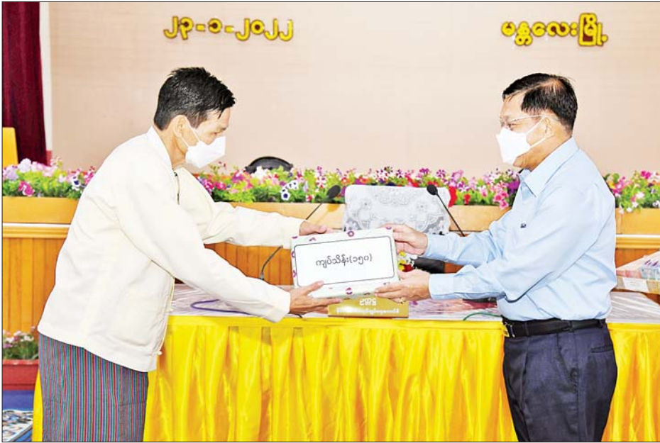
နိုင်ငံတော်စီမံအုပ်ချုပ်ရေးကောင်စီဥက္ကဋ္ဌ၊ နိုင်ငံတော်ဝန်ကြီးချုပ် ဗိုလ်ချုပ်မှူးကြီး မင်းအောင်လှိုင်က ရန်ပုံငွေထောက်ပံ့ပေးအပ်ရာ မန္တလေးမြို့ YMBA အသင်းဥက္ကဋ္ဌ ဦးကြည်စိန် လက်ခံရယူစဉ်။