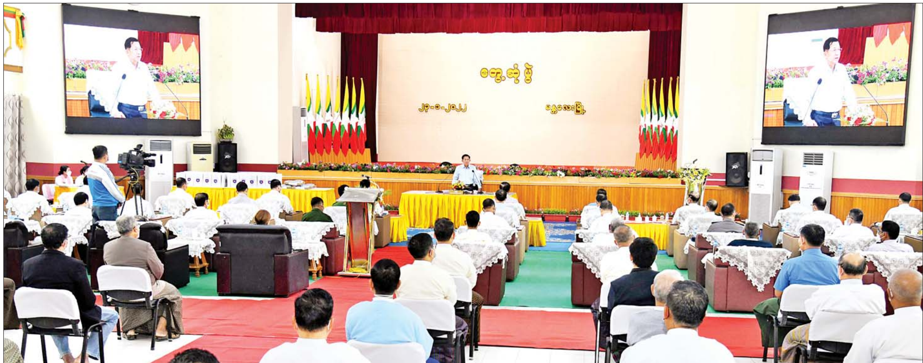
နိုင်ငံတော်စီမံအုပ်ချုပ်ရေးကောင်စီဥက္ကဋ္ဌ၊ နိုင်ငံတော်ဝန်ကြီးချုပ် ဗိုလ်ချုပ်မှူးကြီး မင်းအောင်လှိုင် မန္တလေးမြို့ရှိ ဘာသာပေါင်းစုံအဖွဲ့များ၊ မြို့မ၊ မြို့ဖများ၊ မန္တလေးစက်မှုဇုန်စီမံခန့်ခွဲရေးကော်မတီ၊ မန္တလေးတိုင်း ကုန်သည်များနှင့် စက်မှုလက်မှုလုပ်ငန်းရှင်များအသင်းတို့မှ တာဝန်ရှိသူများအား တွေ့ဆုံအမှာစကားပြောကြားစဉ်။