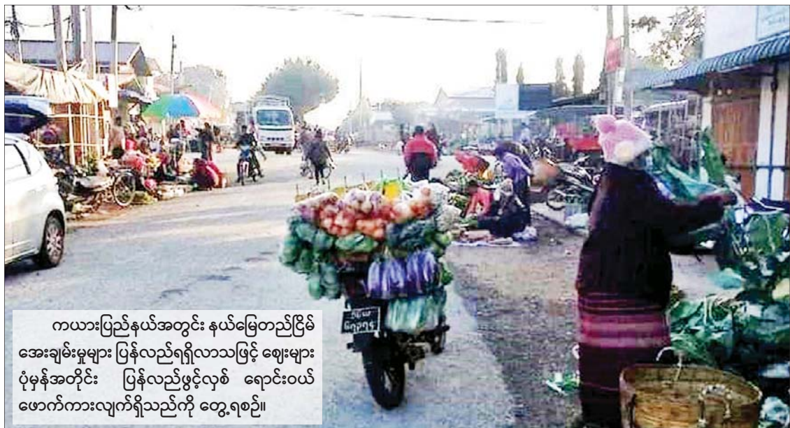
ကယားပြည်နယ်အတွင်း နယ်မြေတည်ငြိမ် အေးချမ်းမှုများ ပြန်လည်ရရှိလာသဖြင့် ဈေးများ ပုံမှန်အတိုင်း ပြန်လည်ဖွင့်လှစ် ရောင်းဝယ် ဖောက်ကားလျက်ရှိသည်ကို တွေ့ရစဉ်။