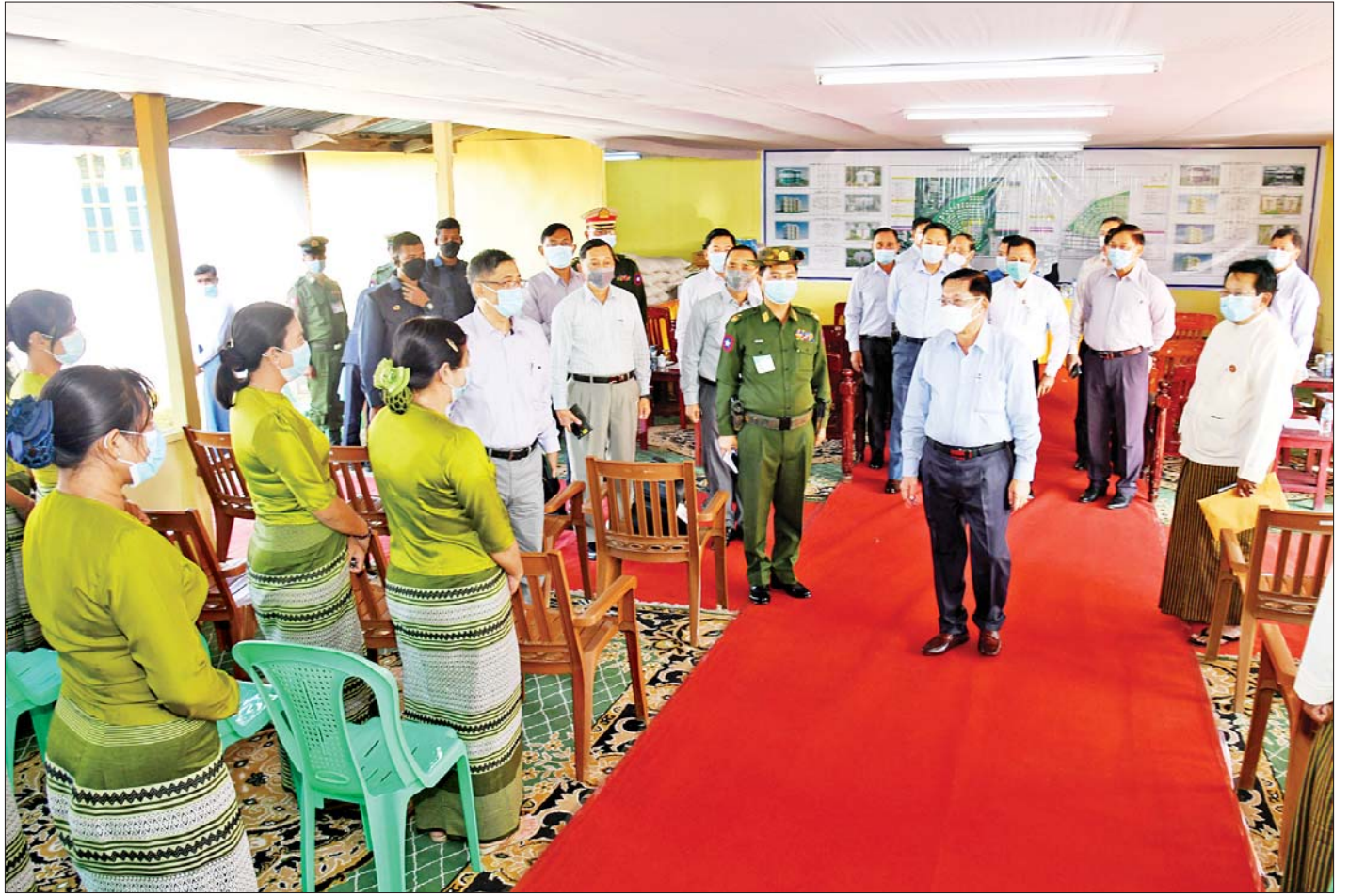
နိုင်ငံတော်စီမံအုပ်ချုပ်ရေးကောင်စီဥက္ကဋ္ဌ တပ်မတော်ကာကွယ်ရေးဦးစီးချုပ် ဗိုလ်ချုပ်မှူးကြီးမင်းအောင်လှိုင် စစ်မှုထမ်းဟောင်းအဖွဲ့ဝင်များနှင့် မိသားစုဝင် များအား ရင်းရင်းနှီးနှီး နှုတ်ဆက်စဉ်။

ထို့နောက် နိုင်ငံတော်စီမံအုပ်ချုပ်ရေးကောင်စီ ဥက္ကဋ္ဌ တပ်မတော်ကာကွယ်ရေးဦးစီးချုပ်က အဆင့်မြင့်စစ်မှုထမ်းဟောင်းအိမ်ရာ (မန္တလေး) တွင် နေထိုင်သည့် စစ်မှုထမ်းဟောင်းများ၊ မိသားစုဝင် များအတွက် ဆန်၊ ဆီနှင့် တပ်မတော်စက်ရုံထုတ် စားသောက်ဖွယ်ရာပစ္စည်းများကို ပေးအပ်ရာ စစ်မှုထမ်းဟောင်းတစ်ဦးက လက်ခံရယူသည်။