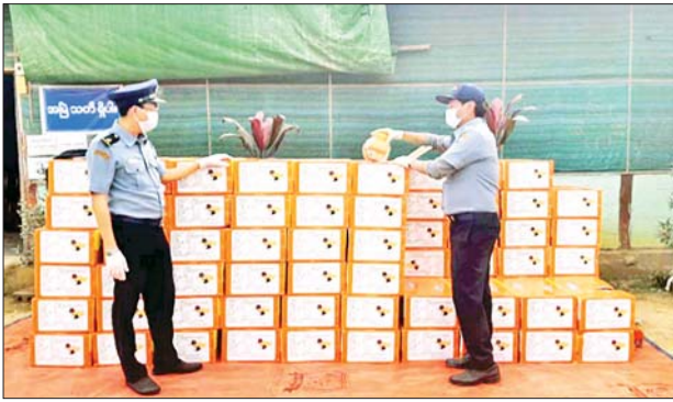
သိမ်းဆည်းရမိသည့် တရားမဝင်စားသောက်ကုန်များကို တွေ့ရစဉ်။