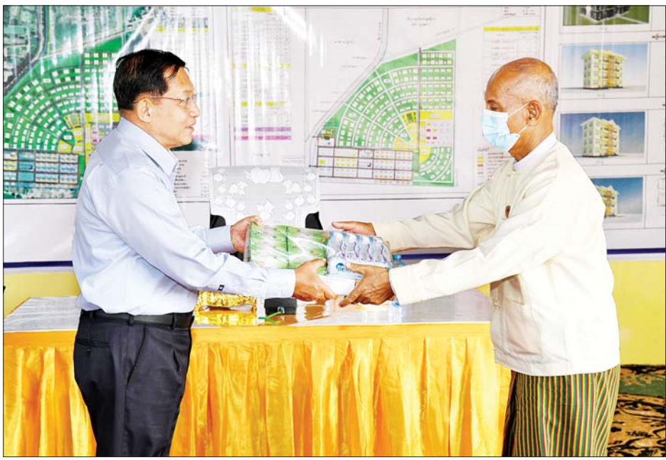
နိုင်ငံတော်စီမံအုပ်ချုပ်ရေးကောင်စီဥက္ကဋ္ဌ၊ တပ်မတော်ကာကွယ်ရေးဦးစီးချုပ် ဗိုလ်ချုပ်မှူးကြီး မင်းအောင်လှိုင် အဆင့်မြင့်စစ်မှုထမ်းဟောင်းအိမ်ရာ(မန္တလေး)ရှိ စစ်မှုထမ်းဟောင်းများနှင့် မိသားစုဝင် များအတွက် ဆန်၊ ဆီနှင့် တပ်မတော်စက်ရုံထုတ် စားသောက်ဖွယ်ရာပစ္စည်းများကို ပေးအပ်ရာ စစ်မှုထမ်းဟောင်းတစ်ဦးက လက်ခံရယူစဉ်။

နိုင်ငံတော်အနေဖြင့် ရှိရင်းစွဲလုပ်ငန်းများ၊ အကြမ်းဖက်သမားများ၏ အဖျက်အမှောင့် လုပ်ရပ်များကြောင့် ထိခိုက်ပျက်စီးခဲ့ရသည့် လုပ်ငန်းများနှင့် အခြေအနေအရပ်ရပ်တွင် ပြန်လည် ထူထောင်ရေးလုပ်ငန်းများကို လုပ်ဆောင်နေရလျက် ရှိကြောင်း၊ ထို့ပြင် မိမိတို့နိုင်ငံသည် ဖွံ့ဖြိုးဆဲ နိုင်ငံဖြစ်သည့်အတွက် နိုင်ငံတော်အနေဖြင့် ဘတ်ဂျက် ကန့်သတ်ချက်ရှိပြီး တပ်မတော်အနေဖြင့် တပ်မတော်သားများနှင့် မိသားစုဝင်များ၏ သက်သာ ချောင်ချိရေးလုပ်ငန်းများကို ဖြည့်ဆည်းဆောင်ရွက် ပေးနိုင်ရေး တပ်မတော်ပိုင် စီးပွားရေးလုပ်ငန်းများ ကို နိုင်ငံတော်သို့ ပေးသွင်းရမည့် အခွန်အခများ ပြည့်မီစွာ ပေးသွင်း၍ ဆောင်ရွက်ခဲ့ကြောင်း၊ လုပ်ငန်း များ ဆောင်ရွက်ရာတွင်လည်း ဥပဒေနှင့်အညီသာ ဆောင်ရွက်ခဲ့ခြင်းဖြစ်ပြီး အခွင့်အရေးများ တောင်းဆို ခဲ့ခြင်းမရှိကြောင်း၊ ရရှိလာသည့် အကျိုးအမြတ်များ မှ ယခုကဲ့သို့ တပ်မတော်သား၊ စစ်မှုထမ်းဟောင်း များ၊ မိသားစုဝင်များ၏ သက်သာချောင်ချိရေးလုပ်ငန်း များကို ဆောင်ရွက်ပေးနေခြင်းပင်ဖြစ်ကြောင်း။ ထိန်းသိမ်းရန် လိုအပ် တပ်မတော်မှ ဆောင်ရွက်ပေးထားသည့် အိမ်ရာ များ၊ အလုပ်အကိုင် အခွင့်အလမ်းများကို ဖန်တီး ထားပြီးဖြစ်သဖြင့် မိမိတို့နေထိုင်ရသည့် ပတ်ဝန်းကျင်