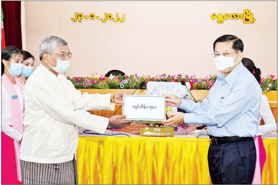
နိုင်ငံတော်စီမံအုပ်ချုပ်ရေးကောင်စီဥက္ကဋ္ဌ၊ နိုင်ငံတော်ဝန်ကြီးချုပ် ဗိုလ်ချုပ်မှူးကြီး မင်းအောင်လှိုင်က ရန်ပုံငွေထောက်ပံ့ပေးအပ်ရာ အထက်မြန်မာပြည် ဟိန္ဒူဘာသာရေးအဖွဲ့ ဒုတိယဥက္ကဋ္ဌ ဦးမောင်မောင်လွင် လက်ခံရယူစဉ်။

စာမျက်နှာ ၄ မှ ထိုသို့ဆောင်ရွက်နိုင်ရန်အတွက် နိုင်ငံတော်အစိုးရ အနေဖြင့် ခွင့်ပြုပေးသွားမည်ဖြစ်ကြောင်း၊ အလားတူ LED မီးများကိုအသုံးပြုခြင်းဖြင့် လျှပ်စစ်ဓာတ်အား သုံးစွဲမှုကို လျှော့ချနိုင်မည်ဖြစ်သဖြင့် မီတာခများ သက်သာမည်ဖြစ်သကဲ့သို့ လိုအပ်သည့်နေရာတွင် မီးသုံးစွဲမှုကို ပိုမိုအသုံးပြုနိုင်မည်ဖြစ်ကြောင်း၊ စိုက်ပျိုးမွေးမြူရေးလုပ်ငန်းများမှ ထွက်ရှိသည့် ဘိုင်အိုကတ်များမှလည်း လျှပ်စစ်ဓာတ်အား ထုတ်လုပ်ရေးလုပ်ငန်းများကို ဆောင်ရွက်နိုင်ကြောင်း၊ “လိုလျှင်ကြံဆ နည်းလမ်းရ” ဟူသည့်အတိုင်း တွေးခေါ်ကြံဆ ဆောင်ရွက်ကြရန်လိုကြောင်း။