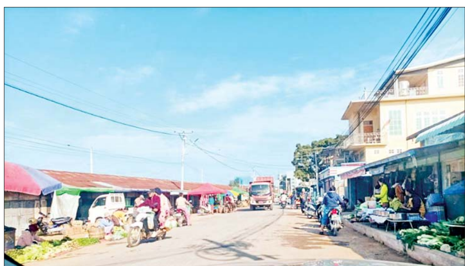
ကယားပြည်နယ်အတွင်း နယ်မြေတည်ငြိမ်အေးချမ်းမှုများ ပြန်လည်ရရှိလာသဖြင့် ဈေးများ ပုံမှန်အတိုင်း ပြန်လည်ဖွင့်လှစ် ရောင်းဝယ်ဖောက်ကားလျက်ရှိသည်ကို တွေ့ရစဉ်။

■ ကယားပြည်နယ်မှ အဆိုပါဒေသတစ်ဝိုက် လုံခြုံရေးတပ်ဖွဲ့ဝင်များက ဇန်နဝါရီ ၂၂ ရက်မှစ၍ ပြန်လည်ထိန်းချုပ်နိုင်ခဲ့ပြီး နယ်မြေတည်ငြိမ်အေးချမ်းမှုများ ပြန်လည်ရရှိလာသဖြင့် ဈေးများ ပုံမှန်အတိုင်း ပြန်လည်ဖွင့်လှစ်၍ အေးချမ်းတည်ငြိမ်စွာ ရောင်းဝယ်ဖောက်ကားလျက်