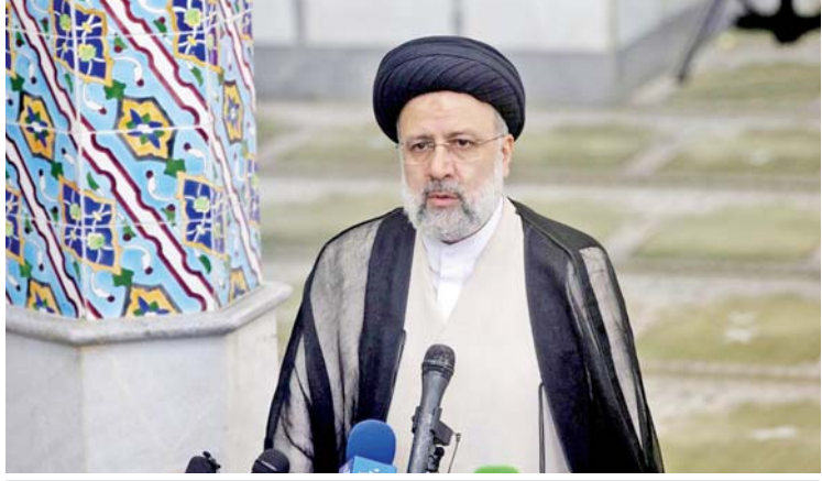
အီရန်နိုင်ငံသမ္မတ အီဘရာဟင်ရိုင်းစ်

သည်။ ထို့ပြင် တူရကီသမ္မတ အာဒိုဂန်သည် အီရန်နိုင်ငံအနေဖြင့် တူရကီနိုင်ငံသို့ စွမ်းအင်အထောက်အပံ့များ ဆက်လက်ပေးပို့ရေးကို အလေးထားပြောကြားခဲ့ပြီး တူရကီနိုင်ငံက အီရန်နိုင်ငံအား ယုံကြည်စိတ်ချရသော စွမ်းအင်ထောက်ပံ့သော နိုင်ငံအဖြစ် သတ်မှတ်ကာ အီရန်နိုင်ငံနှင့် ပူးပေါင်းဆောင်ရွက်မှုများ တိုးမြှင့်ဆောင်ရွက်ရန် ကြိုးပမ်းလျက်ရှိကြောင်း ပြောကြားခဲ့သည်။ ဒေသတွင်းလိုခြံရေး၏ အာမခံချက်