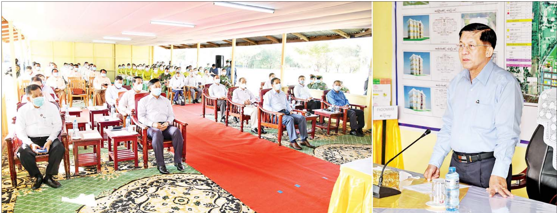
နိုင်ငံတော်စီမံအုပ်ချုပ်ရေးကောင်စီဥက္ကဋ္ဌ၊ တပ်မတော်ကာကွယ်ရေးဦးစီးချုပ် ဗိုလ်ချုပ်မှူးကြီးမင်းအောင်လှိုင် အဆင့်မြင့်စစ်မှုထမ်းဟောင်းအိမ်ရာ(မန္တလေး)ရှိ စစ်မှုထမ်းဟောင်းများနှင့် မိသားစုဝင်များအား တွေ့ဆုံအမှာစကား ပြောကြားစဉ်။