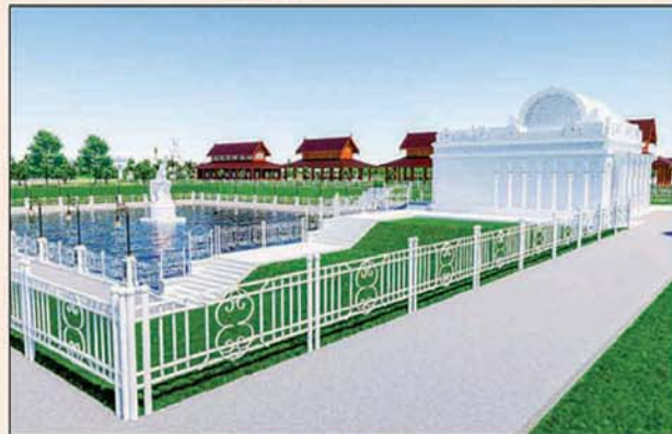
မုစလိန္နုတိုင်

၁။ နိုင်ငံတော်စီမံအုပ်ချုပ်ရေးကောင်စီဥက္ကဋ္ဌ၊ တပ်မတော်ကာကွယ်ရေးဦးစီးချုပ် ဗိုလ်ချုပ်မှူးကြီးမင်းအောင်လှိုင် ဦးဆောင်သည့် (၇)ရက်သား၊ သမီး၊ ဘုရားဒါယကာ၊ ဒါယိကာမတို့က မာရဝိဇယပုဒ္ဒရုပ်ပွားတော်မြတ်ကြီးအား မြန်မာနိုင်ငံတွင် ထေရဝါဒဗုဒ္ဓသာသနာတော်ထွန်းလင်းတောက်ပလျက်ရှိသည်ကို ကမ္ဘာကိုပြသရန်၊ တိုင်းပြည်အေးချမ်းသာယာမှုရှိစေရန်၊ ရုပ်ပွားတော်မြတ်ကြီးအား ပြည်တွင်း၊ ပြည်ပဘုရားဖူးများလာရောက်ခြင်းဖြင့် ဒေသတိုးတက်စည်ကားမှုကို အထောက်အကူဖြစ်စေရန်၊ နိုင်ငံတော်ဖွံ့ဖြိုးတိုးတက်မှုအား အထောက်အကူဖြစ်စေရန် ရည်သန်လျက် ပြည်ထောင်စုနယ်မြေ နေပြည်တော်၊ ဒက္ခိဏသီရိမြို့နယ်အတွင်း၌ သာသနာတော်ထုံး၊ ရုပ်ပွားဆင်းတုတော်ထုံး၊ မြန်မာ့ရိုးရာတည်ထုံးများနှင့်အညီ တည်ဆောက်ပူဇော်လျက် ရှိပါသည်။