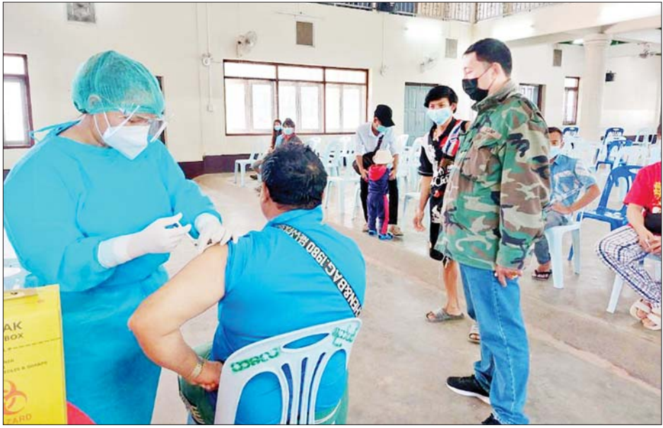
တိုင်းစစ်ဌာနချုပ်များမှ တာဝန်ရှိသူများက ပေါင်းစပ်ညှိနှိုင်းဆောင်ရွက်ပေးခဲ့ကြောင်း သိရသည်။ သွားရောက်ကြည့်ရှုအားပေးပြီး လိုအပ်သည်များ သတင်းစဉ်

၌ ဒေသခံပြည်သူ ၇၇၇ ဦး၊ ဧရာဝတီတိုင်းဒေသကြီးအတွင်းရှိ မြို့နယ် ၂၆ မြို့နယ်တို့၌ ဒေသခံပြည်သူ ၂၆၄၈၆ ဦး၊ စစ်ကိုင်းတိုင်းဒေသကြီး ခန္တီးမြို့၌ ဒေသခံပြည်သူ ၃၀၀ နှင့် မန္တလေးတိုင်းဒေသကြီးအတွင်းရှိ ခရိုင် ခုနစ်ခုတို့၌ ဒေသခံပြည်သူ ၈၄၅၀ တို့ကို တပ်မတော်မှ ဆေးအဖွဲ့များက ပြည်သူ့ဆေးရုံများမှ ဆရာဝန်များ၊ သက်ဆိုင်ရာ ကျန်းမာရေးဝန်ထမ်းများ၊ စေတနာ့ဝန်ထမ်းများနှင့်ပူးပေါင်း၍ ကိုဗစ်-၁၉ ရောဂါ ကာကွယ်ဆေးထိုးနှံပေးသည်။ ထို့အတူ ကျောင်းသား ကျောင်းသူများကိုလည်း ကိုဗစ်-၁၉ ရောဂါ ကာကွယ်ဆေးများ ထိုးနှံပေးလျက်ရှိရာ ယနေ့တွင် ဧရာဝတီတိုင်းဒေသကြီးအတွင်းရှိ မြို့နယ် ၂၆ မြို့နယ်တို့၌ ကျောင်းသား ကျောင်းသူ ၄၀၃ ဦးတို့ကို တပ်မတော်မှ ဆေးအဖွဲ့များက ပြည်သူ့ဆေးရုံများမှ ဆရာဝန်များ၊ သက်ဆိုင်ရာ ကျန်းမာရေးဝန်ထမ်းများ၊ စေတနာ့ဝန်ထမ်းများနှင့်ပူးပေါင်း၍ ကိုဗစ်-၁၉ ရောဂါကာကွယ်ဆေး ထိုးနှံပေးသည်။ ထိုသို့ ဆောင်ရွက်ပေးနေမှုများကို သက်ဆိုင်ရာ