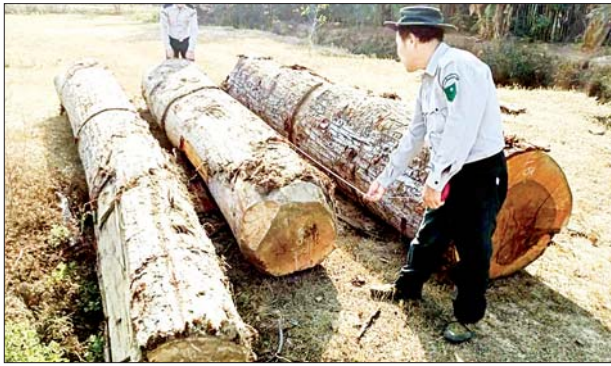
သိမ်းဆည်းရမိသည့် တရားမဝင်သစ်များကို တွေ့ရစဉ်။

နေပြည်တော် ဇန်နဝါရီ ၂၃ တရားမဝင်ကုန်သွယ်မှုတိုက်ဖျက်ရေးဦးဆောင်ကော်မတီ၏ ကြီးကြပ်ကွပ်ကဲမှုဖြင့် တရားမဝင်ကုန်သွယ်မှုများကို ဥပဒေနှင့်အညီ ထိရောက်စွာ တားဆီးအရေးယူနိုင်ရေး ဆောင်ရွက်လျက်ရှိရာ ဇန်နဝါရီ ၁၈ ရက်တွင် ရခိုင်ပြည်နယ် တရားမဝင်ကုန်သွယ်မှု တိုက်ဖျက်ရေး အထူးအဖွဲ့၏ စီမံခန့်ခွဲမှုဖြင့် စစ်ဆေးမှုများ ဆောင်ရွက်ခဲ့ရာတွင် ပူးပေါင်းအဖွဲ့များမှ စစ်တွေမြို့နယ်တွင် သစ်မျိုးစုံ ၃ ဒဿမ ၄၉၄၆ တန် (ခန့်မှန်းတန်ဖိုးငွေကျပ် ၅၅၉၂၁၆)၊ ဇန်နဝါရီ ၁၉ ရက်၌ တောင်ကုတ်မြို့နယ်တွင် တောင်သရက်ခွဲသား ၃ ဒဿမ ၄၇၄ တန် (ခန့်မှန်းတန်ဖိုးငွေကျပ် ၃၄၇၄၀၀) စုစုပေါင်း သစ်မျိုးစုံ ၆ ဒဿမ ၉၆၈၆ တန် (ခန့်မှန်းတန်ဖိုးငွေကျပ် ၉၀၆၅၂၆)ကို ဖမ်းဆီးရမိခဲ့သဖြင့် မြို့နယ်သစ်တောဦးစီးဌာနသို့ လွှဲပြောင်းအပ်နှံခဲ့ပြီး သစ်တောဥပဒေနှင့်အညီ အရေးယူဆောင်ရွက်လျက်ရှိသည်။